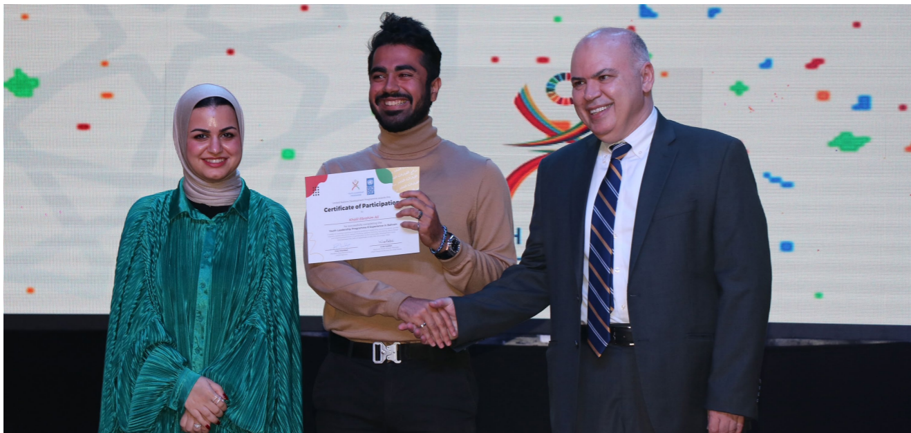
تعاون مثمر بين البحرين وبرنامج الأمم المتحدة الإنمائي

وقد نفذ برنامج الأمم المتحدة الإنمائي في مملكة البحرين برنامج القيادات الشابة لأول مرة في البحرين العام 2017 بالتعاون مع وزارة شؤون الشباب والرياضة، ومنظمات المجتمع المدني؛ لإعداد وتمكين الشباب لقيادة التنمية المستدامة في المملكة. وقدم برنامج الأمم المتحدة الإنمائي في البحرين بنقل الاستراتيجية العالمية للشباب 2030 إلى البحرين من خلال برنامج القيادات الشابة، بمساعدة خبراء الأمم المتحدة، مستقيين الأفكار من المكتب الإقليمي، وموائمتها مع احتياجات الشباب البحريني لتمكينهم من بناء قدراتهم في تصميم وتنفيذ حلول مبتكرة ومؤثرة تساهم إيجاباً في تنمية مجتمعهم. النسخة الثامنة من برنامج القيادات الشابة في البحرين اختتمت في نوفمبر 2022 وخرجت 24 شاباً وشابة لينضموا لأكثر من 200 شاب وشابة آخرين تخرجوا من النسخ السابقة للبرنامج في البحرين، ومواصلاً لهذه الجهود، فإن برنامج الأمم المتحدة الإنمائي في البحرين يعد لإطلاق النسخة التاسعة من برنامج القيادات الشابة نهاية شهر أبريل 2023.