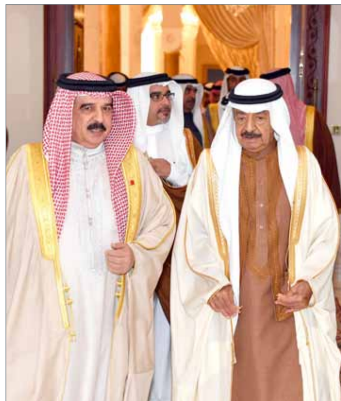
• جلالة الملك مستقبلاً سمو رئيس الوزراء بحضور سمو ولي العهد

المنامة - بنا: استقبل عاهل البلاد صاحب الجلالة الملك حمد بن عيسى آل خليفة، في قصر الصخير أمس، رئيس الوزراء صاحب السمو الملكي الأمير خليفة بن سلمان آل خليفة، بحضور ولي العهد نائب القائد الأعلى النائب الأول لرئيس مجلس الوزراء صاحب السمو الملكي الأمير سلمان بن حمد آل خليفة. وخلال اللقاء، جدد جلالته الملك التهنئة لسمو رئيس الوزراء بعد أن أنعم الله على سموه بتمام الصحة والعافية بنجاح الفحوصات الطبية الموقفة ومغادرته المستشفى سالماً معافى، سائلاً المولى عز وجل أن يحفظ سموه ويديم عليه موفور الصحة والسعادة ليواصل جهوده المباركة في خدمة المملكة وشعبها العزيز. وأشاد صاحب الجلالة الملك بالدور الذي يضطلع به صاحب السمو الملكي رئيس الوزراء وإسهاماته المشهودة في تعزيز نهضة البحرين الحديثة وتقديمها وإزدهارها.