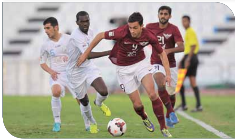
من منافسات الدوري القطري