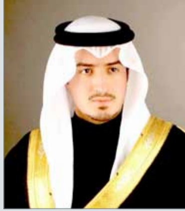
• الشيخ خالد بن حمود

كشف الرئيس التنفيذي لهيئة البحرين للسياحة والمعارض الشيخ خالد بن حمود آل خليفة أن أكثر من 250 ألف مشاهدة ومتابعة بثتها قنوات ”أم بي سي“ عن البحرين عبر منصاتهما الإعلامية المختلفة، وبمختلف اللغات، ومنها القنوات الإخبارية المهمة، والتي تحظى بنسبة مشاهدة عالمية عالية وذلك عبر الاتفاقية التي وقعتها الهيئة مع المجموعة.