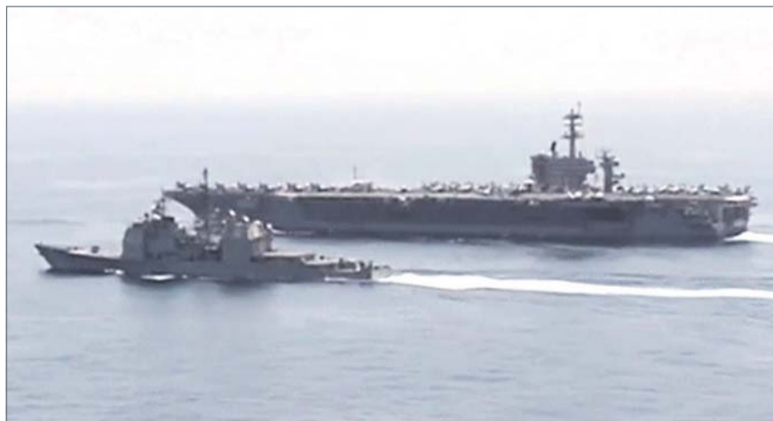
• صورة أرشيفية لسفينتين إيرانيتين في طريقهما إلى خليج عدن

أهمية خاصة بالنسبة لإيران. فاليمن يشرف على مضيق باب المندب أحد أكثر الممرات المائية حركة في العالم. وأوضح كاتب المقال وهو كبير الباحثين بمعهد دراسات الأمن القومي التابع لجامعة "تل أبيب" يوفيل غوزانسكي، أن من شأن إقامة قاعدة بحرية هناك منح طهران منفذاً إلى البحر الأحمر وجعلها في وضع موات أكثر لتهديد المملكة العربية السعودية "خصمها اللدود في المنطقة".