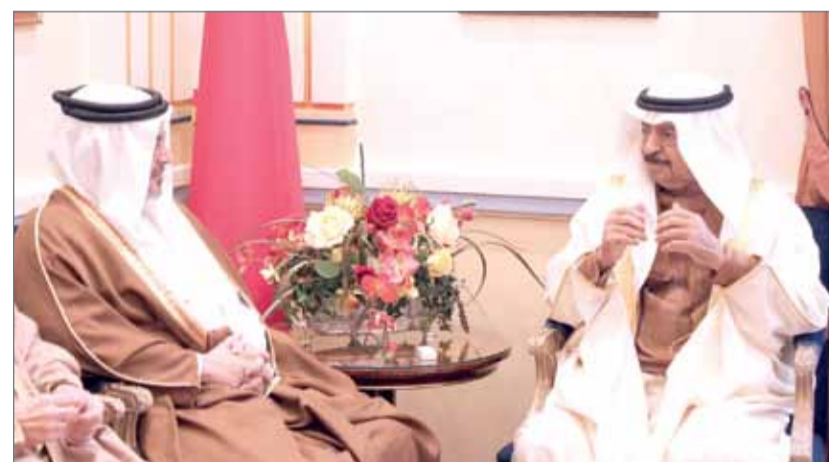
• سمو رئيس الوزراء مستقبلاً سمو ولي العهد

المنامة - بنا: استقبل رئيس الوزراء صاحب السمو الملكي الأمير خليفة بن سلمان آل خليفة وولي العهد نائب القائد الأعلى النائب الأول لرئيس مجلس الوزراء صاحب السمو الملكي الأمير سلمان بن حمد آل خليفة، وذلك صباح أمس بقصر القضيبيّة. وخلال اللقاء، استعرض صاحب السمو الملكي رئيس الوزراء وصاحب السمو الملكي ولي العهد نائب القائد الأعلى النائب الأول لرئيس مجلس الوزراء عدداً من الموضوعات المتصلة بالشأن الوطني في إطار توجه الحكومة نحو تبني المزيد من المبادرات التي