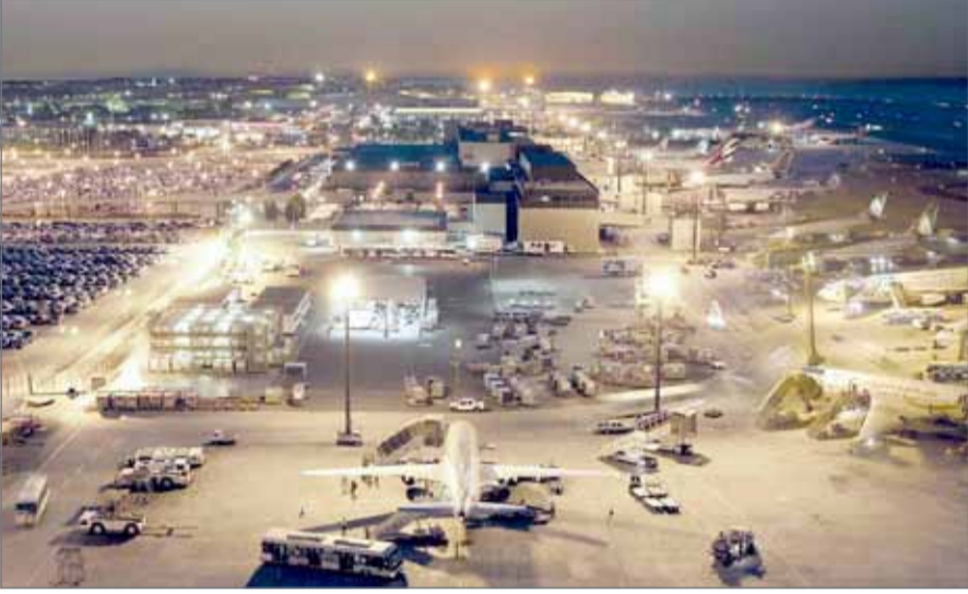
• دينار واحد رسم على المسافرين المحول مقابل استخدام مرافق المطار

ومن المفترض أن تستحصل شركة المطار إيرادات تصل إلى 30 مليون دينار خلال السنة باعتبار بلوغ عدد مغادري المطار في 2015 نحو 4 ملايين و201 ألف مسافر بزيادة قدرها 6 %، في حين بلغ عدد مسافري الترانزيت 131 ألف مسافر. وحاولت ”البلاد“ الاتصال بوزير المواصلات والاتصالات والرئيس التنفيذي لشركة المطار لكن دون رد.