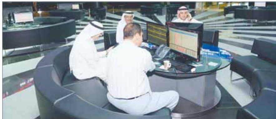
• الإعلان عن الادراج

وقد تم يوم أمس تداول أسهم 9 شركات، ارتفعت أسعار أسهم شركتين، في حين انخفضت أسعار أسهم 3 شركات، وحافظت بقية الشركات على أسعار إقفالاتها السابقة.