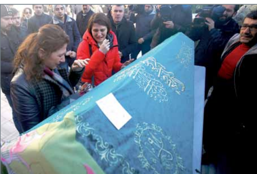
• أقارب أحد ضحايا الهجوم المسلح على ملهى رينا خلال جنازته في اسطنبول

قال المتحدث باسم الحكومة التركية أمس الاثنين إن السلطات تقترب من التعرف بشكل كامل على المسلح المسؤول عن هجوم على ملهى ليبي في اسطنبول قتل خلاله 39 شخصاً في يوم رأس السنة وإنها اعتقلت ثمانية أشخاص آخرين. وقال نائب رئيس الوزراء نعمان قور تولموش خلال مؤتمر صحفي “تم اكتشاف معلومات بشأن البصمات والمظهر الأساسي للإرهابي. في العملية التي تعقب ذلك سيجري العمل على التعرف عليه بشكل سريع.” وكان تنظيم داعش أعلن في بيان أمس مسؤوليته عن هجوم الملهى في اسطنبول. ووصف البيان ملهى رينا الليبي حيث قتل الكثير من الأجانب والأتراك بأنه نقطة تجمع للمسيحيين للاحتفال “بعيدهم”.