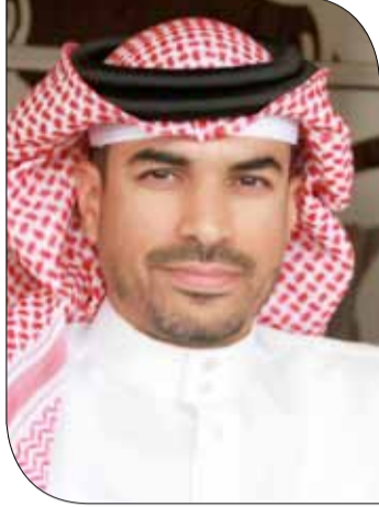
صقر بن سلمان

وأثنى الشيخ صقر بن سلمان آل خليفة على الإنجازات التي حققتها أبطال البحرين للترياثلون في مختلف البطولات التي شاركوا فيها وحققوا من خلالها مراكز متقدمة، مؤكداً سعي الاتحاد إلى مواصلة العمل بوتيرة أفضل وتطبيق الإستراتيجيات التي تحافظ على الإنجازات وتعزز المكتسبات.