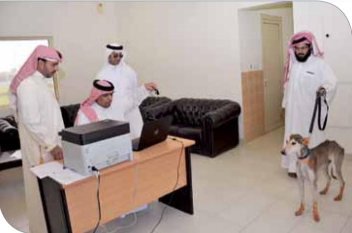
جانب من مرحلة التسجيل النهائي

وقد بدأت يوم أمس مرحلة تشبيه وتحجيل الصقور للملاك وأصحاب الصقور المشاركة بالمسابقة وذلك بالقرية العالمية للقدرة. حيث تخلل هذه المرحلة إنهاء إجراءات التسجيل النهائي وتقديم الشهادة الطبية الخاصة بسلامة الصقور من أي مرض معدية، وكذلك القسم للملاك وأصحاب الصقور البحرينيين فقط. وستستمر هذه المرحلة حتى يوم غد الأربعاء. وشهدت القرية يوم أمس الأول التسجيل النهائي ومرحلة التشبيه لـ"السلقان" المشاركة بسباق السلطان العربية ومسابقة مزايين السلوقي. حيث تم الاعتماد النهائي لمشاركة 130 "سلق" ضمن منافسات المسابقتين.