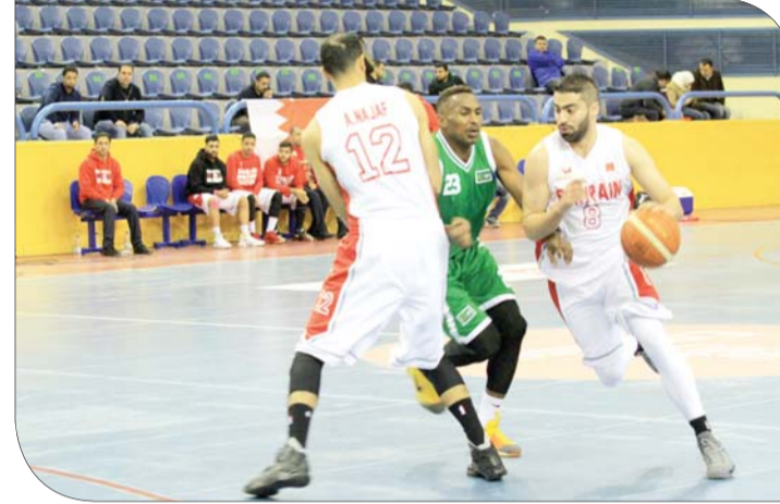
لقطة من المباراة

الدفاع، حيث أدى ذلك إلى تقدم حسين وحسن نوروز بالجانب الهجومي.