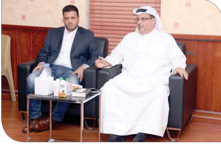
جانب من المؤتمر الصحافي للمدرب