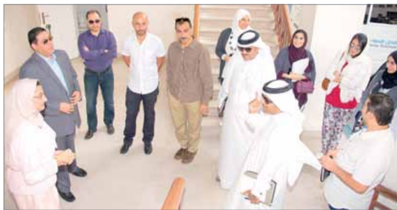
لقطة جماعية للمشاركين

المشاركين من الاطلاع على التجارب والممارسات المتميزة، التي يمكن نقلها إلى مؤسسات حكومية أخرى من أجل تعزيز التعاون للارتقاء بالعمل الحكومي. وشملت الزيارات الميدانية للدفعة السادسة من البرنامج كلا من وزارة المواصلات والاتصالات، وهيئة