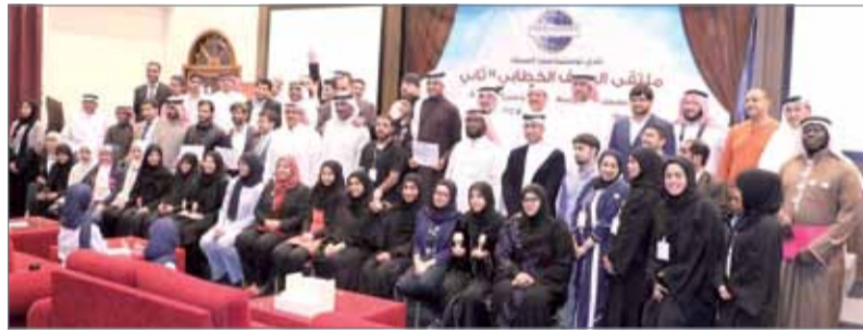
لقطة جماعية للمشاركين

بمشاركة جماعية للمشاركين حضور حشد كبير فاق الـ 170 شخصاً من ضيوف شرف وأعضاء وجمهور من جميع دول الخليج العربية ومتابعي النادي والمهتمين