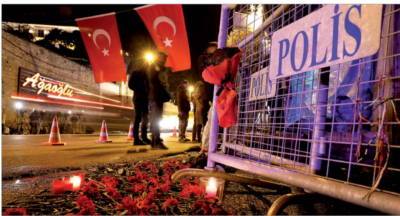
• زهور أمام مدخل ملهي رينا الليلي الذي تعرض لهجوم في اسطنبول

وقالت صحيفة حريت التركية إن السلطات تعتقد أن المهاجم قد يكون من إحدى دول آسيا الوسطى وتشبته في وجود صلات تربطه بداعش. وقالت إنه ربما يكون من الخلية ذاتها المسؤولة