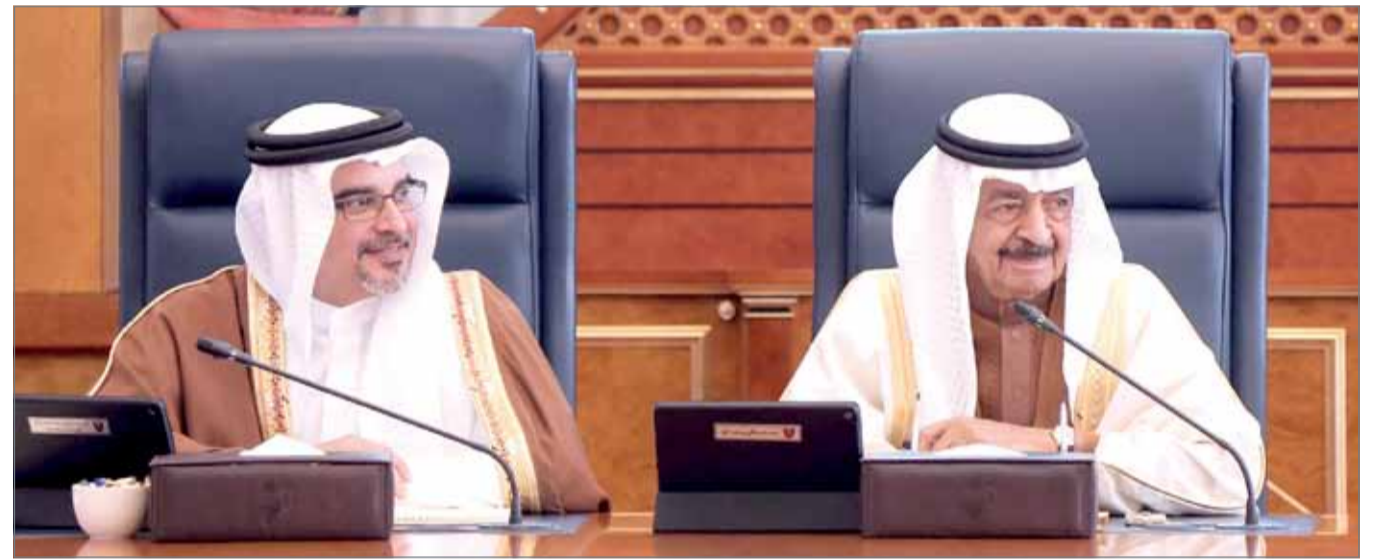
● سمو رئيس الوزراء وبحضور سمو ولي العهد مترشداً جلسة مجلس الوزراء