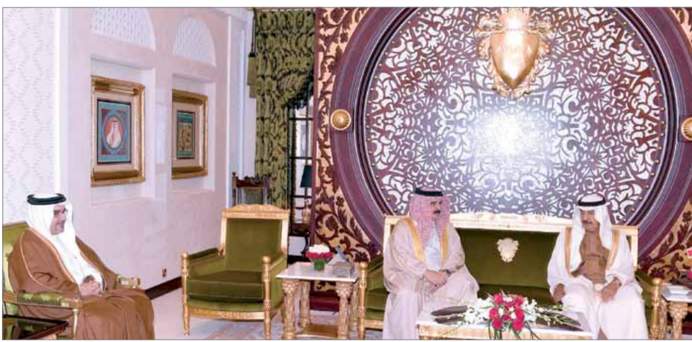
• جلالة الملك مستقبلاً سمو رئيس الوزراء بحضور سمو ولي العهد

كما جرى خلال اللقاء استعراض المواضيع التي تهم الشأن المحلي من أجل تعزيز مسيرة الوطنية، مؤكداً جلالته الملك المفدى في هذا السياق أن مملكة البحرين ماضية في مسيرة التطوير والتحديث وبدعم ومساندة أبنائها المخلصين، معرباً في الوقت ذاته عن اعتزازه بما تحققه المملكة من تنمية متواصلة وتطور متسارع في كافة مناحي الحياة لما فيه خير الوطن وصالح المواطن، داعياً جلالته الله أن يحفظ البحرين ويديم عليها أمنها واستقرارها ورخاءها.