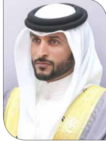
سمو الشيخ ناصر بن حمد آل خليفة

الترياثلون من الرجال والنساء؛ الأمر الذي أعطى المنتخب البحريني