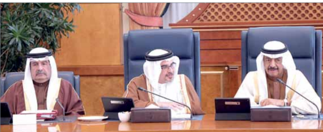
• سمو رئيس الوزراء مترئسا جلسة مجلس الوزراء بحضور سمو ولي العهد

التصدي لمثل هذه الجرائم ومنع تكرارها بإجراءات تحفظ الأمن والاستقرار وتكفل تقديم الجناة للعدالة؛ لينالوا القصاص، كما بحث مجلس الوزراء مشروع قانون جديد للصحافة والإعلام الإلكتروني يحل محل قانون تنظيم الصحافة والطباعة والنشر رقم (47) لسنة 2002م.