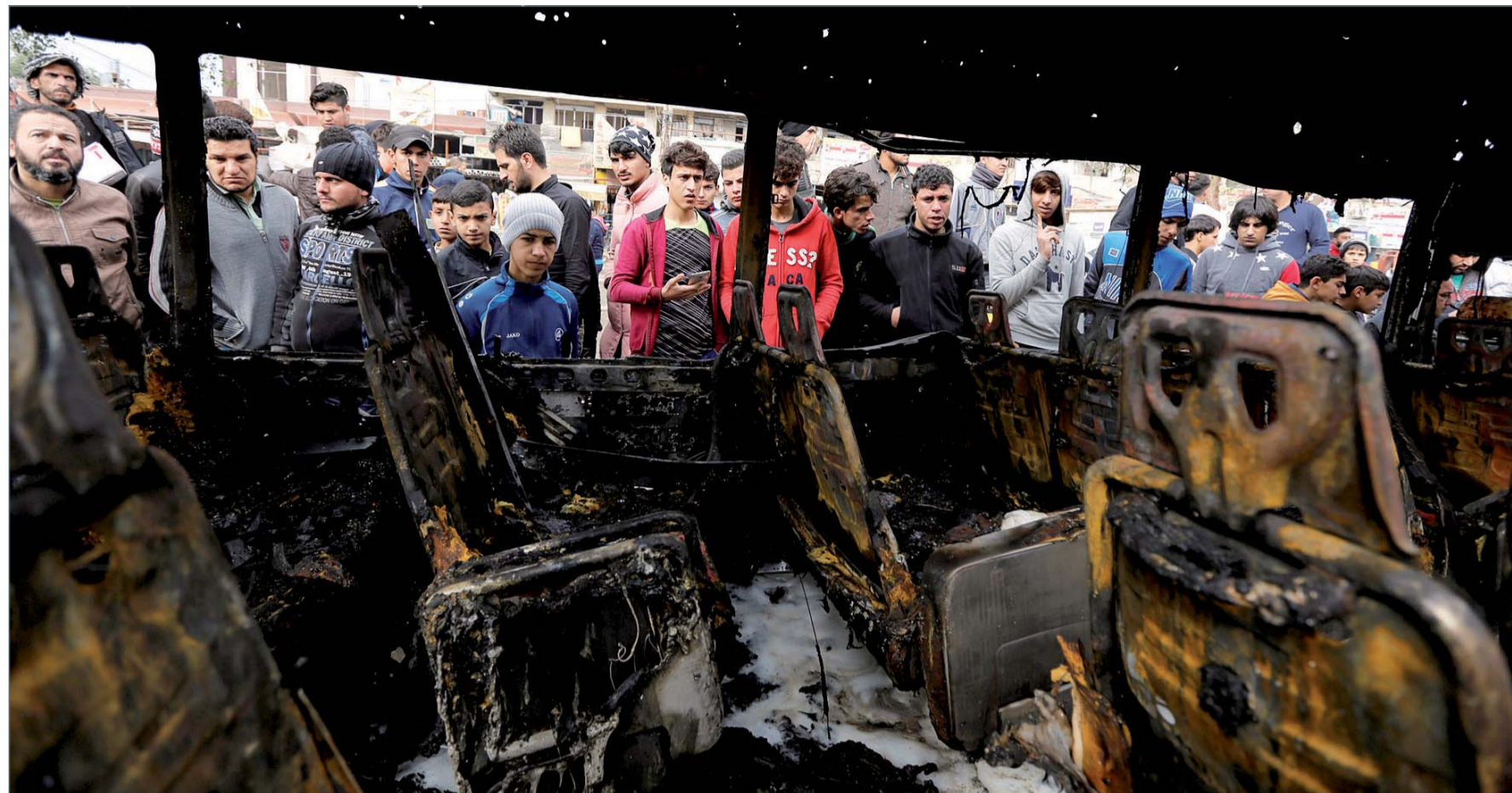
عراقيون ينظرون إلى سيارة أحرقت في موقع انفجار مفخخة في حي بمدينة الصدر في بغداد