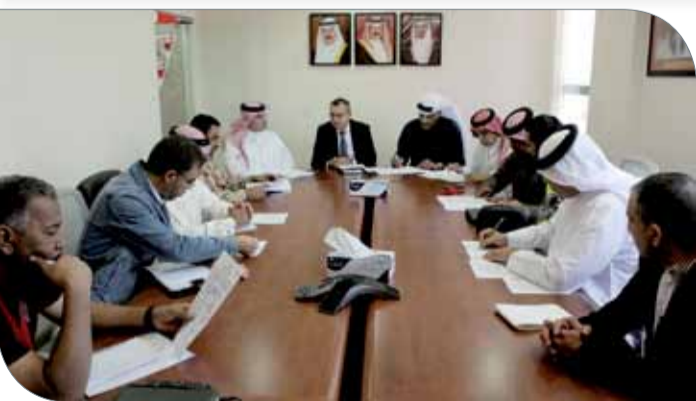
جانب من الاجتماع التنسيقي للأولمبياد المدرسي المصغر

الترياثلون إقامة السباق بالقرب من فندق الريتزكارتون أو فندق السوفوتيل، فيما تم الاتفاق مع مندوب اتحاد الكرة الطائرة لمشاركة فئة المهرجان مع إدخال المدارس الراغبة في المشاركة مع مراعاة تحديد أعداد اللاعبين، كما تم الاتفاق مع مندوب اتحاد السباحة السماح لأي لاعب المشاركة بحسب الفئة العمرية المحددة.