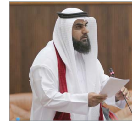
• البلوشي: هل تتجح الوزارة فيما لم ينجح الرجال؟

والمستشفيات تنشئ مواقف للسيارات فما بالك بالمجمع الحكومي المعروف