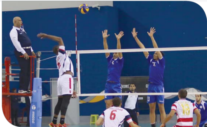
من لقاء المحرق والنصر بالقسام الأول

يشكل لقاء النجمة والأهلي أحد أهم وأقوى اللقاءات التي بات يستمتع بها محبو وعشاق الكرة الطائرة، خصوصاً وأن النجمة أصبح بمثابة العقدة للنسور. النجمة بقيادة المدرب الأرجنتيني اليقيتا يسعى للعودة إلى نغمة الانتصارات بعد الخسارة الأولى له من المحرق في الجولة الماضية، وذلك من خلال تصحيح الأخطاء والاعتماد على