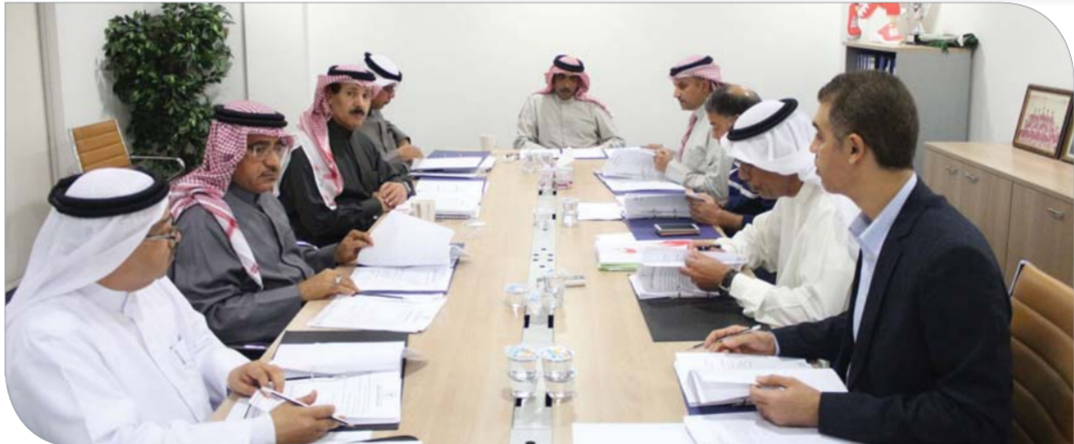
جانب من إجتماع مجلس الإدارة

وأكد مجلس الإدارة أهمية وضع شروط ومعايير خاصة لكافة المديرين لتولي قيادة الفريق الأول بالأندية المحلية وتكليف لجنة المديرين بإعداد تصور عن هذا الموضوع، كما ناقش المجلس إعداد لائحة تنظيمية وافية لمجلس الكرة الطائرة الشاطئية. واعتمد المجلس المقترح المرفوع من لجنة المسابقات بتخصيص جائزة للفريق المشالي ببطولتي الدوري لأندية الدرجة الأولى والثانية، وأطلع على مقترح عضو مجلس الإدارة