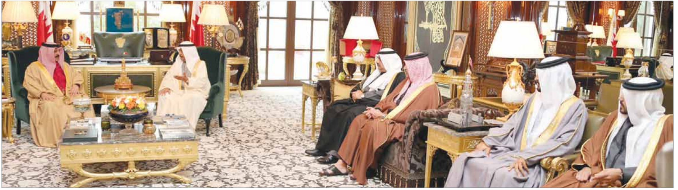
• جلالة الملك مستقبلاً سمو رئيس الوزراء وسمو ولي العهد

جلالته استقبل سموهما بذكرى الميثاق... رئيس الوزراء وولي العهد: