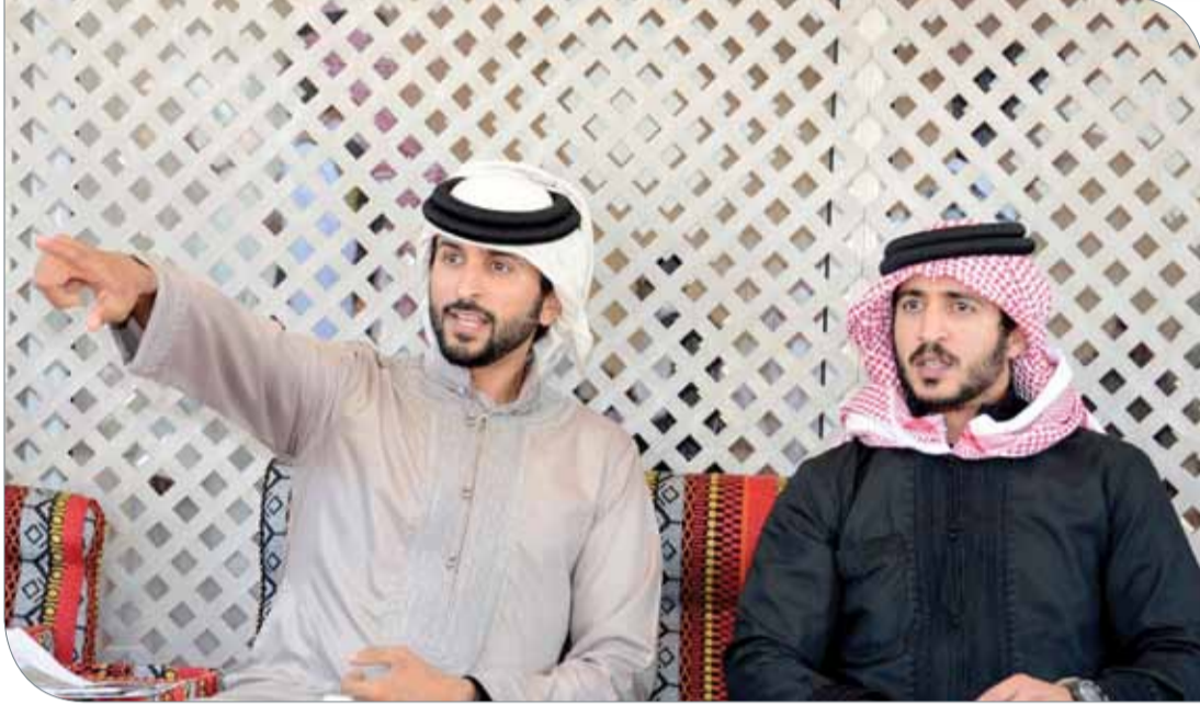
سمو الشيخ ناصر بن حمد وسمو الشيخ خالد بن حمد

كبيرة من قبل المتسابقين الخليجيين الذين حرصوا على الحضور والتواجد للمنافسة على حصد المراكز الأولى في هذا الحدث الرياضي التراثي، الذي يجمع أبناء دول مجلس التعاون في البحرين، وهي فرصة كذلك لتعزيز الروابط الاجتماعية بينهم، مشيراً إلى أن المسابقة ستشهد إقامة شوط النخبة الدولي برياضة الصيد للصحور، الذي سيشارك فيه عدد من المتأهلين المحليين من مسابقات الأسابيع الخمسة الماضية إلى جانب عدد من المتأهلين من المتسابقين الخليجيين من منافسات هذا الأسبوع. موضحاً القعود أن هذه المسابقة تحقّق العديد من الأهداف التي رسمها سمو الشيخ ناصر على الصعيد الرياضي والاجتماعي وكذلك الثقافي عبر تعزيز ثقافة الرياضات التراثية في أبناء المنطقة، والذي يترجم جهود سموه في تنفيذ رؤى وتوجيهات عاهل البلاد المفدى حفظه الله ورعاه للمحافظة على قيمنا وموروثاتنا العريقة النابعة من تراثنا الوطني الأصيل.