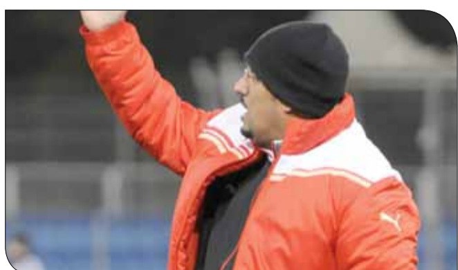
مدرب الشرقي مرتدياً الملابس الشتوية خلال لقاء الأهلي

وجود نقل تلفزيوني لأغلب لقاءات الجولة، خصوصاً في لقاء المالكية والمحرق، والمنامة مع الرفاع، واللذين كان يتوقع أن يشهدا حضوراً أكبر من الذي شهدته استاد مدينة خليفة الرياضية.