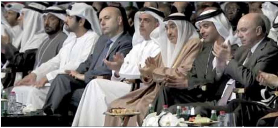
الشيخ خالد بن عبدالله لدى مشاركته في أعمال القمة العالمية للحكومات

المنامة - قصر القضيبيية: بتكليف من عامل البلاد صاحب الجلالة الملك حمد بن عيسى آل خليفة، ترأس نائب رئيس مجلس الوزراء الشيخ خالد بن عبدالله آل خليفة وفد البحرين في القمة العالمية للحكومات التي اختتمت أعمالها أمس بدبي؛ وذلك تلبية لدعوة تلقاها جللته من رئيس دولة الإمارات العربية المتحدة الشقيقة أخيه صاحب السمو الشيخ خليفة بن زايد آل نهيان. وبهذه المناسبة، أعرب الشيخ خالد بن عبدالله عن شكره وتقديره لجلالة الملك على تكليفه رئاسة وفد مملكة البحرين لهذه القمة، التي أصبحت بمثابة منصة رفيعة المستوى وتظاهرة دولية سنوية وتجمعاً بارزاً لأكثر من أربعة آلاف شخصية إقليمية ودولية من مختلف المستويات القيادية تمثل حوالي 140 دولة، ل طرح الموضوعات والقضايا ذات الصلة والأكثر أهمية والحاحاً بالنسبة إلى كافة الحكومات على مستوى دول العالم. وأشاد بما تضمنه الحوار الذي أجره نائب رئيس دولة الإمارات رئيس مجلس الوزراء حاكم دبي صاحب السمو الشيخ محمد بن راشد آل مكتوم، من رؤى وأفكار قيمة تهدف إلى استنهاض الأمة العربية واستئناف دورها الريادي والحضاري الذي كانت تعرف به قديماً والذي أدى إلى تطورها وازدهار عمرانها وعلومها التي خدمت البشرية على مر العصور الماضية.