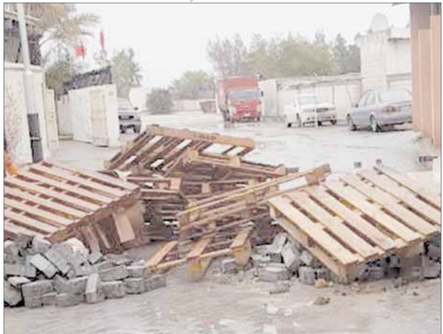
• غلق طريق إحدى المدارس

وهناك قال المتهم لموظف الصرافة إن لديه وصل استلام بـمبلغ