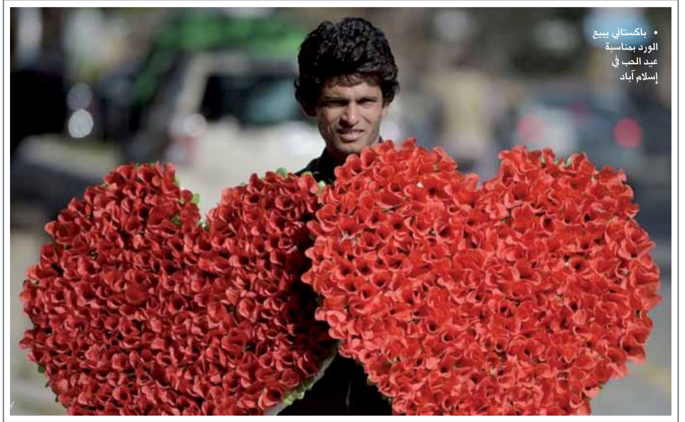
• باكستاني يبيع الورود بمناسبة عيد الحب في إسلام آباد