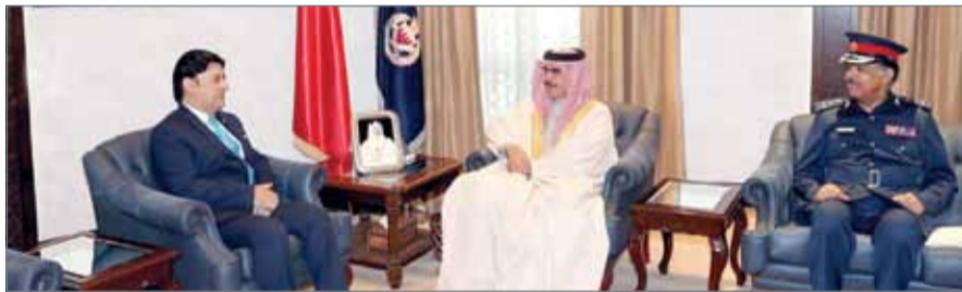
وزير الداخلية مستقبلاً السفير الباكستاني

المنامة - بنا: استقبل وزير الداخلية الفريق الركن الشيخ راشد بن عبدالله آل خليفة صباح أمس سفير جمهورية باكستان الإسلامية لدى مملكة البحرين جافيد مالك، وتم خلال اللقاء، استعراض العلاقات الثنائية بين البلدين الصديقين وعدد من الموضوعات ذات الاهتمام المشترك. حضر اللقاء الوكيل المساعد للمناذ والبحث والمتابعة بشؤون الجنسية والجوازات والإقامة.