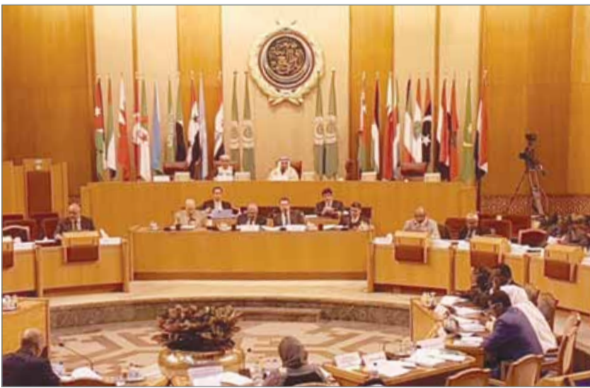
• البرلمان العربي يدين التصريحات الإيرانية الاستفزازية