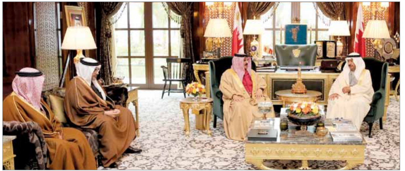
• جلالة الملك مستقبلاً سمو رئيس الوزراء وسمو ولي العهد

عن إرادته وتوافقته على ثوابت العمل الوطني، والتي كانت بداية لمرحلة جديدة من مسيرة العمل الوطني والنهضة الشاملة وفق رؤية تعتمد النهج الديمقراطي خياراً لتعزيز المشاركة الشعبية. وأشاد جلالة الملك بالدور الوطني الفاعل للسلطات الثلاث، والتي دعمت بجهودها مسيرة الإصلاح الوطني، وبفضلها وصلت المملكة إلى مستوى متقدم، ونالت التقدير من دول العالم المحبة للسلام والسعادة إلى احترام كرامة الإنسان وحرية.