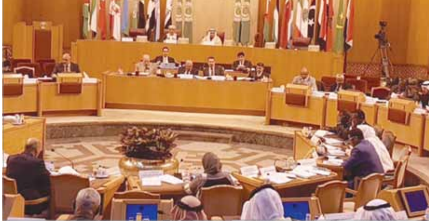
من جلسات البرلمان العربي أمس

القاهرة - بنا: أكد البرلمان العربي دعمه الكامل لمملكة البحرين بما تقوم به للحفاظ على أمنها واستقرارها وسلامة أراضيها، مثنياً بإحباط قوات الأمن عملية تهريب عدد من المطلوبين في قضايا إرهابية والمهاجرين من مركز الإصلاح والتأهيل في جو.