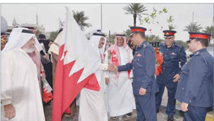
مواطنون يتوافدون على خفر السواحل

المنامة - وزارة الداخلية: تعزيزاً لإستراتيجية الشراكة المجتمعية بين رجال الأمن وفئات المجتمع وأطرافه، عبرت فعاليات وطنية ورواد مجالس وجموع من المواطنين عن خالص الشكر والامتنان على الجهود والخدمات التي تقدمها قوات خفر السواحل في مجال الأمن والسلامة البحرية. وحييا المواطنين، لشدن توافدهم اليوم على قاعدة خفر السواحل في المحرق، جمود وزارة الداخلية في حفظ الأمن والاستقرار وحماية المواطنين وبث الطمأنينة في المجتمع، في ظل ما يتمتع به رجال الأمن من جهودية عالية وكفاءة متقدمة بقيادة وزير الداخلية ودورهم في الحفاظ على أمن الوطن والسهر على راحة المواطنين، سائلين العلي التقدير أن يحفظهم ويكثمهم دوماً من أداء واجبه الوطني.