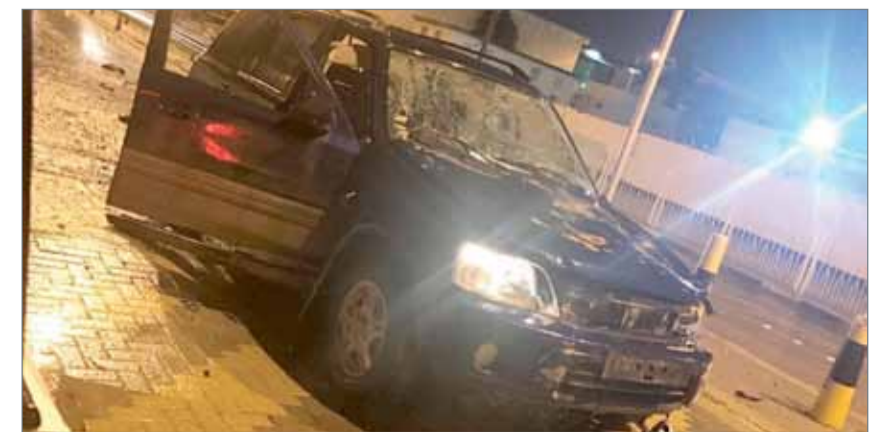
• السيارة المتضررة من التفجير الإرهابي

المنامة - بنا: تعرض مساء أمس (الثلاثاء) زوجان لإصابات بسيطة إثر تفجير إرهابي في بسترة.