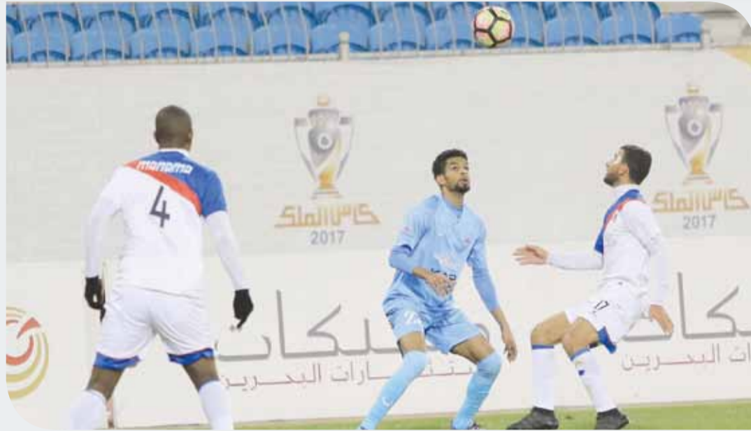
من لقاءات الجولة العاشرة

وعدم استطاعته المحافظة عليها فيما بعد، فيما لا تبدو أحوال الحالة أفضل منه، خصوصاً وأنه حقق فوزاً وحيداً طوال الجولات العشر. لقاءات الجولة 11 التي ستنتقل غداً (الخميس) ستكون على صفيح ساخن، خصوصاً لرغبة الفرق الكبيرة في حصد النقاط لأهداف مختلفة، سواء لفرق المقدمة أو المؤخرة، أو حتى لتلك الساعية لتأمين موقعها في المناطق الدافئة.