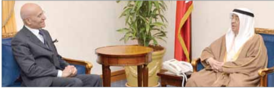
سمو نائب رئيس مجلس الوزراء مستقبلاً السفير الياباني

وعلى ما يوليه سموه من اهتمام بتطوير الاقتصادية والاستثمارية، من جانبه، شكر السفير سمو الشيخ محمد بن مبارك آل خليفة على استقباله