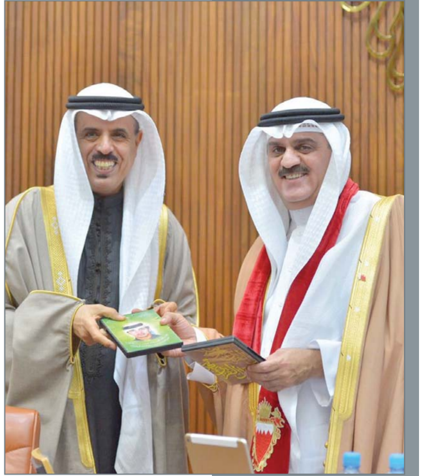
• استوفى وزير التربية والتعليم بإدخال التعليم واجد التلميخ حصة للبرلمان لإعداد رئيس البرلمان أحمد النخاس من إصدارات الوزارة