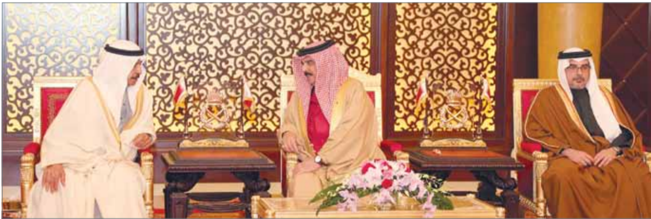
• جلالة الملك مستقبلاً كبار أفراد العائلة المالكة الكريمة بحضور سمو رئيس الوزراء وسمو ولي العهد

• "الداخلية" و"الأمن الوطني" يسهران على راحة المواطنين وسلامتهم