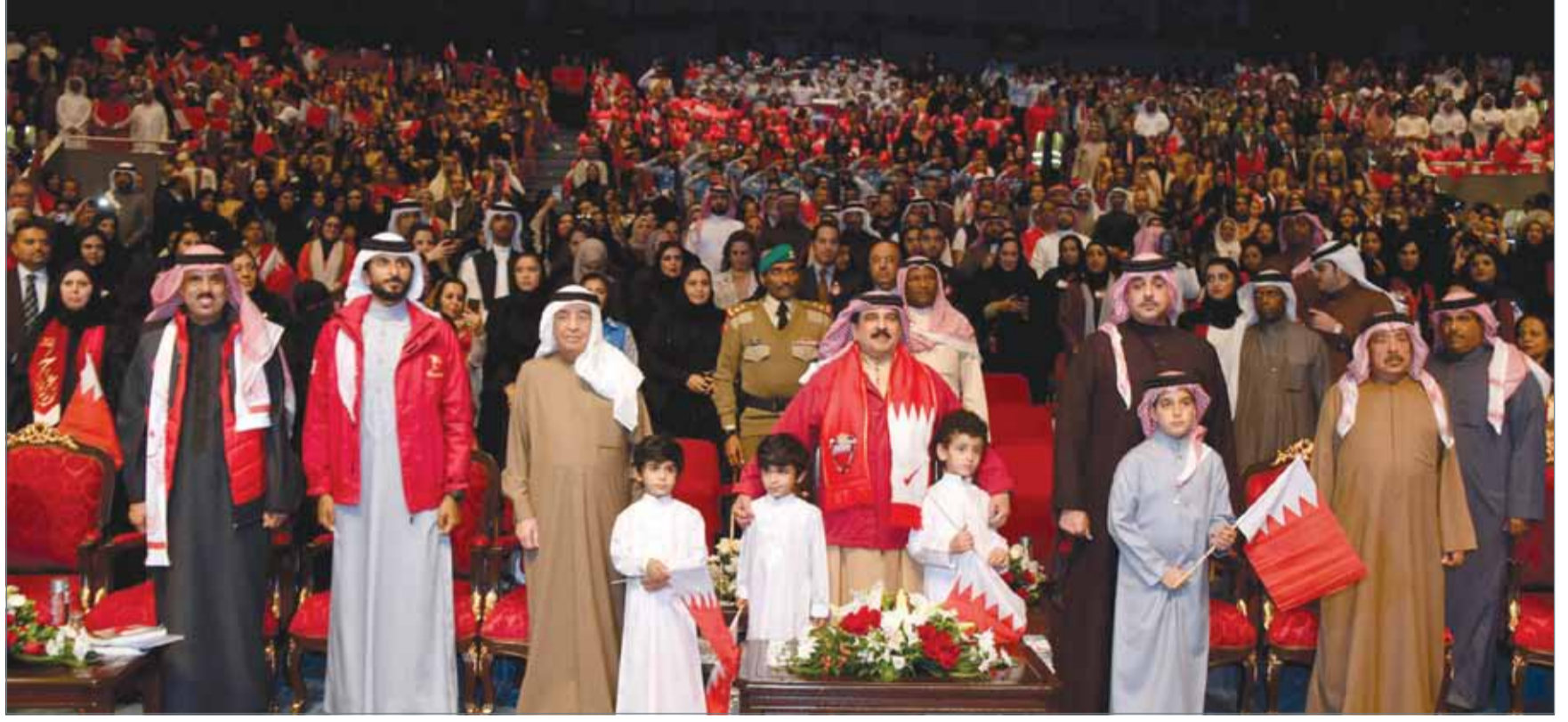
• جلالة الملك مشرفاً احتفال وزارة التربية والتعليم بذكري ميثاق العمل الوطني

إن الرابع عشر من فبراير سيظل راسخاً في ذاكرة الأمم الباحثة عن النهضة والحضارة، عن الكرامة والتقدم والرقي، وستظل أحداثه ماثلة في أذهاننا، موجمة لأعمالنا، مثقبة بالخير في صميم وجداننا، فالأمم العظيمة لا تبقى ولا ترتقي إلا بالمشارك العظيمة والميثاق الوطني ما كان سوى نبذة حية في ضمير أمة تصنع الرؤى، وتعشق الحياة.