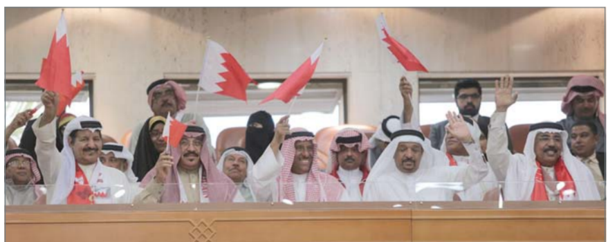
• وقد من مجلس بوطينيخ حضر جانبا من جلسة البرلمان

وافق مجلس النواب على مقترح صفة الاستعمال بشأن إصدار بيان بمناسبة الذكرى السادسة عشرة لميثاق العمل الوطني. وفي هذا السياق، أصدر عدد من النواب بيانات تهنئة بهذه المناسبة، معتبرين لإيصال اللبنة الأولى لبحرين اليوم، والأساس الذي قام عليه المشروع الإصلاحى لولاية الملك.