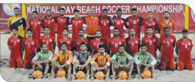
منتخب كرة القدم الشاطئية