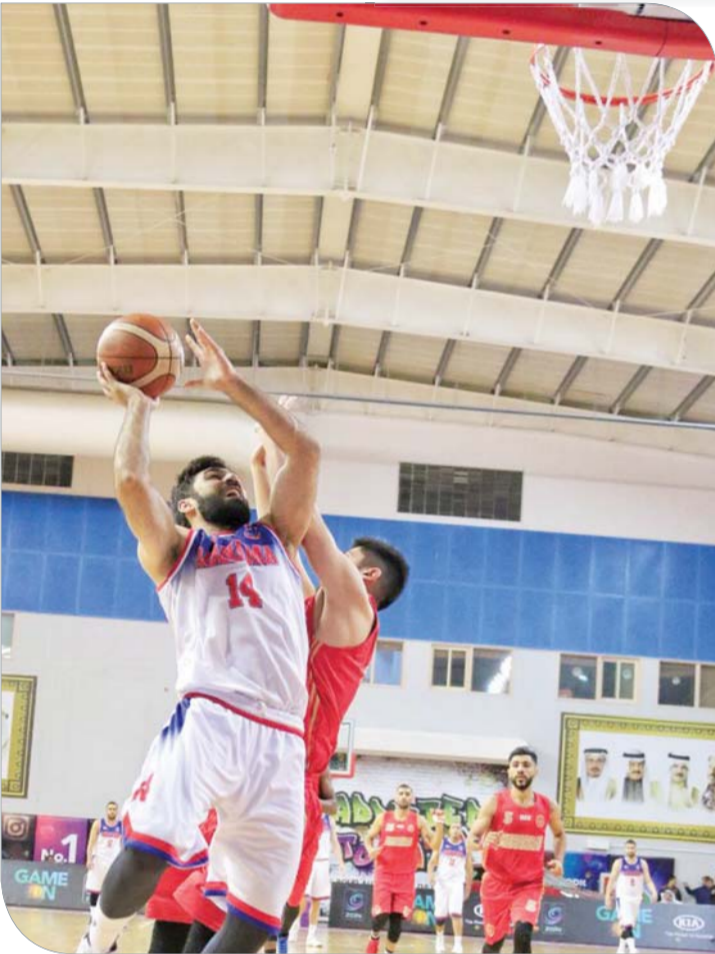
جانب من اللقاء