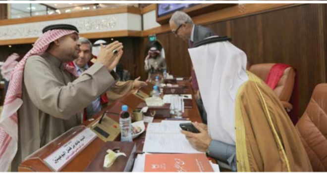
• النائب خليفة الغانم مصافحاً وفد إدارة المرور

وافق مجلس النواب أمس على طلب طرح موضوع نظام السير والمرور في مملكة البحرين للمناقشة خلال جلسة المجلس المقبلة. وتتضمن هذه المناقشة حول الإجراءات والخطط المعدة والمتخذة لتخفيف الازدحامات المرورية الشديدة والمستمرّة، ومن حيث تنفيذ قانون المرور في ضبط المخالفات المرورية وفرض العقوبات على المخالفين، وقبل التصويت، بين النائب جمال داوود أن سير طرح هذا الموضوع يأتي في إطار ارتفاع معدل المرورية في المملكة، والبحث عن حلول لتخفيفها، وتشميل حركة السير.