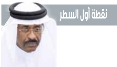
نقطة أول السطر