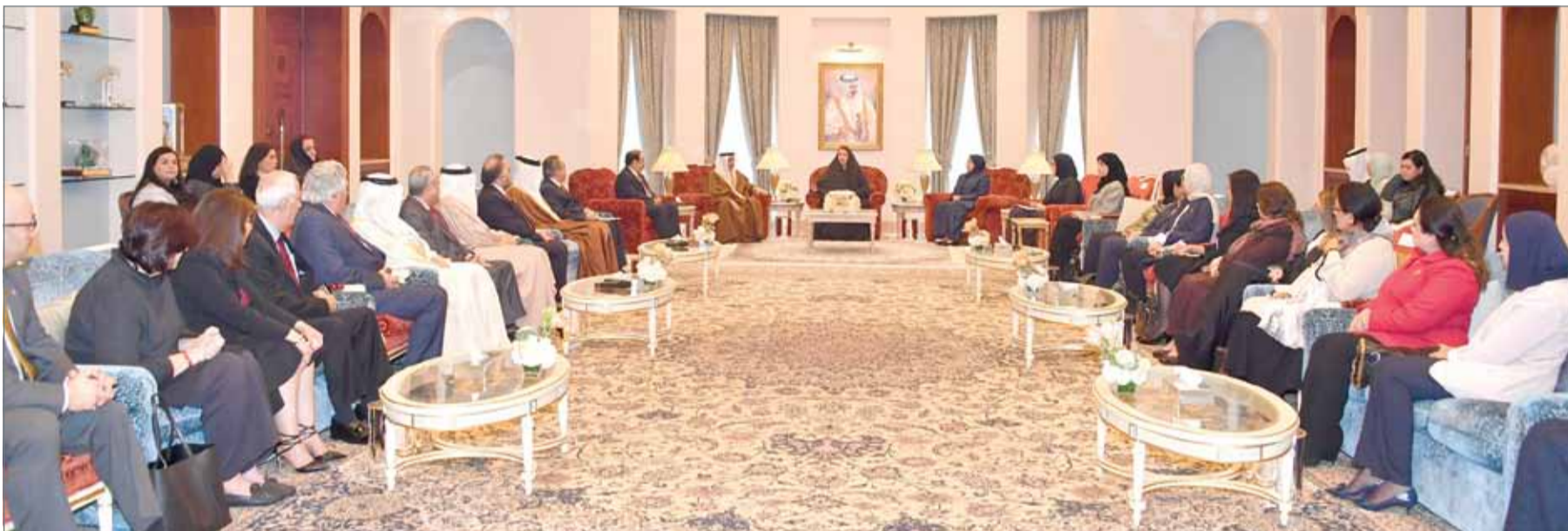
• سمو الأميرة سبيكة بنت إبراهيم مستقبلة نائب رئيس مجلس الوزراء الشيخ خالد بن عبدالله آل خليفة، وعدداً من الوزراء والمسؤولين

الرفاع - المجلس الأعلى للمرأة: أعلنت قرينة عاهل البلاد، رئيسة المجلس الأعلى للمرأة صاحبة السمو الملكي الأميرة سبيكة بنت إبراهيم آل خليفة عن موضوع يوم المرأة البحرينية للعام الجاري 2017، والذي سيخصص للاحتفاء بالمرأة البحرينية في المجال الهندسي، مشيدة سموها بالدعم اللامحدود الذي تحظى به المرأة البحرينية من لدن عاهل البلاد صاحب الجلالة الملك حمد بن عيسى آل خليفة، وتقدير جلالتها لدور المرأة وإسهاماتها القيمة في المجالات التنموية كافة ضمن المسيرة الوطنية المباركة التي توجه دفتها تلك الرؤية الملكية السبابة بتطلعاتها لاستمرار الخير والنماء والرخاء لشعب البحرين الوفي برجاله ونسائه.