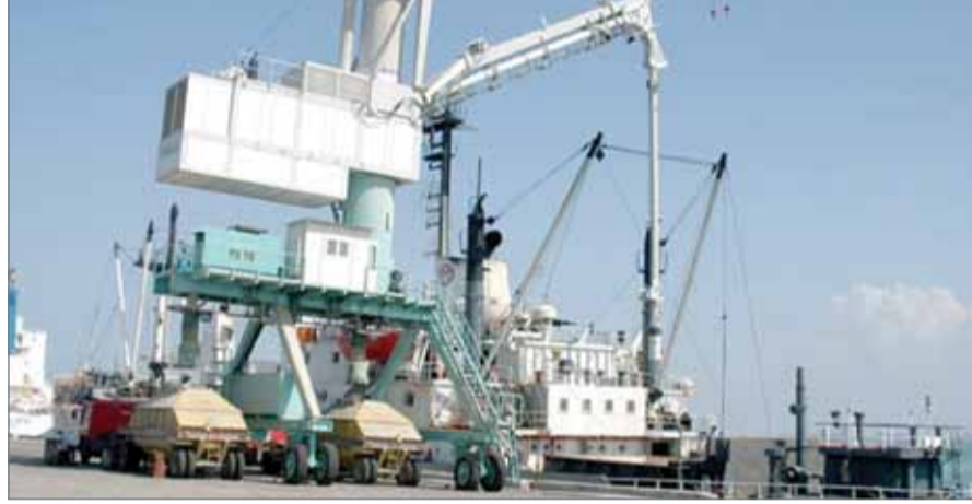
• 2,245,640 ديناراً انخفاض الدعم الحكومي