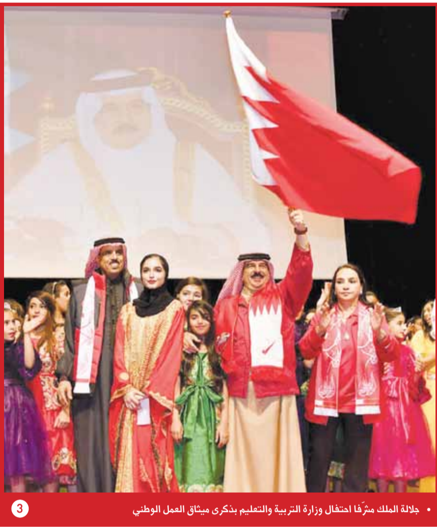
• جلالة الملك مشرفاً احتفال وزارة التربية والتعليم بذكرى ميثاق العمل الوطني

• رئيس الوزراء وولي العهد: سواصل العمل لتحقيق تطلعات الملك