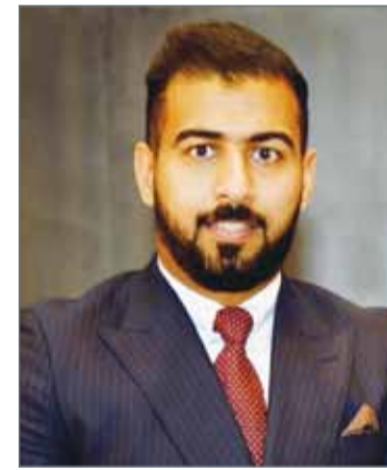
• محمود عادل بن حميد

ويقع مقر شركة أمفا لتأجير السيارات في برج "كاجيريا" بالقرب من مجمع الدانة المحاذي لمنطقة السيف.