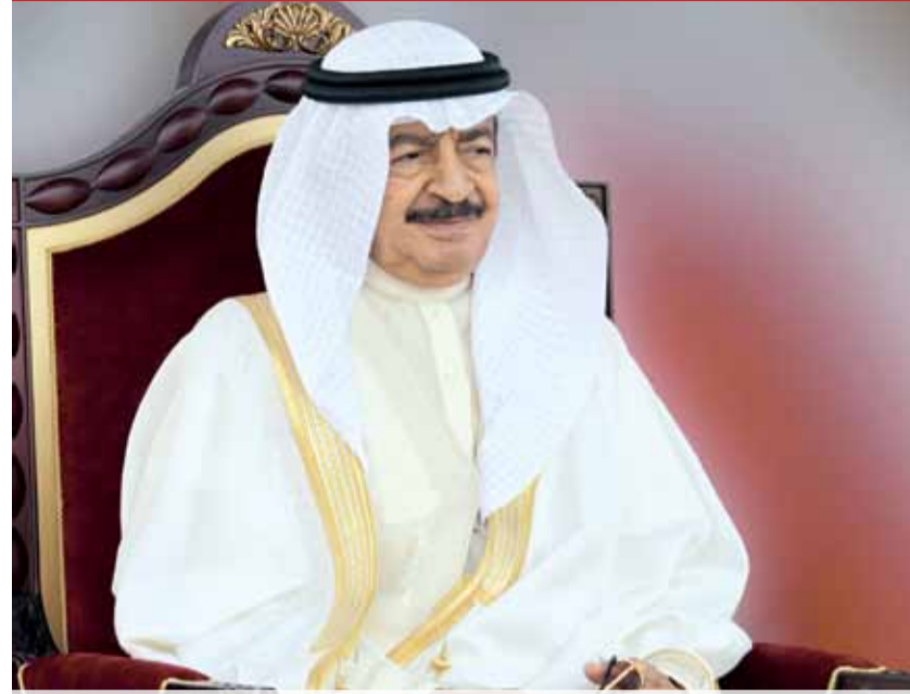
قصيدة مهداة إلى مقام رئيس الوزراء صاحب السمو الملكي