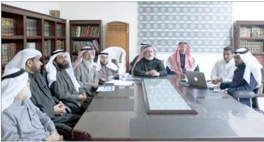
• استعراض مخرجات المراكز والحلقات القرآنية

التميزة التي يقيمها المركز، بعدها تم فتح باب النقاش حول المشكلات ومقترحات التطوير. وشملت زيارات العمرى، المراكز والحلقات