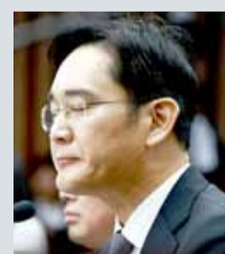
• جاي واي لي

سول - رويترز: اقتيد امس السبت رئيس مجموعة سامسونج موثق اليدين بجبل أبيض لاستجوابه امام سلطات كوريا الجنوبية بعد أن امضى ليلة في حبس انفرادي.