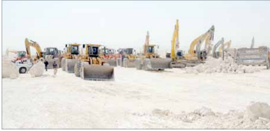
• نقص في إنتاجية المحجر

الرياض - أرقام: كشف وزير التجارة والاستثمار السعودي ماجد القصبي عن تدخل جهات عليا في السعودية لحماية 5 شركات عائلية كبرى من التفتت بعد أن دبت مشكلات عدة غير مالية فيها. وقال إن تلك الشركات أصبحت "ماركات عالمية"، وإن المشكلات حصلت فيها جراء التباين في الإدارة ومنهجية العمل، منوها إلى أن تفتتها سيضر بالاقتصاد الوطني. وقال "منذ تعييني بالوزارة، استلمت ملفات 5 شركات عائلية لكبار الأسر تعاني مشكلات، ونسعى بكل ما نستطيع لمعالجة أوضاعها، مع إعطاء أولوية لحمايتها بعدة طرق، من بينها إصلاح وتقريب وجهات النظر، أو تحويلها لمساهمة مغلقة، أو توزيعها إلى شركات عدة". وتطرق إلى قرب توقيع اتفاقية بين الدول الإسلامية يمكن من خلالها تبادل 45 سلعة دون قيود.