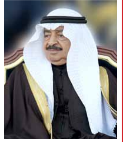
بقلم: الدكتور عبدالله الحواج

كما تضمن القرار تحديد مهمات لجنة جائزة صاحبة السمو الشيخة حصة بنت سلمان آل خليفة للعمل الشبابي التطوعي في إقرار الشروط والمعايير الخاصة بالجائزة، وإقرار السمات المشتركة التي تعكس الشروط والمعايير والإجراءات الخاصة بالجائزة وأهداف ومعايير التأهل للفرز، واقتراح الأعمال المرشحة لنيل الجائزة، وتقييم تلك الأعمال، وإقرار