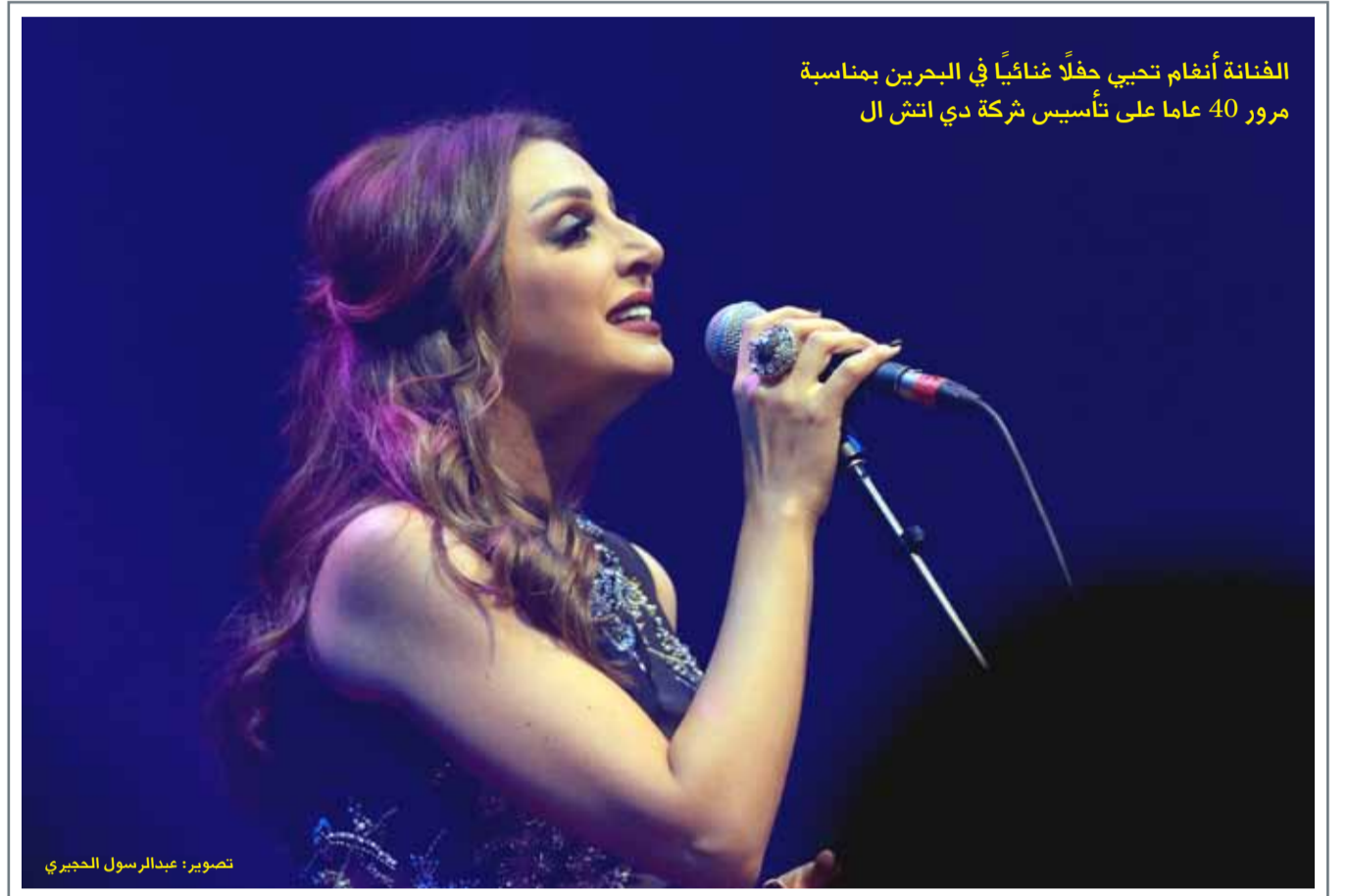
الفنانة أنغام تحيي حفلاً غنائياً في البحرين بمناسبة مرور 40 عاماً على تأسيس شركة دي اتش ال