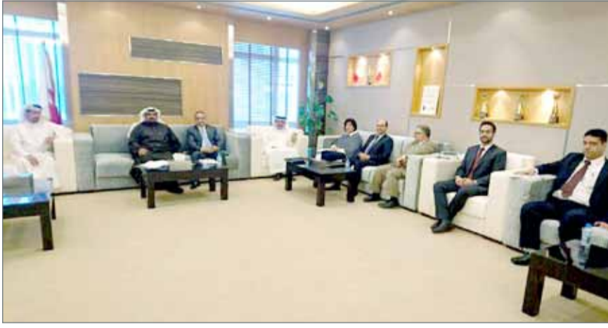
• خلال الاجتماع

مزلق المرفأ وإنشاء حاجز للسلامة بين المرفأ والبحر حماية لمرتاديه، إضافة لتوفير عمال نظافة بشكل مستمر للحفاظ على نظافة المرفأ وتوفير حراسة أمن حفاظاً على مرافق المرفأ وممتلكات الصيادين.