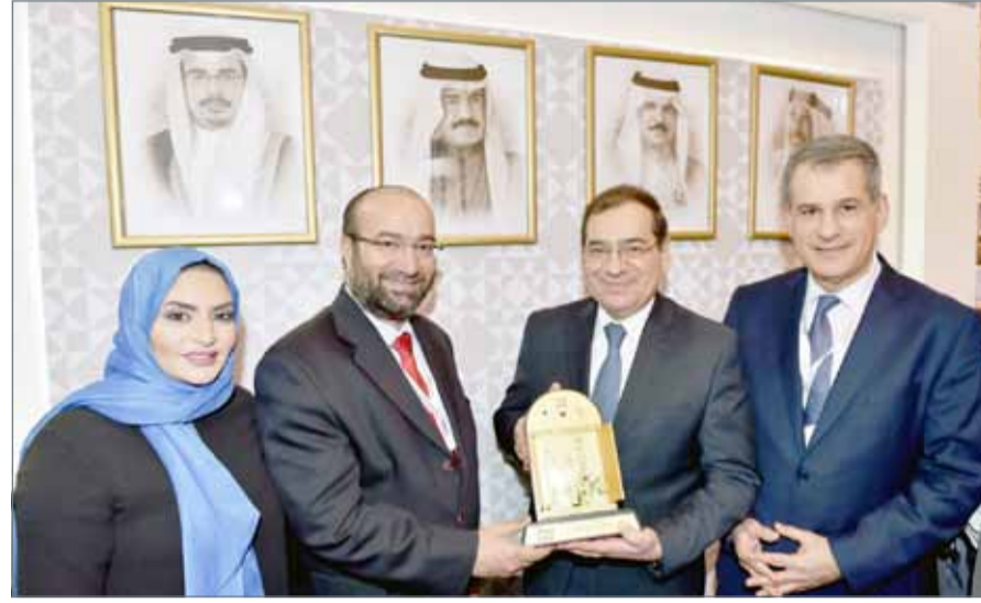
• توفيقى لدى لقائه طارق الملا

على مساحة 12 ألف متر مربع بمركز القاهرة الدولي للمؤتمرات. ويعتبر المؤتمر فرصة لتجمع المسؤولين الحكوميين، وكبار التنفيذيين، وصناع القرار للعمل معاً على إيجاد حلول ومواجهة التحديات ومناقشة الفرص الجديدة المتاحة في مجال الطاقة في مصر، حيث تضمن مؤتمر ومعرض مصر الدولي للبترول 2017، ثلاثة اجتماعات هي المؤتمر الإستراتيجي ومؤتمر المرأة في قطاع الطاقة، والذي ركز على دور السيدات في هذه الصناعة، إضافة إلى لقاء ثالث اشتمل على نحو 28 جلسة فنية غطت أكثر من 10 فئات فنية، بحثت المواضيع الأكثر تعقيداً في قطاع الطاقة.