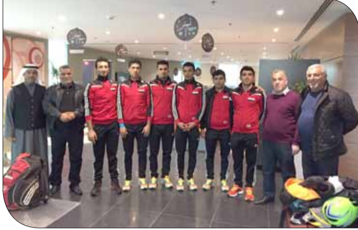
منتخب العراق لفئة العموم

بدأت المنتخبات المشاركة في البطولة التوافد على أرض مملكة البحرين استعداداً للمشاركة القارية والخوض في المنافسات القارية جداً على مستوى سباقات الطريق، وكان المنتخب العراقي أول الواصلين إلى البلاد، حيث وصلت الدفعة الأولى من الوفد العراقي الخاصة بمنتخب فئة تحت 23 سنة في 12 فبراير الجاري، وتبعها في ظهر أمس الدفعة الثانية من أسود نجوم الدراجات العراقية في فئة العموم بالوصول إلى البحرين، وفي ظهيرة أمس وصلت أيضاً بعثة المنتخب السوري الذي يشارك في البطولة ويتطلع إلى المنافسة على مراكز المقدمة، ويستمر خلال الأيام القادم تقاطر الوفود الآسيوية على البحرين لاكمال المشهد الرياضي الذي سيكون مشوقاً للجماهير وعشاق اللعبة وفيه الكثير من الجمال والتدية والإثارة.