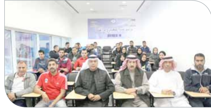
جانب من افتتاح الدورة

من البطولات القارية والعالمية وكانوا خير سفراء لوطنهم. وأكد خلفان أن الاتحاد بأمرس الحاجة لتعزيز قاعدة الحكام لديه، خصوصاً وأنه مقبل على استضافة سلسلة من البطولات القارية والعالمية، في مقدمتها بطولة العالم للناشئين تحت 19 عاماً والتي ستقام خلال شهر