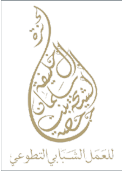
• شعار جائزة الشيخة حصة للعمل الشبابي التطوعي

ويشترط للمشاركة في الجائزة أن يكون عمر المتقدم ما بين 18 و35 عاماً، وأن يكون المتقدم للجائزة بحريني الجنسية، وأن تكون الأعمال في الفئة الجماعية المشاركة تحت مظلة قانونية أي تابعة لأحدى المؤسسات التعليمية أو الجامعات أو مؤسسات المجتمع المدني، فيما تدور معايير الجائزة حول جوانب التميز في المشروع والاستدامة والالتزام به، والجهات التي تم التعاون معها أو الداعمة للمشروع، إلى جانب الفئات المستهدفة من المشروع والآثار الإيجابية المقدمة لهم، والخبرات المكتسبة والحصول على شهادات أو جوائز في مجال عمل المشروع، والإنجازات والإسهامات السابقة لصاحب المشروع أو الفريق في المشاريع التطوعية الأخرى، والمقابلات الشخصية.