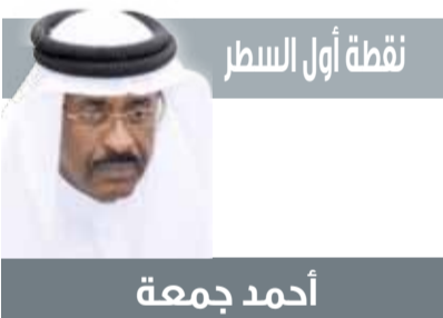
نقطة أول السطر