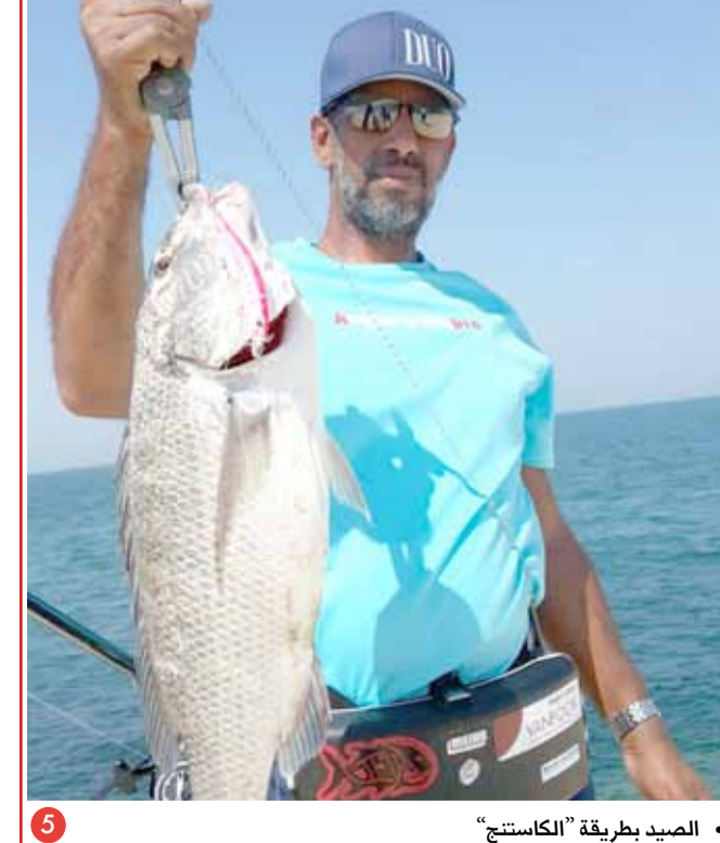
• الصيد بطريقة "الكاستنج"