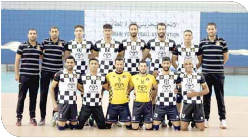
فريق الأهلي لكرة الطائرة

ويدخل الفريق مواجهة البطولة بمعنويات عالية بعد فوزه على النجمة وارتقائه للمركز الثالث في سلم الترتيب، حيث يقع الفريق في المجموعة الثالثة التي تضم إلى جانبه المجمع الجزائري، تتورين اللبناني، الأهلي السعودي، وسيبدأ الفريق مشواره العربي بلقاء المجمع الجزائري يوم غد الاثنين الساعة 7 مساءً.