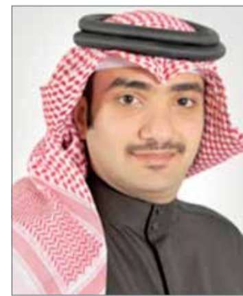
• الشيخ عبدالله بن خليفة

وبشكل خاص تجاوز حجم الأصول تحت الإدارة مبلغ 1 مليار دولار مما يعكس ثقة عملائنا المتزايدة بقدرتنا على تحقيق أداء ثابت والتكيف مع أوضاع السوق الصعبة.“ من جانبه، أوضحت الرئيس التنفيذي نجلاء الشيراوي بشأن النتائج المالية لسنة 2016 قائلة: ”على الرغم من التقلبات التي سادت الأسواق المالية خلال السنة وأثرت على عوائد محفظة الاستثمار التابعة للبنك، غير أن قطاعات أعمالنا الأساسية شهدت زخماً في نشاطاتها، ما يظهر مدى إصرارنا على تنمية أعمالنا من خلال هيكلة أدوات استثمارية فريدة وإبتكار حلول رائدة في سوق المال، وتحقيق أداء متفوق لعملائنا“.