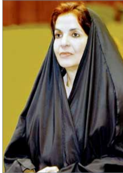
• سمو الأميرة سبيكة بنت إبراهيم

وكان سبباً في إثراء مجتمعها المدني. وتهدف الجائزة إلى نشر وتعزيز مفهوم ثقافة العمل التطوعي وإبراز قيمته المعنوية كواجب وطني وإنساني، وتعزيز وتطوير دور الأفراد والجماعات في تحقيق الانجاز والإبداع والاستدامة لمشاريع العمل التطوعي، وتعزيز روح المنافسة وإبراز المبادرات الشبابية في مجال تنفيذ مشاريع متميزة موجهة لخدمة المجتمع.