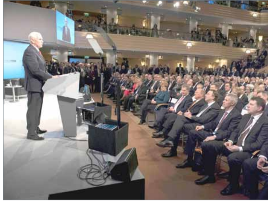
• نائب الرئيس الأميركي متحدثاً أمام مؤتمر الأمن في ميونخ

ميونخ - فرانس برس: أكد نائب الرئيس الأميركي مايك بنس أن إيران لا تزال تمثل تهديداً للأمن العالمي إلى جانب الإرهاب المتطرف، ودعا بنس أمام مؤتمر الأمن في ميونخ إلى استجابة قوية من الدول على تهديدات الخصوم الجدد والقدامى، حسب وصفه. وقال: "المخاطر تتغير وتتمو كل يوم، العالم الآن أكثر خطورة منذ انهيار الشيوعية، تهديدات أمننا وسلامتنا تنتشر حول العالم من صعود الإرهاب المتطرف إلى التهديدات التي تمثلها إيران وكوريا الشمالية.. صعود الخصوم الجدد والقدامى يتطلب استجابة قوية منا جميعاً". وقال أمام مؤتمر الأمن في ميونخ، بهدف طمأنة طغاة الولايات المتحدة القلقين إزاء تصريحات الرئيس دونالد ترامب إن "الرئيس طلب مني أن أكون هنا اليوم لنقل هذه الرسالة التي تفيد أن الولايات المتحدة تدعم بقوة الحلف الأطلسي وإننا ثابتون في التزامنا بحياة".