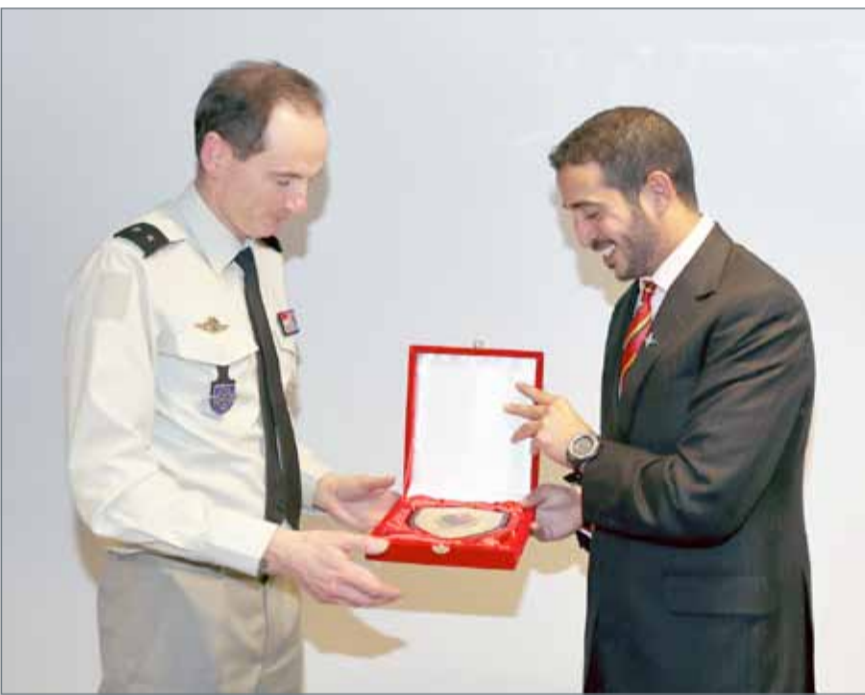
• سمو الشيخ خالد بن حمد ملتقياً مدير إدارة التعاون الدولي بالجيش الفرنسي

وفي ختام اللقاء، تبادل سموه الدروع التذكارية بهذه المناسبة مع مدير إدارة التعاون الدولي بالجيش الفرنسي. من جهته، عبر الجنرال فريتش عن شكره وتقديره للرائد سمو الشيخ خالد بن حمد متمناً دور سموه الداعم لفتح آفاق أرحب للتعاون المشترك مع فرنسا في المجال العسكري خصوصاً على صعيد التدريب والتأهيل وتبادل الخبرات، والذي من شأنه أن يعزز العلاقة البحرينية الفرنسية في هذا المجال، ويسهم في تقوية الروابط الوثيقة بين البلدين الصديقين.