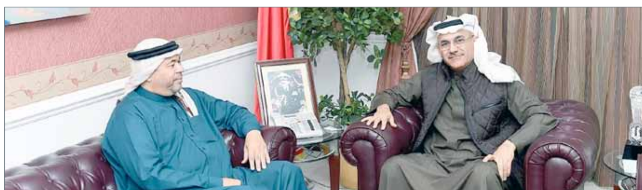
• العصفور مستقبلاً السكان

محافظة، مؤكداً ثقته في كوادر المحافظة لبذل المزيد من الجهد لتنفيذ الأفكار التي تخدم المجتمع بكل فئاته، مشيراً إلى أن هناك العديد من الأفكار التي يمكن تحويلها إلى برامج عمل تساهم في استقطاب المواطنين والمقيمين لتحقيق