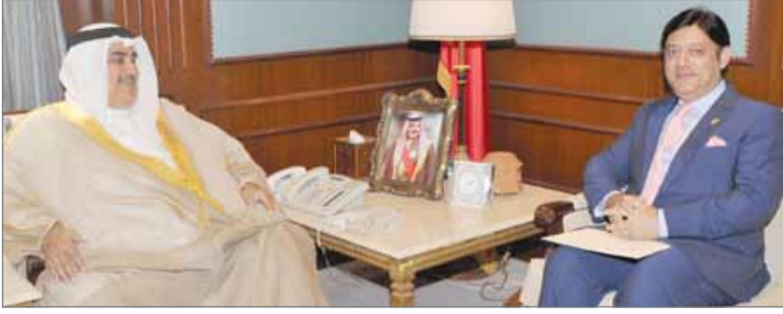
• وزير الخارجية مستقبلاً السفير الباكستاني