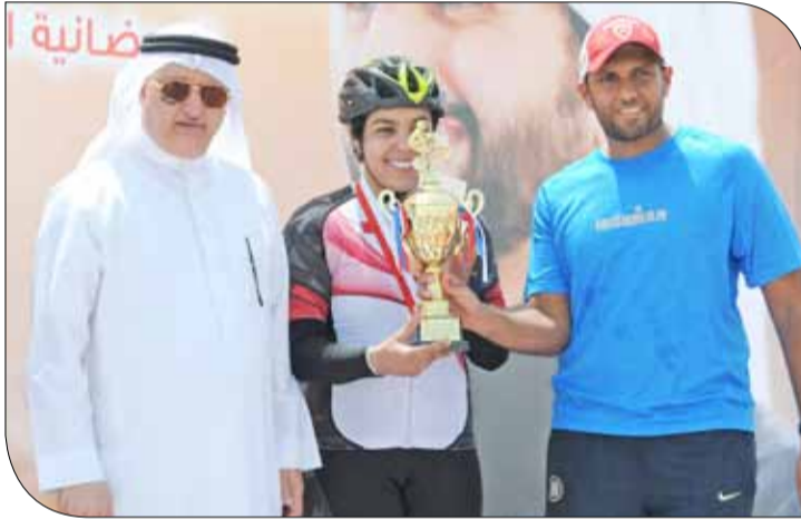
رئيس مجلس إدارة الاتحاد البحرين للدراجات الهوائية يتوج الفائزين

والمشاركين، مختتما حديثه بالإشارة إلى أنها فرصة حقيقية لإبراز المواهب وتشجيعهم وتوجيههم للمزيد من العطاء الرياضي ولأن يجد جميع الدراجين فرصتهم الأكيدة في المشاركة وإثبات قدراتهم وما يمتلكون من موهبة في هذا المجال الرياضي.