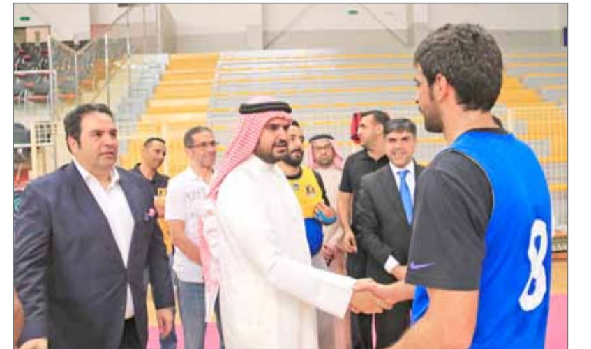
سمو الشيخ عيسى بن علي يشهد تدريبات المنامة والأهلي قبل المغادرة إلى تركيا

بطولة الأندية الخليجية، وسنكون خلفهما مع كافة الجماهير البحرينية التي تنشأ من لاعبي الفريقين إنجازاً مثيراً يعكس ما وصلت إليه السلة البحرينية من مستوى. والتقى سموه بعدد من مسؤولي الناديين والأجهزة الفنية والإدارية ولاعبي الفريقين، وتمنى لهم قضاء معسكر تدريبي ناجح يرفع من وتيرة الاستعداد لهذه المشاركة الخليجية، مؤكداً سموه أن الاتحاد البحريني لكرة السلة يقف قلباً وقالباً مع ممثلي المملكة.