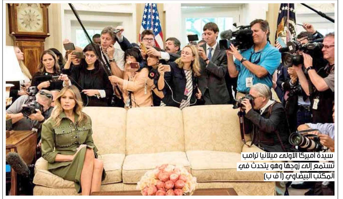
سيدة أميركا الأولى ميلانيا ترامب تستمع إلى زوجها وهو يتحدث في المكتب البيضاوي

حالة الطقس: الطقس غائم جزئيا إلى غائم أحيانا مع فرصة لتساقط أمطار متفرقة. الرياح جنوبية شرقية من 12 إلى 17 عقدة تتحول إلى شمالية شرقية مع هبات قد تصل إلى 35 عقدة. ارتفاع موج البحر من قدم إلى قدمين قرب السواحل ومن 2 إلى 4 أقدام في عرض البحر. درجة الحرارة العظمى 35 درجة مئوية، والصغرى 26 درجة مئوية.