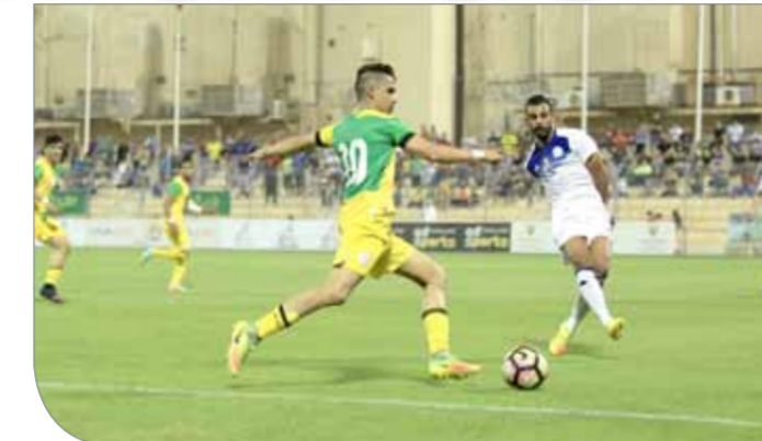
من لقاء المالكية والنجمة