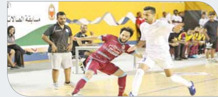
من لقاء الشباب والحد

أسفرت نتائج الجولة الخامسة من دوري الاتحاد وبيت التمويل الكويتي لكرة قدم الصالات عن فوز فريقتي الشباب ومنتخبنا تحت 20 عاماً على الحد والمالكية، وتعادل قلالي مع المحرق. وأسفرت نتائج الجولة الخامسة من دوري الاتحاد وبيت التمويل الكويتي لكرة قدم الصالات عن فوز فريقتي الشباب ومنتخبنا تحت 20 عاماً على الحد والمالكية، وتعادل قلالي مع المحرق. وكانت لقاءات الجولة أقيمت مساء يوم أمس الأول على صالة الاتحاد البحرينية لرياضة ذوي الاعاقة، إذ فاز منتخبنا تحت 20 عاماً على المالكية بنتيجة (2-1)، في حين تخطى الشباب نظيره الحد بنتيجة (2-1)، بينما تعادل قلالي مع المحرق بنتيجة (2-2). وبناء على نتائج الجولة الخامسة، فإن الترتيب يشير حالياً إلى صدارة الشباب برصيد 12 نقطة من 4 مباريات لعبها، وحقق الفوز في جميعها، المحرق 10 نقاط من 3 حالات فوز وخسارة، قلالي 9 نقاط من 3 حالات فوز وخسارة، قلالي 7 نقاط من فوزين وتعادل وخسارة، منتخبنا 6 نقاط من فوزين و3 حالات خسارة، التضامن والمالكية بلا نقاط، إذ لعب الأول 4 مباريات والثاني 5.