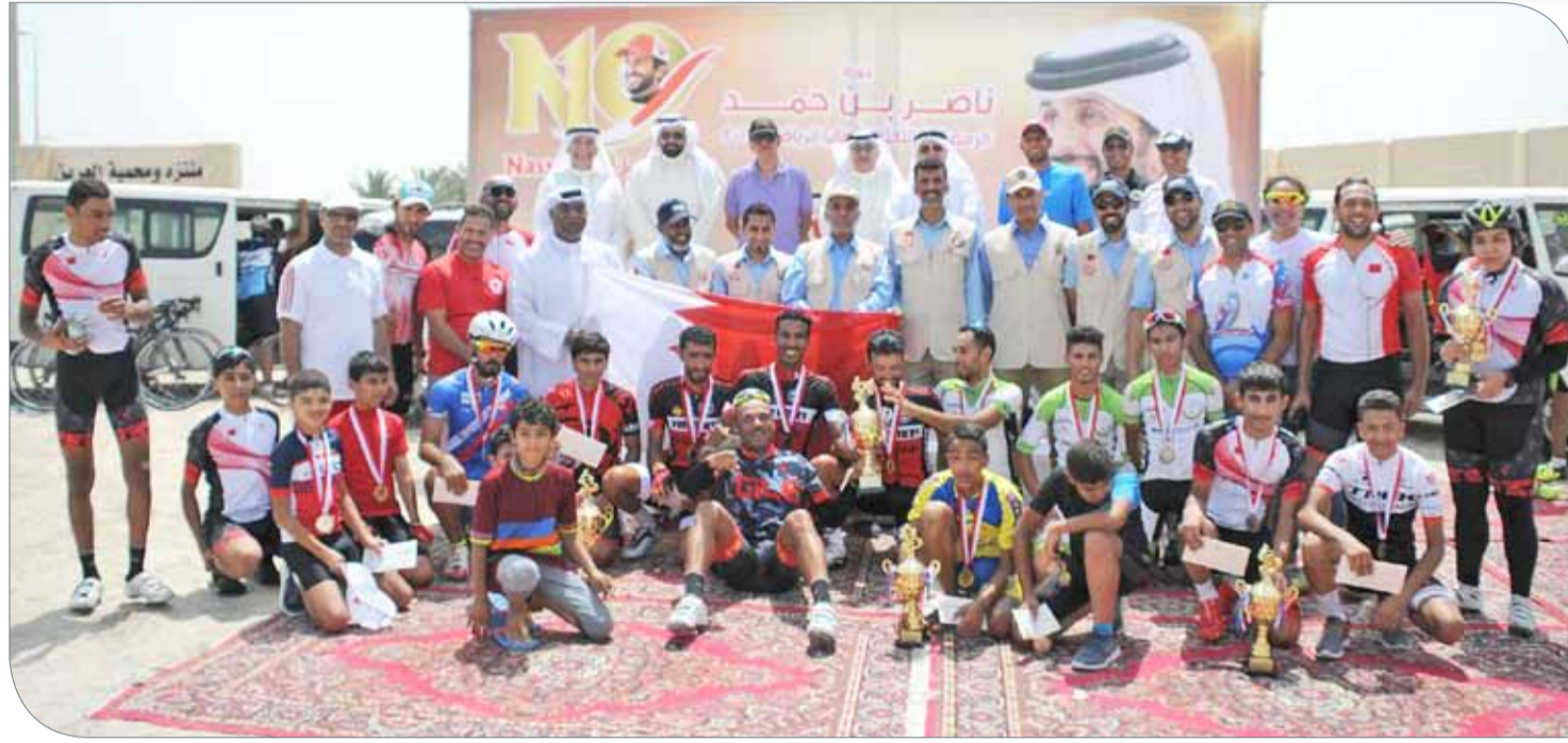
عسكر يتوسط الفائزين في أحد سباقات الدراجات ضمن ناصر 10