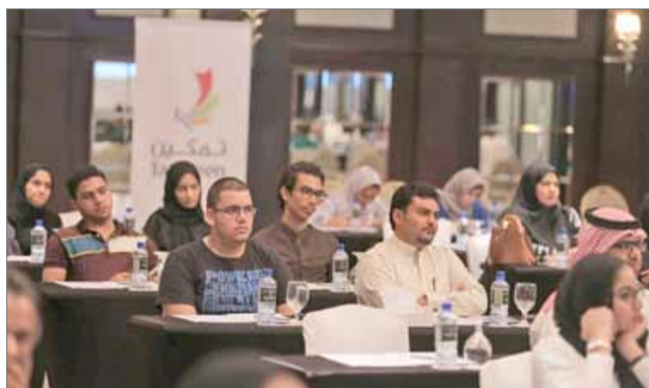
• جانب من ورش عمل ”تمكين“

تحسين كفاءاتهم؛ ليحققوا أعلى معايير الإنتاجية، كما ستقوم ”تمكين“ بتوفير رسوم التدريب ودعم الأجور للمؤسسات، مما يساعدها على خفض تكاليف التوظيف والتدريب.