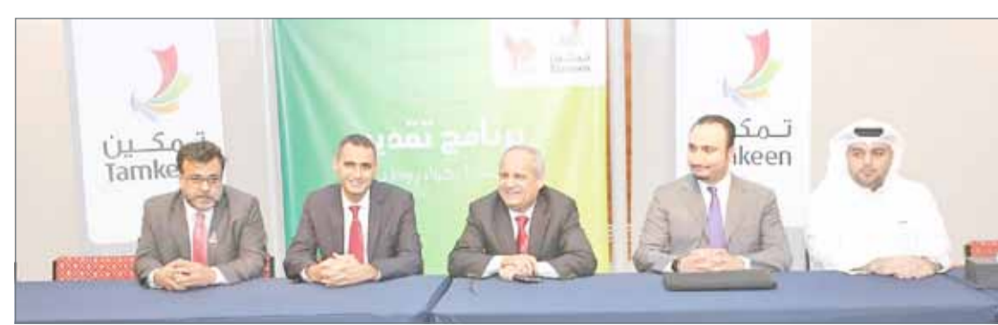
• احدى فعاليات برنامج ”تمكين“

جميع المؤسسات التي لديها سجل تجاري نشيط في مملكة البحرين وتجاوزت معدل البرنة مؤهلة للتقديم في البرنامج.