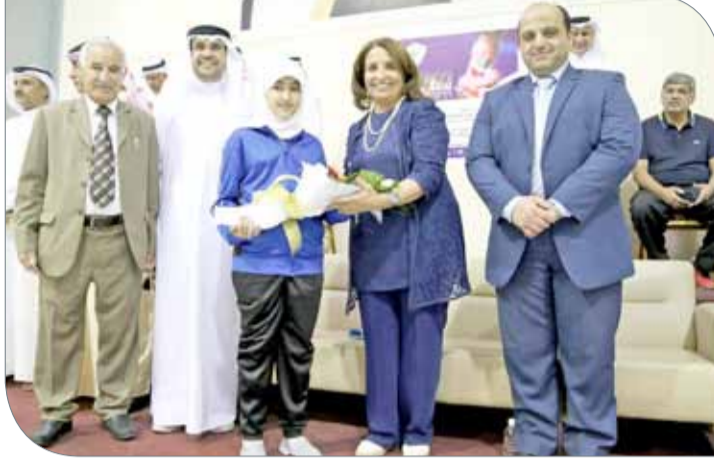
حياة بنت عبدالعزيز لدى رعايتها احتفالية نادي توبلي

الموسم المنصرم يؤكد أن النادي يسير في الطريق الصحيح. وأيدت رئيسة اتحاد الطاولة، المبادرة التي قام بها نادي توبلي بإعلان تشكيل نسائي لكرة الطاولة، مبينة أن هذه الخطوة المميزة تؤكد حرص النادي بإشراك العصر النسائي، متمنية للنادي والفرق كل التوفيق والنجاح. وشددت الشبيخة حياة بنت عبد العزيز آل خليفة على أن اتحاد الطاولة سيواصل دعمه لكل الأندية دون استثناء لرفع مستوى اللعبة والمنافسة فيها، بما يعزز من قدرتها على تحقيق إنجازات للرياضة البحرينية، وأبدت سعادتها بأن يأتي هذا التكريم شاملاً لكرة الطاولة وكرة اليد.