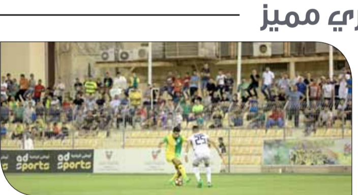
حضور جماهيري مميز في استاد الأهلي

◆ بناء على ما أفرزته نتائج الجولة 17 (قبل الأخيرة)، فإن المنافسة على البقاء ضمن الأندية الكبار بين البحرين والنجمة. البحرين سيلعب الجولة الأخيرة أمام الحد، فيما النجمة سيلعب أمام الهناطة. الأفضلية للنجمة في حال تشابه النتيجة التي سيقفها مع النتيجة التي سيحققها البحرين بناء على المواجهات المباشرة بين الطرفين، في وقت فإن البحرين ينظر تشر النجمة بالتعادل أو الخسارة، بالإضافة إلى تحقيقه للفوز؛ للبقاء في الدرجة الأولى.