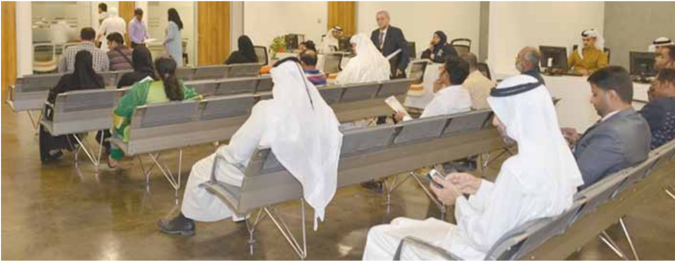
• تسجيل شركات المسؤولية المحدودة يتجاوز 50%