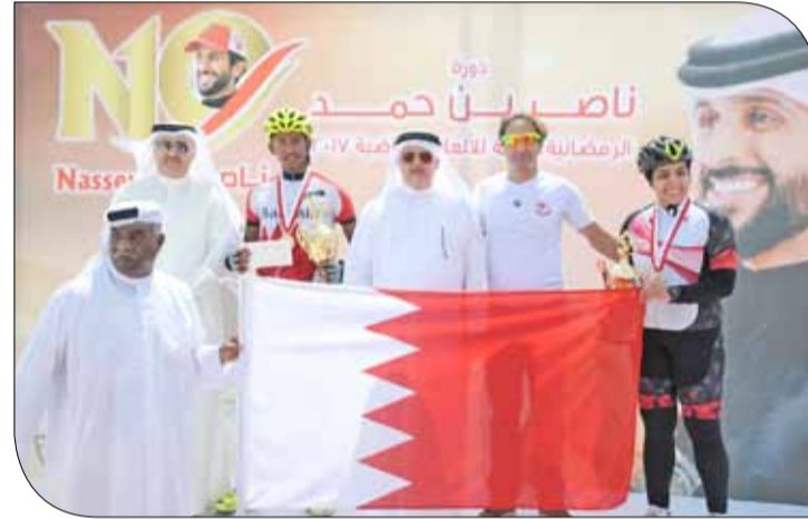
جانب من تتويج الفائزين في سباق الدراجات ضمن ناصر 10

وهذه الأمور في مجملها أسهمت بشكل واضح في النجاح الذي تحقق في إحدى سلسلات مسابقات البطولة، مضيفاً أن الدلائل تشير إلى المزيد من النجاح والتميز في القادم من المسابقات. ويرى عبدالرحمن عسكر أن هناك الكثير من العوائد الإيجابية والانعكاسات الطيبة على الشباب الرياضي وأن مثل هذا الأمر هو بديهي جداً للعبة الدراجات الهوائية مع اختيار اللعبة في أن تكون ضمن الألعاب المصاحبة لبطولة محاطة بالكثير من الرعاية والاهتمام من سمو الشيخ ناصر بن حمد آل خليفة لجميع اللاعبين