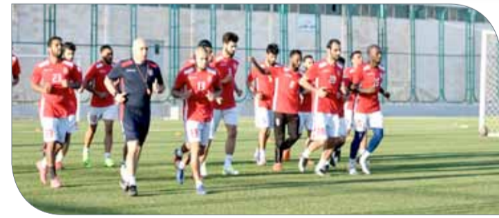
من تدريب المحرق يوم أمس