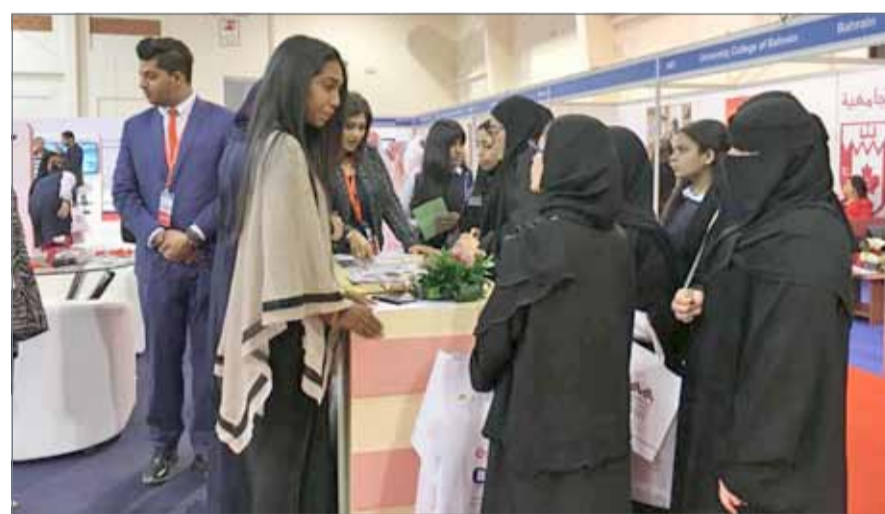
• بحرينيات يبحثن عن فرص تدريب وتوظيف تناسب مؤهلاتهن في أحد المعارض