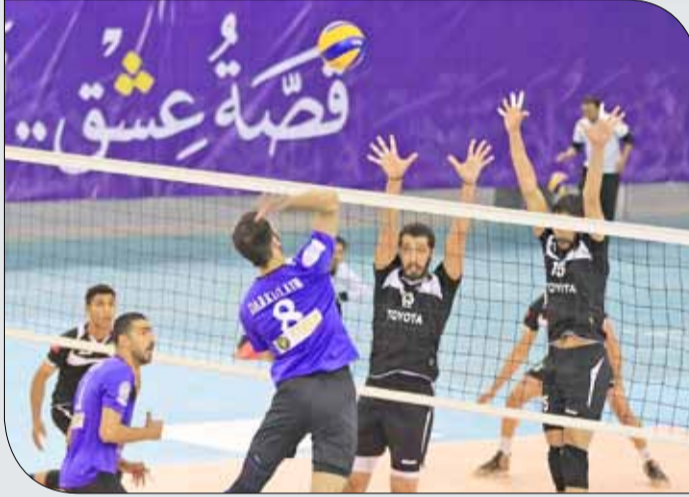
من لقاء داركليب والأهلي الأخير فيه الجولة الثالثة

التقى الأهلي مع داركليب هذا الموسم ثمان مرات ومواجهة اليوم تعتبر اللقاء التاسع بينهما. ومن أصل ثمانية لقاءات استطاع الأهلي أن يحقق الفوز في 6 مباريات، حيث تغلب عليه في نهائي كأس الاتحاد 3/0، وفاز عليه في الدور الثاني لمسابقة الدوري بالنتيجة نفسها، بينما فاز عليه بصعوبة في بطولة الأندية الخليجية بالدوحة 3/2، كما فاز عليه بكأس ولي العهد بنتيجة 3/2، وتغلب عليه في الجولة الأولى من المربع الذهبي 3/1 وفي الجولة الثالثة بذات النتيجة، فيما نجح داركليب في الفوز عليه في الدور الأول من مسابقة الدوري 3/1 وبالنتيجة نفسها في الجولة الثانية من المربع الذهبي.