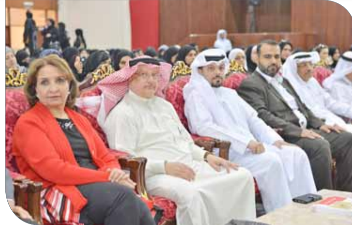
عبدالرحمن عسكري لبدء افتتاحه الندوة

وكان الأمين العام للجنة الأولمبية البحرينية عبدالرحمن صادق عسكري افتتح الندوة بكلمة رحّب فيها بالحضور ونقل لهم فيها تحيات ممثل جلالة الملك