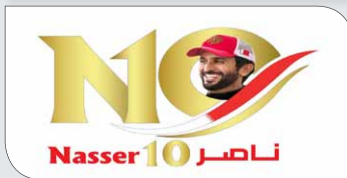
شعار دورة ناصر 10

بالتواصل مع المعنيين في الاتحاد البحريني لكرة اليد من أجل تنفيذ توجيهات سمو الشيخ ناصر بن حمد آل خليفة واتخاذ الإجراءات الإدارية المناسبة لتوزيع تلك الجوائز على الجماهير التي ستحضر المباراة، مؤكداً أن التعاون والشراكة بين اللجنة المنظمة لدورة ناصر بن حمد والاتحاد البحريني لكرة اليد ستسهم في نجاح هذه المبادرة والرامية إلى تشجيع الجماهير البحرينية لحضور المباريات والوقوف إلى جانب فرقها الرياضية.