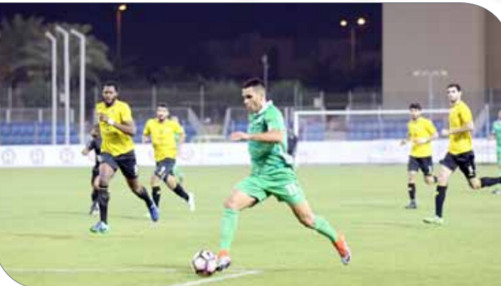
من لقاء البحرين والأهلي