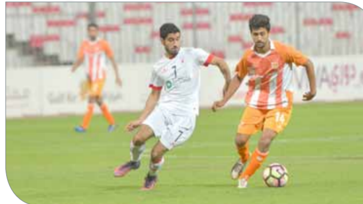
من لقاء الرفاع الشرقي والحالة