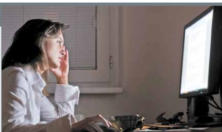
• نساء يؤكدن أن العمل الليلي لم يضيف إليهن شيئا

واختتمت حديثها قائلته: إن مهنتي مرتبطة بفكرة الحياة والموت، ولذا فأنا أقبل العمل وفق شروط استثنائية، ولكن لا أقبل التوسع في التوجه لعمل النساء ليلاً على نحو مطلق.