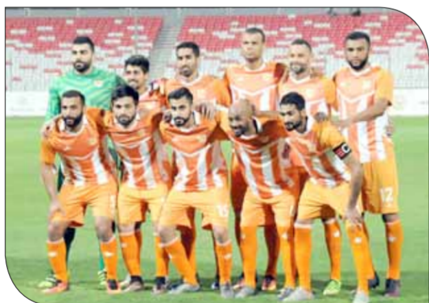
الحالة هبط رسمياً وسيرافق البحرين أو النجمة

◆ شهد استاد النادي الأهلي بالمحور حضوراً جماهيرياً مميزاً من قبل جماهير الطرفين، وبالأخص جمهور المالكية. وحضرت رايفاتنا الناديين الملعب وأرزتار فريقهما طوال المباراة، إذ جلست جماهير المالكية بين المنصة الرسمية والمدارجات المقابلة لها، بالإضافة إلى أنحاء أخرى من الملعب، في حين جلست جماهير النجمة يسار المنصة. وعلقت جماهير المالكية بإفلات تشجيعية لفرقها على أنحاء الملعب، وتفاعل الجمهوران