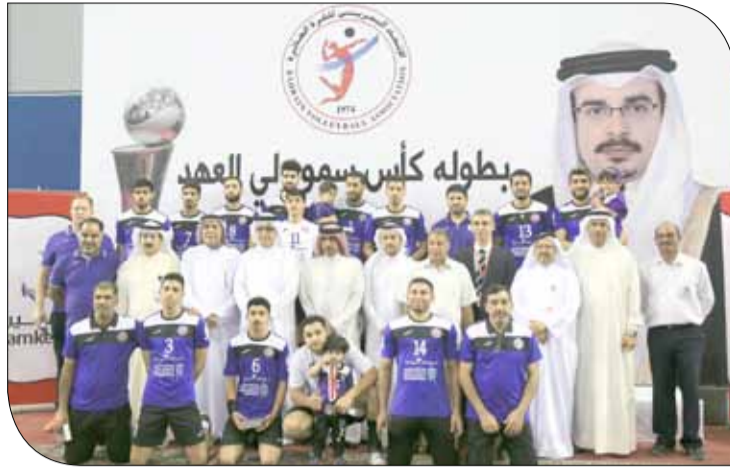
صورة جماعية لداركليب صاحب المركز الثاني