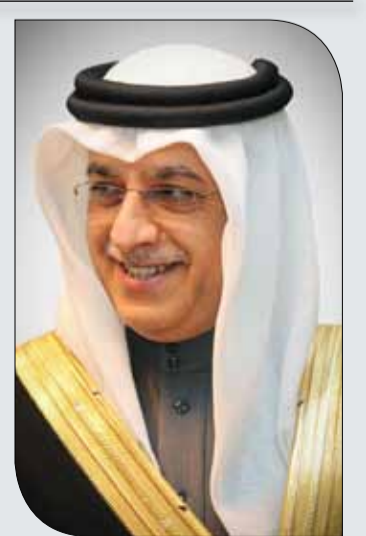
الشيخ سلمان بن إبراهيم

وبهذه المناسبة أعرب معالي الشيخ سلمان بن إبراهيم آل خليفة عن شكره لصاحب السمو الملكي الأمير سلمان بن حمد آل خليفة ولي العهد نائب القائد الأعلى النائب الأول لرئيس مجلس الوزراء واعترازه بإنابة سموه بتتويج الفائزين بمسابقة كأس سمو