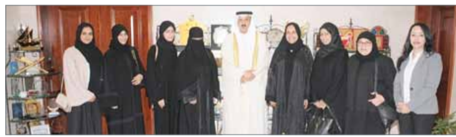
• جانب من الاستقبال

الكوادر التربوية العاملة في الميدان على تحقيق أعلى مستويات التميز والإبداع في الأداء المدرسي بمجالاته كافة، ومردودها الإيجابي على الأداء العام للمدارس، وتحسين مخرجات الطلبة، معرباً عن شكره وتقديره لفرق العمل بلجنة تقييم الجائزة على جهودها في تقييم أداء المدارس المشاركة.