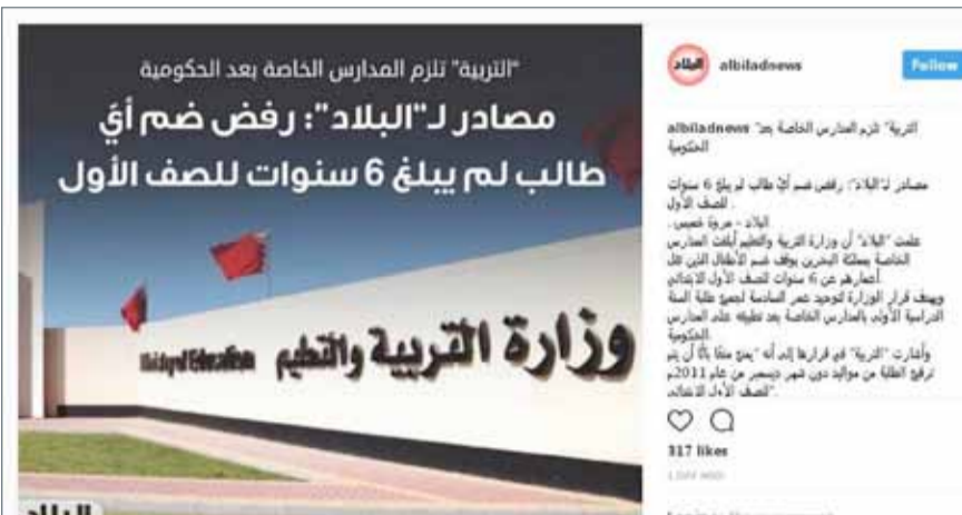
صورة الموضوع المنشور في "إنستغرام" الصحيفة