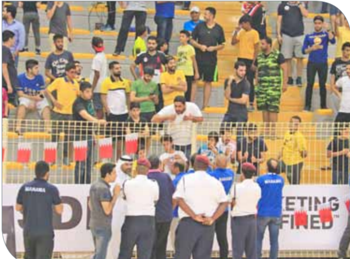
تخدير جماهيري لأهلهي من قبل المنظمين ورجال الأمان قبل الاستعدادهم

36/22 واستمر الأهلي الإماراتي اعتماده على الريمات الثلاثية التي قفصت ظهر فريقنا بعد صياح لأكثر من 3 دقائق عن التسجيل، ولمعق الفارق إلى 49/24 مع منتصف الربع. وشهدت الدقيقة السابعة استبعاد ميكو لمحرّف الأهلي الأمريكي بعد أن حصل على 4 أخطاء شخصية ليتلفظ على حكم المباراة الذي قام باستجاده على الفور. وفرد الأهلي الإماراتي غزلاته خلال باقي فترات الربع، ونجح في إنهاء الشوط الأول بفارق كبير جداً وصل إلى 39 نقطة، وسط غياب تام للحلول الجماعية وحتى الفردية من لاعبيها.