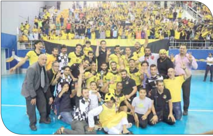
صورة جماعية للفريق البطل