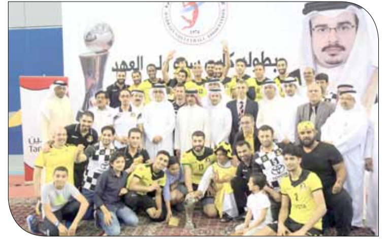
جانب من التتويج

◆ سلمان بن إبراهيم توجه بلقب كأس ولي العهد للطائرة