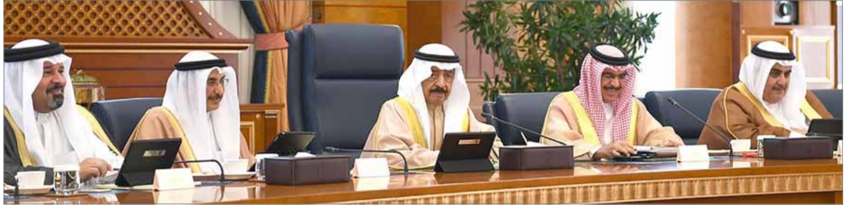
• سمو رئيس الوزراء يتأسر جلسة مجلس الوزراء

بعد ذلك وجه سموه إلى استيعاب احتياجات أهالي بلاد القديم والزنج من الخدمات الإسكانية ضمن المدينة الشمالية إضافة إلى استيعاب أصحاب الطلبات من أهالي سلماباد ضمن مشروع الرملة الإسكاني.