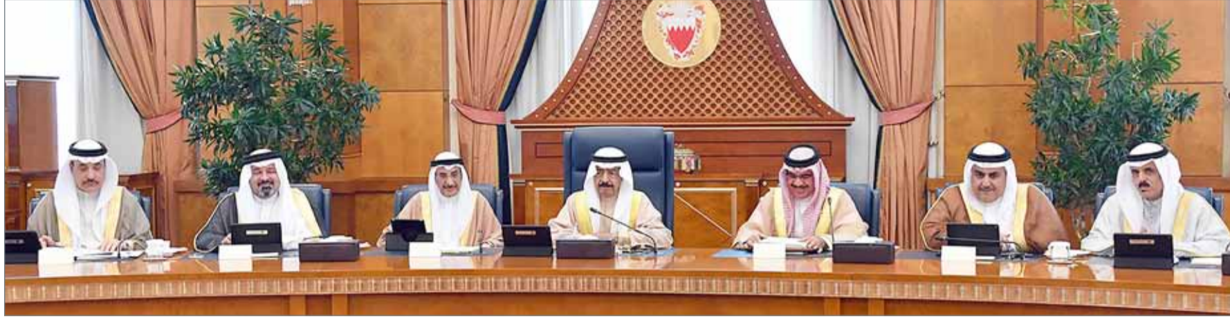
• سمو رئيس الوزراء يترأس جلسة مجلس الوزراء

• استيعاب الاحتياجات الإسكانية للبلاد القديم بالمدينة الشمالية وسلماباد في "الرملي"