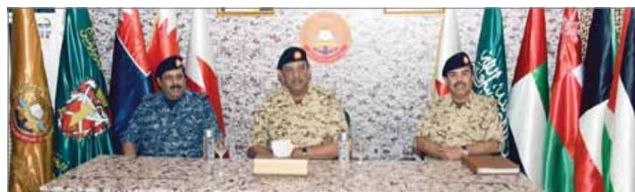
• القائد العام في زيارة الكلية الملكية للقيادة والأركان والدفاع الوطني

إلى أن الكلية الملكية للقيادة والأركان والدفاع الوطني تسخر إمكاناتها كافة؛ لتقديم أعلى مستويات التأهيل العسكري لتخريج دفعات متتالية من القادة والضباط المؤهلين أكاديمياً وعسكرياً وإعدادهم الإعداد الأمثل وصلقلهم بالعلم والمعرفة؛ للمساهمة في متابعة عمليات التحديث والتطوير بقوة دفاع البحرين.