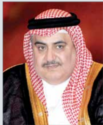
• وزير الخارجية

المنامة - بنا: تلقى وزير الخارجية الشيخ خالد بن أحمد بن محمد آل خليفة مساء أمس، اتصالاً هاتفياً من نائب رئيس الوزراء ووزير الخارجية بالجمهورية اليمنية عبدالملك المخلافي.