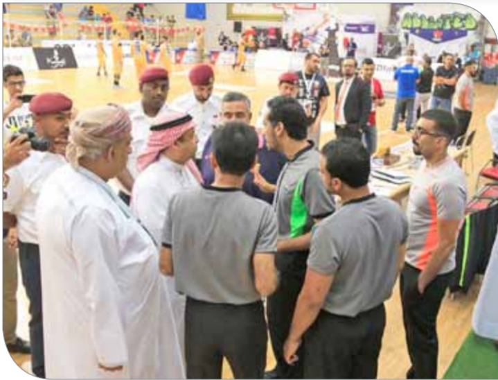
مشاورات ومداولات بين الحكام واللجنة الفنية لاستئناف اللقاء