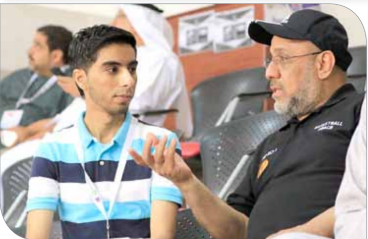
لال متحدتاً لـ"البلاد سبورت"

تضخيراً ولم يخض مباريات تجريبية ما أثر ذلك على الفريق كثيراً". وعن منافسات البطولة، أبان لال بأن ممثلي السلة البحرينية والإماراتية ينتفخون على الجميع فنياً وهم من سيشكلون أطراف المربع الذهبي. ولفت إلى أن فريق المنامة يعتبر من أكثر الفرق تكاملاً إلى جانب الشياب الإماراتي من ناحية توافر جميع العناصر المتمثلة في الطول والمهارة والتصوب والاختراقات والدفاع القوي والارتداد الهجومي السريع.