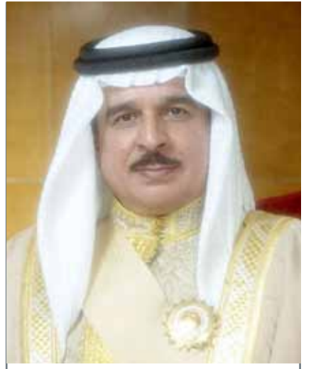
• جلالة الملك