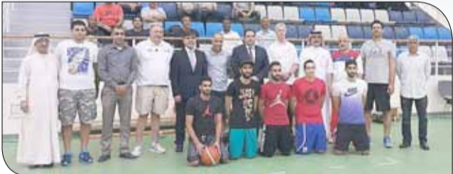
جانب من افتتاح الدورة

◆ اتحاد السلة - المركز الإعلامي : تحت رعاية رئيس الاتحاد البحريني لكرة السلة سمو الشيخ عيسى بن علي بن خليفة آل خليفة، انطلقت صباح أمس الإثنين دورة المدربين الدولية المعتمدة، التي ينظمها الاتحاد بالفترة من 15 حتى 19 مايو الجاري ضمن الاستراتيجية الموضوعية لتطوير المدربين وتخريج دفعات مؤهلة قادرة على قيادة السلة لأفضل المستويات. وافتتح الدورة نائب رئيس الاتحاد وجميع أعضاء مجلس الإدارة، وتمنى للمشاركين الاستفادة من مخرجات الدورة الدولية. ويشارك بالدورة أكثر من 60 مدرباً من مملكة البحرين ودول مجلس التعاون الخليجي ومن الدول العربية الذين تواجدوا خصيصاً لهذه الفعالية المهمة التي يقودها المحاضر الدولي الصربي فيرالين ماتيج والمحاضر الدولي الأمريكي روب بوبوكوك. وبدأت الجولة الأولى من هذه الدورة، إذ تم التطرق لمختلف الأمور الفنية التي تضمنها برنامج اليوم الأول والذي استمر لأكثر من 3 ساعات متتالية. كما أجرى المدربان الدوليان عدداً من التدريبات العملية وشرحها أمام المشاركين بالدورة؛ من أجل تبيان العديد من الأمور الفنية التي من شأنها أن تغرس المفاهيم المهمة للعبة لتسهل في تعزيز الجوانب الضرورية في التدريب.