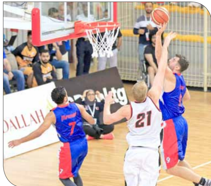
من لقاء المنامة والريان أمس