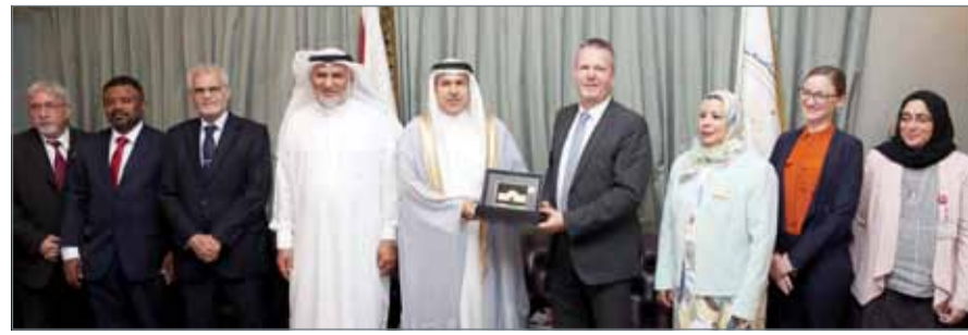
• محافظ العاصمة ملتقياً وفداً من الخبراء

مختلف البرامج والأنشطة التثايفية. وأشاد بمستوى التعاون بين محافظة العاصمة ووزارة الصحة، والذي توج مؤخراً بتدشين واحد من أهم المشاريع والمبادرات، المتمثل بمشروع المدن الصحية.