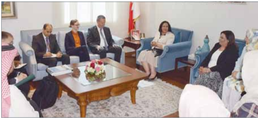
• وزيرة الصحة في لقاء مع وفد خبراء منظمات الأمم المتحدة

ويقوم الوفد المكون من 5 زائرين على مدار الثلاثة أيام بزيارات واجتماعات عدة مع عدد من الوزارات والهيئات ومنظمات المجتمع المدني ذات العلاقة بمكافحة هذه الأمراض مثل وزارة الإعلام ووزارة العمل والتنمية الاجتماعية المجلس الأعلى للصحة والمجلس الأعلى للبيئة ومجلسي الشورى والنواب، ولقاءات مع عددا من المحافظات والمجالس البلدية وعدد من المستشفيات والمراكز الصحية بالبحرين، وسيتم التركيز على آلية التعاون بين الجهات الحكومية والجهات غير الحكومية وكذلك الاطلاع على المشاريع والجهود التي تبذل لمكافحة الأمراض غير السارية في مملكة البحرين.