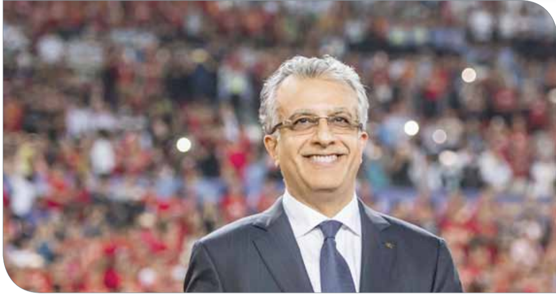
سلمان بن إبراهيم

رعاية مختلف أركان منظومة كرة القدم؛ كي تواصل النمو والتقدم في شتى المجالات. وأشار إلى أن الاتحاد الآسيوي لكرة القدم سيواصل مساعدة الاتحادات الوطنية الأعضاء؛ من أجل تطبيق برامج فعالة وشاملة للواعدين في جميع أرجاء القارة، مشيراً إلى أن مجموعة عمل الواعدين في الاتحاد الآسيوي تواصل العمل مع الاتحادات الوطنية؛ من أجل دفع التعاون المشتركة على صعيد رعاية الواعدين حيث ستقوم المجموعة في وقت لاحق بتفعيل دليل الواعدين في الاتحاد. وختم رئيس الاتحاد الآسيوي رسالته بالإعجاب عن عميق التقدير للاتحادات الوطنية الأعضاء على روح الشراكة والوحدة التي أظهرتها خلال الاحتفالات بيوم الواعدين، كما أشاد بالمدرسين والأهالي والمتطوعين، على العمل الذي يقومون به من خلف الأضواء؛ من أجل ضمان استمرار نجاح قطاع الواعدين في آسيا.