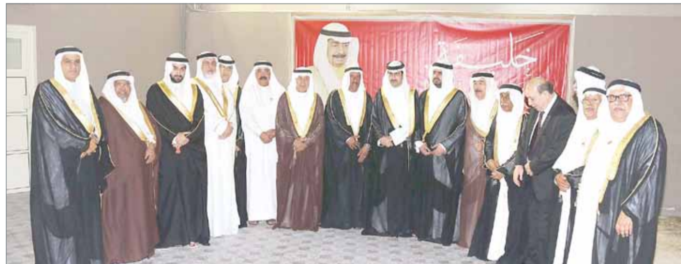
• سمو الشيخ خليفة بن علي وسمو الشيخ عيسى بن علي في زيارة لمجلس بوطينية بمنطقة عراد

الشاعر: عامر بن سالم بن عبدالله الحوسني من سلطنة عمان