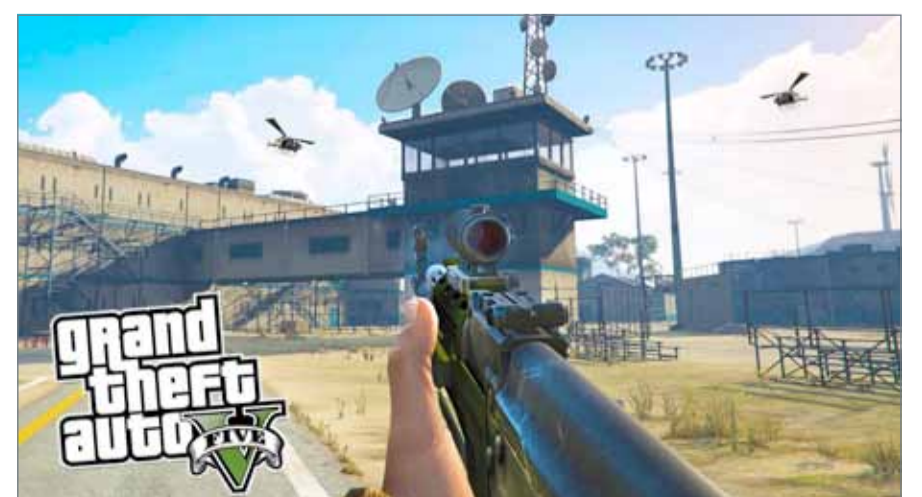
● لعبة GTA5 المحظورة تشجع على قتل الناس والشرطة لمرقة السيارات