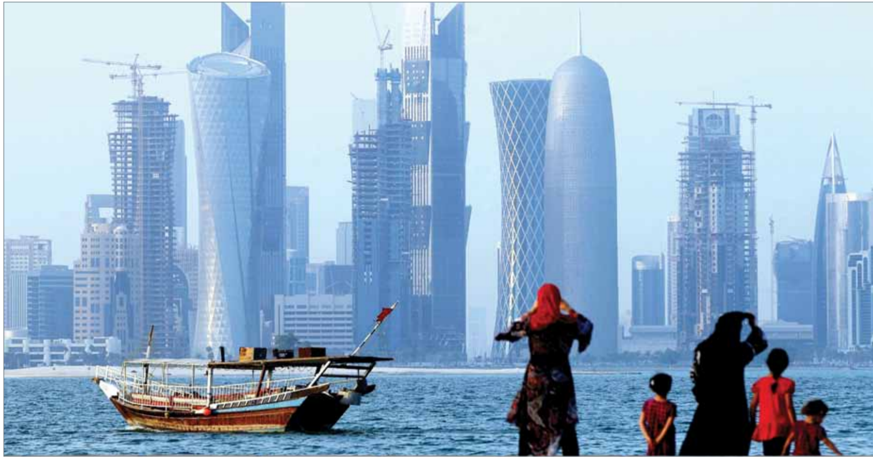
السعودية والإمارات أغلقت المنافذ البرية ومجالها الجوي أمام قطر

وكان نحو نصف القتلى في المدينة من المدنيين والباقيون من أفراد القوات المسلحة ومقاتلي العشائر السنية. ولا يزال حظر للجول مفروضا في الساعات الأولى من المساء. وخس "داعش" السيطرة على الثرقاط لقوات الحكومة العراقية المدعومة من الولايات المتحدة ومقاتلين من العشائر العام الماضي. ومهدت السيطرة عليها بدء الهجوم على الموصل المعقل الرئيسي للتنظيم في العراق.