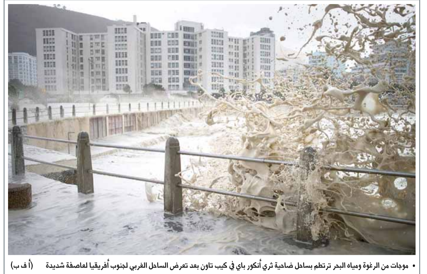
• موجات من الرغوة ومياه البحر ترتطم بساحل ضاحية ثري أنكور باي في كيب تاون بعد تعرض الساحل الغربي لجنوب أفريقيا لعاصفة شديدة (أ ف ب)