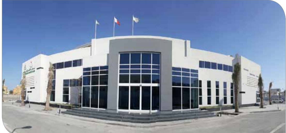
جانب من المبنى الإداري الجديد