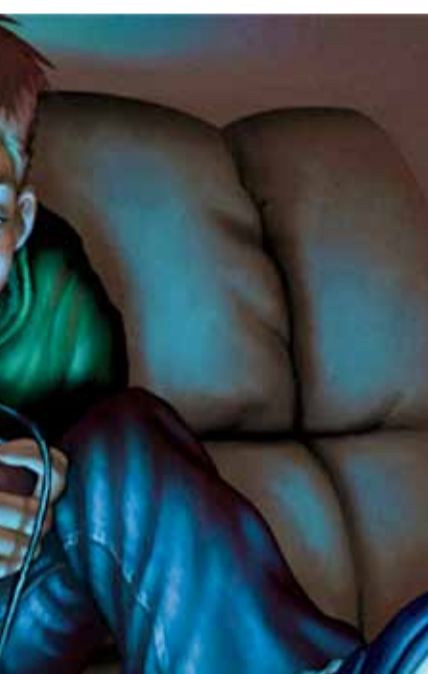
● الشغف بألعاب الفيديو قد يصل لمرحلة الإدمان

محظورة ويجري تداولها في البحرين، ومنها لعبة God of war التي تدور فصولها ومشاهدها حول أسطورة قديمة للصراع بين الآلهة، مؤكداً أنها تحاكي أسطورة ولا تمس بثوابتنا الدينية المقدسة أبداً.