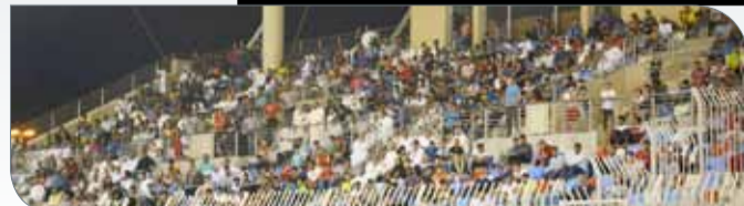
جانب من الحضور الجماهيري الكبير في نهائي دور "ناصر 10"

◆ كان الحضور الجماهيري الكبير في المباراة النهائية لـ "ناصر 10" في مستوى الحدث المميز، وما يليق به، بعد أن سجلت المدرجات رقماً جيداً ومميزاً غصت به مقاعد مدرجات ملعب مدينة خليفة الرياضية، وقدم لاعبو الفريقين مستوى وأداءً كروياً جيداً تفاعلت به الجماهير مع نهائي البطولة، بما يمتلكانه من مستوى فني جيد وأسماء قدمت لمحات فنية رائعة. وساهمت اللجنة المنظمة للبطولة في الحصول على حضور جماهيري كبير خصوصاً مع الجوائز الكبيرة والكثيرة التي وضعتها وفي مقدمتها السيارات، وهو الأمر الذي يؤكد نجاح العمل الإداري والتنظيمي الذي قامت به اللجنة المنظمة والترويج الجيد الذي ينم عن وجود كوادر إدارية قادرة على النجاح في ظل الأفكار الجيدة التي أطلقتها وساهمت في الحصول على حضور جماهيري جيد العدد في المباراة الختامية.