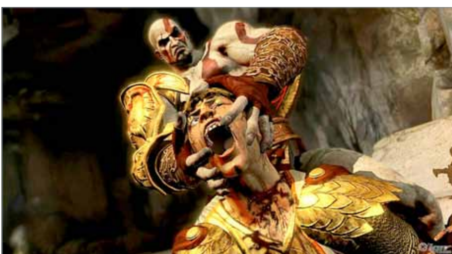
● لعبة إله الحرب الممنوعة في البحرين