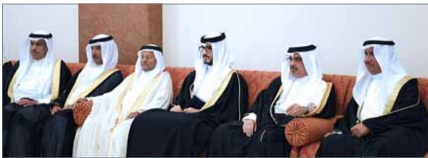
• ... وسموه في زيارة لمجلس عائلة الكعبي

من جانبهم، أعرب أصحاب وضيوف المجالس عن شكرهم وتقديرهم لصاحب السمو الملكي ولي العهد نائب القائد الأعلى النائب الأول لرئيس مجلس الوزراء على زيارته لهم وحرصه على لقاء أبناء البحرين في المجالس الرضائية، ونوهين بما يطره سموه دوماً من رؤية نيرة تعكس توجهات مملكة البحرين نحو مزيد من الخطى التقدم والتطوير الشامل بقيادة صاحب الجلالة عامل البلاد.