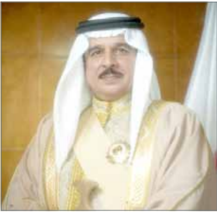
• جلالة الملك