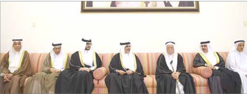
• ... وسموه يزور مجلس عائلة الربيعي