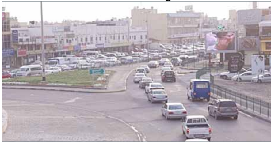
المشروع يشمل توفير قنوات أرضية للخدمات على امتداد شارع البديع

وتحسين الإنارة وإضافة اللمسات الجمالية على امتداد الشارع. وأفادت الوزارة بأنه سيتم توفير جميع متطلبات السلامة المرورية من حواجز للمشاة وأخرى؛ لحماية المركبات من التدهور في حال وقوع حوادث مرورية، وكذلك سيتم توفير جسور للمشاة عند نقاط الاستقطاب للعبور عوضاً عن الإشارات الضوئية للمشاة الموجودة حالياً إذا تطلب الأمر ذلك.