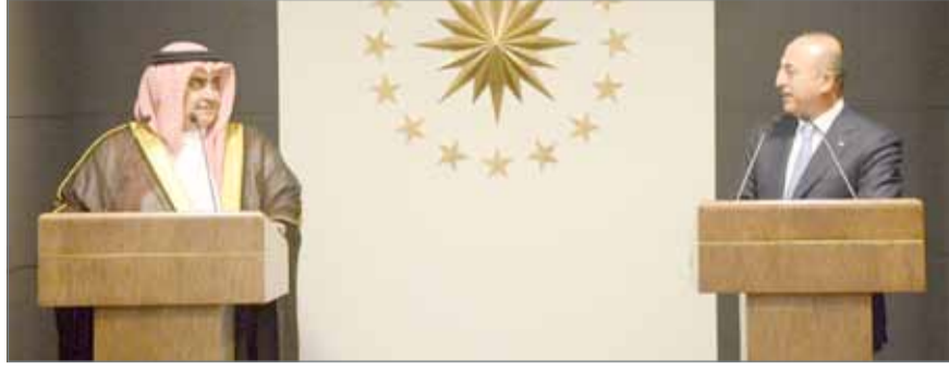
• وزير الخارجية يعقد مؤتمراً صحفياً مع نظيره التركي

من جانبه، أعرب الشيخ خالد بن أحمد بن محمد آل خليفة عن تشرفه بنقل تحيات جلالة الملك إلى الرئيس التركي، وأكد أنه بين له الموقف تجاه سياسة القيادة القطرية وممارساتها ضد أشقائها، وأن خطوة قطع العلاقات الدبلوماسية مع قطر كانت ضرورية ومهمة للحفاظ على أمننا، مؤكداً أنه يجب على قطر أن تغير من سياساتها وتتوقف عن أي ممارسات تهدد أمن أشقائها، ورحب وزير الخارجية بتصريحات وزير خارجية الجمهورية التركية عن دور القاعدة العسكرية التركية في دولة قطر وتأكيد أنها ليست لها علاقة بالتطورات الراهنة وليست موجبة ضد أحد، مقدرًا اهتمام الرئيس التركي بأمن المنطقة واستقرارها، ومتطلعا إلى حل وتسوية هذا الموضوع بأسرع وقت ممكن.