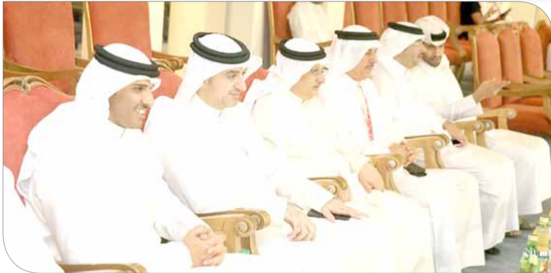
الجودو خلال تواجده في المباراة النهائية

وأكد الجودو أن وزارة شؤون الشباب والرياضة حرصت على التعاون مع اللجنة المنظمة للدورة في سبيل تهيئة كافة الأجواء الإيجابية لإنجاح المسابقات وإخراجها بحلة زاهية تتناسب مع حجم الدورة الشبابية.