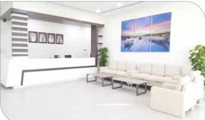
جانب من مرافق الصالة