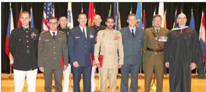
• جانب من حفل جامعة المشاة البحرية الأميركية

وأكد سمو الشيخ خالد بن حمد آل خليفة أن جامعة المشاة البحرية الأميركية تعد من المؤسسات التعليمية المرموقة المعروفة بكفاءة منتسبيها ومهارات الانضباط والنظام وتميز فيهم النواحي القيادية، مشيراً سموه في الوقت ذاته إلى عمق العلاقة الوثيقة التي تربط مملكة البحرين بالولايات المتحدة الأميركية في مختلف المجالات خصوصاً المجال العسكري، وما تتضمنه هذه العلاقة من شراكة وتعاون دائم يخدم مصلحة أمن واستقرار المنطقة.