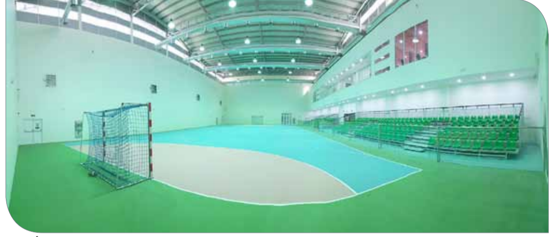
منشأة نادي الاتفاق الرياضي

◆ عنصر جذب للشباب وأهمية حيوية لأبناء المنطقة ◆ أول صالة رياضية تصمّم بهذا الطراز الفخم