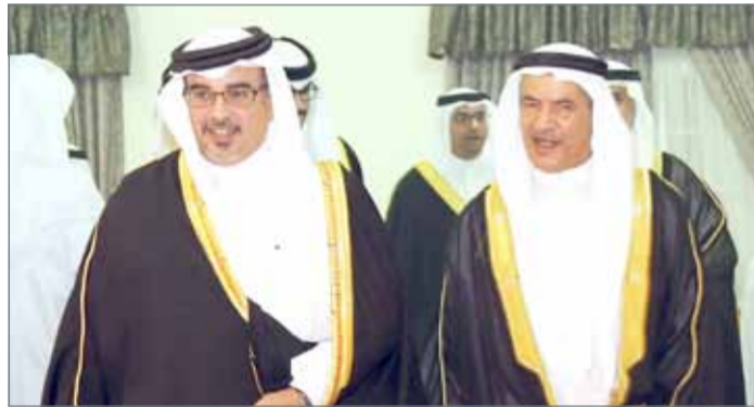
• سمو ولي العهد في زيارة لمجلس عائلة الفضالة

استراتيجية العمل في الفترة الحالية يأتي لتأكيد دورها وحجمها الحقيقي في منظومة القطاعات الاقتصادية الأخرى ولما تحمله من فرص استثمارية واعدة.