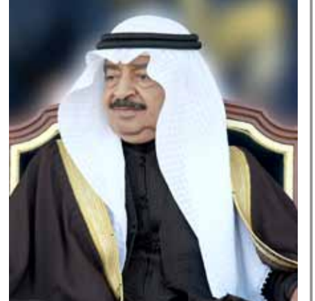
بقلم: الدكتور عبدالله الحوаж

يثرقني يا صاحب السمو أن أرفع لمقام سموكم الكريم أسمى