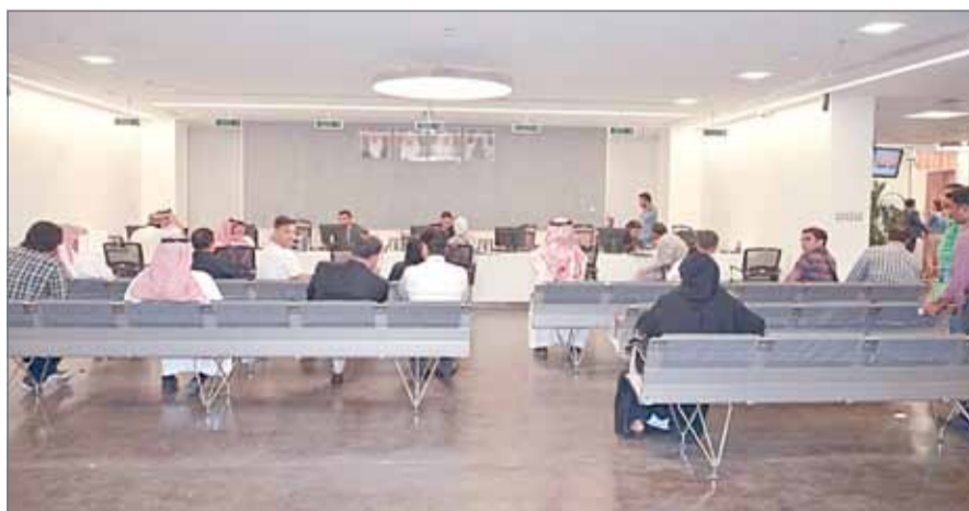
• مستثمرون في المركز

وأشارت البيانات أنه تم الترخيص إلى 58 شركة برؤوس أموال مختلفة تتراوح بين 6 آلاف دينار وحتى 50 ديناراً ويصل إجمالي المبلغ إلى 159 ألف دينار. كما رخص المركز إلى فرع لشركة أجنبية بريطانية وهي "جي ثري سيستمز البحرين ليمتد" وتكمن أنشطتها التجارية في إصلاح المعدات الإلكترونية والبرية، تركيب الآلات والمعدات الصناعية، أنشطة التصميم المتخصصة الأخرى، أنشطة المكاتب الرئيسية أو الإدارية، وأنشطة الخبرة الاستشارية في مجال الإدارة.