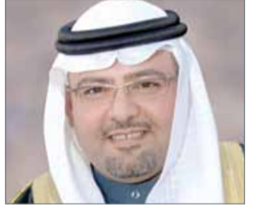
• وزير العدل