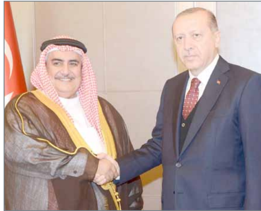
الرئيس التركي مستقبلاً وزير الخارجية

أوغلو: أمن دول التعاون من أمن تركيا ونسعى لحل إيجابي