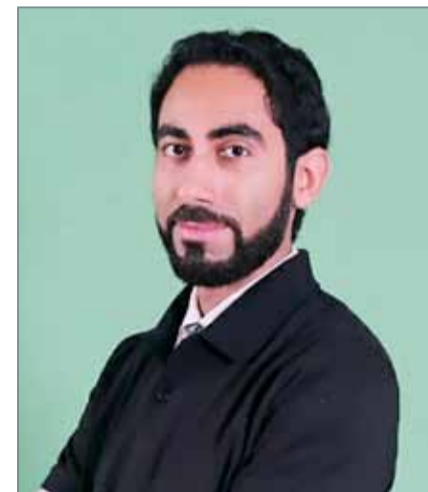
● أمين التاجر

وأردفت: أعتقد أن الدراسة لا تمنح الوقت الكافي أمام السيل المتدفق من الألعاب والاهتمام المفرط بها.. "دائماً يقفل على