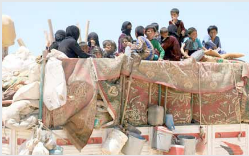
سوريون نزحوا من مدينة الرقة التي يسيطر عليها الجهاديون لدى وصولهم إلى قرية بلدان جنوب جرابلس