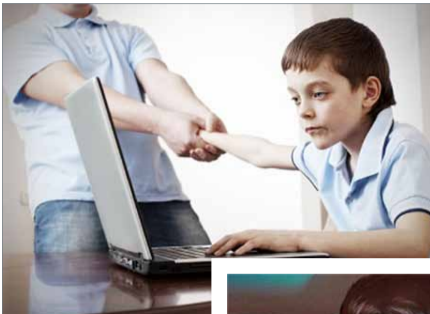
● أولياء أمور يواجهون صعوبات للحد من تواجد ألعاب الفيديو في حياة أطفالهم

واستطردت: يعتقد البعض أن هذه مبالغة فكيف يمكن إدمان لعبة مرئية لا يمكن أن تمس أجسادنا أو عقولنا كما هو الحال مع المخدرات وغيرها، إلا أن هذه حقيقة سببها أن الإنجاز الذي يحققه اللاعب يعني مزيد من الدوبامين والذي يعطيه النشوة والحماس للمتابعة.