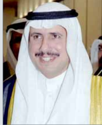
• الشيخ عزام مبارك الصباح

أن أمن واستقرار مملكة البحرين جزء لا يتجزأ من أمن واستقرار دولة الكويت.