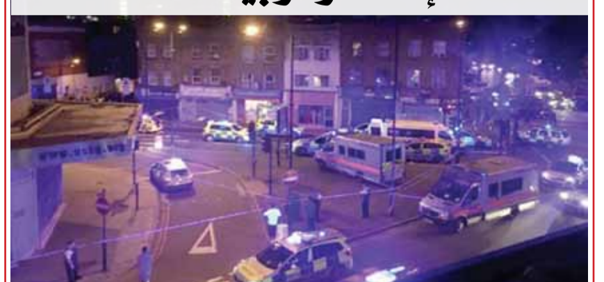
• قتل 8 جرحى بعملية دهس قرب مسجد في لندن