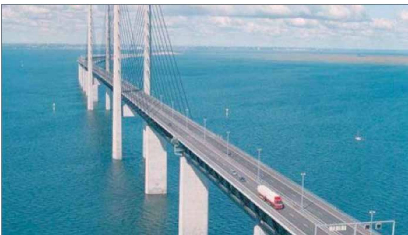
● الرسم التخطيطي لجسر الملك حمد

وكان جسر الملك فهد القائم حالياً، والبالغ طوله 25 كيلومتراً بين البلدين، قد افتتح عام 1986، وبلغ متوسط حركة النقل عليه 31 ألف مسافر يومياً في 2016، لكن الوثيقة تظهر أن من المتوقع أن يزيد هذا الرقم إلى الضعف بحلول 2030.