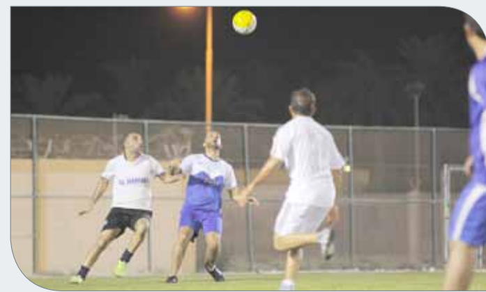
جانب من المنافسات

حيث استطاع السيطرة على أيضاً على مجريات الشوط الثاني وكان واضحاً نقص عامل اللياقة لدى فريق رفيف بعد كل هذا العطاء، وبذلك رد فريق رفيف اعتباره نظراً لخسارته بالدور التمهيدي من قبل سفريات القصبي، وبذلك أقصى رفيف فريق سفريات القصبي وتأهل إلى نهائي كبار الهمة الكروية والذي سيقام مساء الجمعة.