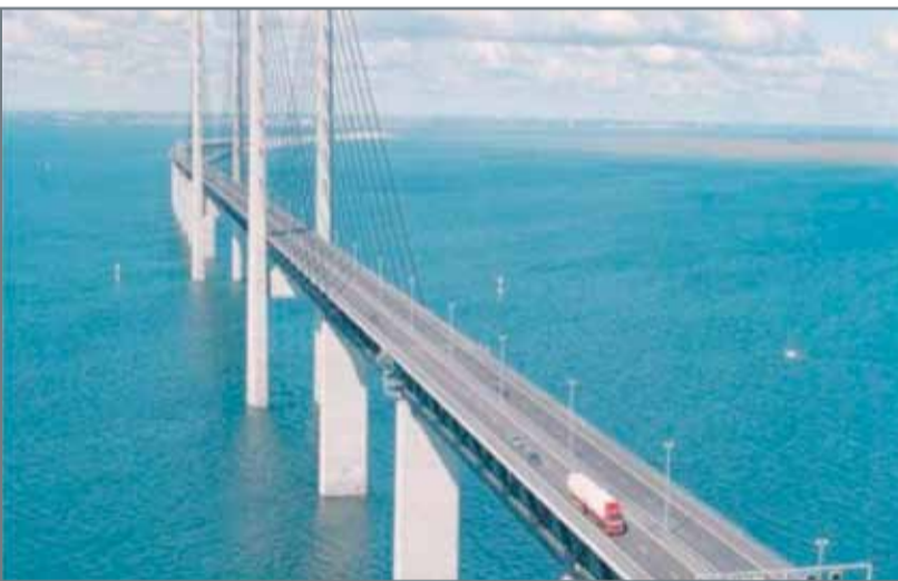
• الرسم التخطيطي لجسر الملك حمد