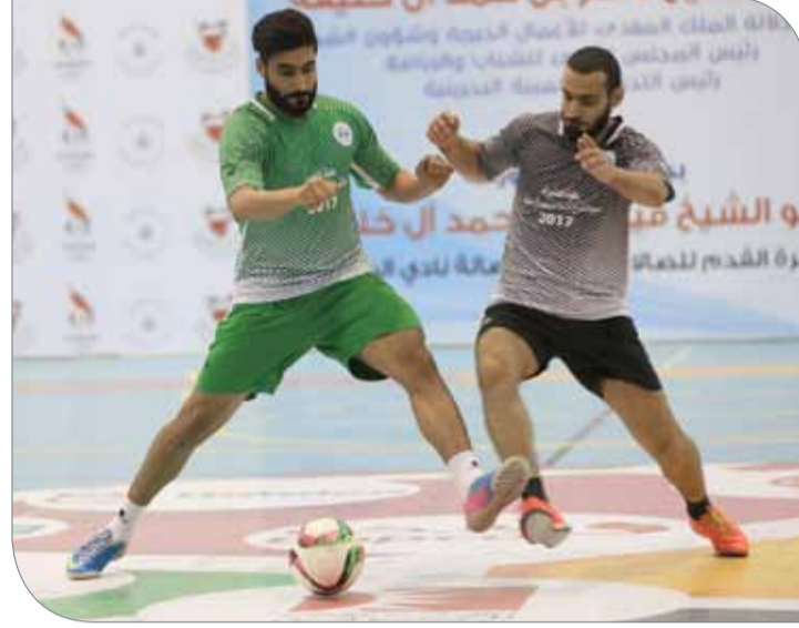
جانب من منافسات الجولة الثانية