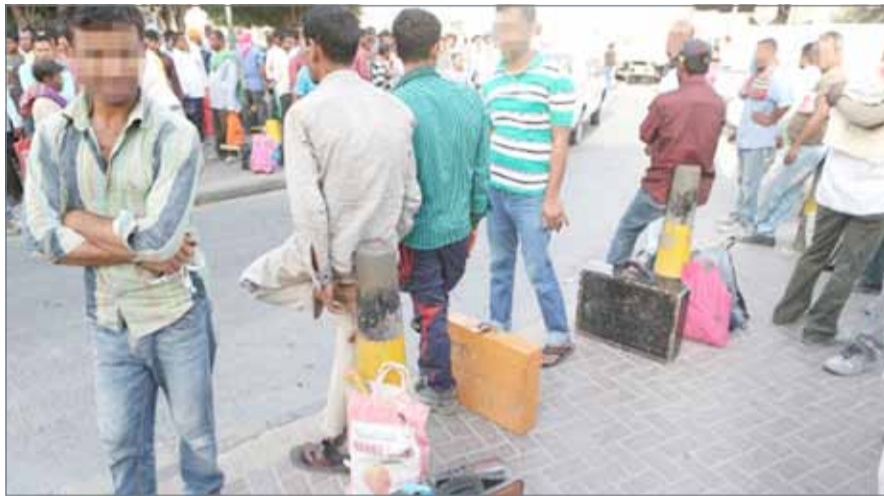
عمال في البحرين (أرشيفية)

عمل سواء سجل تجاري أو فردي، وبالتعاقد المباشر المؤقت، كما يمنح لأي صاحب عمل إمكانية التعاقد مع العامل المرن بصورة كلية أو جزئية وبنظام الساعات أو الأيام أو الأسابيع. ويتضمن النظام إصدار تراخيص العمل بمهنتين فقط هما (عامل مرن) و(عامل ضيافة مرن) وتختص الثانية بالعمالة التي ستعمل في قطاع المطاعم والفنادق وغيرها من المهن التي تحتاج إلى فحص طبي خاص، وتستصدر لهذه الفئة بطاقة تعريفية تتضمن صورة العامل وبياناته ونوع ترخيصه، ومدة سريان التصريح ليتمكن التاجر والمواطن من معرفة إذا كان هذا العامل فعلاً من هذه الفئة ويمكن استخدامه دون مخالفة القانون، كما ستوفر هذه البيانات على الموقع الإلكتروني للهيئة. كما أن النظام لن يسمح بجلب هذه الفئة من الخارج أو بانضمام العمالة المنزلية المخالفة لها حيث سيقصر على العمالة الموجودة في البحرين وتصريحها ”ملفي“ أو ”غير مجدد“. ويشترط على العمال الراغبين بالاستفادة من النظام الجديد إيداع مبلغ ثراء تذكرة العودة إلى بلدهم الأصلي، إلى جانب الرسوم المعتمدة في المملكة لإصدار تصريح العمل.