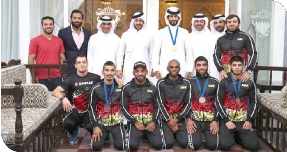
سمو الشيخ ناصر بن حمد مستقبلاً منتخباً MMA للهواة

الرفاء | المكتب الإعلامي لسمو الشيخ خالد بن حمد