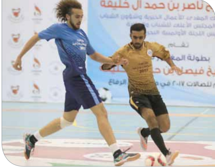
جانب من منافسات الجولة الثانية

يبدو أن نتائج الجولة الثانية من البطولة قد وضعت فرق المجموعة الأولى في صراع للحصول على بطاقتي العبور للدور الثاني، ففريق سمو الشيخ فيصل بن حمد وسمو الشيخ ناصر بن حمد يتقاسمان الصدارة برصيد 4 نقاط ويحتل فريق سمو الشيخ محمد بن سلمان المركز الثالث برصيد 3 نقاط والذي لديه فرصة الحصول فرصة التأهل في حال تعثر أحد الفريقين. في حين ودع فريق الشيخ عبدالله بن خالد بن حمد فريق مبكراً بعد أن خسر في مواجهتين، وتنتظره مواجهة واحدة مع فريق سمو الشيخ فيصل بن حمد. في المقابل، ضمن فريق الشيخ خالد بن سلمان الحصول على إحدى بطاقتي التأهل عن المجموعة الثانية بعد أن نجح في جمع 6 نقاط من فوزين، فيما سيكون الصراع محتدماً بين فريق سمو الشيخ خالد بن حمد وفريق سمو الشيخ سلطان بن حمد للانضمام لفريق الشيخ خالد بن سلمان مواصلة المشوار في هذه البطولة، بينما لم تخدم النتائج فريق سمو الشيخ خليفة بن علي في البقاء، بل ودع البطولة مبكراً وتنتظره مواجهة واحدة مع فريق سمو الشيخ خالد بن حمد.