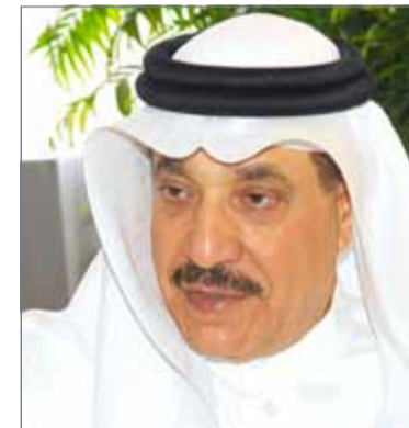
• وزير العمل والتنمية الاجتماعية

مدينة عيسى - وزارة العمل وزارة العمل والتنمية الاجتماعية: أنهت وزارة العمل والتنمية الاجتماعية استعدادها للإشراف على تطبيق القرار الوزاري رقم (3) لسنة 2013، بشأن حظر العمل تحت أشعة الشمس والأماكن المكشوفة خلال فترة الظهيرة من الساعة 12 ظهراً وحتى الساعة 4 عصرًا في شهري يوليو وأغسطس القادمين.