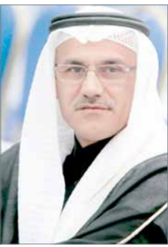
• علي الفصفوس

الجنبية - المحافظة الشمالية: شدد محافظ الشمالية علي الفصفوس على أهمية تضافر الجهود الحكومية والأهلية في الأوقات الراهنة التي تتطلب توحيداً للصفوف وتقوية الساحة الداخلية في وجه من يضمر الشر لبلادنا من خلال الحوادث الإرهابية الجبانه التي أكد أنها لن تزعزع تماسك المجتمع.