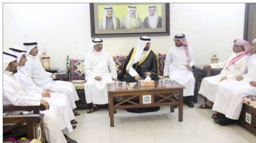
• سمو الشيخ عيسى بن علي يزور جمعية الكلمة الطيبة

المنامة - بنا: قام الرئيس الفخري لجمعية الكلمة الطيبة سمو الشيخ عيسى بن علي بن خليفة آل خليفة بزيارة للمجلس الرمضاني لجمعية "الكلمة الطيبة"، إذ التقى سموه رئيس وأعضاء مجلس إدارة الجمعية. وأكد سموه دور المجالس الرمضانية في تعزيز التعاون والتواصل بين أبناء المجتمع البحريني وتبادل الآراء والمقترحات التي تعزز أمن واستقرار المجتمع. من جهته، تقدم رئيس الجمعية حسن بوهزاع، بالشكر والتقدير لسمو الشيخ عيسى بن علي آل خليفة، على زيارته، مثنياً الدور الذي يضطلع به سموه في دعم العمل التطوعي والخيري في مملكة البحرين.