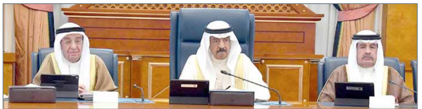
• سمو رئيس الوزراء يتأسر جلسة مجلس الوزراء أمس