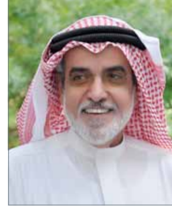
• وكيل الزراعة والثروة البحرية

وأوضح الشيخ خليفة أن قانون الحجر الزراعي يمنع دخول الإرساليات الزراعية المخالفة سواء كانت لم تستكمل الشروط أو المستندات اللازمة مثل شهادة الصحة النباتية وشهادة بلد المنشأ وشهادة