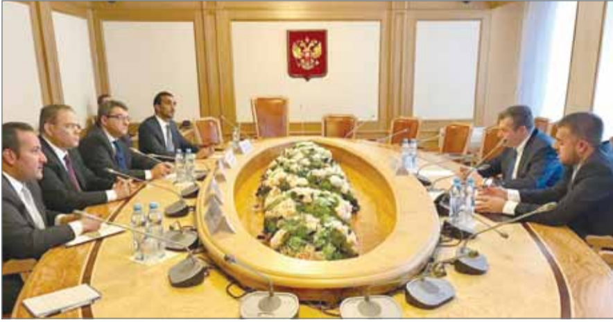
• جانب من اجتماع الدبلوماسيين مع رئيس لجنة الشؤون الخارجية بمجلس الدوما الروسي

المنامة - وزارة الخارجية: اجتمع سفير مملكة البحرين لدى أمد الساعاتي وسفير جمهورية مصر العربية محمد البديري ونائب سفير المملكة العربية السعودية محمد الشمري والسكرتير الأول بسفارة دولة الإمارات العربية المتحدة محمد المنصوري لدى روسيا الاتحادية ظهر امس مع رئيس لجنة الشؤون الخارجية بمجلس الدوما الروسي ليونيد سلوتسكي.