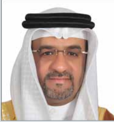
• فوزي الجودر

مدينة عيسى - وزارة التربية والتعليم: دعا القائم بأعمال وكيل وزارة التربية والتعليم لشؤون التعليم والمناهج رئيس اللجنة الوطنية لتقويم المؤهلات العلمية فوزي الجودر، الطلبة الراغبين في الدراسة في الخارج على نفقتهم الخاصة بمؤسسات التعليم العالي، إلى ضرورة مراجعة قسم الإرشاد الجامعي بوزارة التربية والتعليم بمدينة عيسى، قبل التسجيل، للتأكد من نوعية الجامعات والبرامج، لتجنب التسجيل في برامج أو جامعات غير موصى بها، مما يجعل الطالب يواجه عدم الاعتراف بمؤهله الأكاديمي أو معادلته، وفقاً للمعايير المعتمدة لدى اللجنة الوطنية لتقويم المؤهلات العلمية.