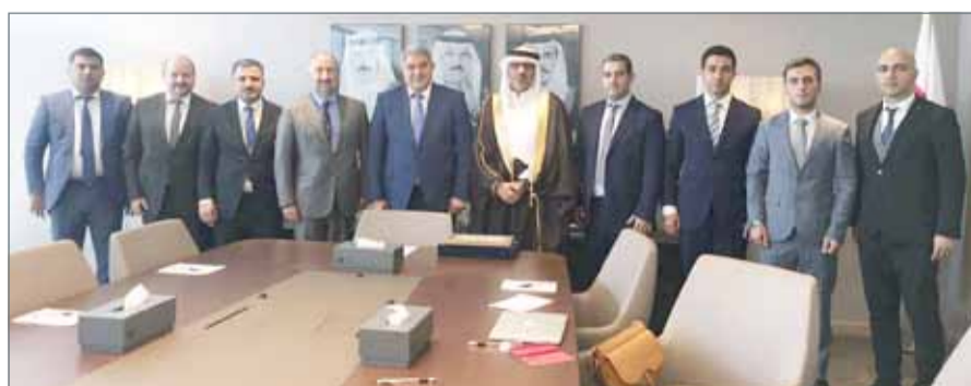
على هامش توقيع مذكرة التفاهم

وقال إن مجالات التعاون المتوقعة بين مملكة البحرين وجمهورية أذربيجان من شأنها أن تحقق استثمارات بقيمة 100 مليون دولار، لاسيما في قطاعات الزراعة والخدمات اللوجستية. وتعتبر هذه الزيارة هي الأولى من نوعها لرجال الأعمال من جمهورية أذربيجان المتخصصين في الاستثمارات الزراعية. وقد