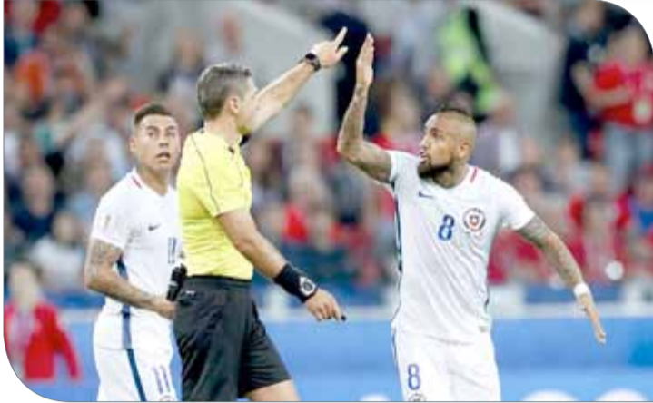
حكم لقاء تشيليه والكامبيون

وستطبق هذه التقنية في نهائيات كأس العالم 2018 في روسيا وهي تستعمل في أربع حالات فقط: بعد تسجيل هدف، في حالة ركلة الجزاء، منح بطاقة حمراء مباشرة أو تصحيح خطأ في تحديد هوية لاعب تعرض للعقوبة.