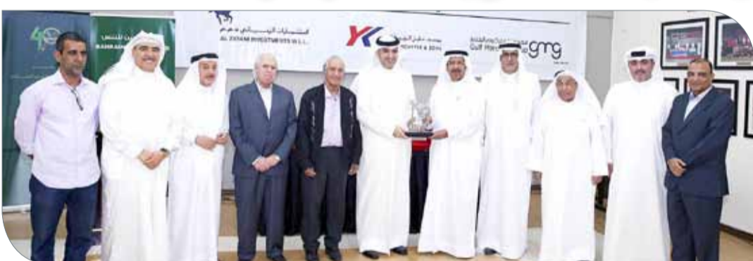
الجودو مشاركاً فيه الحفل الختامي لنادي البحرين

والكويت - شركة إبراهيم خليل كانو - مجموعة سوليدرتي القابضة - السوق الحرة البحرين - مجموعة جناحي الاستثمارية القابضة - شركة يوسف خليل المؤيد - استثمارات الزباني - شركة عبد الله أحمد ناس - شركة محمد جلال - شركة ماركوم الخليج.