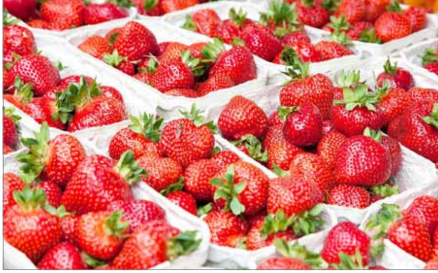
• الفراولة الأميركية تتوفر بالسوق البحرينية على مدار العام

ولفت إلى أن حظر استيراد الفراولة من مصر حالياً ومنع استيراد بعض المحاصيل الزراعية في فبراير الماضي من بعض الدول تعني أن الحجر الزراعي بالتعاون مع مفتشي الصحة بالوزارة يتعاونون في الكشف على الإرساليات الزراعية الواردة من الدول وأخذ العينات لتحليلها بصفة مستمرة سواء في مختبرات الوزارة أو الخاصة المعتمدة لدى الزراعة والثروة البحرية.