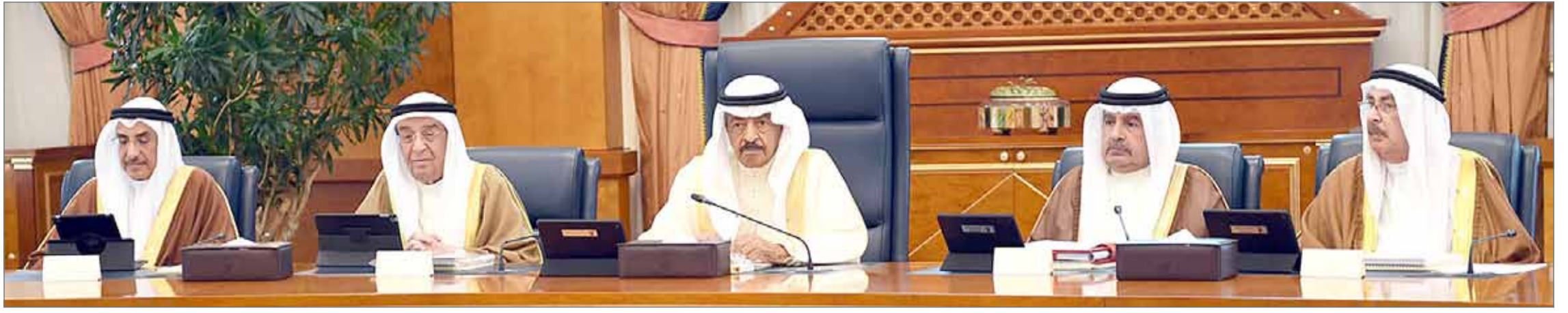
• سمو رئيس الوزراء يتأسس جلسة مجلس الوزراء أمس