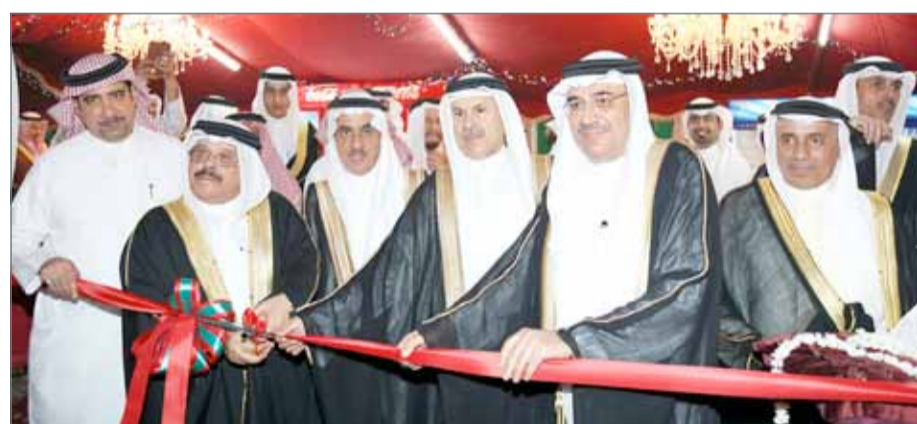
● مجلس الحاجة احتضن فعالية "السعودية والبحرين.. محبة ووثام" بحضور السفير السعودي

الحاجة في كلمته الترحيبية: "إن تنظيم هذه الفعالية دليل على ما يكنه أهل البحرين من محبة في قلوبهم تجاه خادم الحرمين الشريفين والسعودية حكومتاً وشعباً، وتقديراً لدورها المحوري والاستراتيجي في المنطقة والعالم، وفي دعم البحرين على كافة الأصعدة، والذي سيظل ماثلاً في ذاكرة التاريخ ولدى شعب البحرين جيلاً بعد جيل، وتأتي هذه الفعالية تجسيداً لعمق العلاقات الأخوية والتلاحم ووحدة المصير المشترك والروابط التاريخية المتينة التي تربط البلدين الشقيقين".