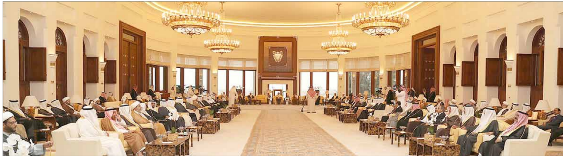
جلالة الملك يقدم أمانة إبطار في قصر الروضة بحضور سمو ولي العهد