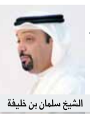
الشيخ سلمان بن خليفة