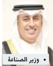
• وزير الصناعة

7 ملايين لتأسيس السجل والعلامات... و6 ملايين إيجار المناطق الصناعية 3 ملايين إيرادات رسوم فحص الذهب واللؤلؤ