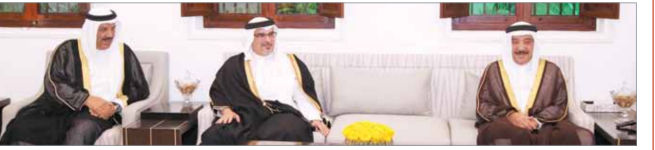
سمو ولي العهد في زيارة لمجلس القائد العام لقوة الدفاع

ولذلك فإن البحث يجب أن يكون عن الوسائل لمواجهة هذا المنكر الديني والإنساني الذي يستهدف أمتنا والعالم، والذي يجب علينا كمتجمع مدني لنكاره من خلال تربية أبنائنا على نبيذ ثقافة التطرف والإرهاب، وتعليمهم نهج الوسيطة والاعتدال.