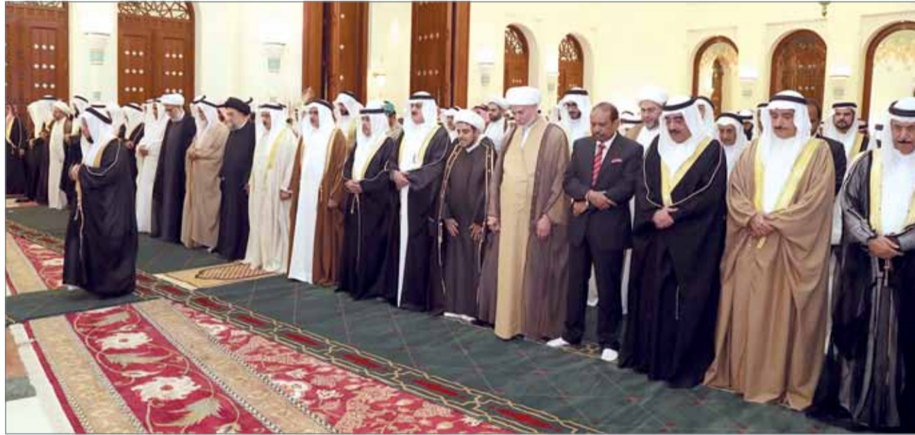
• جلالة الملك يؤدي صلاة المغرب جماعة بحضور سمو ولي العهد

المنامة - بنا: قال عاهل البلاد صاحب الجلالة الملك حمد بن عيسى آل خليفة إننا نحمد الله تبارك وتعالى على نعمة الأمن والأمان الذي نعيشه في هذا الوطن الطيب والعزير، والتلاحم الصادق بين أبناء شعبنا الوفي على اختلاف عقائدهم ومذاهبهم وطوائفهم. وأكد جلالتنا أن قضية الأمن والأمان قضية هامة جداً، بل من أهم القضايا التي يجب علينا أن نتذكرها دائماً، والتي يجب أن يحرص عليها كل مواطن ومقيم. وقد جعل الله تعالى الأمن في رأس نعمة الكبرى، مستشهداً بقوله تعالى: ”الَّذِي أَطْعَمَهُمْ مِنْ جُوعٍ وَأَمَّنَّهُمْ مِنْ خَوْفٍ“. وأقام جلالة الملك مأدبة إفطار، في قصر الروضة مساء أمس، بحضور ولي العهد نائب القائد الأعلى النائب الأول لرئيس مجلس الوزراء صاحب السمو الملكي الأمير سلمان بن حمد آل خليفة.