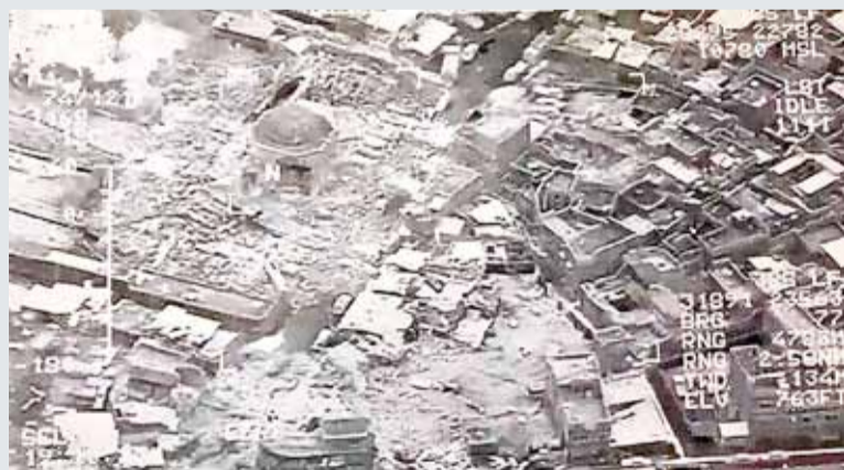
• العبادي: نسف جامع النوري إعلان رسمي لهزيمة داعش (ا ف ب)

وأعلنت القوات العراقية أن جهاديين تنظيم داعش فجروا منارة الحدياء التاريخية وجامع النوري الكبير الذي شهد الظهور العلني الوحيد لزعيم التنظيم أبو بكر البغدادي في المدينة القديمة بغرب الموصل، وأمسّت البلاد في حالة صدمة حيال خبر تدمير المنارة التي شيّدت في القرن الثاني عشر، والتي تعد واحدة من أبرز المعالم في العراق، ويشار إليها أحياناً باسم برج بيزا العراقي.