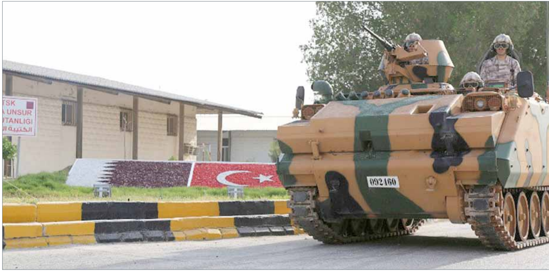
• وصول 23 جندياً تركيا و5 مركبات عسكرية إلى العاصمة القطرية

باريس - اف ب: اعتبر الرئيس الفرنسي إيمانويل ماكرون، أن رحيل رئيس النظام السوري، بشار الأسد، عن السلطة لم يعد أولوية بالنسبة لفرنسا التي أصبح هدفها الأساسي محاربة التنظيمات الإرهابية في سوريا، وذلك في مقابلة نشرتها ثمانية صحف أوروبية أمس الخميس. وقال ماكرون: "لم أقل بوضوح إن إزاحة الأسد تشكل شرطاً مسبقاً لكل شيء، لأن أحداً لم يقدم لي خلفاً مثرواً له"، مكرساً للمرة الأولى هذا النهج الفرنسي حيال سوريا، ومقرراً في الوقت نفسه بتعديل موقف باريس. ولطالما كانت باريس في مقدمة المطالبين برحيل الأسد، ورغم تراجع الإصرار على ذلك بعد الاعتداءات التي شهدتها فرنسا منذ 2015، فإن النهج الرسمي كان يقول إن الأسد "لا يمكن أن يمثل مستقبل سوريا" التي تشهد نزاعاً دائماً منذ أكثر من ست سنوات أسفر عن نحو 320 ألف قتيل.