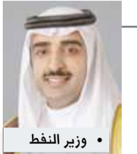
• وزير النفط