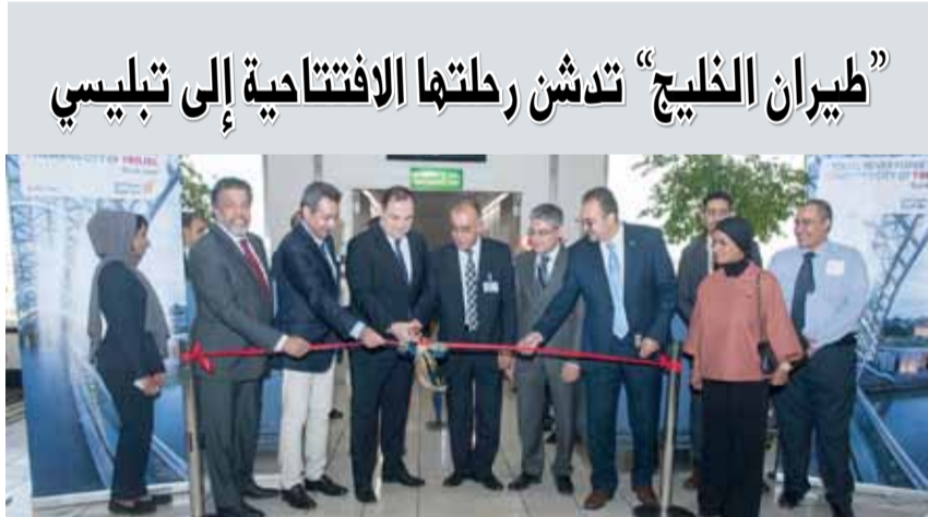
”طيران الخليج“ تدهن رحلتها الافتتاحية إلى تبليسي

أنحاء منطقة دول مجلس التعاون ومنطقة الشرق الأوسط وشمال إفريقيا معاً، وإلى استمتاعهم بمنتجات وخدمات طيران الخليج في سفرهم إلى هذه الوجهة ذات الخيارات المتنوعة. واختتم بقوله ”أود أن أشكر جميع المسؤولين في كل من البحرين وجورجيا الذين دعموا إطلاق هذه الرحلة الأولى لطيران الخليج؛ حيث إنهم بذلوا جهودهم الحثيثة لإطلاق هذا الخط ورفع مستوى الوعي بهذه الوجهة“. وستعزز طيران الخليج رحلاتها الأسبوعية الثلاث هذا الأسبوع، ونظراً للطلب المتزايد على الوجهة الجديدة، ستعزز برحلتين إضافيتين في كل من 23 و25 يونيو 2017. وتسير الناقل الوطنية رحلتين يوميتين أو أكثر إلى 10 مدن إقليمية.