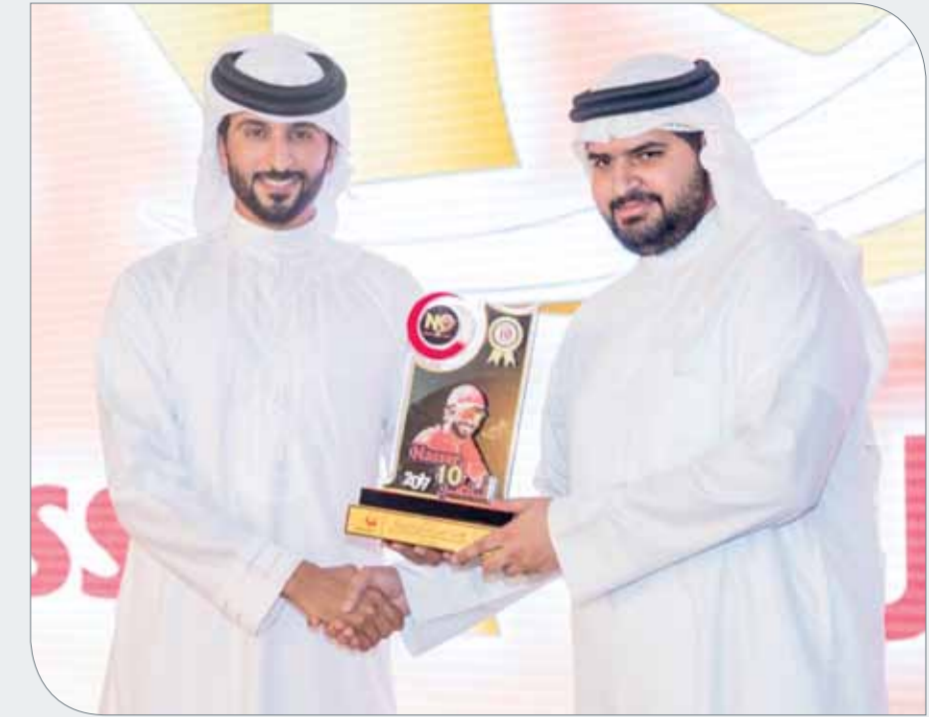
سمو الشيخ ناصر بن حمد مكرماً سمو الشيخ عيسى بن علي

♦ أكد ممثل جلالة الملك للأعمال الخيرية وشؤون الشباب رئيس المجلس الأعلى للشباب والرياضة رئيس اللجنة الأولمبية البحرينية سمو الشيخ ناصر بن حمد آل خليفة أن الدورة الرمضانية شهدت متابعة حثيئة من قبل عاهل البلاد صاحب الجلالة الملك حمد بن عيسى آل خليفة منذ انطلاقها في العام 2007 وصولاً إلى عيدها العاشر في العام الجاري، مشيراً إلى أن دعم واهتمام جلالة كان الأساس المتين للنجاحات التي تحققت لهذه الدورة والتي جاءت متوافقة مع توجيهات ورؤية جلالة في توفير منصات شبابية وبرامج متنوعة قادرة على استقطاب الشباب وتوجيه طاقاتهم نحو مسيرة البناء والتحديث التي تشهدها المملكة في ظل العهد الزاهر.