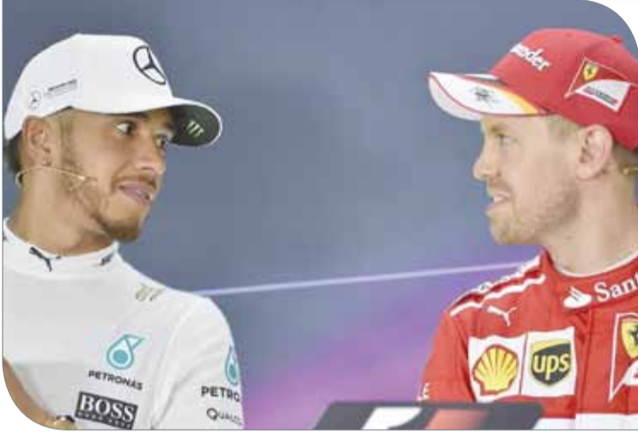
سيباستيان فيتيل ولويس هاميلتون

نيكو روزبرغ بالمركز الأول. وقال هاميلتون: "كنت سريعاً العام الماضي على هذه الحلبة، لكني لم أحقق النتيجة المرجوة. وبالتالي فإن هدي هذه المرة هو تحقيق نتيجة إيجابية". وأشاد وولف بهاميلتون في قوله: "يبدو لويس في أفضل وضعية له منذ خمس سنوات، تاريخ انضمامي إلى الفريق، ليس فقط بسبب النتيجة الأخيرة في مونترال، بل لأنه يتأقلم جيداً مع الأيام الصعبة". وتعتبر حلبة باكو ثاني أطول حلبة بعد سبا فرانكورشان البلجيكية حيث تمتد على أكثر من 6 كيلومترات.