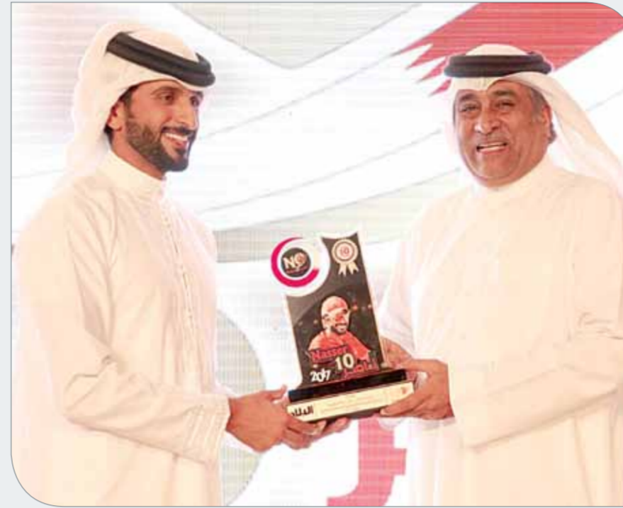
... وسموه مكرماً "البلاد"