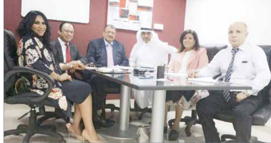
• أول اجتماع لمجلس الإدارة لم تحضره المهزوع