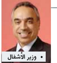
• وزير الأشغال

200 ألف لإدارة الأصول والاستشارات وإل... "الأشغال" 4 ملايين دينار لصيانة ممتلكات الدولة