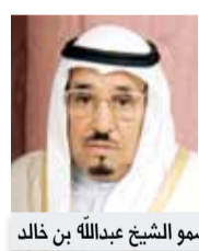
سمو الشيخ عبدالله بن خالد