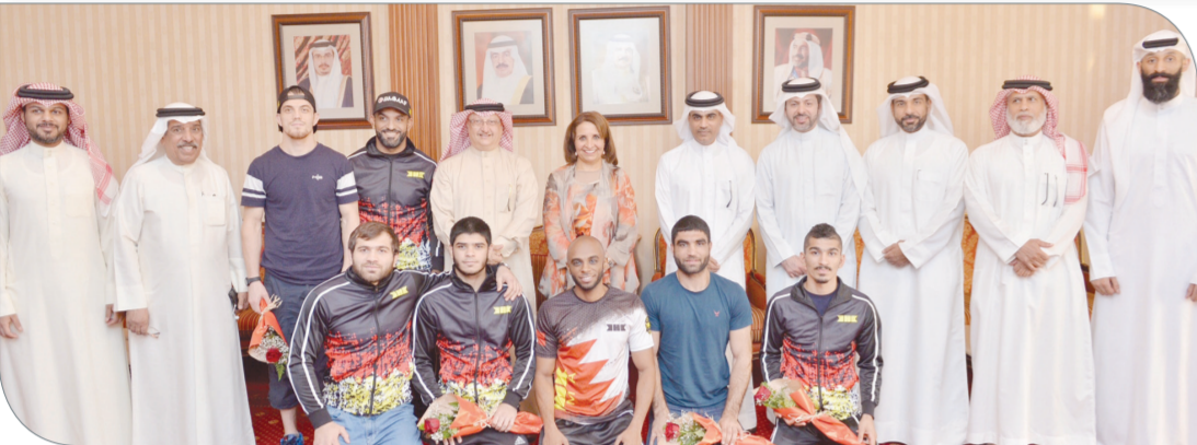
عسكر وكبار المستقبلين في صورة جماعية مع الأبطال

ضاحية السيف | اللجنة الأولمبية البحرينية