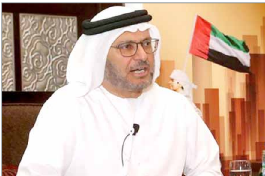
• وزير الدولة للشؤون الخارجية الإماراتي

دبي - قناة العربية: أعلنت مصادر أن البحرين والسعودية والإمارات ومصر أعدت قائمة بالمطالب التي يجب على قطر تلبيتها لتخفيف الأزمة الحالية، على أن تسلم للدوحة عبر الكويت في الأيام القليلة المقبلة. وكان وزير الخارجية الأمريكي ريكس تيلرسون أعرب عن أمل الولايات المتحدة بأن يتم تقديم لائحة المطالب إلى قطر في وقت قريب. وكان وزير الدولة للشؤون الخارجية الإماراتي أنور قرقاش، قد حدد مطالب دول الخليج ومصر لإنهاء مقاطعتها لقطر، ومنها وقف دعم الدوحة للإرهابيين، والتخلي عن شخصيات مطلوبة دولياً وإقليمياً.