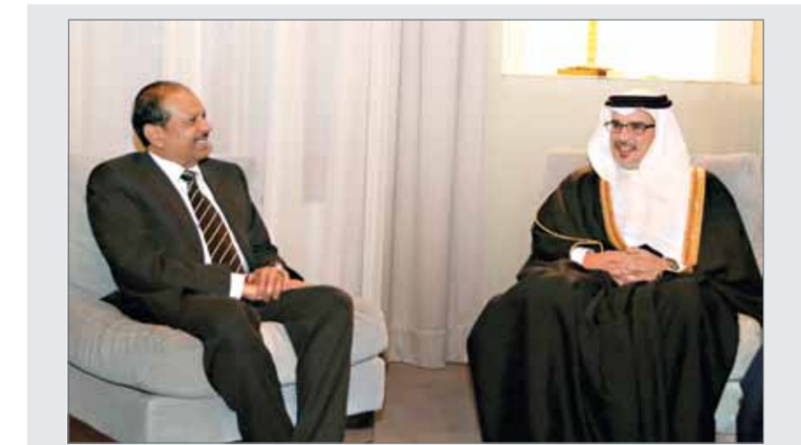
سمو ولي العهد مستقبلاً رئيس مجموعة لولو

ويجب علينا الوقوف وراء دولنا الوطنية والإنخاف حول مرجعيتها ومؤسستها، وأن نكون عوناً لها في المواجهة، لأنه ليس باستطاعتنا أن نتجاهل هذا الإرهاب بدون الدولة الناطقة لأمر، وقد ورد في الحديث: "إن الله يرع بالسلطان ما لا يرع بالقرآن"، "والسلطان ورعة الله في أرضه". وهنا تبرز أهمية المسؤولية الملقاة على عواتق الدول ولاة الأمر خصوصاً في منطقة الشرق الأوسط التي بلغ الشحن الطائفي مستوى خطيراً والانتخاف حول مرجعيتها ومؤسستها، وأن نكون عوناً لها في المواجهة، لأنه ليس باستطاعتنا أن نتجاهل أيضاً بالتعمد والتأخر في مواجهة التطرف والإرهاب، وتعليمهم نهج الوسيطة والاعتدال.