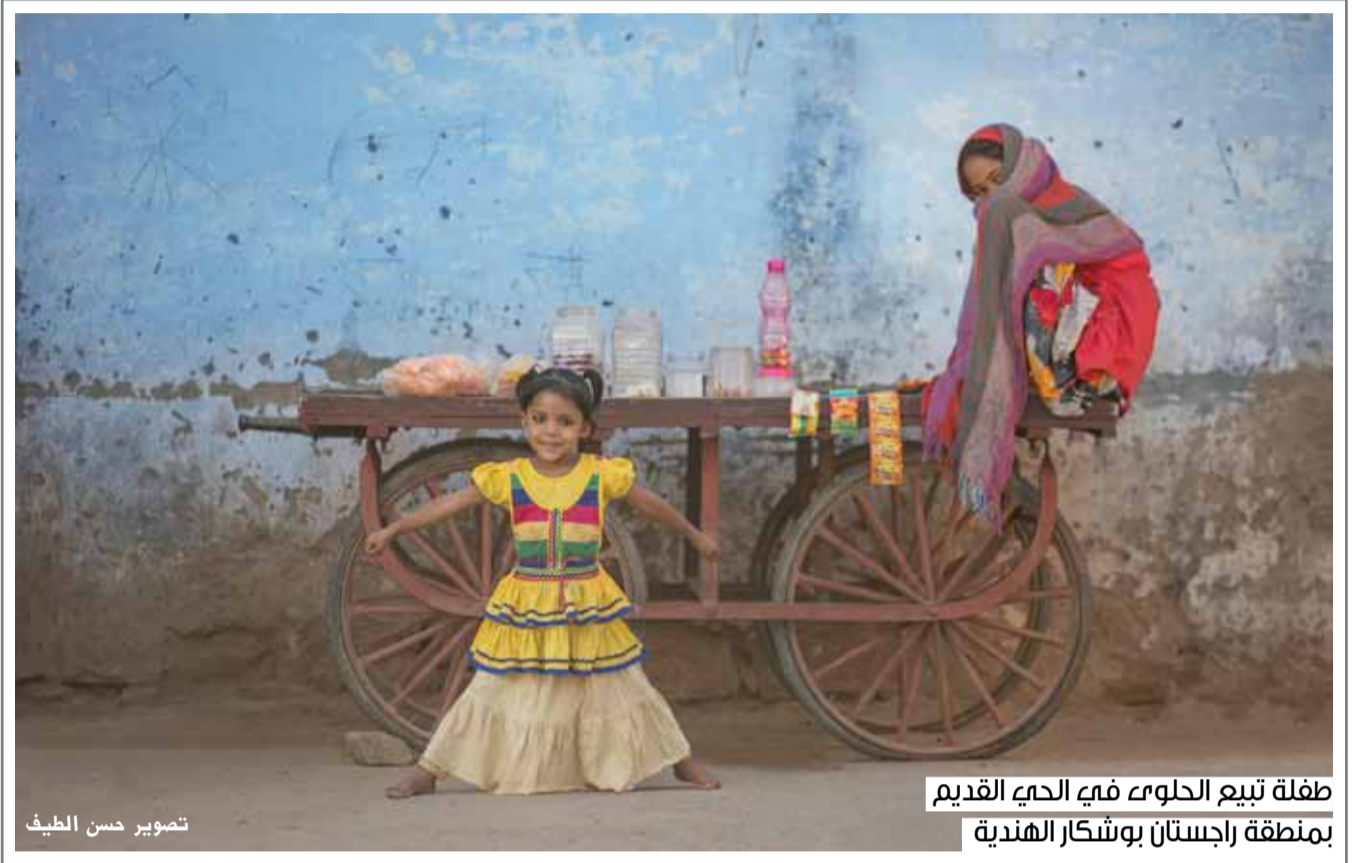
طفلة تبيع الحلوى في الحى القديم بمنطقة راجستان بوشكار الهندية