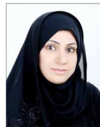
• ابتسام الصباح

ولفتت إلى أنها تقدمت بدعوى أمام المحكمة الشرعية السنية طلبت فيها بنفي نسب الطفل لمولدها، أشارت فيها إلى أن المدعى عليها مطلقة من المدعى بموجب وثيقة طلاق بتاريخ 29 يوليو 2002، وتفاجأ المدعى عند مراجعته السجل السكاني بأن لديه ابن مولود بتاريخ 22 أبريل 2004، وأن والدته المدعى عليها بحسب إشعار الولادة.