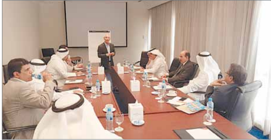
• من لقاء الجمعية

النما - الاقتصاديين البحرينية: خلص اجتماع لجمعية الاقتصاديين البحرينية إلى ضرورة زيادة أعضائها والتركيز على استقطاب الشباب المتخصصين في مجال الاقتصاد من مختلف القطاعات، والعمل على تنمية الموارد المالية واستغلالها وديمومتها، واستثمار صورة الجمعية الطيبة في الإعلام من خلال أنشطتها والترويج لها عن طريق وسائل الاتصال الحديثة.