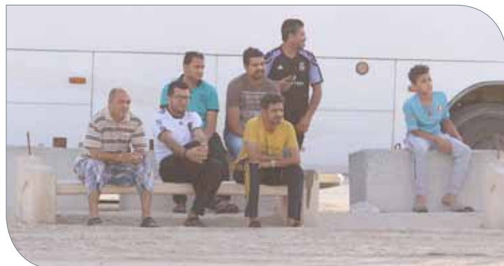
البطولة تحظى بحضور جماهيري مميز