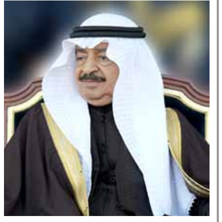
بقلم: الدكتور عبدالله الحواري

المنامة - بنا: جرت اتصالات هاتفية أمس بين عاقل البلاد صاحب الجلالة الملك حمد بن عيسى آل خليفة وكل من إخوانه، عاقل المملكة العربية السعودية الشقيقة خادم الحرمين الشريفين الملك سلمان بن عبد العزيز آل سعود وأمير دولة الكويت الشقيقة صاحب السمو الشيخ صباح الأحمد الجابر الصباح ونائب رئيس الدولة رئيس مجلس الوزراء حاكم دبي دولة الإمارات العربية المتحدة الشقيقة صاحب السمو