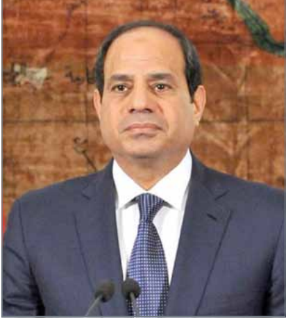
• الرئيس المصري

الأعلى للقوات المسلحة بدولة الإمارات العربية المتحدة الشقيقة صاحب السمو الشيخ محمد بن زايد آل نهيان، وشيخ الأزهر الشريف فضيلة الدكتور أحمد الطيب، تم خلال هذه الاتصالات تبادل التهاني بمناسبة حلول عيد الفطر المبارك، داعين المولى عز وجل أن يعيد هذه المناسبة المباركة على مملكة البحرين وعلى شعوب هذه الدول باليمن والخير والبركات وعلى الأمتين العربية والإسلامية بالعرفه والتقدم.