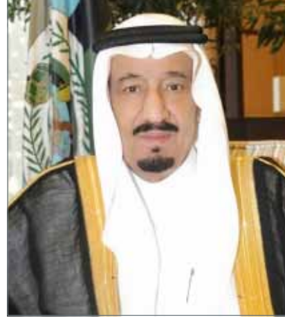
• خادم الحرمين

الشيخ محمد بن راشد آل مكتوم وولي عهد المملكة العربية السعودية الشقيقة صاحب السمو الملكي الأمير محمد بن سلمان بن عبد العزيز آل سعود وولي عهد دولة الكويت الشقيقة سمو الشيخ نواف الأحمد الجابر الصباح وأمير منطقة تبوك صاحب السمو الملكي الأمير فهد بن سلطان بن عبد العزيز آل سعود. تم خلال الاتصالات تبادل التهاني بمناسبة حلول عيد الفطر المبارك، داعين