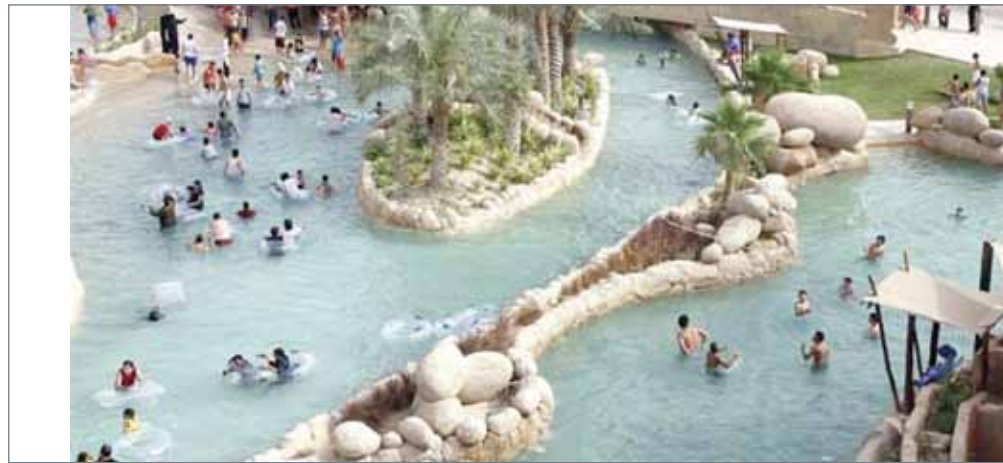
• سياحة الشواطئ والرمال في البحرين (أرشيفية)

تشهده المملكة من تطورات في صعيد السياحة والضيافة. وقال: "ستضيف الاستثمارات المستقبلية في قطاع الضيافة سلسلة جديدة من الفنادق الدولية للمملكة، وتزيد من انتشار الفنادق القائمة. ومن المتوقع أن ترفع هذه الفنادق الطاقة الاستيعابية بنحو 4000 غرفة خلال العام 2020، خصوصاً في فئة الفنادق المتوسطة والراقية وصولاً إلى الفنادق الفاخرة كالمنتجعات. وأضاف "يرجى أن تساهم هذه الاستثمارات في تلبية الطلب المتزايد وجذب الزوار إلى المملكة، فقد حققت البحرين نمواً قوياً من ناحية أعداد السياح الوافدين العام 2016، حيث شهدت زيادة بنسبة 6%، لتستقبل نحو 12.2 مليون سائح. وهذا يؤكد مركز البحرين السياحي في المنطقة، حيث إن هنالك أكثر من 300 مليون شخص على مقربة ساعتين بالطيران جواً، غالبيتهم من دول مجلس التعاون الخليجي". ويعتبر قطاع السياحة أحد الأعمدة الرئيسية في اقتصاد المملكة، حيث يتم تركيز الجهود لتطويره وتنميته جنباً إلى جنب مع قطاعات الخدمات المالية، والتصنيع، وتكنولوجيا معلومات الاتصال، وقطاع النقل والخدمات اللوجستية. ومن المتوقع أن يشهد القطاع نمواً متواصلاً، ففي العام 2015 ساهم قطاع السياحة بـ 6% من إجمالي النمو، حيث بلغت إيرادات القطاع 1.9 مليار دولار.