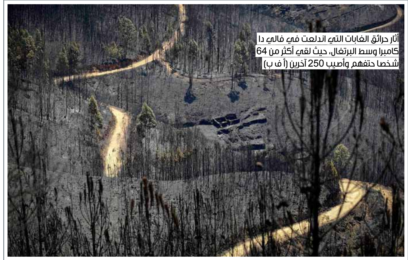
آثار حرائق الغابات التي اندلعت فيه فاليه دا كامبرا وسط البرتغال، حيث لقي أكثر من 64 شخصاً حتفهم وأصيب 250 آخرين (أ ف ب)

حالة الطقس الطقس حسن مع تساعد الإترية في بعض المناطق أثناء النهار.