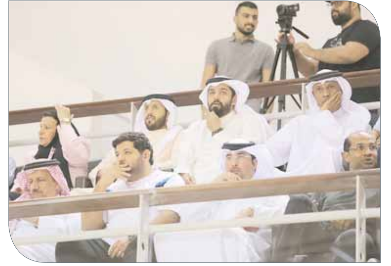
لقطات متنوعة من النهائي والتتويج

المسابقات التي أقيمت خلال فترة الاستراحة بين شوطي المباراة النهائية.