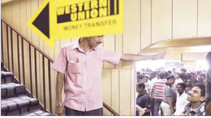
• المند وبنغلادش والنيبال.. أشد المتأثرين

يقول راجان كيرالا مدمنة على التحويلات المالية، حتى لو لم يحصلوا على أي وظيفة، سيقيمون هناك وينتظرون أيضا هناك، وسيبحثون عن أي وظيفة. وحتى لا يمانعوا العمل مقابل أجر أقل، لأنهم يعتقدون أنه يعطيهم وضعا اجتماعيا لا يمكنهم الحصول عليه عند العمل في كيرالا.