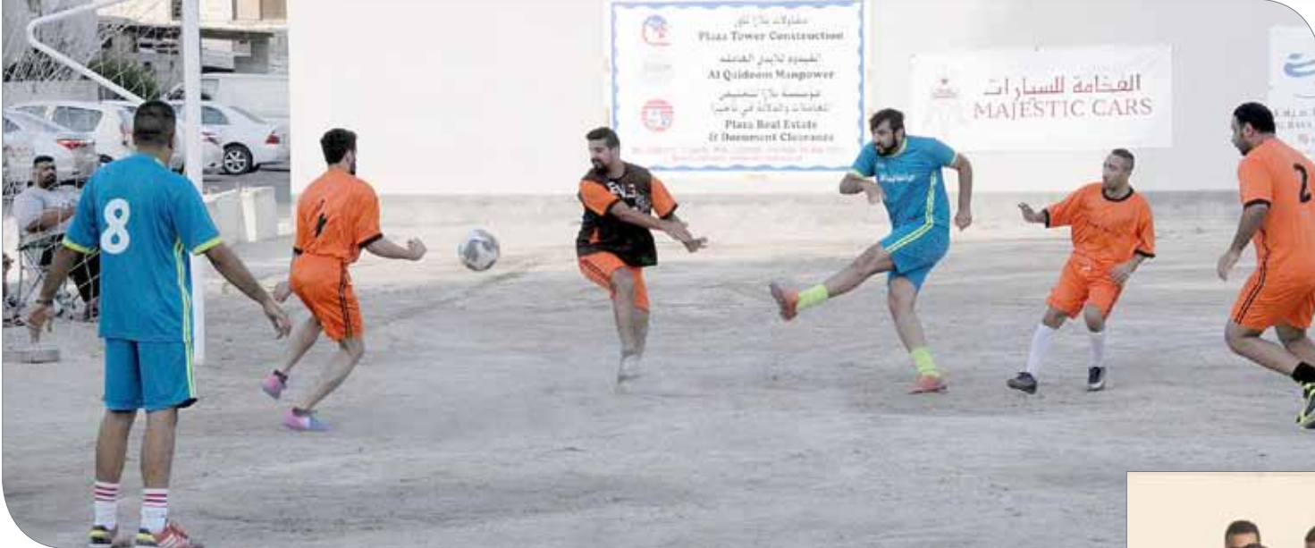
لقطات متنوعة من البطولة في العام الحالي