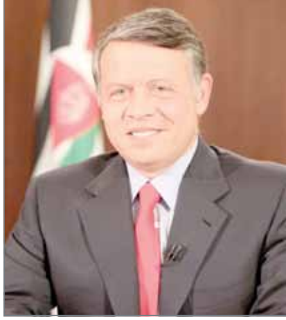
• ملك الأردن

الأعلى للقوات المسلحة بدولة الإمارات العربية المتحدة الشقيقة صاحب السمو الشيخ محمد بن زايد آل نهيان، وشيخ الأزهر الشريف فضيلة الدكتور أحمد الطيب، تم خلال هذه الاتصالات تبادل التهاني بمناسبة حلول عيد الفطر المبارك، داعين المولى عز وجل أن يعيد هذه المناسبة المباركة على مملكة البحرين وعلى شعوب هذه الدول باليمن والخير والبركات وعلى الأمتين العربية والإسلامية بالعرفه والتقدم.