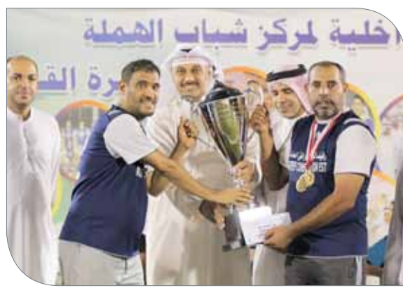
جانب من التتويج

لضربات الجزاء، لتنتهي المباراة بالتعادل السلبي ويلجأ الفريقان لضربات الجزاء حيث تقدم في البداية هابي، لكن براءة الحارس الجديد علي خليل حالت دون ذلك، ليختمها الحارس علي خليل بتسديد الركلة الأخيرة والتي رجحت كفة رفيف، حيث أكد رفيف أنه فريق بطولات وقادم بقوة ليحقق الفوز مثبته جدارته بالفوز حيث فاجأ لاعبي فريق هابي الذين كانوا يتوقعون فوزهم بالمباراة، لتنتهي المباراة بفوز رفيف، ويتوج بطلاً لكبار الهمة الكروية وهاي وصيفاً للبطول لهذا العام.