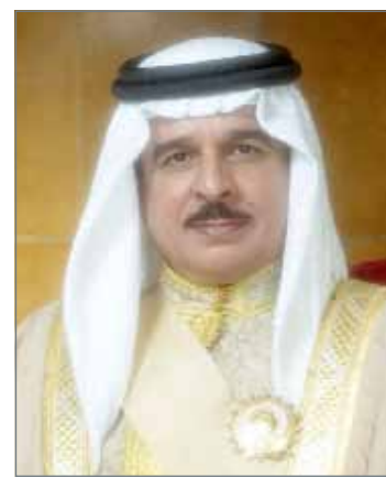
• جلالة الملك

للعام 1438هـ، وإننا إذ نشكر سموكم خالص الشكر لنبعث لكم بأطيب تحياتنا وتمنياتنا، أن يعيد هذه المناسبة السعيدة على سموكم، وعلى مملكتنا العزيزة وشعبنا الوفي والأمتين العربية والإسلامية بالخير والمسرّة. ونسأله تعالى أن يمتعكم بالصحة والعافية والسعادة حفظكم الله ورعاكم، ودمتم بحفظه سالمين.