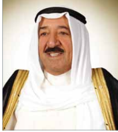
• سمو أمير الكويت

المولى عز وجل أن يعيد هذه المناسبة المباركة على مملكة البحرين وعلى شعوب الأمتين العربية والإسلامية بالعرفه والتقدم. كما جرت اتصالات هاتفية أمس بين جلالة الملك وكل من إخوانه ملك المملكة الأردنية الهاشمية الشقيقة صاحب الجلالة الملك عبدالله الثاني ابن الحسين، ورئيس جمهورية مصر العربية الشقيقة عبدالفتاح السيسي، وولي عهد أبوظبي نائب القائد