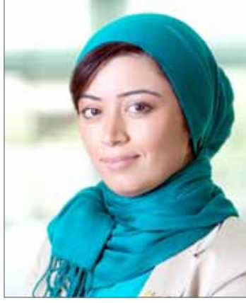
• النائب رؤى الحاكي