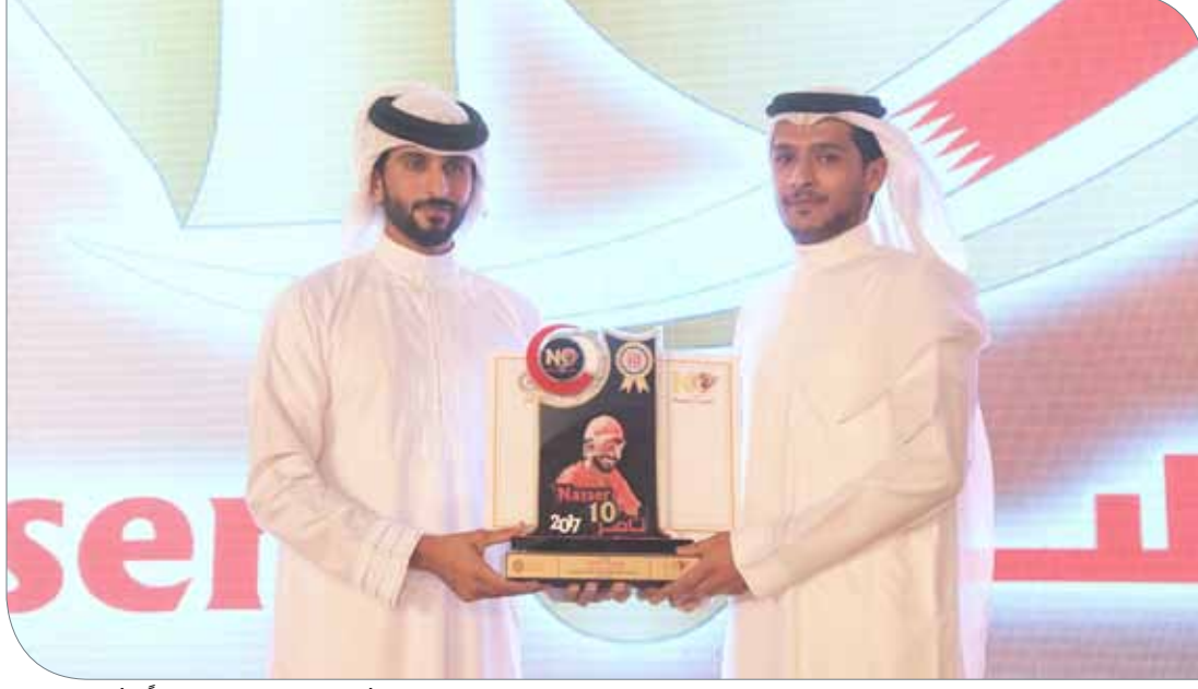
سمو الشيخ ناصر بن حمد مكرماً شركة حفيرة

وأعرب عبدالرحيم عن تقديره للجنة المنظمة العليا لدورة ناصر بن حمد للألعاب الرياضية والتي عملت بكل جد وإخلاص من أجل تنفيذ توجيهات وأفكار سموه حتى وصلت الدورة إلى محطاتها العاشرة وأضحت من بين الدورات المتميزة محلياً وإقليمياً.