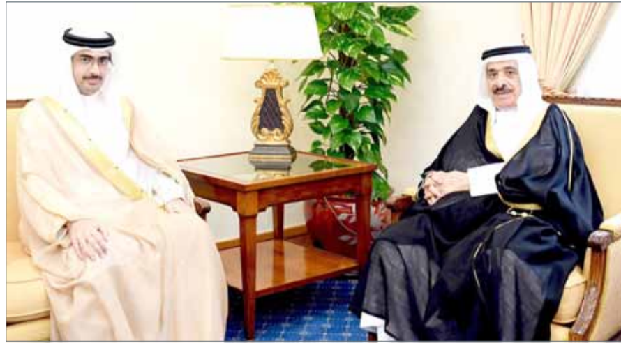
• سمو الشيخ خليفة بن علي مستقبلاً الأديب والمفكر وزير الدولة السابق محمد حسن كمال الدين

النامية - بنا: استقبل سمو الشيخ خليفة بن علي بن خليفة آل خليفة، بمكتبه، الأديب والمفكر ووزير الدولة السابق محمد حسن كمال الدين، إذ نوه سموه بما يبذله من جهود في مجالات الأدب والفكر والتوثيق. وأشاد سموه بالمنتجات الفكرية والأدبية للمفكر والأديب كمال الدين، مؤكداً سموه أن محمد حسن كمال الدين هو من الأدباء المميزين الذين أثروا المكتبة بإصداراتهم وأعمالهم الأدبية التي أشرت الساحة الفكرية والأدبية البحرينية، متمنياً سموه لمحمد حسن كمال الدين التوفيق والسداد. من جهته، أثنى محمد حسن كمال الدين على الاهتمام الكبير الذي يولييه سمو الشيخ خليفة بن علي لكل ما يتعلق بالمجالات الفكرية والأدبية.