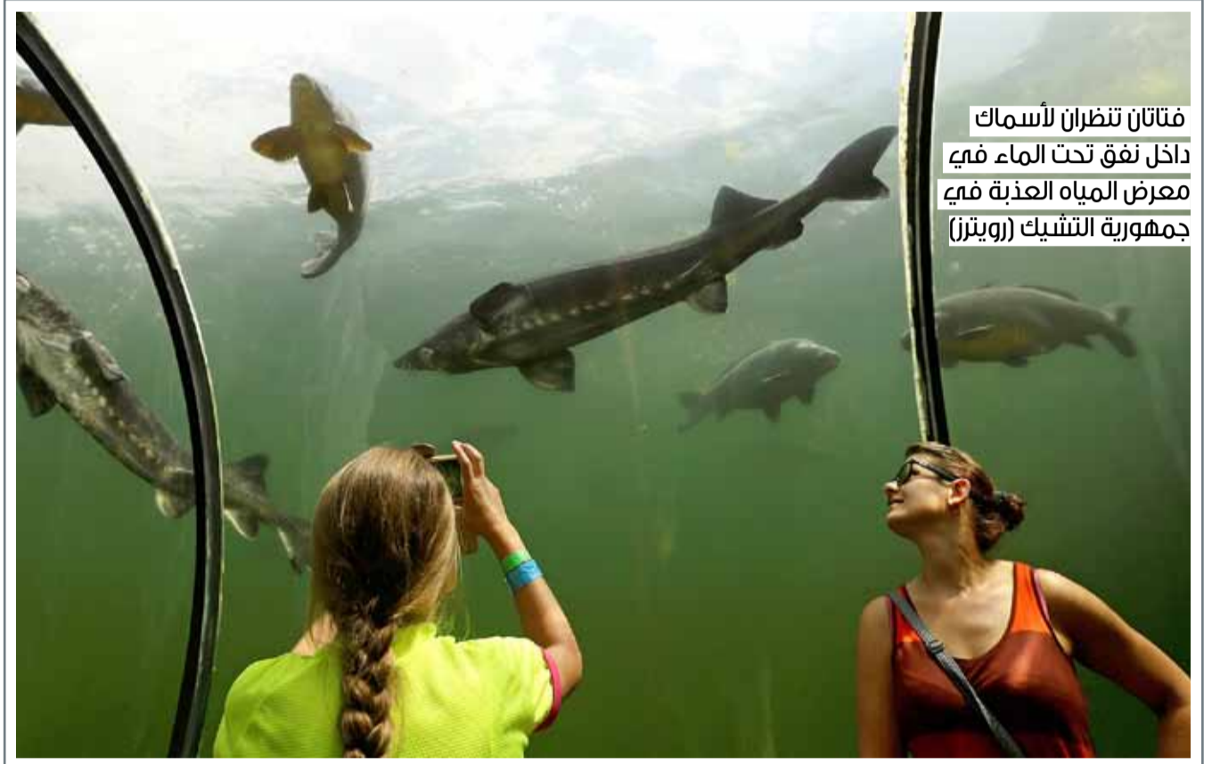
فتاتان تنظران لأسماك داخل نفق تحت الماء في معرض المياه العذبة في جمهورية التشيك

قال مستشفى "كليفلاند كلينيك" إن امرأة تبلغ من العمر 21 عاما مشوهة الوجه جراء طلقه نارية خضعت لعملية زرع وجه كامل. وأفاد المستشفى بأن الجراحة التي استمرت 31 ساعة في مايو ثالث زراعة في الوجه، لكنها أول عملية "زرع وجه كامل". وشملت العملية فروة الرأس والجفون والأنف وعضلات الوجه والأعصاب والأسنان ومعظم الفك، ولا تكشف هذه المؤسسة الطبية عن أسماء المرضى أو التفاصيل الأخرى بشأن حالتهم والمترعين لحماية خصوصيتهم.