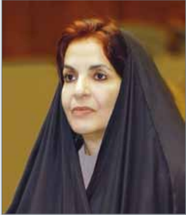
• صاحبة السمو الملكي الأميرة سبيكة بنت إبراهيم

ونؤكد في هذا السياق أن صدور قانون جامع للأسرة البحرينية هو إنجاز تاريخي للمؤسسة التشريعية بمملكة البحرين التي تولت مسؤوليتها باقتدار مشكور، استطاعت عبره أن تلبى تطلعات ملكية سبأقة وحاجة مجتمعية ملحة لحفظ كيان الأسرة البحرينية وحماية حقوق أفرادها، ولبتوح هذا الإنجاز سجل إنجازاتنا الوطنية التي تحظى بقيادة ورعاية جلالته السامية لكل ما من شأنه أن يرتقي بمسيرة الوطن المباركة ويعزز مكانة البحرين الحضارية بين الأمم.