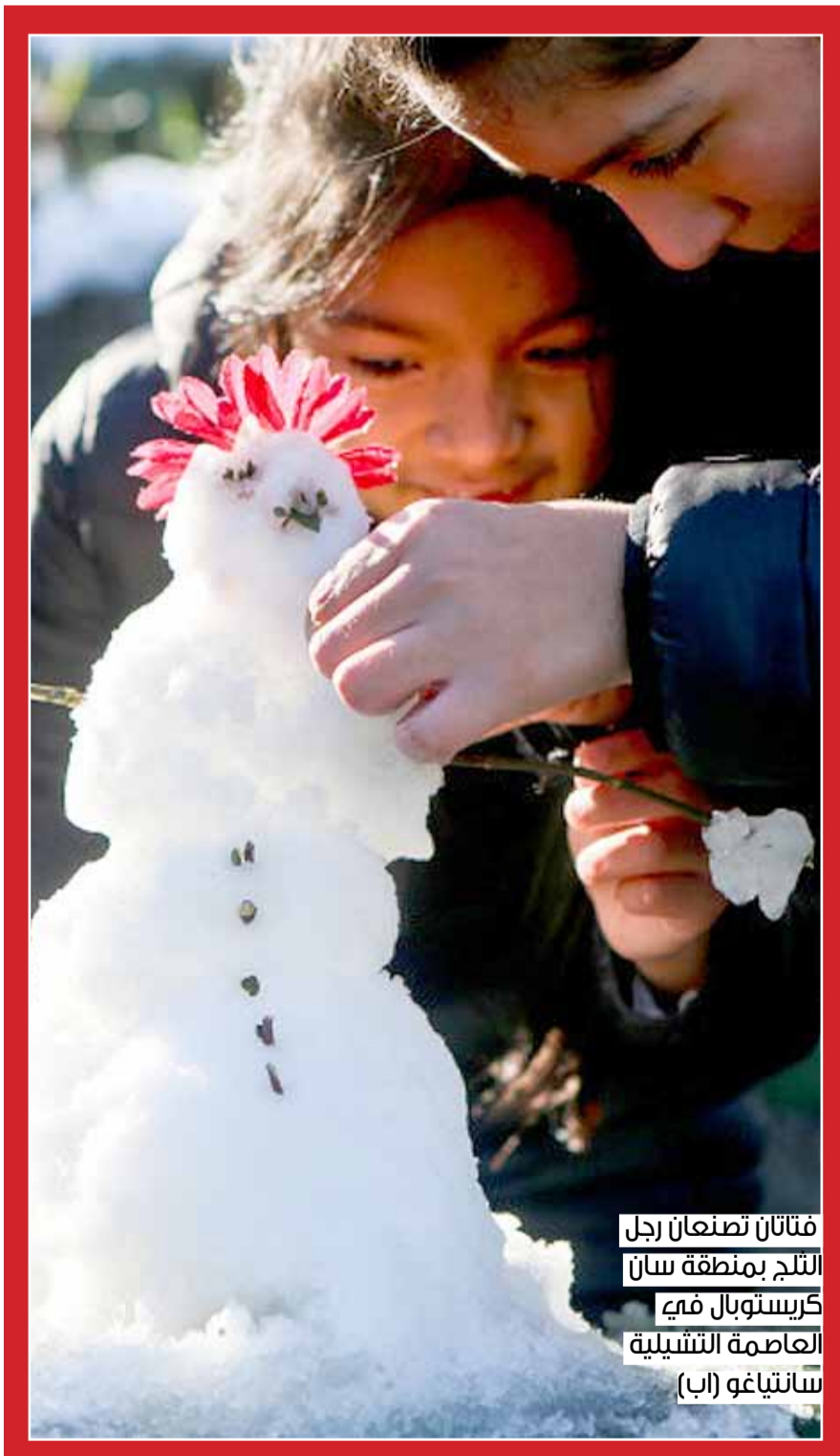
فتاتان تصنعان رجل الثلج بمنطقة سان كريستوبال في العاصمة التشيلية سانتياغو

أصدرت شبكة "بي بي سي" الممولة بشكل كامل من دافعي الضرائب في بريطانيا قائمة بالرواتب المالية التي يتقاضاها النجوم العاملون فيها، وهم أشهر نجوم الإذاعة والتلفزيون في البلاد، ليظهر أن أغناهم وأكثرهم دخلاً هو المذيع المشهور كرييس إيفان الذي يتقاضى 2.25 مليون جنيه إسترليني (3 ملايين دولار) راتباً سنوياً، أي أن راتبه الشهري هو ربع مليون دولار. ويعتبر إيفان الإعلامي الأشهر في بريطانيا منذ أن كان مذيعاً في برنامج "ذا بيج بريكفاست" الصباحي على القناة الرابعة، قبل أن ينتقل إلى شبكة "بي بي سي" التي واصل تالقه على شاشتها وواصل جني مزيد من الشهرة والمال. أما بدايات إيفان فتعود إلى محطة إذاعية محلية في مدينة "مانشستر" تدعى "راديو بيكاديلي"، حيث كان مقدماً للبرامج هناك عندما كان في سن المراهقة. وبعد ضغوط من الرأي العام ووسائل الإعلام في بريطانيا اضطرت شبكة "بي بي سي" أخيراً أن تكشف لأول مرة عن الرواتب المالية التي يتقاضاها نجومها، فأصدرت قائمة تتضمن أعلى 96 راتباً تدفعهم الشبكة، ومن بين القائمة أسماء النجوم كافة الذين يعرفهم البريطانيون ولم يسبق أن عرفوا دخولهم المالية.