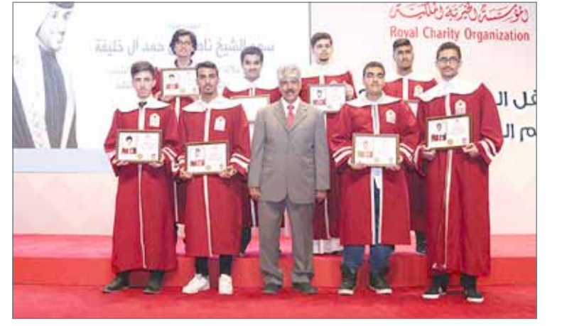
• جانب من الحفل الذي نظمته المؤسسة الخيرية الملكية لتكريم 540 طالباً

سموه رعى تكريم 540 من طلاب "الخيرية الملكية" ... ناصر بن حمد: