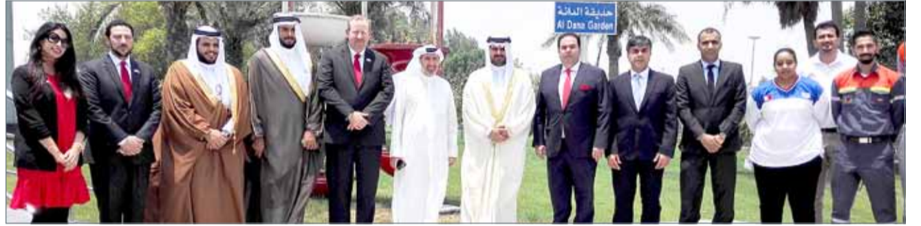
• سمو الشيخ عيسى بن علي ملتقياً رئيس مجلس إدارة شركة ألبا (ألبا)