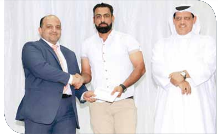
لقطات من التكريم