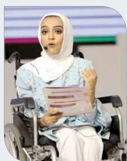
جانب من حفل القرعة بمشاركة ذوي الإعاقة

قامت اللجنة المنظمة لدوري خالد بن حمد ولذوي الإعاقة والفتيات الخامس يوم أمس "الأربعاء" بتوزيع التجهيزات على الفرق المشاركة، والذي يأتي تنفيذاً لتوجيهات النائب الأول لرئيس المجلس الأعلى للشباب والرياضة الرئيس الفخري للاتحاد البحريني لرياضة ذوي الإعاقة سمو