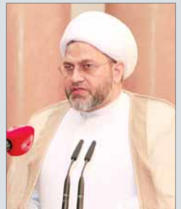
• رئيس الأوقاف الجعفرية

الشأن والتحقق من مطابقة جميع بنوده ومواده مع ثوابت أحكام الشريعة الإسلامية وتحصين هذا القانون بضمانات تكفل عدم السماح لأي جهة غير الجهة ذات الاختصاص المتمثلة في اللجنة الشرعية بتغيير أي مادة من موادها.