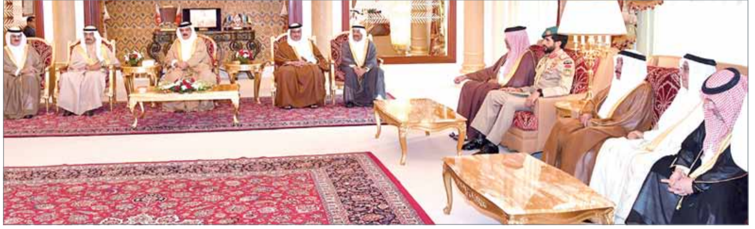
• جلالة الملك مستقبلاً، بحضور سمو رئيس الوزراء وسمو ولي العهد، رئيسي مجلسي النواب والشورى

جلالته شكر رئيس الوزراء وولي العهد على تعاون سموهما مع البرلمان... العاهل: