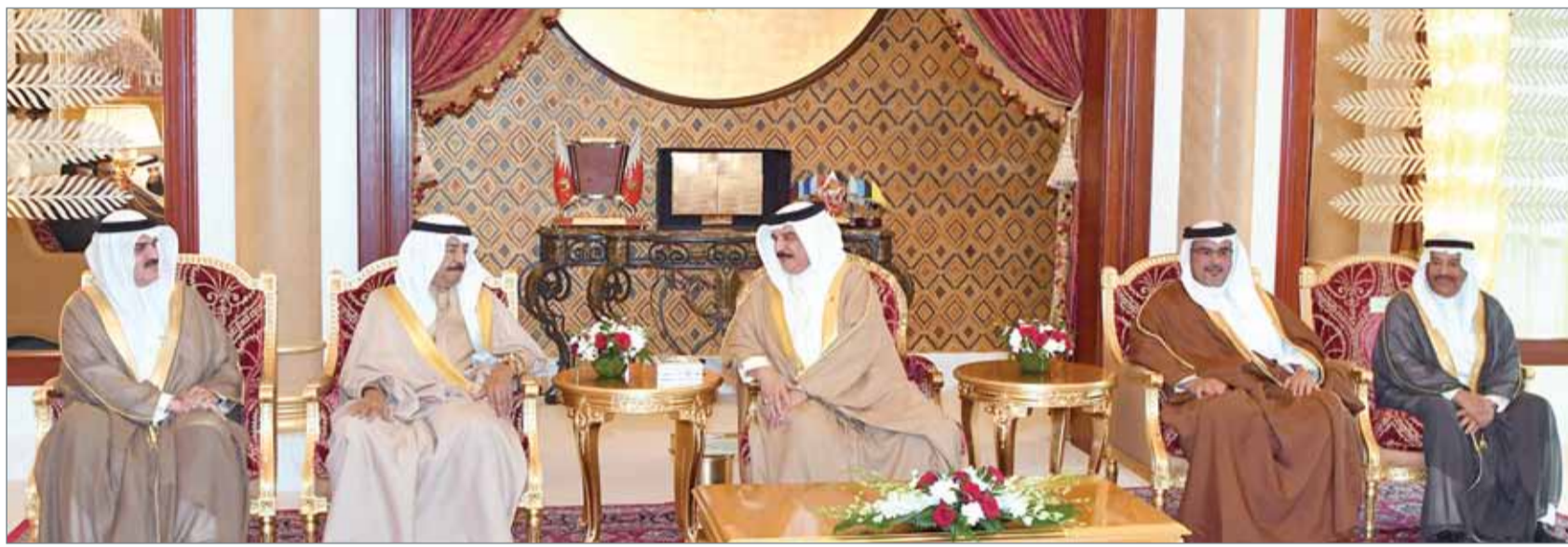
• جلالة الملك مستقبلا، بحضور سمو رئيس الوزراء وسمو ولي العهد، رئيسي مجلسي النواب والشورى

• السلطة التشريعية وضعت مصلحة البحرين فوق كل اعتبار