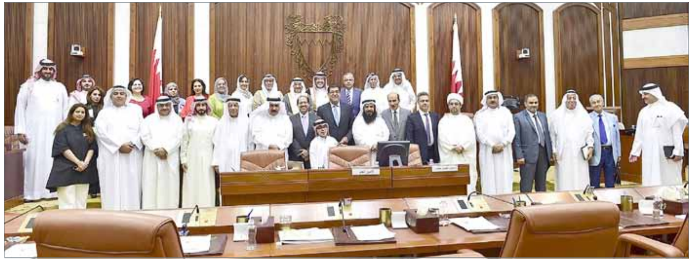
• وزير العدل في لقطة تذكارية مع الشوريين على هامش الجلسة الاستثنائية

وبعد ترفه ورؤساء اللجان النوعية في مجلس الشورى ببقاء جلالة الملك مساء أمس، أكد الصالح أن توجيهات جلالاته تعتبر البوصلة التي يهتدي بها أعضاء المجلس من خلال ممارستهم لدورهم التشريعي، معرباً عن اعتراز مجلس الشورى بما تحقق من إنجازات الوطن والمواطنين في ظل العهد الزاهر لجلالة الملك، مشيداً بالرؤى والتوجيهات الملكية التي عبر عنها جلالاته خلال اللقاء، والتي تؤكد ضرورة المحافظة على اللحمة الوطنية، والانطلاق من العادات والقيم العربية الأصيلة التي يتمتع بها أهل البحرين الكرام، وما يتميزون به من وعي