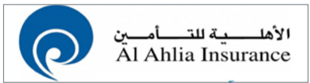
• مجلس إدارة سوليدرتي يوافق على خطاب نوايا الدمج

تبادل تعادل 1:2.5، وذلك استناداً على التقييم المستقل الذي تم إجراؤه على قيمة أسهم شركة الأهلية للتأمين بواسطة كي بي إم جي فخر والتقييم المستقل الذي تم إجراؤه على قيمة أسهم شركة سوليدرتي التكافل العام بواسطة برايس وتر هاوس كوبرز الشرق الأوسط المحدودة كما هو مطلوب من قبل مصرف البحرين المركزي، حيث إن 2.5 سهم عادي مدفوع من اسهم شركة الأهلية يصدر مقابل كل سهم واحد من الأسهم العادية الصادرة والمدفوعة لشركة سوليدرتي، وذلك مقابل دمج سوليدرتي مع الأهلية من خلال نقل الأعمال والموجودات والمطلوبات.