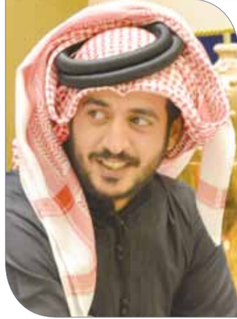
سمو الشيخ خالد بن حمد آل خليفة

دوري خالد بن حمد للمراكز الشبابية ولذوي الإعاقة