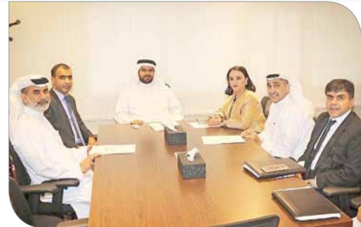
سمو الشيخ عيسى بن علي خلال اجتماع اللجنة العليا المنظمة للبطولة