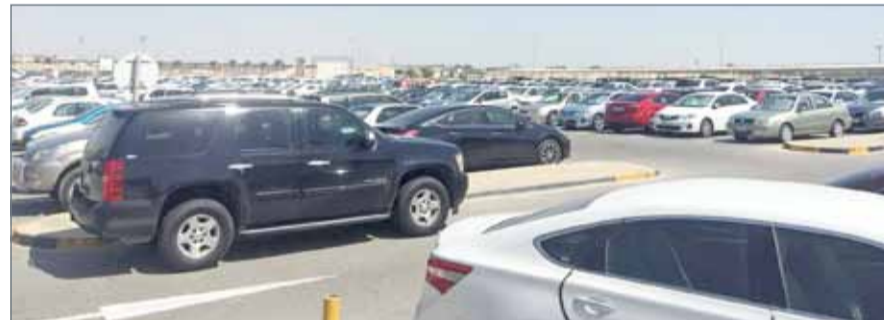
• ضرورة فتح البوابة الثالثة لأنها ستخفف الازدحام