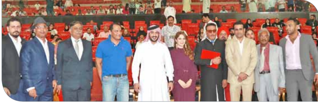
سمو الشيخ خالد بن حمد آل خليفة يتابع فعاليات اليوم الختامي

الرفاء | المكتب الإعلامي لسمو الشيخ خالد بن حمد آل خليفة