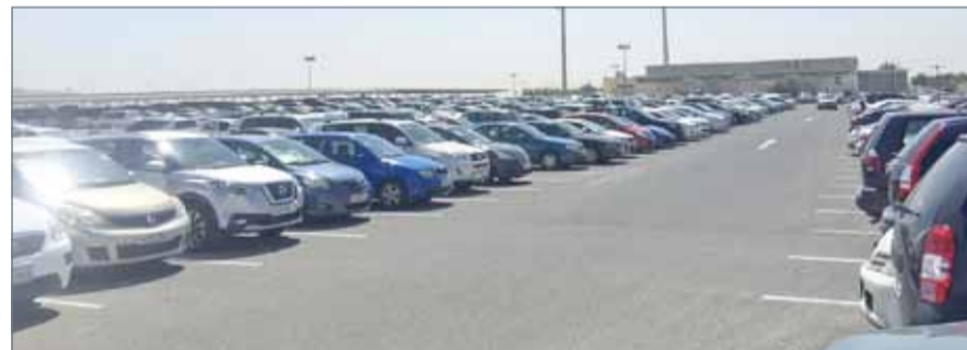
• مشهد تكديس السيارات في الساحات أشبه برب نمل