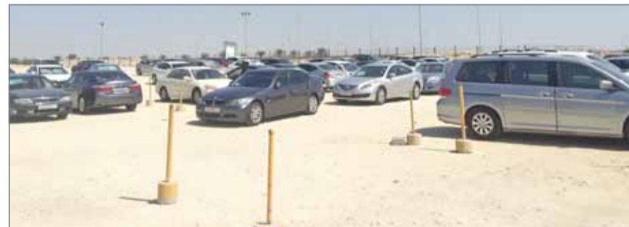
• كومة حصى وتراب ومرتفعات ولا أحد يهتم