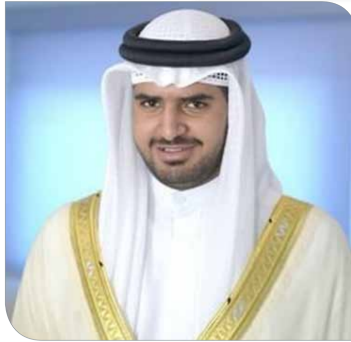
أم الحصم | اللجنة الإعلامية