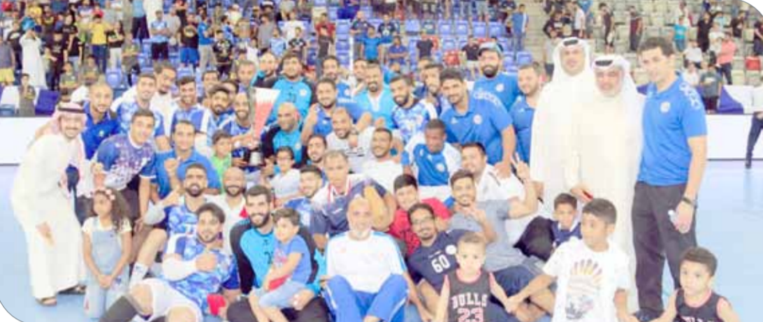
فريدة نجموية بالتتويج