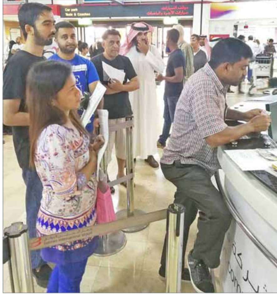
• رئيس جمعية مكاتب الاستخدام: مشكلة استخدام العمالة من إفريقيا بطريقة غير قانونية منتشرة بشكل كبير

ضحية لنصب هؤلاء التجار، وسجلت الجمعية العديد من هذه القصص من قبلها أن المواطنين يدفعون لأحد الأشخاص بعد تعرفهم على رقم ورد إليهم عن طريق برنامج التواصل الاجتماعي الشهير (الواتس اب) وبعد تواصلهم مع الرقم ودفع المبلغ لا يحصلون لا على خادمة ولا المبلغ بعدما يقوم السمسار بخلق الماتف ناهياً وبعد تقديم الشكوى عليه يتضح أنه من ضمن شبكة السوق السوداء.