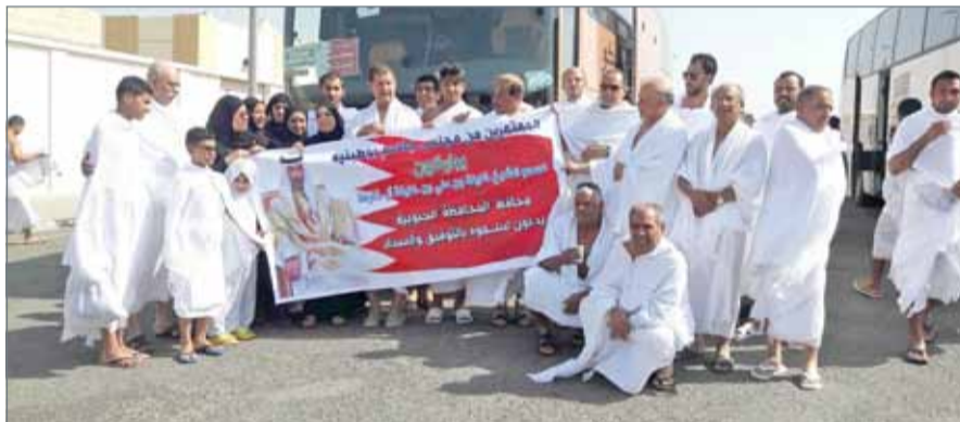
أعضاء مجلس بوطينية عبروا عن امتنانهم وشكرهم لسمو الشيخ خليفة بن علي

بإذن الله تعالى طفرة كبيرة في المجالات كافة، بما يسهم في النموذج بالعمل التنموي ويجعل بلادنا الغالية على مصاف الدول المتقدمة.