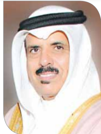
وزير التربية والتعليم

تنطلق مساء اليوم الأحد منافسات بطولة سمو الشيخ عيسى بن علي المدرسة الأولى لكرة السلة، وذلك عبر إقامة لقاءين لحساب المجموعة الأولى. ويلتقي فريق مدرسة عثمان بن عفان مع فريق مدرسة كانو الدولية عند الثالثة والنصف عصراً، تليها مباشرة مباراة فريقي مدرسة مدينة حمد مع مدرسة البلاد القديم عند الخامسة مساءً، وتقام المباراتان على الصالة الرياضية التابعة لمدرسة مدينة عيسى الابتدائية الإعدادية للبنين. ويبهذ المناسبة صرح رئيس الاتحاد البحريني لكرة السلة رئيس اللجنة المنظمة العليا للبطولة سمو الشيخ عيسى بن علي بن خليفة آل خليفة بأن مثل هذه الفعاليات المدرسية من شأنها أن تحقق العديد من الأهداف النبيلة، وتؤدي إلى المزيد من النجاحات؛ كونها تأسس إلى بناء القواعد الصلبة للعبة، لافتاً سموه إلى أن مجلس إدارة الاتحاد يضع نصب عينيه أهمية صناعة الأساس القوي للسلة البحرينية عبر هذه النوعية من الفعاليات المدرسية. وأكد سمو الشيخ عيسى بن علي آل خليفة أن البطولة فرصة طيبة للمدرسين لاكتشاف المواهب والاستفادة منها في تعزيز قواعد الأندية الوطنية وبالتالى انعكاس هذا النجاح على المنتخب الوطني، مشيراً سموه إلى البطولة فرصة للتعاون المشترك بين الاتحاد البحريني لكرة السلة ووزارة التربية والتعليم، وأعرب سمو الشيخ عيسى بن علي آل خليفة عن تقديره البالغ للجهود التي