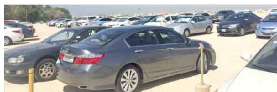
• المواقف بلا أسفلت ولا مظلات

الكثيرة من الازدحام وفترة البحث عن مواقف للسيارات، ومن بين الاقتراحات توفير حافلات كافية للطلبة بمواقع "الباركات" البعيدة عن الحرم الجامعي ليستطيع الطلاب الذهاب الالتحاق بمحاضراتهم في وقتها وتخفيفاً من حدة الازدحام.