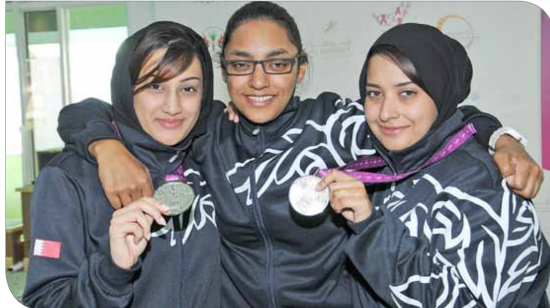
جانب من مشاركة البحرين في إحدى نسخ المنافسات