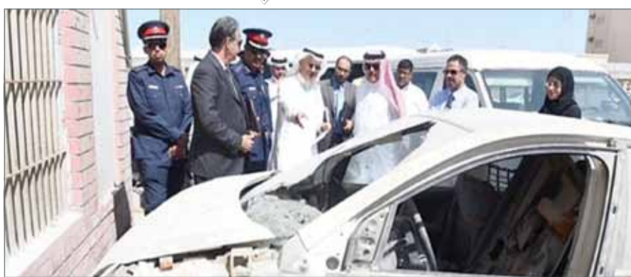
إزالة السيارات السكراب ب "المسطحة" في سلماباد

كراج لمخالفته لقانون إشغال الطرق مشيراً إلى "ضرورة إزالة هذه المخالفات". ووجه الغتم الشكر لمحافظ الشمالية على دور المحافظة في التنسيق والمتابعة.