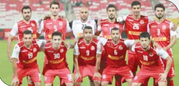
المحرق لم يشرك أي لاعب تحت 21 حته الآن

◆ أعلن اتحاد الكرة الإحصائيات الخاصة بمشاركة اللاعبين تحت 21 عاماً خلال أول 4 جولات، وجاءت كالآتي: فريق نادي الشباب جاء في المقدمة كأكثرهم مشاركة عبر مشاركة 3 لاعبين شاركوا بها مجموعهم (805) دقيقة، فيما شارك الرفاع بـ 3 لاعبين أيضاً ومجموع (582) دقيقة، الرفاع الشرقي بلاعبين اثنين مجموع (377) دقيقة، المالكية بلاعب واحد (360) دقيقة، الحد بلاعب واحد (360) دقيقة، الأهلي بلاعب واحد مجموع (180) دقيقة، الاتحاد بلاعب واحد مجموع (177) دقيقة، النجمة بلاعب واحد (97) دقيقة، المنامة بلاعبين اثنين مجموع (33) دقيقة، فيما لم يشرك فريق نادي المحرق أي لاعب حتى الآن. وبلغ مجموع اللاعبين المشاركين في المباريات الـ 20 الماضية 15 لاعباً تحت 21 عاماً، فيما بلغ مجموع الدقائق الكلية لمشاركتهم (2971) دقيقة. وكان الاتحاد طبق مشاركة اللاعبين تحت 21 بشكل تدريجي بدءاً من هذا الموسم وفقاً للمعايير التي أعلنها قبل الموسم.