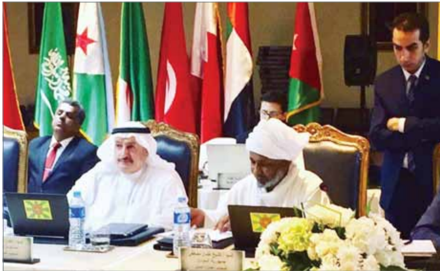
عثمان شريف حاضراً بالاجتماع

انتخب مؤتمر منظمة العمل العربية هيئة رئاسة جديدة لمجلس إدارة المنظمة، واختار المؤتمر وزير العمل والشؤون الاجتماعي بجمهورية العراق محمد شياع السوداني رئيساً لمجلس الإدارة.