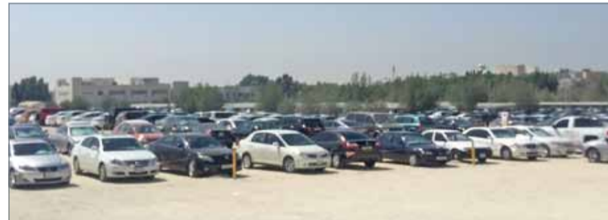
• مواقف السيارات معاناة يومية لا يختلف عليها اثنان