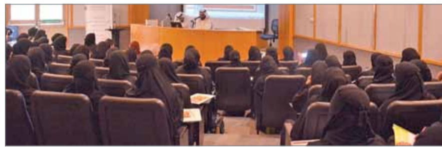
• تحتسب وزارة التربية ساعات تمهين للملتحق بالبرنامج

التالي: 200 دينار لمن يجتاز البرنامج بنجاح، و100 دينار إضافية لمن يتخرج بامتياز، و100 دينار لمن يجتاز البرنامج في فصلين دراسيين، و200 دينار لمن يجتاز البرنامج في فصل دراسي واحد. وحتت الإدارة جميع المعلمين الجدد على الالتحاق بالبرنامج وعلى ضرورة حصول معلم التربية الإسلامية على شهادة علم التجويد؛ لتعليم كتاب الله على الوجه الصحيح.