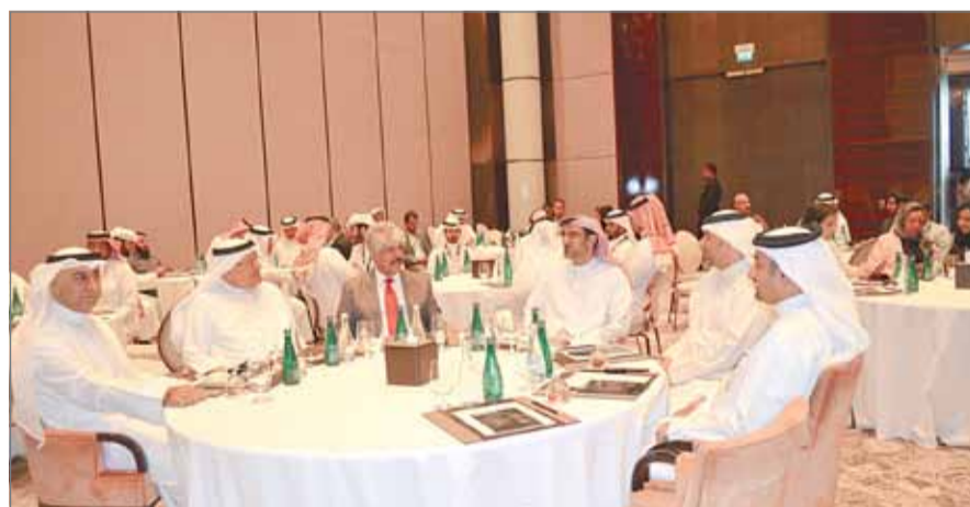
• هيئة المعلومات والحكومة الإلكترونية عقدت الاجتماع الدوري ونظمت الورشة بالتنسيق مع "كاسبر سكاى"

بدوره قال الشيخ سلمان بن محمد آل خليفة إن مبادرة صقور أمن المعلومات نجحت في تحقيق أهدافها المتمثلة في زيادة التنسيق والتعاون بين مختلف الجهات الحكومية للكشف والتصدي