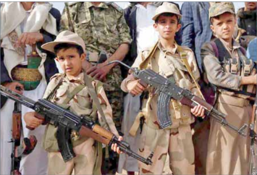
أطفال يحملون السلاح في تجمع للمحوثيين بمنعاف يونيو 2017 (غيتي)

أبوظبي - سكاى نيوز عربية: فشلت منظمة الأمم المتحدة في السنوات الست الماضية في وقف العنف والفضوى بالمنطقة العربية، حيث عملت على قلب الحقائق ونشر معلومات مضللة كان آخرها الفضيحة المتمثلة بتقرير "غير دقيق ومضلل" عن التحالف العربي الداعم للثورة في اليمن. والتحالف العربي الذي أطلق بقيادة السعودية بناء على طلب من إدارة الرئيس اليمني عبد ربه منصور هادي، جاء نتيجة حتمية لفشل الأمم المتحدة متمثلة بمندوبها جمال بنعمر الذي اتخذ موقفاً منحازاً ومتخاذلاً أمام انقلاب قوات صالح وميليشيات الحوثي على الشرعية في اليمن. وفشل الأمين العام للمنظمة أنطونيو غوتيريس في إدارة الأزمة اليمنية وغيرها من الملفات الساخنة في المنطقة، مما عزز الصورة المهزوزة للمنظمة التي بانت مثار تهكم.