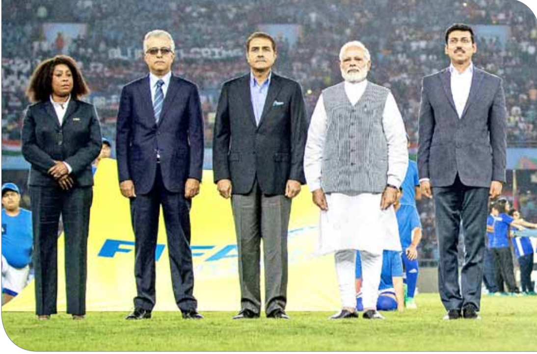
رئيس الاتحاد الآسيوي مع رئيس الوزراء الهندي وكبار الشخصيات في حفل الافتتاح

دلهي | مكتب رئيس الاتحاد الآسيوي لكرة القدم