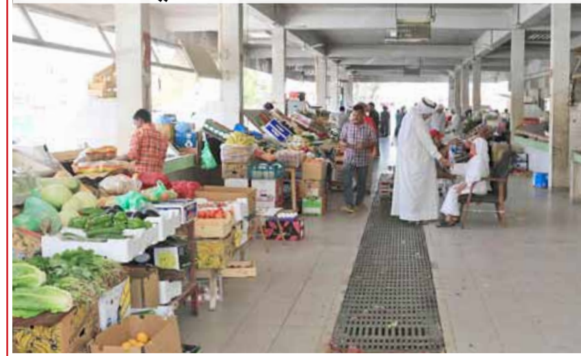
مايزال أهالي سترة بانتظار تطوير السوق المركزي رغم مرور 6 سنوات على رصد ميزانية التطوير التي بلغت 1.8 مليون دينار