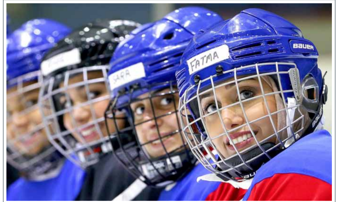
لاعبات المنتخب النسائي الكويتي للهوكي على الجليد يخضن تدريبات مكثفة تحضيراً للمشاركة الدولية الأولى لهن المقررة في وقت لاحق هذا الشهر

شاركت النجمة غلوريا إستيفان وربينا مورينو وجيفر لوبيز ولويس فونسي في إنتاج أغنية لدعم جهود الإغاثة المبدولة في جزيرة بورتوريكو، التي ضربها الإعصار ”ماريا“ مؤخرا. وكتب كلمات الأغنية، التي تحمل عنوان ”تقريبا مثل الصلاة“ Almost Like Praying، كاتب الأغاني الشهير لين مانويل ميراندا، مؤلف مسرحية هاميلتون الفنائية التي تعرض في برودواي في نيويورك.