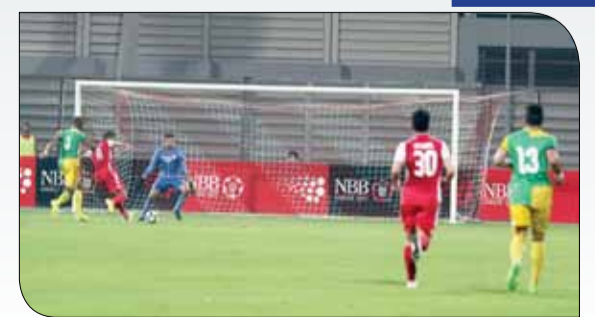
من منافسات الدوري