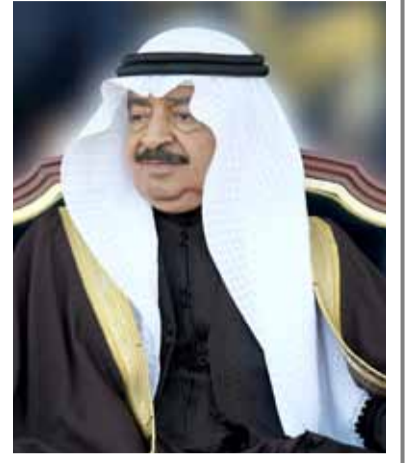
بقلم: الدكتور عبدالله الحواج

النامنة- بناءً، وجه رئيس الوزراء صاحب السمو الملكي الأمير خليفة بن سلمان آل خليفة، إلى زيادة اعتمادات ميزانية وزارة الصحة في الميزانية العامة للدولة للفتره المتبقية من السنة المالية 2017، في حدود 15 مليون دينار، يتم تخصيصها لتغطية نفقات توفير أدوية ومستلزمات طبية للمستشفيات العامة والمراكز الصحية التابعة للوزارة. ويأتي هذا التوجيه في إطار المتابعة المستمرة لصاحب السمو الملكي رئيس الوزراء لمتطلبات القطاع الصحي في المملكة والاطمئنان على توفير الأدوية والمستلزمات والخدمات الطبية اللازمة لأداء هذا القطاع لمهامه على الوجه الأكمل، وبهذه المناسبة، أعربت وزيرة