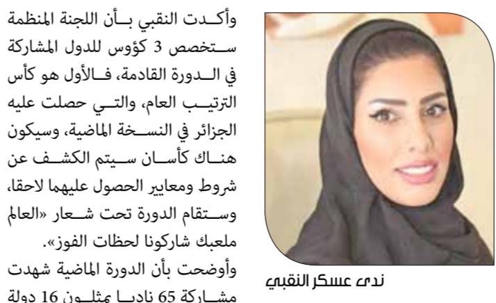
نداء عسكري التقبيي

مشاركة أكثر من ناد من دولة واحدة في كل لعبة باستثناء الإمارات الدولة المنظمة للحدث. وكشفت التقبي عن أهمية وضع صديقة للبيئة داخل المنشآت وخارجها من خلال تطبيق كافة المعايير والتعليمات بهذا الخصوص، وتقليل استخدام الأوراق واستبدالها بالأمور الإلكترونية في كل ما يتعلق بالتسجيل والناتج، كما سيتم تطبيق فحص المشطاط. وأشارت إلى أهمية مشاركة الأندية الفلسطينية؛ لرفع مستوى الفرق الرياضية الفلسطينية، موضحة بأن الدورة ستحتضن مشاركة فرق