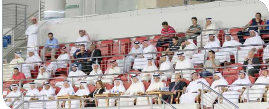
حضور رسمي لافت في المنصة الرسمية