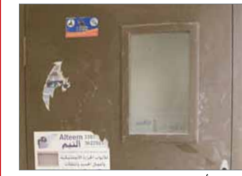
مرات 5 أشهر على تسليم البيوت ولم يتم تركيب عدادات الكهرباء

بن سلمان آل خليفة إصدار توجيهات سموه الكريمة للمعنيين؛ للإسراع في تركيب عدادات الكهرباء للمشروع. وزار عدد من ملاك تلك الوحدات مقر صحيفة "البلاد" للحديث عن مشكلتهم التي ظلت تتقاذفها أقسام وزارة الإسكان منذ تسليمهم الوحدات وحتى الآن، دون الوصول إلى نتيجة تذكر، أو معرفة لأسباب تأخر تركيب العدادات لمنازلهم وفقاً لأقوالهم.