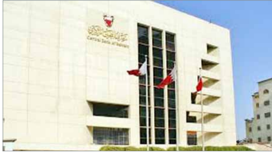
أظهرت البيانات أن النقد المتداول خارج المصارف بلغ 535 مليون دينار في أغسطس الماضي

تراجع إجمالي ودائع قطاعي العام والخاص إلى 11.867 مليار دينار حتى أغسطس الماضي مقابل 12.041 مليار دينار بالفترة نفسها من العام الماضي، بانخفاض نسبته 1.44%، وتشير البيانات إلى أن ودائع القطاع الخاص (تحت الطلب) قد سجلت 2.812 مليار دينار حتى أغسطس مقابل 2.879 مليار دينار في يوليو 2017، أما ودائع القطاع الخاص (الأجل والتوفير)، فقد بلغت 7.147 مليار دينار في أغسطس الماضي مقابل 7.130 مليار دينار في يوليو 2017. أما ودائع الحكومة، فقد انخفضت إلى 1.906 مليار دينار في أغسطس مقارنة بـ 2.030 مليار دينار في يوليو.