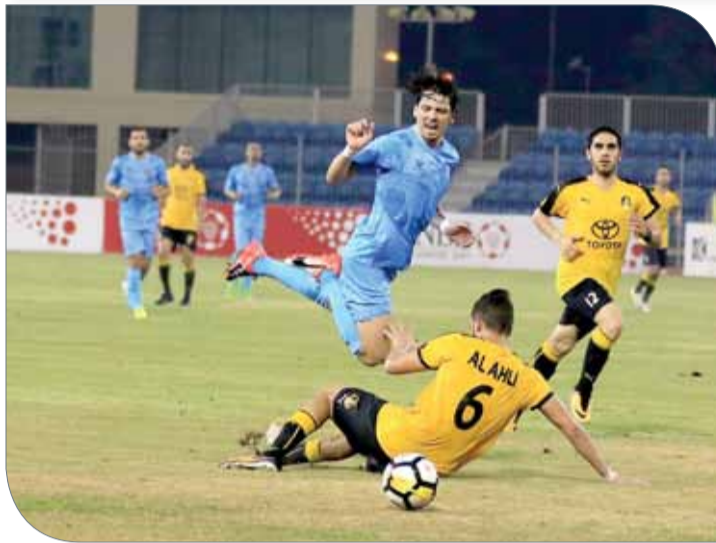
من منافسات الدوري