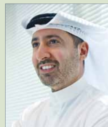
الشيخ دعيج بن سلمان آل خليفة

بدأ من مطلع هذا العام وحتى 31 أغسطس 2017. وتشير التوقعات إلى أن العام 2018 سيكون عاماً إيجابياً أيضاً، خصوصاً في ضوء خريطة الطريق التي تعكف الشركة على إعدادها، وبالتالي تنفيذها في السنة الجديدة.