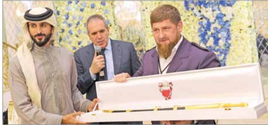
• سمو الشيخ ناصر بن حمد يقدم هدية تذكارية إلى الرئيس الشيشاني

غروزي - بنا: حضر ممثل جلالة الملك للأعمال الخيرية وشؤون الشباب رئيس المجلس الأعلى للشباب والرياضة رئيس اللجنة الأولمبية البحرينية سمو الشيخ ناصر بن حمد آل خليفة الحفل الذي أقامه رئيس جمهورية الشيشان الصديقة رمضان أحمد قاديروف بمناسبة عيد ميلاده، بحضور عدد من رؤساء الجمهوريات والمسؤولين وعدد كبير من المدعوين. وخلال الحفل، قدم سمو الشيخ ناصر بن حمد آل خليفة هدية تذكارية إلى الرئيس رمضان أحمد قاديروف بمناسبة عيد ميلاده، مبرعاً سموه عن أطيب تمنياته وتمنياته للرئيس موفور الصحة والسعادة، وللشعب الشيشاني مزيداً من التقدم والرخاء في مختلف المجالات، سائلاً سموه المولى عز وجل أن يعيد هذه المناسبة العطرة على الرئيس بالخير واليمن والبركات، وأن يتمتع بموفور الصحة والعافية.