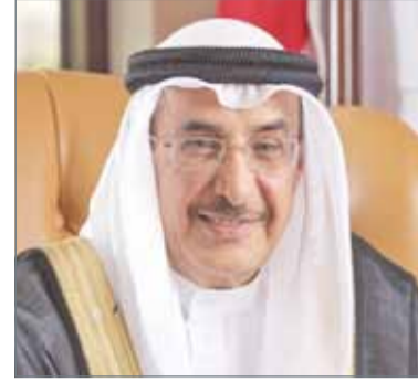
• الشيخ خالد بن عبدالله

ولفت إلى أنه وعلى الرغم من أنها المرة الأولى التي يكون فيها لنظام الخدمة المدنية المقلد منذ أكثر من 4 عقود في المملكة استراتيجية شاملة وموحدة لهذا القطاع، إلا أن ذلك لا يخفي حقيقة أن البحرين وبم هذه الاستراتيجية تعتبر من أوائل دول المنطقة من حيث وضع هذه الاستراتيجية والبدء الفعلي في تطبيقها الذي سيتضح مع مرور الوقت ما سيحققه من آثار إيجابية إداريا وماليا واقتصاديا واجتماعيا. وكان مجلس الخدمة المدنية وافق أواخر سبتمبر 2016 على مشروع إدارة الأداء المؤسسي، مستندا في ذلك على أحكام المادة (12) من المرسوم بقانون رقم (48) لسنة 2010 بإصدار قانون الخدمة المدنية التي نصت على أن "يضع الديوان نظاما لإدارة الأداء المؤسسي بهدف تطوير الخدمات الحكومية ورفع الإنتاجية والكفاءة بالجهات الحكومية، وذلك وفقا للضوابط التي تحددها اللائحة التنفيذية".