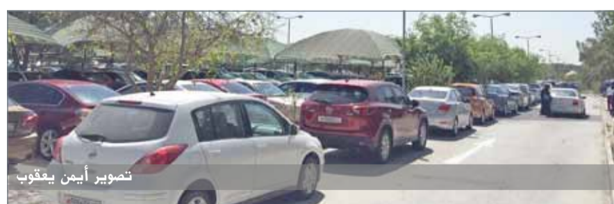
• طالبة تقول إما تضر محاضراتها أو تضرها متأخرة