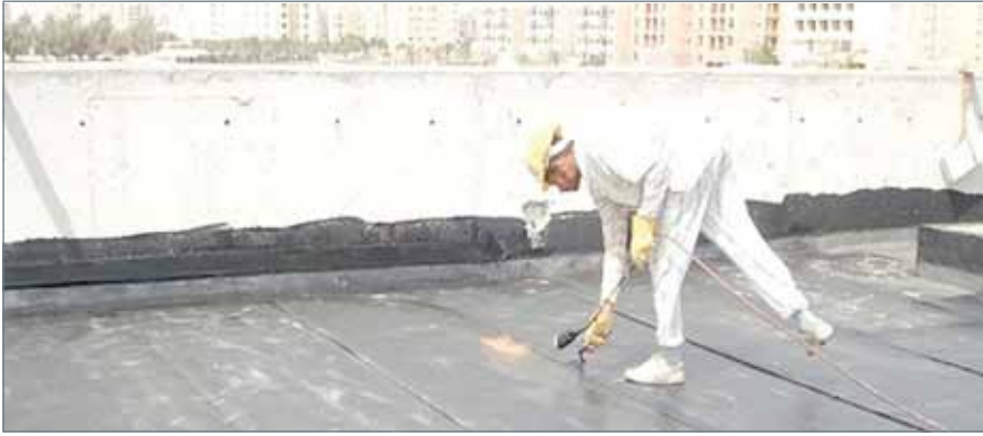
• عامل يركب عازل أمطار على أحد المنازل