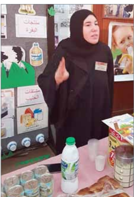
• التوعية عن المشاكل الغذائية والسمنة