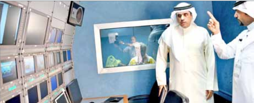
• وزير شؤون الإعلام في زيارة للمركز الإعلامي

النقل الفضائي لربط جميع أماكن المعرض، مع تجهيز استوديوهات في قلب مركز البحرين الدولي للمعارض والمؤتمرات لبث برامج تليفزيونية مباشرة في الفترتين الصباحية والمسائية، بالإضافة إلى البرامج التليفزيونية التسجيلية والحوارية والوثائقية. وانطلاقاً من أهمية هذا الحدث العالمي، أكد الريجي تفريغ أكثر من 200 موظف من الكوادر الإعلامية والفنية لتغطية النسخة الأولى من معرض البحرين الدولي للدفاع والفعاليات المصاحبة له، من خلال النقل المباشر لعروض السفن الحربية والمركبات العسكرية وتمايرين الرماية الحرة والمهبط بالمظلات، فضلاً عن تغطية مؤتمر التحالفات العسكرية في الشرق الأوسط (MEMAC) الذي سيعقد إلى جانب المعرض خلال الفترة من 17-16 أكتوبر 2017.