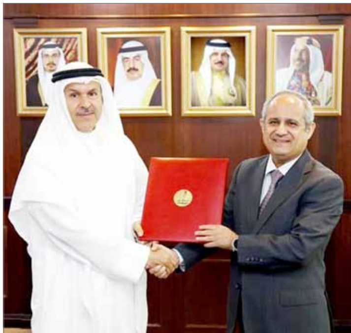
• رئيس التنفيذي لـ ”تمكين“ ملتقى محافظ العاصمة

ليكونوا الخيار الأمثل للتوظيف، ووضعهم على مسار ريادة الأعمال كخيار بديل عن التوظيف، تواصل تمكين دعمها لأهداف ومبادرات تحقيق الازدهار في الاقتصاد الوطني وتعزيز دور القطاع الخاص ليكون المحرك الرئيس للاقتصاد في المملكة“. وأثنى جناحي على جهود محافظة العاصمة ممثلة في المحافظ الشيخ هشام بن عبدالرحمن آل خليفة في إقامة برامج قيمة ذات رؤية وأهداف مهمة، مؤكداً حرص تمكين على إقامة شراكات مثمرة مع مختلف الجهات لما من شأنه تطوير الأفراد البحرانيين، وتزويدهم بكافة الأدوات اللازمة للارتقاء بمهاراتهم ليكونوا الخيار الأمثل في سوق العمل.