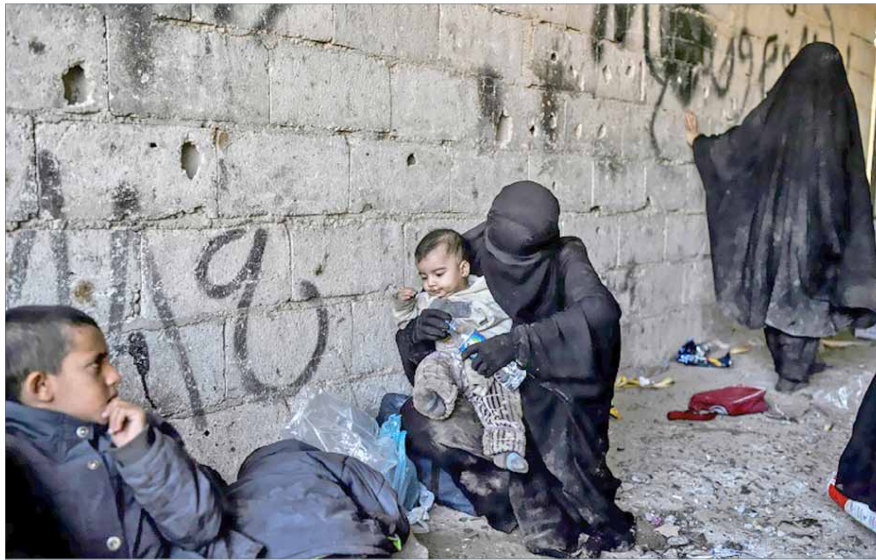
• نسوة وأطفال فروا من وسط الرقة (شمال) يتجمعون في الجهة الغربية، يوم 12 أكتوبر 2017

قالت مصادر أمنية أمس السبت إن التوتر تصاعد في مدينة طوز خورماتو العراقية مختلطة الأعراق بعد اشتباك بين الأحزاب السياسية الكردية والشيعية التركمانية المختلفة بشأن استقلال إقليم كردستان. وقالت المصادر إن ما لا يقل عن 10 أمر كردية فرت من حي العسكري الذي يقرب على سكانه التركمان إلى الأحياء الكردية بالمدينة بعد اشتباك استمر لساعتين صباح أمس. وأضافت أن تبادل لإطلاق النار بأسلحة آلية لم يسفر عن سقوط ضحايا. وجرى الاشتباك بين أفراد من الاتحاد الوطني الكردستاني والتركمان المواليين لجماعات سياسية شيعية تحكم العراق. وتبعد المدينة 75 كيلومترا إلى الجنوب من مدينة كركوك متعددة الأعراق الغنية بالنفط وتسيطر عليها قوات البشمركة الكردية وتطالب بها الحكومة المركزية في بغداد. وانتشرت جماعات شيعية شبه عسكرية تدعمها إيران يطلق عليها الحشد التركماني في حي طوز الذي يقرب على سكانه التركمان بينما تسيطر قوات الأمن الداخلي الكردية (الأسايش) على الأحياء الكردية.