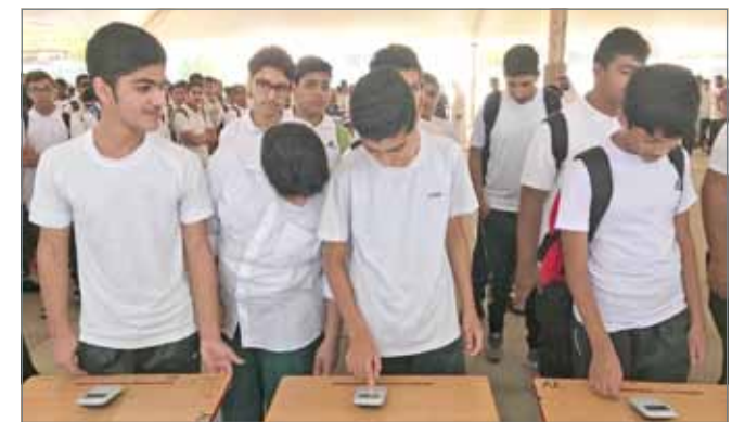
• تستوعب المدرسة قرابة 575 طالبا

نظمت مدرسة مدينة عيسى الثانوية للبنين يوما انتخابيا أسفر عن انتخاب التلاميذ أعضاء لمجلس الطلبة. واللافت في عملية الاقتراع اعتماد نظام التصويت الإلكتروني بالانتخاب، وهو النظام الأول من نوعه المعتمد بمدرسة حكومية. واعتلى المرشحون منصة بطابور