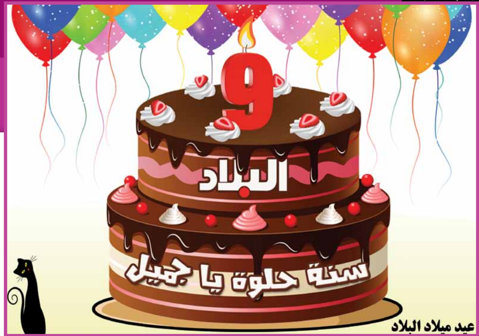
عيد ميلاد البلاد