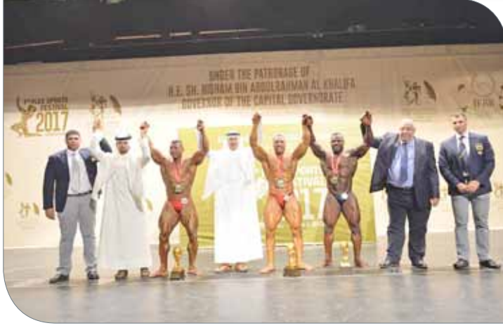
جوانب متنوعة من المهرجان والتتويج

وشهد اليوم الأول من المهرجان بثاً مباشراً من قبل قناة البحرين الرياضية التي واكبته الحدث، كما قامت قناة اليوتيوب التابعة للمهرجان بنقل المنافسات، وشهدت القناة في اليوم الأول تواجد أكثر من 1500 مشاهد. الجدير بالذكر أن المهرجان أقيمت نسخته الأولى عام 2004، ويشهد في كل عام مشاركة واسعة محلياً وخارجياً.