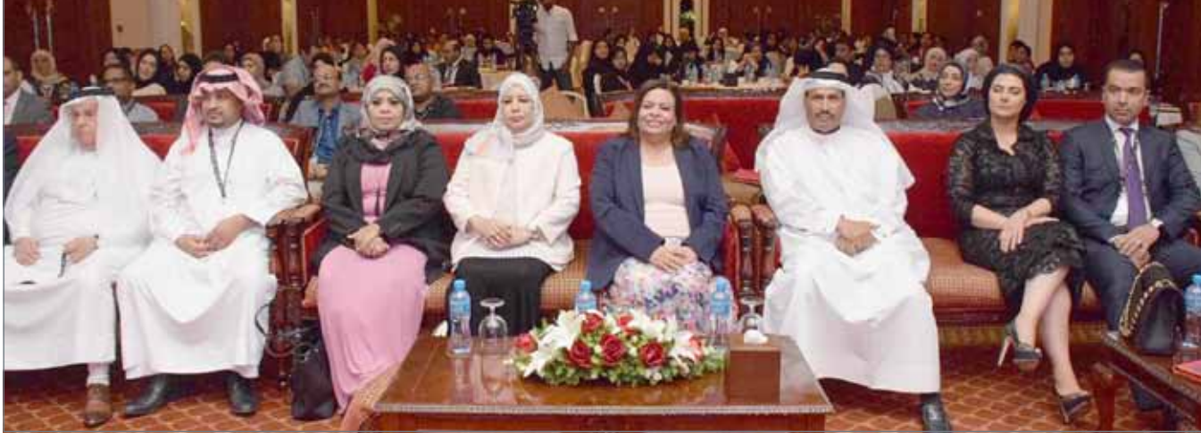
● جانب من الافتتاح