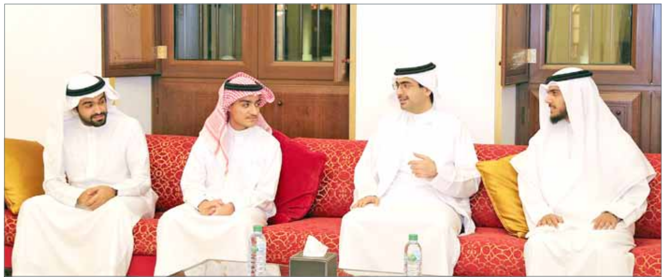
• سمو الشيخ خليفة بن علي بن خليفة مستقبلاً الشابين عبدالله عيسى جناحي وعلي عيسى

لدى استقباله عبدالله جناحي وعلي عيسى... سمو محافظ الجنوبية: