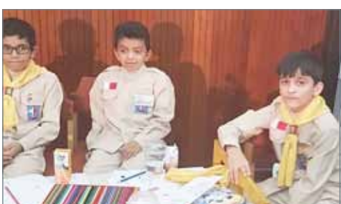
• معلمون بحرينيون يتطلون بالخبرة والكفاءة بالمعهد • المعهد يقدم لطلبته خدمات تربوية تعليمية