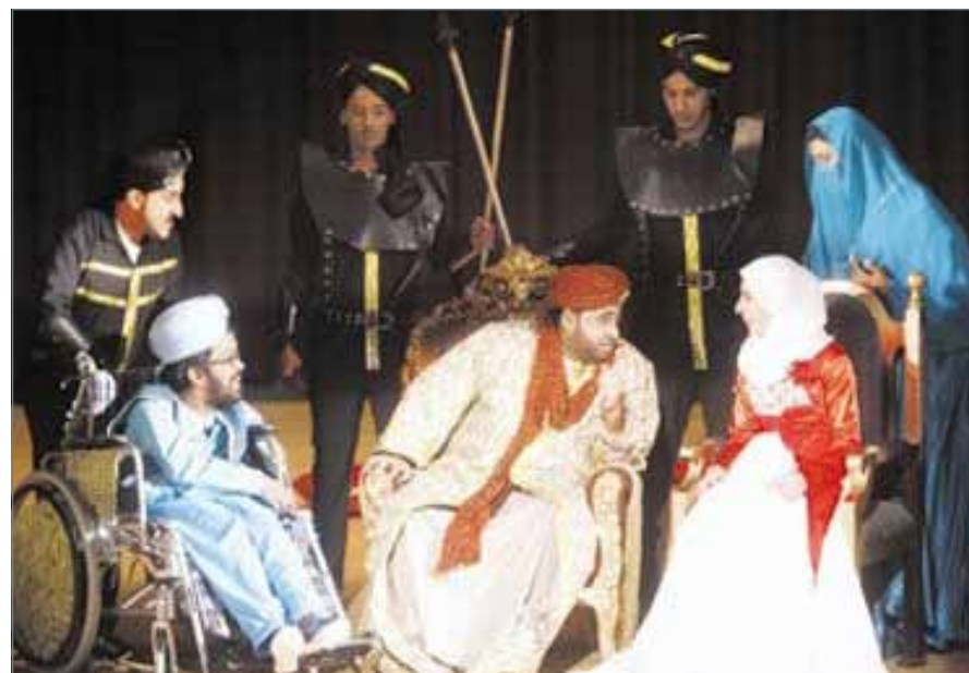
جانب من المشاركات المسرحية

ما زالت النوبات تحضر من وقت لآخر مع ارتفاع البرودة في الشتاء أو اشتداد الرطوبة في الصيف، ولكنها لم تعد تُقعدني أو تُعيقني.