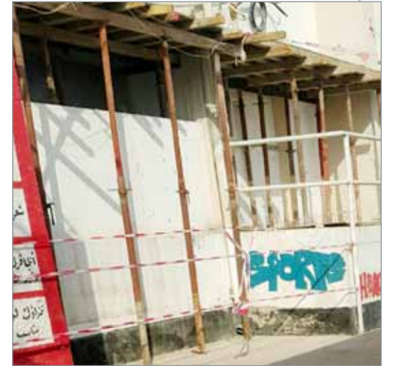
• نصب دعائم حديدية لتثبيت مبنى بالمدرسة (صورة من ولي أمر طالبة)

شهدت مدرسة أميمة بنت النعمان الثانوية للبنات بمدينة عيسى حالة طوارئ ترتبط بأمن وسلامة البنية التحتية للمدرسة. وقال أولياء أمور طالبات لـ "البلاد" إن لجنة مختصة بوزارة التربية والتعليم عاينت مبنى بالمدرسة، وأمرت بإجلاء الطالبات والمعلمات منه فوراً. ولفتوا إلى أن وضع المبنى خطر جدا ومرشح لأن يكون أيلا للسقوط. وذكروا بأنه تقرر نقل مكاتب معلمات المبنى الآيل للسقوط للصالة الرياضية. أما الطالبات، فجرى إخلاؤهم بوقت