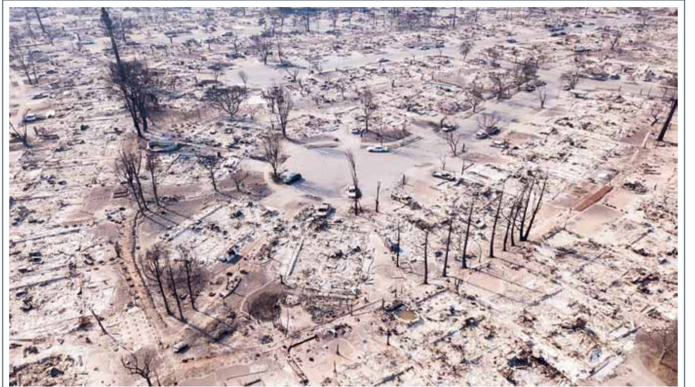
صورة جوية لحرانق الغابات في حديقة في سانتاروزا بولاية كاليفورنيا يوم الجمعة، والتي تعد من أعنف حرائق الغابات في تاريخ الولاية مع ارتفاع عدد القتلى إلى 35 شخصاً وتدمير ما يقدر بنحو 5700 منزل وشركة مما أجبر السلطات على إجلاء 25 ألف شخص على الأقل

حالة الطقس الطقس المتوقع اليوم سيكون معتدلاً بوجه عام. الرياح شمالية غربية من 7 إلى 12 عقدة وتصل من 13 إلى 18 عقدة أحياناً. ارتفاع موج البحر من قدم إلى قدمين قرب السواحل ومن 2 إلى 4 أقدام في عرض البحر. درجة الحرارة العظمى 36، والصغرى 25 درجة مئوية.