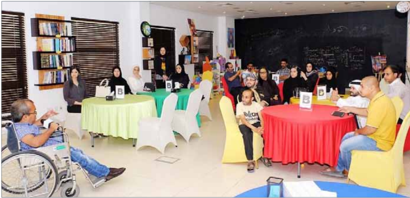
صالح يقدم إحدى محاضراته في التنمية البشرية

غير أن ما منح لي من فرصة عمل لم تكن سهلة الأداء على النحو الذي يفترض أن تكون. فهذه