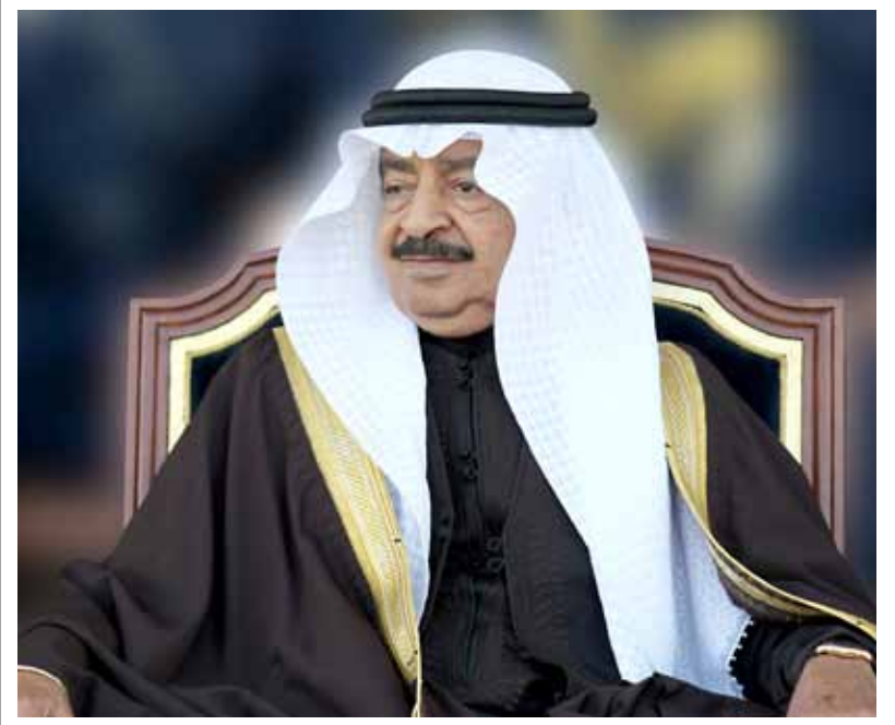
بقلم: الدكتور عبدالله الحواج

المنامة - بنا: تحت رعاية رئيس الوزراء صاحب السمو الملكي الأمير خليفة بن سلمان آل خليفة، تنظم جمعية الأطباء البحرينية مؤتمر الخليج للأحياء الدقيقة والأمراض المعدية في نسخته الثانية على التوالي في البحرين، ويقام بالتعاون مع الجمعية السعودية للأمراض المعدية والكائنات الدقيقة، وجمعية الإمارات الطبية للأمراض المعدية خلال الفترة 1 حتى 4 نوفمبر المقبل في فندق الخليج. ويهدف المؤتمر إلى تبادل الخبرات ومناقشة الحالات الغريبة والنادرة وطرق علاجها بحسب المعايير العالمية وآخر ما توصل إليه الطب الحديث في هذا المجال بهدف تعزيز مهارات ومعارف الأطباء في مجال مكافحة الأمراض وتزويدهم بأحدث المعلومات الطبية والصحية، وبما يدعم جهود الارتقاء بالقطاع الصحي، وتقديم الخدمات الصحية والطبية وفقاً لأرقى المعايير العالمية. ويشارك في الحدث الطبي العالمي نحو 500 ممارس صحي من مختلف التخصصات الصحية بالمنطقة والوطن العربي، إضافة إلى 78 متحدثاً من مختلف أنحاء العالم، 5 من مملكة البحرين