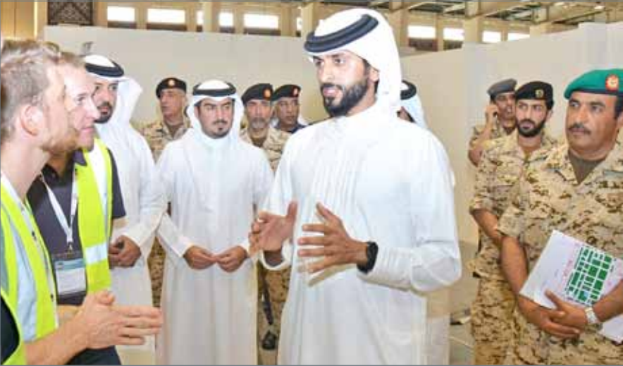
• سمو الشيخ ناصر بن حمد يطلع على الاستعدادات والتجهيزات لمعرض ومؤتمر "BIDEC"

البحرين الباسلة لإنجاح معرض ومؤتمر "BIDEC" في إطار دورها الوطني المشهود في تعزيز الأمن والاستقرار، ودعم جهود التنمية المستدامة، بما يتماشى مع المشروع الإصلاحي الشامل لصاحب الجلالة الملك، ورؤية البحرين الاقتصادية 2030.