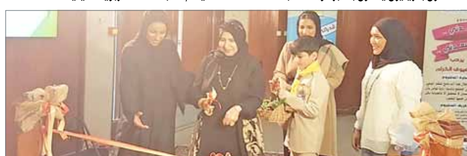
• نظم معهد الأمل احتفالا بمناسبة يوم الغذاء العالمي