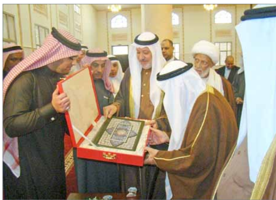
• تقديم هدية لسمو رئيس المجلس الأعلى للشؤون الإسلامية لمناسبة افتتاح جامع سترة