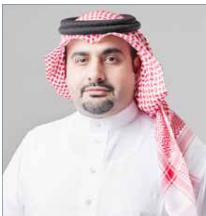
• الشيخ ناصر بن محمد آل خليفة

وأظهرت النتائج أن 82 % ممن شملهم الاستطلاع راضون عن خدمات الخطوط الثابتة المقدمة لهم، وأن 90 % راضون عن خدمات الهواتف المتحركة المقدمة لهم، وأن 84 % سعداء بخدمات الإنترنت المقدمة لهم.