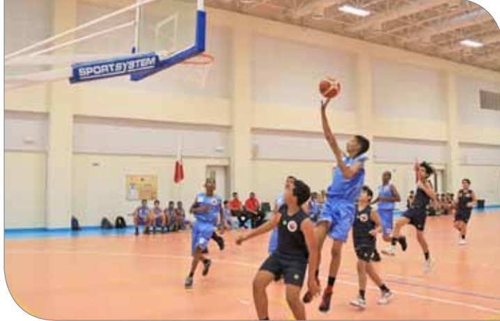
جانب من منافسات الدوري

التنافس الشريف والتميز والتحلي الأهداف التي رسمها الاتحاد بالأخلاق الرياضية العالية، وتحقيق البحرين للعبة.