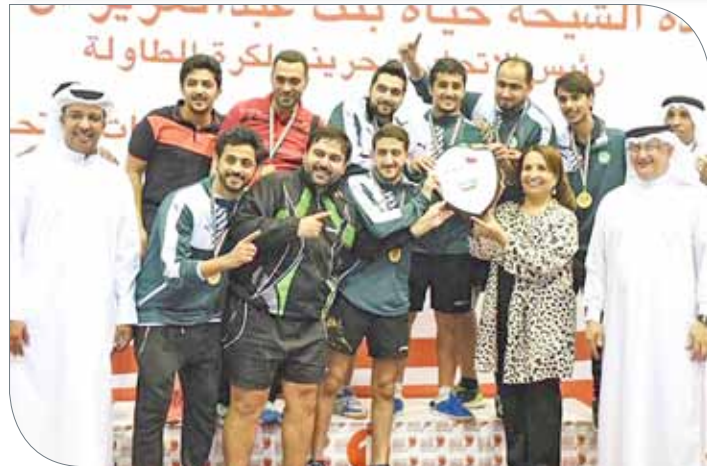
فريق نادي البحرين لكرة الطاولة