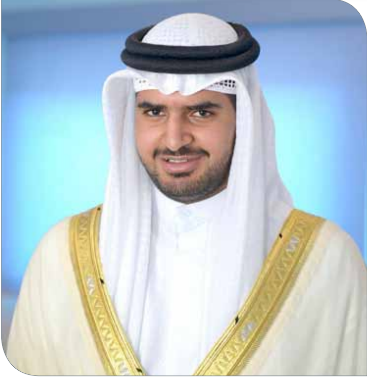
سمو الشيخ عيسى بن علي بن خليفة

التنافس الشريف والتميز والتحلي الأهداف التي رسمها الاتحاد بالأخلاق الرياضية العالية، وتحقيق البحرين للعبة.