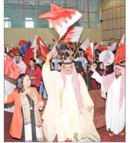
الفوز يؤكد حجم التطور الذي تشهده المسيرة التعليمية