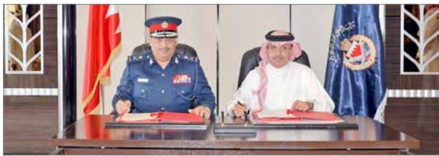
رئيس الأمن العام ورئيس هيئة التشريع والإفتاء القانوني يوقعان مذكرة التفاهم

مضيفاً أن مذكرة التفاهم، تأتي في سياق الحرص على تعزيز التعاون وتنفيذ مشاريع مشتركة. وتؤكد مذكرة التفاهم سعي الطرفين إلى الاستفادة من الخبرات القانونية والعملية لكليهما من خلال التعاون البناء بينهما بما من شأنه إثراء منظومة العمل القانوني والشرطي من ناحيتين العلمية والعملية بجانب دعم أواخر التعاون على جانب التدريب الأكاديمي ذي البعد التطبيقي