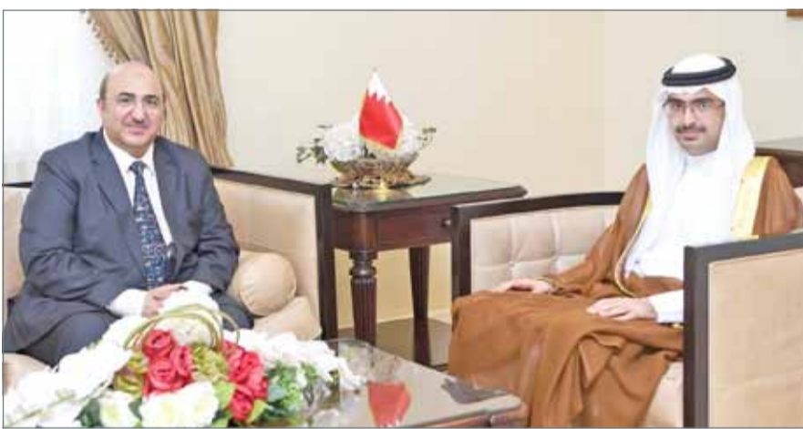
• سمو الشيخ خليفة بن علي بن خليفة مستقبلاً رئيس الجمعية الفلكية البحرينية

بحث مدى إمكان الاستفادة من دراسات وأبحاث بعض الطلبة وبلورتها إلى مشاريع واقعية. وأشاد سمو الشيخ خليفة بن علي آل خليفة بالإسهامات والجهود العلمية الكبيرة المخصصة التي يتمتع بها الناصر وما يقدمه من معرفة وعلوم أثرت الساحة العلمية البحرينية وهبات الأرض الخصبة لإبراز جيل بحريني متمكن في مجال الفيزياء وعلم الفلك. من جانبه، قدم الناصر لسمو محافظ المحافظة الجنوبية مجموعة من الإصدارات والكتب الحديثة التي قام بالعمل عليها، شاكرًا ومقدراً لسموه اهتمامه ودعمه اللامحدود للعلم والعلوم في مختلف الأصعدة.