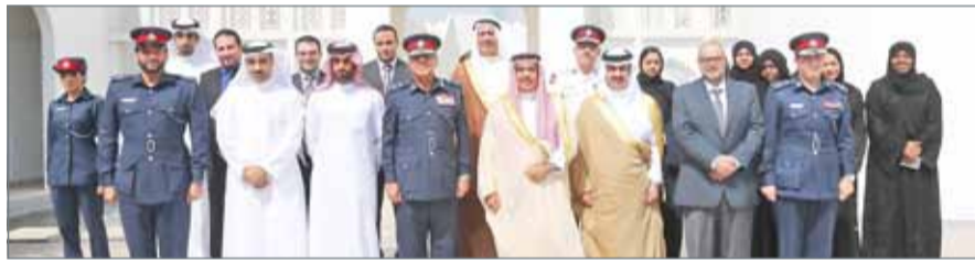
وزير الداخلية مستقبلاً فريق إدارة تنفيذ الأحكام بالشؤون القانونية

أما فريق التميز المؤسسي بالموارد البشرية فكان تقدم بـ 3 ترشحات ضمن جائزة "سنتيفي العالمية" في مجال الإبداع والتميز المؤسسي وذلك بقطاع "المرأة في مجال العمل" عكست التطبيق العملي للتميز المؤسسي والتطوير في مجال العمل الذي تنتهجه الموارد البشرية طبقاً للمعايير العالمية مما أهلها للفوز بالجوائز الثلاث بعد خضوع الأعمال للتحكيم الدولي، على أن يتم تسليم الجوائز في حفل عالمي يعقد في مدينة نيويورك 17 نوفمبر المقبل.