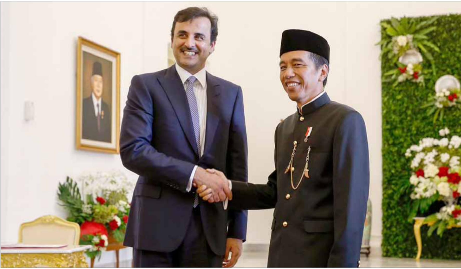
الرئيس الإندونيسي جوكو ويديدو مستقبلا أمير قطر بالقرع الرئاسي في العاصمة جاكارتا.

بغداد - وكالات: وصلت أول طائرة سعودية، أمس الأربعاء، إلى بغداد للمرة الأولى منذ 27 عاما، وفق وزارة النقل العراقية. وقال بيان لوزارة النقل نقلته وسائل الإعلام إن "مطار بغداد الدولي استقبل أول طائرة سعودية بعد توقف دام 27 عاما"، مبينا أن "هذه الطائرة تابعة لشركة ناس السعودية للطيران". وكان وزير النقل العراقي كاظم فحجان الحمادي، قد التقى الثلاثاء، سفير المملكة العربية السعودية في العراق، عبدالعزيز الشمري، لبحث تعزيز العلاقات الثنائية بين البلدين في مجال النقل. وقال الحمادي إنه "في إطار التعاون المشترك بين العراق والسعودية تم توقيع مذكرة تفاهم مشتركة بين الطرفين لتنظيم خدمات النقل الجوي وتقديم الخدمات الأرضية كافة لطائرات المملكة وبالعكس"، مؤكدا أن العراق يسعى للانفتاح على جميع دول العالم خصوصا الإقليمية، مشيرا إلى أن "هناك مصالح مشتركة مع الأشقاء السعوديين ونحن بصدد فتح آفاق جديدة للتعاون بمختلف مجالات النقل". كما ذكر أنه تم الاتفاق على تسيير رحلات جوية من مطارات المملكة إلى المطارات العراقية، لافتا إلى أن "الأربعاء سيشهد هبوط طائرة شركة (ناس) السعودية في مطار بغداد الدولي تليها طائرة أخرى من الملكية السعودية".