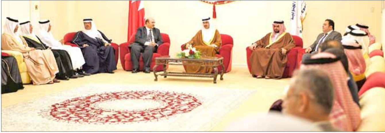
• سمو الشيخ خليفة بن علي بن خليفة متحدثاً في المجلس الأسبوعي بحضور وجهاء وأعيان المحافظة

عيسى بن علي المدرسية لكرة السلة والتي من شأنها اكتشاف المواهب الشابة وتهيئة الأجواء للتعرف والمنافسة الشريفة بين طلبة المدارس. وأكد سموه أهمية تبادل الأحاديث والآراء مع مختلف شرائح المجتمع والالتقاء بهم بصورة مستمرة للاطلاع عن قرب لأهم الاحتياجات والملاحظات التي يرصدونها خلال حياتهم المعيشية اليومية، مشيراً سموه إلى الأهمية الكبيرة التي تعززها عادة التواصل في تماسك المجتمع وتوطيد العلاقات بين مختلف مكوناته. من جانبهم، عبر رواد المجلس عن إشاداتهم برؤى وتطلعات سمو محافظ الجنوبية مؤكداً أنهم سيكونون العون والسند في إيصال الملاحظات التي من شأنها تنمية وتطوير جميع أرجاء المحافظة.