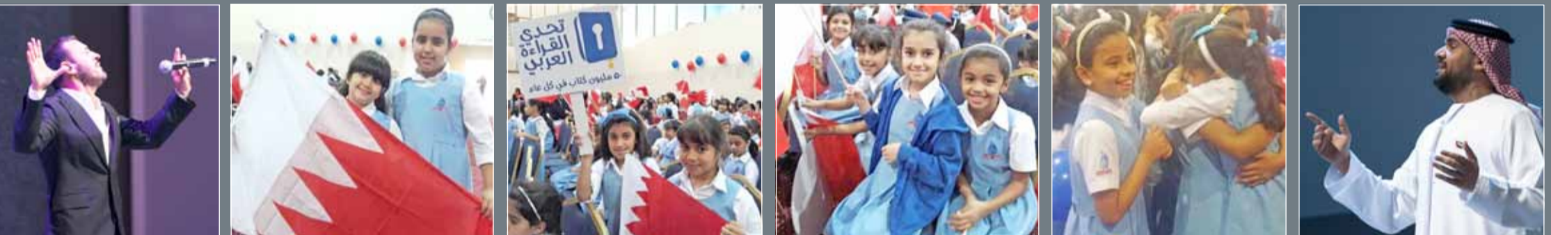
الفنان المبدع حسين الجسمي وقصر الغناء العربي كاظم الساهر أحييا حفل تحدي القراءة... وفرحة وعناق الفوز لطالبات مدرسة الإيمان

توج نائب رئيس دولة الإمارات رئيس مجلس الوزراء حاكم دبي صاحب السمو الشيخ محمد بن راشد آل مكتوم "مدراس الإيمان" من البحرين التي نالت لقب "المدرسة الأولى" في تحدي القراءة العربي، وفازت بجائزة المليون دولار. وتفوقت المدرسة البحرينية على كل من "مدارس الحصاد التربوي"، من الأردن، التي حلت ثانياً، و"مدارس الإمارات الوطنية" في الإمارات التي جاءت في الترتيب الثالث. واستطاعت "مدارس الإيمان" أن تتميز خلال مسيرة التحدي من خلال تنظيم العديد من الفعاليات والمبادرات