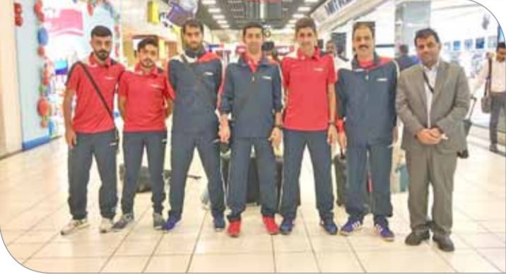
وفد نادي سار