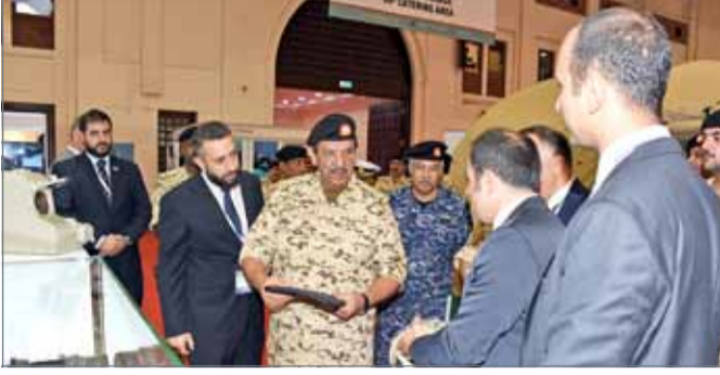
القائد العام في جولة بالمعرض

مكافحة لتنظيم مختلف الفعاليات على المستويات كافة، وما تمتلكه من طاقات وكوادر فعالة وتاريخ طويل في تنظيم الفعاليات الدولية مما يعبر عن تميزها في إقامة المعارض والمؤتمرات، ويعكس الازدهار الذي تشهده اليوم، والذي جعل من البحرين محط أنظار العالم لتسجل نجاحاً جديداً ومهما يضاف إلى النجاحات التي تحققت بتنظيم المعارض العالمية. كما أشاد بالنجاح الكبير الذي حققه المعرض والمؤتمر في نسخته الأولى، مؤكداً اعتزازه بالجهود المخلصة التي ساهمت في نجاحه وظهوره بالمستوى المرتفع، موضحاً أن الاستضافة تصاف إلى سجل إنجازات قوة دفاع البحرين التي دأبت على الدوام لتنظيم كبرى الفعاليات في جميع المستويات، واعتادت على تحقيق الإنجازات الرفيعة المتواصلة بسواعد رجالها الأوفياء الذين أبدعوا في صناعة النجاح في جميع المجالات، وامتداداً لسلسلة من المعارض والفعاليات الدولية، ومنها معرض البحرين الدولي للطيران.