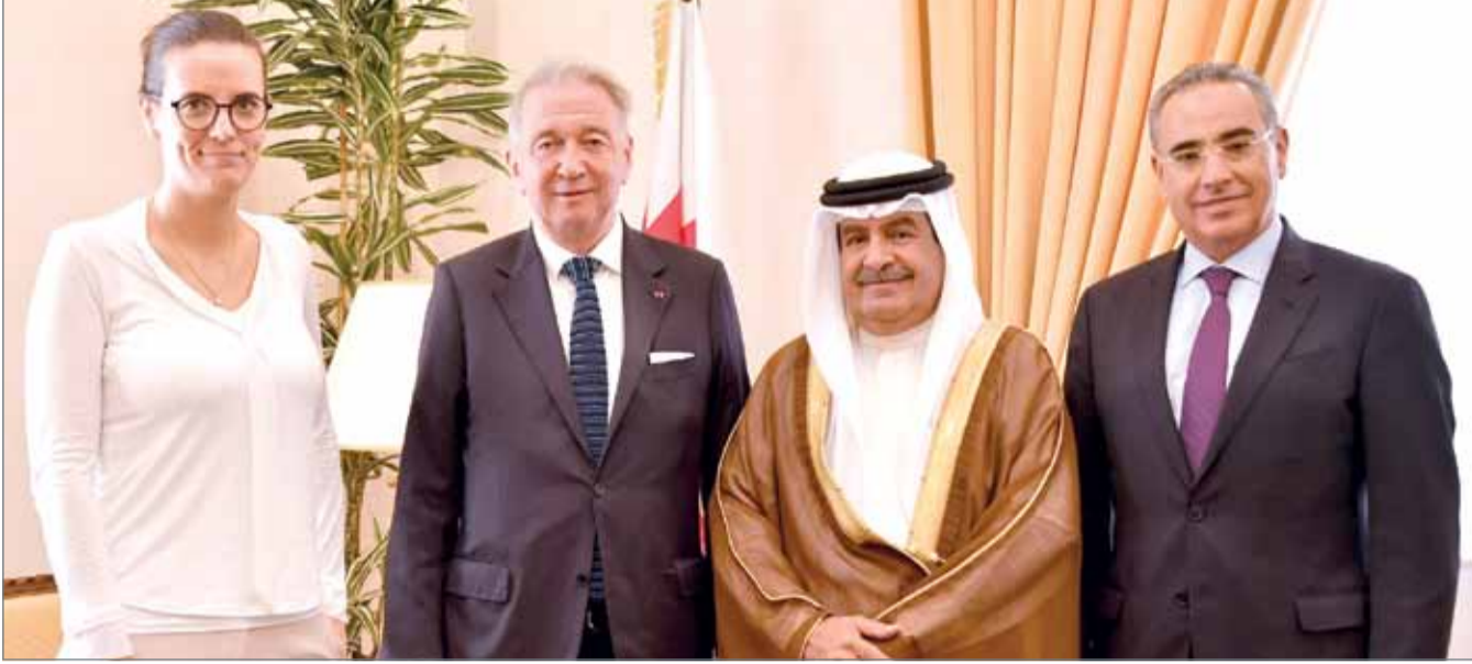
• سمو نائب رئيس مجلس الوزراء مستقبلاً مدير معهد السلام الدولي

على المستوى العالمي، ونوه سموه بمستوى التعاون القائم بين مملكة البحرين ومعهد السلام الدولي من خلال المؤتمرات والندوات التي ينظمها المعهد، مؤكداً حرص المملكة على تعزيز هذا التعاون على كافة الأصعدة. من جانبه، أعرب تيري لارسون عن خالص شكره وتقديره للمملكة على الدعم والمساندة التي تحظى بها مؤسسات الدراسات والبحوث في مجال السلام الدولي وتقدير كل العون في سبيل تحقيق الأهداف المنشودة، مؤكداً اهتمام المعهد بتطوير التعاون القائم مع كافة المراكز والجهات المعنية في البحرين.