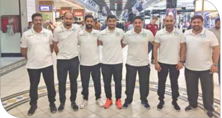
وفد نادي البحرين المغافر إلى الأردن

نادي البحرين سيشارك في النسخة الأولى من بطولة غرب آسيا بهدف المنافسة على المركز الأول وليس