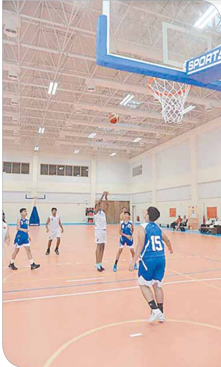
جانب من منافسات البطولة