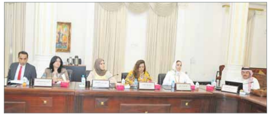
• تكليف مكتب هندسي لإعداد التصاميم

أشار مدير عام أمانة العاصمة الشيخ محمد بن أحمد آل خليفة بأن سوق جدحفص المركزي سيكون في موقعه وهناك شركة مختصة لإعداد التصاميم، إذ سيتم إزالة الإشغالات المخالفة على جهة شمال السوق. وقال "قمنا بزيارة برفقة وكيل الوزارة لشؤون البلديات في وزارة الأشغال وشؤون البلديات والتخطيط العمراني نبيل أبو الفتح وتم تكليف مكتب هندسي لإعداد التصاميم الأولية لتطوير مشروع سوق جدحفص في موقعه الحالي".