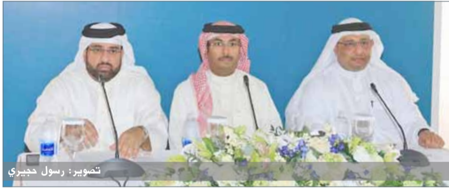
تصوير: رسول حبيري