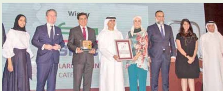
• مدير عام التصنيع يتسلم الجائزة

فوزها بهذه الجائزة الأخيرة إلا تأكيد على سلامة النهج الذي تتبناه، ودقة رؤيتها الإستراتيجية في