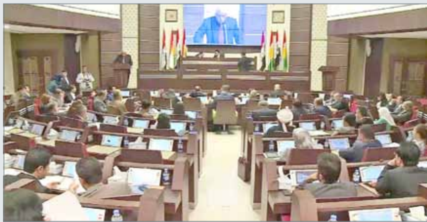
جانب من جلسة برلمان كردستان

وذكر الموقع أن من غير الواضح ما إذا كانت هذه الخطوة بداية لفرض إقامة جبرية على خاتمي، كما حدث مع زعماء الحركة الخضراء، أم أنه احتجاج مؤقت، لكنه أكد أن عناصر الأمن حضروا إلى منزل خاتمي، وأبلغوه أنه ممنوع من الخروج من المنزل بشكل تام. كما انتشرت 3 سيارات تابعة للأمن الداخلي، إضافة إلى عدد من عناصر الأمن أمام منزل رئيس إيران الأسبق، وأبلغوا عناصر حمايته أن خاتمي ممنوع من الخروج من المنزل، بحسب "سحام نيوز". ويخضع زعيم التيار الإصلاحي محمد خاتمي، لحظر إعلامي منذ بداية شهر أكتوبر الجاري، بقرار من المحكمة الخاصة برجال الدين، التي يرأسها إبراهيم رئيسي، زعيم "جبهة قوى الثورة" المتشددة والمقرب من المرشد الأعلى علي خامنئي، والتي منعت خاتمي من النشاط السياسي والإعلامي والثقافي لمدة 3 أشهر.