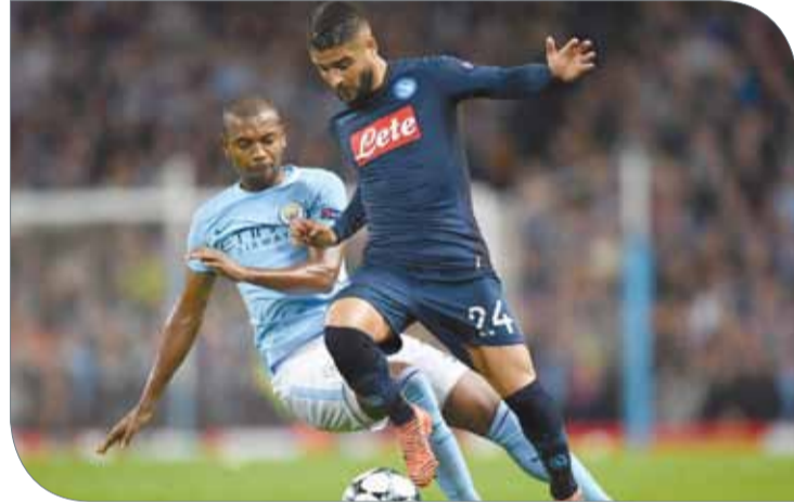
من مواجهة سيتي و نابولي

8 جولات. وأضاف ساري "المنافس يستحق الإشادة على طريقة بدء المباراة وأسلوبه الفني وسرعته، تحركات الخصم كانت رائعة، لكن في الوقت ذاته فإننا لم نرفض الضغط الكافي". وتابع: "لكن كل التحية للاعبين على الخروج من هذا الموقف أمام فريق يدمر كل من يقف أمامه، أشعر ببعض المرارة من النتيجة، لكننا أظهرنا أن بوسعنا التنافس على هذا المستوى".