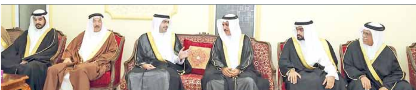
• سمو محافظ الجنوبية لدى زيارته عدداً من مجالس الرفاع

احتياجات الأهالي والمناطق المقيمين فيها من خدمات ومرافق. كما تناول سموه معهم الأحاديث والموضوعات التي يمكن من خلالها الخروج بمقترحات وتصورات تعزز الشراكة المجتمعية بين المحافظة الجنوبية والأهالي والتي يمكن من خلالها تنفيذ برامج وفعاليات تساهم في ترسيخ التاريخ العريق الذي تترخ به المحافظة الجنوبية. وأشار سموه إلى أن ما تم تناوله وطرحه في جميع الزيارات التي يقوم بها سموه ستكون موضع اهتمام وأولوية للدراسة وتطبيقها في أفضل الممارسات المحققة لتطلعات الجميع. من جانبهم، أكد أصحاب المجالس وروادها دعمهم ومشاركتهم المطلقة لمبادرات و جهود سمو محافظ المحافظة الجنوبية المادفة إلى تطوير المحافظة وتحقيق تطلعات قاطنيها.