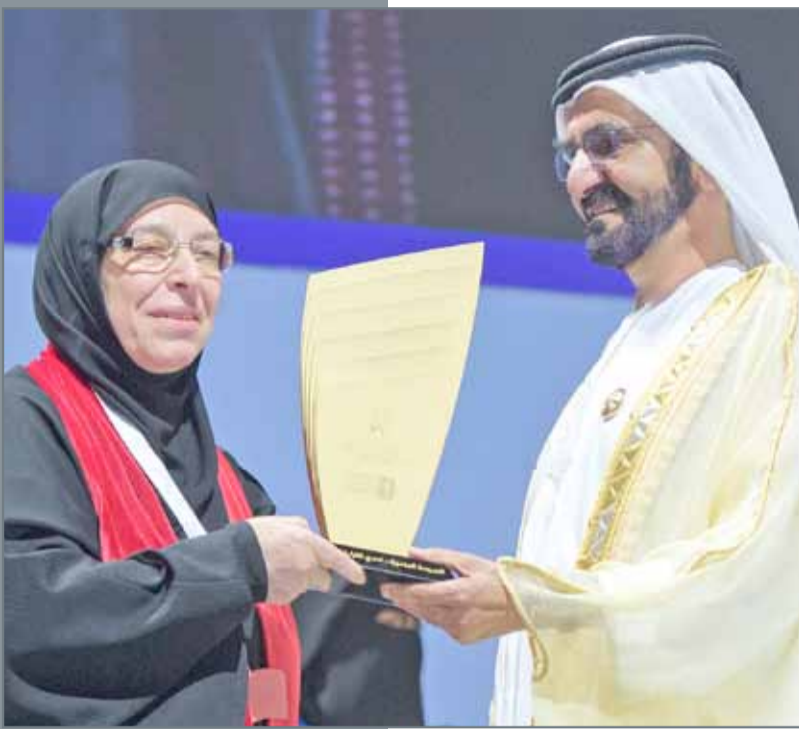
استطاعت مدارس الإيمان التميز بمسيرة التحدي