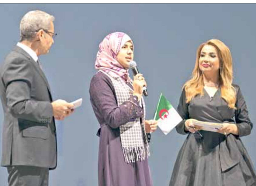
قدمت حفل الفائزين بتحدي القراءة العربي الإعلامية البحرينية برون جيب

نائب رئيس دولة الإمارات يُكّرّم المدرسة الأولى عربياً