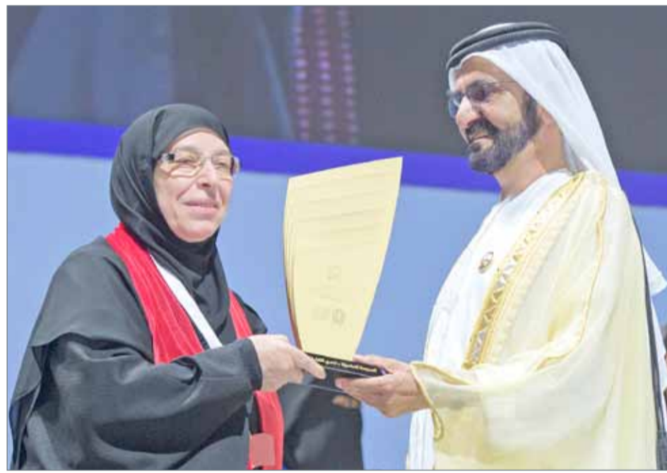
استطاعت مدارس الإيمان التميز بمسيرة التحدي

مدينة عيسى - وزارة التربية والتعليم: حققت مملكة البحرين إنجازاً تعليمياً باهراً بحلول مدرسة الإيمان الخاصة - فرع البنات على المركز الأول في تحدي القراءة العربي في دورته الثانية، متفوقة على 41 ألف مدرسة مشاركة في هذا التحدي من العديد من الدول. وأكد جلالة الملك وسمو رئيس الوزراء وسمو ولي العهد أن الجائزة المرموقة تعكس جودة الخدمات التربوية والتعليمية في البحرين. وكان نائب رئيس دولة الإمارات العربية المتحدة الشقيقة رئيس مجلس الوزراء حاكم دبي صاحب السمو الشيخ محمد بن راشد آل مكتوم قد كرم المدرسة في الحفل الختامي للتحدي، والذي أقيم في إمارة دبي أمس الأربعاء.