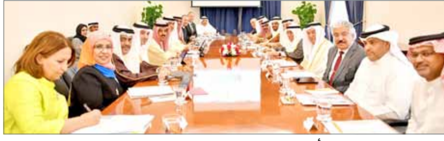
سمو الشيخ محمد بن مبارك يترأس اجتماع المجلس

العام لنظام التلمذة المهنية، ومشروع الاستراتيجية الوطنية للإرشاد والتوجيه المهني، حيث وجه سمو الشيخ محمد بن مبارك آل خليفة بالاستمرار في متابعة وإنجاز المشاريع وتقديم عرض للمجلس حول شراكة مختلف الجهات الحكومية في تنفيذها. واعتمد المجلس تقرير هيئة جودة التعليم والتدريب المتضمن نتائج عملية مراجعة أداء المدارس الحكومية ضمن دورتها الثالثة ونتائج مراجعة أداء المدارس الخاصة ضمن دورتها الثانية، حيث بينت النتائج ارتفاع عدد المدارس الحكومية والخاصة التي حققت تقدير "ممتاز" مقارنة بالدورات السابقة. كما استعرض المجلس نتائج عملية مراجعة أداء مؤسسات التدريب المهني ضمن دورتها الثالثة بالإضافة إلى نتائج المرحلة الثانية من عملية مراجعة البرامج الأكاديمية في مؤسسات التعليم العالي ونتائج الإدراج المؤسسي وتسكين المؤهلات على الإطار الوطني، موجهاً سموه بضرورة الاعتماد على نتائج التقارير في تطوير أداء المؤسسات التعليمية والتدريبية.