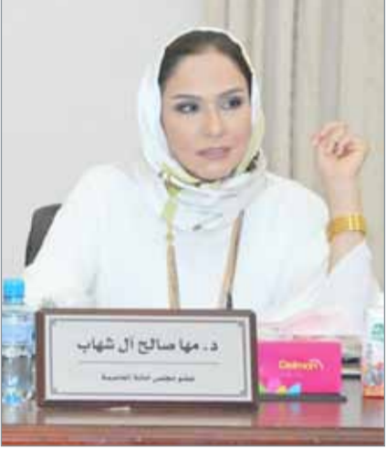
• للإسراع بتطوير السوق

ولتخاذ عدد من الإجراءات لتنمية المشاريع البلدية المتمثلة في الأسواق المركزية من خلال حصر احتياجاتها وإيجاد الميزانية اللازمة لصيانتها.