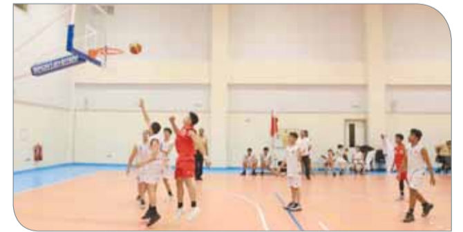
لقطة من المنافسات

تستكمل اليوم مباريات الجولة الرابعة من بطولة سمو الشيخ عيسى بن علي المدرسية الأولى لكرة السلة، حيث تقام في الثالثة والنصف بعد الظهر مباراة تجمع فريقي مدرسة عراد الإعدادية مع مدينة حمد الإعدادية، فيما تجمع المباراة الثانية فريقي مدرسة النسيم الدولية ومدرسة مدينة حمد الابتدائية الإعدادية "الجديدة" بالساعة الخامسة والنصف مساءً. ويعمل فريق مدرسة عراد على مواصلة سلسلة الانتصارات التي بدأها منذ الجولة الثانية؛ لضمان تأهله للدور قبل النهائي من البطولة، خصوصاً في ظل ما يمتلكه الفريق من إمكانات فنية عالية بوجود عدد من اللاعبين المميزين القادرين على ترجمة توجيهات الجهاز الفني بصورة طيبة داخل الملعب، فيما سيعمل فريق مدرسة مدينة حمد على مجاراة خصمه، والسعي إلى تقديم مستوى فني أفضل من الجولات الماضية، ومحاولة تحقيق نتيجة إيجابية على الرغم من صعوبة المهمة. وفي اللقاء الثاني يدخل فريقاً مدرسة النسيم الدولية ومدرسة مدينة حمد الابتدائية الإعدادية "الجديدة" هذه الجولة؛ من أجل تقديم مستوى أفضل من الجولات الماضية، وتحقيق الفوز الأول لهما، خصوصاً وأن الفريقين لم يذوقا طعم الفوز منذ انطلاق البطولة، وبات خارج دائرة المنافسة على بلوغ الدور قبل النهائي بعد سلسلة من الهزائم في اللقاءات السابقة.