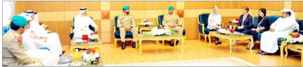
سمو الشيخ ناصر بن حمد مستقبلاً، بحضور سمو الشيخ خالد بن حمد، الشيخ عبدالله بن أحمد

هاتون ديميرير التي قدمت لسموه وفداً من وزارة الدفاع التركية. واستقبل سموه أيضاً بحضور سمو الشيخ خالد بن حمد آل خليفة مستشار الرئيس اليمني ممثل اليمن في قوة التحالف العربي الفريق الركن محمد علي المقدشي. كما استعرض سموه مع المسؤول العسكري اليمني أهم التطورات والمستجدات على الساحتين الإقليمية والدولية. كما استقبل سموه بحضور القائد العام سمو الشيخ خالد بن حمد آل خليفة، مفتش البحرية الملكية بالمملكة المغربية الشقيقة الاميرال بحري مصطفى العلمي. واستقبل سموه بحضور القائد العام سمو الشيخ خالد بن حمد آل خليفة، كلاً من نائب رئيس شركة ايفريس الاسبانية ليون بيطار والمدير الإقليمي للشركة ذياب مصطفى. وقدم ممثلو الشركة هدية تذكارية لسمو الشيخ ناصر بن حمد آل خليفة بمناسبة مشاركتهم في المعرض.