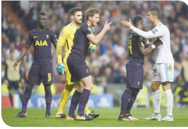
من مواجهة ريال وتوتنهام

أيضا. وواصل: "كرة القدم هي كرة القدم. أداء هوجو اليوم كان رائعاً. يستحق تقديراً خاصاً. أقول إنه ضمن الأفضل في البريميرليج واليوم سنحت لنا الفرصة لرؤية لماذا هو أحد الأفضل في العالم. كان المستوى خيالياً."