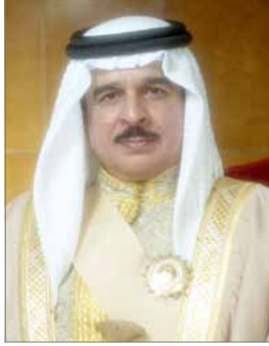
• جلالة الملك

الكوكبة من القادة والخبراء العسكريين، وبما أسفر عنه من نتائج إيجابية كبيرة