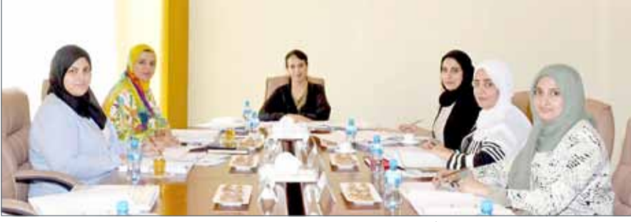
• سمو الشيخة حصة بنت خليفة تتراأس اجتماع لجنة الجائزة

والالتزام به، والجهات التي تم التعاون معها أو الداعمة للمشروع، إلى جانب الفئات المستهدفة من المشروع والآثار الإيجابية المقدمة لهم، والخبرات المكتسبة والحصول على شهادات أو جوائز في مجال عمل المشروع، والإنجازات والإسهامات السابقة لصاحب المشروع أو الفريق في المشروعات التطوعية الأخرى، والمقابلات الشخصية.