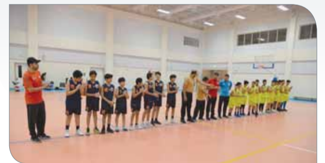
من مراسم دخول الفرق