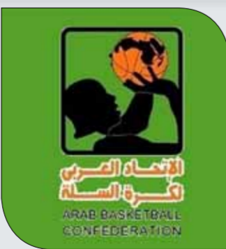
شعار الاتحاد العربي لكرة السلة

◆ تسحب بعد غد السبت قرعة بطولة الأندية العربية الأبطال من جديد بعد توقف دام قرابة 7 سنوات، إذ كانت آخر مشاركة للأندية الوطنية في البطولة تعود إلى عام 2014.