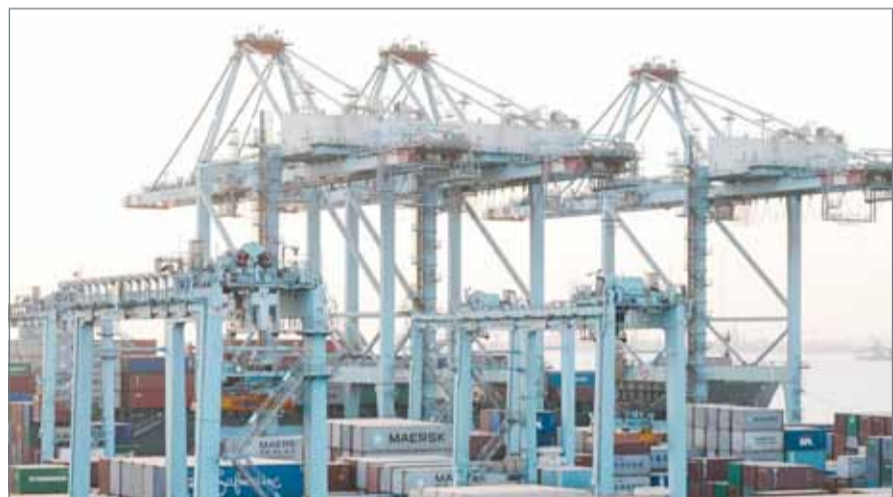
• موقع إستراتيجي لمنطقة البحرين اللوجستية

تحتسناً في 3 مجالات أو أكثر، أحدها كان ”التجارة عبر الحدود“، وهو عامل ذو أهمية قصوى بالنسبة للشركات الصناعية المصدرة لسلعها إلى الأسواق الإقليمية، ويرجع ذلك إلى حد كبير للعمل المستمر في تحسين البنية التحتية وتبسيط الإجراءات على جسر الملك فهد. وتعتبر قطاعات التصنيع والمواصلات والخدمات اللوجستية من أكبر القطاعات المساهمة في اقتصاد البحرين، بنسبة تبلغ 20.3% من الناتج المحلي الإجمالي للعام 2016. إلى ذلك، قال الرئيس التنفيذي لمجلس التنمية الاقتصادية خالد المريجي ”إن التحول الاقتصادي الذي تشهده أسواق دول مجلس التعاون الخليجي يساهم في خلق فرص واعدة للشركات الصناعية والخدمات اللوجستية - ويسعدنا أن نرى كثيراً من المستثمرين في هذا القطاع يختارون البحرين كموقع للوصول إلى هذه الأسواق“، وأضاف ”تساهم مشاريع الاستثمارات في البنية التحتية مثل مشروع تحديث وتوسعة مطار البحرين الدولي، وبناء جسر ثان يصل البحرين بالمملكة العربية السعودية، وإجراء إصلاحات تنظيمية إضافية في تسهيل وصول الشركات العاملة في البحرين إلى أسواق المنطقة، ونتطلع إلى الترحيب بالمزيد من الشركات في السنوات المقبلة“.