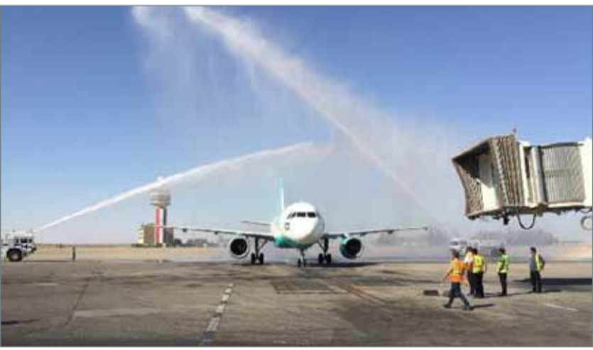
هبوط طائرة تابعة لشركة ناس السعودية في مطار بغداد

بغداد - وكالات: وصلت أول طائرة سعودية، أمس الأربعاء، إلى بغداد للمرة الأولى منذ 27 عاماً، وفق وزارة النقل العراقية. وقال بيان لوزارة النقل نقلته وسائل الإعلام إن "مطار بغداد الدولي استقبل أول طائرة سعودية بعد توقف دام 27 عاماً"، مبيناً أن "هذه الطائرة تابعة لشركة ناس السعودية للطيران". وكان وزير النقل العراقي كاظم فنجان الحمادي قد التقى الثلاثاء سفير المملكة العربية السعودية في العراق عبدالعزيز الشمري، لبحث تعزيز العلاقات الثنائية بين البلدين في مجال النقل.