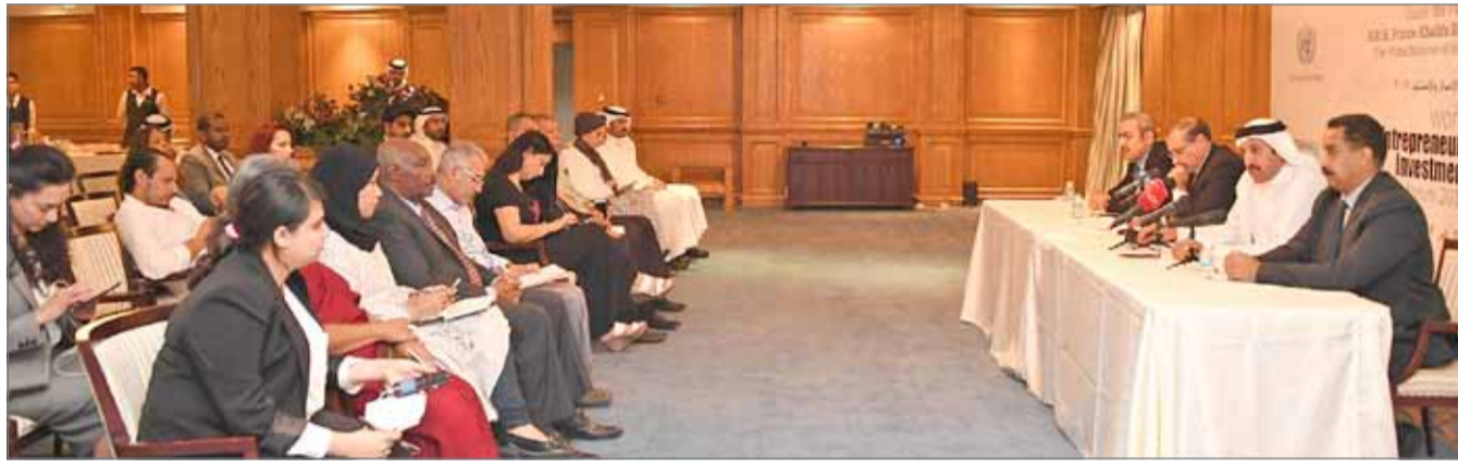
• أثناء المؤتمر الصحافي للإعلان عن المنتدى أمس

ونظراً لحسين إلى أنه خلال إعلان المنامة لرواد الأعمال في العام 2015 اتخذ قرار عقد المنتدى بشكل دوري كل عامين في المنامة، وهناك مقترح لإقامته العام 2018 في تركيا. وذكر أن المنتدى سيضم الإعلان عن إطلاق مبادرة لتمكين المرأة في ريادة الأعمال، وسيتم البدء بالنساء في الدول الإفريقية. ويرتكز المنتدى على ثلاثة محاور رئيسية، وهي: المرأة والصناعة، والاستثمار ذو الأثر، وثالثاً تحالف رواد أعمال لمنظمة الأمم المتحدة لطريق الحرير البري والبحري، كما سيصاحب المنتدى المعرض البحريني لرواد الأعمال برعاية من تمكين وبمشاركة 200 رائد عمل في مختلف المجالات، وسيشمل المنتدى والمعرض منصة للقائات الشائبة (B2B).