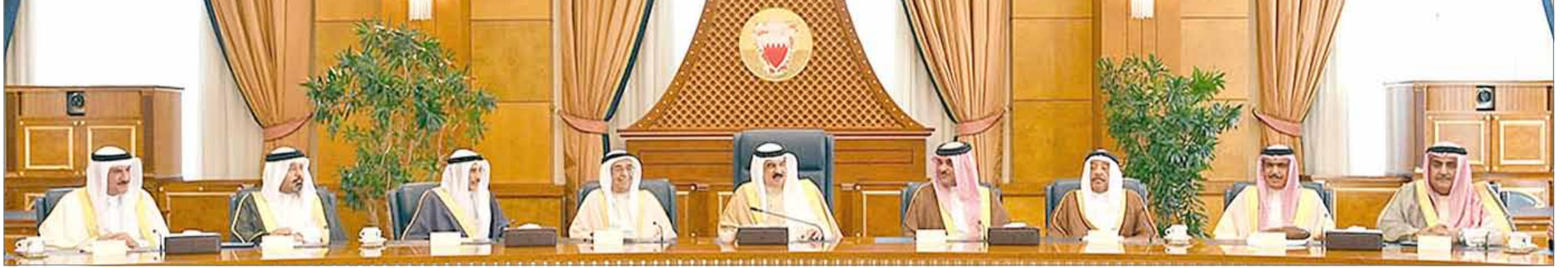
• جلالة الملك مترئسا جلسة مجلس الوزراء أمس