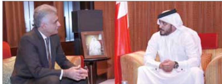
سمو الشيخ خالد بن حمد خلال استقباله جاسم حاجي جاسم

تشجّع وتعزّز ثقافة البحث والتأليف والذي يخدم بدوره رفع مستوى العلمي والمعرفي بالمجتمع البحريني. من جانب آخر، استقبل سمو الشيخ خالد بن حمد آل خليفة الباحث في شؤون التكنولوجيا والثقافة التنظيمية في إدارة الشركات جاسم حاجي جاسم، الذي أهدى لسموه إصداره الجديد من مؤلفه بعنوان "تكنو. إداري انسكلوبيديا"، والذي يتضمن مناقشة للعديد من المواضيع التكنولوجية والاقتصادية والاستثمارية