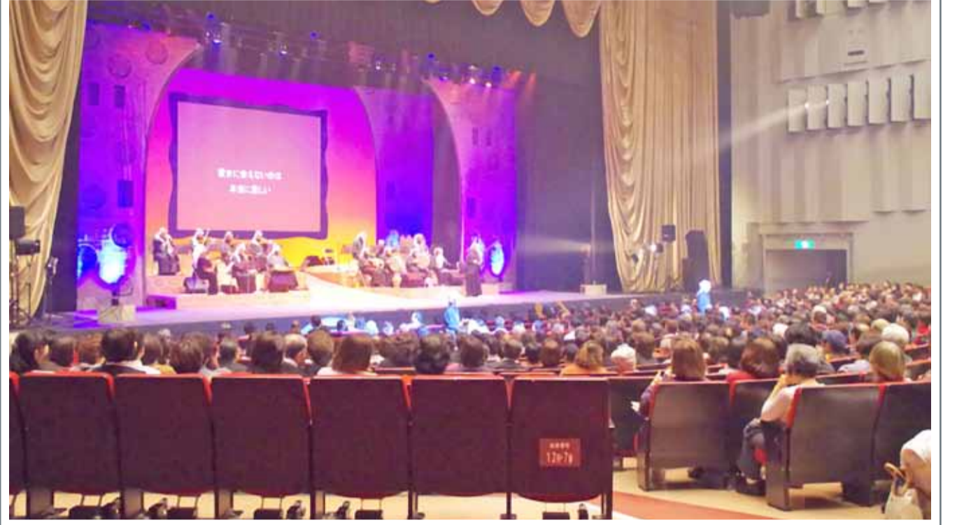
فرقة "محمد بن فارس" تفتتح عروضها الفنية من الأغنيات والألحان المتنوعة التي تنتمي إلى الفلكلور البحريني في عدد من المدن اليابانية، بتنظيم من سفارة مملكة البحرين لدى اليابان وبالتعاون مع هيئة البحرين للثقافة والآثار.