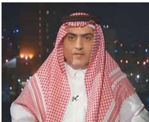
• وزير الدولة السعودي لشؤون الخليج ثامر السبهان

أن ما يربط السعودية بالعراق ليس مجرد الجوار والمصالح المشتركة، وإنما أواصر الأخوة والدم والتاريخ والمصير الواحد. وأضاف العاهل السعودي خلال كلمة له بمناسبة التوقيع على مجلس التنسيق السعودي العراقي "أتطلع أن تسهم اجتماعات مجلس التنسيق السعودي العراقي في المضي إلى أفق أوسع وأرحب".