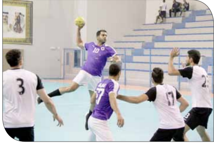
من لقاء باربار وتوبولي