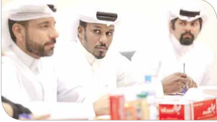
جانب من الاجتماع التسيقي

اللجنة الإعلامية | بطولة العالم لفنون القتال المختلطة