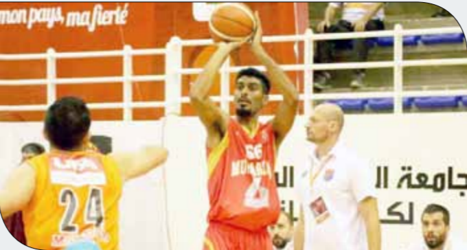
من لقاء المحرق وهومنتن أمس

أخذ لاعبي سماهيج أفضلية نسبية في الأداء عن نظيره النجمة من خلال الشوط الأول أحرر عن تقدمه بالنتيجة 15/16 رغم أن موسمها يهزئ هذا التتوق كان عبر الارتداد السريع للاعبين بعد تألق حارسه أحمد عقيل بن ثنلات دقائق العشرين الدقيقة الأولى كانت الأمور