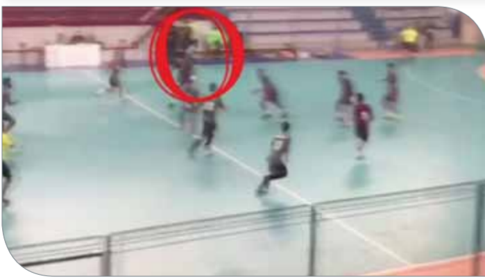
دخول لاعبي التضامن لمنطقة الشباب قبل إرسال الكرة

لهذه الأمور وخصوصاً أنها من صميم مهامها. ولن يجدي اكتشاف هذه الحالة بعد انتهاء اللقاء نفعاً في ظل عدم وجود نص قانوني يفيد بإلغاء الهدف، ولكن هناك صدارة أثير يجب على لجنة الحكام أن تعود لشرطي اللقاء، وهي أن الهدف ورغم عدم شرعيته للحالة المذكورة أعلاه، فهناك شك أيضاً في تسجيله بعد انتهاء الوقت الأصلي للمباراة، وهذا يجب على الحكمن أن يكونوا أكثر تركيزاً