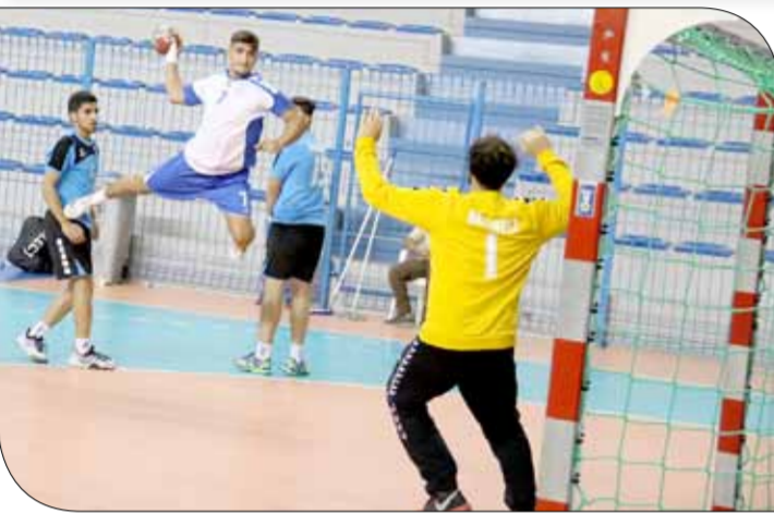
من لقاء سماهيج والنجمة

لم يكتب لها النجاح بسبب الاستعجال من جهة وضيق الوقت من جهة أخرى ليتبني اللقاء، أدار اللقاء الحكمان علي السمروخ وحسن رضي.