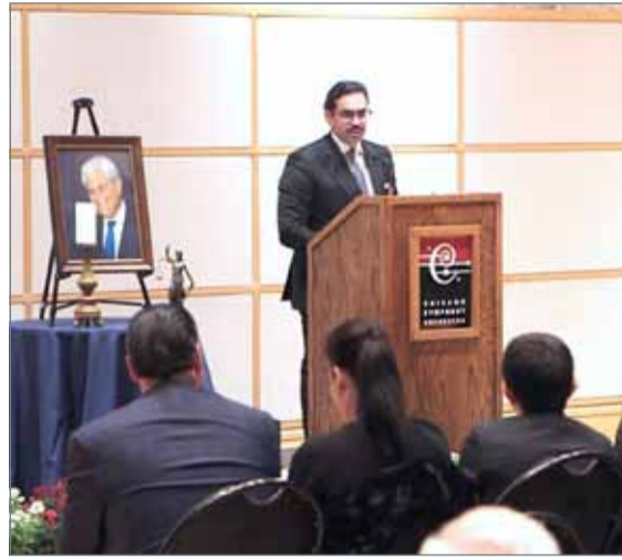
• سفير البحرين بواشنطن معزيا أسرة البروفيسور محمود شريف بسيوني

اللجنة البريانية المستقلة لتقصي الحقائق وما تعرضت له البحرين من مؤامرة قادتها تدخلات خارجية لاستهداف أمنها واستقرارها ومكتسباتها آنذاك، والتي لم تتوقف جهوده المخلصة مع انتهاء عمل اللجنة البريانية المستقلة، بل تابع بشكل شخصي المرحلة التي تلت ذلك، وساعد في تقديم المساعدة التقنية لأعضاء السلطة القضائية ورجال إنفاذ القانون من خلال معهد دراسات العلوم الجنائية بسيراكوزا. جاء ذلك لدى مشاركة السفير في حفل تأبين البروفيسور بسيوني الذي أقامته عائلته في مدينة شيكاغو الأميركية وحضره عدد من القضاة والحقوقيين واصحاب أسرة الفقيد.