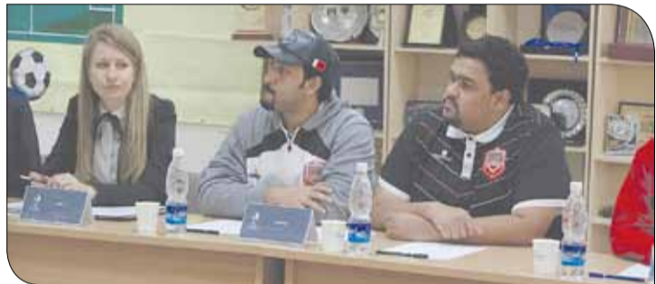
منتخبنا الوطني لكرة القدم لفئة الشباب