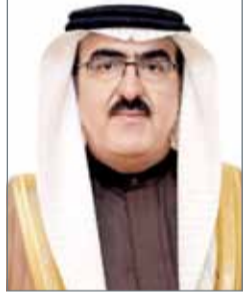
• ياسر الناصر

لكل ما فيه أمنها واستقرارها ودعم الشرعية في اليمن، كما رحب مجلس الوزراء بنتائج اجتماع وزراء الإعلام للدول الداعية لمكافحة الإرهاب الذي استضافته مملكة البحرين مؤخراً وأهميتها على صعيد تعزيز العمل الإعلامي المشترك، فيما أخذ المجلس عملاً بنتائج الاجتماعات السنوية لصندوق النقد الدولي ومجموعة البنك الدولي والفعاليات التي عقدت على هامشها.