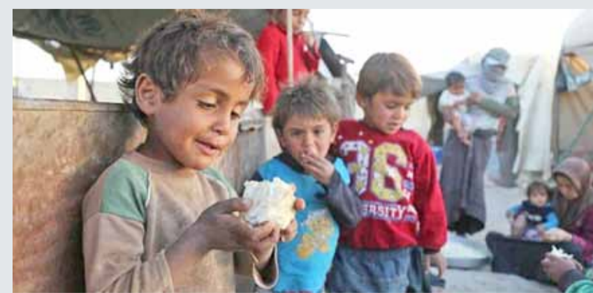
• حصار القوات الحكومية للغوطة الشرقية وضعها على شفا المجاعة

المحاصرة من القوات الحكومية قرب دمشق، وفق ما أكدت متحدثة باسم الأمم المتحدة، أمس الاثنين. وقالت المتحدثة باسم مكتب تنسيق الشؤون الإنسانية التابع للأمم المتحدة ليندا توم "دخلنا الغوطة الشرقية"، موضحة أن القافلة محملة بمساعدات تكفي لأربعين ألف شخص، وهي مشتركة مع الهلال الأحمر السوري. وفي إطار محادثات أستانا، توصلت روسيا وإيران وتركيا في مايو إلى اتفاق لإقامة 4 مناطق خفض توتر في سوريا، في محافظتي إدلب وحمص ومنطقة الغوطة الشرقية وفي الجنوب. وأعلنت منظمة الأمم المتحدة للطفولة (يونيسيف) في أكتوبر الجاري أن أكثر من ألف و100 طفل في منطقة الغوطة الشرقية التي تحاصرها القوات النظامية قرب دمشق يعانون من سوء تغذية حاد.