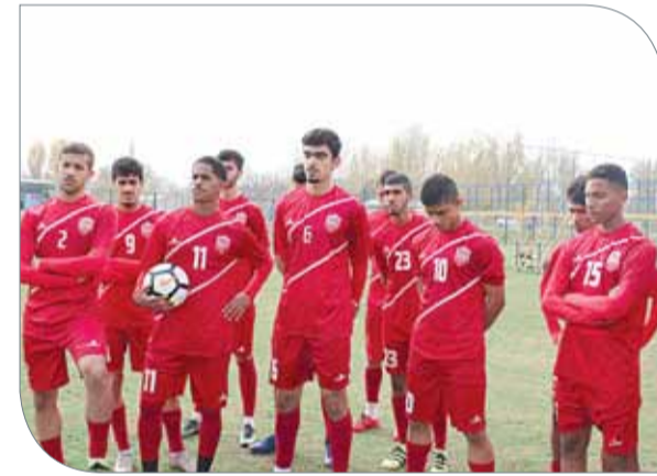
صفوف مكتملة للأحمر الشباب