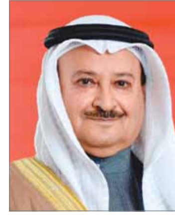
• الشيخ محمد بن خليفة

حجم قاعدة مشتركي الخطوط الثابتة بنسبة 11 % وزيادة في مشتركي خدمة برودباند بنسبة 4 %، بينما ارتفع عدد مشتركي خدمات البرودباند في شركة أمنية بنسبة 33 % بفضل شبكة النطاق العريض الثابت المتقدمة وشبكة الهاتف النقال المتطورة، وكذلك إدخال خدمات الألياف فائقة السرعة".