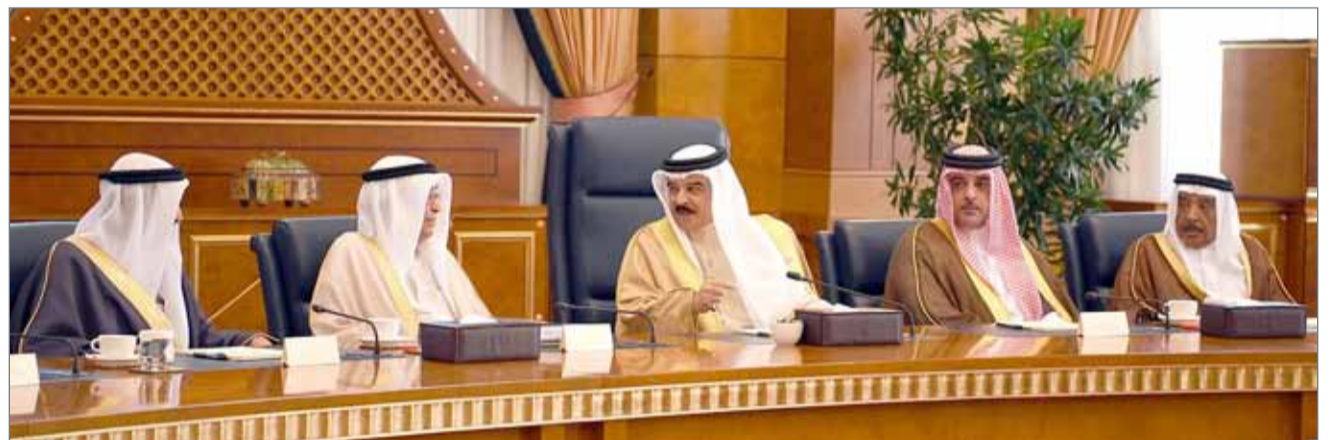
• جلالة الملك مترئسا جلسة الوزراء أمس

التوجيه الكريم لرئيس الوزراء صاحب السمو الملكي الأمير خليفة بن سلمان آل خليفة بالوقوف على مرثيات غرفة تجارة وصناعة البحرين، وبعد اطلاع المجلس على رأي الغرفة بشأنه، وافق مجلس الوزراء على السماح للشركات الأجنبية العالمية بالتملك بنسبة 100 % في الأنشطة التجارية وفق الضوابط والشروط التي حددها مشروع القرار.