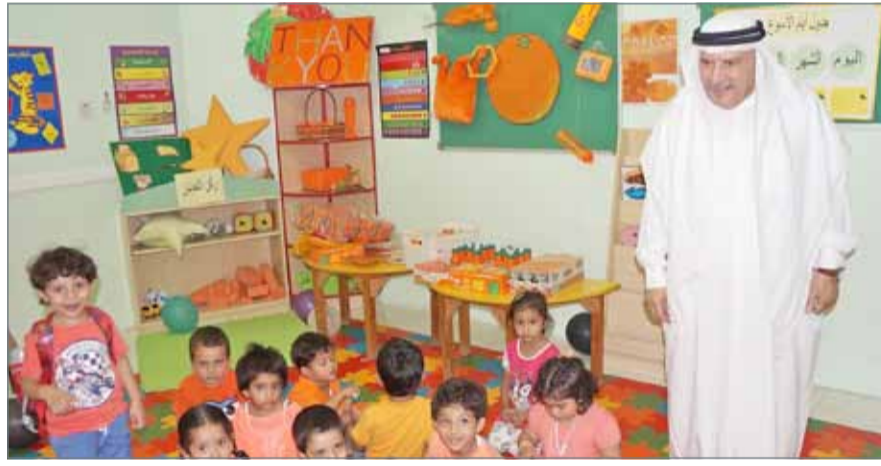
• اطلع الوكيل المساعد للتعليم الخاص على تطبيق الروضة المنهج الموحد

المستمر. وأشارت إلى أن الوزارة تحرص على إجراء الدراسات العلمية حول المدارس غير الملائمة التي تكرر مستوى الأداء غير الملائم فيها ولم تتحسن.