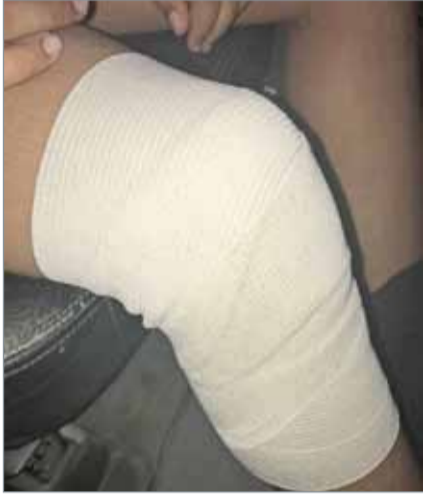
آثار الرض بركبة الطالب

على ابنه جرى وقفه 3 أيام على ذمة التحقيق.