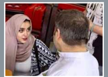
• مجموعة من طلبة كلية البحرين الجامعية يزورون دار بنك البحرين الوطني للمسنين

افتتح منتدى الابتكار وريادة الأعمال بحضور 600 طالب