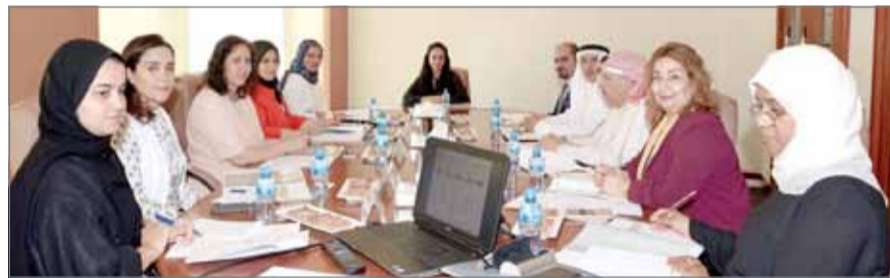
• اجتماع العمل الثالث للفريق المؤقت المعني بدراسة وتطوير وضع العمالات

مؤحد لحفظ حقوق العمالات بدور الحضانه ورياض الأطفال. والتي ستأخذ حيز التنفيذ في نوفمبر القادم، ومقترح لتطبيق عقد