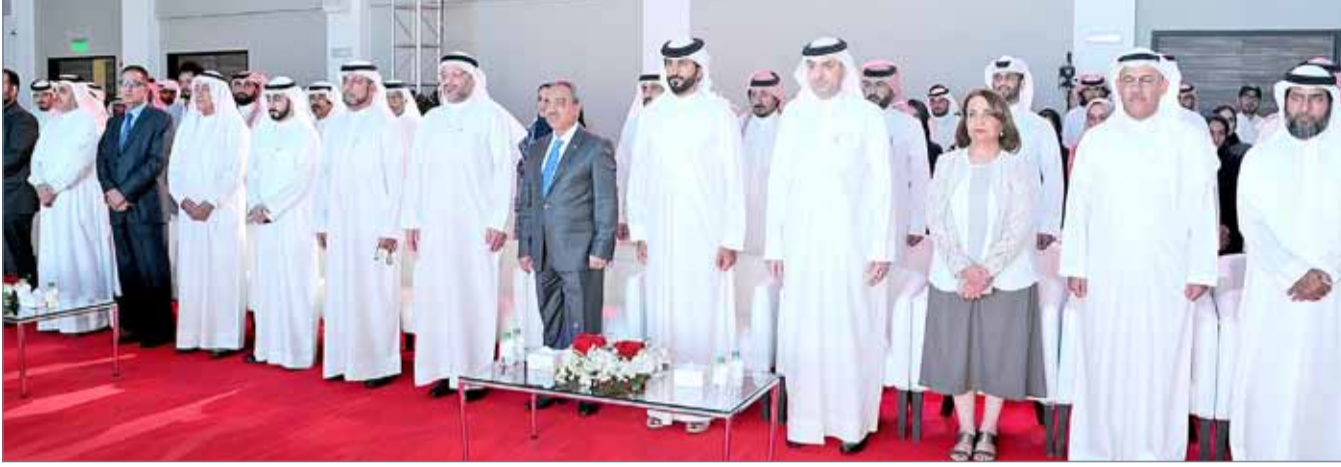
• سمو الشيخ ناصر بن حمد يفتتح مركز شباب مدينة حمد النموذجي