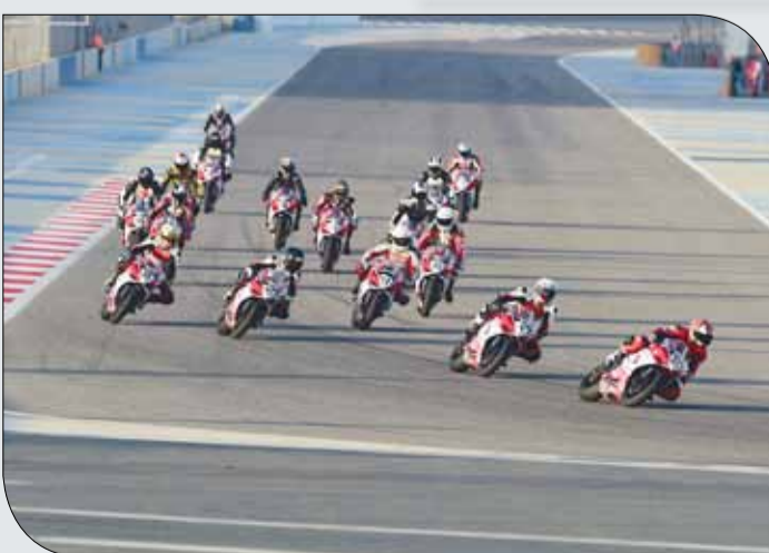
جانب من المنافسات على حلبة البحرين