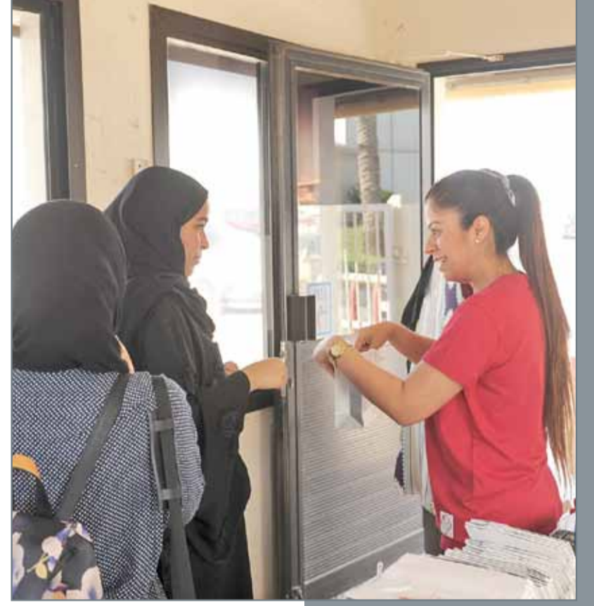
• نظمت كلية البحرين التقنية (بوليتكنك البحرين) أسبوع التوعية المهنية لتعريف الطلبة وأولياء الأمور على مركز الإرشاد والتطوير الوظيفي. وشملت الفعالية توزيع الهدايا والسحب على جوائز قيمة

تفاعلا مع ما نشرته "البلاد"، أفادت وزارة التربية والتعليم بأن ولي الأمر الذي دخل مدرسة عثمان بن عفان الإعدادية للبنين، دون إذن، وقيد تلميذا، ليضربه ابنه، تحول للجهة المختصة بالدولة؛ لاتخاذ اللازم بحقه. أما بالنسبة للطالبة، فذكرت الوزارة بأنه ستطبق عليهم لائحة الانضباط الطلابي. وجاء قرار رد الوزارة بعد العودة للإدارة المختصة، وزيارة المدرسة للتحقق. وقال ولي أمر الطالب (س. ح. أ.) بالمدرسة للصحيفة إن الطالب المعتدي