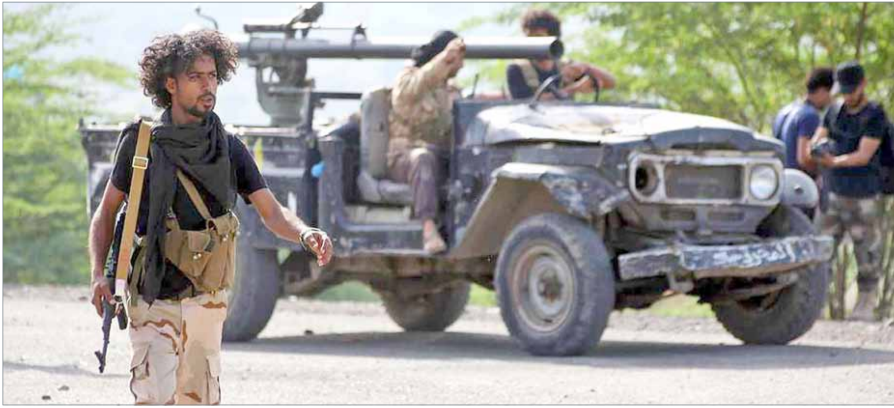
• أفراد من القوات الشرعية في تعز جنوبي اليمن

نيويورك - وكالات: أشاد الأمين العام للأمم المتحدة أنطونيو غوتيريش بالجهود التي تبذلها السعودية، ودعمها الحثيث لاستراتيجية المنظمة الدولية في مكافحة الإرهاب. وقال غوتيريش في كلمة أمام مجلس الأمن الدولي: إن مركز "اعتدال" لمكافحة الإرهاب، في العاصمة السعودية الرياض، لعب دوراً قيادياً على مستوى العالم، وإن هدفه كان التنسيق في العمل الاستراتيجي، وقبل كل شيء بناء قدرات الدول الأعضاء لمواجهة الإرهاب والإرهابيين. وأضاف غوتيريش أن: التحديات والمخاطر الأمنية تتغير باستمرار، ولابد من مواجهة الجماعات الإرهابية، من "داعش" والقاعدة و"بوكو حرام" وغيرها، عن طريق وقف تمويلهم وعدم تمكينهم من تنفيذ أعمالهم التخريبية والإجرامية، ومنعهم من الاستمرار في تهديد الشعوب والتلاعب بشبابها. وأشار الأمين العام للأمم المتحدة إلى أن عدم وجود الفرص الاجتماعية وغياب العملية الديمقراطية وانعدام الحريات، كلها أسس تؤدي إلى إمكان تجنيد الشباب.