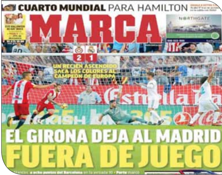
غلاف صحيفة ماركا

أما صحيفة "أس"، جاء العنوان الرئيسي "إيسكو يلعب وحيدا"، مؤكدة أن اللاعب قدم مباراة جيدة بينما لم يساعده رفاقه على تحقيق الفوز، مؤكدة أن كريستيانو رونالدو يمر بفترة سيئة للغاية، وأن فاران خرج مصابا من اللقاء. وبالانتقال إلى صحيفة "موندو ديبورتيفو" جاء العنوان الرئيسي "شكرا جيرونا"، وذلك بعد سقوط الملكي أمام الفريق الصاعد، واتساع الفجوة بين برشلونة وريال مدريد. ولم يختلف عنوان "سبورت" كثيرا، وجاء أيضا موجهاً التحية لجيرونا، مؤكداً على "فارق الـ 8 نقاط" وعودة جيرونا للفوز باللقاء بعد التأخر بهدف نظيف. وذكرت الصحيفة أن كريستيانو رونالدو وزيدان "ابتعدا عن المنافسة على اللقب".