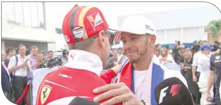
سيباستيان فيتل ولويس هاميلتون

كما هنأ ماوريتسيو أريفافينيني رئيس فيراري هاميلتون، لكنه قال إن السباق لم يعكس القدرات الحقيقية لسيارة فريقه. وقال "قاتل الفريق حتى النهاية من أجل فرصة الفوز بطولة العالم، سنواصل بذل قصارى جهدنا في السباقين المتبقين وسنعاملهم بالقدر نفسه من التركيز والتصميم".