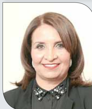
الشيخة حياة بنت عبدالعزيز

البحرينية رئيسة الاتحاد البحريني لكرة الطاولة الشيخة حياة بنت عبد العزيز آل خليفة التي تحرص بدورها بدعم رياضة المرأة عموماً ورياضة التنس خصوصاً. وتسعى اللجنة النسائية التابعة للاتحاد البحريني للتنس لجذب أكبر عدد من اللاعبات للعبة التنس وإتاحة الفرصة للتنافس الشريف وتعتبر هذه البطولة فرصة لانتقاء الخاملات والعناصر الواعدة وتشكيل منتخبات وطنية نسائية قادرة على تمثيل الوطن خير تمثيل في مختلف المشاركات والبطولات. وحث الاتحاد البحريني للتنس واللجنة النسائية التابعة له الراغبات بالمشاركة في النسخة السادسة من بطولة البحرين المفتوحة للسيدات.