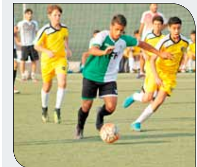
من منافسات بطولة البحرين للأكاديميات