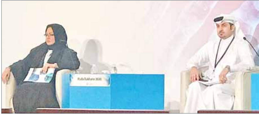
● من جلسات المؤتمر

وأشاروا في تصريحات لوسائل إعلام دولية ومواقع طبية إلى أن المؤتمر يعد نقطة انطلاق