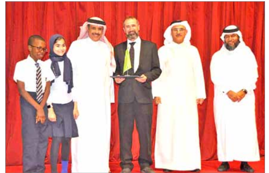
• 1610 طلاب عدد المستفيدين من مشروع “الإيكوسكولز” حتى الآن

البلدية الشمالية كانت وما زالت سباقة في برامجها المجتمعية التي تشكل مفهومًا عمليًا لمعنى الثراكة المجتمعية، ويضيف “نسعى أيضًا إلى استفادة أكبر قدر ممكن من الطلبة والطالبات من البرنامج من خلال التنسيق لزيارة الحديقة البيئية وهي حديقة الجنبية التي أنشئت بصورة مختلفة عن بقية الحدائق، وهي تعتمد في تشغيلها على الطاقة الشمسية وطاقة الرياح إضافة إلى استخدام عناصر التدوير في أثاثها الحدائقي وصناعة الأسمدة من مخلفات الحديقة (...) وهي تجربة يمكن للطلبة الاطلاع عليها بصورة مباشرة والاستفادة منها بصورة عملية”.