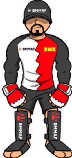
شعارات بطولة العالم ٢٠١٧ في البحرين