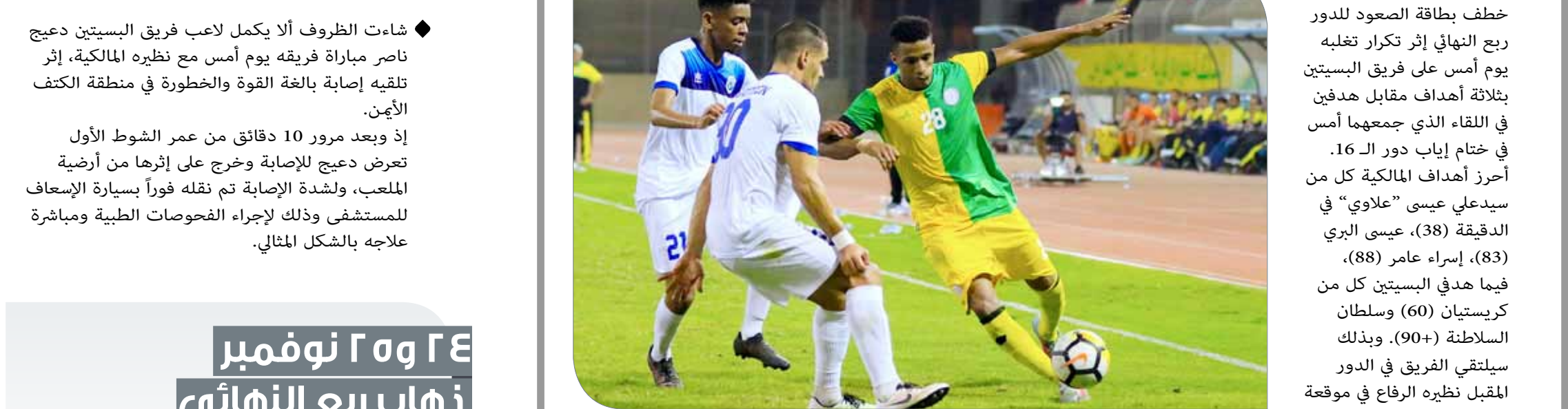
من لقاء المالكية والبسيتين

تمكن فريق المالكية من حفظ بطاقة الصعود للدور ربع النهائي إثر تكرار تغلبه يوم أمس على فريق البسيتين بثلاثة أهداف مقابل هدفين في اللقاء الذي جمعهما أمس في ختام إياب دور ال16. أحرز أهداف المالكية كل من سيدعلي عيسى «علاوي» في الدقيقة (38)، عيسى البري (83)، إسماعيل عامر (88). فيما هدفي البسيتين كل من كريستيان (60) وسلطان السلاطنة (+90). وبذلك سيلتقي الفريق في الدور المقبل نظيره الرفاع في موقعة مرتتبة.