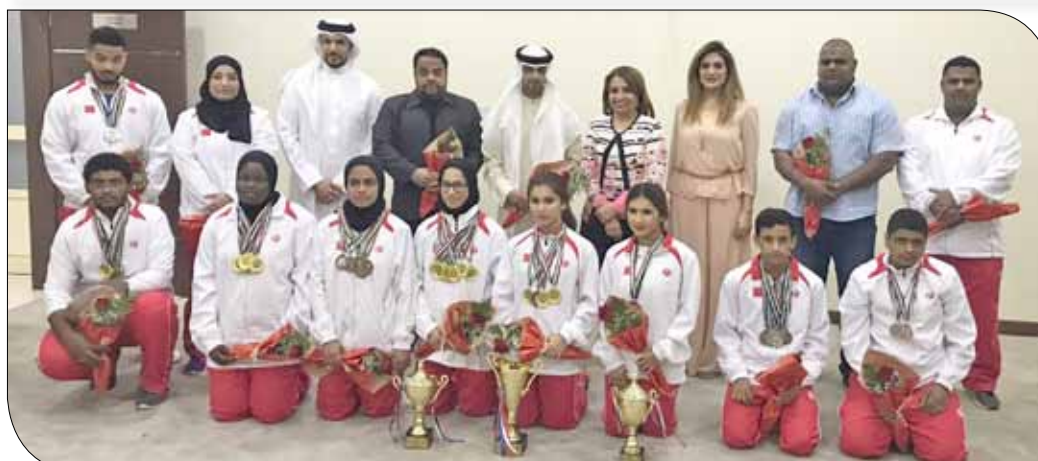
من زيارة الشبيخة حياة منتخب رفع الأثقال

التي شهدت مشاركة قوية من نجبة من لاعبي ولاعبات رفع الأثقال من دول غرب آسيا.