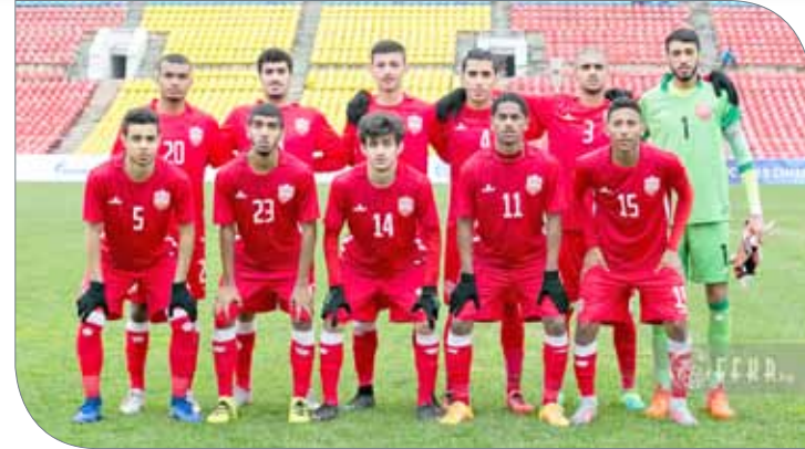
منتخبنا لفئة الشباب