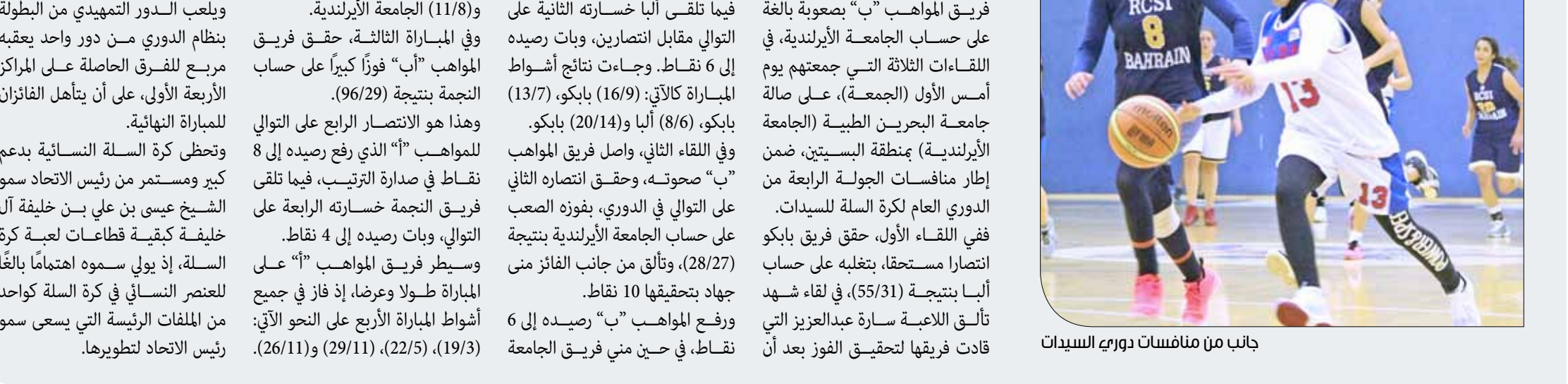
جانب من منافسات دوري السيدات