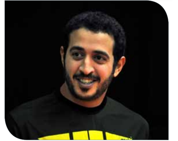
سمو الشيخ خالد بن حمد آل خليفة