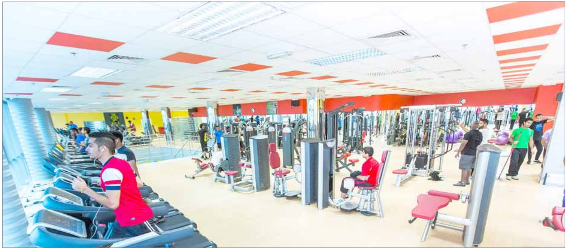
• نادي سفيكس

الرقابة على منح الرخص حتى لا تكون الأندية مجرد استثمارات اقتصادية ولكن على حساب صحة الناس.