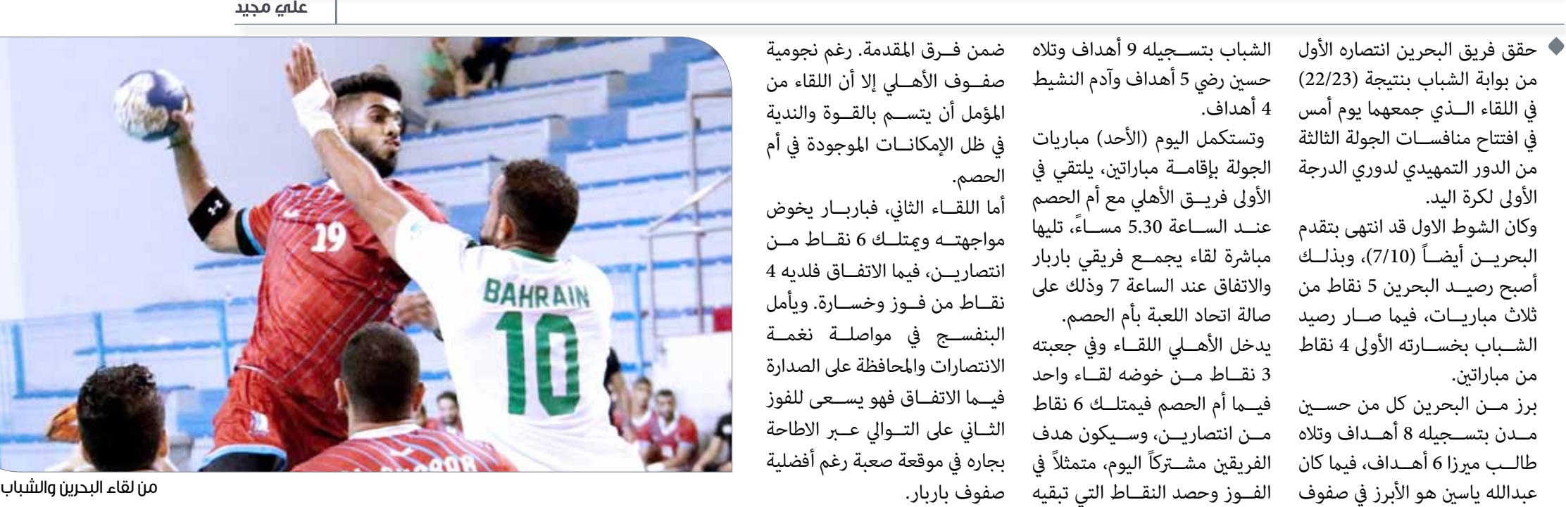
من لقاء البحرين والشباب أمس

حقق فريق البحرين انتصاره الأول من بوابة الشباب بنتيجة (22/23) في اللقاء الذي جمعهم يوم أمس في افتتاح منافسات الجولة الثالثة من الدور التمهيدي لدوري الدرجة الأولى لكرة اليد. وكان الشوط الاول قد انتهى بتقدم البحرين أيضاً (7/10)، وبذلك أصبح رصيد البحرين 5 نقاط من ثلاث مباريات، فيما صار رصيد الشباب بخسارته الأولى 4 نقاط من مباراتين.