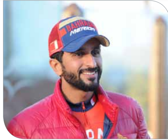
سمو الشيخ ناصر بن حمد آل خليفة