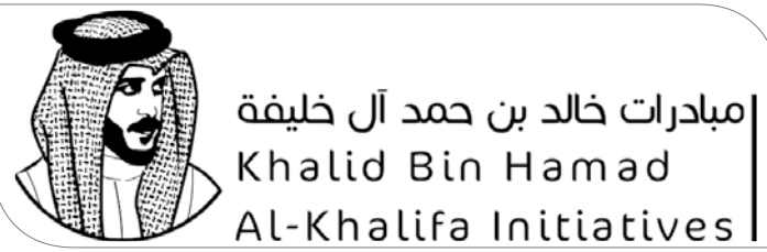
شعار مبادرات خالد بن حمد