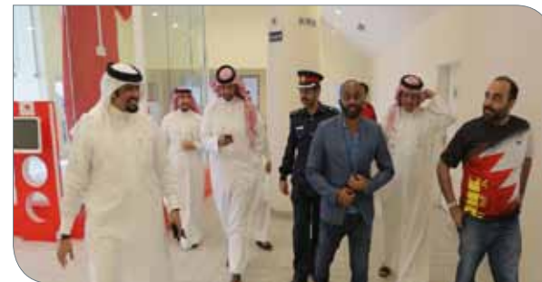
جانب من الزيارة التي قام بها الحاج واللجنة المنظمة ورئيس الاتحاد الدولي لصالة مدينة خليفة الرياضية