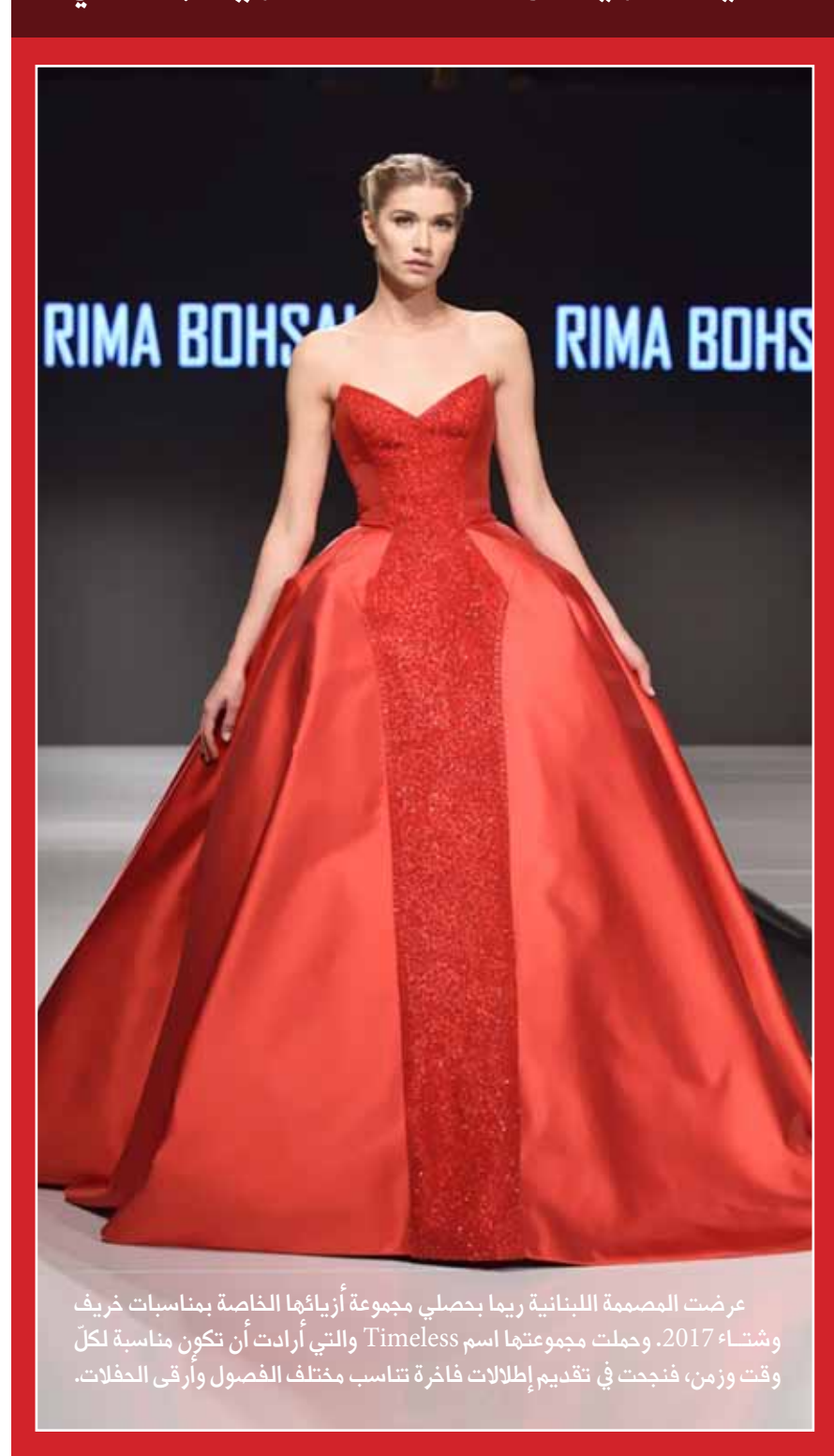
عرضت المصممة اللبنانية ريماء بحصلي مجموعة أزيائها الخاصة بمناسبة خريف وشتاء 2017. وحملت مجموعتها اسم Timeless والتي أرادت أن تكون مناسبة لكل وقت وزمن، فنجمت في تقديم إطلالات فاخرة تناسب مختلف الفصول وأرقى الحفلات.