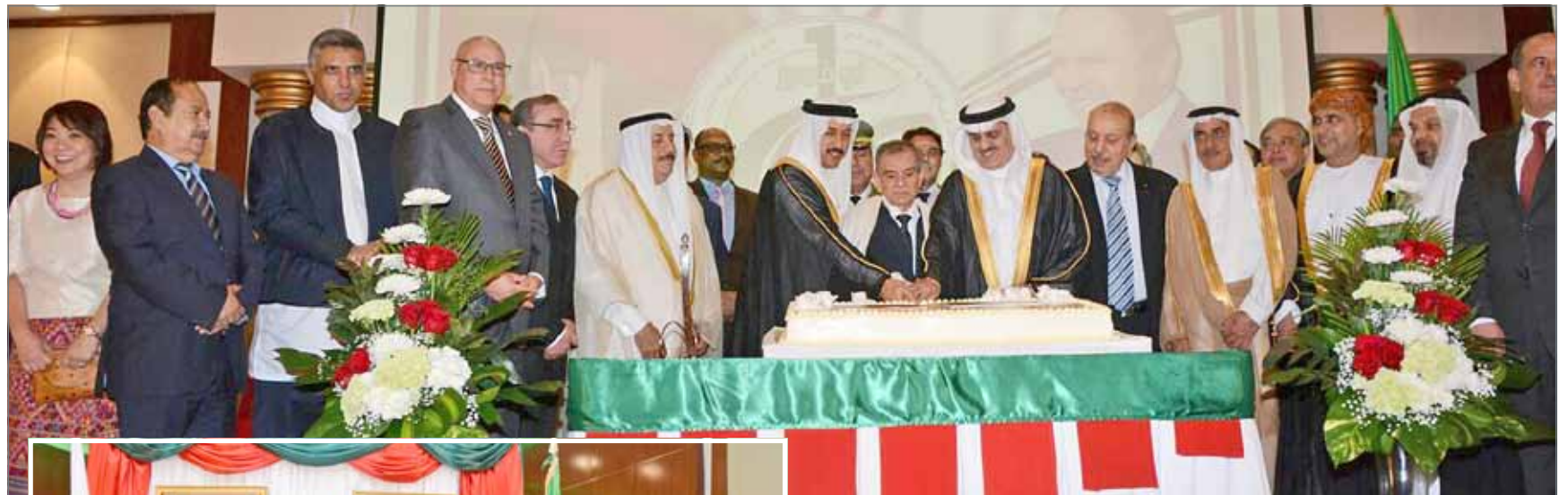
من احتفال السفارة الجزائرية بعيدها الوطني

المنامة - بنا: احتفلت السفارة الجزائرية لدى مملكة البحرين أمس الأول بالعيد الوطني بحضور وزير العدل والشؤون الإسلامية والأوقاف الشيخ خالد بن علي آل خليفة، وكيل وزارة الخارجية للشؤون الدولية الشيخ عبدالله بن أحمد بن عبدالله آل خليفة، وكيل المساعد لشؤون مجلس التعاون والدول العربية بوزارة الخارجية ظافر العمران، ورئيس مجلس النواب أحمد الملا. وبهذه المناسبة، أقام السفير