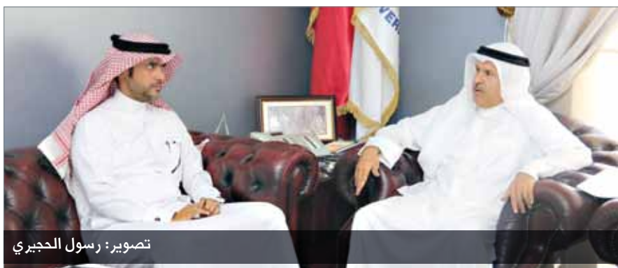
● محافظ العاصمة الشيخ هشام بن عبدالرحمن في حوار مع "البلاد"

– استطاعت المحافظة حتى شهر أغسطس من العام 2017 بالتعاون والتنسيق مع الجهات المختصة، والتي تشمل: محافظة العاصمة، وهيئة تنظيم سوق العمل، وأمانة العاصمة، وإدارة الهجرة والجوازات، من ضبط 281 عاملا أجنبيا مخالفا، إلى جانب ذلك تم مصادرة وإزالة عدد 585 فرشة مخالفة، كما تولي محافظة العاصمة أهمية خاصة لمتابعة الخدمات الحكومية المقدمة للأهالي والمقيمين؛ تحقيقاً لدورها في خلق قنوات تواصل بين المواطنين والمسؤولين من مختلف الجهات الحكومية، وتقوم المحافظة على الدوام بدراسة وبحث مختلف الظواهر الاجتماعية الدائرة في المحافظة، ومن ثم رفع توصية بشأنها في المجلس التنسيقي، ورفعها بعد ذلك إلى الجهات الحكومية