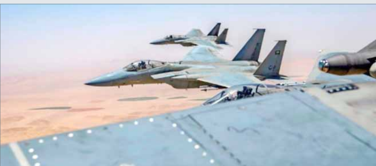
• مقاتلات من سلاح الجو السعودي