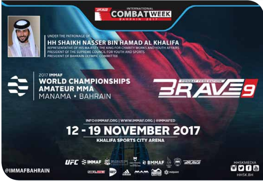
شعارات بطولة العالم ٢٠١٧ في البحرين