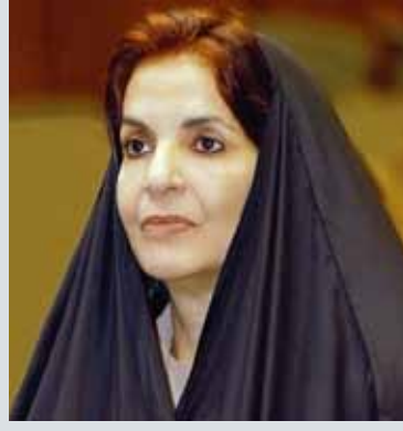
• الأميرة سبيكة بنت إبراهيم

المنامة - بنا: تحت رعاية قرينة عاهل البلاد رئيسة المجلس الأعلى للمرأة صاحبة السمو الملكي الأميرة سبيكة بنت إبراهيم آل خليفة، تنظم جمعية المهندسين البحرينية بالتعاون مع المجلس اليوم بمركز عيسى الثقافي مؤتمر "المرأة البحرينية والهندسة" تحت عنوان "استدامة الإنجاز بأسس وطنية.. نحو تنافسية دولية". ويأتي هذا المؤتمر كأحد الأنشطة الرئيسية المصاحبة ليوم المرأة البحرينية الذي جرى تخصيصه هذا العام للاحتفاء بالمرأة في المجال الهندسي.