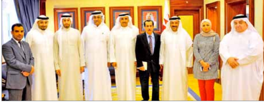
• وزير الإسكان مستقبلاً رئيس وأعضاء مجلس إدارة جمعية الصحافيين

تمتد إلى ما يقارب 60 عاماً استطاعت الحكومة أن توفر ما يقارب 129 ألف خدمة إسكانية مختلفة للمواطنين. من جانبها، عبرت جمعية الصحافيين عن شكرها وتقديرها للدور الذي توليه وزارة الإسكان، مثنئة التزامها بتنفيذ التوجيهات السامية بشأن مشروع إسكان الصحافيين، وأشادت بجهود الوزارة التي تحققت خلال السنوات الأخيرة والتي حظيت بنتائج خطتها ومخرجاتها بالإشادة الملكية، والتي تعتبر شهادة نجاح لجهود الحكومة في إدارة ومتابعة هذا الملف الاجتماعي الهام في ظل التحديات الاقتصادية والاجتماعية الحالية.