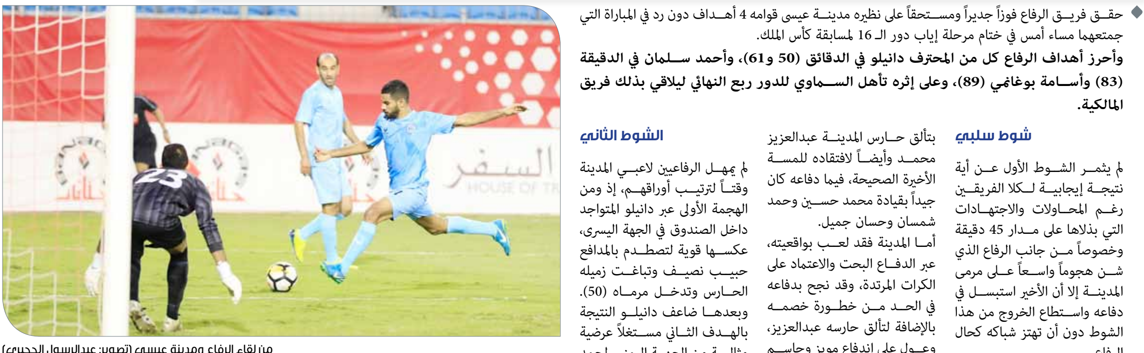
من لقاء الرفاع ومدنية عيسى

حقق فريق الرفاع فوزاً جديراً ومستحقاً على نظيره مدينة عيسى قوامه 4 أهداف دون رد في المباراة التي جمعتهما مساء أمس في ختام مرحلة إياب دور ال16 لمسابقة كأس الملك. وأحرز أهداف الرفاع كل من المحترف دانيلو في الدقائق (50 و61)، وأحمد سلمان في الدقيقة (83) وأسامة بوغامي (89)، وعلى إثره تأهل السماوي للدور ربع النهائي يليقي بذلك فريق المالكية.