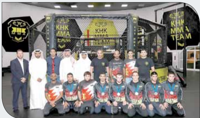
منتخبنا لفنون القتال قبل المغادرة لمعسكر الشيشان

ومن خلال وضع جدول خاص بوصول المنتخبات وممثلي الدول المشاركة وذلك حسب تأكيدات الحجوزات للدول المشاركة لوصولها المملكة، وستبدأ الوفود والشخصيات بالتوافد على المملكة بداية من اليوم الخميس وبوصول المنتخب الأسترالي، وسيستعد بقية المنتخبات والوفود المشاركة قبل أن تنطلق المنافسات يوم الثاني عشر من نوفمبر الجاري.