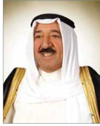
• سمو أمير دولة الكويت