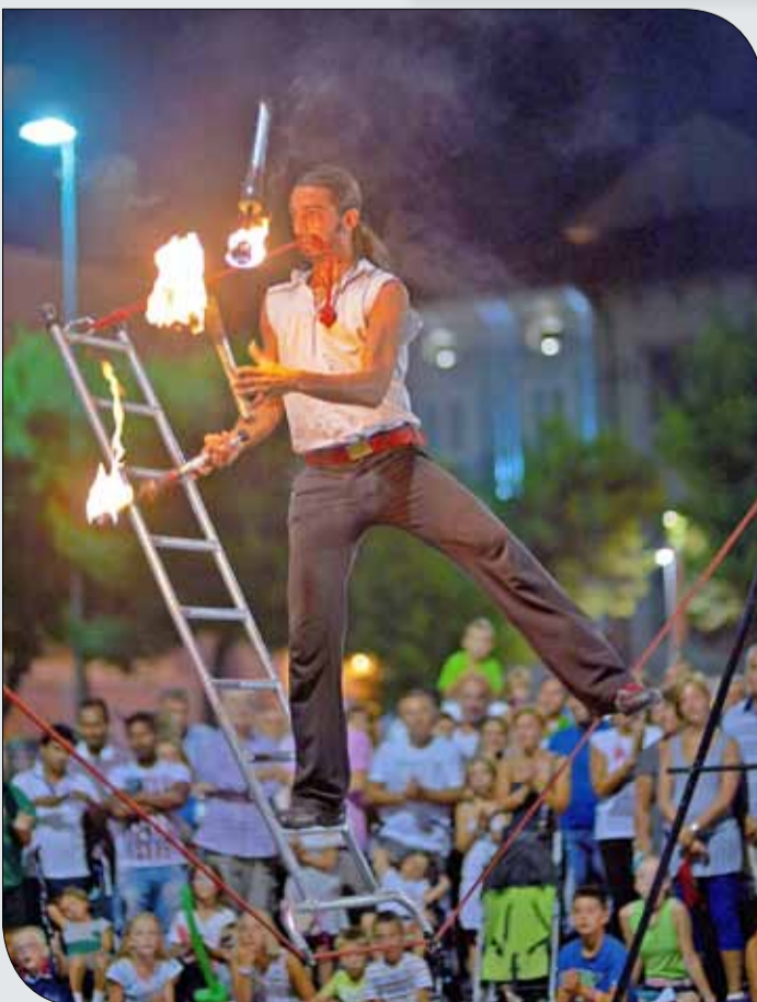
جانب من العروض الشيقة التي ستستضيفها حلبة البحرين

الجماهير من الطيران في الهواء خلال هذه الفعالية، والتي لاقت إقبالا جماهيريا سابقا، وسيتمكن الجماهير من تجربة الطيران في الهواء، فلا تفوتك الفرصة بتجربة الإثارة والمتعة في هذه الفعالية. وسيستمتع الأطفال بالعروض المسرحية المتنوعة وهي عبارة عن عرض فني مسرحي منوع يشمل فقرات غنائية وأخرى راقصة، وسيشد العرض المسرحي جميع أفراد العائلة من كل الأعمار. وستقوم المجموعة بتقديم عروضها الشهيرة: علاء الدين وسندريلا. إلى جانب الفرق الاستعراضية والتي ستمتع زوار السباق أبرزها فرقة هاكونا ما سامبا الموسيقية وفرقة الأخوين الكوميدية والألعاب الأخرى للأطفال كالقصر الهزاز والقطار المتحرك والرسم على الوجوه، إلى جانب توفر العديد من الخدمات الأساسية كأكشاك الأطعمة والمشروبات طول فترة الفعالية، لذا ستكون فعالية عائلية متكاملة فلا تفوتوا حضورها والاستمتاع بها.