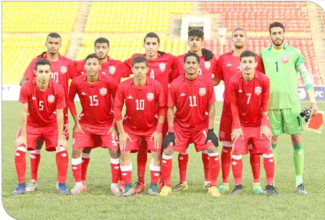
منتخبنا الوطني لفئة الشباب لكرة القدم

أدار اللقاء الحكم السعودي شكري حسين، وعاونته مواطنه خالد الشمري والبنغلاديشي مانير، والحكم الرابع “وانق” من الصين.