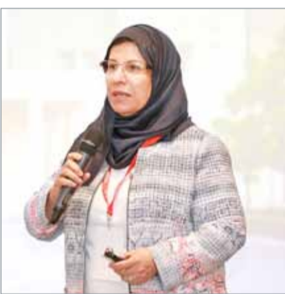
• المرأة البحرينية في ريادة الأعمال حققت تقدماً كبيراً

وأشارت إلى أهمية دور الجامعات لا سيما الجامعة الأهلية في إعداد الدراسات والبحوث في مجال المرأة وتكافؤ الفرص، وتضمين موضوعات تتعلق بالمرأة وتكافؤ الفرص في المقررات العلمية، بالإضافة إلى إبراز النماذج النسائية الرائدة والمتميزة على المستويين الوطني والدولي، وأخيراً تطوير برامج الإرشاد الأكاديمي والتوجيه المهني بما يضمن الالتحاق بال تخصصات ذات القيمة المضافة والواعدة وفق الدراسات الاستشرافية لمتطلبات سوق العمل.