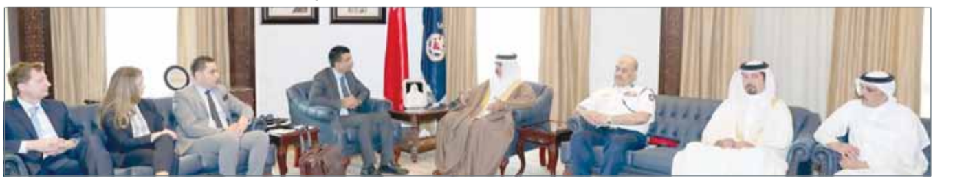
• وزير الداخلية مستقبلاً فريق التقييم بحضور رئيسي الأمن العام والجمارك