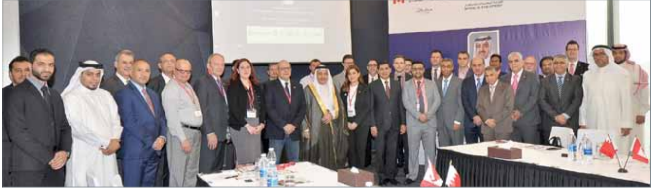
• كبار الشخصيات في المنتدى

وثمّن وزير النفط الجهود التي بذلتها السفارة الكندية بالرياض في عقد هذا الملتقى، مشيداً عالياً بالتوجهات السديدة لحكومة البحرين وما توليه من اهتمام نوعي وتميز في استقطاب الوفود الاستثمارية ذات العلاقة بقطاع النفط والغاز والبتر وكيمياويات وتذليل كافة الصعوبات لعقد الاجتماعات البنائية وفتح قنوات الاستثمارات النفطية مع الشركات النفطية الوطنية، بما يحقق الأهداف الاستراتيجية للمهئية الوطنية للنفط والغاز وكذلك القيم والمبادئ التي ترتكز عليها رؤية البحرين الاقتصادية 2030، منوهاً الوزير بالنهضة التكنولوجية وقطاع النفط والغاز والبتر وكيمياويات، والتي تتلزم بالمعايير الدولية المتعلقة بالحفاظ على البيئة.