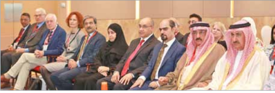
• إتاحة الفرصة الكاملة للمرأة في تحمل المسؤولية

المجتمع، بما يعكس رؤية المجلس الأعلى للمرأة في تعزيز مبدأ الشراكة المتكافئة، سعياً لبناء مجتمع تنافسي مستدام من خلال إدماج احتياجات المرأة في التنمية في إطار العدالة والإنصاف وعدم التمييز في توفير الفرص في كافة المجالات.