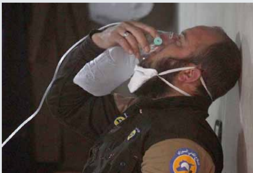
• أحد أفراد قوات الدفاع المدني السوري يتنفس من خلال قناع أكسجين بعد هجوم على خان شيخون

وفي بيان مشترك أصدره وزراء خارجية بريطانيا وفرنسا وألمانيا والولايات المتحدة قالت الدول الأربع إن لديها ثقة كاملة فيما توصلت إليه اللجنة ودعت النظام السوري إلى