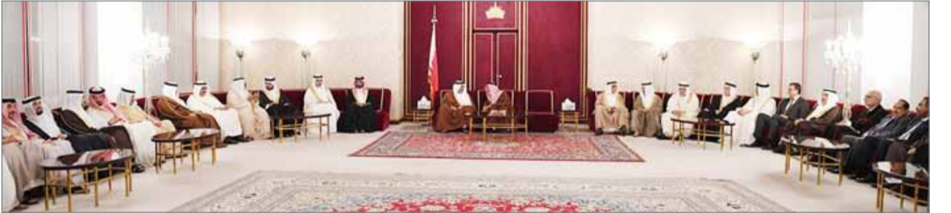
• سمو نائب جلالة الملك مستقبلاً رواد مجلسه الأسبوعي

البحريني ونسيجه وهويته الجامعة. وقد أثنى الحضور على حرص سموه بالالتقاء بالمواطنين والتواصل معهم وما يشكله المجلس من منصة جامعة لأبناء المجتمع كافة في صورة تجسد هوية البحرينيين التي جبلت على المحبة والخير، منوهين بجهود القيادة الحكيمة في تعزيز أسس التنمية المستدامة؛ لتحقيق المزيد من الرخاء والتقدم، وتأمين الحياة الكريمة للمواطن.