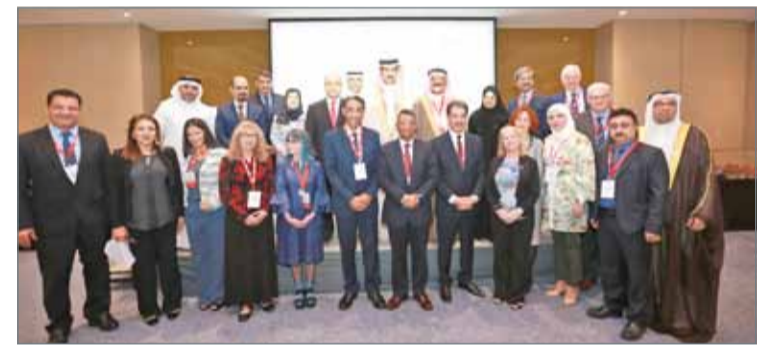
• المرأة شريك أساسي في مختلف أنشطة الجامعة البحثية والتعليمية

ولفت الحواج إلى أن حرص الجامعة على أن تكون المرأة شريكاً أساسياً في مختلف أنشطتها البحثية والتعليمية، وكذلك في المواقع القيادية، فهناك 5