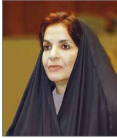
الأميرة سبيكة بنت إبراهيم

كذلك إلى دعم الرؤى الاقتصادية في مجال المشاريع الصغيرة والمتوسطة والاسترشاد بالتجارب الرائدة في هذا المجال، وطرح مبادرات مشتركة لتعزيز التعاون الاقتصادي والتأكيد على استقطاب رؤوس الأموال لتشجيع قيام مشاريع مشتركة بين ذوي الاختصاص. ويقام المنتدى بالتعاون مع عدد من شركاء إستراتيجيين هم مجلس التنمية الاقتصادية، "تمكين"، "اليونيدو"، غرفة تجارة وصناعة البحرين، اتحاد غرف دول مجلس التعاون الخليجي، وجمعية البحرين للتدريب والموارد البشرية، إضافة إلى الجهات الراعية لدعمها المستمر مثل مركز البحرين التجاري العالمي "بريجير"، شركة ديار المحرق، بنك البحرين للتنمية، "جيبك"، طيران الخليج، وفندق ذا غروف، ويفتتح المعرض أبوابه للعموم الساعة 3 - 7 مساءً يوم الإثنين 13 نوفمبر 2017، ومن الساعة 10 صباحاً وحتى الساعة مساءً يوم الثلاثاء، ومن الساعة 10 صباحاً وحتى الواحدة ظهراً في اليوم الأخير.