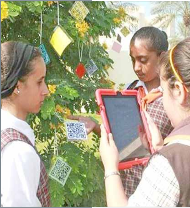
• حديقة المواطنة الرقمية بمدرسة الرلاق الابتدائية الإعدادية للبنات، وهي ضمن مشروع المدرسة المعززة للمواطنة وحقوق الإنسان