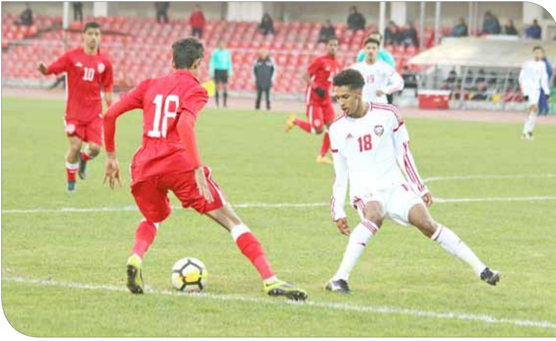
لقطات من المباراة