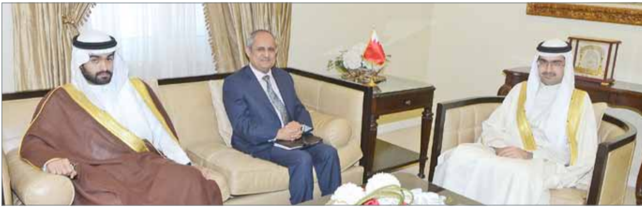
• سمو محافظ الجنوبية مستقبلاً الرئيس التنفيذي لصندوق العمل (تمكين)

المشاريع والبرامج التي تحقق الأهداف التي تسعى إليها "تمكين" وبما تعزز من منح القدرات والإمكانات للمواطنين، والتي تمكنهم من تنمية قدراتهم وتمهية الأجواء التي تعينهم على دخول سوق العمل والاستفادة القصوى من برامج الدعم التي يقدمها الصندوق.