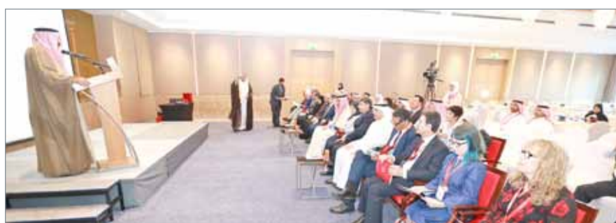
• حققت مملكتنا الغالبة إنجازات عظيمة في مجال تمكين المرأة

وأكد أن مسؤولية الجامعات لا تتوقف عند تخريج الكوادر المؤهلة وإنما تمتد إلى رفد المجتمعات بقيم ومفاهيم الحضارة من خلال رسائل التنوير والثقافة والفن والإبداع والابتكار.