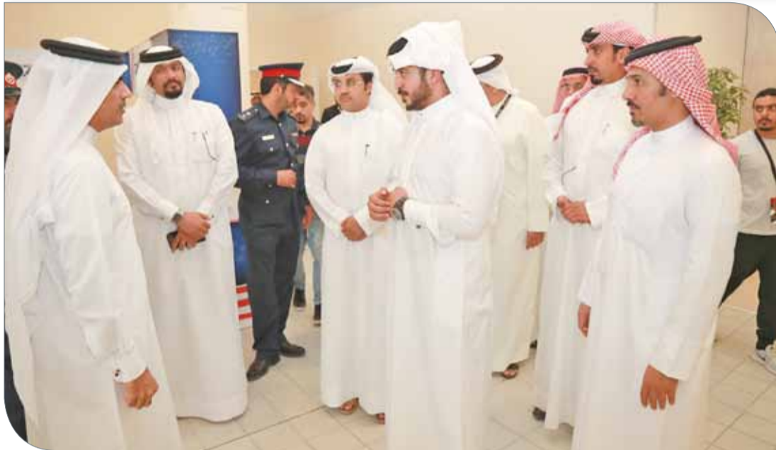
سمو الشيخ خالد بن حمد مع الخياط أثناء تقعد صالة مدينة خليفة الرياضية

وأوضح أن الاتحاد على ثقة كبيرة بقدرات لاعبي منتخبنا الوطني واللاعبات لفنون القتال المختلطة بتقديم أفضل المستويات، وإبراز الصورة المشرفة للعبة التي شهدت تطوراً كبيراً في الفترة الماضية بفضل الدعم اللا محدود الذي يقدمه سمو الشيخ خالد بن حمد آل خليفة، متمنياً للمنتخب التوفيق والنجاح.