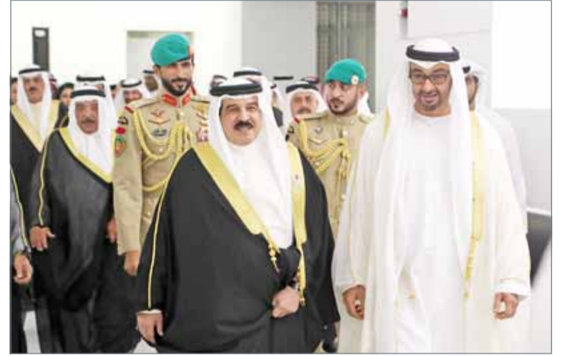
• جلالة الملك يحضر حفل افتتاح متحف اللوفر أبوظبي المقام في جزيرة السعديات بالعاصمة الإماراتية