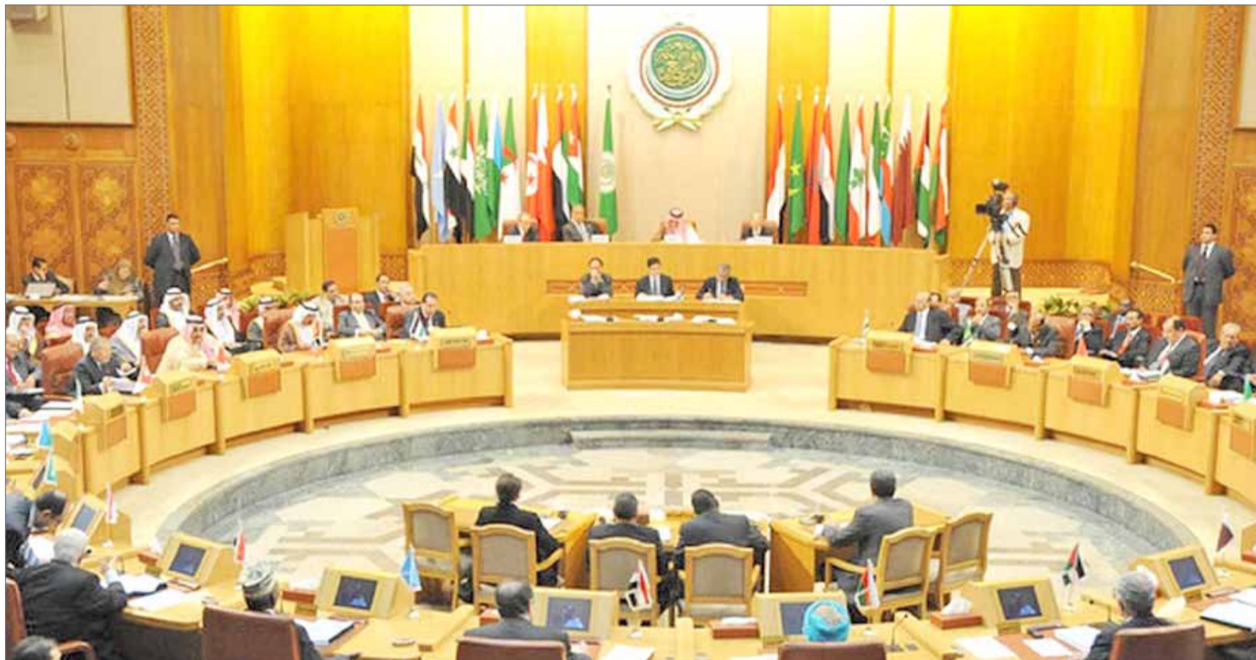
• أبو الغيط يستكر التصعيد غير المسبوق ضد المملكة العربية السعودية.

وقالت السفارة الأميركية في المنظمة الدولية، نيكي هيلي، إن المعلومات التي كشفت عنها السعودية أظهرت أن الصاروخ الذي أطلق في يوليو إيراني من طراز (قيام)، ووصفته بأن "نوع من الأسلحة التي لم تكن موجودة في اليمن قبل الصراع".