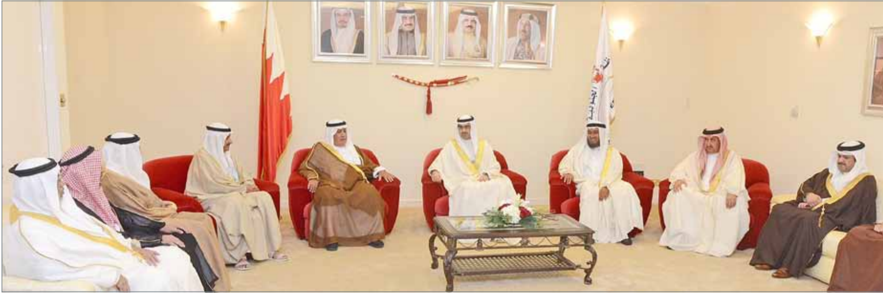
• سمو محافظ الجنوبية متحدًا في المجلس الأسبوعي بحضور جمع من أعيان ووجهاء المحافظة

من جانبهم، عبر رواد المجلس عن خالص تقديرهم وشكرهم لجهود وتكرات سمو محافظ الجنوبية المنطلقة من واقع احتياجاتهم وتطلعاتهم للارتقاء بالمحافظة مع مراعاة الحفاظ على الماضي العريق الذي تتركز به المحافظة في العديد من المواقع وما في ذلك من انعكاسات إيجابية متعددة عائدة بالخير والنفع على المحافظة وقاطنيها، مؤكداً مساندتهم المتواصلة، ومد يد العون والتعاون، لتحقيق الأهداف النبيلة التي يسعى سموه إلى تحقيقها من رفعة وتقدم وتنمية شاملة.