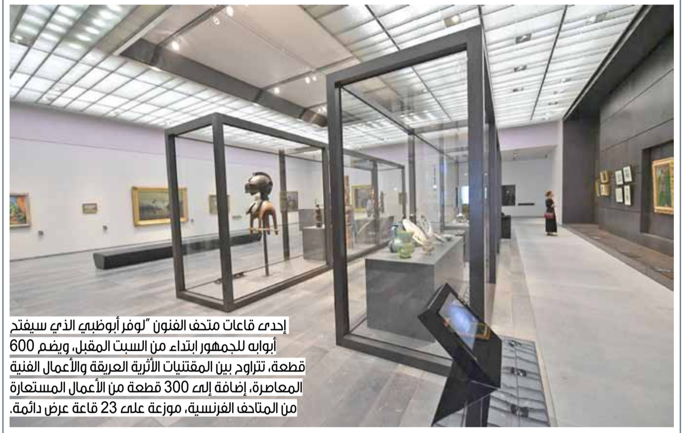
إحدى قاعات متحف الفنون ”لوفر أبوظبي“ الذي سيفتح أبوابه للجمهور ابتداءً من السبت المقبل، ويضم 600 قطعة، تتراوح بين المقتنيات الأثرية العريقة والأعمال الفنية المعاصرة، إضافة إلى 300 قطعة من الأعمال المستعارة من المتاحف الفرنسية، موزعة على 23 قاعة عرض دائمة.

حالة الطقس: الطقس المتوقع لهذا اليوم سيكون معتدلاً مع بعض السحب أحياناً. الرياح متقلبة الاتجاه من 5 إلى 10 عقده. ارتفاع موج البحر من قدم إلى قدمين. درجة الحرارة العظمى 32، والصغرى 22 درجة مئوية.