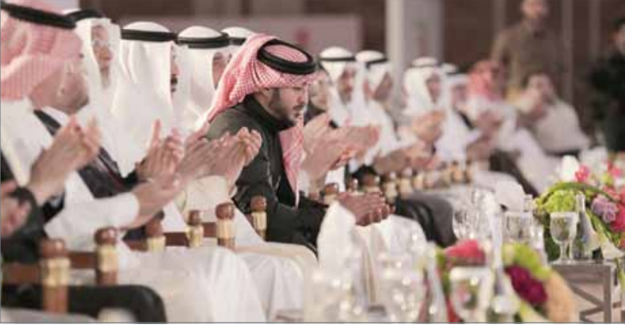
• سمو الشيخ خالد بن حمد آل خليفة

الإعاقة، تعزيز المبادرات التطوعية المؤسسية والدولية من أجل تحقيق التمكين للأشخاص ذوي الإعاقة من خلال تقنيات المعلومات والاتصالات، استخدام وسائل التواصل الاجتماعي في توعية وتأهيل وتدريب المهنيين وأولياء الأمور والمختصين بالتقنيات المساعدة للتقليل من التحديات والمشكلات الحسية والحركية والتواصلية للأشخاص من ذوي الإعاقة، إرساء مبدأ صناعة الكوادر الفنية والتقنية بتكنولوجيا الإعاقة والقدرة على توظيفها في تأهيل وتدريب الأشخاص ذوي الإعاقة، توظيف التقنيات الحديثة (مثل الواقع المعزز والواقع الافتراضي والحوسبة السحابية) وغيرها من التقنيات المساعدة في مجال التدريب والتعلم للأشخاص ذوي الإعاقة لتعزيز التنمية المستدامة ودمج التقنيات المساعدة في الكسب والتقييم والتدخل العلاجي للأشخاص من ذوي الإعاقة في مرحلة التدخل المبكر والمراحل اللاحقة.