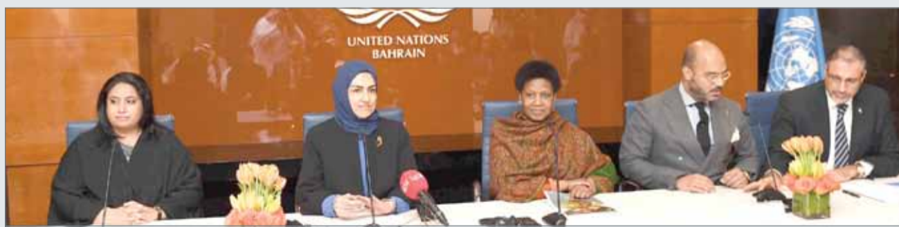
• المجلس الأعلى المرأة

وكانت وكالة الأمين العام للأمم المتحدة، والمديرة التنفيذية لهيئة الأمم المتحدة للمرأة في مملكة البحرين فومزيلي ملامو لوكوكا، ترافقها الأمين العام للمجلس الأعلى هالة الانصاري، قد افتتحت صباح أمس أول مكتباً تمثيلاً للأمم المتحدة للمرأة في البحرين والمنطقة بحضور وكالة وزارة الخارجية وعدد من كبار المسؤولين في بيت الأمم المتحدة.