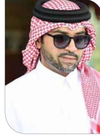
سمو الشيخ فيصل بن راشد

وأوضح سمو الشيخ ناصر بن حمد آل خليفة أن الاسطبلات البحرينية حريصة دائماً على المشاركة الفاعلة في مختلف البطولات التي ينظمها الاتحاد الملكي، حيث تعتبر مشاركتها جزءاً رئيسياً من نجاح المنافسات المحلية، وهي أحد الأسباب التي ساهمت في تحقيق الشراكة مع الاتحاد لتطوير وارتقاء رياضة الفروسية على الصعيد المحلي، والتي منحت البحرين مركزاً عالمياً متقدماً في هذه الرياضة بفضل النتائج المشرفة التي حققتها المنتخبات الوطنية بمختلف المشاركات والمسابقات القارية والدولية، منوها سموه إلى مشاركة الاسطبلات في بطولة جمال الخيل العربية الأصلية، يدفع الاتحاد نحو المضي قدماً لتطوير هذه البطولة بما يحقق لها المكانة الرفيعة التي تعود بالفائدة الكبيرة على النهوض بهذه الرياضة.