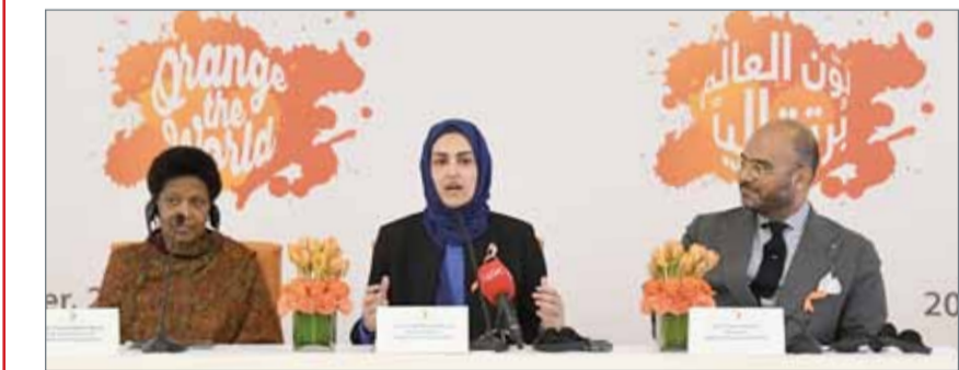
جانب من المؤتمر الصحافي

ضد المرأة، مشيدة بما وصلت إليه العلاقات من تطور بين مملكة البحرين ممثلة في المجلس الأعلى للمرأة وهيئة الأمم المتحدة للمرأة في كل ما يتعلق بقضايا المرأة.