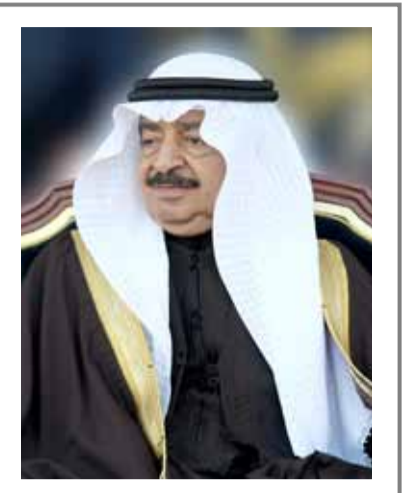
يقلم: الدكتور عبدالله الجواهر