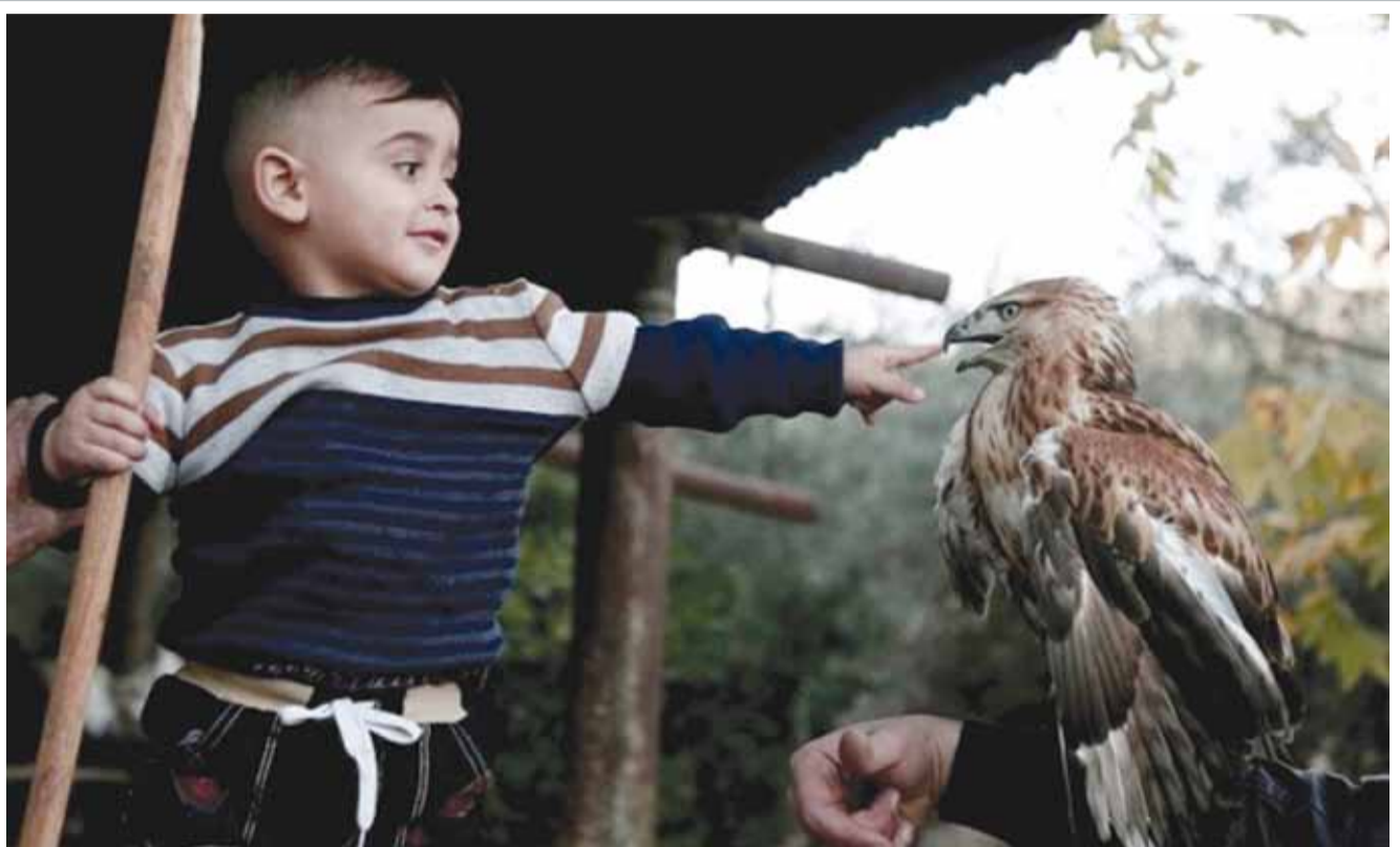
طفل فلسطيني يداعب صقرا في مدينة طوباس بالضفة الغربية.