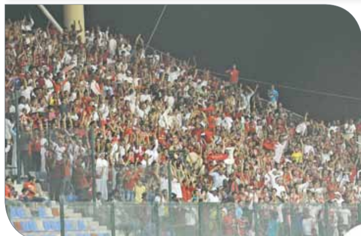
لقطة للجماهير الرياضية

اليوم نفسه فريق لعبة الطائرة لعب مع النصر في الساعة 7.30، وفريق النجمة هو الآخر كان له نصيب مع هذا التضارب بين ألعاب القدم والسلة والطائرة يوم 29 نوفمبر الماضي. بغض النظر عن قرب الملاعب والصالات التي تبارت فيها فرق الأندية المذكورة وغيرها، لا بد أن يتم التنسيق لجدول مباريات الاتحادات الرياضية كافة؛ من أجل ضمان حضور الجماهير وللألعاب كافة دون تشبث لهم ولمحبي وعاشقي الألعاب الأخرى، وهذا حق من حقوق الجمهور أن يجد سبيل الراحة في حضور وتشجيع فرق ناديه في الملعب وخلف التلفاز بكل يسر وراحة دون "لخبطة الرأس وضرب أخماس في أسداس" وخصوصاً إذا ما ذكرنا أن قناتنا الرياضية لم تصل للمرحلة المتطورة التي بإمكانها أن تغطي كافة ومختلف المباريات التي تقام في آن واحد.