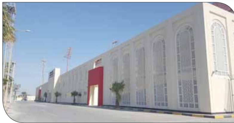
من الصور التي انتشرت لاستاد المحرق بخلته الجديدة