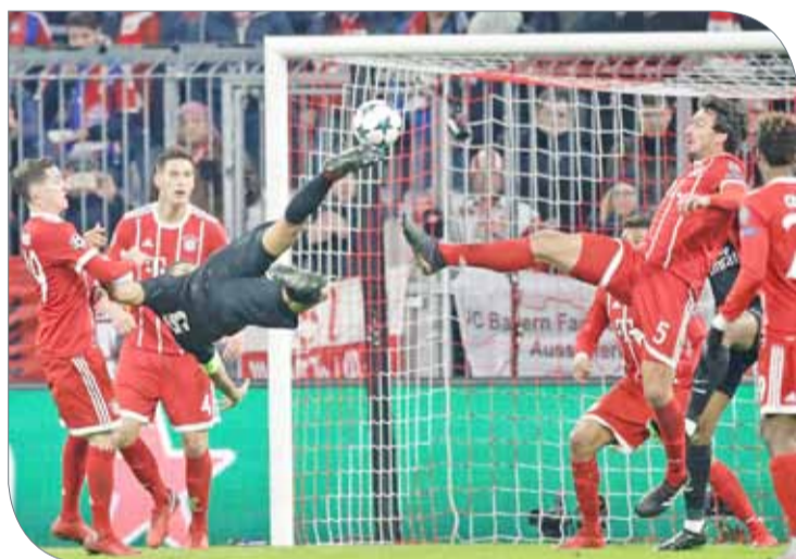
من مباراة بايرن وباريس

وقال رونالدنيو في مؤتمر صحفي: "هناك فرصة، أعتقد أنني سأودع كرة القدم العام المقبل، ربما سألعب بعض المباريات الودية مع الفرق التي لعبت لها، إنه أمر يجب التفكير به قريباً". وأضاف: "بمجرد أن أعتزل كرة القدم، سأمضي قدماً في مشاريعي الموسيقية، ومدستي الكروية، إنه أمر جديد يتوجب أن أتأقلم عليه".