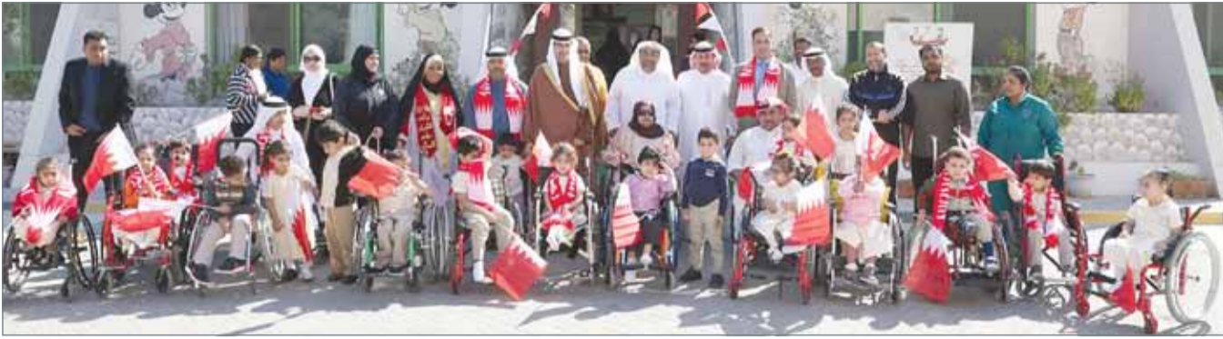
• خلال زيارة سمو محافظ الجنوبية للمركز البحري الدولي ومعهد الأمل للتربية الخاصة

رعاية بالغة في الوصول إليهم والبقاء على مقربة تامة... سمو محافظ الجنوبية: