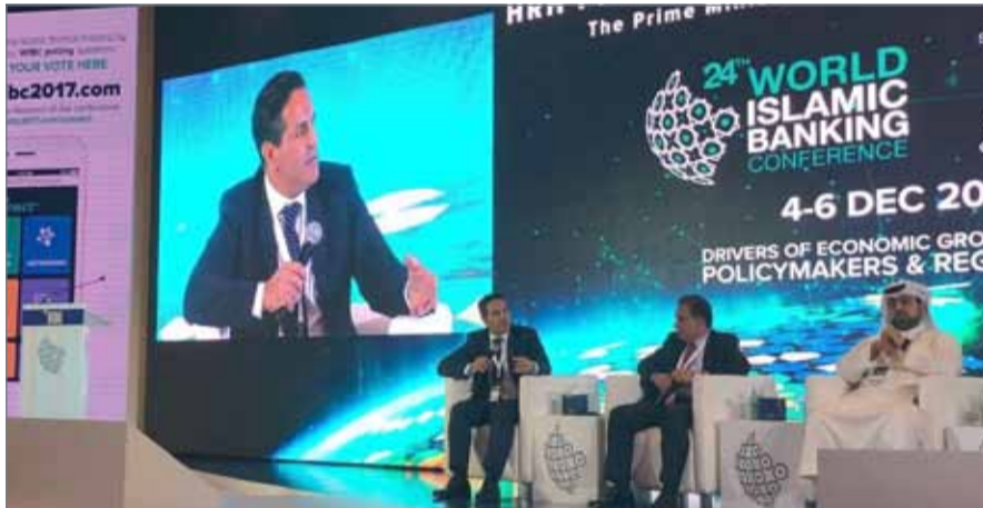
يرى خبراء القطاع المصرفي أن تجميع البيانات وتحليلها يعتبر أحد الأصول الثمينة

الجاري، وبحسب الدراسة، فإن 52 % من عملاء البنوك في المملكة العربية السعودية و41 % في الإمارات العربية المتحدة أعربوا عن استعدادهم لتغيير البنك في حال عدم خوصهم لتجارب مرضية أثناء تداول الخدمات المصرفية.