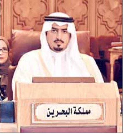
• الشيخ خالد بن حمد

السياحية في الدول المستقبلية للسائحيين. كما ناقش المجلس مقترحاً بشأن سبل تفعيل ”السياحة الميسرة“ في المنطقة العربية، وما تفتقده العديد من الدول العربية من المعايير والمتطلبات بحيث تكون السياحة متاحة للجميع في قلب ومحور السياسات السياحية واستراتيجيات الأعمال، إلى جانب مناقشة التعاون العربي مع دول أمريكا الجنوبية في مجال السياحة ودراسة عدد من الموضوعات المقترحة من المنظمة العربية للسياحة، والتي تهدف إلى النهوض بصناعة السياحة العربية ومن أهمها مشروع ”لوحة الإحصاء السياحي للنزول والفنادق السياحية“ وبرنامج مشروع حاضرات الأعمال للمشاركة السياحية.