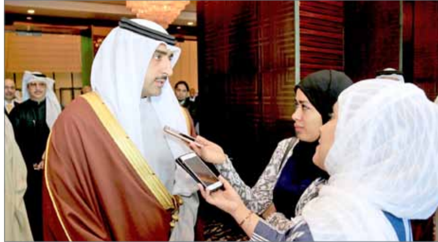
● الشيخ محمد بن خليفة متحدثاً للمصاحبين