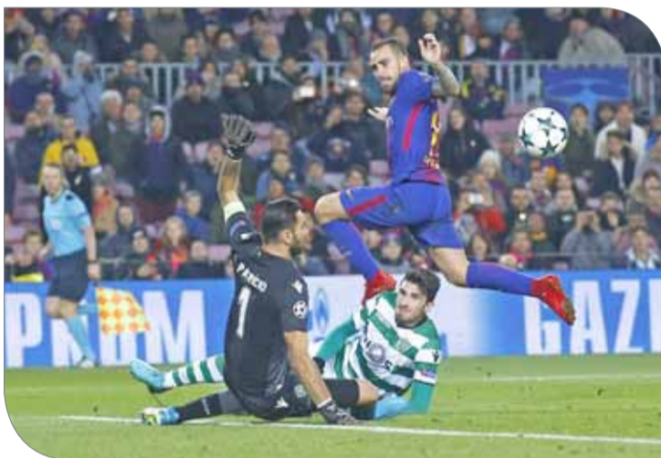
من مواجهة برشلونة وسبورتنغ

وعن قرعة دور الـ16 من دوري الأبطال بعد تأهل برشلونة في الصدارة قال فالفيدي إن فريقه سيقبل بأي خصم في الدور المقبل، محذراً من صعوبة جميع المواجهات في البطولة. وبشأن مواجهة سيلتا فيجو في كأس الملك أكد أن منافسه فريق صعب، ولكنه أشار في الوقت نفسه إلى أن المواجهة تبقى جذابة بالنسبة للجماهير.