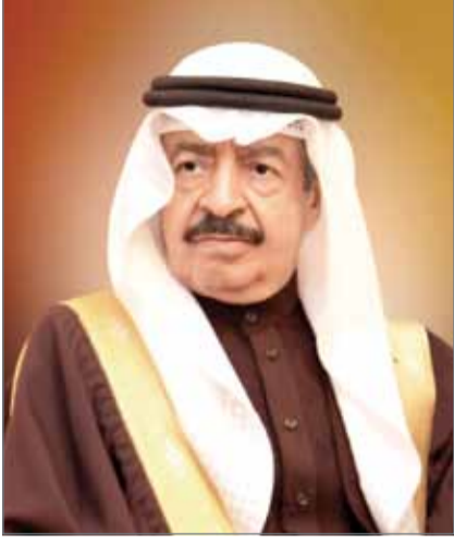
• سمو رئيس الوزراء

على الوزراء - كل فيما يخصه - تنفيذ هذا القرار، ويعمل به من تاريخ صدوره، وينشر في الجريدة الرسمية.