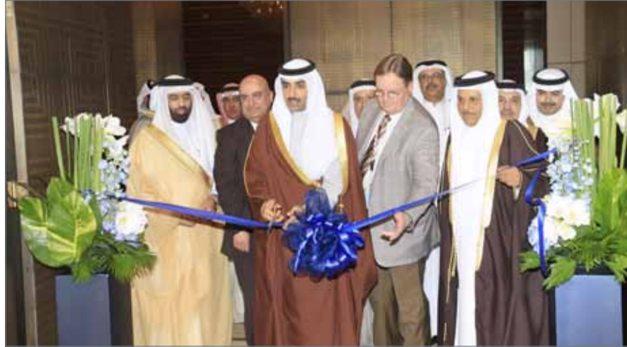
● أثناء افتتاح المعرض المصاحب

● 33 مليار دولار التوقعات بحجم السوق العالمية للمنتجات المحفزة 2018