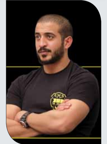
سمو الشيخ خالد بن حمد

اعتمد النائب الأول لرئيس المجلس الأعلى للشباب والرياضة رئيس الاتحاد البحريني لألعاب القوى سمو الشيخ خالد بن حمد آل خليفة جوائز بطولة #أقوى_رجل_بحريني والتي ستقام تحت شعار #خلك_وحش، والتي سينظمها المكتب الاعلامي لسموه في فبراير من العام المقبل بـ "خليج البحرين". وقد حدد سموه جائزة المركز الأول بالوزن الثقيل في البطولة وهي عبارة عن سيارة جيب لاند كروزر، وجوائز مالية لبقية الفائزين بالمراكز الأولى في الوزن الثقيل، المتوسط والخفيف