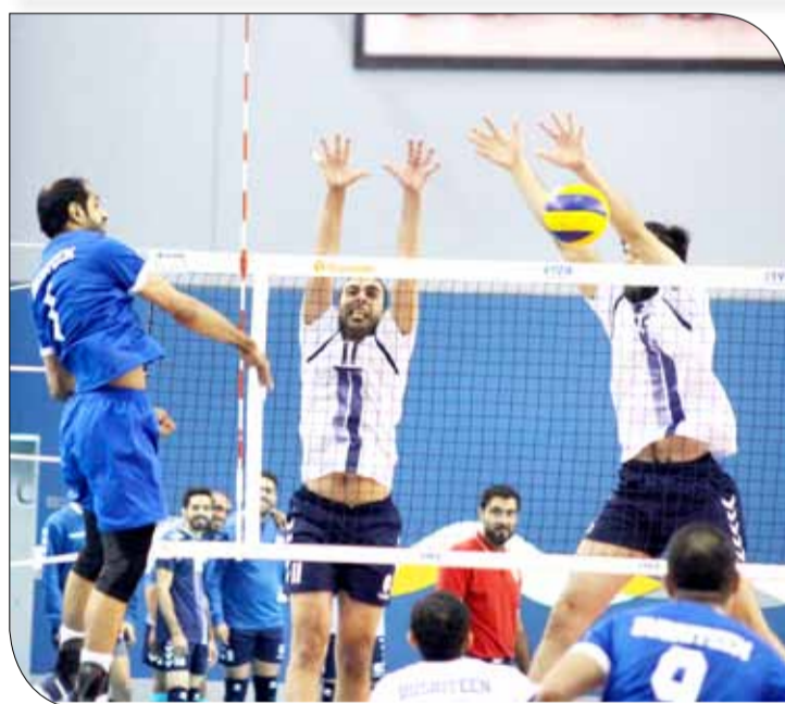
من لقاء النجمة والبسيتين

وكان المحرق فاز على بني جمرة في القسم الأول بالذهاب بثلاثة أشواط نظيفة.