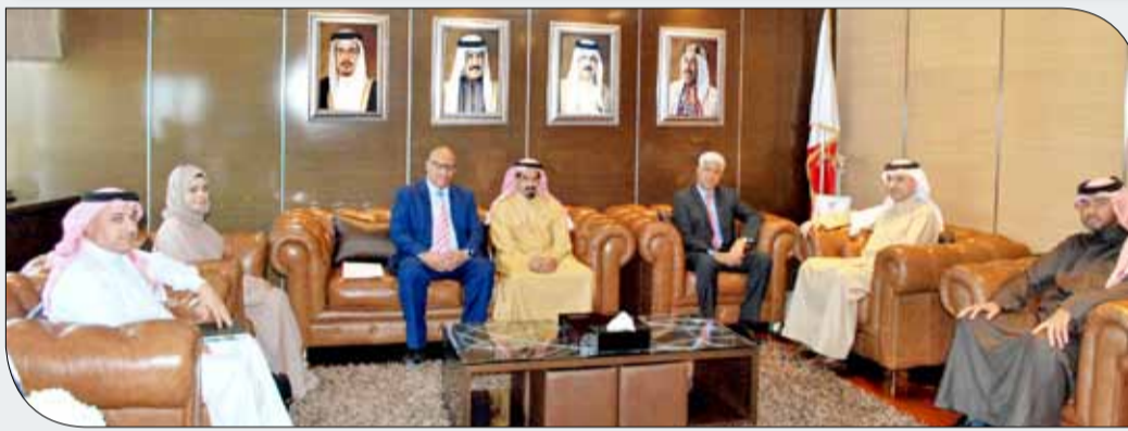
وزير شؤون الشباب والرياضة يستقبل رئيس نادي المالكية

عمل النادي الإداري والفني واحتضان الشباب وتنمية مهاراتهم علاوة على دعم الأنشطة النسوية في الجوانب الرياضية والثقافية وغيرها. وخلال اللقاء ناقش وزير شؤون الشباب والرياضة مع وفد نادي المالكية تحضيرات الفريق للقاء العين الاماراتي ضمن الدور التمهيدي لدوري أبطال آسيا وسير العمل في مشروع المبنى الإداري للنادي وأهمية استثماره بصورة متميزة بعد الانتهاء منه كما تم التطرق الى مخرجات اكااديمية كرة القدم والمشاريع الاستثمارية بالنادي علاوة على نشاطات النادي الموجهة الى الفتيات وبرامجها الثقافية والابتكارية.