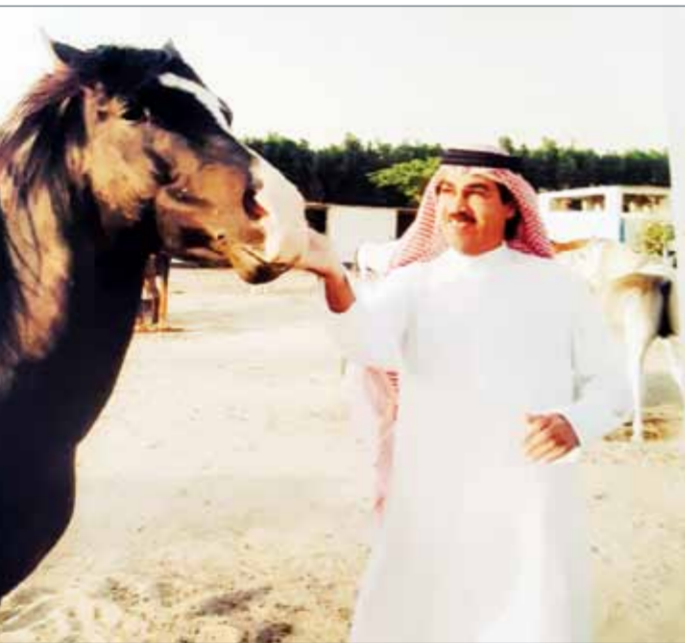
• عيسى بن خليفة

يعد الممد عيسى بن خليفة آل خليفة وسيداه يوم غد السبت عند الساعة العاشرة مساءً. يتحدث البرنامج عن الخيل البحرينية الأصيلة، والدور الكبير الذي لعبته البرامج "الجزء الأول" من البرنامج الوثائقي الجديد "أصايل أهل البحرين" من إعداد الشاعر والإعلامي الشيخ