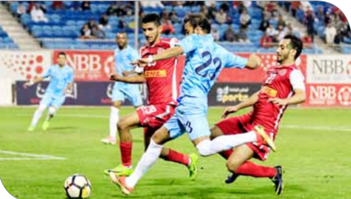
من لقاء المحرق والرفاع

قبل أن يكتفي بالتعادل الذي أجل الجسم لمباراة الإياب. وفي اللقاء الأول يوم أمس، عجز فرقا الاتحاد والنجمة عن هز الشباك؛ لتنتهي المباراة سلبية دون أهداف، ويتبادل الجسم للقاء الإياب.