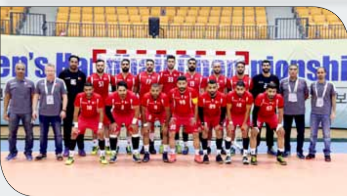
منتخبنا الوطني لكرة اليد

أسلوبه في اللعب مع التشابه الكبير في بعض الجوانب الدفاعية بالاعتماد على الدفاع المغلق، وفي الهجوم يمتلك المنتخبان خيارات عدة في الخط الخلفي، ومن المباريات التي لعبها المنتخب السعودي نجد أن التعويل الأكبر ينصب على حارس مرماه كعنصر مؤثر على وضعية المنتخب في نتيجة المباراة كما حدث أمام إيران وكوريا الجنوبية، أما منتخبنا فلهذه العديد من الحلول وهو ما يسعى المدرب جودنسون الى الاستعانة بها وتفعيلها بالشكل الصحيح وفقاً لمجريات اللقاء.