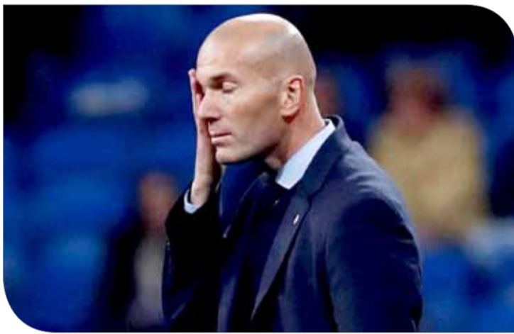
زين الدين زيدان

مدار الـ90 دقيقة ولكننا لم نتمكن، الخطأ مسؤولية الجميع ولكني المسؤول الأول". وأبقى المدرب الفرنسي على العديد من النجوم خارج المباراة مثل البرتغالي كريستيانو رونالدو والويلزي جاريث بيل والبرازيلي مارسيلو، وهو القرار الذي لم يندم عليه. وقال في هذا الصدد "أتحمل مسؤولية قراراتي.. لقد فكرت في هذا الأمر بعد الفوز بهدف في مباراة الذهب، وخوض المباراة الثانية على ملعبنا، ولكني كنت غاضبا بعد بداية المباراة، لا أفهم ما حدث، والآن يجب البحث عن طريقة لتخطي هذه الكبوة". وأكد أن "الحل في الوقت الحالي هو مواصلة العمل" ولا شيء غير ذلك.