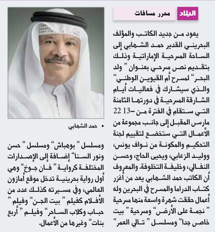
• حمد الشهابي

يعد من جديد الكاتب والمؤلف البحريني القدير حمد الشهابي إلى الساحة المسرحية الإماراتية وذلك بتقديم نص مسرحي بعنوان " ولد البحر" لمسرح أم القيوين الوطني والذي سيشترك في فعاليات أيام الشارقة المسرحية في دورتها الثامنة التي ستقام في الفترة من -22 13 مارس المقبل إلى جانب مجموعة من الأعمال التي ستفرض لتقييم لجنة التكريم والمكونة من نوافل بوس، ووليد الزعابي، ويحيى الحاج، وحسن النخالي، وخليفة التلخوف، والمعروف أن الكاتب حمد الشهابي يعد من أئزر كتاب الدراما والمسرح في البحرين وله أعمال حققت شهرة واسعة منها مسرحية " نجمة على الأرض "ومسرحية " بيت خاص جداً" ومسلسل "تالي العمر"