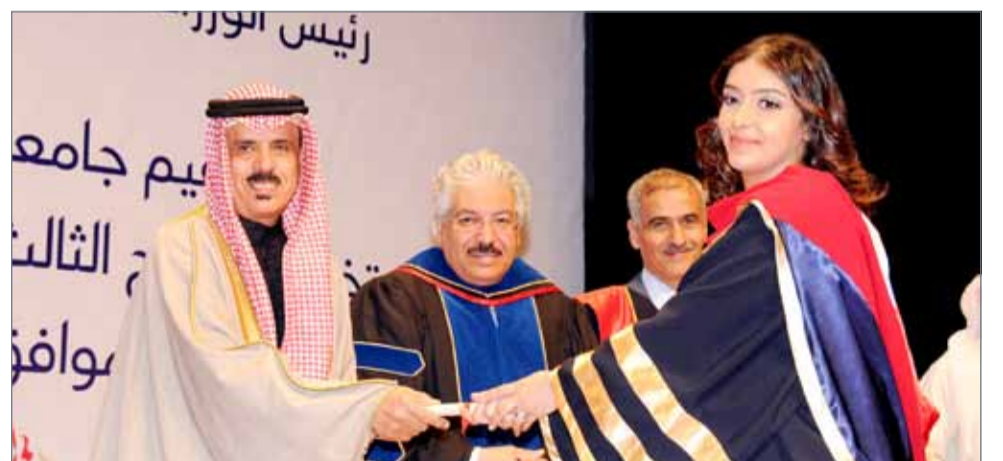
• وزير التربية يكرم الخريجين

وفي كلمته خلال الحفل، أكد رئيس جامعة البحرين رياض حمزة أن الرعاية الكريمة من سمو رئيس الوزراء محل فخر واعتزاز أبناءه وبناته الذين أتموا دراستهم الجامعية بنجاح، وباتوا مؤهلين للمساهمة الفاعلة في مسيرة التنمية والبناء بمملكتنا الغالية في ظل قيادتها الحكيمة، مشيداً بالدعم الذي تحظى به الجامعة من قبل رئيس مجلس أمنائها سعادة وزير التربية والتعليم. بعدها قام نائب راعي الحفل بتوزيع الشهادات على الخريجين والخريجات.