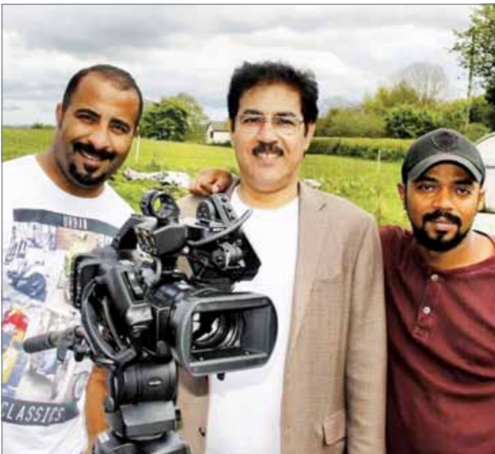
• الممد عيسى بن خليفة وفريق العمل

يعد الممد عيسى بن خليفة آل خليفة وسيداه يوم غد السبت عند الساعة العاشرة مساءً. يتحدث البرنامج عن الخيل البحرينية الأصيلة، والدور الكبير الذي لعبته البرامج "الجزء الأول" من البرنامج الوثائقي الجديد "أصايل أهل البحرين" من إعداد الشاعر والإعلامي الشيخ