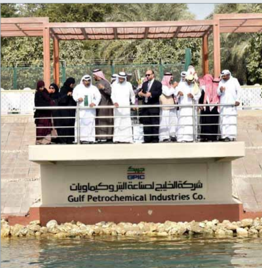
• جانب من زيارة وفد نادي عبدالله بن يوسف فخرو لرعاية الوالدين لشركة "جيبك"