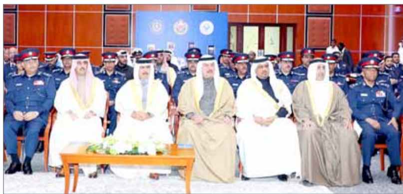
• وزير الداخلية يشهد الاحتفال بمناسبة يوم الجمارك العالمي

يوم الجمارك العالمي، الذي يوافق 26 من يناير من كل عام. وذكر رئيس شؤون الجمارك الشيخ أحمد بن حمد آل خليفة في كلمة أن الإيرادات الجمركية الفعلية ارتفعت بنسبة 6% مقارنة بالعام 2016 لتصل إلى أعلى مستوى إيرادات جمركية منذ انتقال تبعية شؤون الجمارك إلى وزارة الداخلية.