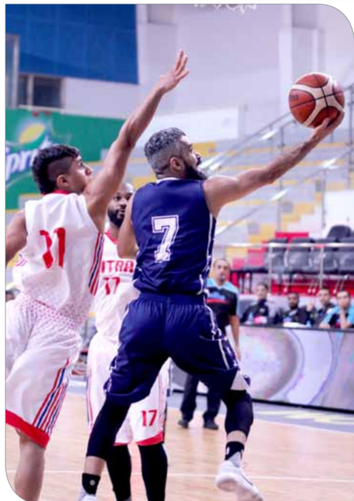
من لقاء النجمة وسطرة