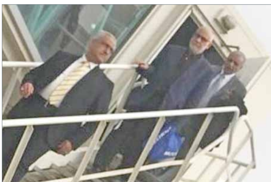
• عبدالفتاح السوداني لدى وصوله إلى مطار بغداد

بغداد - أ ف ب: أعلنت السلطات العراقية الخميس تسلمها وزير التجارة الأسبق عبدالفتاح السوداني المدان بقضايا فساد مالي من الإنتربول بعد اعتقاله في بيروت في سبتمبر الماضي. واعتبر مصدر مقرب من الحكومة العراقية أنه "أول مسؤول بدرجة وزير يأتي مخفوراً بصحة وأمور عراقي ومفطرة من الشرطة الدولية". وأضاف أنها "المرّة الأولى التي يستجيب فيها الإنتربول لطلب حكومي بهذا المستوى". يذكر أن السلطات اللبنانية كانت اعتقلت السوداني، في مطار بيروت الدولي على خلفية مذكرة إلقاء قبض صادرة من الشرطة الدولية في سبتمبر الماضي. وأصدرت المحاكم العراقية العام 2012 حكماً غيابياً بالسجن 7 سنوات على السوداني لإدانته بقضايا فساد إداري ومالي.