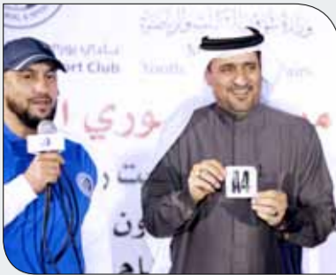
جانب من مراسم سحب القرعة

تسمية الفرق المشاركة في المونديال بأسماء وطنية مرتبطة بتاريخ البحرين العريق عبر العصور من خلال أسماء البحرين التاريخية بالإضافة إلى معلّمين تاريخيين.