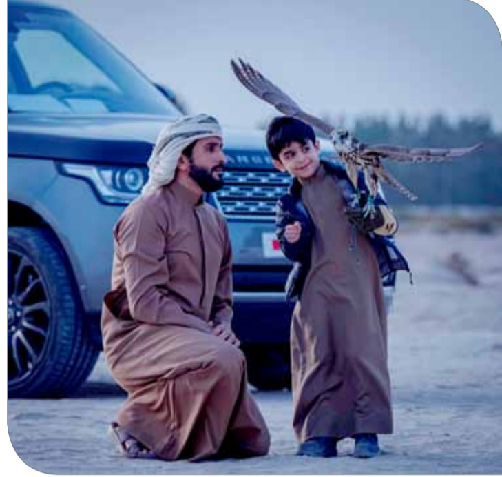
سمو الشيخ ناصر بن حمد