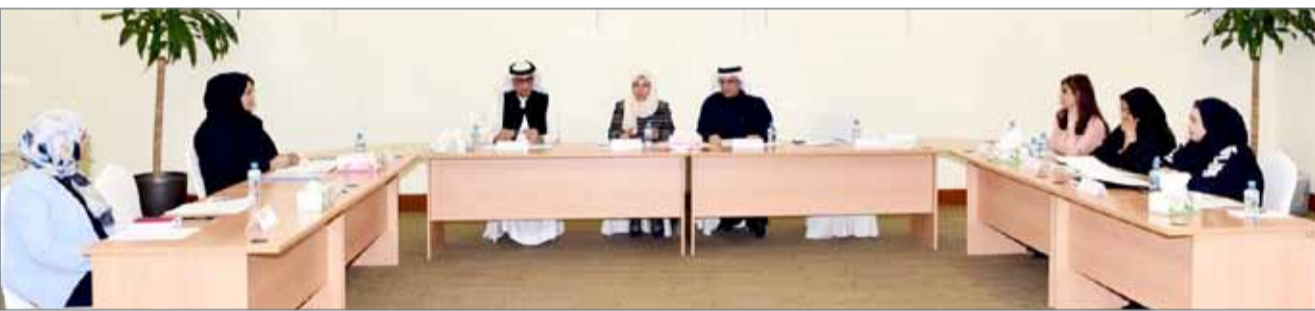
• المجلس الأعلى للمرأة يعقد لقاء تشاوريا مع الجمعيات واللجان النسائية

الجمعيات النسائية والمهنية ولجان المرأة في مؤسسات المجتمع المدني الأعضاء في لجان التعاون عن "المشاريع والبرامج الداعمة للمرأة في مجال عمل الجمعيات النسائية"، وبرامج التوعية والتدريب المقترح تنفيذها في الفترة المقبلة.