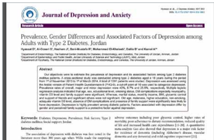
• نشرة مجلة "Journal of Depression and Anxiety"

في الفترة ما بين نوفمبر 2013 وحتى مارس 2014.