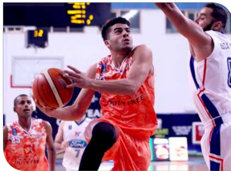
من لقاء الحالة ومدينة عيسى

حافظ فريقا النجمة والحالة على حظوظهما في المنافسة على التأهل للمرحلة النهائية يدورتي زين لكرة السلة، إثر فوزهما الكبير على حساب سطرة ومدينة عيسى على التوالي، في المباراتين اللتين جمعتهما مساء أمس (الخميس)، على صالة اتحاد السلة بأم الحصم، في ختام منافسات الجولة 23.