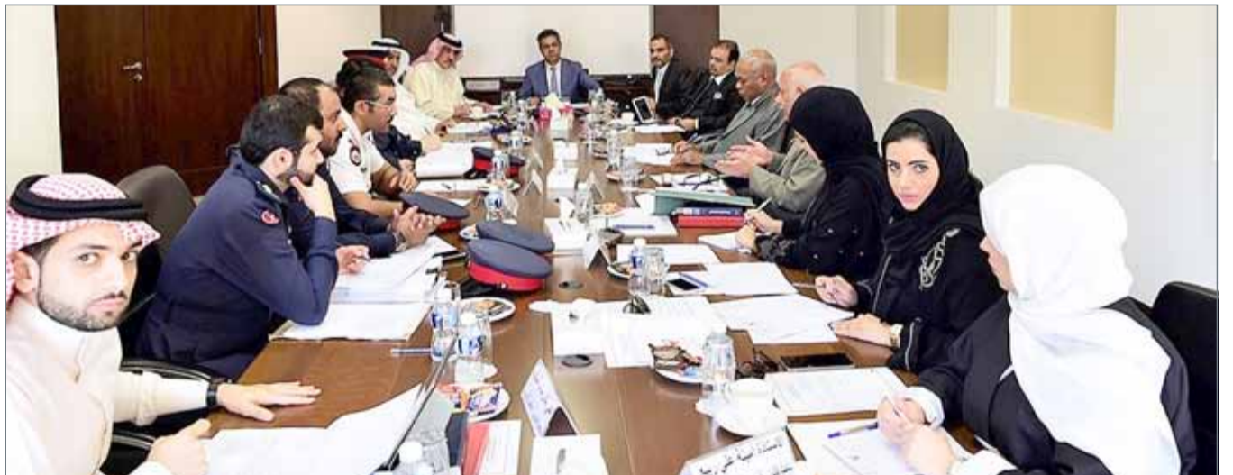
اجتماع سابق للجنة المرافق الشورية

سكنية بالقرب من مشاريع سياحية واستثمارية.