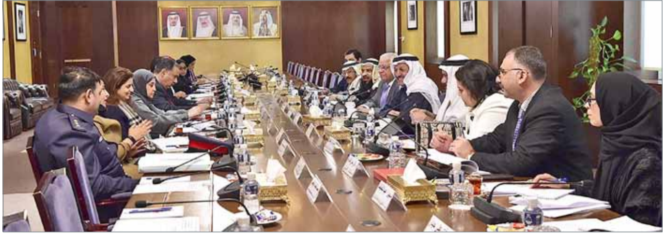
اجتماع سابق للجنة الأمن الوطني الشورية مع الجهات الحكومية

مصطلح ”اللقيط“، وعليه تقترح الوزارة استخدام مصطلح ”مجهول الأبوين أو الأب“ أسوة بهذه القوانين، وحفاظاً على شعور ونفسية هذه الفئة.