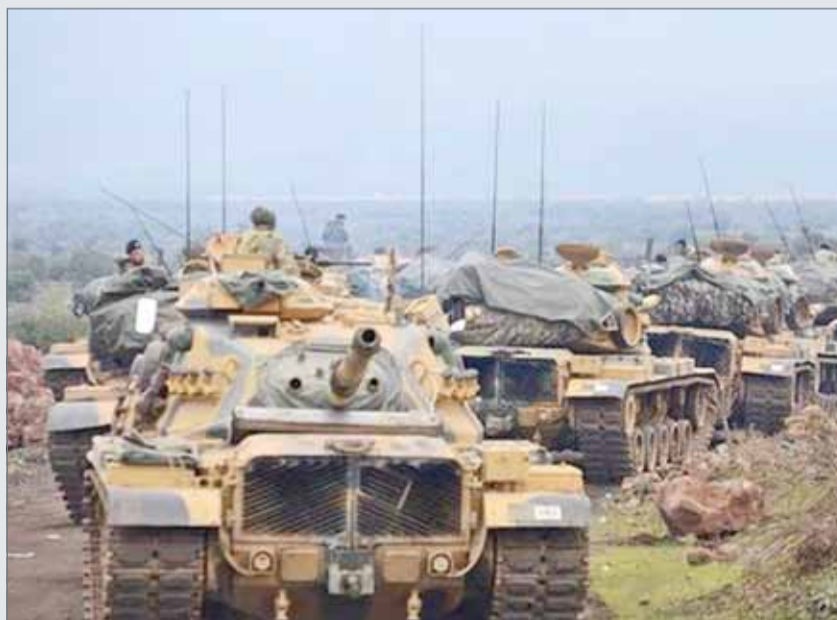
• قوات تركية على الحدود السورية التركية

وأكد نائب رئيس وزراء تركيا، بكر بوزداج، أمس، أنه إذا كانت أميركا تريد تجنب اشتباك محتمل مع تركيا في سوريا فعليها أن تتوقف عن دعم "الإرهابيين" في