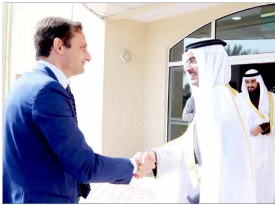
• سمو محافظ الجنوبية مستقبلاً السفير الإيطالي

بالثقافة الإيطالية والمبادرات المستقبلية المثمرة التي يحرص سموه في إقامتها بالمحافظة الجنوبية، مؤكداً السفير الإيطالي مواصلة جهوده وتعاونيه المستمر في تحقيق كل ما تطمح إليه المحافظة الجنوبية من تعاون وتطلعات واستفادة في مجمل الأصدقاء.