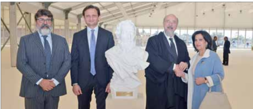
• منظمة "Life Beyond Tourism" تمنح الشخة مي التمثال

النهضة في أوروبا، يعد واحداً من أعظم النحاتين في عصره، إذ كان نحاتاً، معمارياً، رساماً وشاعراً كما ويعد رمزاً من رموز التراث الثقافي لإيطاليا.