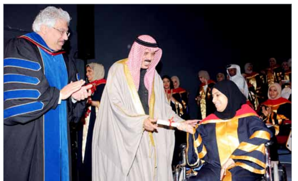
• ويكرم خريجة من ذوي الاحتياجات الخاصة