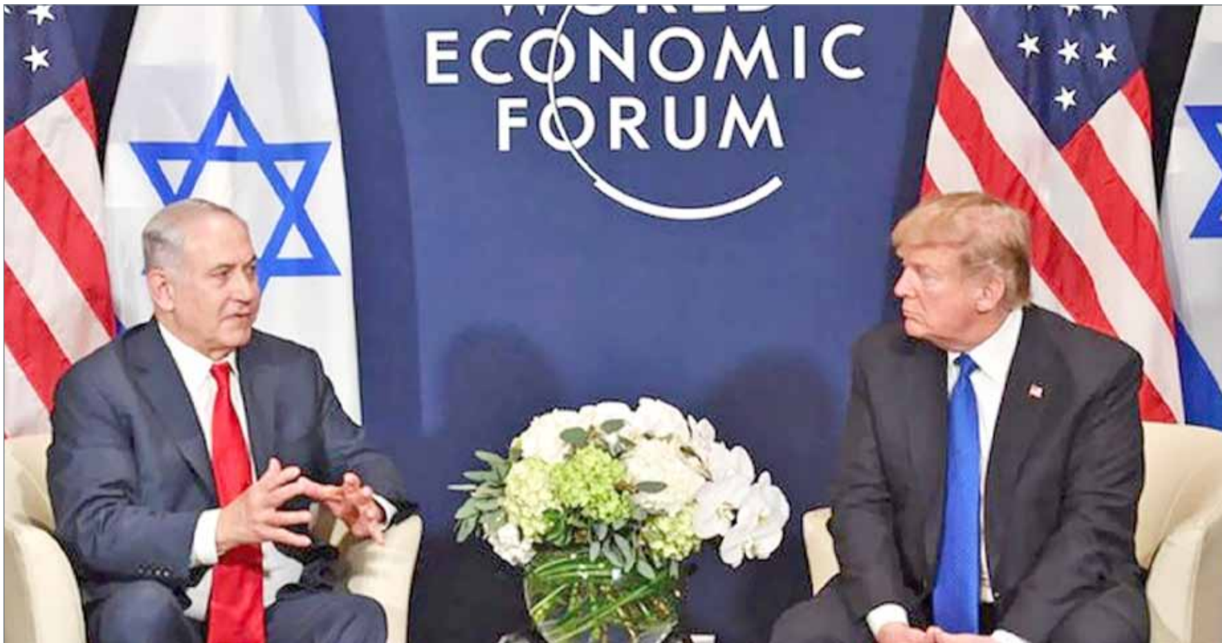
• ترامب ونتياهو في دافوس

دعت بيونغيانغ، إلى إعادة توحيد كوريا الشمالية وكوريا الجنوبية، وحثت كافة الكوريين، سواء كانوا في الداخل أو في الخارج، على التعاون والتواصل فيما بينهم. وذكرت وسائل إعلام محلية في كوريا الشمالية، أن بيونغيانغ ستواجه كل التحديات لأجل إعادة "توحيد شبه الجزيرة الكورية". وحثت بيونغيانغ، الكوريين على إحراز "اختراق" لأجل إعادة التوحيد دون مساعدة من الدول الأجنبية، وفق ما نقلت "سكاى نيوز". وأوردت وكالة الأنباء الرسمية في البلاد، أن التوتر العسكري كان العائق الأبرز أمام تحسين العلاقات بين الكوريين. وأضافت أن المناورات العسكرية مع قوى خارجية في إشارة إلى تدريبات كوريا الجنوبية مع الجيش الأميركي، لم تكن عاملاً مساعداً. وتأتي اللهجة الودية لبيونغيانغ تجاه سيول، تزامناً مع عبور فريق كوريا الشمالية للهوكي الحدود إلى كوريا الجنوبية، وسيشكل لاعبو الفريق مع نظرائهم في كوريا الجنوبية فريقاً موحداً لأول مرة، ينتظر أن يخوض مبارياته في الألعاب الأولمبية الشتوية.