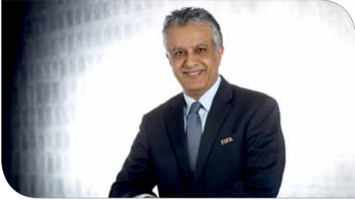
الشيخ سلمان بن إبراهيم

مكتب رئيس الاتحاد الآسيوي لكرة القدم | زيورخ