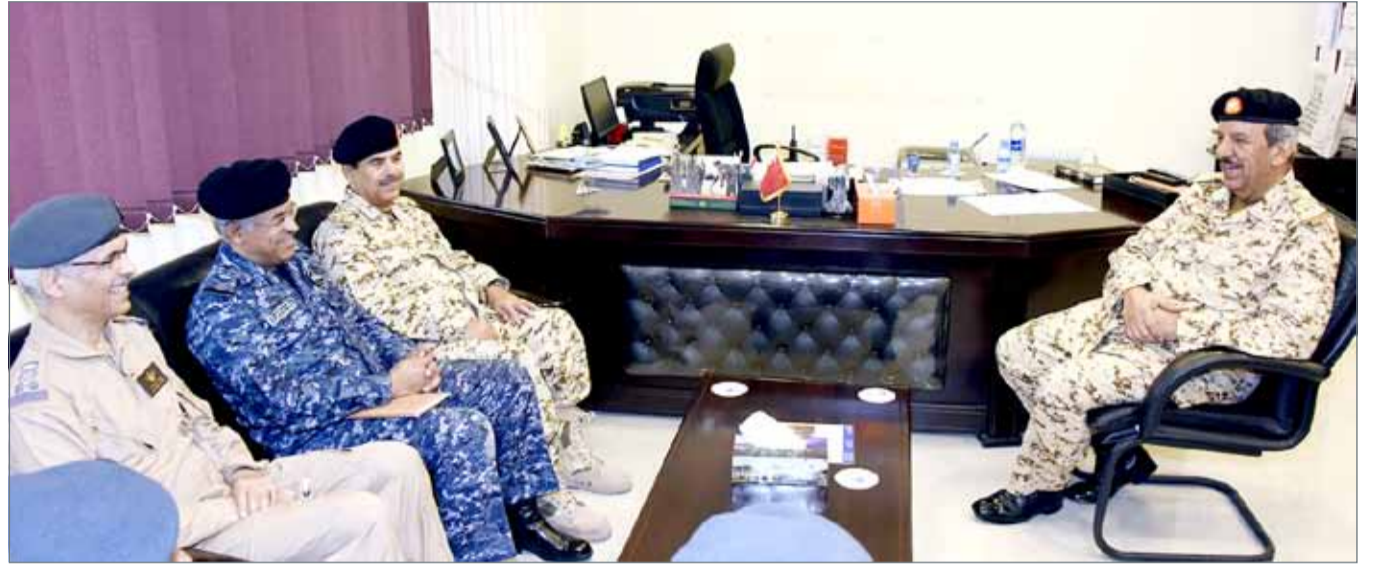
القائد العام في زيارة تفقدية لعدد من أسلحة ووحدات قوة الدفاع

الرفاع - قوة دفاع البحرين: قام القائد العام لقوة دفاع البحرين المشير الركن الشيخ خليفة بن أحمد آل خليفة أمس بزيارة تفقدية لعدد من أسلحة ووحدات قوة دفاع البحرين.