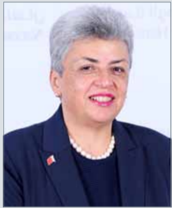
• ماريا خوري

المنامة - المؤسسة الوطنية لحقوق الإنسان: أوضحت رئيس المؤسسة الوطنية لحقوق الإنسان ماريا خوري أن إنشاء مبنى خاص بمحاكم الأسرة سيحقق الخصوصية والرية المطلوبة عبر الابتعاد بالخلافات الأسرية عن مبنى القضاء الخاص بالقضايا الجنائية والجنح، وسيساهم بشكل كبير في الارتقاء بالمنظومة القضائية في مملكة البحرين بما يصب في صالح واستقرار الأسر. وأكدت في مشاركتها حفل افتتاح مجمع محاكم الأسرة الذي تفضلت بافتتاحه قرينة عاجل البلاد ورئيسة المجلس الأعلى للمرأة صاحبة السمو الملكي الأميرة سبيكة بنت إبراهيم آل خليفة أن الإنجاز الوطني المشرف يعزز المكانة الرفيعة لمملكة البحرين بين دول العالم المتقدمة والمتحضرة، وأنه لم يكن ليتحقق لولا حرص جلالته الملك على تأكيد دور الأسرة البحرينية ومكونها الرئيسي (المرأة) على وجه الخصوص كإحدى الدعائم المهمة في المشروع الإصلاحي، وجهود سمو قرينة العاهل في دعم قضايا المرأة بكافة أشكالها من أجل مجتمع مستقر يعطي للأسرة البحرينية