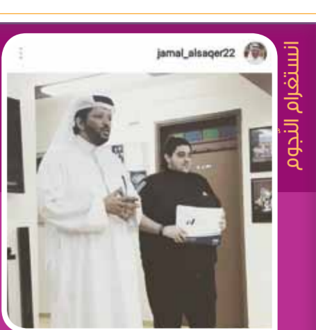
السنة العاشرة - العدد 3391 الجمعة 26 يناير 2018 9 جمادى الأولى 1439