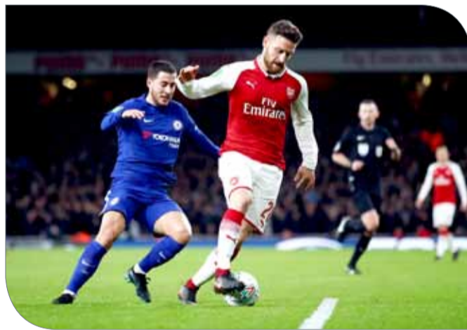
من مواجهة ارسنال وتشيلسي

بيير إيمريك أوباميانج من بروسيا دورتموند الألماني في محاولة لتعويض سانشير. وقال فينجر "أفضل شيء هو عدم الحديث لأن ذلك لن يفيد، لو حدث أي شيء سيكون جيدا، نحن أقوياء بما يكفي للتركيز على تشكيلتنا الحالية... أنا سعيد للغاية بمجموعة اللاعبين التي نملكها". وتابع "نريد تدعيم فريقنا، لكننا لسنا قريبين من التعاقد مع أي لاعب".