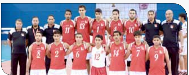
منتخبنا الوطني للشباب لكرة الطائرة