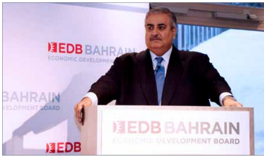
• وزير الخارجية مشاركا في ندوة إفطار نظمتها مجلس التنمية الاقتصادية

وفي الندوة، ناقش الرميحي والمشاركون الندوة بالتعاون الاقتصادي والفرص العديدة للاستثمار في مملكة البحرين ودول الخليج العربية في ظل السياسات الاقتصادية الرشيدة التي تتبناها هذه الدول والتي تنعكس إيجاباً على مختلف مجالات الاستثمار فيها.