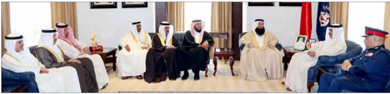
• وزير الداخلية مستقبلاً عدداً من النواب

يهم سلامة الوطن والمواطن ومشاركتهم الإيجابية في دعم الجهود الأمنية للحفاظ على أمن الوطن وصون منجزاته. وتم في اللقاء، بحث عدد من الموضوعات ذات الاهتمام المشترك، والتي من شأنها تعزيز التعاون والتنسيق بين وزارة الداخلية ومجلس النواب، تحقيقاً لمزيد من الأمن والاستقرار في ربوع البلاد.