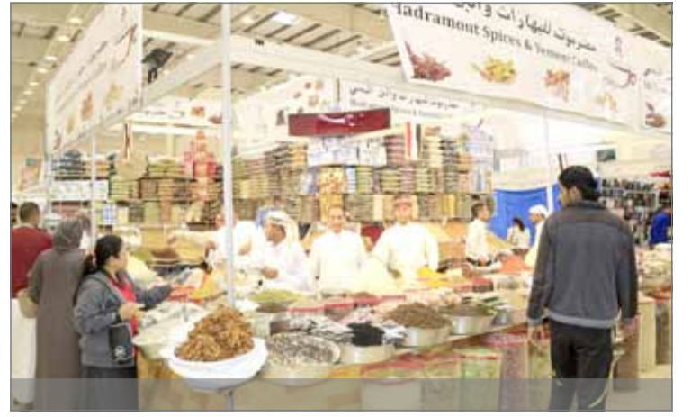
العارضون أشادوا بالتسهيلات التي قدمتها الجهات الرسمية

معرض الخريف 2018 يستمر 9 أيام... مشاركون: