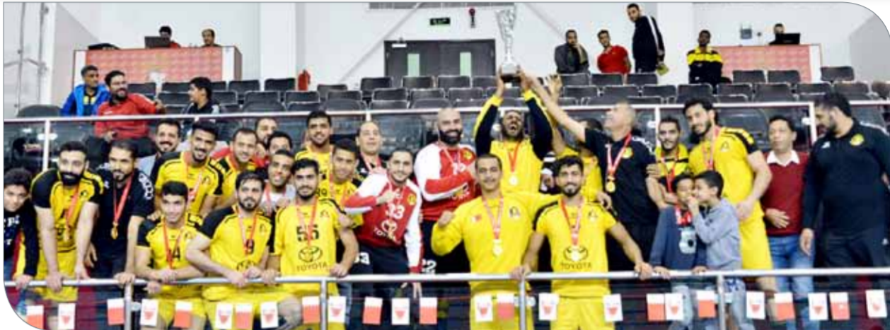
جانب من التتويج

آخر دقائق المباراة شهد حضورا لرابطة الأشلهي التشجيعية التي احتفلت بفوز فريقها.