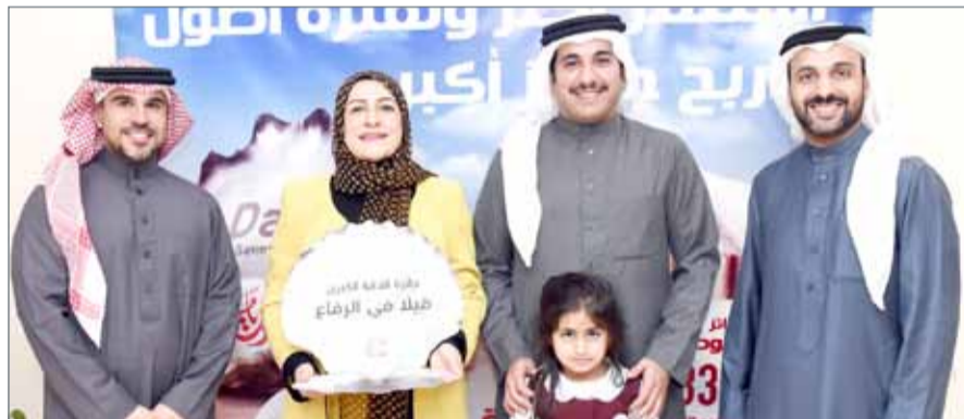
• أثناء تسليم الجائزة الكبرى

أحد فروع مصرف السلام-البحرين والاستثمار بمبلغ 50 د.ب كحد أدنى. وستجري السحبوات الشهرية تحت إشراف مندوب من وزارة التجارة والصناعة والسياحة بالإضافة إلى المدقق الداخلي للمصرف وممثل المدققين الخارجيين حسب القواعد المتبعة لكل من مصرف البحرين المركزي ووزارة التجارة والصناعة والسياحة في المملكة.