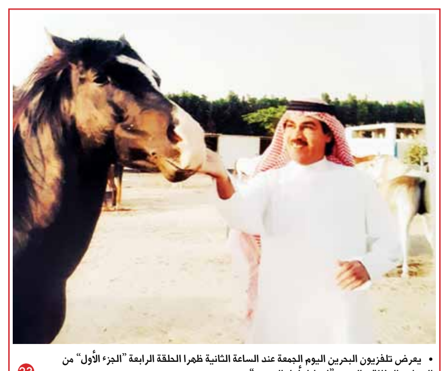
• يعرض تلفزيون البحرين اليوم الجمعة عند الساعة الثانية ظهراً الحلقة الرابعة "الجزء الأول" من البرنامج الوثائقي الجديد "اصابيل أهل البحرين"

بغداد - أ ف ب: أعلنت السلطات العراقية الخميس تسلمها وزير التجارة الأسبق عبدالفتاح السوداني المدان بقضايا فساد مالي من الإنتربول بعد اعتقاله في بيروت في سبتمبر الماضي. واعتبر مصدر مقرب من الحكومة العراقية أنه "أول مسؤول بدرجة وزير يأتي مخفوراً بصحة وأمور عراقي ومفطرة من الشرطة الدولية". وأضاف أنها "المرّة الأولى التي يستجيب فيها الإنتربول لطلب حكومي بهذا المستوى". يذكر أن السلطات اللبنانية كانت اعتقلت السوداني، في مطار بيروت الدولي على خلفية مذكرة إلقاء قبض صادرة من الشرطة الدولية في سبتمبر الماضي. وأصدرت المحاكم العراقية العام 2012 حكماً غيابياً بالسجن 7 سنوات على السوداني لإدانته بقضايا فساد إداري ومالي.