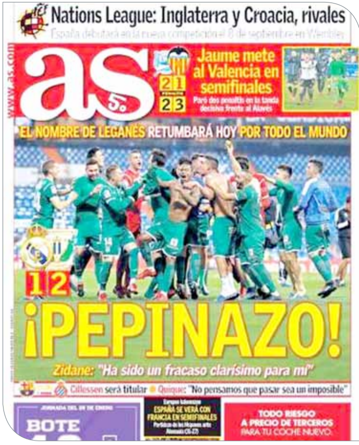
غلاف صحيفة "أس"