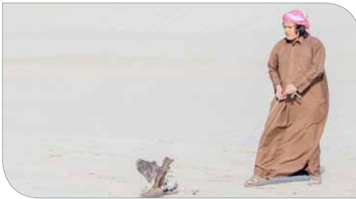
جانب من المنافسات

تواصل اليوم منافسات الأسبوع الرابع لمسابقة ناصر بن حمد للصقور والصيد، حيث ستقام اليوم فعاليات. وتنطلق فعاليات اليوم الثاني بالتحضير لفئة الحرار وفئة جيرات الخلط، فيما ستطلق ظهراً منافسات المسابقة بمشاركة 80 صقاراً في الفئتين، حيث يتنافس على لقب فئة الحرار 40 صقاراً، وفئة جيرات الخلط 40 صقاراً، وهم الذين تأهلوا من الأشواط التأهيلية الأولى والثانية. يذكر أن الأسبوع الرابع سيختتم يوم السبت بإقامة منافسات فئة الشواهين وفئة جيرات الشواهين.