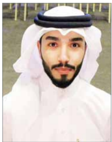
• فهد السيابى

أصدر القاص والروائي فهد السيابى حديثاً عن الدار العربية للعلوم ناشرون ببلنات - بعد سنوات ثلاث من صدور روايته الأولى "أن تدفن حياً" - مجموعة قصصية، بعنوان "الموت سلمة رخيصة".