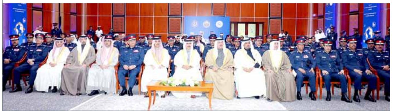
• وزير الداخلية يشهد الاحتفال بمناسبة يوم الجمارك العالمي