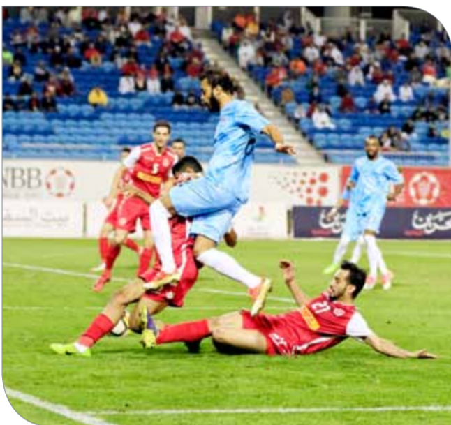
من لقاء المحرق والرفاع

جاء الشوط الأول من القمة قويا وتنافسيا بدرجة كبيرة، واستطاع الرفاع تسجيل هدف مبكر عند الدقيقة (9) بعدما لعب كمبول الأسود كرة طويلة أمامية تمكن على إثرها المدافع الأيسر راشد الحوطي من كسر مصيدة التسلسل، والتوغل داخل المنطقة؛ ليسكن الكرة برأسه بينه وبين الشباب الذي كان يجاهد لتقليصها ونجح في ذلك حينما بلغ فارق الهدف 22/23 إلا أن الأهلي كان يعاود بتوسيعها بفضل خبرته الحاسمة والصارمة ليبيهي اللقاء 26/28.