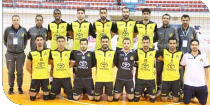
فريق الأهلي لكرة الطائرة