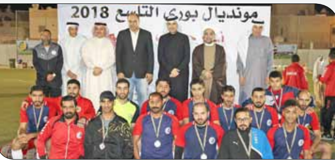
الجودر، متوج الفريق الفائز