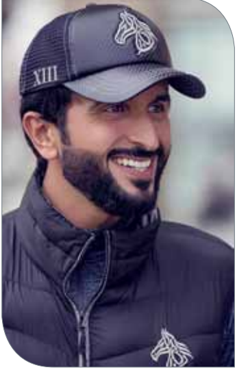
سمو الشيخ ناصر بن حمد

ويقام الشوط الخامس على كأس سمو الشيخ حمد بن ناصر بن حمد آل خليفة لخياد الدرجة الأولى "مستورد" مسافة 1400 متر، والجائزة 4000 دينار، وبمشاركة 14 جواداً. ويقام الشوط السادس على كأس سمو الشيخ ناصر بن حمد آل خليفة لخياد الدرجة الأولى (نتاج محلي) مسافة 2000 متر، والجائزة 5000 دينار. وتتجه الأنظار نحو الشوط السابع والأخير الذي سيقام على كأس سمو الشيخ ناصر بن حمد آل خليفة لخياد الدرجة الأولى "مستورد" مسافة 2000 متر، والجائزة 10000 دينار.