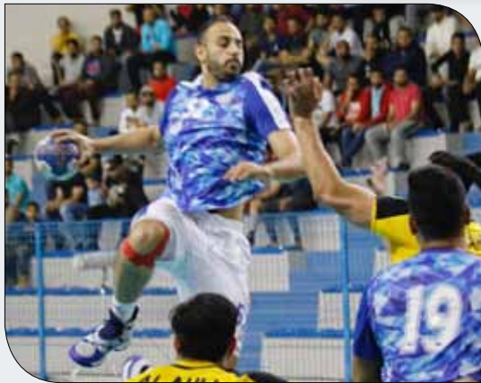
من لقاء الأهلي والنجمة أمس