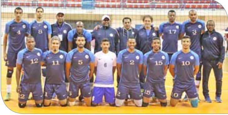
فريق الهلال السعودي