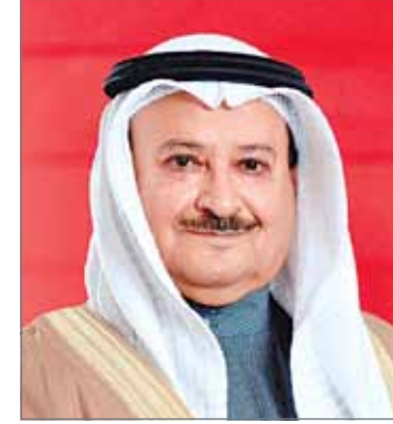
• الشيخ محمد بن خليفة

وأضاف "لقد شهدنا ترجيحاً في صافي الأرباح وهو أمر طبيعي في ظل الإستراتيجية المتحفظة والصرامة التي يتبعها فريق الإدارة في احتساب الانخفاض