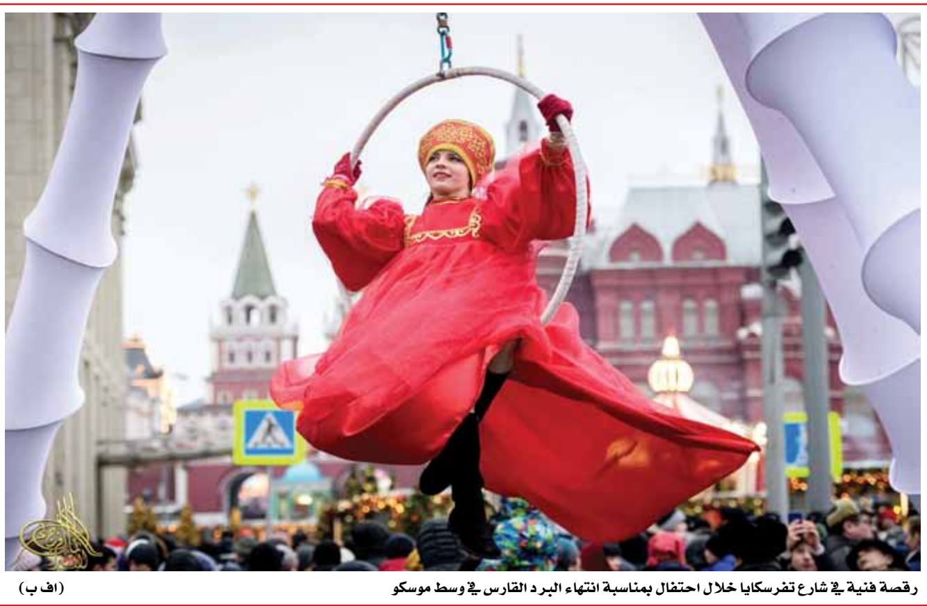
رفصة هنية في شارع تفرسكايا خلال احتفال بمناسبة انتهاء البرد القارس في وسط موسكو (اف ب)

حالة الطقس الطقس غائم جزئيا احيانا يتحول إلى غائم في وقت لاحق غدا مع فرصة لتساقط امطار خفيفة متفرقة.