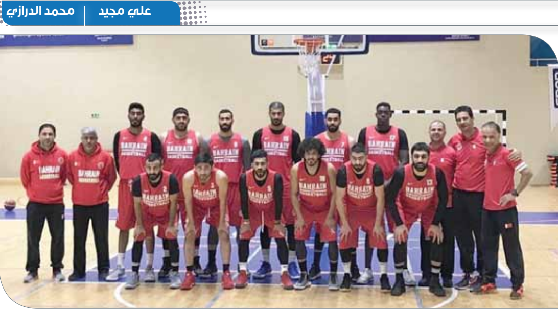
منتخبنا الوطني الأهل لكرة السلة

في دائرة المنافسة من خلال مرحلة الذهاب وهي الأهم طالما أن منافساتنا تدار على أرضنا وبين جمهورنا.