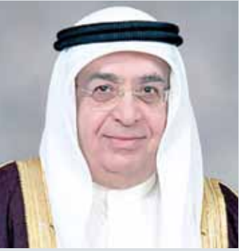
• سمو الشيخ محمد بن مبارك

المنامة - بنا: استقبل نائب رئيس مجلس الوزراء سمو الشيخ محمد بن مبارك آل خليفة بمكتبه بقصر القضيبيية امس سفير كوريا الجنوبية لدى مملكة البحرين كو هيون. وخلال اللقاء استعرض سموه مع السفير علاقات الصداقة والتعاون القائمة بين مملكة البحرين وجمهورية كوريا الجنوبية وأهمية تميئتها وتعزيزها في كافة المجالات لما فيه خير وصالح شعب البلدين. كما أشاد سموه بما حقته وتحققه جمهورية كوريا الجنوبية من تقدم في مختلف المجالات.