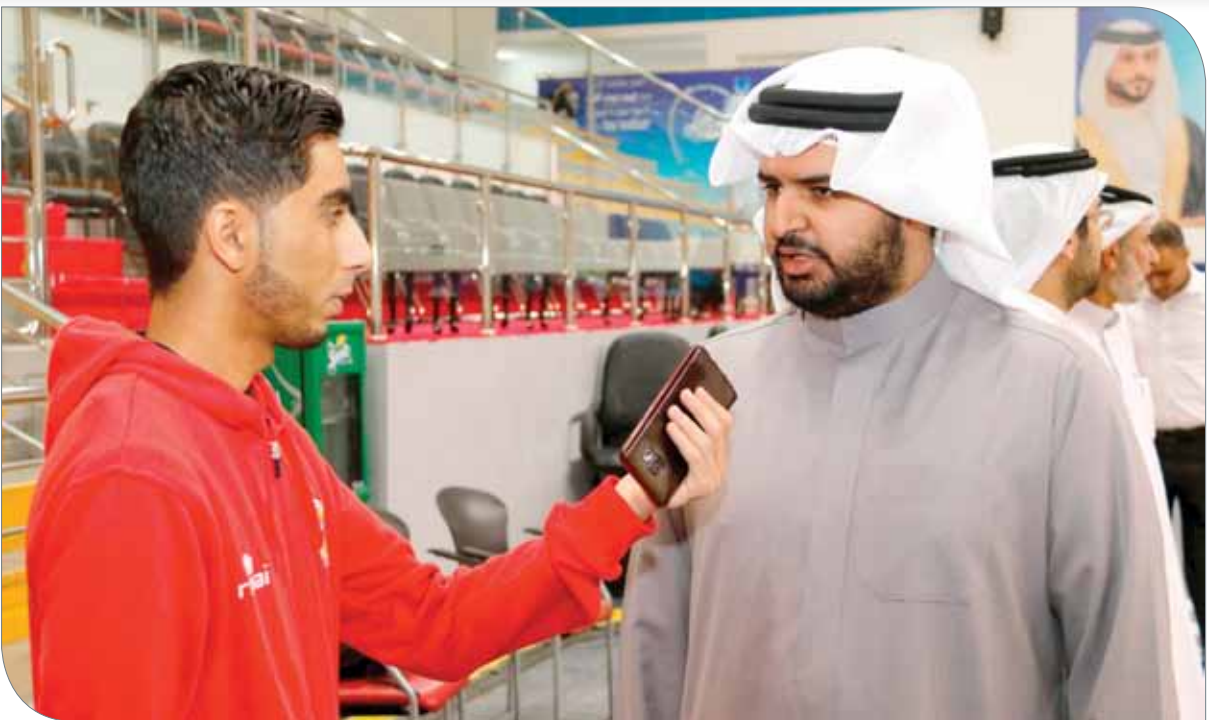
سمو الشيخ عيسى بن علي متحدًا لـ ”البلاد سيورت“

لطالما لبث نداء الوطن وكالت لها وقلقات مشرفة مع جميع المنتخبات الوطنية واليوم هي أمام مهمة وطنية جديدة تستدعي وقتهم مع منتخب رجال السلة. التمنيات بالتوفيق وأهني سمو رئيس الاتحاد تصريحه لـ ”البلاد سيورت“ متمنيا كل التوفيق لمنتخبنا في مباراته الأولى أمام شقيقه الإماراتي، مؤكداً أهمية فقرة البداية في مشوار التصفيات.