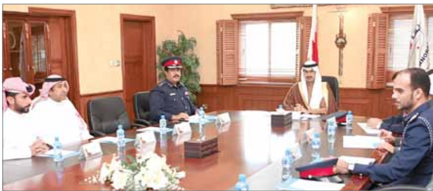
• سمو الشيخ خليفة بن علي آل خليفة مترئساً الاجتماع الأمني

عوالي - المحافظة الجنوبية: ترأس محافظ الجنوبية سمو الشيخ خليفة بن علي آل خليفة الاجتماع الأمني في قاعة الاجتماعات بالمحافظة الجنوبية بحضور الضباط الأعضاء من الجهات الأمنية المعنية. ثم تناقش سمو محافظ الجنوبية مع أعضاء اللجنة في عدد من القضايا والمواضيع الأمنية أبرزها المؤثرات المعروفة من قبل الجهات الأمنية بشأن موسم البر، والتي تشير إلى نجاح الموسم من جوانب عدة كلف على إثرها