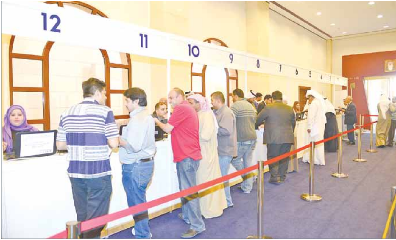
• لقطة من عملية الانتخابات السابقة (أرشيفية)