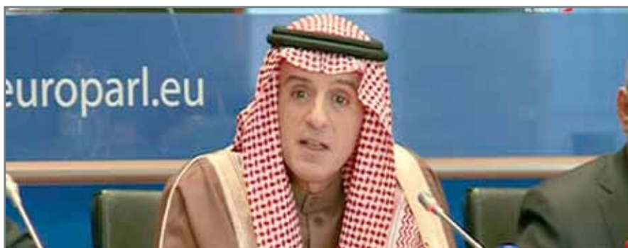
• عادل الجبير في كلمة له أمام البرلمان الأوروبي.

أن الاتفاق النووي الحالي لا يكفي لتعديل سلوك إيران. وأضاف الجبير، إن إيران تسعى للتدخل في شؤون الدول من خلال الطائفية. وتابع: "لا تتسامح أبداً مع الإرهاب ومع تمويله ومع دعم