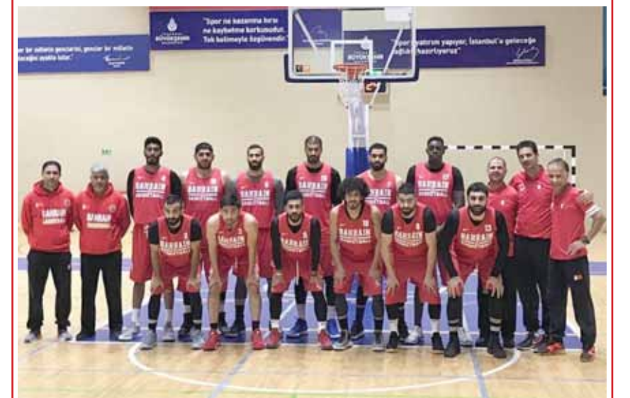
• منتخبنا الوطني الأول لكرة السلة