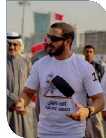
سمو الشيخ خالد بن حمد

الأول من البطولة، حيث قدم فقرة على مسرح البطولة تحدثت عن أهمية ممارسة الرياضة والمزج بين الرياضة والعمل الإنساني، مشيداً خلالها بتوجيه سمو الشيخ خالد بن حمد آل خليفة بتخصيص ربع هذه البطولة لدعم مرضى السرطان، مؤكداً أن هذه المبادرة تعكس حرص واهتمام سموه على توجيه الدعم لجميع الحالات الإنسانية بالمجتمع البحريني.