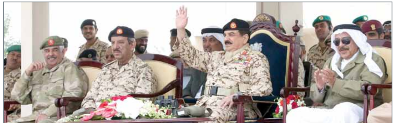
• العامل لدى رعايته حفل ختام كأس جلالاته لبطولة الضاحية العسكرية

وتدريب احترافي متقن، مما يؤكد حرصهم لتحقيق الفوز دائماً. وأشاد جلالاته بالإنجازات الرياضية المميزة التي حققتها قوة الدفاع في العديد من المنافسات في المحافل الإقليمية والدولية، معرباً عن تهنئته للفرق الفائزة.