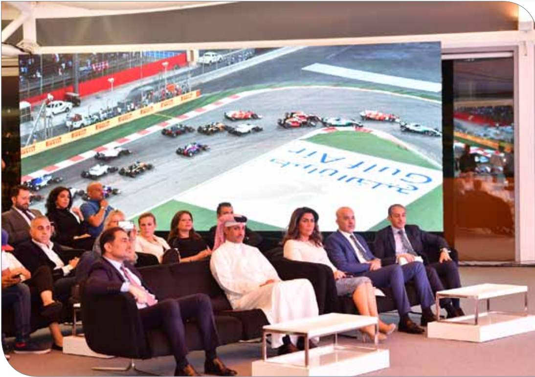
لقطات من المؤتمر الصحافي

وجدينا لهذا العام هو 3 تجارب مثيرة مقدمة لجماهير وزار السباق العالمي، إذ سيخربون فرصة الطيران في الهواء من خلال 3 فعاليات أولها: البنجي العكسي، وتجربة السقوط الحر، والفعالية الثالثة سكاى كوستر. إلى جانب عدد من العروض البهلوانية المثيرة كعروض والفرق المتجولة التي ستمتع زوار السباق.