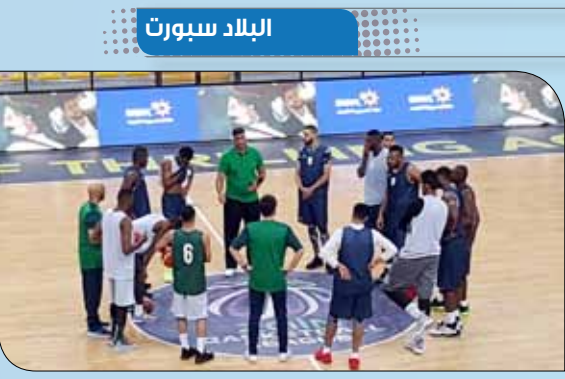
لقطة لتدريب المنتخب السعودي

أنهت المنتخبات تحضيراتها واستعداداتها لخوض مرحلة الذهاب من التصفيات الآسيوية التي ستقام على أرض مملكة البحرين. إذ تدرت المنتخبات تباعاً زهاء ساعة واحدة على صالة أم الحمص التي تستضيف المنافسات. المنتخب العماني بدأ تدريباته منذ الرابعة عصرًا وتلاه السعودية وعقب ذلك منتخبنا الوطني وأخيراً المنتخب الإماراتي.