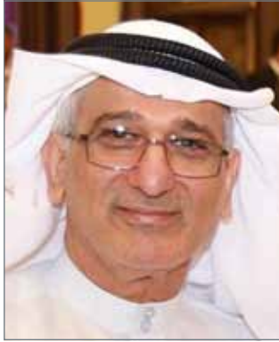
• رئيس كتلة تعاون حميد الحلبي

وتعقد الانتخابات في ظل مخاوف لشرعية واسعة من أعضاء الغرفة والمرشحين من إمكان حدوث حالات تزوير، أو تلاعب في كشوف الناخبين، في حين أكد رئيس لجنة الانتخابات جاسم عبدالعال اتخاذ جميع التدابير اللازمة؛ لضمان نزاهة الانتخابات، وزيادة الطاقم والتجهيزات لاستقبال وانسياب عملية التصويت.