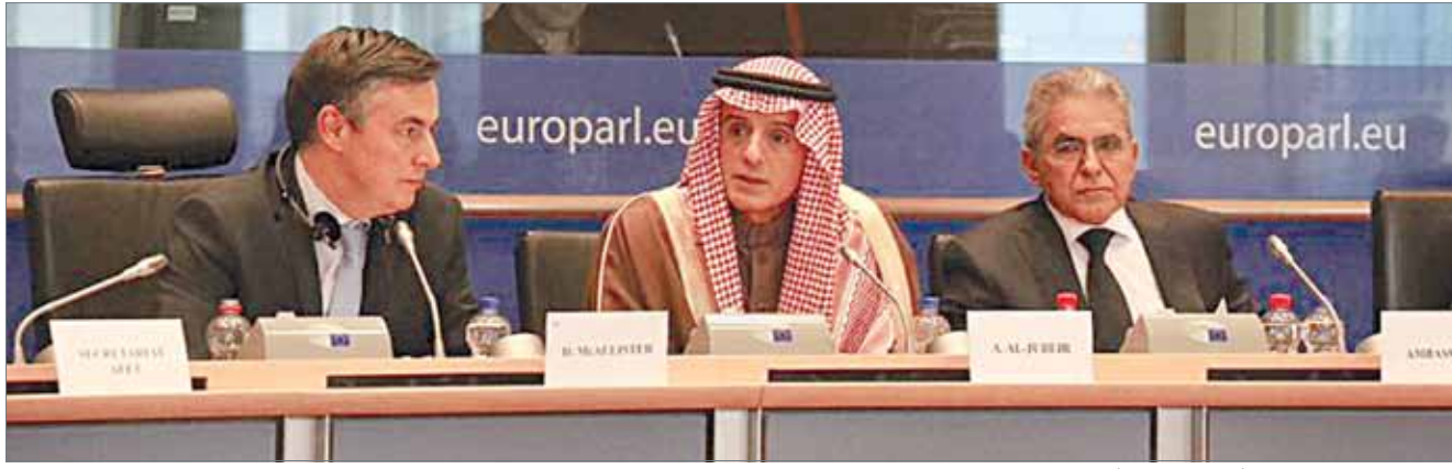
عادل الجبير في كلمة له أمام البرلمان الأوروبي

بعلاقات تألف مع جماعة الإخوان المسلمين، مضيفاً أن السعودية حاولت على مدى 15 عاماً ثني الدوحة عن تلك السياسة. وقال: "كل ما نطلبه من قطر هو وقف التدخل في دولنا، والكف عن دعم الجماعات الإرهابية". وأضاف "نرفض أن يكون الإعلام القطري منصة لاستضافة المتطرفين والإرهابيين".