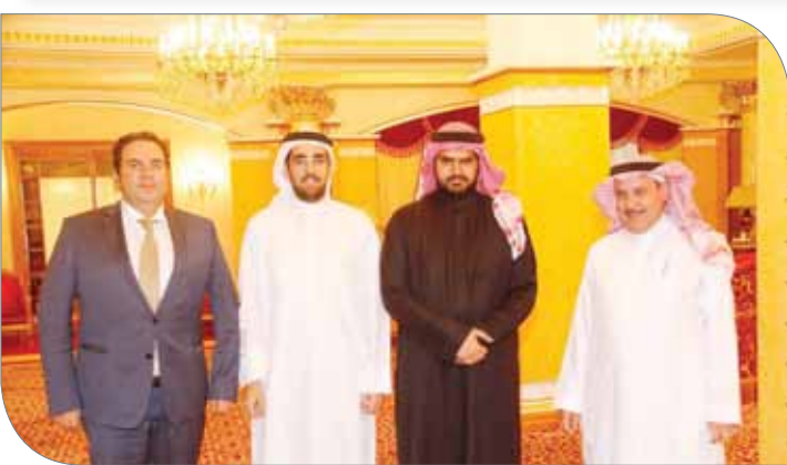
سمو الشيخ عيسى بن علي مستقبلاً نظيره السعودي

الاجتماع الفني عقدت اللجنة المنظمة للمرحلة الأولى من تصفيات الاتحاد الدولي المؤهلة لكأس آسيا في مملكة البحرين الاجتماع الفني في إحدى قاعات فندق سكن الوفود، بحضور مندوبي المنتخبات الأربعة المخاركة. وناقش الاجتماع مختلف الجوانب الفنية ذات الصلة بالتصفيات، كما تم شرح القوانين والأنظمة واللوائح المعمول بها في هذه التصفيات والعديد من النقاط المهمة ذات العلاقة.