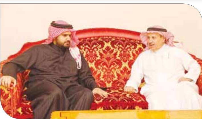
سمو الشيخ عيسى بن علي مستقبلاً نظيره السعودي

الإماراتي؛ للمشاركة في تصفيات الاتحاد الآسيوي بعد وصول منتخبنا السعودي وعمان الذي حرص على القدوم مبكراً لإقامة معسكر تدريبي. وكان في استقبال وفد المنتخب الإماراتي