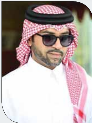
سمو الشيخ فيصل بن راشد

الفرسان والفارسات المشاركين في بطولة سمو الشيخ فيصل بن راشد آل خليفة اليوم بمراعاة خيلهم ومتابعة أحواله الصحية والإشراف على كل المتطلبات وعدم إهمال حصص التدريب المستمر في كل المواسم لخوض المسابقات الكبرى ونيل المراكز الأولى، ونحفز الشباب الجدد لخوض هذه الرياضة بالحضور؛ لمتابعة مسابقات القفز في المسابقات القادمة، فهي رياضة جميلة وممتعة وملينة بالإثارة والتشويق.