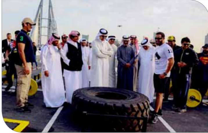
... وسموه خلال الجولة بموقع البطولة

في بادرة جميلة، قامت اللجنة المنظمة العليا للبطولة باستضافة عدد من المصابين بمرض السرطان للمشاركة بفعاليات اليوم الافتتاحي. حيث تم استضافتهم على مسرح البطولة، وتحديثاً خلال ذلك عن قصتهم مع هذا المرض ومحاربتهم له.