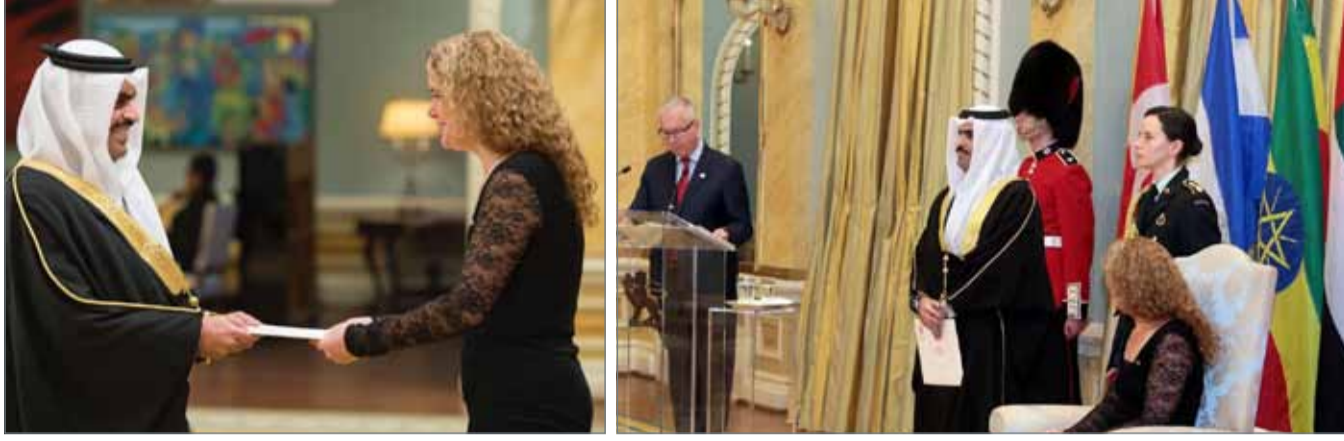
• الشيخ عبدالله بن راشد يقدم أوراقه اعتماده سفيرا غير مقيم للمملكة إلى الحاكم العام الكندي

العربية برئاسة عميد السلك الدبلوماسي سعادة السفير نايف السديري سفير المملكة العربية السعودية لدى كندا في العاصمة الكندية أوتاوا.