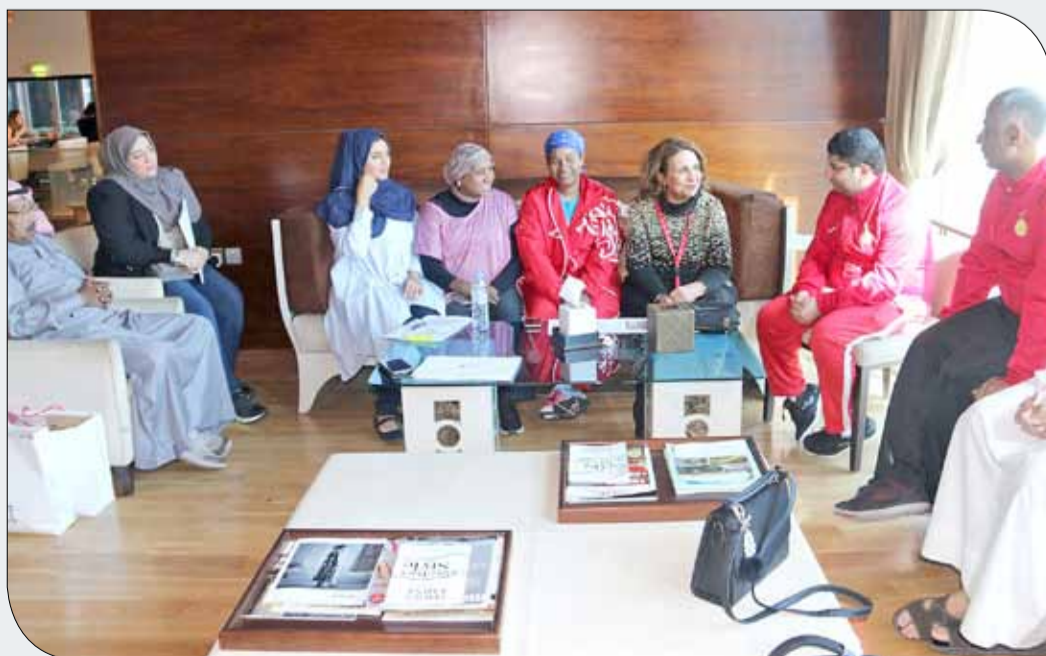
حياة بنت عبدالعزيز أثناء لقاء البعثة الإدارية

اختصاصه خصوصاً اللاعبات اللواتي يقع على عاتقهن تقديم أفضل ما لديهن؛ من أجل اعتلاء منصة التتويج وتشريف سمعة الرياضة البحرينية. وأكدت وقوفها مع جميع أفراد البعثة وحرصها التام على توفير مختلف الظروف الملائمة لإنجاح المشاركة، متمنية لجميع الأندية التوفيق والنجاح في المعترك العربي بما يسهم في مواصلة سلسلة النجاحات والإنجازات التي حققتها الرياضة البحرينية. يذكر أن الشارقة حياة بنت عبدالعزيز بالبعثة خلال وجودها وتبادلت معهم الأحاديث الودية وحثت الجميع على أهمية العمل بجد واجتهاد؛ من أجل التمثيل المشرف في الاستحقاق العربي كل بحسب