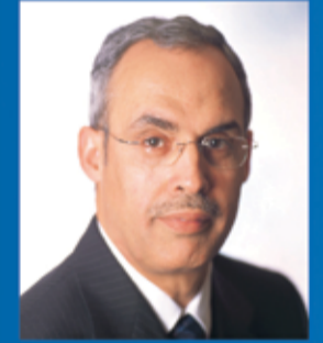
سعادة السيد رشيد المعراج المحافظ مصرف البحرين المركزي