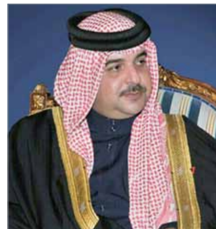
• سمو الشيخ عبدالله بن حمد

كما أكد سموه التزام المجلس الأعلى للبيئة بدعم وتطوير المبادرات البيئية التي تعزز المحافظة على البيئة البحرية والثروات الوطنية، مشيراً إلى أن المجلس وبالتعاون مع الجهات المعنية يسير بخطى ثابتة نحو رسم الخط البيئية الاستراتيجية وترجمتها على أرض الواقع.