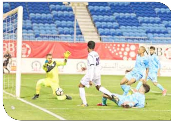
من لقاء الرفاع والنجمة

◆ لم يظهر الشوط الأول بالصورة المتوقعة بين الطرفين، مع أفضلية في الفرص المحققة للتهديد لصالح النجمة، دون أن تترجم إلى أهداف.