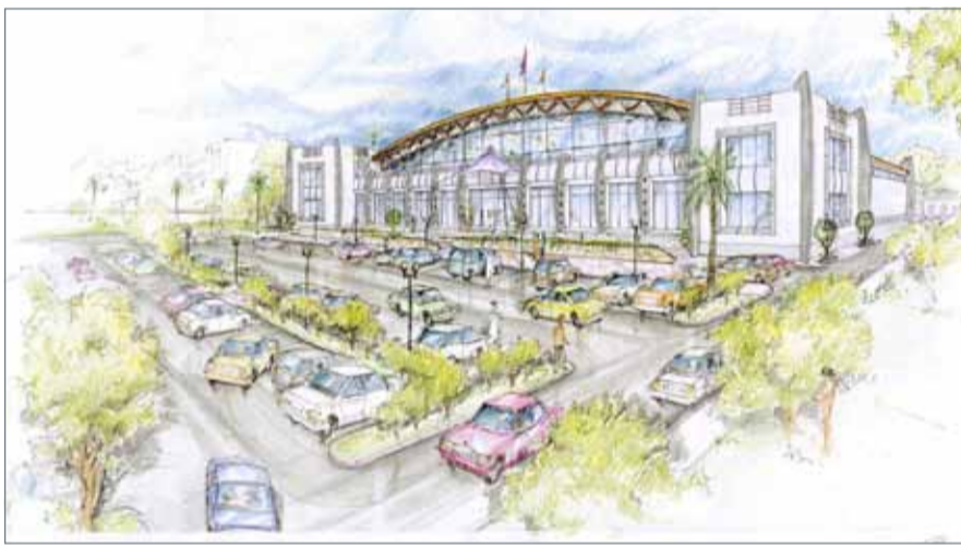
• تصور تخيلي للمركز

وأشار المشعل إلى أن الهيئة تعمل على المشاركة في المعارض الدولية المتخصصة والعامه، إذ تشارك فيها الشركات المصدرة لتقديم أنفسهم ومنتجاتهم والاتصال بالعملاء والموزعين المرتقبين في الأسواق الخارجية المستهدفة وتقوية العلاقة بهم والتعاقد معهم إضافة إلى اكتساب الخبرة والفائدة، وإصدار النشرات والبرامج التليفزيونية التعريفية بالصناعة الوطنية؛ ليتم توزيعها في مختلف دول العالم وبناء صفحات تعريفية على شبكة المعلومات الانترنت للتعريف بالصناعات والخدمات الوطنية وترتيب البعثات التجارية والعلاقات العامة، ويتتمثل في تنظيم البعثات التجارية ووفود رجال الأعمال البحرينيين إلى الأسواق العالمية والأسواق المستهدفة وترتيب لقاءات العمل مع القطاعات التجارية الصناعية في تلك الأسواق؛ لمساعدتهم على تطوير علاقات عمل مباشرة فيما بينهم. وأضاف أن الهيئة تقوم كذلك بتنظيم مقابلات وبعثات تجارية إلى داخل البحرين واستقبال الوفود وترتيب اللقاءات مع المصدرين والمستثمرين البحرينيين؛ لتعريف تلك الوفود بالصناعة البحرينية وفتح قنوات الاتصال التي تساعد على عقد الصفقات وإقامة المشروعات المشتركة.