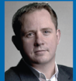
الأستير لوكيز رئيس مجلس إدارة إنوفيتف فاينانس وسفير فينتك الإقتصادي لرئيس الوزراء البريطاني

مجموعة من الخبراء الدوليين المرموقين ورواد صناعة التمويل تناقش أبرز قضايا ما بعد الإرباك المالي التي تواجه البنوك في المستقبل: