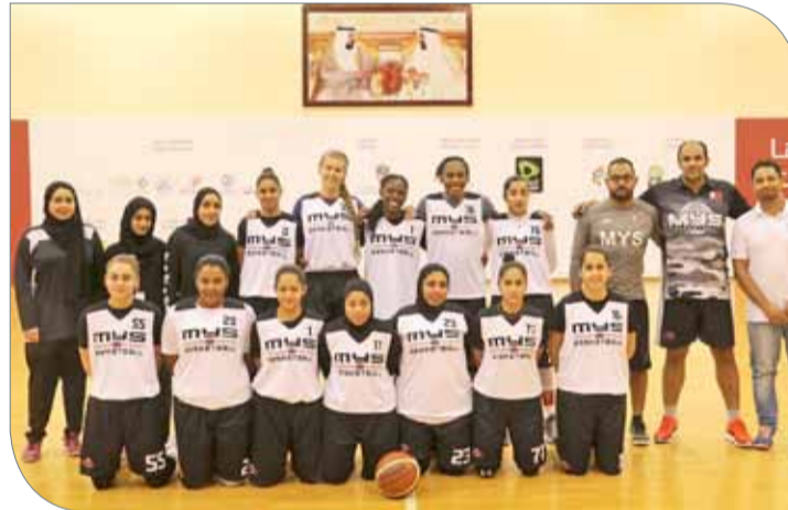
فريق مواهب وزارة الشباب والرياضة لكرة السلة للسيدات