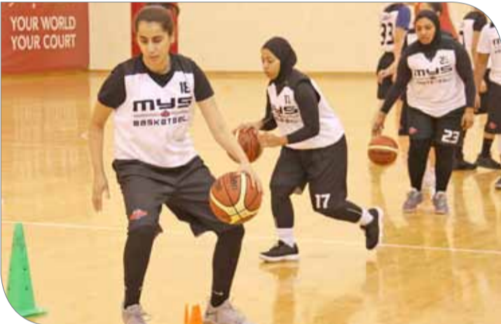
جانب من التدريبات