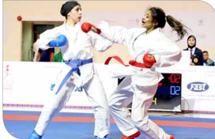
فِي جناحي خلال لقاءها اللاعب السعويّة