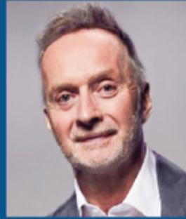
انتوني طومسون مؤسس ورئيس مجلس الإدارة السابق لبنك أتوم وبنك مترو