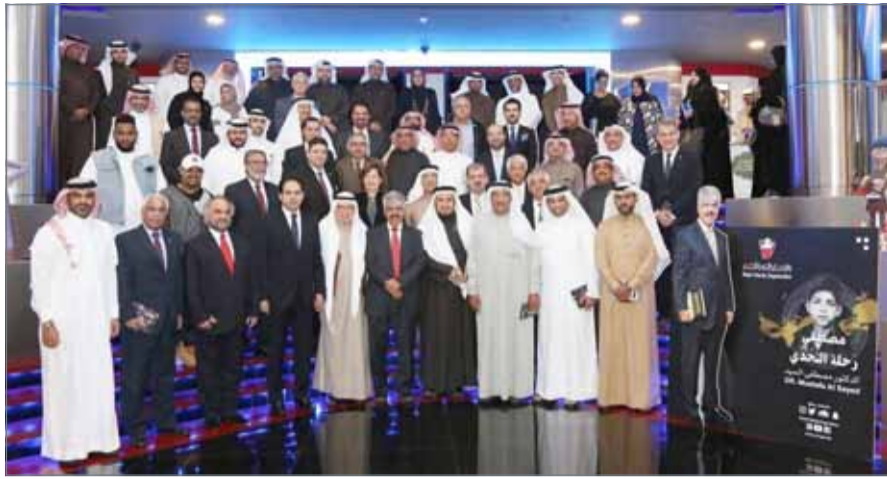
• من تكريم مؤسسة المنجزين العرب لمصطفى السيد

فهي مجعاً للثقافات والأفكار وتترك بصماتها على الشخصية البحرينية لتتفرد بالعقلانية واستيعاب التحديات، واستثمارها دائماً لصالح الوطن وقضاياها الكبرى.