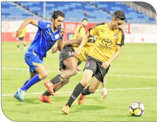
من لقاء الحد والأهلي