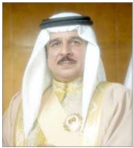
• جلالة الملك

أعرب جلالتة فيها عن أطيب تهانيه وتمنياته له بموفور الصحة والسعادة بهذه المناسبة الوطنية.