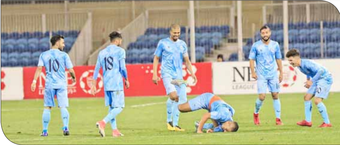
فرحة رفاعية بأحد الهدفين