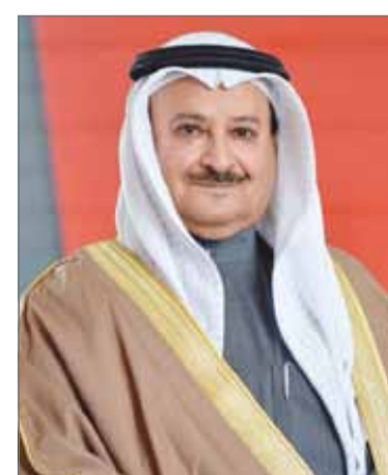
• الشيخ محمد بن خليفة

وستكون هذه الخدمة متوافرة للجميع دون استثناء، إذ سيتم توصيل عملاء بتلكو بالخدمة بشكل تلقائي من خلال هواتفهم النقالة، فور دخولهم لأي منطقة تحت نطاق التغطية، بينما سيتوجب على الآخرين الدخول إلى صفحة إلكترونية خاصة، ليتمكنوا من استخدام الإنترنت المجاني.