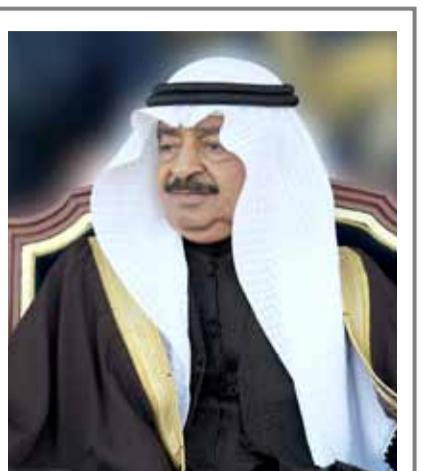
يقلم: الدكتور عبدالله الحوаж

المنامة-بنا: بعث عاهل البلاد صاحب الجلالة الملك حمد بن عيسى آل خليفة برفيقة تهنئة إلى رئيسي