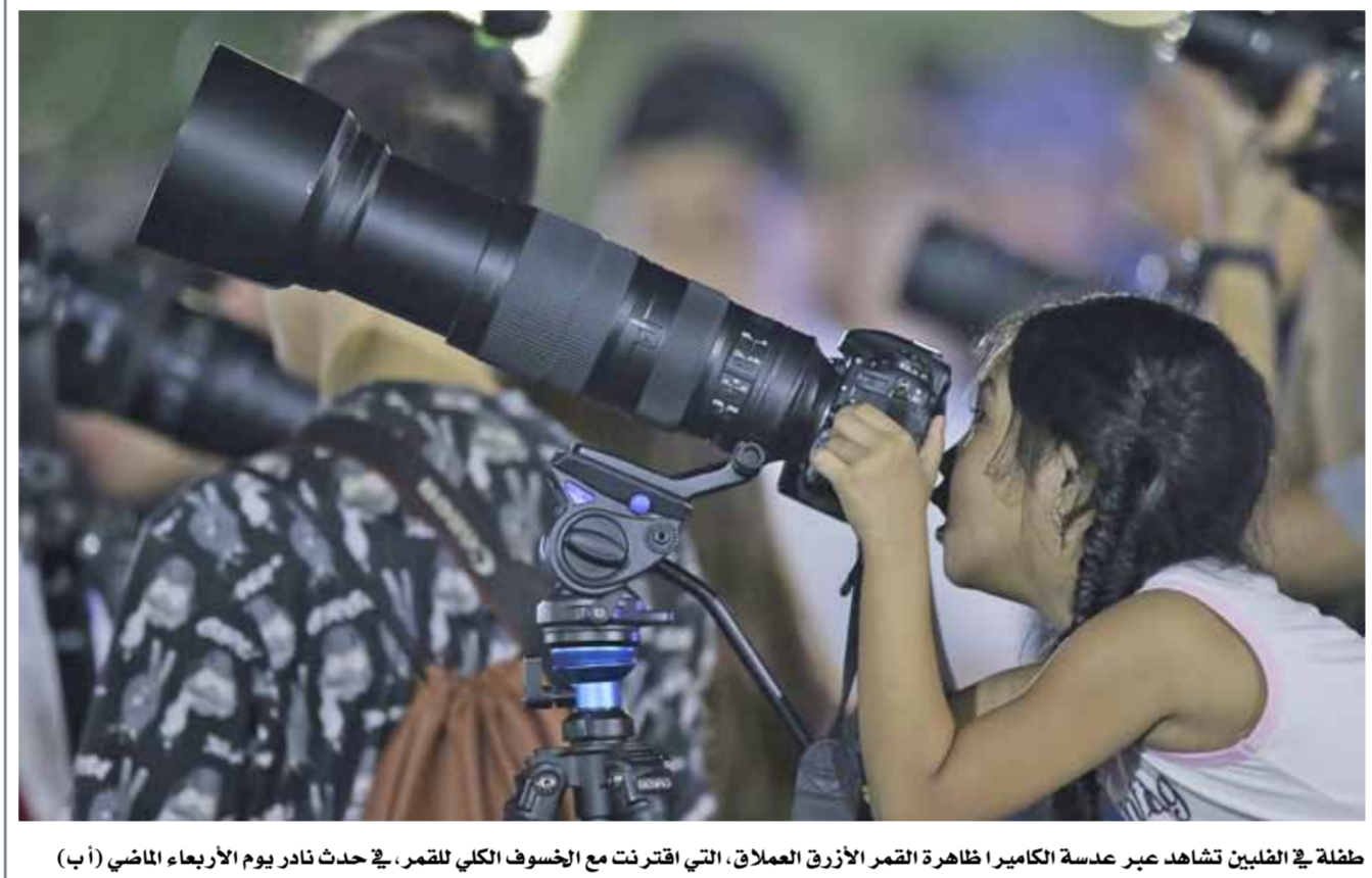
طفلة في الغابن تشاهد عبر عدسة الكاميرا ظاهرة القمر الأزرق العملاق، التي اقترنت مع الخسوف الكلي للقمر. في حدث نادر يوم الأربعاء الماضي (أب)

ارتفاع الموج من قدم إلى قدمين قرب السواحل ومن 3 إلى 5 اقدام في عرض البحر. درجة الحرارة العظمى 22 والصغرى 12 درجة مئوية.