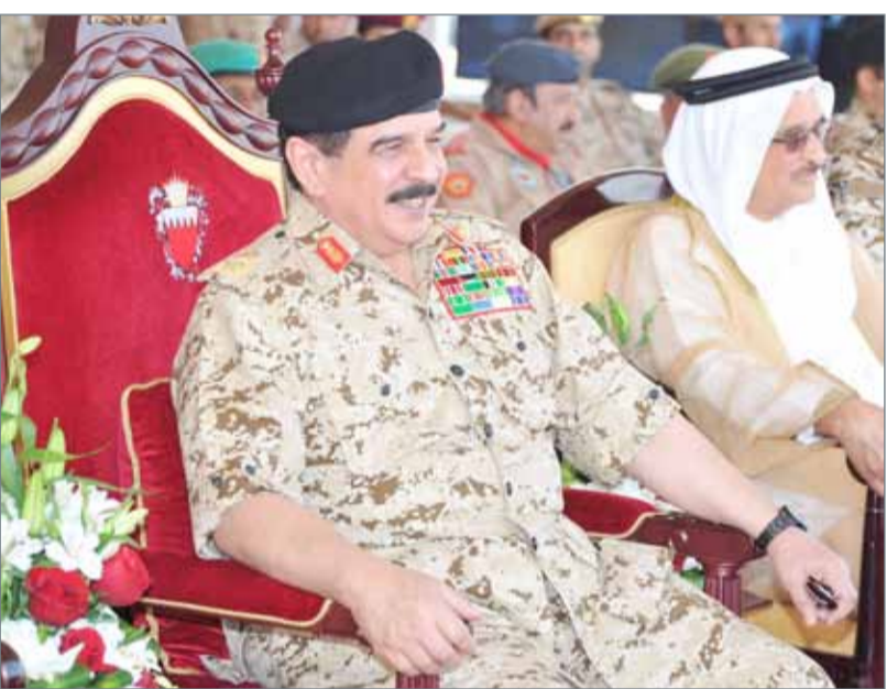
• جلالة الملك

الدفاع التمرين التعبوي المشترك بالذخيرة الحية (قوة العزم)، غدا الاثنين، ويشارك فيه عدد من أسلحة ووحدات قوة دفاع البحرين وقوات شقيقة من المملكة العربية السعودية ودولة الإمارات العربية المتحدة.