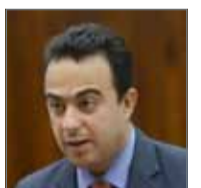
• علي العرادي

البلاد - محرر الشؤون المحلية: قال النائب الأول لرئيس مجلس النواب علي العرادي لـ “البلاد” إن مملكة البحرين تتعاطى مع ملف حقوق الإنسان كأولوية ثابتة وراسخة، وتعمل بصورة حثيثة ودائمة على تطوير النظم التي تضمن تسجيل أفضل النتائج على المستوى الحقوقي. وانتخب العرادي حديثاً من أعضاء لجنة حقوق الإنسان للبرلمانيين بالاتحاد البرلماني الدولي وبالإجماع، ورئيساً للجنة في الدورة 155 لها.