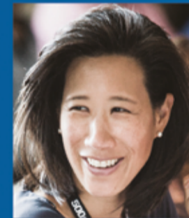
آيلين بوربج الشريك في باشين كابيتال ورئيس تيك سيتي في بريطانيا