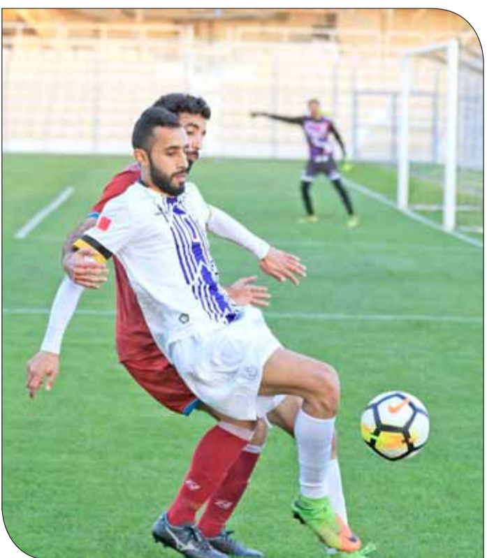
من لقاء الشباب والاتحاد

◆ خرج فريقا الشباب والاتحاد بنتيجة التعادل السلبي، في اللقاء الذي جمعهما أمس على استاد النادي الأهلي، ضمن الجولة 12.