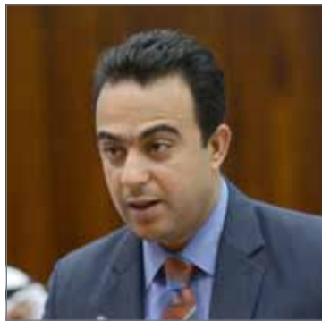
• علي العرادي

وأكد أن عمل المجلس الحالي هو قاعدة سوف تأخذ في الاتساع والتنامي خلال الفترات المقبلة، إذ إن ملف حقوق الإنسان يشكل دائرة اهتمام لجميع المؤسسات الموجودة في البحرين الرسمية منها والأهلية، لما يمثلها هذا الملف من عصب حياة المجتمعات، داعياً المؤسسات الحقوقية في البحرين للبحث عن تدابير دائمة لتطوير العمل الحقوقي، والعمل على إبراز التجربة البحرينية المتقدمة في هذا المجال. يذكر أن لجنة حقوق الإنسان للبرلمانيين بالاتحاد البرلماني الدولي - والتي فاز برئاسة النائب العرادي مؤخرًا - من أبرز اللجان المنضوية تحت لجان الاتحاد البرلماني الدولي، إذ يعمل الأعضاء وعددهم 9 يتم تعيينهم بالانتخاب المباشر للاتحاد، وتنتظر اللجنة خلال اجتماعاتها في إبداعات وشكاوى وقضايا البرلمانيين للدول الأعضاء الحاليين والسابقين، كما تتولى إصدار توصيات لإطلاق سراح البرلمانيين رهن الاعتقال التعسفي، وإعادة البرلمانيين المفقولين بشكل غير قانوني لمقاعدهم، وكذلك توصية وتقدير التعويضات عن الانتهاكات التي يتعرض لها البرلمانيون، والتحقق في الانتهاكات التي تعرضوا لها واتخاذ الإجراءات القانونية الفعالة ضد مرتكبيها، بشكل يتماشى مع تطبيق مبادئ وقوانين حقوق الإنسان والحريات الأساسية، كما تختص اللجنة بتقديم الحماية والدفاع والتأهيل للأشخاص المعرضين للخطر.