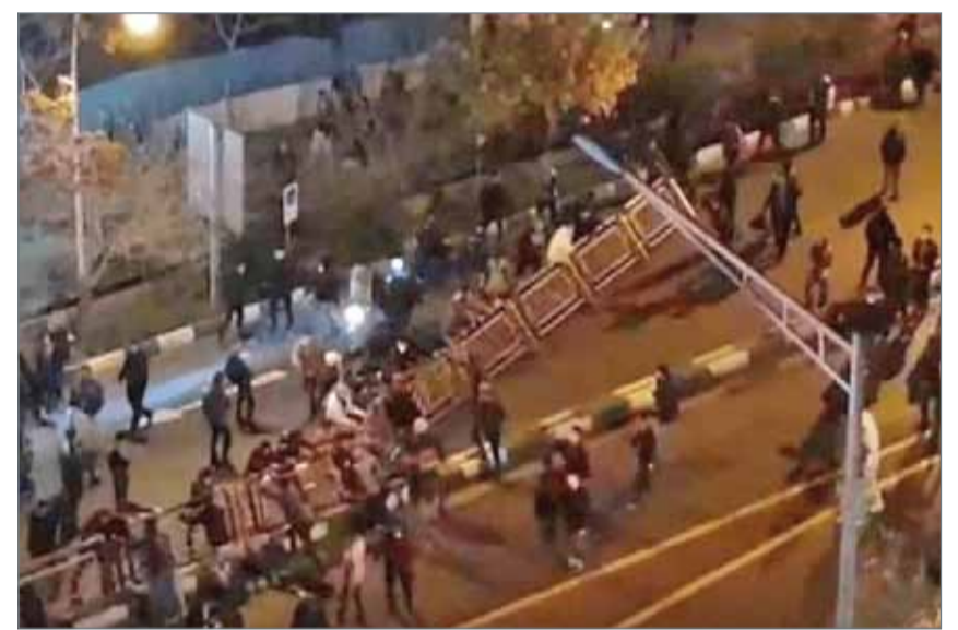
• خرجت تظاهرات في مدن إيرانية عدة، من بينها طهران مساء الخميس، للمطالبة بإسقاط النظام

دبي - العربية.نت: كشف نائب إيراني عن إرسال الرئيس الفرنسي إيمانويل ماكرون رسالة إلى طهران تضمنت 3 مطالب قبيل زيارته المرتقبة إلى إيران، وهي قبول المرشد الأعلى للنظام الإيراني للمفاوضات، وقبول إيران التفاوض بشأن ملف الصواريخ، وكذلك تدخلات إيران وحروبها في المنطقة ودعمها للجماعات الإرهابية. وقال عضو لجنة الأمن القومي والسياسة الخارجية للبرلمان الإيراني، جواد كريمي قدوسي، إن ماكرون اشترط عقد مؤتمر صحفي مع نظيره الإيراني الرئيس حسن روحاني، بحيث يعلن خلالها روحاني موافقة طهران على المفاوضات عن برنامج الصواريخ. من جهته، كشف النائب الإيراني علي رضا رحيمي، أن السلطات اعتقلت ما يقارب 5000 شخص في الاحتجاجات الأخيرة التي اندلعت بأكثر من 100 مدينة بأنحاء مختلفة من البلاد.