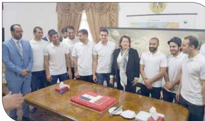
السفيرة المصرية سها الفار تتوسط أفراد الفريق

حضرت العفل عدد كبير من أعضاء الجالية المصرية بالبحرين والعاملين بالسفارة وعدد من الإعلاميين، وقامت السفيرة المصرية سها الفار بتكريم