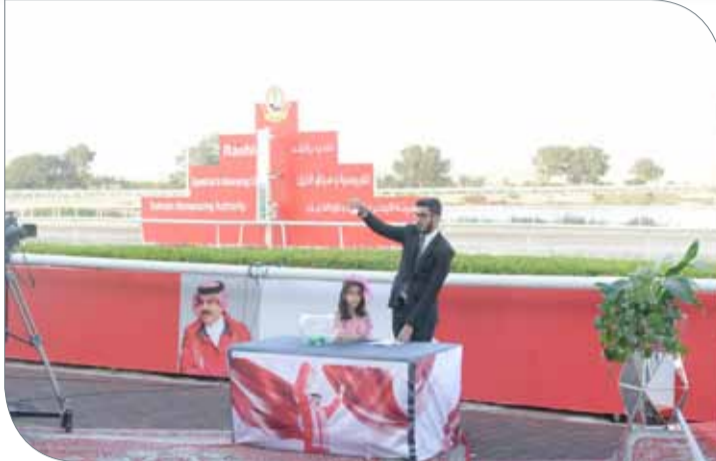
جانب من القرعة