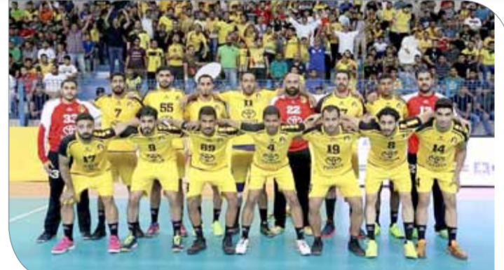
فريق الأهلي لكرة اليد