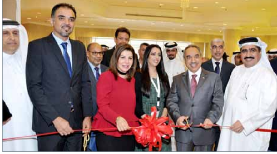
● وزير الأشغال لدى افتتاحه معرض الوساطة العقارية

وقال الوزير "لا أعتقد أن هذه الرسوم لها علاقة بالانخفاض في تراخيص البناء (العمارات) فالإحصاءات بينت أن مشروعات الاستثمارات لم تتأثر بهذا الموضوع، خصوصاً لمساكن العقارات، الإحصاءات تظهر أن المساحات لم تتأثر سوى بـ 2 أو 3% (..) المشروعات الاستثمارية مستمرة وهذا المعرض خير مثال على ذلك، رأينا عدداً من المشروعات الاستثمارية المعروضة في السوق". وعن شكاوى مواطنين من فرض رسوم قدرها 12 ديناراً عند قيامهم بالترافق مع مطورين