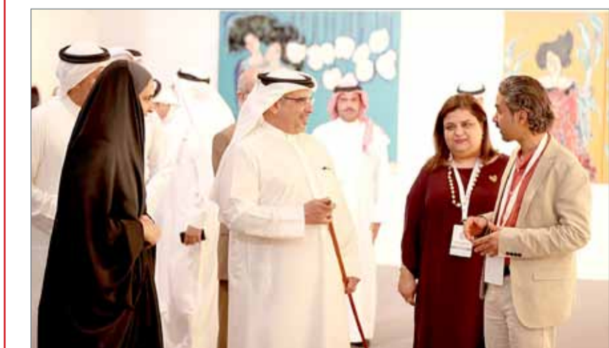
• سمو ولي العهد مفتتحاً معرض “أرت باب”

المنامة - بنا: افتتح ولي العهد نائب القائد الأعلى النائب الأول لرئيس مجلس الوزراء صاحب السمو الملكي الأمير سلمان بن حمد آل خليفة معرض فن البحرين عبر الحدود “أرت باب” في نسخته الثالثة، المقام تحت رعاية قريبة عاهل البلاد رئيسة المجلس الأعلى للمرأة صاحبة السمو الملكي الأميرة سبيكة بنت إبراهيم آل خليفة بمركز البحرين الدولي للمعارض والمؤتمرات أمس. وأشار سموه إلى أن النهضة الشاملة التي تشهدها البحرين بقيادة عاهل البلاد نال فيها الجانب الثقافي وتشجيع الفن والإبداع اهتماماً كبيراً كما حظى المبدعون على التكريم والتحفيز لتبقى مملكة البحرين حاضنة للفن والإبداع.