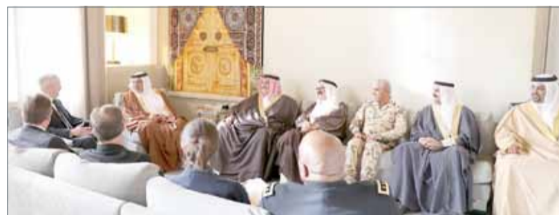
• سمو ولي العهد لدى استقباله وزير الدفاع الأميركي

المنامة - بنا: أعرب ولي العهد نائب القائد الأعلى النائب الأول لرئيس مجلس الوزراء صاحب سمو الملكي الأمير سلمان بن حمد آل خليفة عن ارتياحه لمسار العلاقات البحرينية الأميركية في ضوء ما تحظى به من اهتمام ورعاية من عاهل البلاد صاحب الجلالة الملك حمد بن عيسى آل خليفة، ورئيس الولايات المتحدة الأميركية دونالد ترامب مما أسهم في مواصلة تطور هذه العلاقات بزخم يتناسب مع عراقتها التاريخية والاستراتيجية.