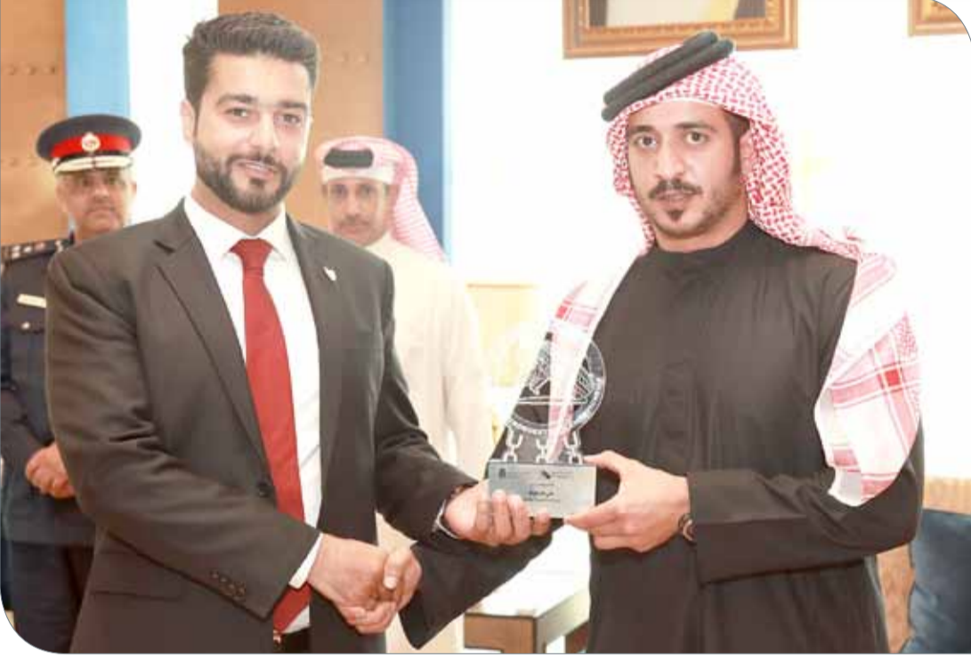
سمو الشيخ خالد بن حمد يكرم أعضاء اللجنة المنظمة العليا واللجان العاملة

الرفاع | المكتب الإعلامي لسمو الشيخ خالد بن حمد