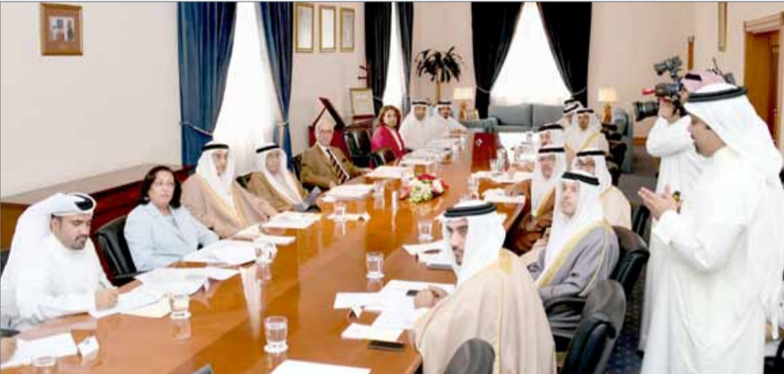
• سمو الشيخ محمد بن مبارك يتأسر اجتماعاً لمناقشة مخرجات ورش العمل

العريض، وقد اعتمدت 5 سياسات و20 مبادرة في محور الأداء الحكومي و5 سياسات و13 مبادرة في محور التشريعي.