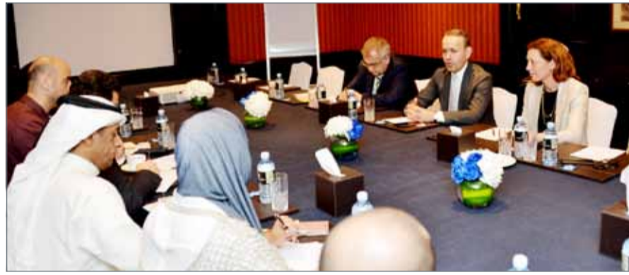
● الوفد التركي في المؤتمر الصحافي وحديث عن آفاق التعاون الاقتصادي مع البحرين

سنتكون في قلب التغييرات الاقتصادية العالمية وأنه يمكن للشركات الخليجية الاستفادة من نسب النمو الجيدة للاقتصاد التركي والتي تقدر بنحو 5%، وذلك للاستثمار في مختلف القطاعات.