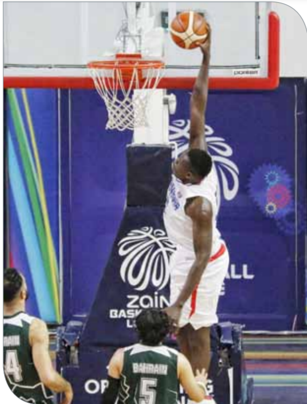
جانب من منافسات الدور التمهيدي