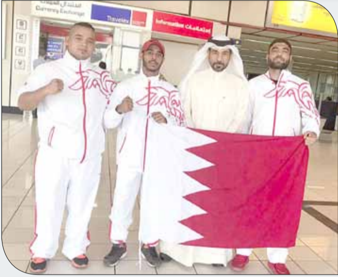
الفريق لحظة مغادرته مطار البحرين الدولي

اتحاد فنون القتال المختلطة | المركز الإعلامي