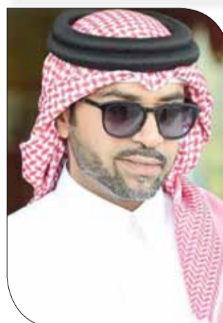
سمو الشيخ فيصل بن راشد

ورفع رايته خفاقة عالية في مختلف المحافل الدولية، إن هذه الرؤية تلهمنا جميعاً لتحقيق المزيد لمملكنا الحبيبة، ونحن بدورنا نحث جميع الرياضيين عموماً والفرسان خصوصاً لبذل أقصى درجات العطاء وتقديم أفضل المستويات التنافسية. وأشار سموه للمشاركة النسائية المميزة في هذا الموسم ومنافساتها في مختلف المسابقات، مشيداً بالحضور النسائي على المستوى التنافسي، متمنياً التوفيق للجميع في بطولة سمو الشيخ ناصر بن حمد آل خليفة القادمة، والتي ينتظرها جميع الفرسان والفارسات بفارغ الصبر.