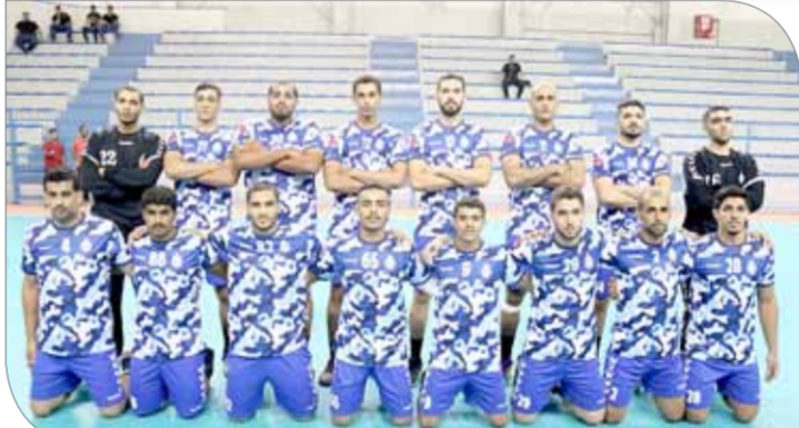
فريق الأهلي لكرة اليد

نعداً عنيداً لـ "حامل اللقب"، أما البرتغالي فظهر بصورة مهزوزة للغاية خالف بها التوقعات كلها وتلقى خسارة مستحقة. الفريقان يمثلان عنصر وخامات جيدة المستوى بإمكانها صنع الفارق وتحقيق الانتصار شرط أن تكون في "فورمتها" الموهودة، فالأهلي بقيادة رشيد شريح يعول على عناصره كافة، وهذا ما لوحظ عليه في مختلف مبارياته دون الاعتماد على أسماء محددة كون ذكة البداء لديه تعطيه الأفضلية بالمرکز الرابع الذي يواجه صاحب المركز الثاني في الدور قبل النهائي في 3 مواجهات، إذ ستكون الأفضلية قادمًا من خسارة على يد الغريم