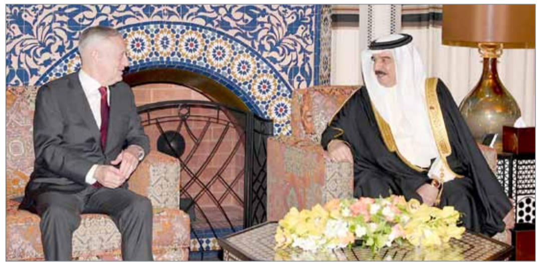
• جلالة الملك لدى استقباله وزير الدفاع الأميركي بحضور سمو ولي العهد

بن حمد آل خليفة في قصر الصخبر أمس وزير الدفاع بالولايات المتحدة الأميركية جيمس ماتيس بمناسبة زيارته للمملكة. ونوه جلالتهم بالدور الفاعل الذي تضطلع به الإدارة الأميركية بالتعاون مع الدول الحليفة والصديقة في إرساء دعائم الأمن والاستقرار في المنطقة وحماية الأمن والسلم الدوليين، مؤكداً دعم المملكة البحرين ومساندتها لجميع هذا الجهود والمساعدات.