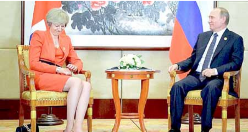
• تيريزا ماي خلال لقاء سابق مع فلاديمير بوتين

وعثر على الجاسوس السابق سيرغي سكريبال (66 عاما) وابنته يوليا (33 عاما) فاقدتي الوعي في مدينة سالزبري بجنوب إنجلترا يوم الرابع من مارس، ولا يزالان بالمستشفى في حالة حرجة. وأصيب صابط شرطة أيضا في الحادث ولا يزال في حالة خطيرة بالمستشفى.