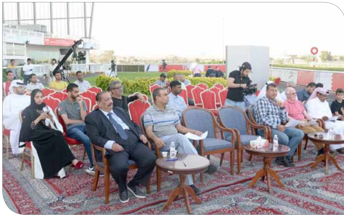
العلوي والحضور في قرعة كأس جلالة الملك

وقام نادي راشد للفروسية بالتعاون والتنسيق واتخاذ الترتيبات التنظيمية لاستقبال الوفد والمشاركين وترتيب إقامتهم في مملكة البحرين، إذ سيشارك 9