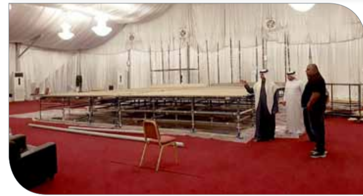
جانب من الزيارة التفقدية

قبل اللجنة الأولمبية البحرينية، ونوه أن هذا الدعم هو سر تآلي الاتحاد وأن العمل الدؤوب مازال مستمراً من أجل الوصول بالبطولة لأعلى المستويات على جميع الأصعدة خصوصاً وأن المملكة الحبيبة رائدة في مجال تنظيم واستضافة مختلف الأحداث والتجمعات الرياضية. ودعت اللجنة المنظمة العليا للبطولة والاتحاد البحريني لرفع الأثقال الجماهير الرياضية ومحبي رياضة رفع الأثقال وعموم الناس لحضور فعاليات بطولة غرب آسيا لرفع الأثقال، حيث تنطلق المسابقات من الساعة التاسعة صباحاً وتستمر حتى الساعة الخامسة مساءً، كما دعت اللجنة المنظمة الجمهور الكريم للوقوف خلف أبطال ونجوم المنتخب الوطني لرفع الأثقال في هذه المشاركة المهمة والتي تقام على أرض البلاد للمرة الأولى من أجل تحقيق الذهب في عام الذهب.