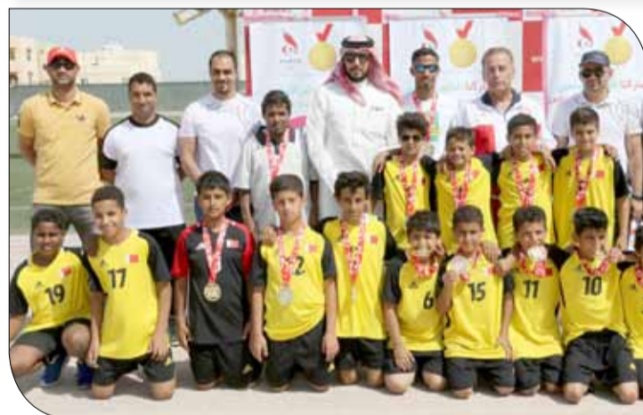
فريق الإمام مالك بن أنس البطل

وفي المجموعة الخامسة، فازت مدرستي مالك بن أنس والقلب المقدس "B" على الألفية الجديدة "B" وعبدالرحمن كانو "A" بنتيجة (2-0) تواليا. ولحساب المجموعة السادسة، فازت الهندية "C" والشرق الأوسط "C" على المهدي (2-0) و(7-1) تواليا، وفازت الشرقية على الهندية (3-1) "C".