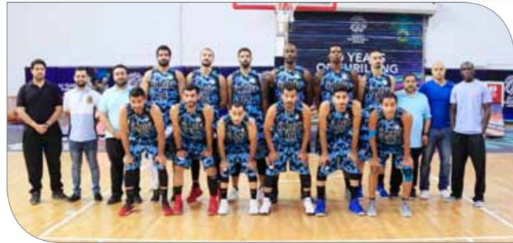
فريق الرفاع لكرة السلة