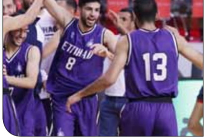
فريدة فريق الاتحاد بالتأهل

استعاد فريق الاتحاد الروح القتالية الكبيرة التي ظهر عليها الفريق في الدوري العام، ليعود بقوة للمنافسة على الوجود في المربع الذهبي للذهب لكأس خليفة بن سلمان. الاتحاد قَدِمَ واحداً من أفضل مواهب، أظهر خلاله مستوى فنياً متطوراً، ولكن أن يتواجد مع الستة الكبار في قائمة الدوري حتى المراحل الأخيرة التي رجحت فيها الخبرة كفة منافسيه من تأهله للأدوار النهائية للدوري. ولعب البنفسج في لقائه الأخير، وفق منهجية وخطة نتج من خلالها في الحد من خطورة الفريق المقابل والوصول إلى تحقيق الهدف المنشود. الفريق إذا ما استمر بهذا الأداء المتزن والمتطور، فإنه طريقه نحو المربع الذهبي سيكون مفرحاً وبالوود.