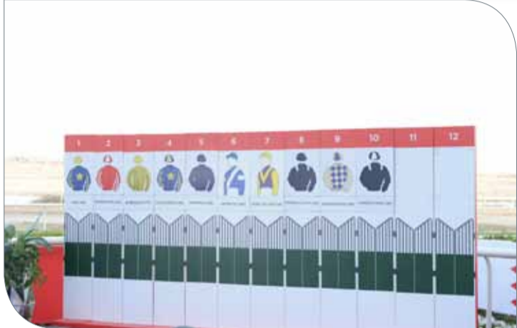
بوابات الانطلاق فيه الشوط الرابع