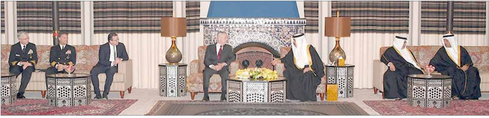
• جلالة الملك لدى استقباله وزير الدفاع الأميركي بحضور سمو ولي العهد