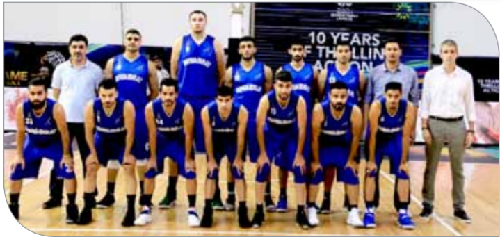
فريق النويدرات لكرة السلة