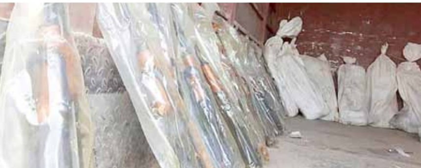
• شحنة أسلحة في طريقها للحوثيين تم ضبطها من قبل قوات الامن اليمنية.

وقال فوتيل خلال جلسة استماع في الكونغرس إن إيران تستخدم شبكات متطورة لنقل الأسلحة إلى الحوثيين في اليمن، مشيرا على أن الأسلحة الإيرانية تشكل تهديداً للسعوديين والأميركيين. كما أكد فوتيل أن ميليشيا الحوثي المدعومة من إيران هي المسؤولة عن الكارثة الإنسانية في اليمن.