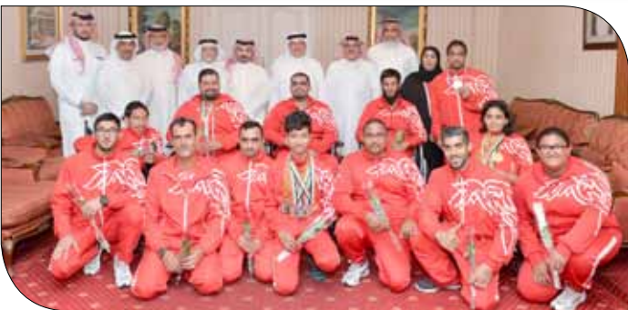
عسكر مستقبلاً أبطال منتخبنا الوطني لذوي الإعاقة

إعداد المنتخب بأفضل صورة، معرباً عن اعتزازه الكبير بما حققه اللاعبون من مستوى لائق ومشرف، مؤكداً حرص اللجنة الأولمبية على مواصلة دعم ذوي العزيمة بما يساهم في مواصلة مسيرة النجاحات والمكتسبات التي حققوها وتوسيع رقعة الإنجازات. ومن جانبهم، عبر أبطال ذوي الإعاقة عن خالص شكرهم وتقديرهم للجنة الأولمبية برئاسة سمو الشيخ ناصر بن حمد آل خليفة على ما يحظون به من دعم ورعاية من سموه، كان لها الأثر الأكبر وراء تحقيق هذا الإنجاز المشرف، مؤكداً عزمهم وتطلعهم إلى حصد المزيد من النجاحات لتعزيز مكانة البحرين على كافة المستويات.