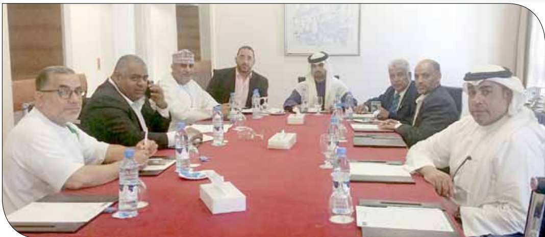
من اجتماع المكتب التنفيذي

رئيس المجلس الأعلى للشباب والرياضة رئيس اللجنة الأولمبية البحرينية سمو الشيخ ناصر بن حمد آل خليفة. وتم اعتماد الجان التابعة لاتحاد غرب آسيا والمنضوية تحت مظلتها، حيث تم إيكال مسؤولية