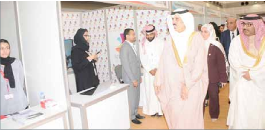
• وزير التربية والتعليم يفتتح فعاليات معرض أسبوع المهن 2018

وجميع الجهات المتعاونة في إنجاح هذه الفعالية السنوية المهمة. هذا، ويفتح المعرض أبوابه للجمهور لغاية