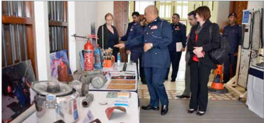
• رئيس الأمن العام مستقبلا وفداً من المفوضية الأميركية للحريات الدينية الدولية

المستقلة لتقصي الحقائق، إذ إن ما تم في وزارة الداخلية من تطوير وتحديث، تجاوز بمراحل توصيات اللجنة وأن بعض الجوانب بطبيعتها ستظل دائماً تحت التنفيذ مثل التدريب والتحديث والتطوير الإداري، كما أكد رئيس الأمن العام أن وزارة الداخلية تعمل باستمرار على تعزيز نهج الشراكة المجتمعية كمبدأ للتواصل الفعال بين رجال الأمن وأفراد المجتمع المدني، وتعزيز الثقة المتبادلة فيما بينهم بما يعود بالنفع على أمن الوطن والمواطنين والمقيمين. وتفقد رئيس الأمن العام وأعضاء وفد المفوضية الأميركية للحريات الدينية الدولية، المعرض الذي أقيم وتضمن نماذج من الأسلحة والمتفجرات التي استخدمتها الجماعات الإرهابية لاستهداف حياة رجال الشرطة.