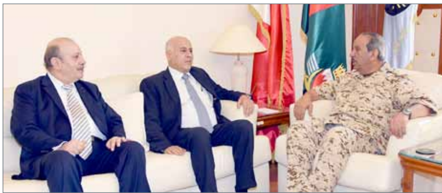
• القائد العام مستقبلاً اللواء جبريل الرجوب

الرفاع - قوة الدفاع: استقبل القائد العام لقوة دفاع البحرين المشير الركن الشيخ خليفة بن أحمد آل خليفة في مكتبه بالقيادة العامة صباح أمس، رئيس المجلس الأعلى للشباب والرياضة ورئيس اللجنة الأولمبية الفلسطينية ورئيس الاتحاد الفلسطيني لكرة القدم اللواء جبريل الرجوب. وخلال اللقاء، رحب القائد العام بالرجوب، مشيداً بعمق العلاقات الأخوية التي تجمع بين البلدين الشقيقين، متمنياً كل التقدم والتطور للرياضة الفلسطينية بشكل عام وللمنتخب الفلسطيني لكرة القدم بشكل خاص.