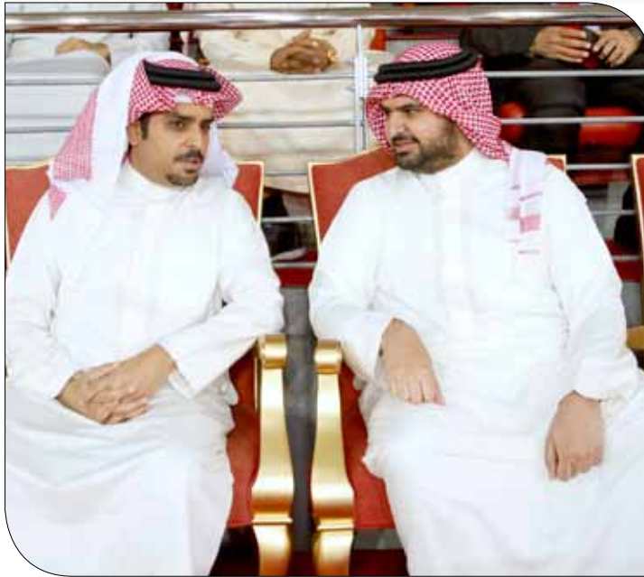
سمو الشيخ عيسى بن علي يشهد اللقاء

وتقاسم الطرفان التسجيل والتقدم في النتيجة خلال النصف الأول للربع الأول، إذ أخذ الرفاع عصا السبق بتقدمه 4/5، قبل أن ينيل أحمد علي والأعرج مارسيل. ونجح الرفاع من تعديل النتيجة 9/9 بأربع