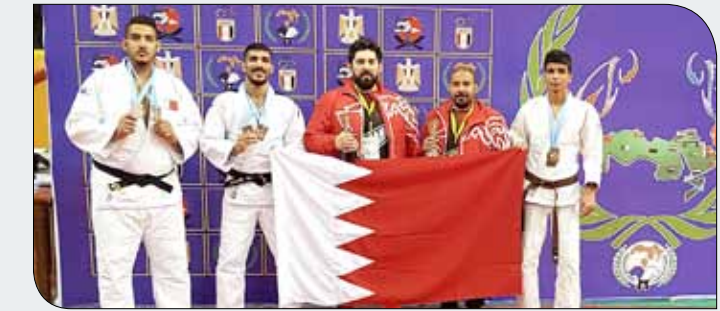
صورة جماعية للاعبين لمنتخبنا

حمد منتخبا الوطني للجودو على 3 ميداليات برونزية في البطولة العربية للأندية البطة الـ 13 للرجال والـ 5 للشباب والرابعة للسيدات والشابات وبطولة المفتوحة للكاتا، والتي أقيمت في العاصمة المصرية القاهرة في الفترة من 16 حتى 21 مارس الجاري بمشاركة 13 دولة عربية، وكانت مشاركة المنتخب في البطولة برعاية سما ديوتي الداعم