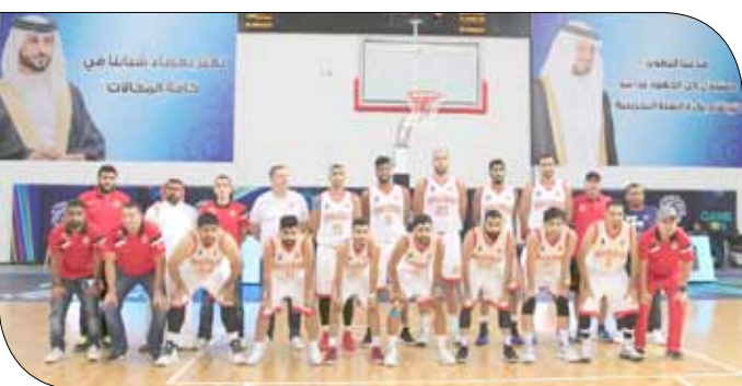
فريق المحرق لكرة السلة

حامل اللقب المحرق، يسعى لمواصلة حملة الدفاع عن لقبه بنجاح وحسم التأهل من أول لقائين: لتجنب حرج المباراة الفاصلة، فيما يسعى الاتحاد سيقنعان مجدداً يوم الاثنين المقبل 26 مارس الجاري في مباراة الجولة الثانية، على أن تقام المباراة الثالثة الفاصلة (في حال التعادل) يوم الجمعة 30 الشهر نفسه.