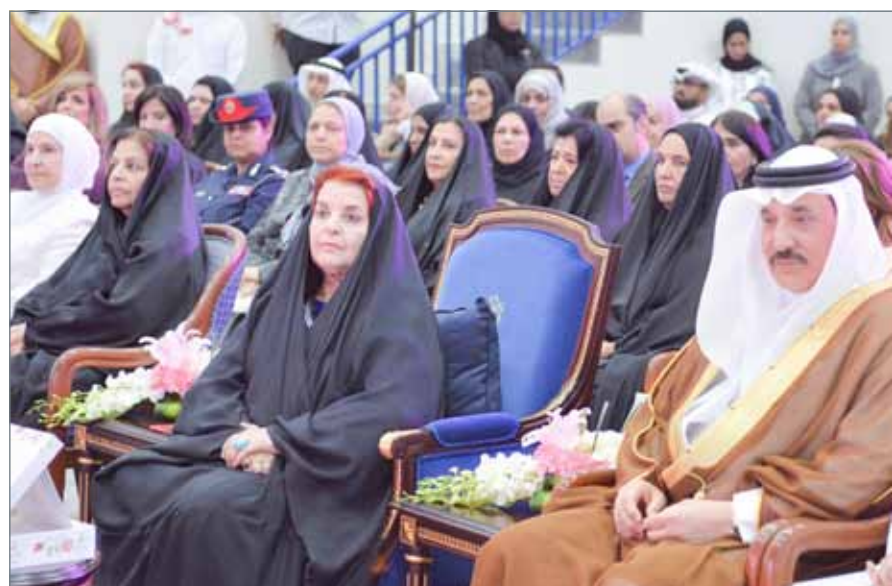
• سمو قرينة عاهل البلاد رئيسة المجلس الأعلى للمرأة ترعى حفل منح جائزة سموها لتشجيع الأسر المنتجة 2018

كرمت الفائزين بجائزة سموها لتشجيع الأسر المنتجة... الأميرة سبيكة: