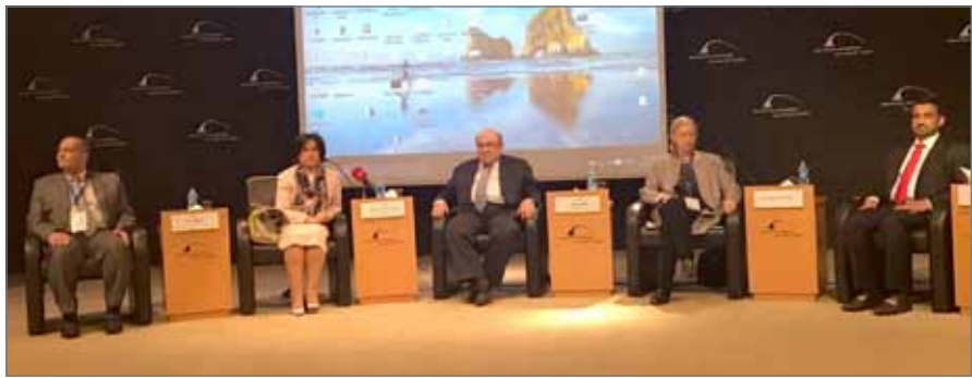
• رئيسة هيئة البحرين للثقافة والآثار ضيفة الشرف في افتتاح المؤتمر بالإسكندرية

مواجهة التطرف“ إلى إحياء روح الفن الإسلامية وتشكيل لجنة للفن الإسلامي في المجلس الدولي للمتاحف، وعلى مدى أيامه الثلاثة سيناقش المؤتمر الذي يجعم باحثين من 13 دولة، موضوعات متعددة ذات ارتباط بالفنون مثل: مدارس الفن الإسلامي وخصائصها، فلسفة الجمال في الفن الإسلامي، متاحف الفن الإسلامي وقدرتها على التعبير عن الموروث الحضاري للإسلام وغيرها كثير. كذلك، افتتح على هامش المؤتمر معرض الهيئة العامة للسياحة والتراث الوطني من المملكة العربية السعودية.