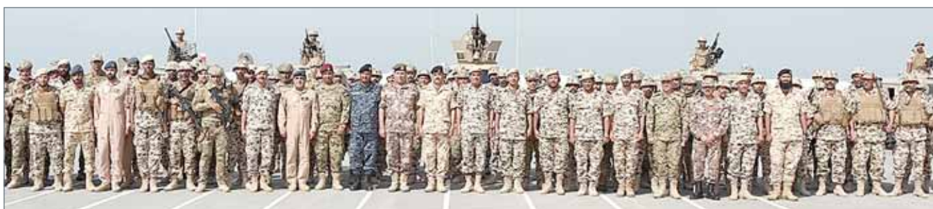
• جانب من فعاليات التمرين المشترك (ترابط 14)

الأردنية الهاشمية الشقيقة في إطار التعاون العسكري المشترك بين الأشقاء، والذي له امتداد طويل خافل بتبادل الخبرات، والتجارب، والتنسيق، في المجال العسكري. حضر ختام فعاليات التمرين المشترك عدد من كبار ضباط قوة دفاع البحرين.