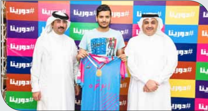
من توزيع الملابس على الفرق المشاركة

المباراة الثانية يلتقي فيها فريقا نادي باربار ومركز شباب دمستان في السابعة والربع.