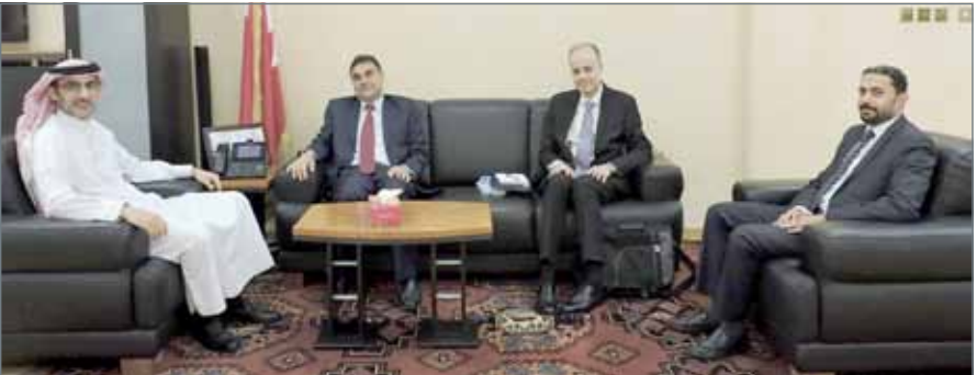
• القائد يلتقي منتسبي برنامج النائب الأول لتنمية الكوادر الوطنية

والتي من بينها استراتيجة الحكومة الإلكترونية ومشروع الحوسبة السحابية، وغيرها من المشاريع والمبادرات التي تنفذها الهيئة بالتعاون والتنسيق مع مختلف الجهات، كما تطرق إلى استراتيجة الهيئة الشاملة في المرحلة المقبلة.