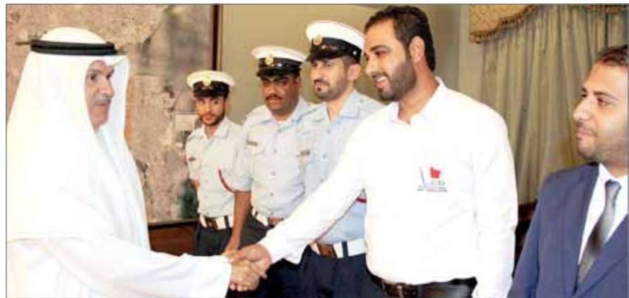
• من فعاليات اختتام المركز الإقليمي لمكافحة العنف والإدمان الدورة العاشرة لمنفذي برنامج (معا)

وقام طاقم التدريب البحريني بتنفيذ الدورة وتغطية الجوانب الأكاديمية والتربوية فيها والتي تهدف إلى إعداد الأفراد وتدريبهم وفق أعلى معايير التدريب المعتمدة في المنظمة.