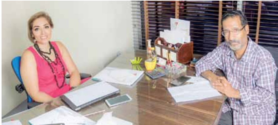
• "البلاد" تذاور الجشي