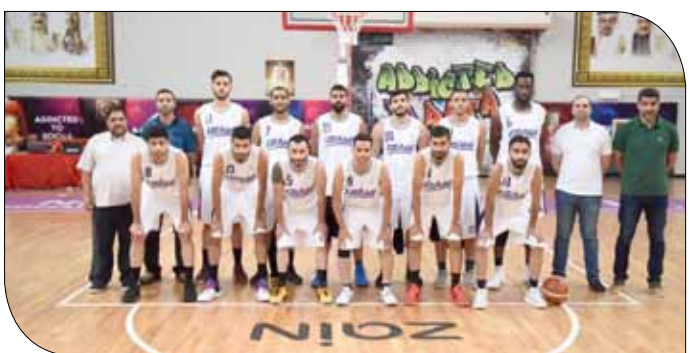
فريق الاتحاد لكرة السلة

وتأهل المحرق لهذا الدور عقب فوزه على سماهيح في الدور التمهيدي، قبل أن يفوز على غريمه الأهلي بنتيجة (84/77) في الدور ربع النهائي. فيما تأهل الاتحاد لهذا الدور بفوزه على الحالة في الدور التمهيدي، ثم فاز