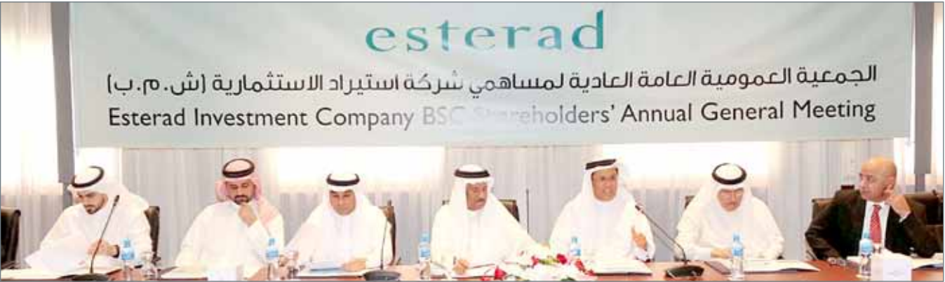
• من الجمعية العمومية