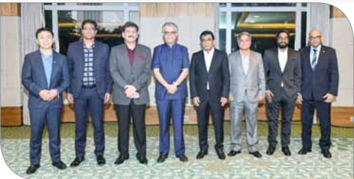
سلمان بن إبراهيم يتوسط الحضور في صورة جماعية

كوالالمبور | مكتب رئيس الاتحاد الآسيوي لكرة القدم