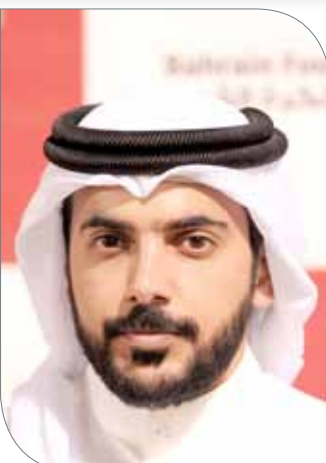
الشيخ أحمد بن عيسى

يشارك منتخبنا الأولمبي لكرة القدم في بطولة ودية ستقام بإندونيسيا نهاية شهر أبريل المقبل. وستشهد البطولة مشاركة 4 منتخبات هي: منتخبنا. إندونيسيا (المستضيف)، ماليزيا وكوريا الشمالية، وذلك في الفترة 27 أبريل وحتى 4 مايو المقبلين. وستقام منافسات البطولة بنظام الدوري من دور واحد، إذ يحسب جدول مباريات الذي أصدرته اللجنة المنظمة، فإن منتخبنا سيلتقي كوريا الشمالية في الجولة الأولى يوم 28 أبريل، على أن يلتقي منتخب ماليزيا يوم 30 من الشهر