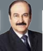
الدكتور: عبدالحسين علي ميرزا وزير شؤون الكهرباء والماء

كما أن الجامعة ومن خلال مشاركتها في هذا المعرض تعرض برامجها الدراسية الجديدة المستضافة في هندسة التصميم المعماري،