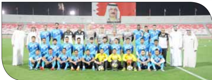
صورة جماعية للمنتخب قبل تدريب أمس