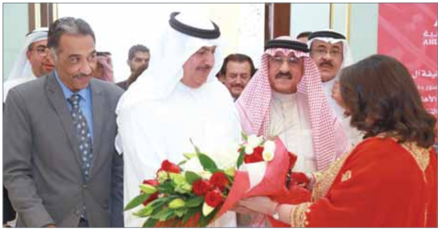
• الشيخ راشد بن خليفة يتجول بمعرض الجامعة الأهلية الثاني للخط العربي والفن التشكيلي

تحقيق مزيد من الأهداف ضمن اقامتها لهذه النوعية من المعارض، والتي تتضمن الاستفادة الطلاب من هذا النمط من الفعاليات، خلال مشاركتهم في تنظيمها، إضافة إلى الاستفادة من الورش التدريبية المصاحبة، مشيراً إلى مبادرة الجامعة الأهلية لمثل هذه الفعاليات التي تتقل طلابها أكاديميا وفنيا. وتضمن المعرض الذي يستمر حتى 26 مارس الجاري، معروضات فنية يصل عددها إلى أكثر من 100 عمل فني من الخط العربي والفن التشكيلي لـ 45 فنانا بحرينيا.