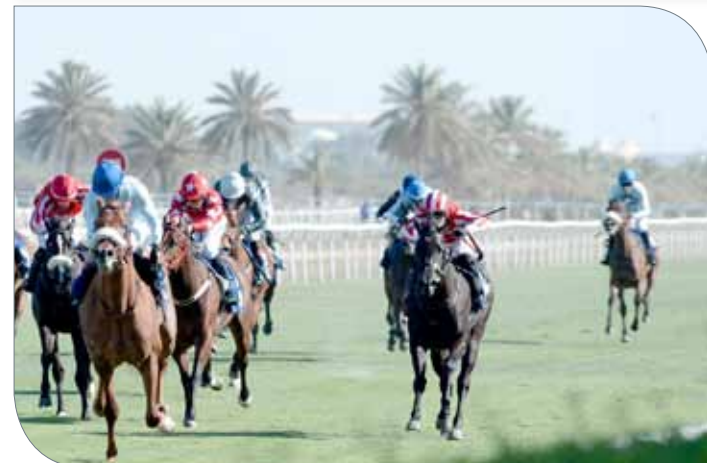
منافسات قوية يشهدها سباق اليوم

والجائزة 2000 دينار. ويقام الشوط الثالث على كأس وزارة الشباب والرياضة لجياد الدرجات الثانية والثالثة والرابعة والمبتدئات من خيل البحرين العربية الأصيلة ( الواهو) مسافة 1400 متر، والجائزة 2500 دينار.