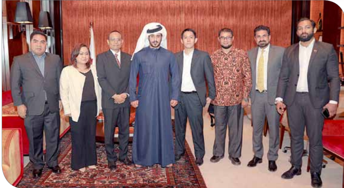
سمو الشيخ خالد بن حمد مع الوفد في صورة جماعية