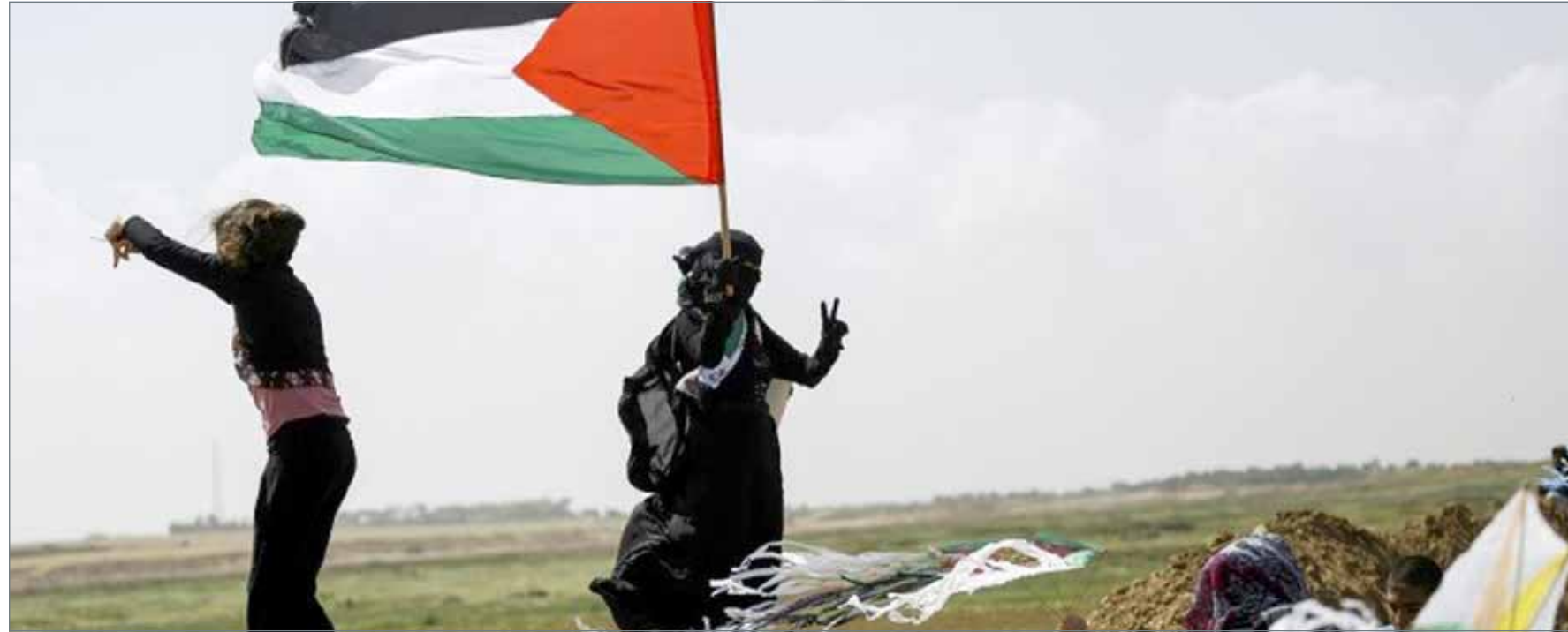
فلسطينية ترفع شارة النصر حاملة العلم الفلسطيني قرب خيمة على الحدود بين إسرائيل وغزة أمس

يتجه الرئيس المصري عبد الفتاح السيسي للفوز بدورة رئاسية ثانية مع إظهار المؤشرات الأولية تفوقاً كاسحاً له على حساب منافسه موسى مصطفى موسى، رئيس حزب الغد. وتظهر النتائج الأولية لفرض الأصوات على مستوى المحافظات حصول السيسي على أكثر من 90% من الأصوات، بينما زاد عدد الأصوات الباطلة عن عدد الأصوات الصحيحة التي حصل عليها موسى. وانتهى مساء الأربعاء الاقتراع في الانتخابات الرئاسية المصرية الذي جرى على مدار 3 أيام. وبدأت عملية فرز الأصوات مباشرة عقب إغلاق صناديق الاقتراع. وبعد غلق مراكز الاقتراع كتب السيسي في صفحته على فيسبوك "صوت جموع المصريين سيظل شاهداً بلا شك علي أن إرادة أمتنا تفرض نفسها بقوة". ومددت الهيئة الوطنية للانتخابات الاقتراع ساعة إضافية الأربعاء قائلّة إن تقلبات في الطقس حالت دون وصول ناخبين إلى مراكز الاقتراع في الوقت المناسب. ومن المقرر إعلان النتيجة الرسمية في الثاني من أبريل.