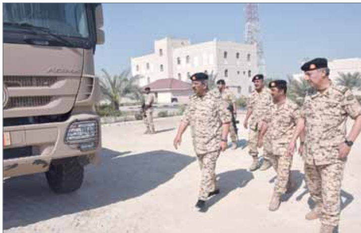
• القائد العام في زيارة لعدد من وحدات قوة دفاع البحرين

بالمسؤولية الوطنية الكبيرة الملقاة على عاتقها على المستوى المحلي، والخليجي، والإقليمي على السواء. وفي ختام الزيارة، أعرب القائد العام لقوة دفاع البحرين عن خالص تقديره للجهود الطيبة والملموسة التي يبذلها رجال قوة دفاع البحرين وظهورهم الدائم بالمظهر المرشرف، كما وجه الجميع إلى أهمية البذل المتواصل الحافل بالتفاني الكبير والالتزام بالمسؤولية الوطنية والعطاء المستمر المرتكز على الإخلاص لخدمة هذا الوطن العزيز وحفظ أمنه واستقراره والدفاع عن مؤسساته وأراضيه.