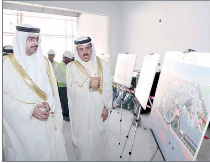
• سمو محافظ الجنوبية في زيارة لمشروع المدرسة النموذجية الشاملة للبنات في مدينة خليفة

عوالي - المحافظة الجنوبية: تفضل محافظ الجنوبية سمو الشيخ خليفة بن علي آل خليفة بزيارة مشروع المدرسة النموذجية الشاملة للبنات في مدينة خليفة، حيث كان في استقبال سموه وزير التربية والتعليم ماجد النعيمي وعدد من المسؤولين بالوزارة، ونقل محافظ الجنوبية سمو الشيخ خليفة بن علي آل خليفة إلى وزير التربية والتعليم والمسؤولين في الوزارة توجيهات رئيس الوزراء صاحب السمو الملكي الورد الأمير خليفة بن سلمان آل خليفة بإطلاق اسم "مدرسة سمو الشيخة موزة بنت حمد آل خليفة الشاملة للبنات" على المدرسة الجديدة. وأكد سموه اهتمام الحكومة برئاسة رئيس الوزراء صاحب السمو الملكي الورد الأمير خليفة بن سلمان آل خليفة بالبروح التعليمية والترابوية والتوسع في إقامتها لما لها من أهمية علمية في بناء المجتمعات القوية المتماسكة ومساهمتها الفعالة في صناعة جيل متعلم واع ومثقف.