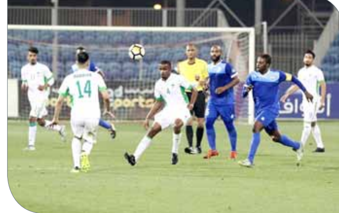
من لقاء الحالة والبحرين