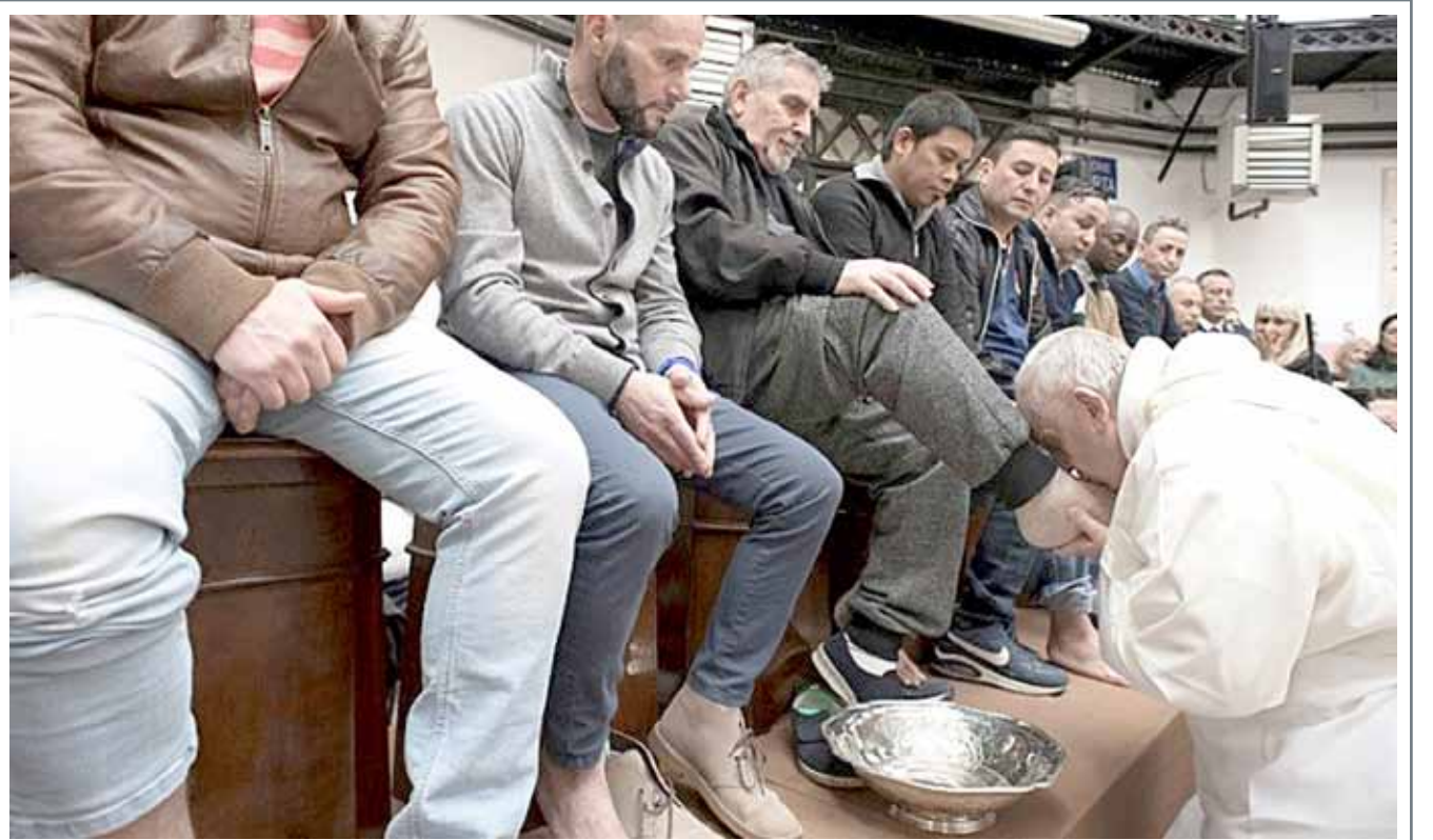
البابا فرنسيس يغسل أقدام 12 معتقلاً من 7 بلدان مختلفة، بينهم مسلمان وأوارثوذكسي وبوذي، في سجن بالعاصمة الإيطالية روما بمناسبة خميس الأسرار يوم أمس

حالة الطقس الطقس رطب ولكنه حار نسبياً خلال النهار مع بعض السحب أحياناً. الرياح جنوبية شرقية بوجه عام من 5 إلى 10 عقد وتصل من 10 إلى 15 عقدة أحياناً. ارتفاع الموج من قدم إلى ثلاث أقدام، درجة الحرارة العظمى 36 والصغرى 21 درجة مئوية.