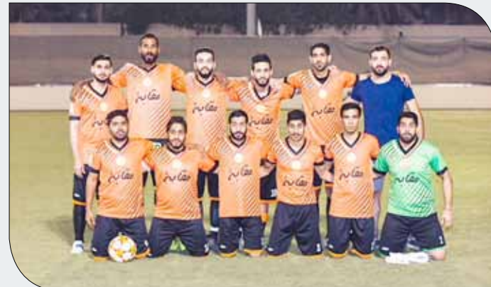
فريق مقابته سيصطدم بمركز شباب كرزكان

شباب السهلة الجنوبية في الجولة الأولى بهدفين دون مقابل بهدف مبكر في الدقيقة التاسعة، لكنه لم يستطع تسجيل الهدف الثاني إلا قبل أربع