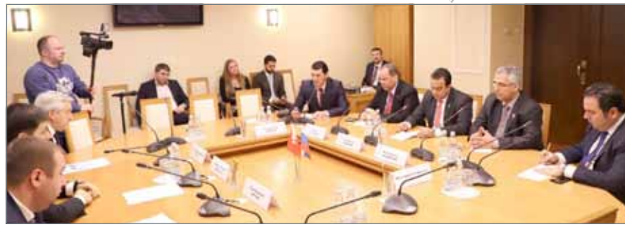
الوفد البرلماني في لقاء مع رئيس مجلس الدوما الروسي

والسياحة والتبادل الثقافي والتعاون في المجال العسكري، وأثر ذلك التعاون التوقيع على العديد من الاتفاقات المشتركة ومذكرات تفاهم وتأسيس لجنة صداقة بحرينية روسية، إضافة إلى تأسيس مجلس أعمال بحريني روسي مشترك.