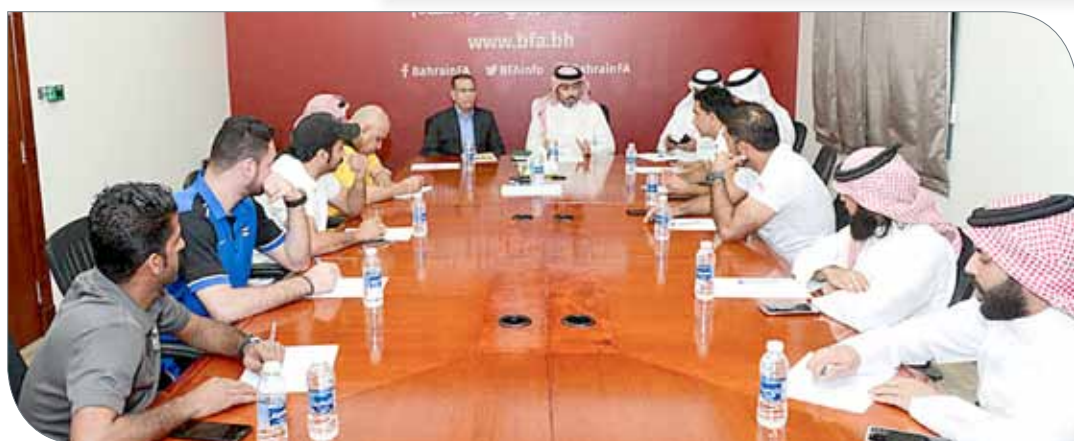
جانب من الاجتماع التنسيقي

البند المتعلق بتسجيل اللاعبين، وفي هذا الصدد تم إخطار الفرق بضرورة الإسراع بعملية تسجيل اللاعبين والانتهاء منها قبيل انطلاق الدورة بـ 5 أيام؛ لكي يتسنى للجنة الفنية العمل على إصدار بطاقات اللاعبين وضمان جاهزيتها قبل انطلاق الدورة.