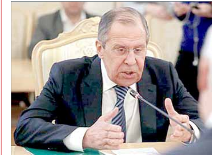
• وزير الخارجية الروسي

دبي - العربية نت: قال وزير الخارجية الروسي سيرغي لافروف إن أطرافاً سعت للتضليل واتهمت موسكو باستخدام أسلحة محظورة في الغوطة الشرقية بالعاصمة السورية دمشق. وجاء حديث لافروف في مؤتمر صحفي مشترك له مع مبعوث الأمم المتحدة إلى سوريا ستيفان دي ميستورا. وأعرب لافروف عن قلق بلاده تجاه "وضع الشعب الكردي في سوريا"، مشدداً على ضرورة الاتفاق على وقف المواجهات في عفرين. وأشار دي ميستورا إلى أن الأمم المتحدة تسعى لإيصال مساعدات إضافية للمدنيين في الغوطة، وفيما يتعلق بالآزمة الدبلوماسية التي نشبت إثر اتهام موسكو بتسميم الجاسوس الروسي في بريطانيا، أعلن وزير الخارجية الروسي أن موسكو استدعت السفير الأميركي، مؤكداً أن بلاده قد طردت 60 دبلوماسياً أميركياً، وأغلقت القنصلية في سان بطرسبرغ.