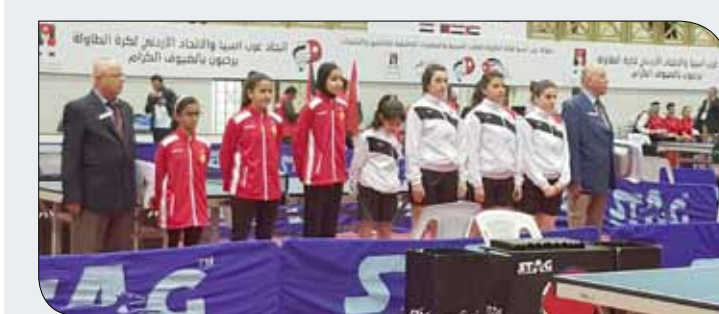
من مشاركة منتخبنا الطاولة فمء البطولة