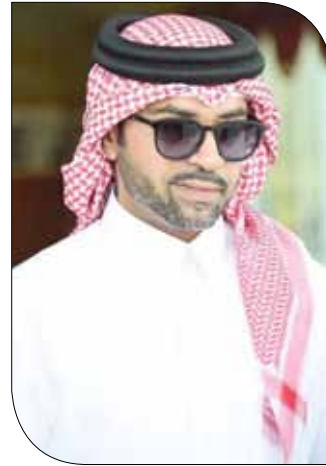
سمو الشيخ فيصل بن راشد

المسابقات المحلية والبطولات الدولية وسط تواجد نخبة من العارضين من أصحاب الخبرة والقادرين على إظهار جميع جماليات الخيل العربية الأصيلة. وأوضح سموه أن اللجنة المنظمة حرصت على الاستعداد الأمثل للبطولة