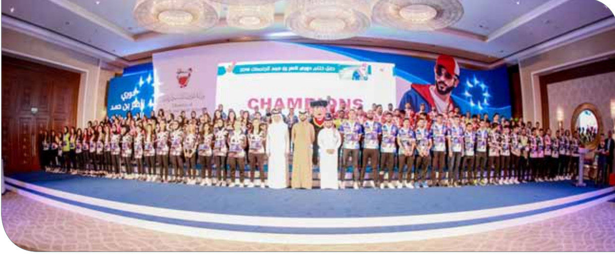
جانب من الحفل الختامي لدوري ناصر بن حمد الأول للجامعات