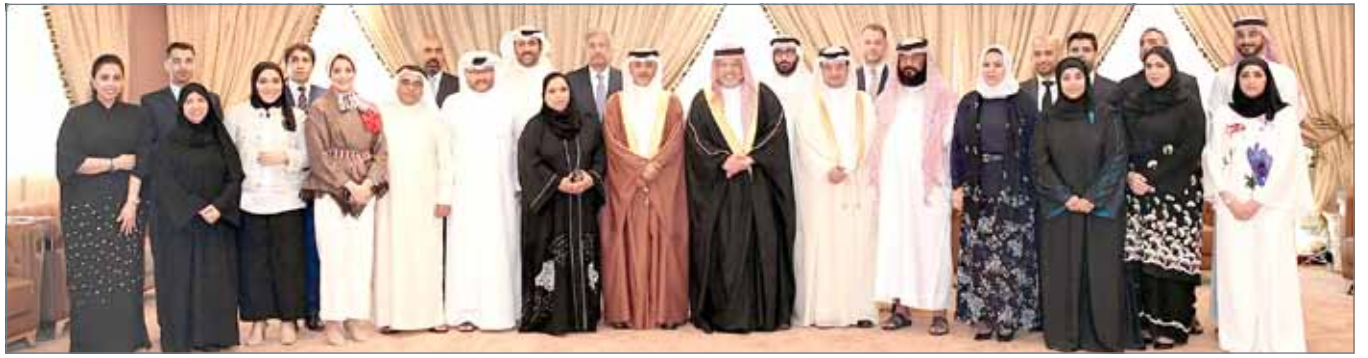
• لحظة تذكارية لوزير العدل مع الموثقين

المنامة - بنا: أدى 14 قانونياً ومحامياً القسم القانوني أمام وزير العدل والشؤون الإسلامية والأوقاف الشيخ خالد بن علي آل خليفة؛ إيماناً ببدء مزاولة أعمال كاتب العدل، بعد استكمالهم جميع متطلبات وشروط البرنامج المقرر لترخيص مزاولة أعمال الموثق الخاص باللغتين العربية والإنجليزية