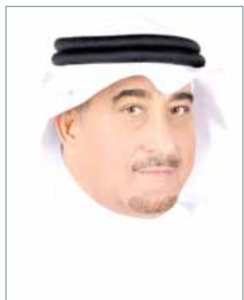
• النائب عادل بن حميد

وزارة الأشغال لرصد الكلفة التقديرية وطلب تخصيص ميزانية التنفيذ وسيتم وضع خطة زمنية لتنفيذ المشروع بعد توفير الاعتمادات المالية المطلوبة.