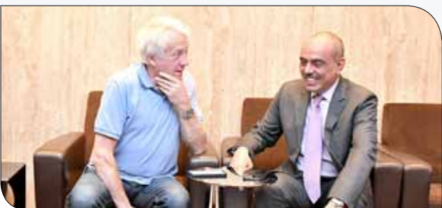
من وصول مدير سباقات الفورمولا 1

◆ الصخير - حلبة البحرين الدولية: استقبل المدير التنفيذي للشؤون الإدارية بحلبة البحرين الدولية عبدالرحمن قراطة، مدير سباقات الفورمولا 1 تشارلي وايتننج لدى وصوله للمملكة أمس استعداداً لمنافسات سباق الفورمولا 1 جائزة البحرين الكبرى لطيران الخليج 2018. ورحب قراطة بتشارلي، مستقبلاً إياه بقاعة كبار الشخصيات بمطار البحرين الدولية، جرياً على عادة الحلبة حين استقبال الفرق والمسؤولين. معبراً عن بالغ سعادته بعودة الحدث العالمي الأهم في رياضة السيارات ناقلاً تحيات مجلس إدارة الحلبة وإدارتها وموظفيها. وجاء وصول وايتننج قبل 7 أيام من انطلاق جائزة البحرين الكبرى المقرر إقامتها في الفترة من 6 وحتى 8 أبريل المقبل بالصخير. وتخصص حلبة البحرين فريقاً للاستقبال والترحيب بزوار المملكة خلال هذه الفترة يلازمهم منذ لحظة خروجهم من الطائرة لتقديم التسهيلات ومساعدتهم في إنهاء الإجراءات الرسمية للدخول.