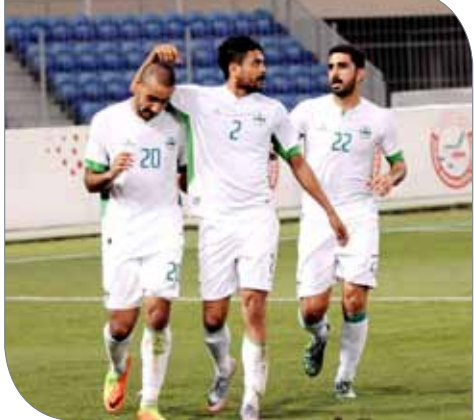
فرحة بديعابرة بافورا والظموذ