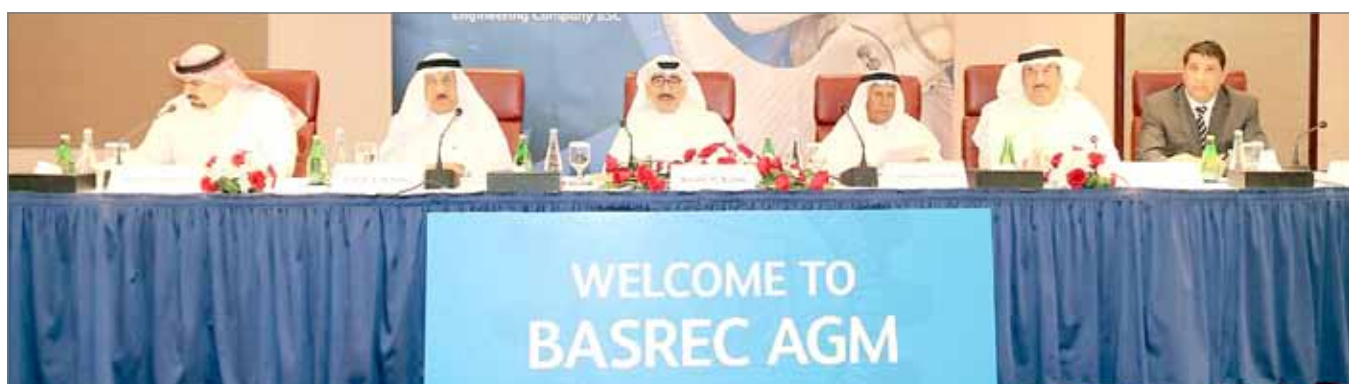
مجلس الإدارة خلال اجتماع الجمعية العمومية