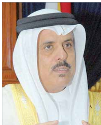
• وزير التربية

- التنسيق مع وزارة الأشغال لإجراء صيانة شاملة وتطويرية لمبنى ومرافق المدرسة، وبما يوفر البيئة المدرسية المناسبة والأمنة للطلبات.