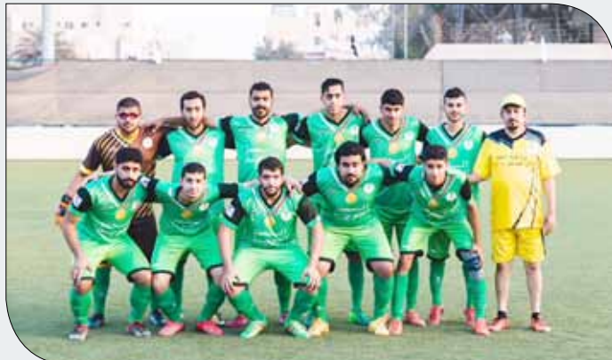
فريق السهلة الجنوبية يخوض مباراة صعبة أمام صدد

وفي المباراة الثانية من أسبوع اليوم يلعب مركز شباب صدد ضد مركز شباب السهلة الجنوبية في الساعة السابعة والربع على ستاد نادي اتحاد الريف الذي يستضيف دور المجموعات.