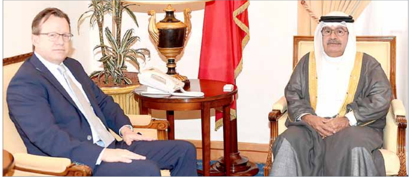
• سمو نائب رئيس مجلس الوزراء مستقبلاً السفير الأمريكي

ورحب سموه بالسفير الأمريكي الجديد، متمنياً له التوفيق والنجاح في مهام عمله الجديدة، مشيداً بمسار العلاقات الطيبة التي تربط بين البلدين الصديقين وما تشهده من تطور ونماء على جميع الأصعدة.