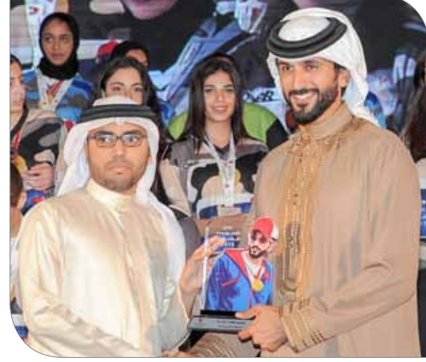
سمو الشيخ ناصر بن حمد مكرماً "البلاد سبورت"

◆ برعاية وحضور ممثل جلالة الملك للأعمال الخيرية وشؤون الشباب رئيس المجلس الأعلى للشباب والرياضة رئيس اللجنة الأولمبية البحرينية سمو الشيخ ناصر بن حمد آل خليفة، أقيم بفندق سوفيتيل الزلاق حفل ختام دوري ناصر بن حمد للجامعات، والذي أسدل الستار على منافساته 17 مارس، وأقيم تحت رعاية سموه، ونظمته وزارة شؤون الشباب والرياضة، إذ شهد مشاركة 15 جامعة من مملكة البحرين تنافست في 3 ألعاب جماعية هي: لعبة كرة القدم الصالات "لطلاب والطالبات"، لعبة كرة الطائرة "لطلاب" ولعبة كرة السلة "لطالبات".