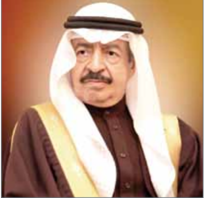
• سمو رئيس الوزراء

المنامة - بنا: صدر عن رئيس الوزراء صاحب السمو الملكي الأمير خليفة بن سلمان آل خليفة قراران رقم 12 و 13 لسنة 2018، بتجديد مدة عضوية أعضاء مجلس الولاية على أموال القاصرين، ومن في حكمهم واعتماد البرنامج الوطني لتسهيلات النقل الجوي وتشكيل اللجنة الخاصة به. وجاء في المادة الأولى من القرار رقم 12 أنه تجدد عضوية أعضاء مجلس الولاية على أموال القاصرين ومن في حكمهم برئاسة وزير العدل والشؤون الإسلامية والأوقاف.