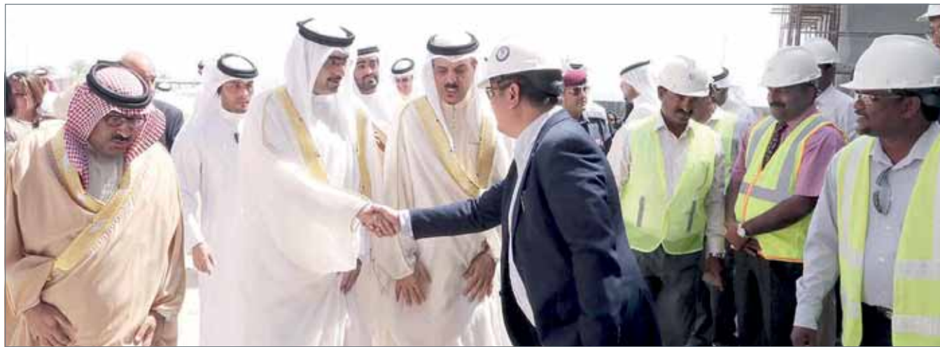
• سمو محافظ الجنوبية في زيارة مشروع المدرسة النموذجية الشاملة للبنات في مدينة خليفة

النظامي بالمملكة، حيث ستضم المراحل التعليمية الثلاث في موقع واحد، بخدمات متكاملة، مع الحرص على مراعاة خصوصية كل مرحلة، وتستوعب نحو 1700 طالبة، إضافة إلى عضوات الهيئتين الإدارية والتعليمية.