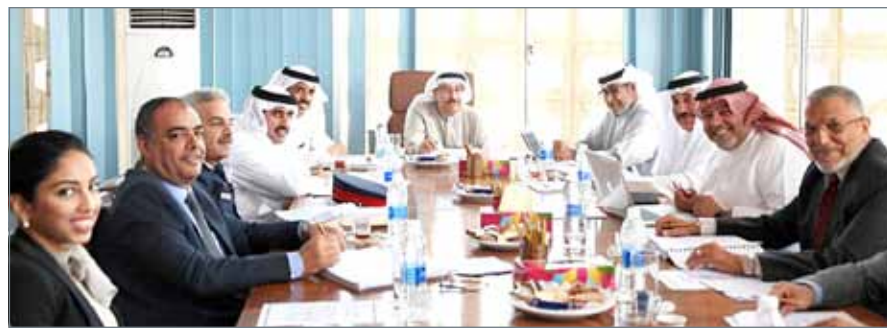
نائب رئيس مجلس الوزراء يترأس اجتماع اللجنة الوزارية للشؤون القانونية

عليها وقررت رفعها إلى مجلس الوزراء لاتخاذ القرارات اللازمة بشأنها، فضلا عما قامت به اللجنة من إبداء الرأي في بعض الموضوعات المحالة إليها من مجلس الوزراء، والوزارات المختلفة.