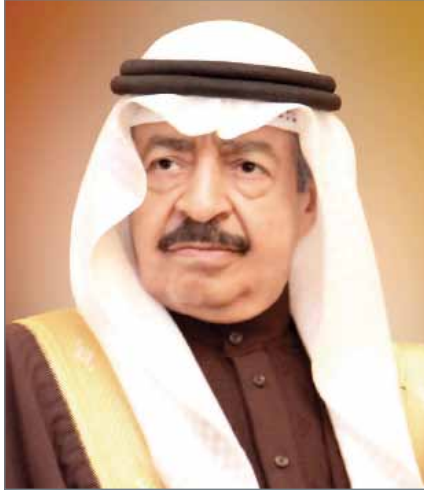
• سمو رئيس الوزراء

على الوزير - كل فيما يخصه - تنفيذ هذا القرار ويعمل به من تاريخ صدوره، وينشر في الجريدة الرسمية.