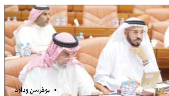
• بوفرسن وداود

بتعديل المادتين رقم (345) و(347) من المرسوم بقانون بإصدار قانون العقوبات. ويتألف الاقتراح بقانون من مادتين الأولى منه مادة موضوعية تتعلق بمعاقبة من واقع أنثى أتمت الرابعة عشرة ولم تتم السادسة عشرة برضاها بالسجن، وكذلك معاقبة من واقع أنثى أتمت السادسة عشرة ولم تتم الحادية والعشرين برضاها، إضافة إلى معاقبة الأنثى (الزانية) التي رضيت بمواقعتها بالحسب مدة لا تزيد على 5 سنوات.