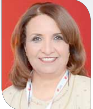
الشيخة حياة بنت عبدالعزيز

الرفاع – اتحاد الطاولة: رفعت رئيسة مجلس إدارة الاتحاد البحريني لكرة الطاولة الشيفخة حياة بنت عبدالعزيز آل خليفة العالمية الذي يؤكد القدرات البحرينية باستضافة البطولات الكبرى على أرض البلاد، وأنت رئيس الوزراء صاحب السمو الملكي الأمير خليفة بن سلمان آل خليفة الأمين نائب القائد الأعلى للملكة باستضافة السباقات العالمية وبإشراف من سمو الشيخة حياة بنت عبدالعزيز بجهد مجلس إدارة طلبة البحرين الدولية وكافة السباق العالمي وإجراجه بأفضل صورة تنظيمية. وأكدت الشيفخة حياة بنت عبدالعزيز آل خليفة أن سباق الفورمولا 1 جعل أنظار الملايين