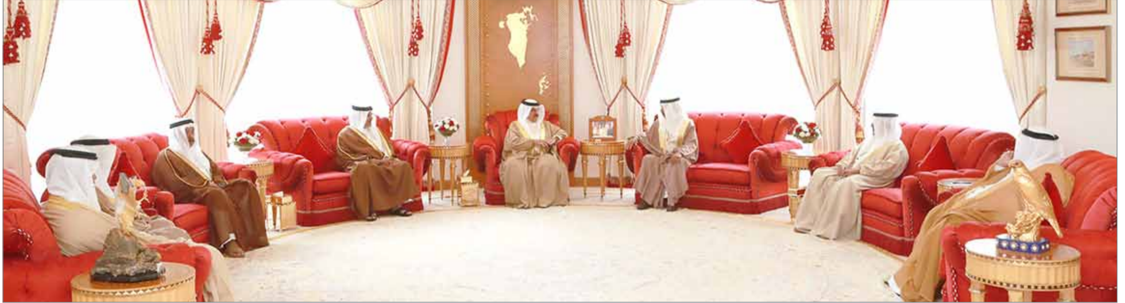
• جلالته الملك مستقبلاً سمو رئيس الوزراء وسمو ولي العهد

• نثمن دور سمو رئيس الوزراء ومتابعته المستمرة لبرامج الحكومة