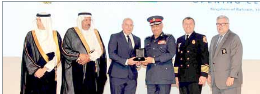
• وزير الداخلية نيبب رئيس الأمن العام في افتتاح المؤتمر الدولي لعمليات الإطفاء للشرق الأوسط

خصوصاً أن المنطقة تشهد تنمية عمرانية ومباني شاهقة وهو ما يستلزم جهود الدفاع المدني لتفقد تلك المباني وأموال السلامة.