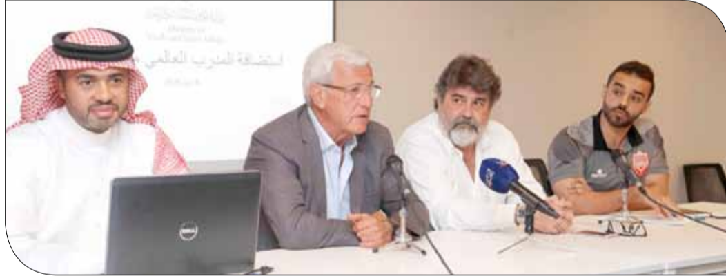
ليبّي متحدثاً للمدربين الوطنيين

فرق الفئات العمرية في نادي سامبدوريا، ثم الانتقال إلى مصاف فرق الدرجة الثالثة، وصولاً إلى قيادة الأندية الكبيرة وتحقيق