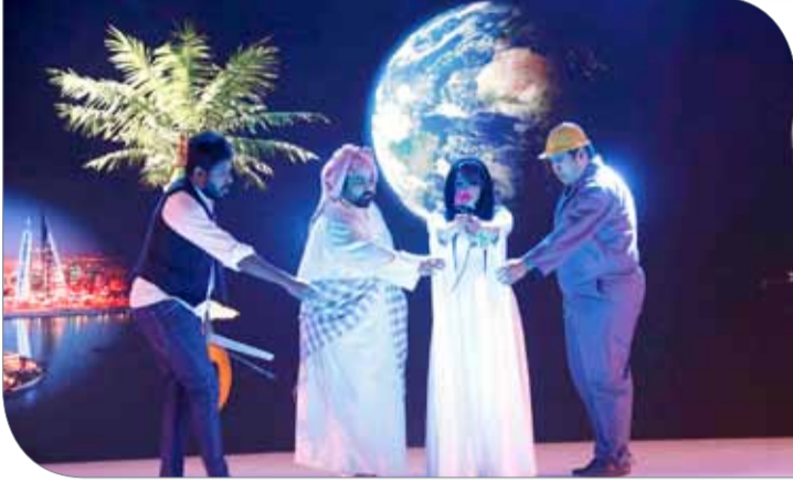
عرض رائعة تضمنها الأوبريت

وزارة شؤون الشباب والرياضة | اللجنة الإعلامية