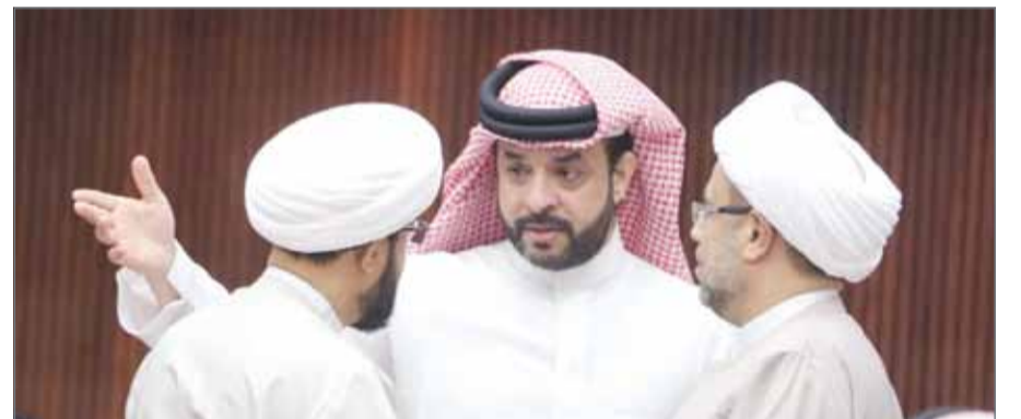
• الماجد والشاعر والعصفور