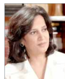
الشيخة مي بنت محمد

النامية - هيئة البحرين للثقافة والآثار: شاركت رئيسة هيئة البحرين للثقافة والآثار الشيخة مي بنت محمد آل خليفة أمس، في افتتاح المؤتمر السنوي السادس عشر لمؤسسة الفكر العربي "فكر" في إمارة دبي،