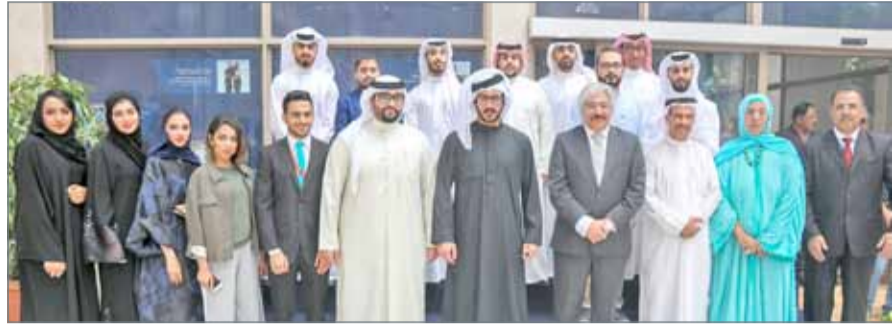
• سمو الشيخ خالد بن حمد يبدش المقر الدائم لمكتب مبادرات سموه

موضحاً سموه أن مملكة البحرين تزخر بشباب لديه الفكر وحس المبادرة ودائماً ما يبحث عما يبيزه عن الآخرين، ويبدل الجهود والتضحيات لتكون البحرين دائماً في الطليعة.