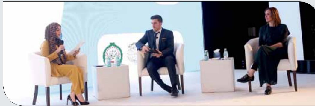
جانب من الجلسة الأولى

الخاصة تحتاج مدربين لديهم شغف للاهتمام بهذه الفئة، ويجب أن يمتلكوا الثقة والتعامل مع الغير كرياضيين مميزين. وفي الورقة الثانية بالمحور نفسه، والتي حملت عنوان "الرياضة بوابتنا