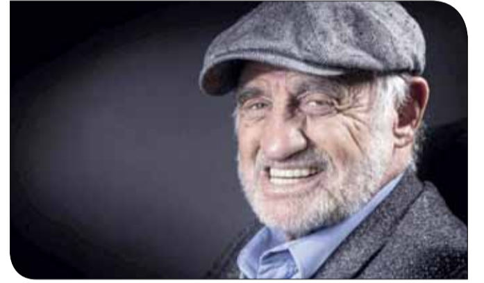
جان بول بلوندو