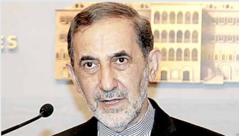
• علي أكبر ولايتي المستشار الأعلى للمرشد الإيراني

لكنها ليست المرة الأولى التي تقصف فيها إسرائيل مطار التيفور، إذ استهدفته