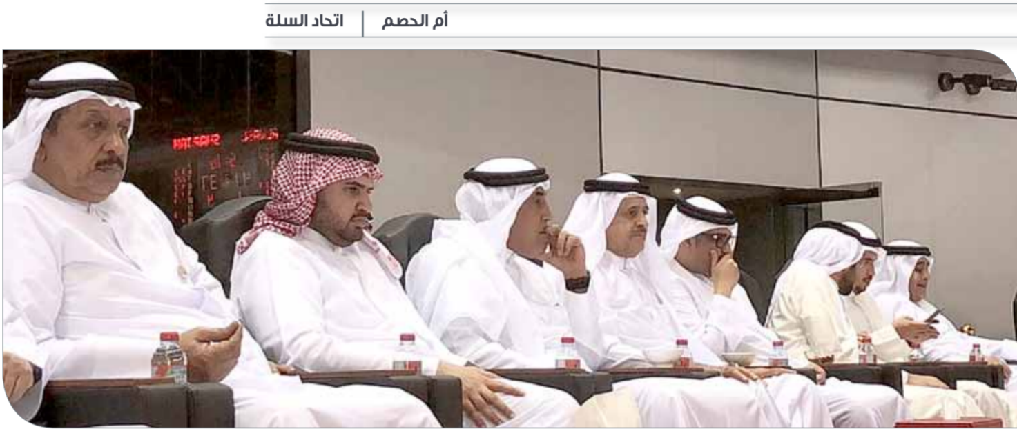
سمو الشيخ عيسى بن علي خلال متابعة اللقاء

وكيل قائد سلة "الأحمر والأصفر" لـ "البلاد سبورت":