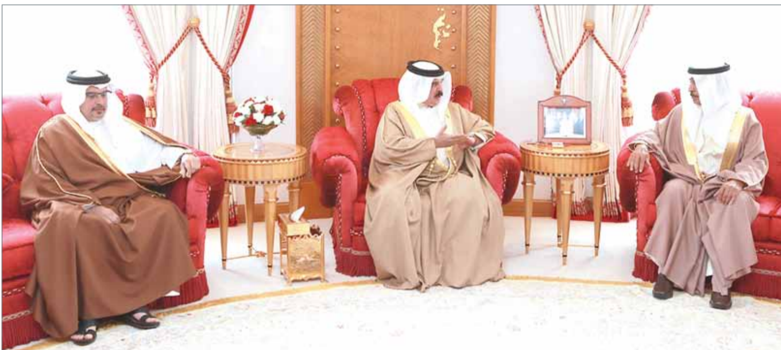
● جلالة الملك مستقبلاً سمو رئيس الوزراء وسمو ولي العهد

● دور فاعل للسعودية في الدفاع عن المصالح العليا للأمة