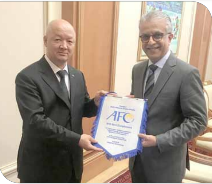
سلمان بن إبراهيم يسلم علم الاتحاد الآسيوي الى وزير الرياضة التركمانستانيه

عشق آباد | مكتب رئيس الاتحاد الآسيوي لكرة القدم