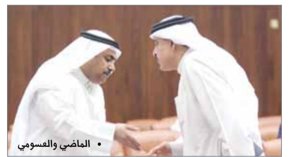
• الماضي والعسومي

أكد وكيل وزارة العمل والتنمية الاجتماعية محمد الأنصاري أن نظام التأمين ضد التعطل تم وضعه بناءً على دراسة اكتوارية حددت مصادر تمويل هذا النظام والحقوق التي يرتبها للمستفيد منه. جاء ذلك، خلال نقاش تعديل تشريعي يرفع إعانة التعطل للجامعيين من 150 إلى 200 دينار شهريًا، ورفع الإعانة لغير الجامعيين إلى 150 دينارًا. وبين الأنصاري أن التعديل المقترح بزيادة مقدار تعويض