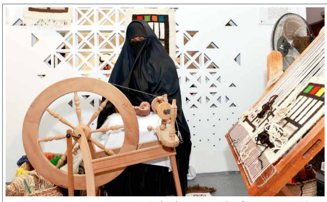
بحرينية تقوم بغزل الصوف في معرض "حرفنا" الذي اختتمت فعالياته أمس الأول في باب البحرين

ويظل لقب أكبر الرجال سنا على الإطلاق مسجلا في موسوعة جينيس للأرقام القياسية باسم ياباني آخر هو جيرمون كيمورا الذي توفي العام 2013 عن عمر 116 عاما و54 يوما. وأكبر عمر موثق للإنسان على الإطلاق هو 122 عاما و164 يوما، وتحمل اللقب الفرنسية جان لوييز كالمون التي توفيت العام 1997.