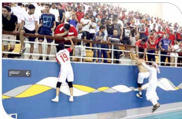
حضور جماهيري غفير