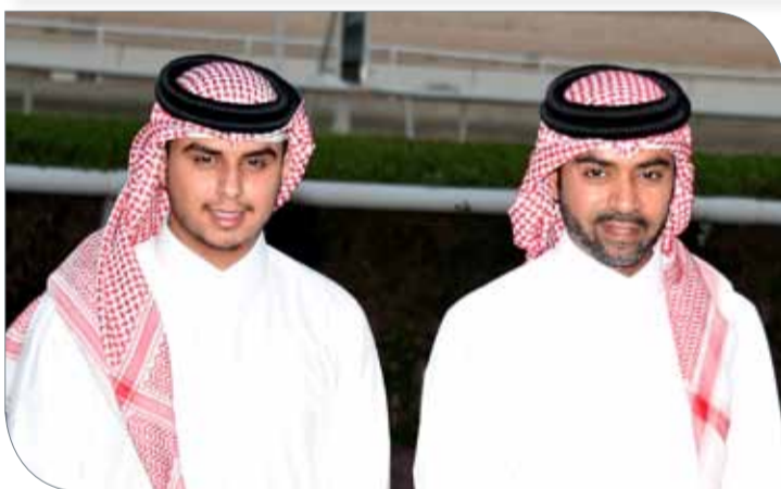
سمو الشيخ فيصل بن راشد وعيسى بن فيصل

خليفة للفئة الثانية من جيات الدرجة الأولى (نتاج محلي) مسافة 1600 متر والجائزة 3000 دينار ومشاركة 7 جيات هي "كبيد كروسيدر - حراش - وين لوني - فارنج - شامخ - سنينك - إيغل - مرسال".