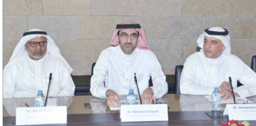
• الاتفاقية تأتي بالتنسيق مع المصرف المركزي