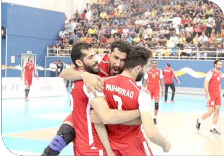
فرحة المحرق بالفوز