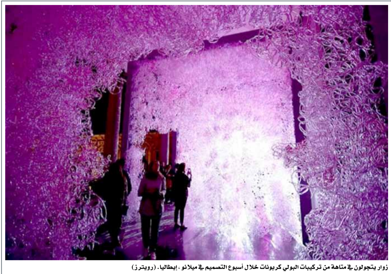
زوار يتجولون في متاهة من تركيبات البولي كربونات خلال أسبوع التصميم في ميلانو ، إيطاليا - (رويترز)

حالة الطقس: الطقس معتدل ولكنه حار نسبيا مع بعض السحب خلال النهار. الرياح شمالية غربية من 12 إلى 17 عقدة وتقل سرعتها من 7 إلى 12 عقدة في وقت لاحق من هذه الليلة ثم تتحول إلى جنوبية شرقية. ارتفاع الموج من قدم إلى قدمين قرب السواحل ومن 2 إلى 4 اقدام في عرض البحر. درجة الحرارة العظمى 34 والصغرى 21 درجة مئوية.