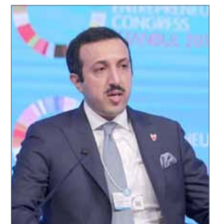
• وكيل الخارجية

المجالات الاقتصادية الجديدة، ومركزاً متقدماً لريادة الأعمال والابتكار، بفضل رؤية البحرين الاقتصادية 2030، وفي إطار نموذج تنموي حديث ومتطور، يتسم بالاستدامة والتنافسية والعدالة.