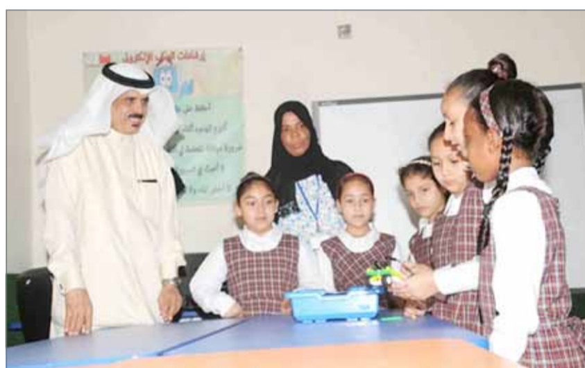
• ماجد النعيمة خلال زيارته مدرسة مريم بنت عمران الابتدائية للبنات

من أهمها مسابقة "فراشات النظافة"، ومبادرة "المزارة الصغيرة"، للمساهمة في تحسين البيئة المدرسية، إضافة إلى فعالية "مقهى الخير" لنشر ثقافة الغذاء الصحي. كما اطلع النعيمة على جهود المدرسة في تزويد الطالبات بمهارات تصميم الروبوت المتحرك، لتطوير مهارات التفكير العليا لديهن، ثم زار مركز اللياقة بالمدرسة، والذي تشرف مجموعة من الطالبات على تقديم خدماته الرياضية لزميلاتهن، بإشراف من المعلمات المختصات. وبهذه المناسبة، أشاد الوزير بالجهود المتميزة للمدرسة لتطوير العملية التربوية والتعليمية، مؤكداً اعتزاز "التربية" بما تقدمه المدارس الحكومية من إسهامات ومبادرات تربوية فاعلة، والحرص على الاستفادة منها وتمعيمها على بقية المدارس.