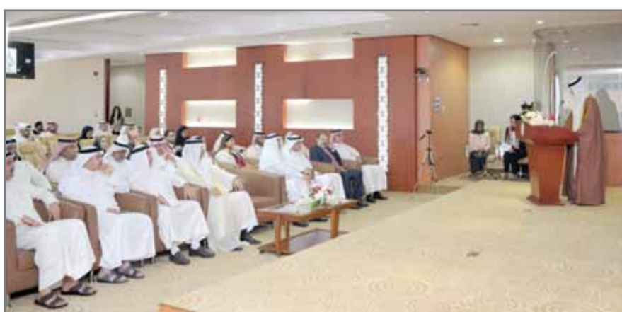
• جانب من فعالية "حقوقى 2"

والمعمل على تكيينها من أداء دورها في الحياة العامة، وإدماج جهودها في برامج التنمية الشاملة.