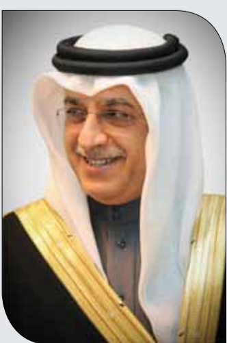
الشيخ سلمان بن إبراهيم

الامانة العامة للمجلس الأعلى للشباب والرياضة | التنمية