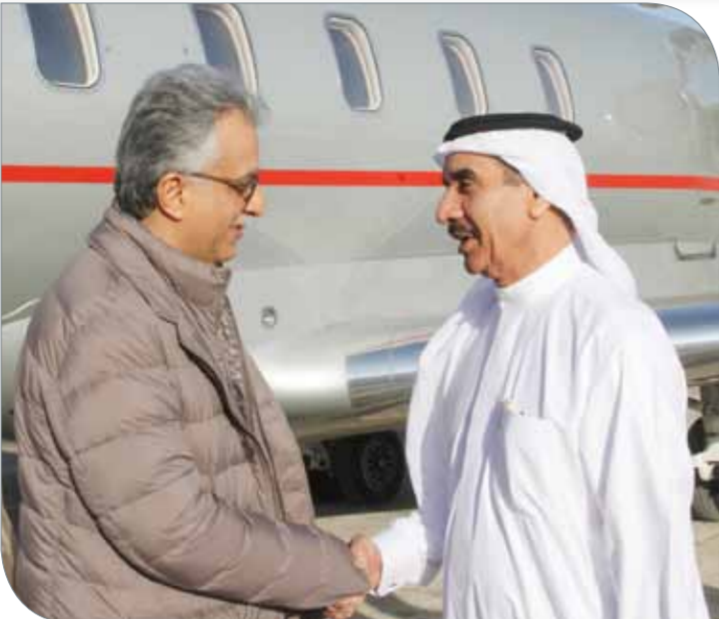
وصول الشيخ سلمان بن إبراهيم إلى الاردن أمس

مكانة الأردن كوجهة متميزة لاحتضان الأحداث الكروية الكبرى، وأثنى الشيخ سلمان بن إبراهيم لكسرة القدم بالأجواء التنافسية المثيرة التي تشهدها منافسات بطولة كأس آسيا للسيدات، مشيرا إلى أن المستويات القوية التي توفرها الأجواء المثالية لتنظيم