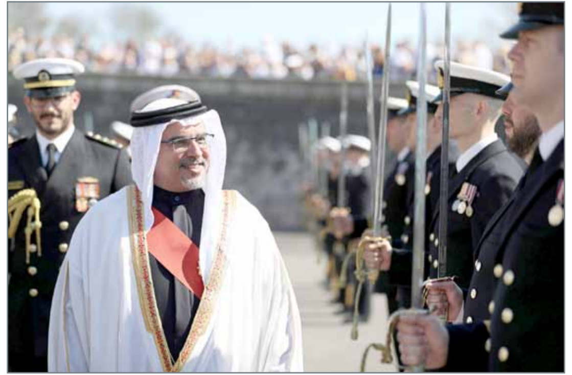
• سمو ولي العهد لدى حضوره عرض القائد البحري بالبحرية البريطانية

الملكية خارج المياه الإقليمية منذ 50 عامًا". وأضاف سموه "إن السلاح البحري يشكل مكونًا أساسيًا ضمن البنية الأمنية لأي دولة، فمن خلال ما يقوم به من مراقبة ودوريات يتمكن من التعرف على التهديدات وتحبيدها وضمان أن تبقى المسارات التجارية مفتوحة وأمنة".