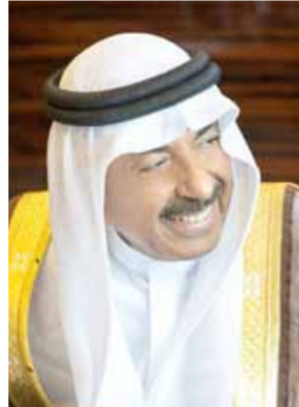
علي عبدالله خليفة

وقع اختيار معهد الشارقة للتراث والذي يشرف على تنظيم جائزة الشارقة الدولية للتراث الثقافي على الشاعر البرياني الكبير ورئيس المنظمة الدولية للفن الشعبي علي عبدالله خليفة ليكون شخصية العام للتراث الثقافي في الدورة الثانية 2018 وذلك على توصيات الأمانة العامة لجائزة الشارقة الدولية للتراث الثقافي، حيث سيقام حفل توزيع الجوائز تحت رعاية حاكم الشارقة سمو الشيخ سلطان الغاسمي يوم الأحد المقبل 22 أبريل برمح المعهد بالشارقة. يذكر بالذكر أن جائزة الشارقة الدولية للتراث الثقافي أنشئت لأهمية حماية التراث المادي وغير المادي