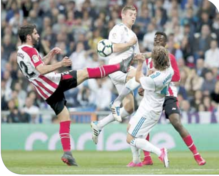
من مواجهة ريال مدريد وأتلتيك بلباو

وعن صافرات الاستهجان الصادرة من جمهور البرنابيو ضد المهاجم الفرنسي، وأضاف: "تفهم الأمر لأنه جمهور ينتظر منا الكثير ويطلب كريم بتسجيل المزيد من الأهداف، ولكنه يلعب بشكل جيد في الكثير من الأحيان ويساعد الفريق.. من الطبيعي مطالبته بتسجيل الأهداف لكننا نعلم أنه يحتاج للدعم".