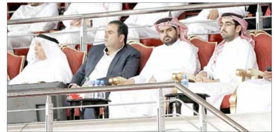
• سمو الشيخ عيسى بن علي يتقدم حضور مباراة السلة بين المنامة والأهلي

بينهما مساء أمس (الخميس)، على صالة مدينة خليفة الرياضية بمدينة عيسى، ضمن إطار الجولة الأولى من الدور النهائي لبطولة الدوري، وسط حضور جماهيري كبير. وجاء رئيس مجلس إدارة الاتحاد البحريني سمو الشيخ عيسى بن علي بن خليفة آل خليفة في مقدمة الحضور خلال اللقاء.