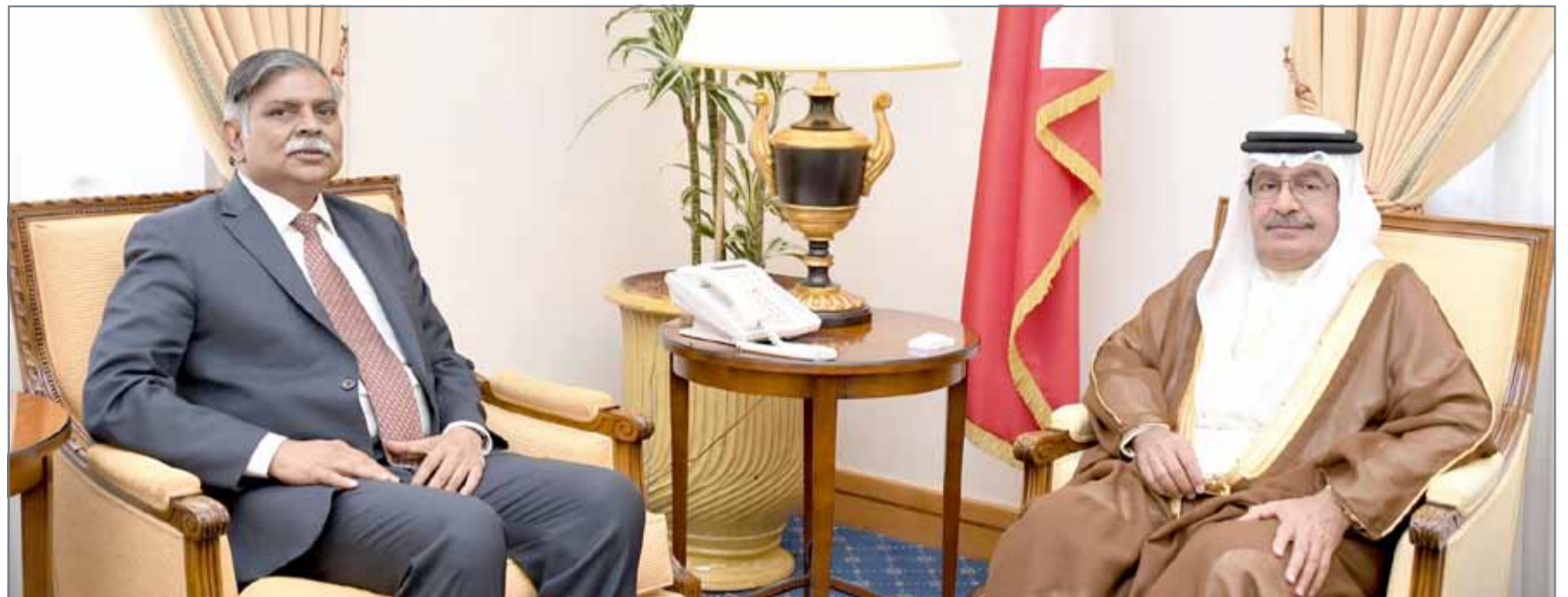
• سمو الشيخ علي بن خليفة يستقبل السفير الهندي