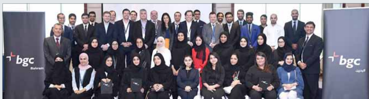
● مشاركون في الفعالية

هذا التدريب المتعدد المستويات يعد الموظفين الشباب ويؤهلهم لخوض غمار مسيرة مهنية ناجحة في واحد من أكثر القطاعات حيوية وإثارة في الأسواق المالية العالمية. بعد الانتهاء من التعليم الفني المبدئي الذي يتمكن الخريجون من خلاله الاطلاع على فئات متعددة من الأصول، سيواصل المتدربون تدريبهم في بيئة المكتب، وسيعملون على مساعدة فريق الوساطة من خلال احتساب الأسعار، وتسجيل عمليات الوساطة، والتفاعل مع العملاء، وحضور اجتماعات الفريق والمساهمة فيها. وبصفتهم أعضاء قيمين في المكتب، ستتاح للمتدربين فرصة تأسيس علاقات مع العملاء الحاليين والجديد في جميع أنحاء العالم.