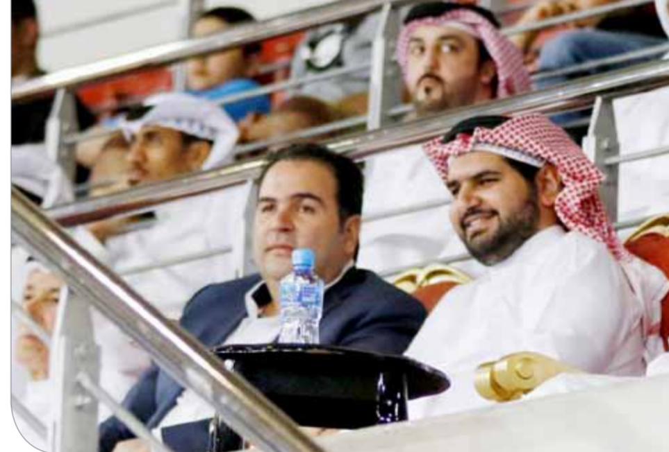
سمو الشيخ عيسى بن علي بنمشهد النهائي الأول

وجاء الربع الثالث سريعًا من الفريقين اللذين تقاسما الهجوم السريع على الحقتين مستغلين الكرات الكثيرة الضائعة مع أفضلية التقدم للمنامة منتصف الربيع 46/41، وأشعلت ثلاثية الأهلاوي كاظم ماجد فيل الإثارة بعد أن قلبت النتيجة، غير أن لفارق سلة واحدة بواقع 46/44، رد عليها المنامة ب7 نقاط متتالية أعاد بها رفع النتيجة 53/44.