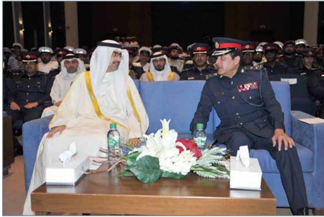
• سمو الشيخ خليفة بن علي آل خليفة لدى تكريمه ضباط شرطة المحافظة الجنوبية

مثلت أساس نهج التواصل والتعاون مع رجال الأمن لتنفيذ المسؤوليات الأمنية بالمحافظة، وأن ثمار التعاون المشترك بين المحافظة الجنوبية ومديرية شرطة المحافظة الجنوبية تكلفت بالنجاح في فترة وجيزة بالعديد من الحلول والتوصيات التي عالجت الكثير من القضايا أبرزها مشروع تثبيت الكاميرات الأمنية.