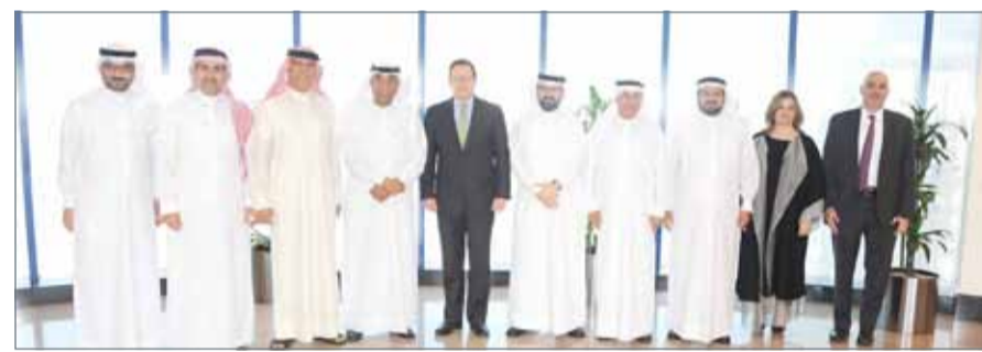
● جانب من لقاء “الغرفة” مع السفير الأميركي

الاقتصادي مع البحرين، مبدئياً حرص بلاده على تنمية قطاع الاستثمار بين البلدين من خلال تعزيز آليات التعاون بين غرفة تجارة وصناعة البحرين والغرف التجارية والصناعية الأميركية لتحقيق كل ما يخدم تطور المصالح الاقتصادية المشتركة، كما أكد على أهمية تبادل الزيارات بين الوفود التجارية خاصة القطاعية المتخصصة، مؤكداً استعداد السفارة الأميركية دوماً للتنسيق مع الغرفة في كافة المجالات ذات الاهتمام المشترك، والعمل على تذليل مختلف الصعوبات والتحديات التي تواجه المستثمرين البحرينيين.