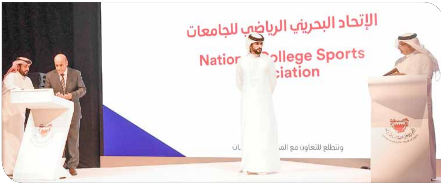
سمو الشيخ ناصر بن حمد يدشن برنامج استجابة

وأكد سموه أن العمل سيكون أيضاً على فتح باب التراخيص الرياضية التجارية، ومن الواجب الاهتمام بهذا الشأن ورؤية سجلات رياضية احترافية من خلال التعاون والمبادرة من الشركات والمؤسسات.