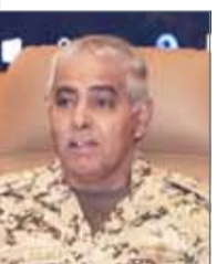
• نزياب النعيمة

الرفاع - قوة الدفاع: شارك رئيس هيئة الأركان الفريق الركن نزياب النعيمة في مؤتمر رؤساء الأركان