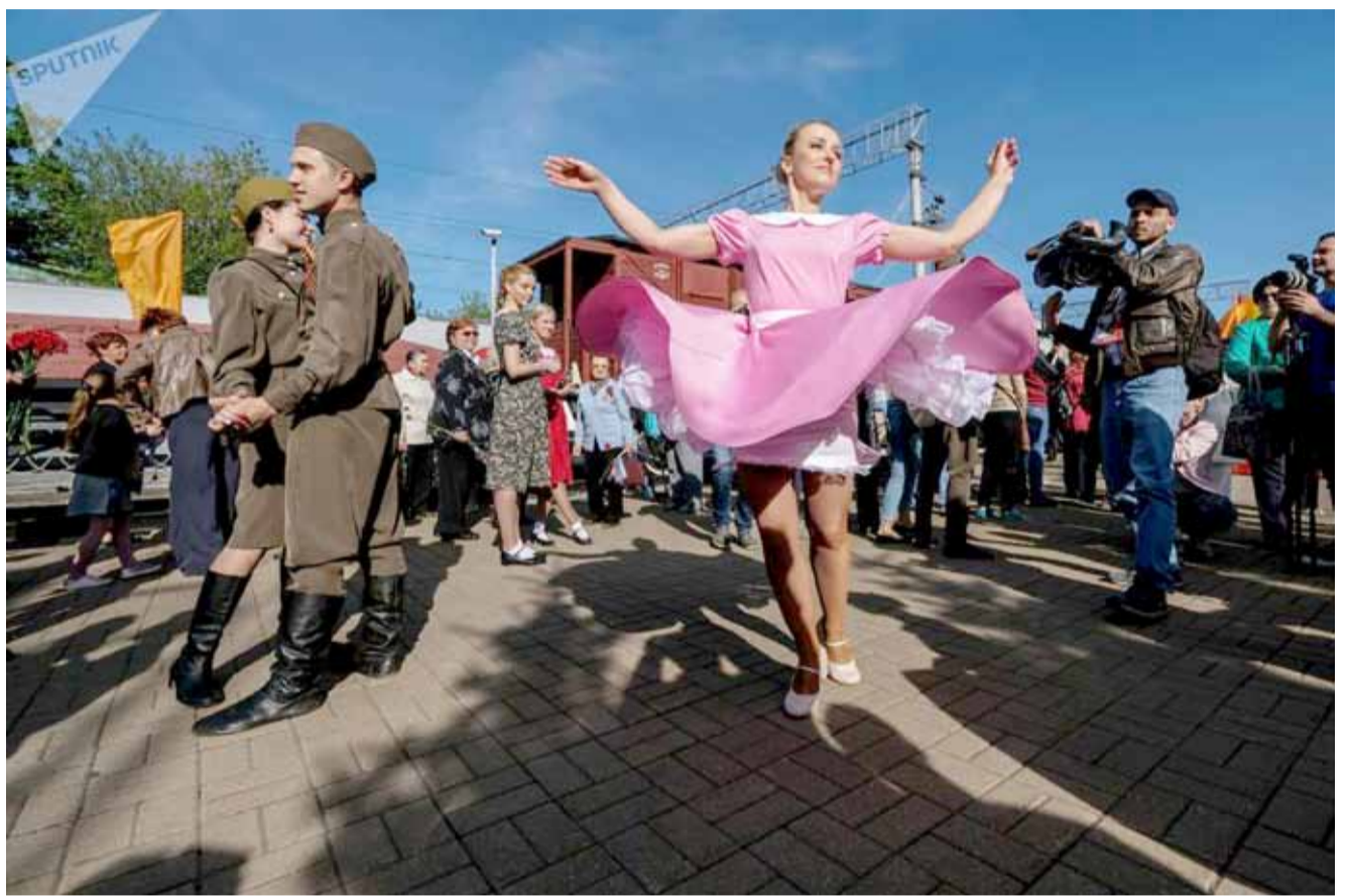
احتفالات بمناسبة الذكرى الـ 73 لعيد النصر على قوات ألمانيا النازية في الحرب الوطنية العظمى (1941 - 1945) في موسكو.

ارتفاع الموج من قدم إلى 3 أقدام ولكنه من 3 إلى 5 أقدام في عرض البحر خلال الظهيرة. درجة الحرارة العظمى 38 والصغرى 25 درجة مئوية.