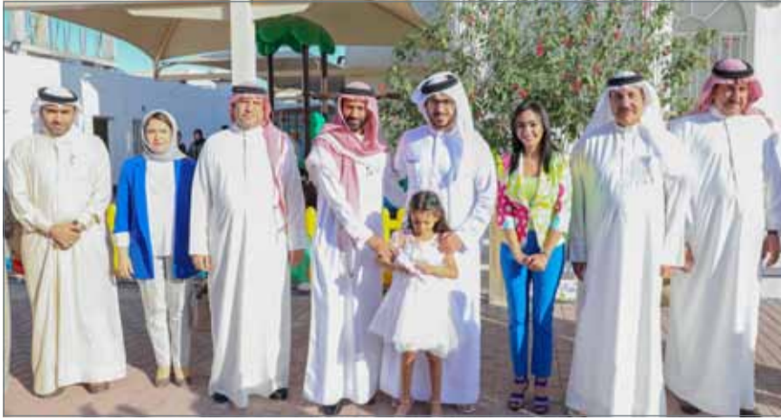
• جانب من زيارة سمو الشيخ خالد بن حمد لمركز دانة للتربية الخاصة

من جهتها، قالت رئيسة مجلس إدارة المركز سمية صالح ”بداية، نشتمن الجهود المتميزة لسمو الشيخ خالد بن حمد آل خليفة برعاية ودعم مختلف الحالات الإنسانية، فإن زيارة سموه للمركز بمناسبة اليوم العالمي للتوحد في أبريل الماضي، كان لها الأثر الإيجابي التي دفعت المركز لإطلاق مشروع دعم أطفال التوحد وصعوبات التعلم للأسر ذات الدخل المحدود بمناسبة حلول شهر رمضان المبارك، من خلال منحهم فرصة تسجيل أبنائهم بالمركز والاستفادة من الخدمات التي يقدمها المركز، وفق برنامج علاجي مهاري تعليمي متكامل يساهم في تنمية قدرات أطفال التوحد وصعوبات التعلم ويساعدهم للعيش بصورة أكثر طبيعية ويؤهلهم للاندماج في الحياة المدرسية المقبلة“.