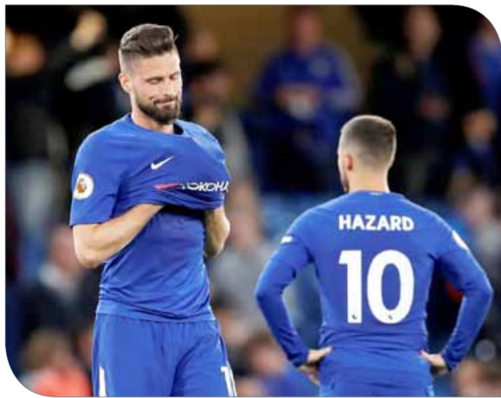
من مواجهة هدرسفيلد وتشيلسي

لهيدرسفيلد على النتيجة". وفضل المدرب الإيطالي، الذي أشارت تكهنات صحفية إلى رحيله عن تشيلسي بنهاية الموسم، عدم الإجابة عن أسئلة حول تحسين تشكيلة الفريق وقال إن النادي سينظر في هذا الأمر بعد ذلك. وأشار كونتي إلى أنه يفكر فقط في آخر مباراة في الدوري ضد نيوكاسل يونايتد يوم الأحد، ثم نهائي كأس الاتحاد الإنجليزي ضد مانشستر يونايتد بعد ذلك بأسبوع.