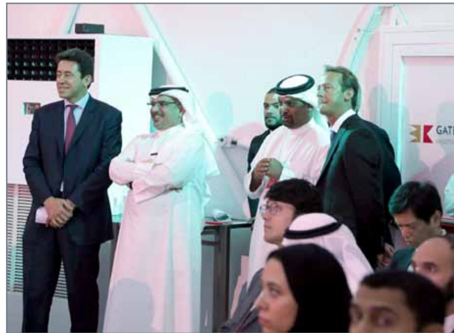
سمو نائب جلالة الملك لدى حضوره مؤتمر "بوابة الخليج"

المنامة - بنا: لدى حضور نائب جلالة الملك ولي العهد صاحب السمو الملكي الأمير سلمان بن حمد آل خليفة، أمس، مؤتمر بوابة الخليج الذي نظمه مجلس التنمية الاقتصادية تحت رعاية سموه في الفترة ما بين 8 و10 مايو، أشاد سموه بمستوى التفاعل بين المشاركين البالغ عددهم 500 مستثمر وأصحاب أعمال ومسؤولين من خلال فعاليات المؤتمر الذي تحتضنه مملكة البحرين. وقال سموه "إن ما شكله المؤتمر من منصة حيوية جمعت مستثمرين على المستويين الإقليمي والدولي يؤكد أهمية أهداف هذه الفعالية الرامية إلى توفير مدخل مباشر إلى السوق الخليجي وخلق الفرص من خلال الإمكانيات التي توفرها الفرص الاستثمارية إقليمياً ودولياً". ونوه سموه بما تم الإعلان عنه من جملة من المشاريع الحيوية، وهو الأمر الذي يجسد استراتيجيات مملكة البحرين لتعزيز دور القطاع الخاص كمحرك رئيس للنمو مع دعم الابتكار والتنافسية.