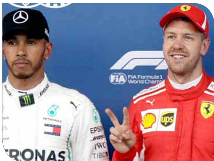
لويس هاميلتون وسيباستيان فيتل

المقدمة لكن الآخرين سيجلوبون معهم أجزاء جديدة". وأضاف "ربما تكون هذه لحظة حاسمة هذا الموسم وأنا مهتم بمعرفة كيف سيكون أداء بقية السائقين".