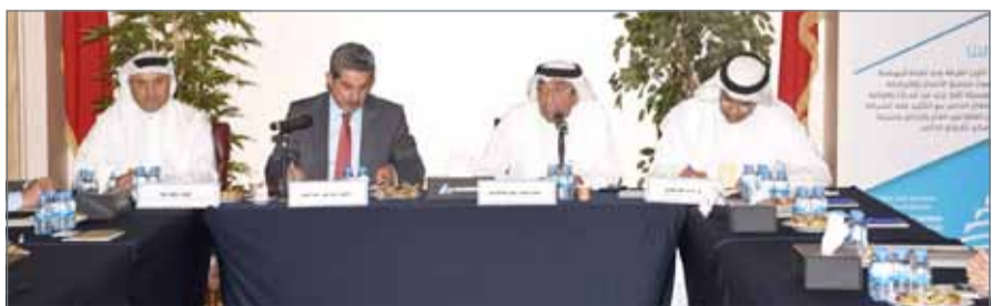
• جانب من لقاء التجار

يكون العرض والطلب على الأغذية طبيعياً خاصة وأن التجار قاموا بعمل الترتيبات اللازمة قبل فترة، مشيراً إلى عدم وجود أية مخاوف من حدوث أي أزمة لحوم أو دواجن أو غيرها من السلع الأساسية. بفضل الاستعدادات المبكرة للشهر الفضيل، وتمن الحضور والمشاركون الجهود والأدوار البارزة التي تقوم بها الغرفة سنوياً لطرح هذه المبادرة الإيجابية، متمنين استمرارها في الأعوام المقبلة خاصة وأن الاستفادة الأول المواطنين.