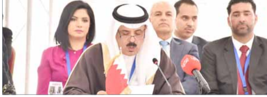
وزير التربية والتعليم خلال إلقاء كلمة مملكة البحرين في المؤتمر العام لمنظمة الألكسو

والثقافية والعلمية، وتعزيز الشراكات مع المنظمات والمؤسسات ذات العلاقة في العالم، من خلال إنشاء "مرصد الألكسو" لبناء قاعدة بيانات وإحصاءات ودراسات وخبرات مرتبطة بالتربية والثقافة والعلوم، وتقييم واقع اللغة العربية والبرامج التعليمية المتعلقة بها في الوطن العربي، خصوصاً في ضوء التحديات التي تواجه الأمة العربية.