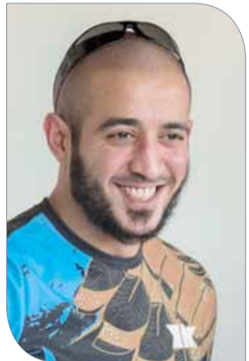
سمو الشيخ خالد بن حمد

جاكرتا | المكتب الإعلامي لسمو الشيخ خالد بن حمد