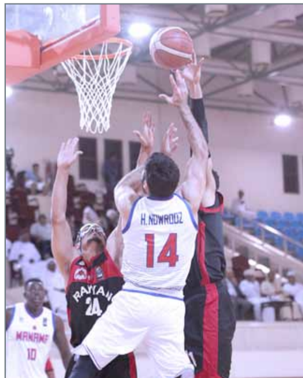
المنامة يتخطى الريان في بطولة السلة الخليجية أمس