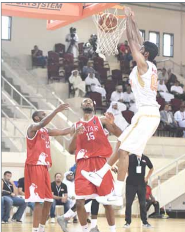
المحرق يكتسح العربي القطري أمس