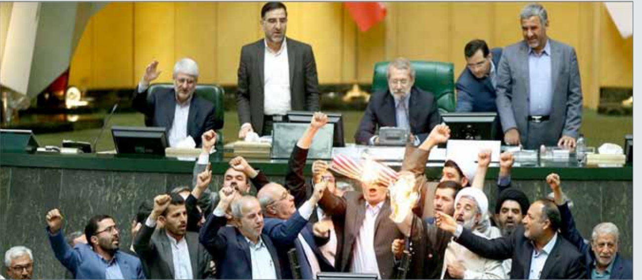
حرق العلم الأميركي في البرلمان الإيراني

وهدد الرئيس الإيراني بإعادة استئناف طهران أنشطتها النووية، بما في ذلك تخصيب اليورانيوم إلى المستوى الصناعي الذي يمكن إيران من صنع القنبلة النووية. في المقابل أكد روحاني على أن إيران ستلتزم بشروط الاتفاق النووي في انتظار إجراء مفاوضات مع القوى الأوروبية التي حاولت التوسط لدى ترامب.