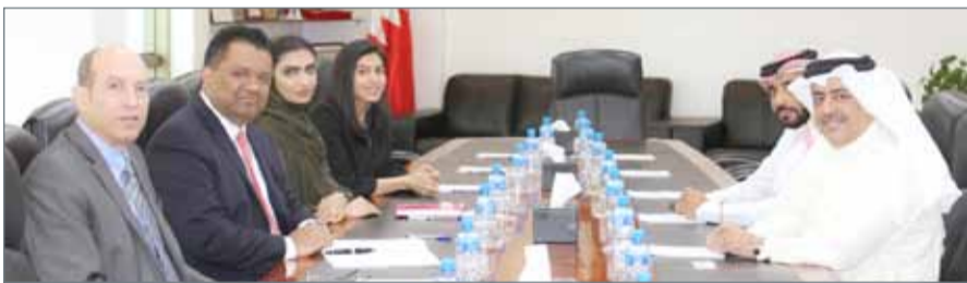
• خلال الاجتماع

العمل البحرينية درجة عالية من التنافسية كما يمنح العمالة الوافدة إمكان تصحيح وضعها القانوني مع حرية العمل، بما يتسق مع الحقوق والموثيق الدولية ولاسيما العهد الدولي الخاص بالحقوق الاقتصادية والاجتماعية والثقافية والذي صادقت عليه مملكة البحرين في العام 2007.