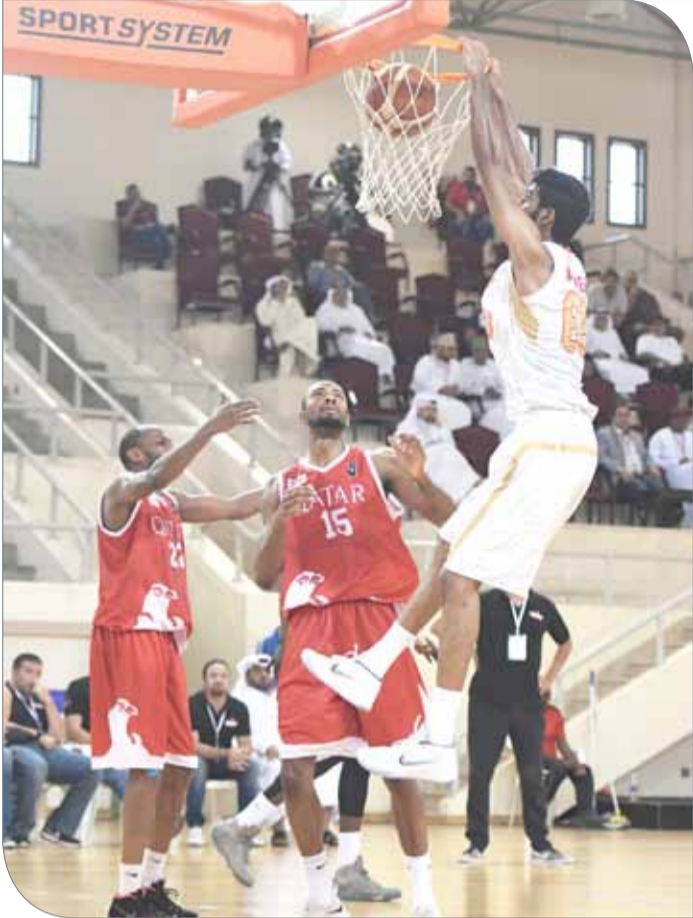
من لقاء المحرق والعربي أمس

وتبادل الفريقان سجل التسجيل، ودام التفوق للمحرق في النتيجة منتصف الفترة 12/9، قبل أن يحسم هذا الربع بـ 21/16. ولم تختلف بداية المحرق المتواضعة في الربع الثاني عن الأول، وتمكن العربي من تقليص الفارق لنقطة واحدة قبل أن يسجل التعادل 23/23. وزاد المحرق من الفاعلية الهجومية مستعيدا التقدم وموسعا الفارق تدريجيا إلى 10 نقاط منتصف الربع بواقع 36/26. وحافظ المحرق على فارق العشر نقاط بهجوم ضارب ودفاع محكم، قبل أن يرفع النتيجة نهاية الشوط الأول 50/33.