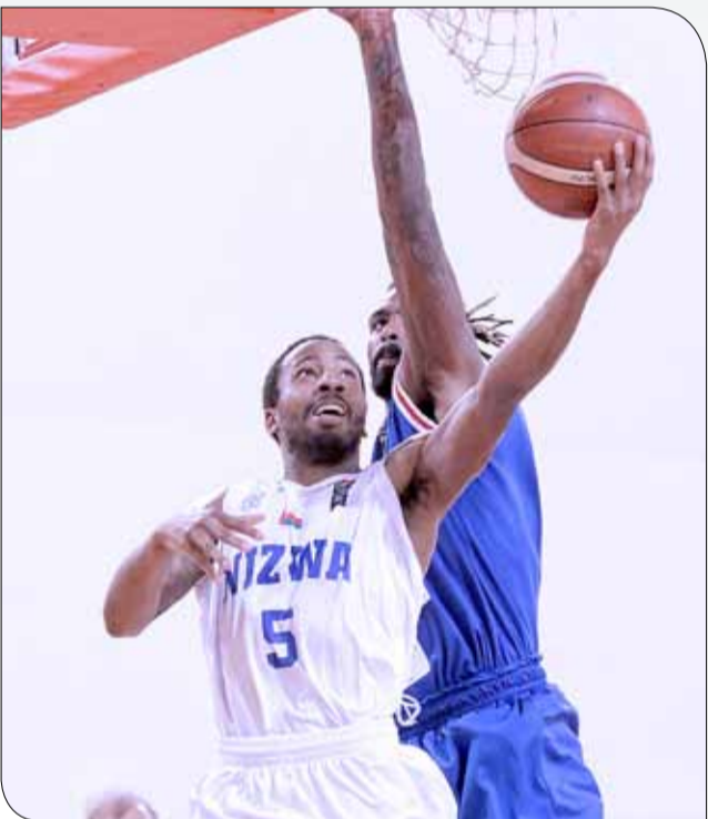
من لقاء الشارقة ونزوى أمس

أكد فريق الشارقة الإماراتي تأهله رسمياً إلى الدور نصف النهائي، بعد أن حقق فوزه الثالث على التوالي في المجموعة الأولى على حساب فريق نزوى العماني بنتيجة (82/64)، رافعا رصيده إلى 6 نقاط، فيما تكبد صاحب الأرض الهزيمة الثالثة برصيد 3 نقاط متديلا آخر الترتيب. ونجح بذلك الشارقة العبور مباشرة إلى المربع الذهبي وتجنب الدور ربع النهائي، إذ سينتظر الفريق الفائز من لقاء العربي والريان القطريين بدور الثمانية.