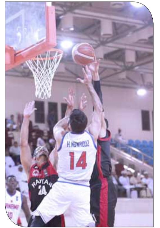
من لقاء المنامة والريان أمس