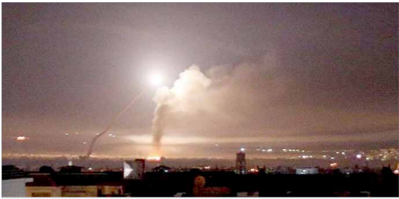
مواجهة بين إيران وإسرائيل في سوريا.

وأضاف ليرمان في مؤتمر هرتزليا الأمني قرب تل أبيب إنه يأمل أن تكون أحدث جولة من العنف مع إيران على الحدود السورية قد انتهت.