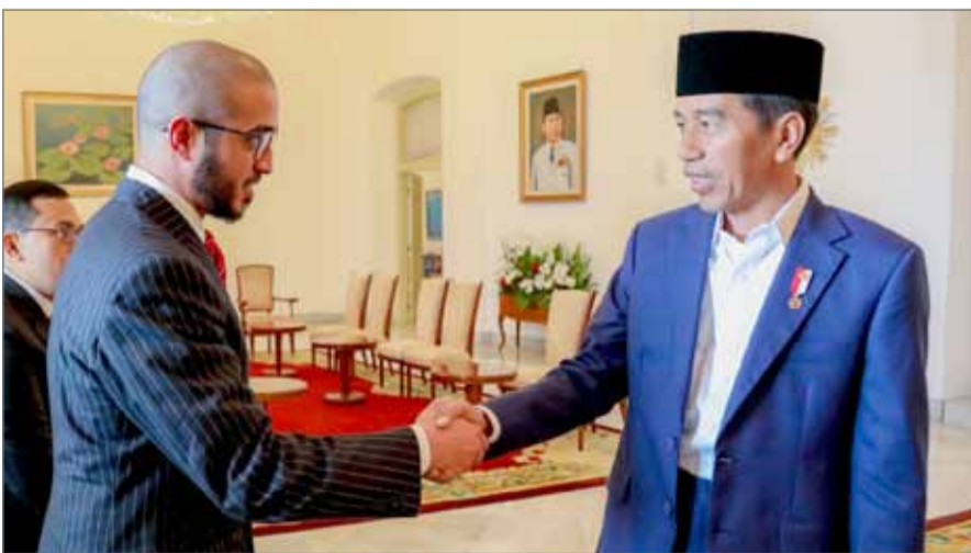
• الرئيس الإندونيسي مستقبلاً سمو الشيخ خالد بن حمد

وطيدة مع مملكة البحرين على مختلف الأصعدة، ونحن هنا اليوم ومن خلال بطولة القتال الشجاع التي أطلقناها من العاصمة البحرينية المنامة لتكون بطولة بحرينية بصبغة عالمية في رياضة فنون القتال المختلطة لفئة المحترفين، نتطلع فيها لتعزيز تلك العلاقات الثنائية على المستوى الرياضي".