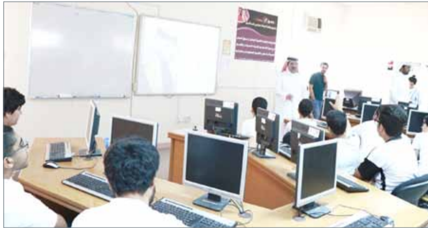
• جانب من الحملة التعريفية

والتخطيط وتشجيع الشباب على الإبداع والإبتقان وتبادل الخبرات بين الشباب ذوي المهومة المتشابهة من مختلف دول العالم وتوطيد العلاقات بين شباب المملكة وشتى بقاع العالم وإنشاء مجتمع يشجع الأجيال الحالية والمستقبلية على الإبداع والتميز.