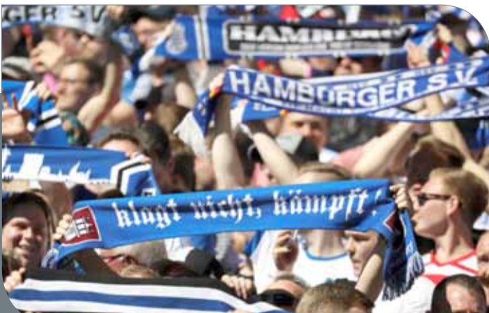
هامبورج ينتظر مباراة "حياة أو موت"

وأضاف "لم يكن سهلا أن نفوز بلقب كأس إيطاليا، للمرة الرابعة على التوالي، بعد موسم صعب. والآن علينا أن نحسم التويج بلقب الدوري". ويتصدر يوفنتوس، جدول الترتيب بفارق 6 نقاط عن أقرب ملاحقيه نابولي، الذي