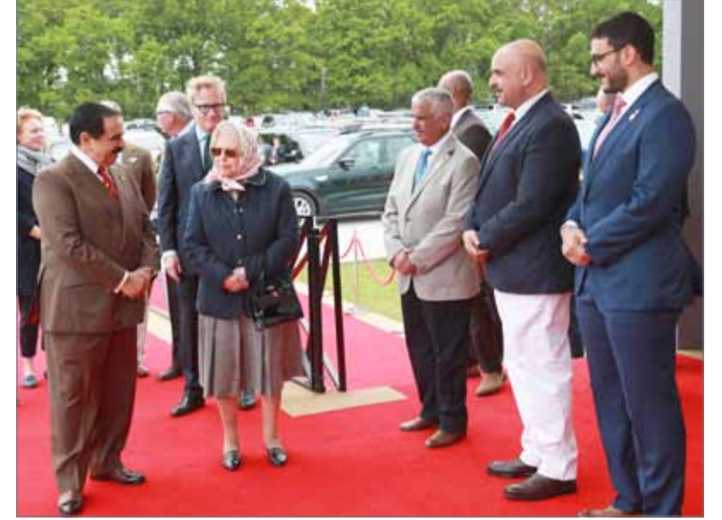
• جلالة الملكة وملكة المملكة المتحدة يشهدان جانباً من مهرجان رويال ويندسور للفروسية