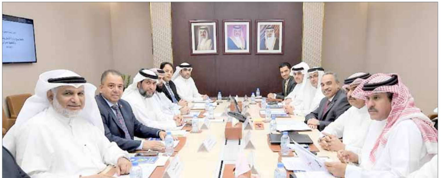
• وزير الأشغال" يترأس اجتماع اللجنة التنسيقية للمجالس البلدية (أرشيفية)