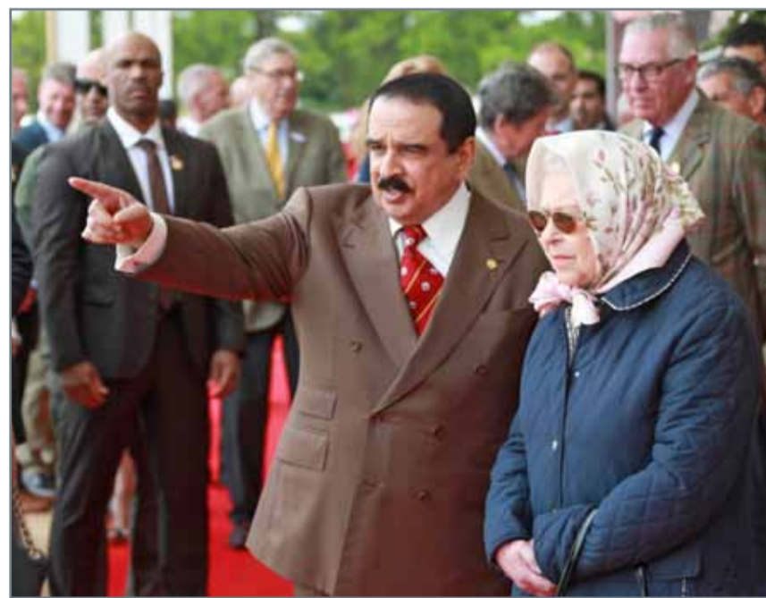
• جلالة الملك وملكة المملكة المتحدة يشهدان جانباً من مهرجان رويال ويندسور للفروسية

لندن - بنا: هنا عاهل البلاد صاحب الجلالة الملك حمد بن عيسى آل خليفة، ممثل جلالة الملك للأعمال الخيرية وشؤون الشباب رئيس المجلس الأعلى للشباب والرياضة رئيس اللجنة الأولمبية البحرينية قائد الفريق الملكي سمو الشيخ ناصر بن حمد آل خليفة، بإحرازه المركز الأول في سباق رويال ويندسور للفروسية، مشيداً بجلالته بما يواصل تحقيقه فرسان البحرين من بطولات ونتائج متقدمة عكست الصورة المثرة لكفاءة وقدرة فرسان البحرين. وكان جلالة الملك قد التقى أمس ملكة المملكة المتحدة وشمال أيرلندا صاحبة الجلالة الملكة إليزابيث الثانية، ونائب رئيس دولة الإمارات العربية المتحدة الشقيقة رئيس مجلس الوزراء حاكم دبي صاحب السمو الشيخ محمد بن راشد آل مكتوم بمضمار سباق القدرة في حديقة قلعة ويندسور الكبرى بالمملكة المتحدة.