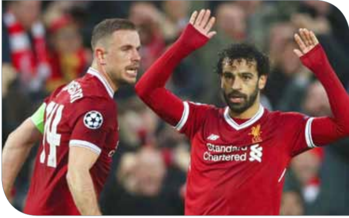
ليفربول يواجه برايتون من اجل حسم المركز الرابع

ويأمل فريق المدرب ديفيد فاجز، في إنهاء مسيرة آرسين فينجر في الدوري الممتاز دون أن يحقق المدرب الفرنسي انتصار الوداع بعد 22 عاما في المنصب.