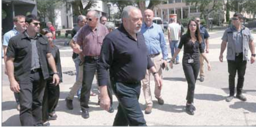
• ليبرمان أثناء زيارته هضبة الجولان

وأضاف ليبرمان: "لا أعتقد أن كل شيء انتهى حتى الآن"، في إشارة إلى التصعيد، لافتاً "سنتابع الوضع بدقة ونحن نعمل بمسؤولية وتصميم".