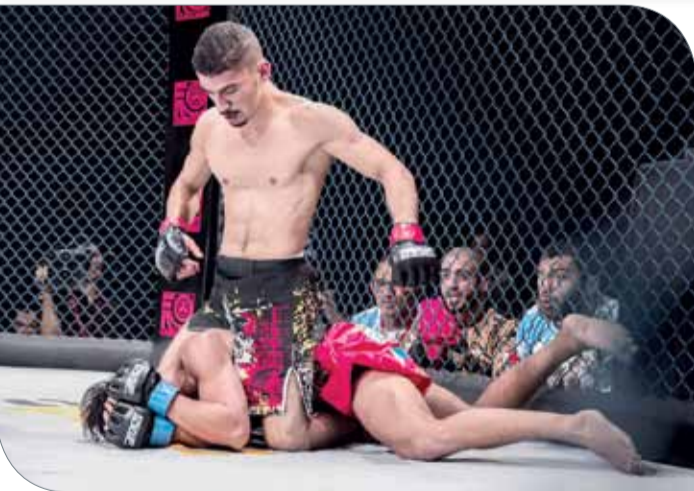
جانب من منافسات بطولة بريف 12

جاكرتا | المكتب الإعلامي لسمو الشيخ خالد بن حمد