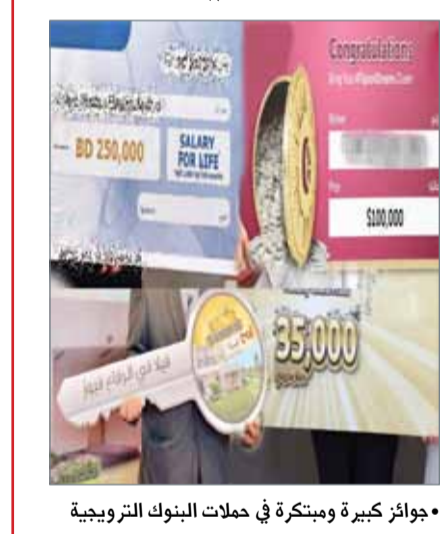
• جوائز كبيرة ومبتكرة في حملات البنوك الترويجية

الخليج الأخرى جوائز بملايين الدولارات، فيما أضافت أخرى على الملايين فلا وبيوتا وسيارات، لكن الأغر من ذلك أن بنوكا تقدم جوائز تتعلق بالسفر إلى وجهات سياحية محببة لدى الناس مدفوعة التكاليف وبطائرة خاصة، أو أن تمنح الفائزين رحلات وتذاكر مجانية لحضور كأس العالم المقبل في روسيا. يأتي التنافس في تقديم الجوائز وتخصيمها وترويجها وتميزها بسبب المنافسة الكبيرة وصغر السوق، والبحرين مثالاً، أم أن المسألة لها علاقة بكلفة إدارة المال، وتوزيع مصادر الدخل وتوزيع المخاطر؟