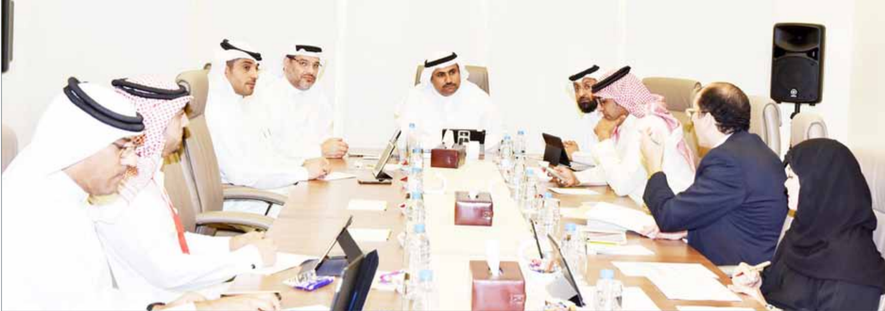
• من اجتماعات لجنة المرافقة العامة والبيئة بمجلس النواب (أرشيفية)

والتي يجب أن يتم الاستثمار فيها بشكل كبير ومستمر لإبقاء الخدمة عند المستوى المطلوب، الأمر الذي يتطلب تخصيص مبالغ كبيرة ليست للإنشاء فقط وإنما للتشغيل والصيانة، ومن أجل مساواة هذه الخدمة الحيوية والمهمة مع الخدمات الأساسية الأخرى كالكهرباء والماء، فقد بات من الضروري فرض رسوم على البنية التحتية.