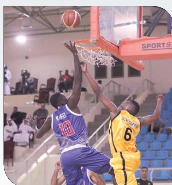
من لقاء المنامة والاتحاد أمس