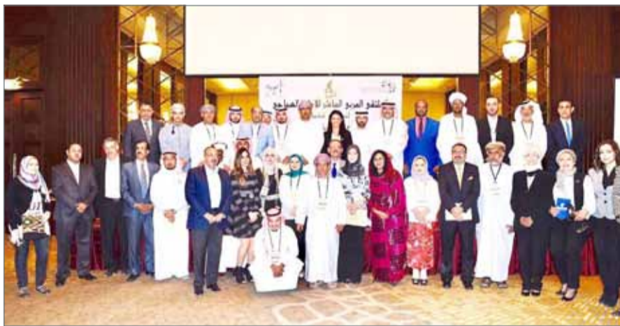
صحفيون وإعلاميون عرب في ضيافة مصر

العمل، ومساهمته في الناتج القومي المحلي، حيث تساهم السياحة بما يقرب من 15% من إجمالي الناتج المصري خلال الربع الثاني من العام الجاري. وحول عودة السياحة الروسية، أكدت الوزيرة أن وصول الطائرات الروسية يعد تطورا إيجابيا في هذا الملف، وقالت إن الوزارة لديها خطة للترويج للمقصد المصري في روسيا خلال كأس العالم، وإنه سيتم الإعلان عن تفاصيلها قريبا. وبالنسبة للمقاصد السياحية الجديدة الجاذبة للسائح العربي عموما، والسعودي خصوصا، أشارت إلى ارتفاع الحركة الوافدة من السوق السعودية العام الماضي خصوصا في منطقي البحر الأحمر والساحل الشمالي، متمنية مزيدا من الحركة هذا العام، مشيرة إلى التعاون وفتح مجالات شراكة مختلفة في المرحلة القادمة في الاستثمار السياحي بين مصر والإمارات.