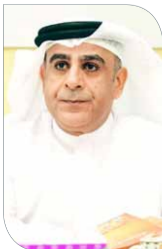
عبد اللطيف الفردان

وأبدى الفردان، حزنه الشديد على استمرار غياب أندية الكويت عن المشاركة في البطولات الخليجية التي تجمع الأشقاء بسبب الإيقاف الدولي. وقال "يعز علينا هذا الغياب، والإخوة الكويتيون لهم مكانة كبيرة في قلوبنا وقلوب الخليج بأكمله، قمنا بالعديد من الاتصالات مع الاتحاد الآسيوي، غير أن جميع المحادثات تأتي بالرفض، ونتمنى في القريب العاجل أن يتم حل الأزمة الرياضية الكويتية ويعودوا للمشاركة مع إخوتهم".