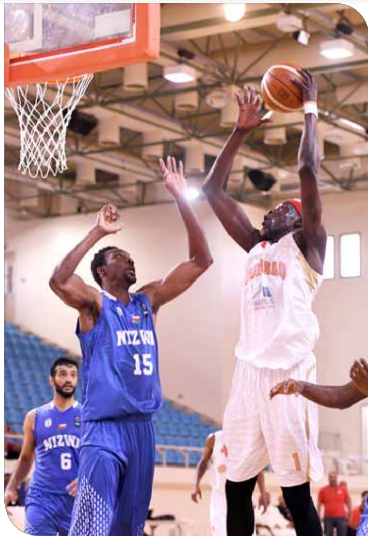
من لقاء المحرق ونزوى أمس

وذكر ناصر أن المحرق لم يبدأ المباراة بقوته المعروفة، إذ شهد أداؤه بعض التراخي في الجانبين الدفاعي والهجوم، وهي التي أدت لتقارب النتيجة حتى بداية الربع الأخير، مضيفا أن المدرب أعاد تصحيح الأوراق في الشوط الثاني. وأكد ناصر أهمية الظهور بأداء قوي في المباراة القادمة، مشيرا إلى أن اللاعبين لن يدخروا جهدا في تقديم كل ما لديهم من إمكانيات في سبيل التأهل للمباراة النهائية، مبديا ثقته من قدرة فريقه على تحقيق الفوز.