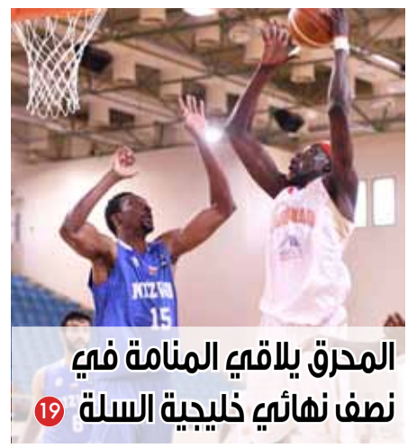
المحرق يلاقي المنامة في نصف نهائي خليجية السلة