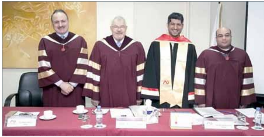
• الباحث متوسلاً لجنة المناقشة

انخفاض المستوى المعرفي لدى الطلبة ذوي صعوبات التعلم في مادة اللغة العربية. واختار الباحث مفردات العينة من الطلبة ذوي صعوبات التعلم من الذكور والإناث، وذلك في المدارس الابتدائية الحكومية المطبقة لبرنامج صعوبات التعلم، وكان عدد أفراد العينة المختارة (18) مفردة من طلبة الصف الخامس الابتدائي.