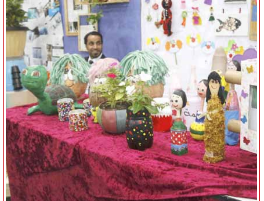
البلاد رسول الحجيري • نظمت بلدية الشمالية حفل ختام برنامج المدارس الصديقة للبيئة للموسم السادس على التوالي وبالتعاون مع وزارة التربية والتعليم والمجلس البلدي لبلدية الشمالية وشركة النظافة (أورباس).