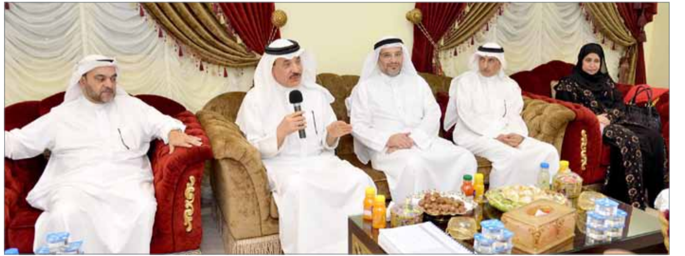
● وزير "العمل" ملتقياً جمعا من الأهالي والفعاليات المجتمعية بمجلس النائب عبدالحميد النجار

لمختلف الفئات، وتلبية احتياجات المواطنين من أفراد وأسر ورفع المستوى المعيشي لهم، بما يتناسب والمتغيرات على الصعيدين الاجتماعي والاقتصادي.