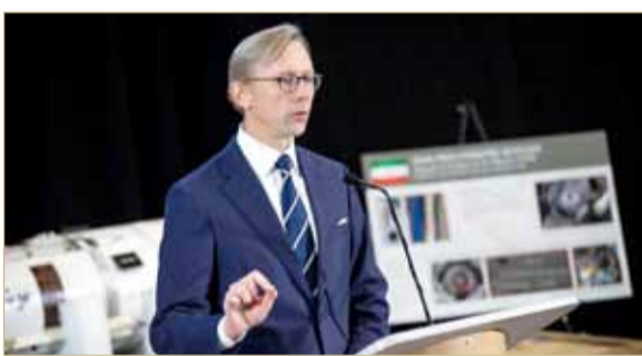
المبعوث الأميركي متحدنا خلال المؤتمر الصحفي

جهدوا في التعامل مع الجماعات المتطرفة، مؤكداً على أن التعاون بين البلدين حاسم لتحقيق الأمن والاستقرار في المنطقة. وشدد هوك على أن "الولايات المتحدة تقف إلى جانب البحرين للحفاظ على سيادتها الوطنية، وسنواصل العمل مع البحرين لإيقاع تمويل الجماعات المتطرفة بالأسلحة في المنطقة.