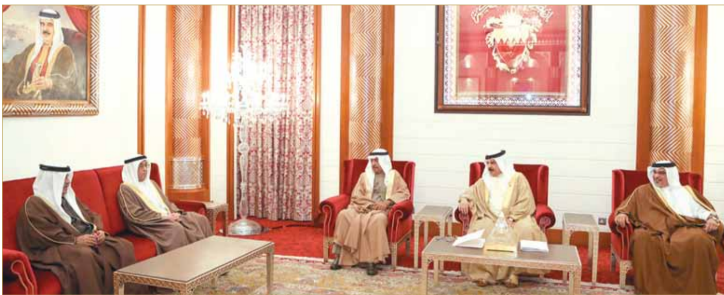
جلالة الملك لدى استقباله سمو رئيس الوزراء وسمو ولي العهد

المنامة - بنا صدر عن عاهل البلاد صاحب الجلالة الملك حمد بن عيسى آل خليفة أمر ملكي رقم 55 لسنة 2018 يقبل استقالة الوزارة. كما صدر عن صاحب الجلالة عاهل البلاد أمر ملكي رقم 56 لسنة 2018 بتعيين رئيس مجلس الوزراء.