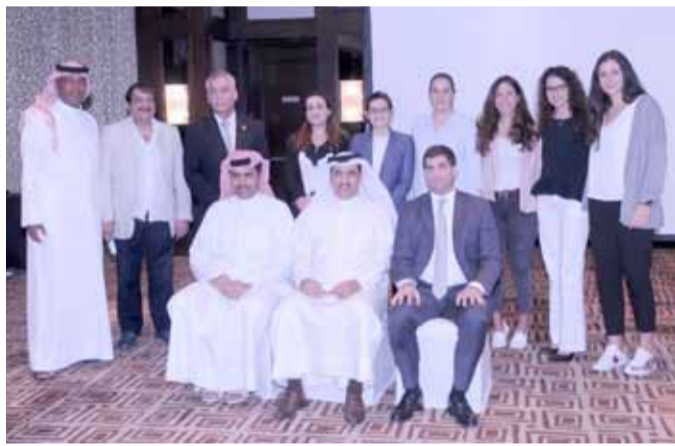
صورة جماعية للحضور