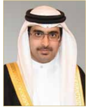
سمو محافظ الجنوبية