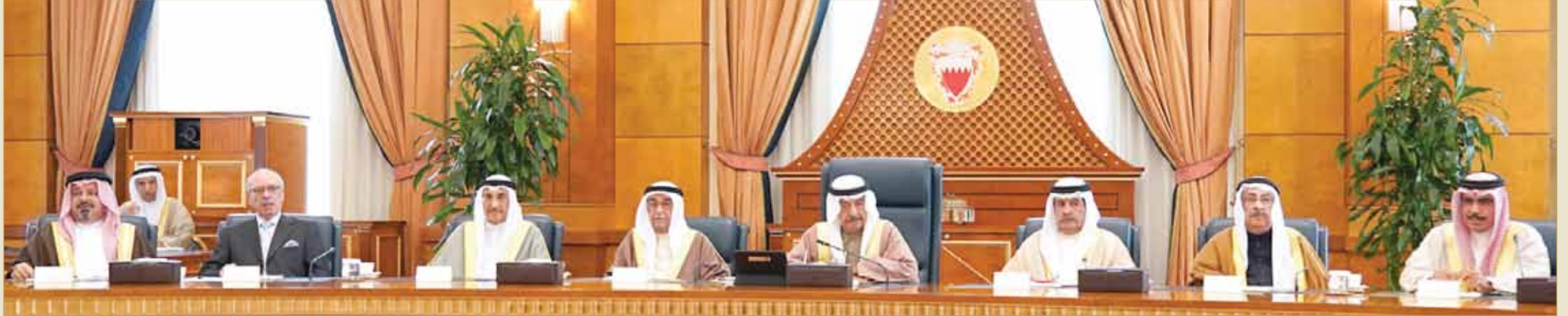
سمو رئيس الوزراء مترسدا الجلسة الاستثنائية لمجلس الوزراء

جلسة استثنائية لمجلس الوزراء بعد الإعلان بشكل رسمي عن نتائج الانتخابات