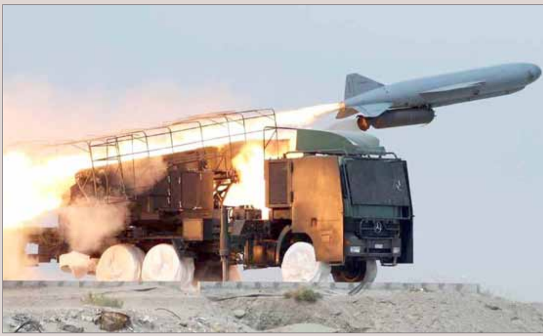
إيران اختبرت صاروخا باليستيا متوسط المدى

تصر على مواصلة استفزاتها الصاروخية بمزاعم دفاعية