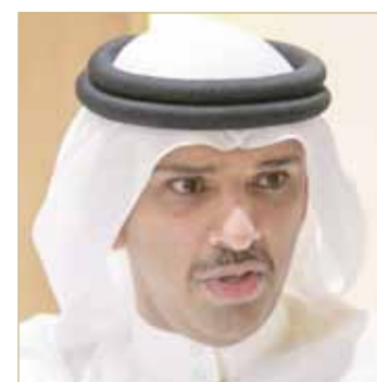
الشيخ علي بن خليفة

رفع رئيس الاتحاد البحريني لكرة القدم الشيخ علي بن خليفة آل خليفة، خالص التهاني والتبريكات إلى النائب الثاني لرئيس المجلس الأعلى للشباب والرياضة الرئيس الفخري للجنة الأولمبية البحرينية الشيخ عيسى بن راشد آل خليفة، بمناسبة فوزه بجائزة الروح الرياضية في الوطن العربي للعام 2018، والتي ينظمها الاتحاد العربي للثقافة الرياضية في نسختها الأولى.