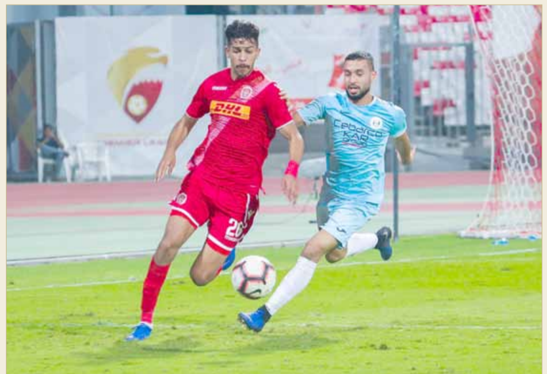
من مباراة الرفاع والمحرق