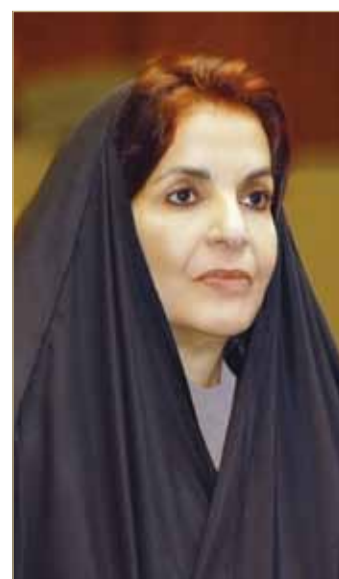
سمو الأميرة سبيكة بنت إبراهيم

بذلل من جهود مقدرة ومشكورة ولتحليلهن بالصبر والمثابرة خلال تأديتهن لمهام ترشحن، وتمنياتها لهن جميعاً بالتوفيق والسداد في خدمة الوطن العزيز الذي يستحق من الجميع بذل الغالي والنفيس لأجل ما يحفظ شأنه ويعلو بمكانته. وأعربت سموها في ختام تصريحها، عن اعتزازها بمستوى الوعي والثقافة السياسية التي يتحلى بها المجتمع البحريني حيث جاءت إرادته معبرة عن قناعاته وتقديره لابنة البحرين التي تستحق كل ما نشهده لها من تقدم ورفعة.