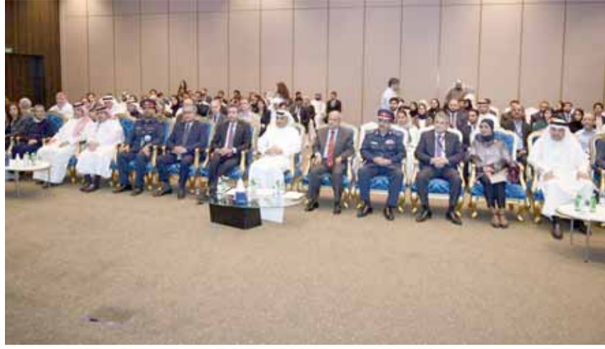
جانب من حفل التخرج