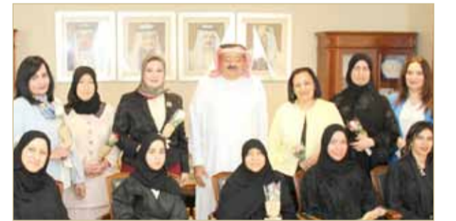
المنامة - هيئة الكهرباء والماء

استقبل الرئيس التنفيذي لهيئة الكهرباء والماء الشيخ نواف بن إبراهيم آل خليفة عددا من موظفات هيئة الكهرباء والماء بمناسبة يوم المرأة البحرينية وقال في بداية اللقاء ان يوم المرأة البحرينية هو يوم التعبير عن مشاعر التقدير والاحترام للدور العظيم الذي تقوم به المرأة البحرينية، والذي تسهم من خلاله وبجدارة في وضع اللبنات