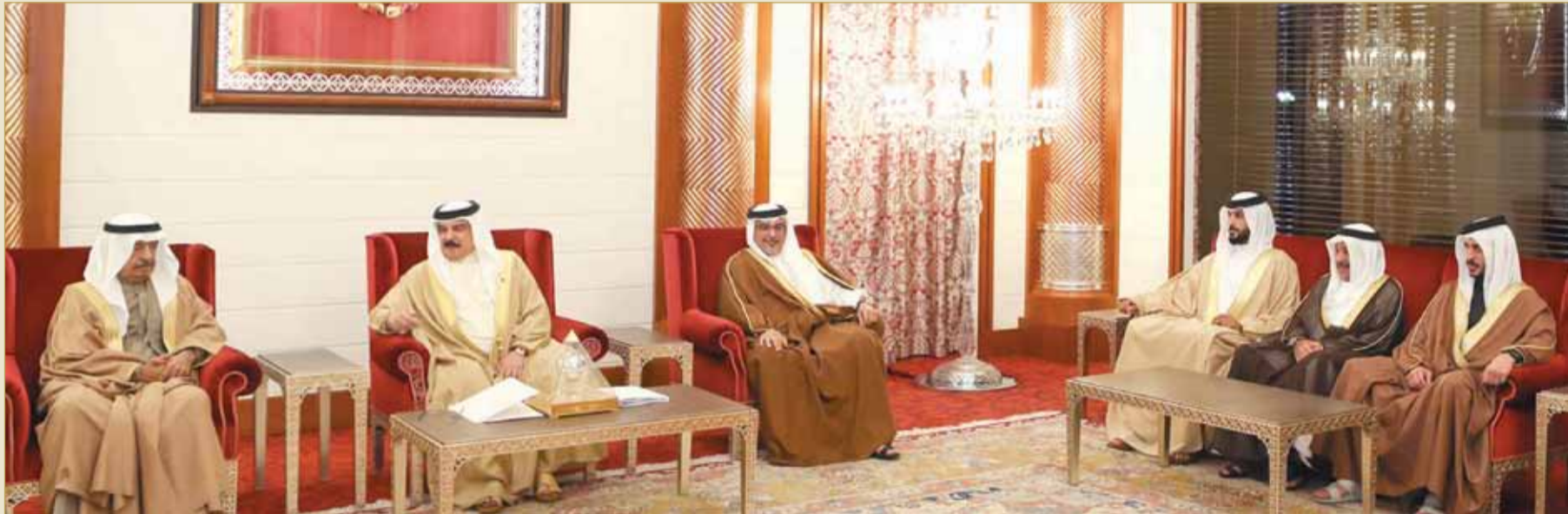
جلالة الملك مستقبلا سمو رئيس الوزراء وسمو ولي العهد

◆ جلالة الملك يشيد بوحي المواطن البحريني بتلبية نداء الواجب بالاستحقاق الانتخابي