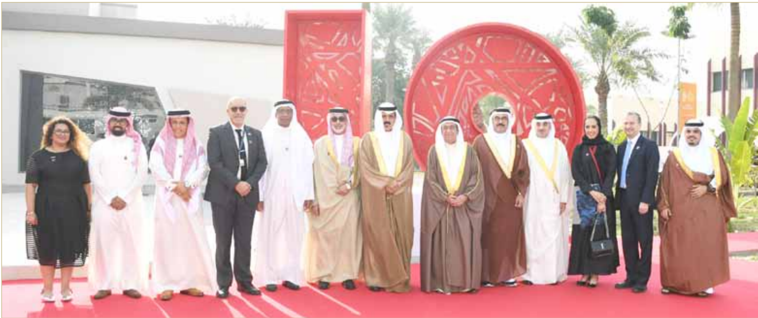
سمو نائب رئيس مجلس الوزراء يرعى الاحتفال بالذكرى العاشرة لتأسيس بوليتكنك

كرم وكيل وزارة الداخلية لشؤون الجنسية والجوازات والإقامة الشيخ راشد بن خليفة آل خليفة، الموظفة منى عيسى موسى الدوسري، بمناسبة إحيائها للثقافة. وأثنى على جهود الموظفة طوال فترة خدمتها ولمدة 35 عاماً، ثمناً لإخلاصها وتفانيها في أداء واجباتها الوظيفية، متمنياً