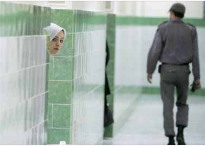
تحتل إيران المرتبة 164 على مؤشر حرية الصحافة لعام 2018