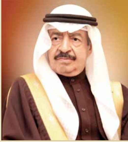
سمو رئيس الوزراء

السلام عليكم ورحمة الله وبركاته، فلقد تشرفت بثقة جلالته الغالية بتكليفه برئاسة الوزراء في السنوات الأربع الماضية من مسيرة العمل الوطني والتي عملنا فيها بكل ما أوتينا من جهد على تنفيذ رؤية جلالته وتلبية تطلعاتكم السديدة في تعزيز النظام الديمقراطي والمؤسسات الدستورية ومواصلة المكتسبات التنموية. ولا يخفى على جلالته التحديات التي انتمت بها المرحلة السابقة والتي ألفت بظلالها على كافة جوانب العمل الوطني واستدعت بذل المزيد من العمل ومضاعفة الجهود وابتكار الحلول لأجل مواجهتها والتغلب عليها حفاظاً على المكتسبات التي تحققت للوطن وللمواطنين، وضماناً لمستويات العيش الكريم لأبناء شعبكم الوفي. ووصولاً لهذه الأهداف الوطنية، فقد حرصت وزملائي أعضاء الوزارة على تحقيق برنامج الحكومة وتنفيذ ما اشتمل عليه من مشاريع وخطط تنموية في كافة القطاعات، ومواصلة العمل على ترسيخ أسس العدل والأمن والاستقرار للجميع، فضلاً عن الارتقاء بمستويات الأداء في المؤسسات والأجهزة الحكومية وفق أفضل معايير الجودة والقدرة على التحفيز وتطبيق أفضل الممارسات، مع الحفاظ على نهجنا الثابت في تقوية دعائم التعاون بين السلطتين التنفيذية والتشريعية. والالتزام بتوجيهات جلالته السديدة، فقد راعينا؛ في تنفيذ برامج التنمية المستدامة جميع الأبعاد الاجتماعية والاقتصادية، إضافة إلى متطلبات المرحلة وطبيعة التحديات والمتغيرات التي نمر بها، وعملنا على تنفيذ برامج طموحة لبناء مستقبل أكثر ازدهاراً لوطننا الغالي. اننا اليوم يا صاحب الجلالة في بداية مرحلة جديدة من مراحل العمل الوطني، ووفقاً لما نص عليه دستور مملكة البحرين في البند (هـ) من المادة (33) بإعادة تشكيل الوزارة عند بدء كل فصل تشريعي، فإننا