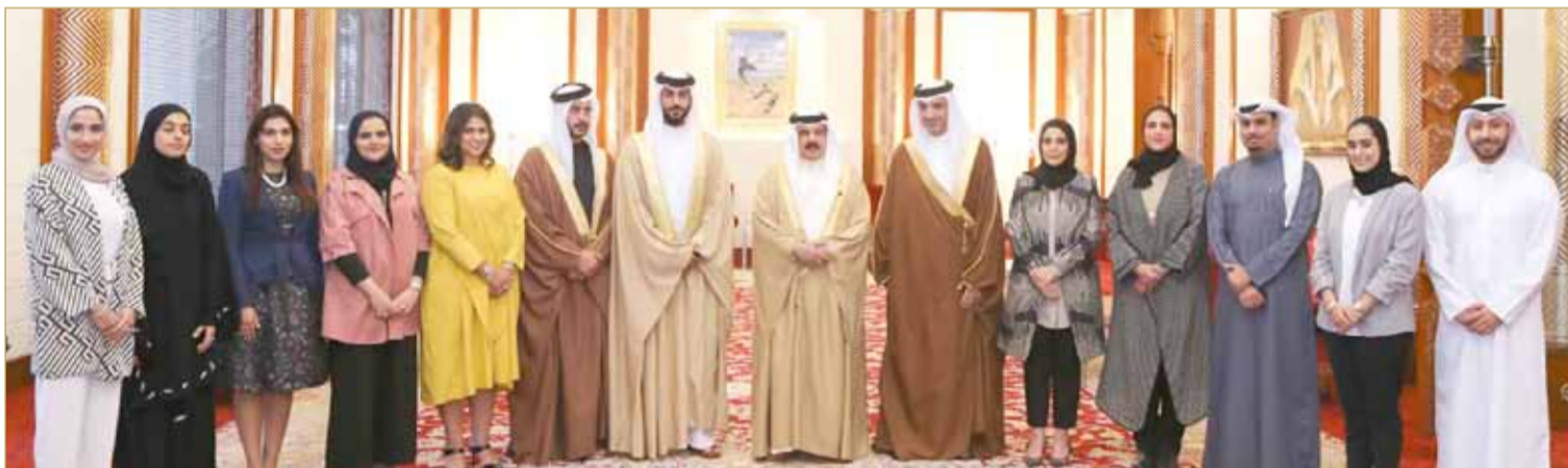
جلالة الملك مستقبلاً سمو الشيخ ناصر بن حمد

كما هنا جلالته المرأة البحرينية لحصولها على نسبة كبيرة في مجلس النواب حيث ضاعفت وجودها في المجلس بنسبة 15%. وأكد جلالته أن هذه الإنجازات تسجل في تاريخنا الوطني بكل الاعتزاز والفخر. ونوه بدور وزارة شؤون الشباب والرياضة في خدمة العمل الشبابي والرياضي وتبني المبادرات الهادفة إلى احتضان الشباب وتوجيه طاقاتهم لخدمة الوطن.