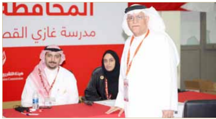
النائب يوسف زينل أمام منصة لجنة تسعة الشمالية بعد إعلان النتيجة

◆ زينل سيرأس جلسة السن لانتخاب رئيس النواب