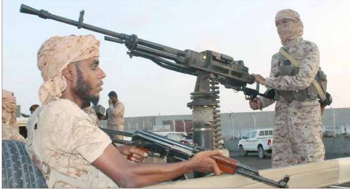
القوات الشرعية في اليمن تحقق تقدما في صعدة