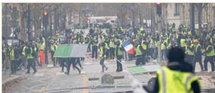
من احتجاجات وسط باريس

قال المتحدث باسم الحكومة الفرنسية بنجامين جريفو، أمس الأحد، إن البلاد ستدرس فرض حالة الطوارئ للحيلولة دون تكرار مشاهد بعض أسوأ الاضطرابات المدنية منذ أكثر من 10 سنوات، ودعا المحتجين السلميين إلى التفاوض.