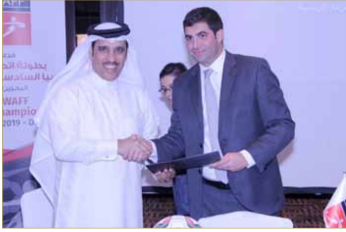
من توقيع الاتفاقية

وأجريت بعد ذلك مراسم قرعة البطولة التي ستقام بنظام الدوري من دور واحد، حيث أوقعت القرعة منتخبنا في الموقع A1 بحسب لائحة البطولة، فيما تم سحب تبعاً على بقية المنتخبات وهي: الأردن، فلسطين، الإمارات ولبنان.