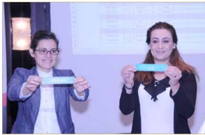
جانب من سحب القرعة