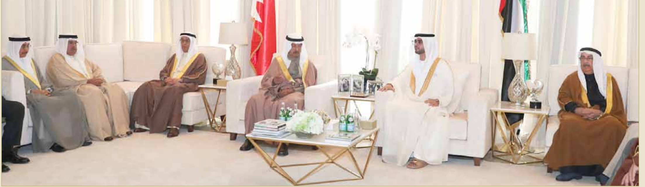
سمو رئيس الوزراء لدى زيارته مقر إقامة السفير الإماراتي لدى المملكة للمشاركة في احتفالات العيد الوطني للإمارات

◆ سمو رئيس الوزراء يشارك في احتفال سفارة دولة الإمارات باليوم الوطني