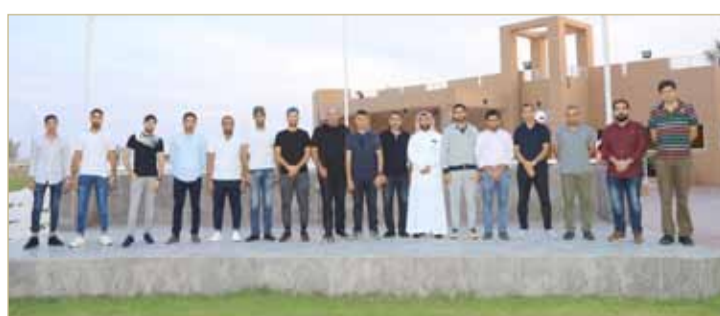
جانب من المشاركين

تنفيذاً للخطة التدريبية التي اعتمدها مجلس إدارة الاتحاد الملكي للفروسية وسباقات القدرة برئاسة رئيس الاتحاد الملكي للفروسية وسباقات القدرة نائب رئيس المجلس الأعلى للبيئة سمو الشيخ فيصل بن راشد آل خليفة وبتوجيه من لجنة جمال الخيل العربية.