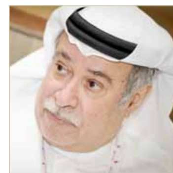
الشيخ عيسى بن راشد

مشيداً بدوره المهم والحيوي في خدمة الرياضة البحرينية والعربية.