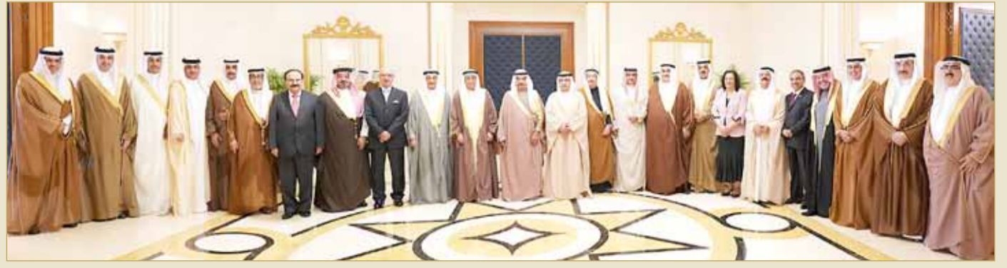
سمو رئيس الوزراء مترئسا جلسة مجلس الوزراء الاستثنائية (05)