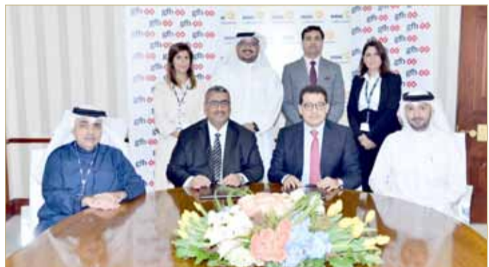
أثناء توقيع مذكرة التفاهم