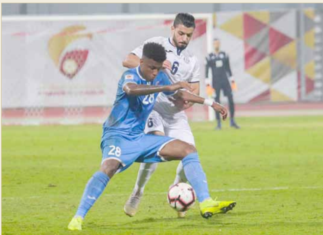
من مباراة النجمة والمنامة