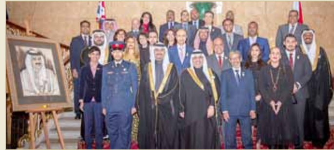
سفارة البحرين لدى المملكة المتحدة تقيم احتفالاً بمناسبة الأعياد الوطنية للمملكة

كلته إلى النهج الإصلاحي والديمقراطي الواعد والمستمر في المملكة، وإلى النجاح التاريخي للانتخابات في البحرين، حيث بلغت نسبة المشاركة فيها 67% وهي تمثل النسبة الأكبر في تاريخ المملكة. ومن الجانب البريطاني الذين حضروا الاحتفال، أعرب وزير الدولة لشؤون الدفاع توبياس الودود عن تهنائه لمملكة