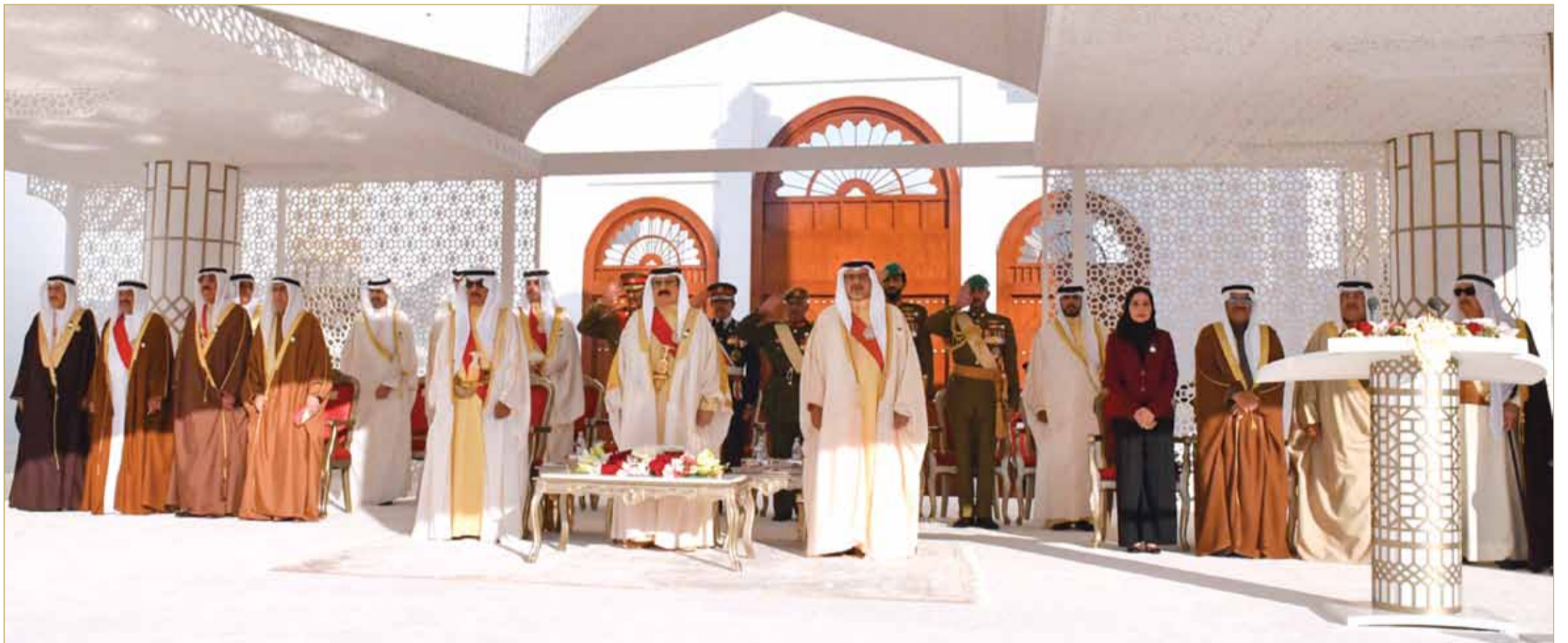
جلالة الملك يعرض، بحضور سمو رئيس الوزراء وسمو ولي العهد، احتفال مملكة البحرين بأعيادها الوطنية

جلالة الملك يمنح الأوسمة التقديرية لـ 68 من رواد النهضة