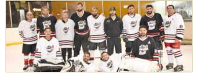
فريق نادي البحرين لهوكي الجليد

وعلى الرغم من تواضع الإمكانيات والظروف التي يمر بها اللاعبون يطمح الفريق البحريني على الحصول على مراكز متقدمة في البطولة رافعين راية مملكة البحرين الرائدة في المجال الرياضي وما وصلت إليه من إنجازات خلال السنوات السابقة سائلين المولى عز وجل أن يوفقهم لتشریف المملكة. وتقدم رئيس وأعضاء مجلس إدارة