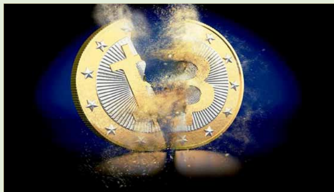
سجلت البتكوين أعلى مستوياتها العام الماضي عند 19780 دولاراً

في مثل هذه الأثناء من العام الماضي، كانت "بتكوين" وسوق العملات الرقمية برمتها، تشهدان أفضل أوقاتها على الإطلاق، في ما وصف بثورة الأموال الافتراضية آنذاك، إذ ارتفع سعر العملة الرقمية الرائدة مما دون 4 آلاف دولار خلال سبتمبر العام 2017 إلى قرابة 20 ألف دولار في ديسمبر من نفس العام، ملامسة مستوى غير مسبق.