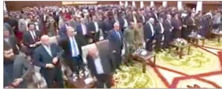
السفير الإيراني انسحب من حفل اقيم بمناسبة الذكرى الأولى للنصر على داعش

دعا رئيس حزب الأمة في العراق، مثال الألوسي، الرئاسات الثلاث لطرد السفير الإيراني لدى بغداد، إيرج مسجدي، بعد انسحابه أثناء وقفة صمت تكريماً لقتلى القوات الأمنية العراقية. وقال الألوسي في رسالة وجهها إلى رؤساء الجمهورية والبرلمان والوزراء، إن السفير الإيراني القيادي المعروف في الحرس الثوري استخف وتهجم بشكل لا أخلاقي وغير دبلوماسي برفضه احترام شهداء العراق، وأكد الألوسي أن التصرف يمثل موقفاً بحق العراق وشعبه.