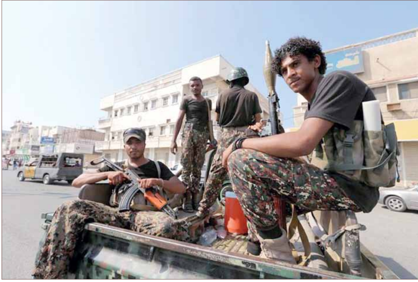
دورة لمسلحين من حركة الحوثي في مدينة الحديدة

القيادة والمراقبة" في هذا المسجد الذي دمرته "ضربة محكمة". وأنهم الجيش الأميركي التنظيم الجهادي بالاستمرار في استخدام مواقع "محمية" لشن هجمات مع استهداف تار بالمباني وكذلك بأرواح الأبرياء.