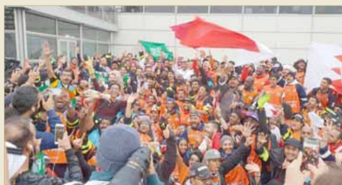
وقد اتحاد السيارات محفلاً بنجاح سباق الفورمولا إي بالسعودية