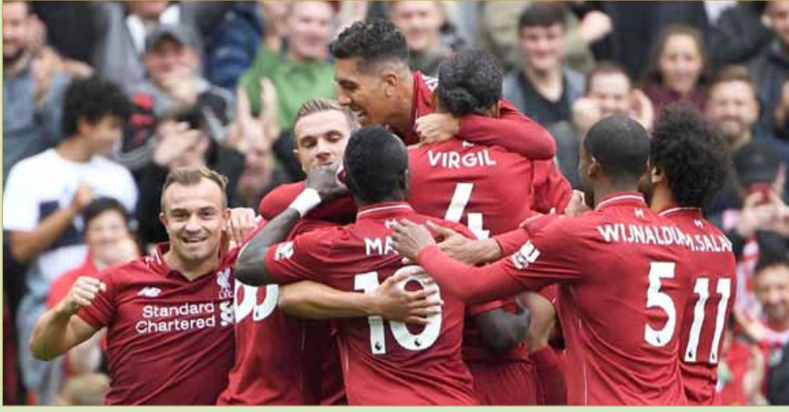
ليفربول واصل الثالث واجتاز يونايتد

وتقدم ليفربول عبر السنغالي ساديو ماني (24)، ثم أدرك يونايتد التعادل بواسطة جيسي لينغارد (33) مستفيدا من خطأ الحارس البرازيلي اليسون. وفي الشوط الثاني سجل البديل السويسري شاكيري ثنائية (73) و(81). وفك تشلسي صاحب المركز الرابع الشراكة مع أرسنال بفوزه على مضيئه برايتون 2-1، وخسارة شريكه السابق أمام مضيئه ساوثمبتون 3-2.