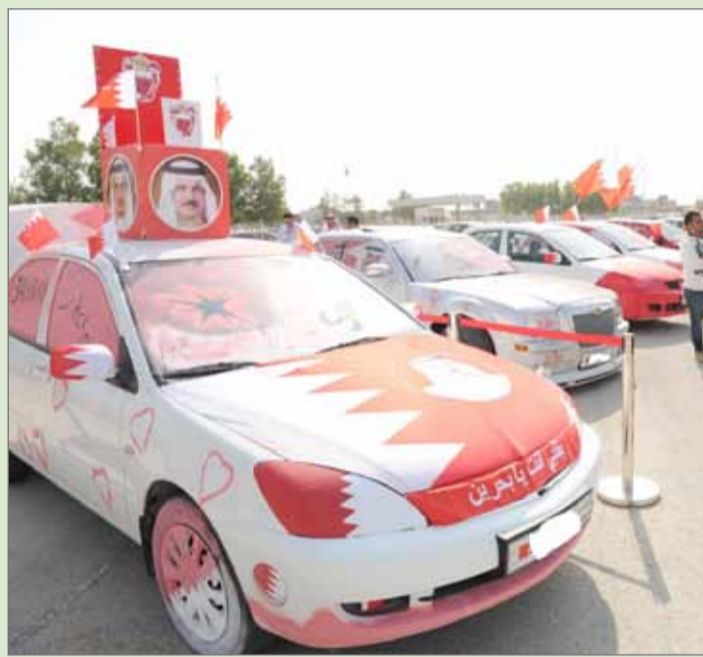
تزيين السيارات احتفاء بالعيد الوطني

سيطر اللونان الأحمر والأبيض على الشوارع التجارية وواجهات المحال في معظم شوارع البحرين؛ احتفالاً بالأعياد الوطنية التي تجلب الفرح والبهجة للجميع، والتكسب والربح للتجار والأسواق.