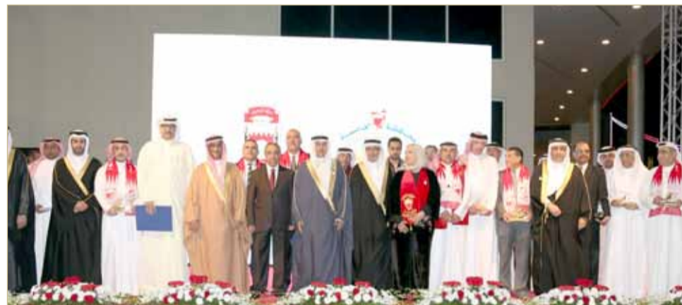
محافظ العاصمة بتوسط الداعمين والرعاة

ومشاركة الفرقة الموسيقية للشرطة، ومنطقة مخصصة لألعاب الأطفال، ومسابقات وجوائز قيمة شملت تذاكر سفر وهدايا متنوعة،