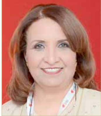
الشبيخة حياة بنت عبدالعزيز

وأشار إلى أن الفترة المقبلة ستشهد تحديد موعد نهائي فئتي الناشئين والعموم حيث سيوجه الاتحاد الدعوة للعديد من المسؤولين لحضور النهائي، متمنياً كل التوفيق والنجاح لكافة اللاعبين واللاعبات المشاركين في البطولة.