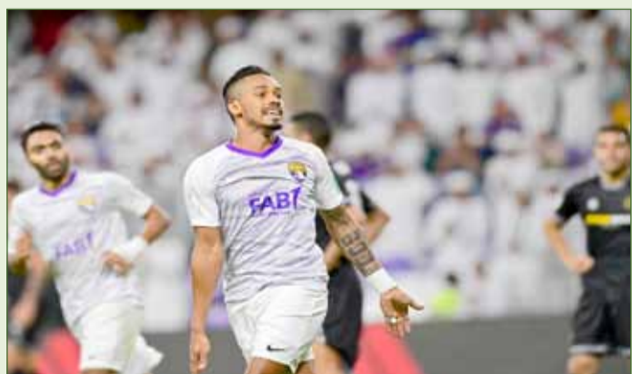
العين تائق واكتسح بطل افريقيا

انتشرت مئات اللافتات المعادية لرئيس نادي روما لكرة القدم جيمس بالوتا في كافة أنحاء العاصمة الإيطالية، وذلك بحسب ما كشفت الأحد وسائل الاعلام المحلية، والغالبية العظمى من هذه اللافتات متطابقة وتحمل رسالة "بالوتا، ارحل بعيدا"، فيما تشير أخرى الى الجنسية الأمريكية لبالوتا الذي يعمل في بوسطن ونادرا ما يكون موجودا في روما، وكتب عليها "بالوتا، عد الى بلدك" أو "روما وبالوتا لم يكونا يوما متحدين". لكن هناك لافتات أكثر عدائية كتلك التي وزعت على مقربة من أكبر الحدائق العامة في العاصمة "فيلا بورغيزي"، وكتب عليها