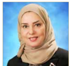
رئيس مجلس النواب

أشادت رئيس مجلس النواب فوزية زينل بتفضل عاهل البلاد صاحب الجلالة الملك حمد بن عيسى آل خليفة بمنح عدد من الشخصيات الأوسمة في الاحتفال الذي أقيم في قصر الصخير العامر أمس.