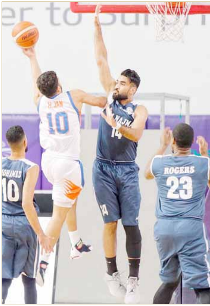
النجمة يخطو بثبات نحو السداسي

وبعد انتصارات دون خسارة، المحرق يتبعده بفارق 3 نقاط عن أقرب المنافسين وهما الرفاع والأهلي، وبـ 4 نقاط عن منافسه على الصدارة المنامة الذي يحتل المركز الرابع حالياً برصيد 12 نقطة.