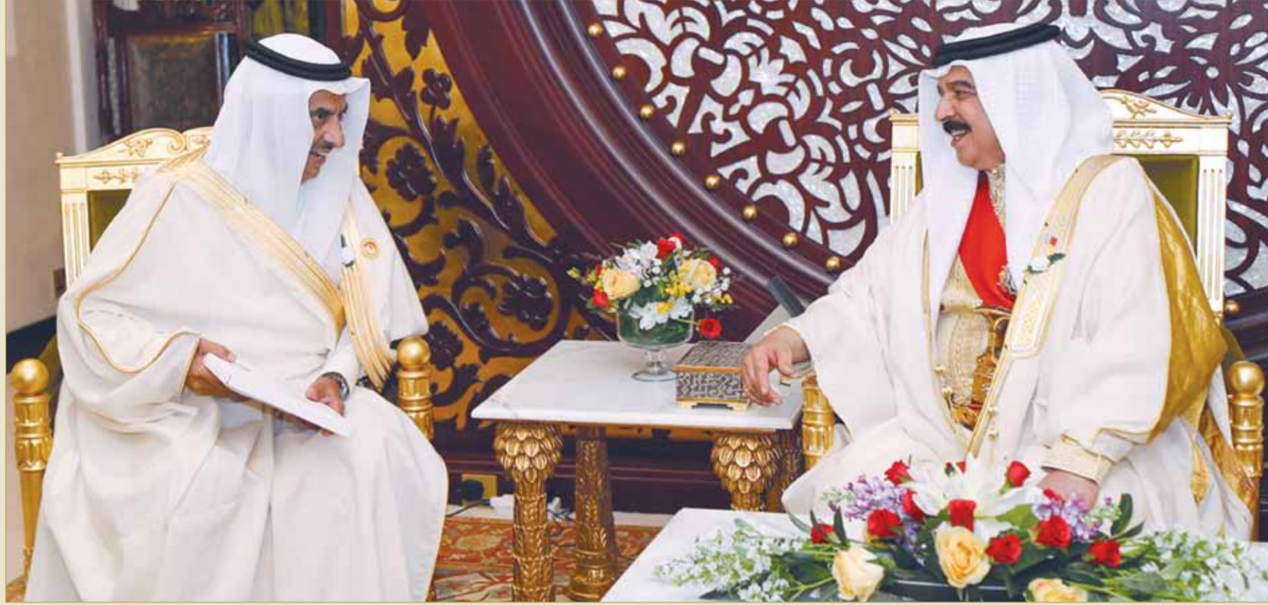
جلالة الملك مستقبلا السفير السعودي

جلالة الملك يتسلم دعوة من خادم الحرمين لحضور المهرجان