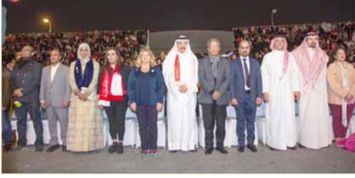
وزير العمل يرعى المهرجان السنوي لجمعية "هذه هي البحرين" بمناسبة الأعياد الوطنية

حميدان: المشروع الإصلاحي عزز مبادئ العدل والمساواة