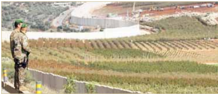
جديدان لبنانيان يتابعان عمليات حفر إسرائيلية عند الحدود

أعلن الجيش الإسرائيلي، أمس الأحد، اكتشاف نفق هجومي جديد لمليشيات حزب الله، يمتد من أراضي لبنان إلى داخل إسرائيل، وهو الرابع منذ عملية إطلاقها مطلع ديسمبر لتدمير أنفاق، يقول قد تُستخدم في هجمات ضد إسرائيل.