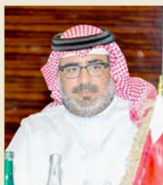
الشيخ عبدالله بن عيسى