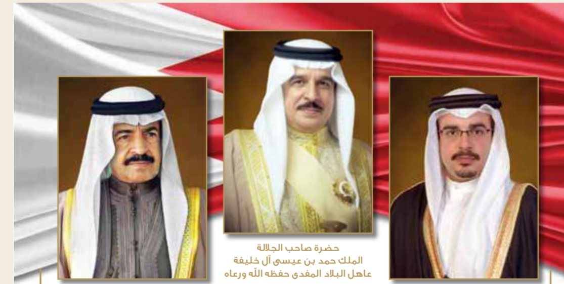
صاحب السمو الملكي الأمير سلمان بن حمد آل خليفة وولي العهد الأمين نائب القائد الأعلى النائب الأول لرئيس مجلس الوزراء

تفضل عاهل البلاد صاحب الجلالة الملك حمد بن عيسى آل خليفة، فشمل برعايته الكريمة في قصر الصخير أمس، بحضور رئيس الوزراء صاحب السمو الملكي الأمير خليفة بن سلمان آل خليفة، وولي العهد نائب القائد الأعلى النائب الأول لرئيس مجلس الوزراء صاحب السمو الملكي الأمير سلمان بن حمد آل خليفة، لرئيس مجلس الوزراء، الاحتفال الذي أقيم بمناسبة