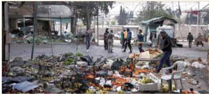
موقع انفجار سيارة مفخخة في سوق بعفرين

لقي 8 أشخاص، أمس الأحد، مصرعهم بتفجير في مدينة عفرين السورية، الخاضعة لسيطرة قوات سورية مسلحة معارضة، مدعومة من تركيا. وقال المرصد السوري لحقوق الإنسان إن التفجير وقع في أحد أسواق عفرين، مشيراً إلى أنه أسفر عن مقتل 8 أشخاص على الأقل، دون أن يوضح ما إذا أصيب آخرون.