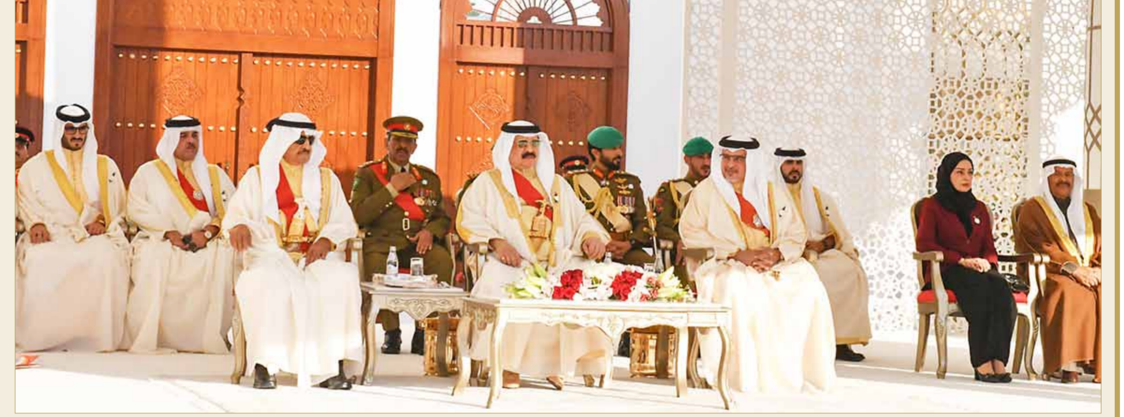
جلالة الملك برعى، بحضور سمو رئيس الوزراء وسمو ولي العهد، احتفالاً بملكية البحرين باعادها الوطنية

الحضور الكريم، في موقف الاحتفاء بيوم الوطن، ومن متطلق واجتما أمام تضحيات أبناء البحرين، فخرنا باستذكار دروس الوفاء والشجاعة التي قدمها شهدائنا البررة على مر التاريخ، لتسليمة منها الفخر، في بخل الغالي والتفيس لجمالية الوطن، والذود عن مصالحه بأروع الصور،