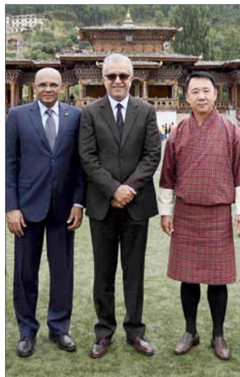
رئيس الاتحاد الآسيوي مع رئيس اتحاد بونان في زيارته الأخيرة