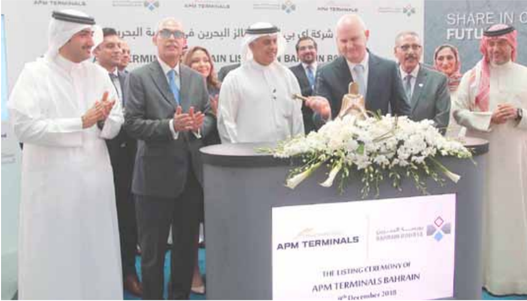
لحظة قرع الجرس لبدء تداول أسهم "إي بي إم تيرمينالز"

استحوذت تداولات أسهم شركة إي بي إم تيرمينالز البحرين (APMT)، المشغل الحصري لميناء خليفة بن سلمان، في أول أسبوع لإدراجها في بورصة البحرين، على نحو 1.141 مليون دينار، ما نسبته 18.64% من قيمة الأسهم المتداولة، وبكمية قدرها مليون و441 ألفاً و311 سهماً، تم تنفيذها من خلال 142 صفقة.