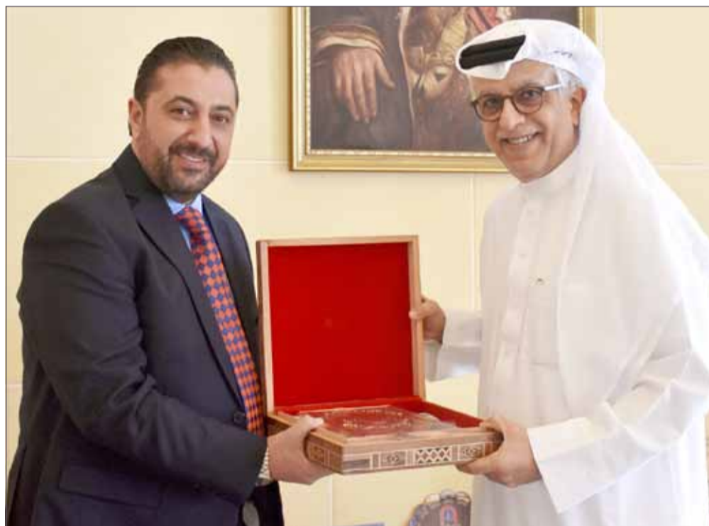
الشيخ سلمان بن إبراهيم مع رئيس الاتحاد الآسيوي

أكد رئيس اتحاد كرة القدم في بوتان داشو أوجين تسييتشوب، أنه يساند رئيس الاتحاد الآسيوي للعبة الشيخ سلمان بن إبراهيم آل خليفة، في الانتخابات المقررة في السادس من أبريل 2019، بالعاصمة الماليزية كوالالمبور.