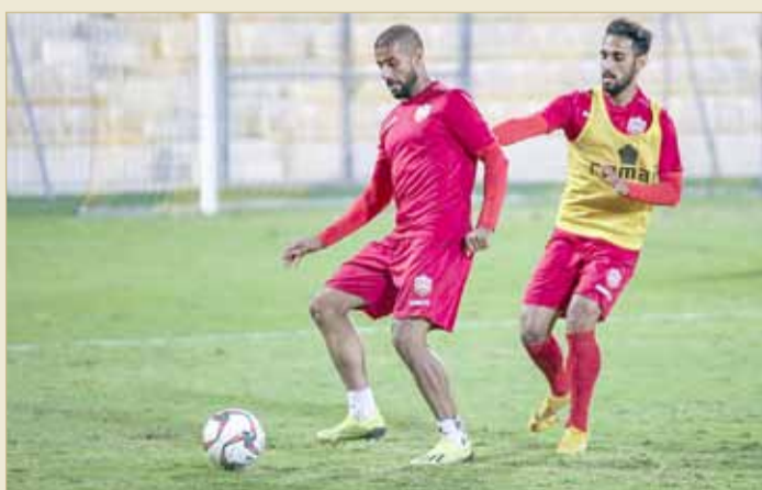
من تدريبات المنتخب

إلى ذلك، سيقود الحكم الكويتي الدولي عمار إبراهيم أشكناني مباراة الأحمر الودية مع طاجيكستان، على أن يساعده حكام بحرينيون، في حين وصل منتخب طاجيكستان، استعداداً للمباراة المرتقبة.