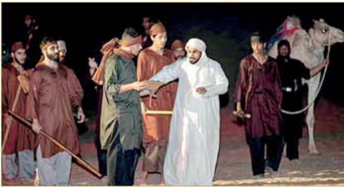
مهرجان المسرح الصحراوي