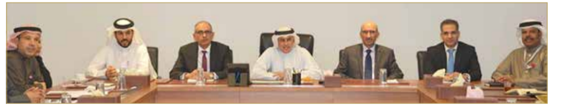
اجتماع المراجعة التاسع لنظام الجودة