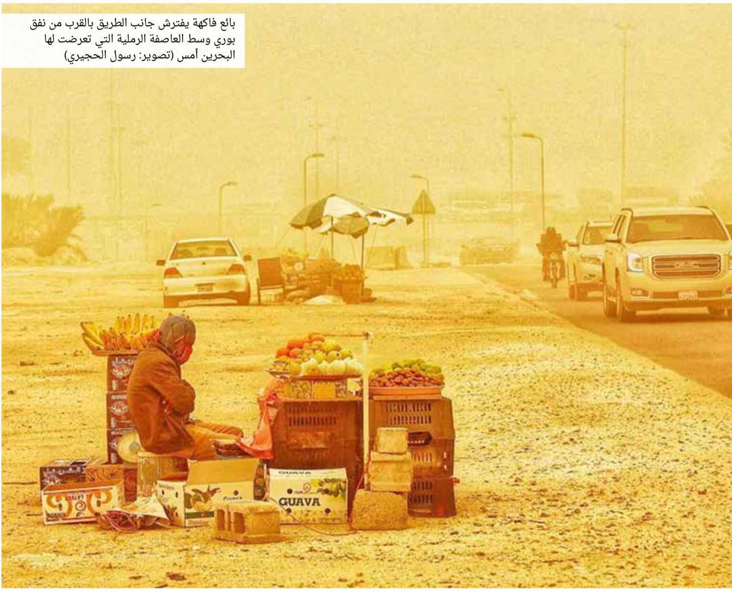
بائع فاكهة يفترش جانب الطريق بالقرب من نفق بوري وسط العاصفة الرملية التي تعرضت لها البحرين أمس