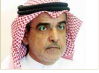
الشيخ خليفة بن عيسى

رفع الشيخ خليفة بن عيسى آل خليفة أسمى آيات التهاني والتبريكات إلى رئيس الوزراء صاحب السمو الملكي الأمير خليفة بن سلمان آل خليفة، بعد أن من الله سبحانه وتعالى عليه بالشفاء وخرج سموه من المستشفى سالماً معافى، متهللاً إلى الله العليّ القدير أن يتم على سموه موفور الصحة والعافية.