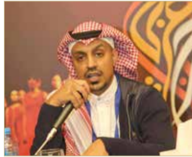
المؤلف السعودي الحارثي