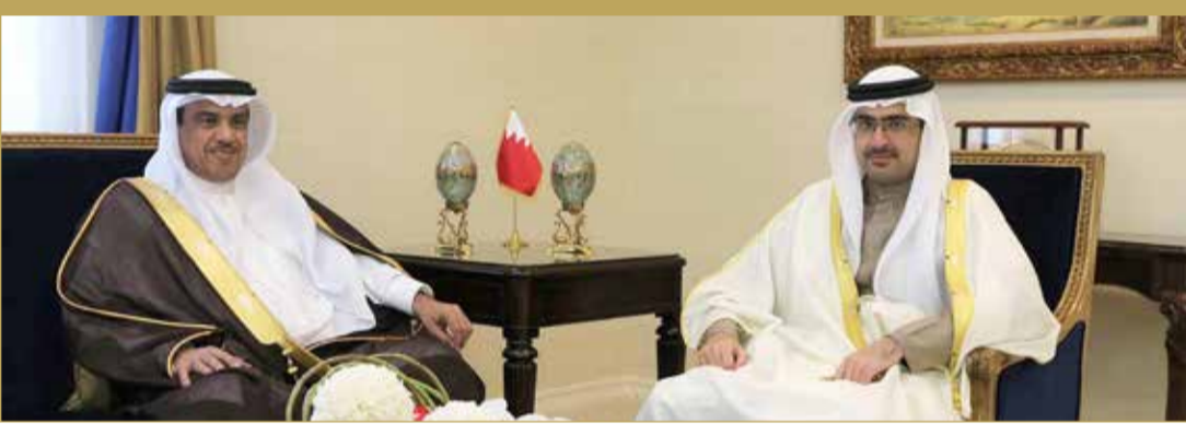
سمو محافظ الجنوبية مستقبلاً وزير شؤون الشباب والرياضة

وتطرق سمو المحافظ إلى أبرز المشاريع الرياضية والشبابية التي تسعى المحافظة إلى تنفيذها بالتعاون مع الوزارة بما يلي