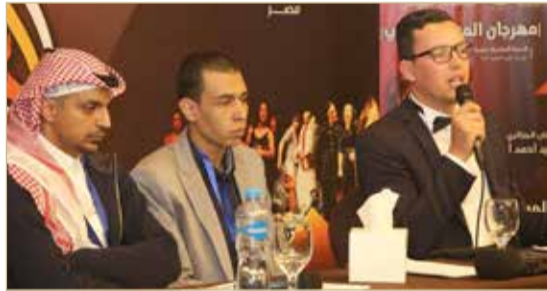
الفائزون بجائزة النص المسرحي للكبار

في مسابقة النص الموجه للكبار فقال إن نصه "طسم وجديس" يعالج فكرية الانقسام والعصية العربية المزمنة والقديمة، حتى أن بعض القبائل العربية فضت على نفسها بنفسها مشيرا إلى سعادته بفوز نصه في المسابقة وقدم الشكر للهيئة العربية للمسرح على أن أتاحت له هذه الفرصة للمشاركة والفوز.