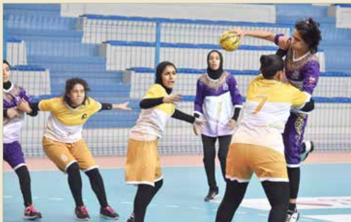
جانب من منافسات "رياضية"

وبالعودة إلى مباراتي الفريقين في نصف النهائي فأنهن لم يجدن صعوبة في تجاوز الدور نصف النهائي وضرب موعد جديد