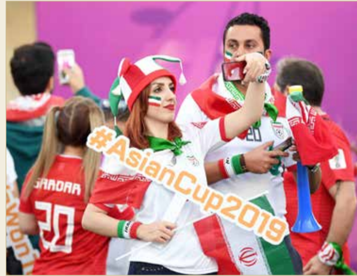
تميز رائع للإمارات في استضافة كأس آسيا 2019

معظم المتطوعين والعاملين في اللجان المنظمة بمختلف مهامها وتخصصاتها هم من أبناء دولة الإمارات العربية المتحدة، فمن يستقبلك في الملاعب هم