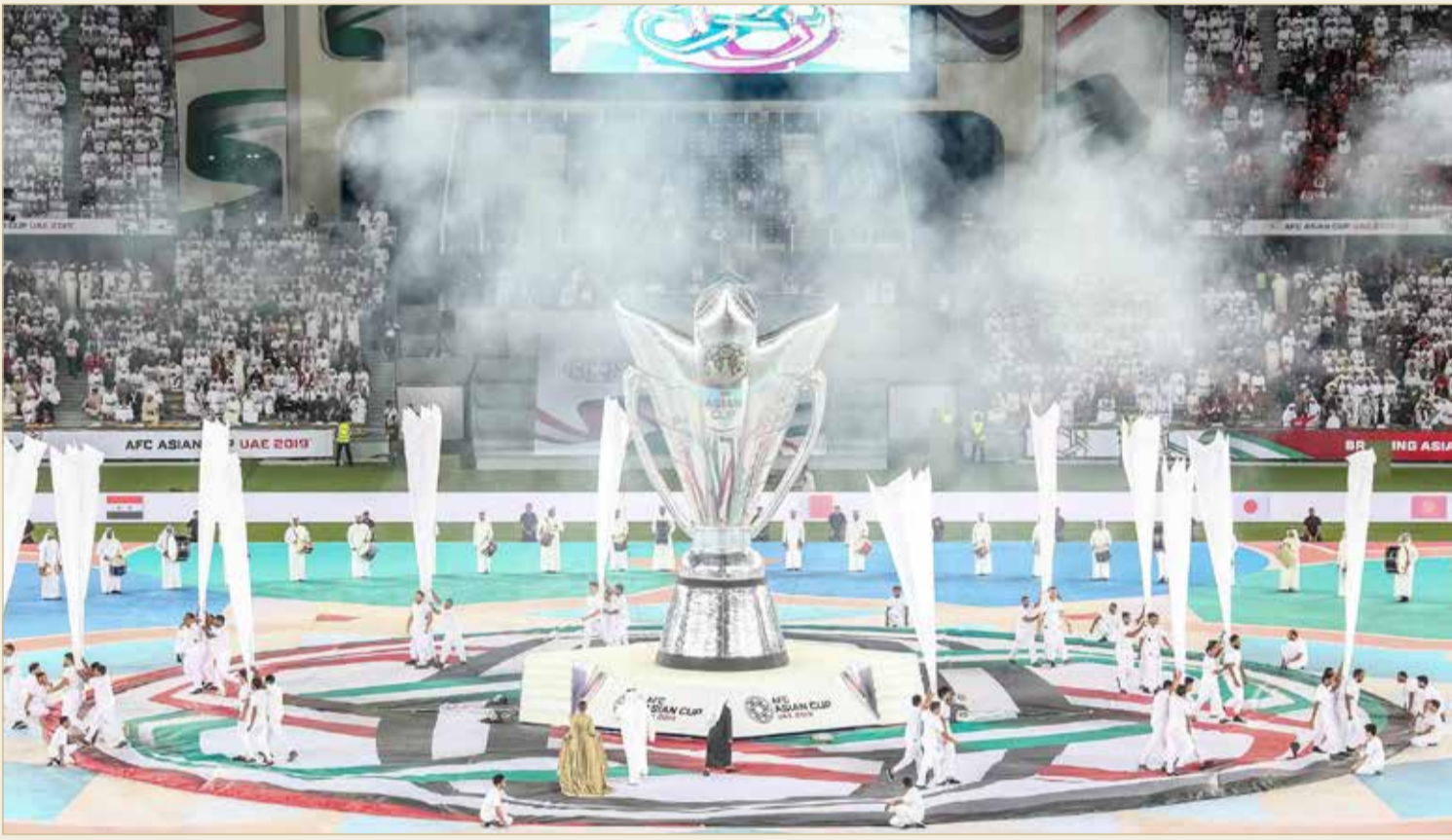
ملعب مدينة زايد الرياضية الذي احتضن حفل الافتتاح

ملاعب عالمية تؤهل الدولة لاستضافة أكبر الأحداث الكروية