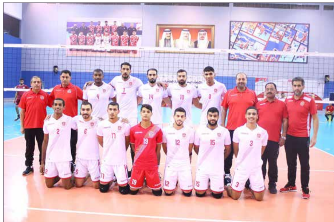
فريق المحرق لكرة الطائرة

العراقي، وادي موسى الأردني، المجمع البترولي الجزائري، سيد بول اللبناني، سنجل وشباب جباليا من فلسطين، المكتاسي المغربي. وينص نظام البطولة على تقسيم الفرق على 4 مجموعات، ويذكر أن الريان القطري هو حامل اللقب في النسخة الماضية التي أقيمت في تونس 2018، والترجي التونسي ثانياً، والهلال السعودي ثالثاً، والعربي القطري رابعاً.