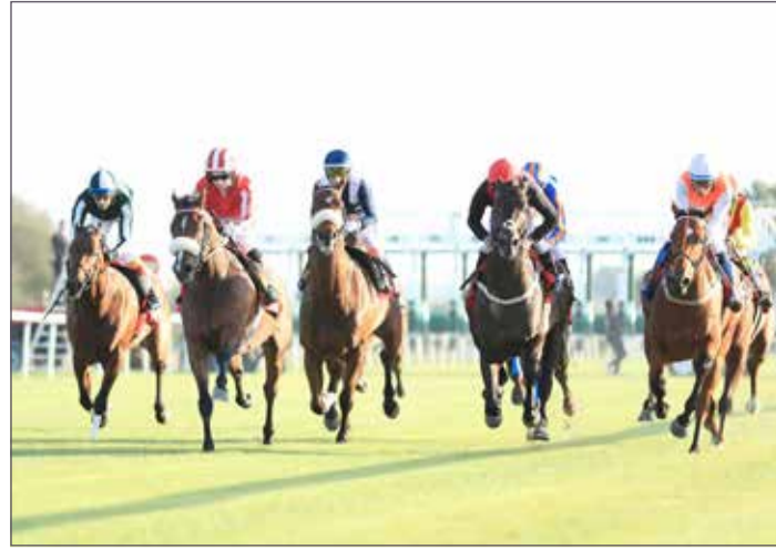
منافسات قوية يشهدها سباق اليوم

وسيشهد السباق مشاركة 60 جوادًا وسط توقعات بأن يشهد السباق منافسات قوية في ظل تقارب المستويات بين أغلب الجياد المرشحة للمنافسة خصوصًا في أشواط الكؤوس مما يجعل المنافسة مفتوحة على جميع الاحتمالات، وذلك