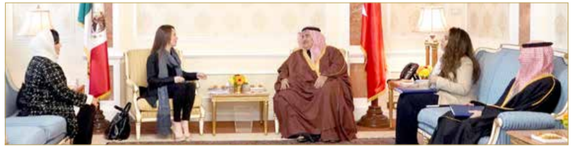
وزير الخارجية مستقبلاً رئيس الاتحاد البرلماني الدولي

كما اطلع وزير الأشغال على أبرز أنشطة هيئة البحرين للثقافة والآثار للعام الجاري 2019 والذي يحمل عنوان "من يوبيل للبلدوماسية البحرينية، مشيداً بمستوى الأنشطة الثقافية في المملكة.