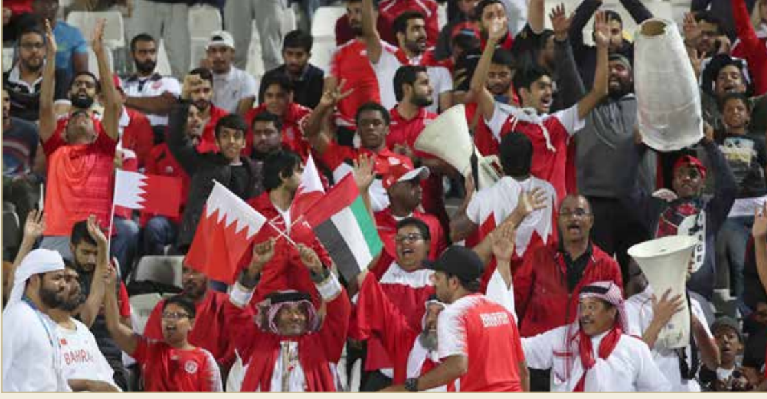
ال جماهير وجدت سهولة في التنقل بين المدن الإماراتية