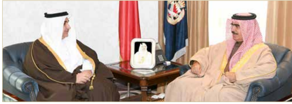
وزير الداخلية مستقبلاً سفير مملكة البحرين لدى اليابان

◆ وزير الداخلية: فتح آفاق جديدة من العمل المشترك مع طوكيو