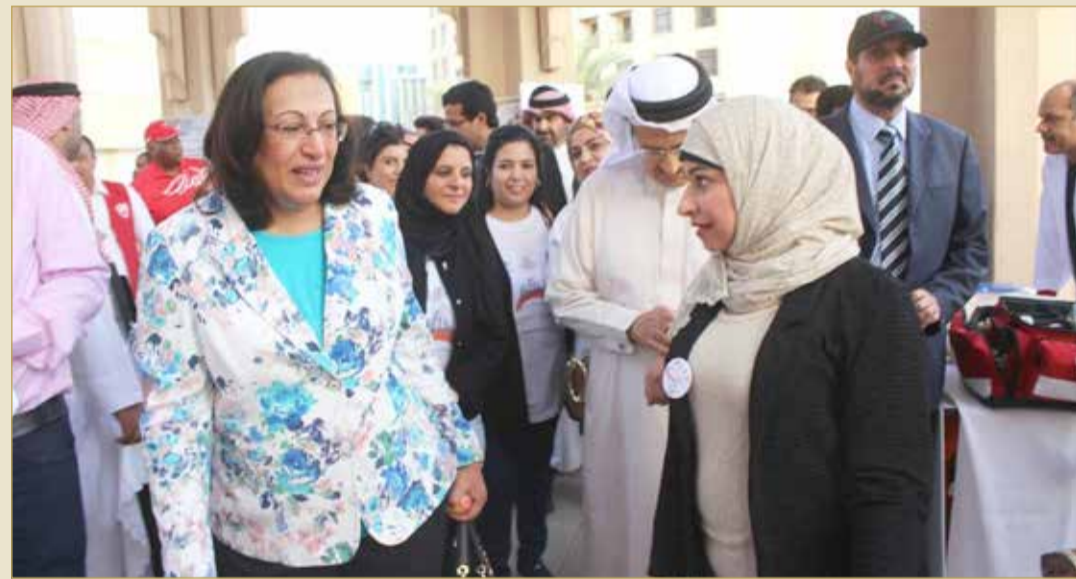
وزيرة الصحة فائقة الصالح تقدم الدعم للمتطوعين

وتشير إلى أن الأمل في التحول إلى جمعية يُمضي وفق الإجراءات، إلا أن ذلك لا يمنع من أن يكون للمتطوعين دورهم المهم في توعية المجتمع وتدريب الشباب والناشئة، وتوضيح الدينبي بالقول "حين يكون لديك عدد من المواطنين المدربين في مجال الإسعافات الأولية، وأن تسعى إلى تدريب المزيد، فهذا من شأنه خدمة المجتمع بشكل أكبر، وينجلى الدور المهم حين يصاب أحد أفراد الأسرة