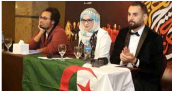
الفائزون بجائزة النص المسرحي الموجه للصغار