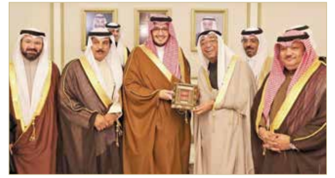
السنايس - الغرفة

التقى وفد غرفة تجارة وصناعة البحرين برئاسة رئيس الغرفة سمير ناس، بنائب أمير المنطقة الشرقية بالملكة العربية السعودية، صاحب السمو الملكي الأمير أحمد بن فهد آل سعود، بحضور رئيس الجانب السعودي من المجلس السعودي البحريني عبدالرحمن العطيشان، وذلك على هامش الزيارة التي قام بها وفد من الغرفة للمنطقة الشرقية. ودعا الأمير أحمد الشركات البحرينية للمشاركة في فعالية مواسم المملكة التي ستعقد في منتصف شهر مارس المقبل في المنطقة الشرقية. من جانبه، قال ناس إننا في غرفة تجارة وصناعة البحرين يحدونا الأمل إلى مزيد من التكامل والشراكة مع أشقائنا السعوديين، فالواقع الحالي لا يعكس حجم الفرص والإمكانات المتاحة، ولا ينسجم مع طموحاتنا المشتركة لسقف هذه العلاقات التي نرى بأنها يجب أن تكون في مستوى يعكس عمق العلاقات التاريخية والأخوية بين البلدين الشقيقين، ولكننا على ثقة بأننا سنشهد خلال الفترة القريبة المقبلة بمشيئة الله تعالى قيام شراكات وتحالفات بحرينية سعودية، والمزيد من التطور والنماء في العلاقات المشتركة على مختلف الأصعدة في ظل القيادة الحكيمة في البلدين الشقيقين.