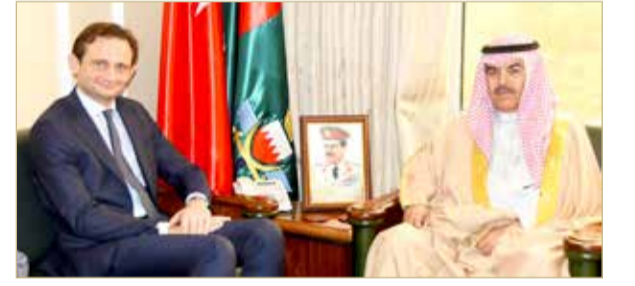
وزير شؤون الدفاع مستقبلاً السفير الإيطالي