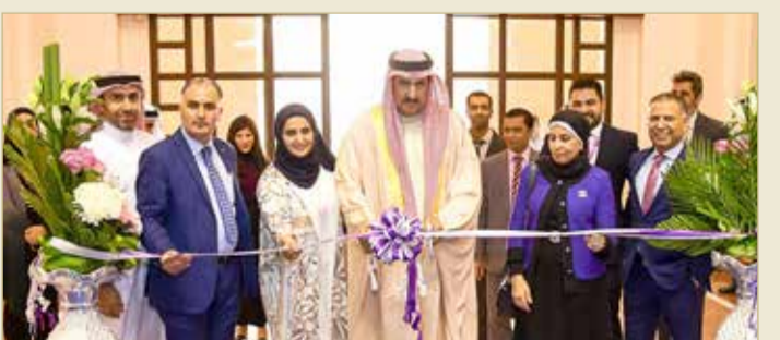
قص شريط الافتتاح