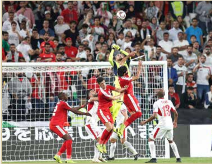
من مباريات كأس آسيا

وأنت في دولة الإمارات العربية المتحدة تتابع منافسات كأس آسيا تشعر بأنك تعيش في عدة دول داخل دولة في ظل تعدد الثقافات والعادات والتقاليد وحتى اللهجات بين كل إمارة وإمارة، حيث أن الحضور في أبوظبي بطابعها العمراني الجذاب وشوارعها الواسعة وهدونها يختلف عن التواجد في دبي التي تعج بصخب السيارات والمباني والأبراج الشاهقة والمجمعات التجارية المنتشرة في الأرجاء، كما أن التواجد في الشارقة بطابعها الإسلامي والتراثي يختلف عن مدينة العين التي تتميز بحداثتها وأسواقها الشعبية، وهو ما يعطي انطباع لدى المشجع بأنه يعيش في عدة دول داخل دولة واحدة رغم ما تعيشه البلاد من اتحاد بين مختلف إماراتها.