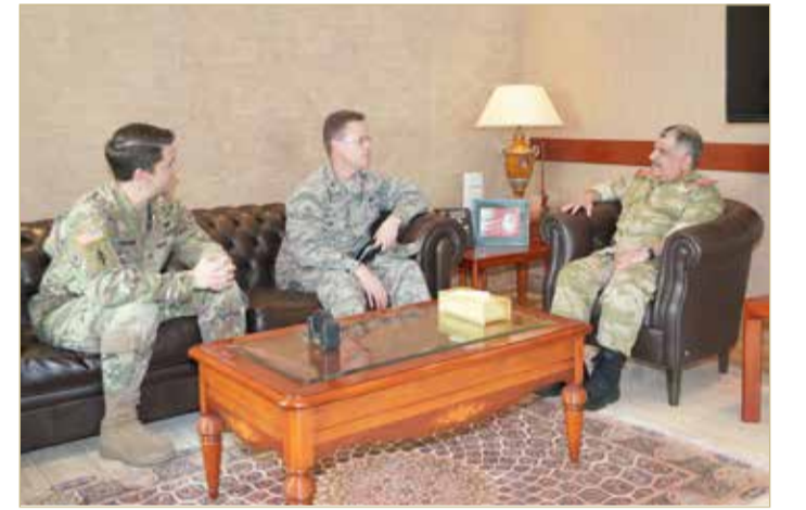
مدير أركان الحرس الوطني يستعرض التعاون المشترك مع الملحق العسكري الأمريكي