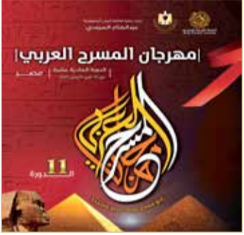
مهرجان المسرح العربي