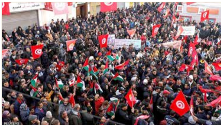
إضراب عام يشل الحركة في تونس

هتافات بإسقاط الحكومة وسط مطالب برفع الأجور