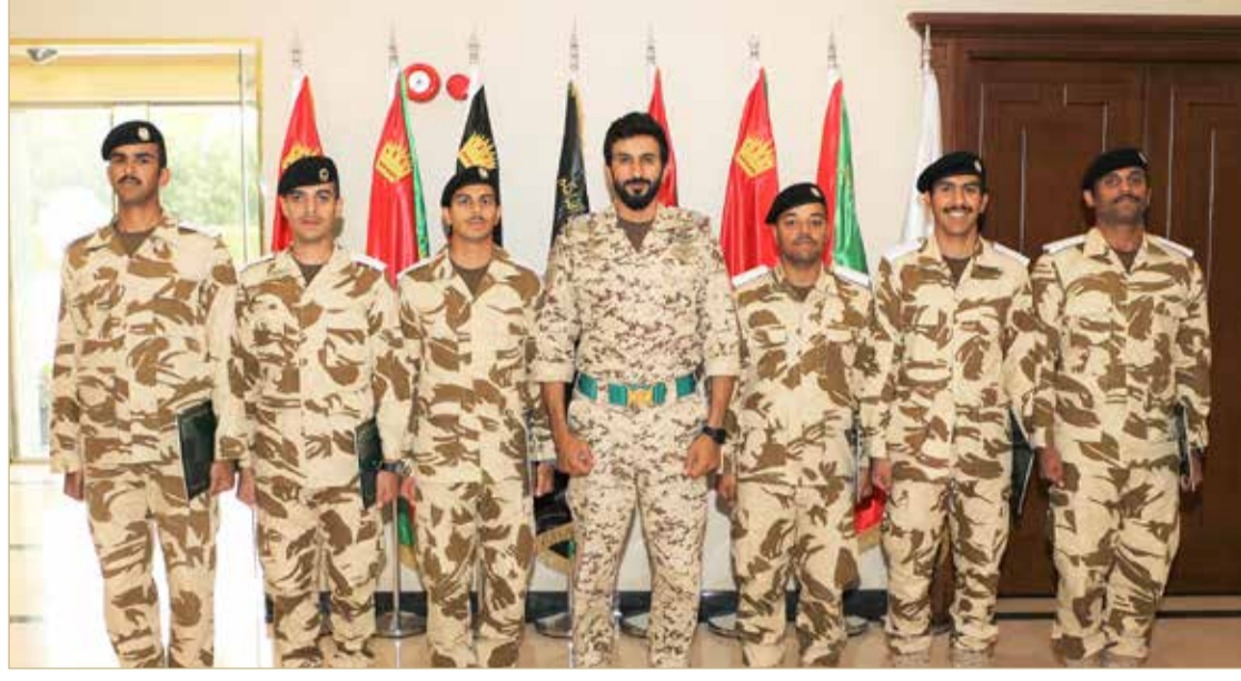
سمو قائد الحرس الملكي مستقبلاً المرشحين الضباط خريجي الدورة التأهيلية

◆ ناصر بن حمد يشيد بجهود الضباط المرشحين لدورة "ساند هيرست"