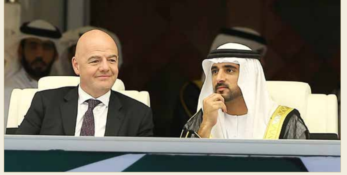
سمو الشيخ حمدان بن محمد بن راشد وإيفانتينو في حفل الافتتاح