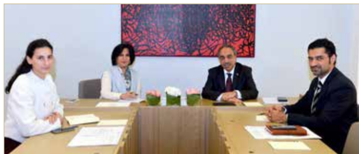
رئيسة هيئة الثقافة والآثار مستقبلة وزير الأشغال وشؤون البلديات

استقبلت رئيسة هيئة البحرين للثقافة والآثار الشيخة مي بنت محمد آل خليفة في مقر الهيئة أمس وزير الأشغال وشؤون البلديات والتخطيط العمراني عصام خلف والوكيل المساعد للخدمات البلدية المشتركة وائل المبارك، وذلك لبحث سبل التعاون في عدد من الموضوعات المشتركة.