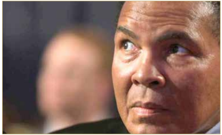
قال رئيس بلدية المدينة غريغ فيشر في بيان "محمد علي ترك ميراثاً من القيم الإنسانية والرياضية التي ألهمت مئات الملايين من البشر، من الجميل أن نخلد اسمه عبر مطار المدينة".

قررت مدينة لويزفيل في ولاية كنتاكي الأمريكية تكريم أسطورة الملاكمة العالمية محمد علي بإطلاق اسمه على مطارها؛ تخليداً لذكرى ابن المدينة الكبير. وقال رئيس مجلس هيئة المطارات جيم ويلش في بيان "هذا يؤكد للعالم عن مدى فخراً بربط اسم محمد علي ليس