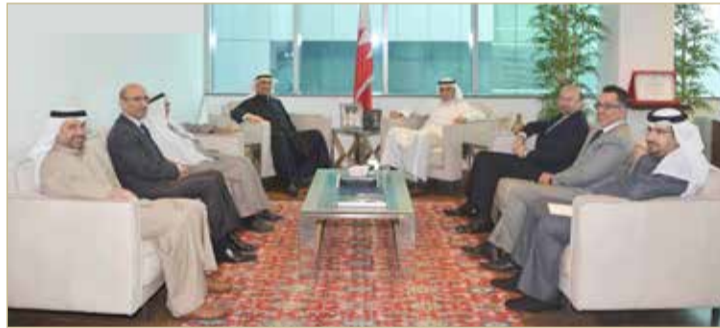
الزياني مستقبلاً رئيس مجموعة الصانع

أكد وزير الصناعة والتجارة والسياحة زايد الزياني، أن احتضان البحرين للاستثمارات العالمية والإقليمية العملاقة كمجموعة عبد الرزاق الصانع لهو مؤشر إيجابي يضاف إلى رصيد المملكة في جذب الاستثمارات الإقليمية والعالمية الرائدة على مستويين الإقليمي والعالمي.