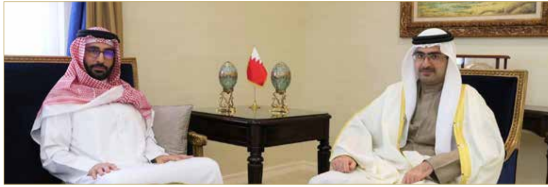
سمو محافظ الجنوبية مستقبلاً وزير شؤون الشباب والرياضة