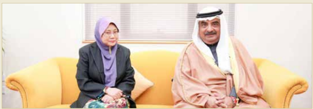
مستشار سمو رئيس مجلس الوزراء مستقبلاً القائم بأعمال سفارة سلطنة بروناي دار السلام لدى مملكة البحرين

وتقديره على ما بذلته القائم بالأعمال سفارة سلطنة بروناي في فترة عملها الدبلوماسي في تعزيز وتنمية العلاقات الطيبة التي تجمع بين البلدين الصديقين على الأصعدة كافة.