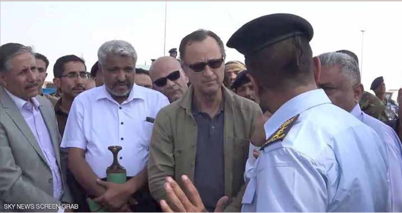
ميليشيات الحوثي تنشن هجوما على كاميرت