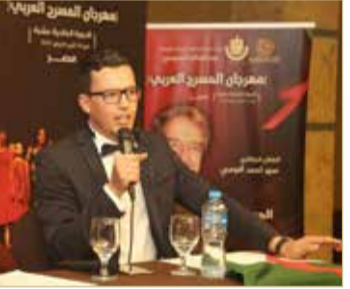
المؤلف المصري أيمن هشام