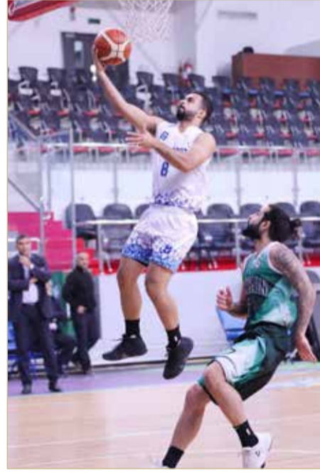
من لقاء النويدرات والبحرين

حقق فريقا النويدرات وسترة نتيجة الفوز، على حساب البحرين ومدينة عيسى على التوالي، في المباراتين اللتين جمعتهما مساء أمس (الخميس)، على صالة اتحاد السلة بأب الحصم، في ختام الجولة الأولى لحساب الدوري الفضي.