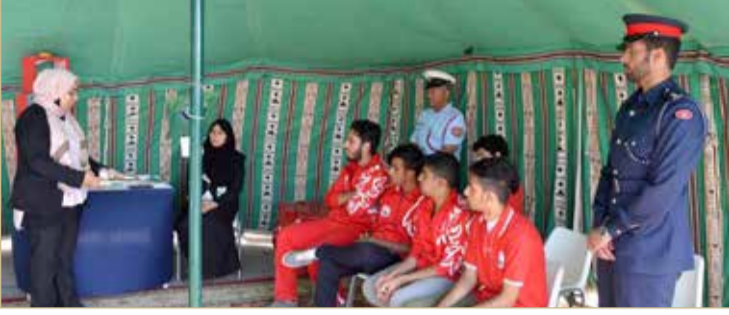
جانب من فعاليات المعسكر الربيعي