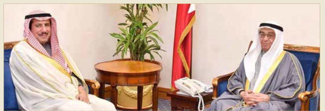
سمو نائب رئيس مجلس الوزراء مستقبلاً السفير الكويتي