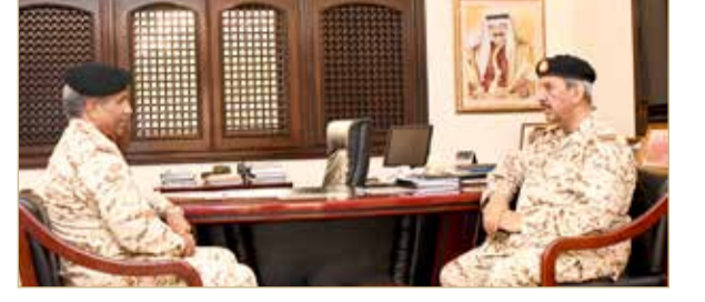
القائد العام يتفقد عددا من وحدات قوة الدفاع