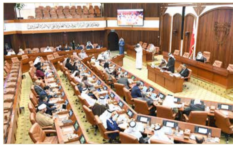
جلسة مجلس الشورى الثالثة (8)

الأساسية التي تدخل في الفهم أو استخدام اللغة المكتوبة أو المنطوقة، لذا فإن التعديل المقترح لا يقدم أية إضافة جديدة إلى المادة.