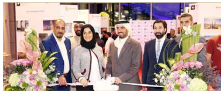
الشيخ عيسى بن علي مفتتحًا المعرض

إظهار المشاهد البحرينية المتميزة والجميلة. وكانت الحصيلة الإجمالية للصور المشاركة في النسخة الرابعة من المسابقة ما يفوق 1500 التقاطة من كافة الفئات، وتخلت مراحل المسابقة عقد 10 ورش تدريبية مكثفة ورحلات تصويرية ميدانية أجريت خلال شهر ديسمبر الماضي، انضم إليها أكثر من 300 شخص الذين اكتسبوا كفاءات من المعلومات والخبرات المقدمة من أبرز المختصين في مجال التصوير.