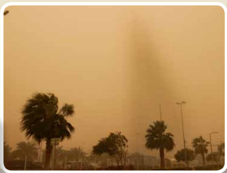
الغبار يغطي المباني الشاهقة في العاصمة