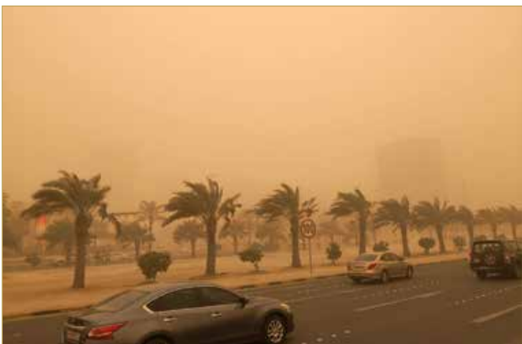
عاصفة ترابية هبت على مختلف المناطق بالمملكة

تعرضت مملكة البحرين يوم أمس لموجة لعاصفة ترابية شديدة السرعة، مع انخفاض في الرؤية الأفقية لأقل من 1000 متر في عدد من مناطق المملكة.