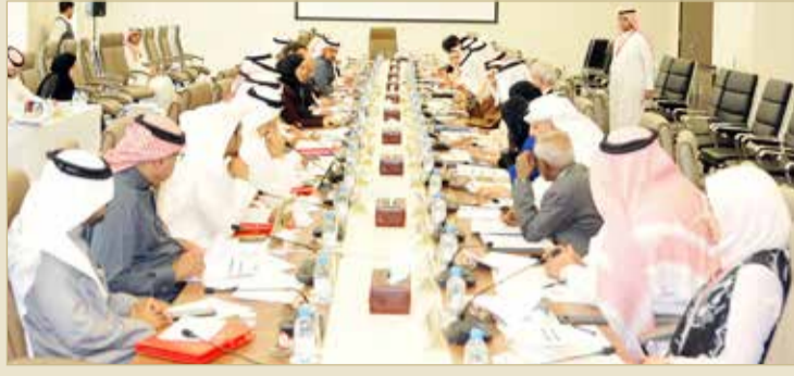
جانب من الاجتماع البرلماني الحكومي

هذا ومن المقرر أن تعقد اللجنة النيابية اجتماعها الرابع يوم الأحد المقبل بحضور رئيس وأعضاء الوفد الحكومي، للباحث بشأن مرئيات اللجنة المزمع تسليمها للحكومة حول التعديلات المقترح إدخالها على برنامج عمل الحكومة، تمهيداً لقيام اللجنة بإعداد تقريرها النهائي وعرضه على المجلس للتصويت.