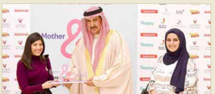
تكريم الرعاة والداعمين والشركاء الاستراتيجيين