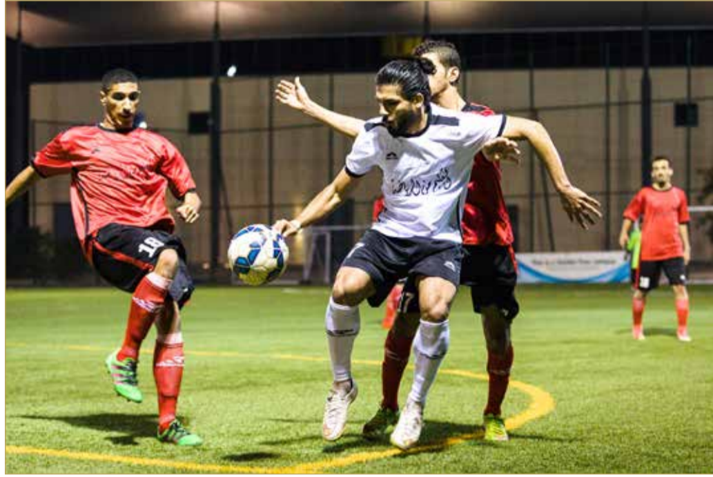
جانب من الدوري الجامعي

تعود الحياة مجدداً اليوم الى ملاعب الدوري الوطني للجامعات لكرة القدم بعد توقف دام نحو شهر واحد بسبب ظروف الاختبارات الدراسية في الجامعات، وسط غموض الصورة بشأن وضعية الفرق ومدى تأثرها بفترة التوقف وما إذا كان بعضها أستفاد في إعادة ترتيب أوراقه وتجهيز نفسه بصورة أفضل من الجولات السابقة، وما بين خشية بعض الفرق التي ظهرت بصورة جيدة في الجولات الأولى من التأثير السلبى لفترة التوقف.