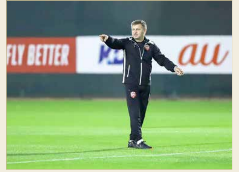
مدرب منتخبنا سكوب