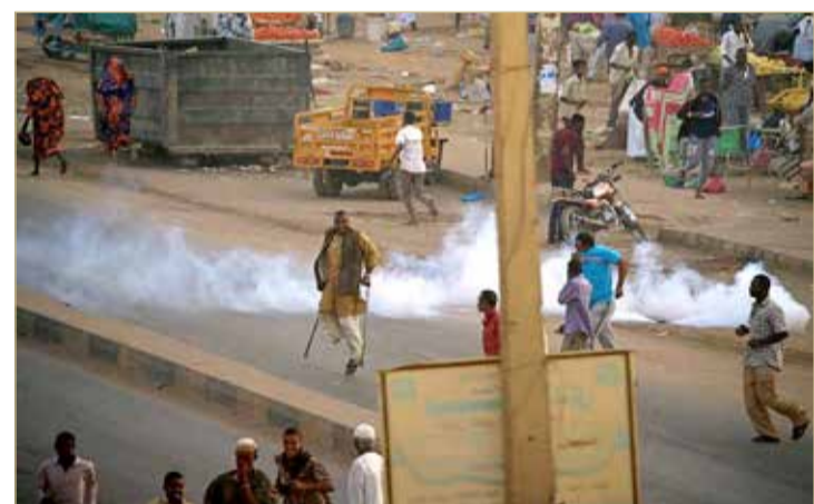
محتجون خلال اشتباكات مع الشرطة السودانية في الخرطوم

تظاهرة باتجاه القصر الرئاسي والحكومة تزيد الرواتب