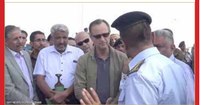
ميليشيات الحوثي تشن هجوماً على كاميرت