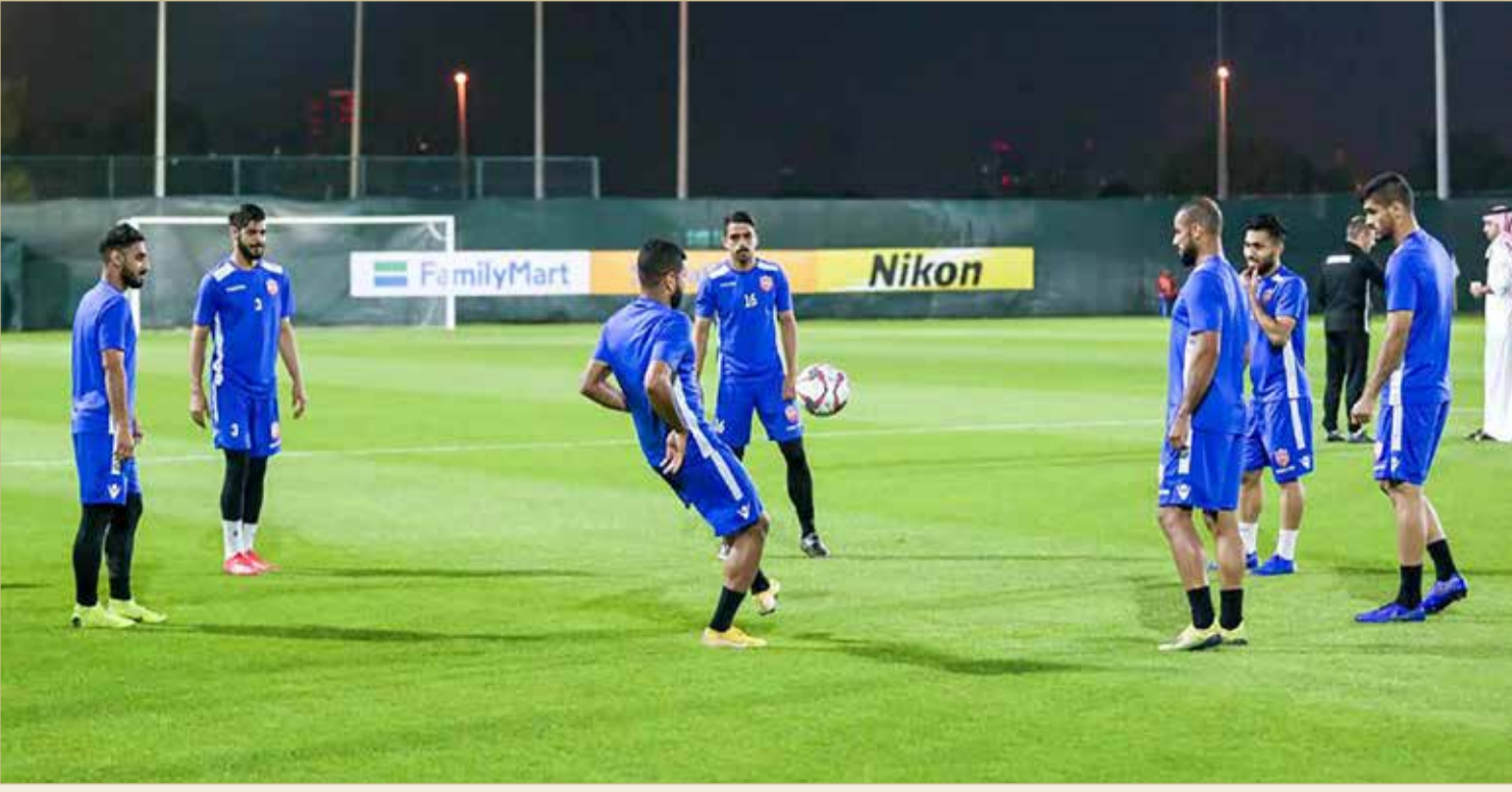
من تحضيرات منتخبنا