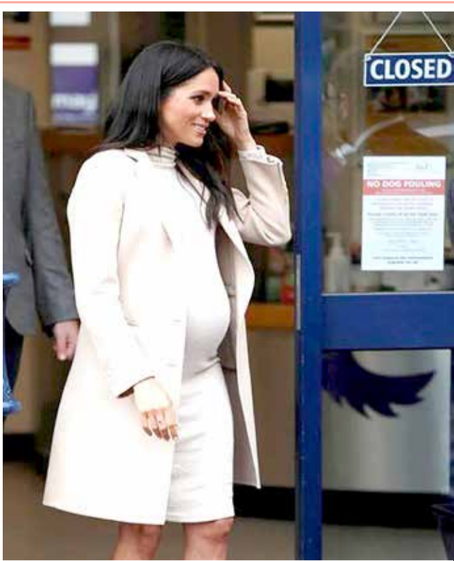
دوقة ساسكس ميغان زوجة الأمير البريطاني هاري في زيارة لمؤسسة مايبهيو الخيرية لرعاية الحيوانات في لندن

سيكون مستحيلاً دون تغيير العادات الغذائية وتحسين إنتاج الغذاء وتقليل إهداره. وقال لانغ "نحتاج إلى إصلاح كبير، وإلى تغيير النظام الغذائي العالمي على نطاق غير مسبوق". وترتبط العديد من الأمراض المزمنة التي تهدد الحياة بالأنظمة الغذائية السيئة،