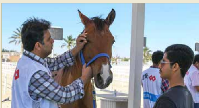
جانب من الفحص البيطري

وسيشارك سمو الشيخ خالد بن حمد آل خليفة في سباق بطولة سموه للقدرة لمسافة 120 كيلومتراً الذي من المقرر أن ينطلق صباح يوم غد السبت. وكان فرسان الإسطبلات المختلفة قد استعدوا بشكل مكثف في الفترة الماضية للمشاركة بكل قوتهم في بطولة سمو الشيخ خالد بن حمد آل خليفة للقدرة والمقرر أن تنطلق