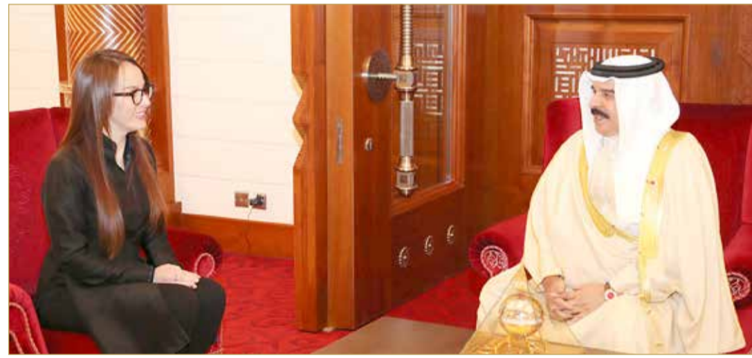
جلالة الملك مستقبلاً رئيسة الاتحاد البرلماني الدولي

العاهل: ماضون قدماً في نهج التطوير والتحديث