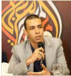
الكاتب الجزائري محمد الأمين