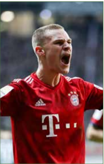
بايرن يسعي للفوز السادس على التوالي

موتشجلادباخ، ضيفاً على باير ليفركوزن، كما يأمل فولفسبورج في الحفاظ على قوة الدفع التي جعلت الفريق يحتل المركز الخامس، عندما يحل ضيفاً على شالكة. وبلتشي شتوتجارت، صاحب المركز الثالث من القاع، مع ماينز، ويلعب آينتراخت فرانكفورت مع فرايبورج، وهانوفر، صاحب المركز الثاني من القاع، مع فيردر بريمن، وأجوسبورج مع دوسلدورف.