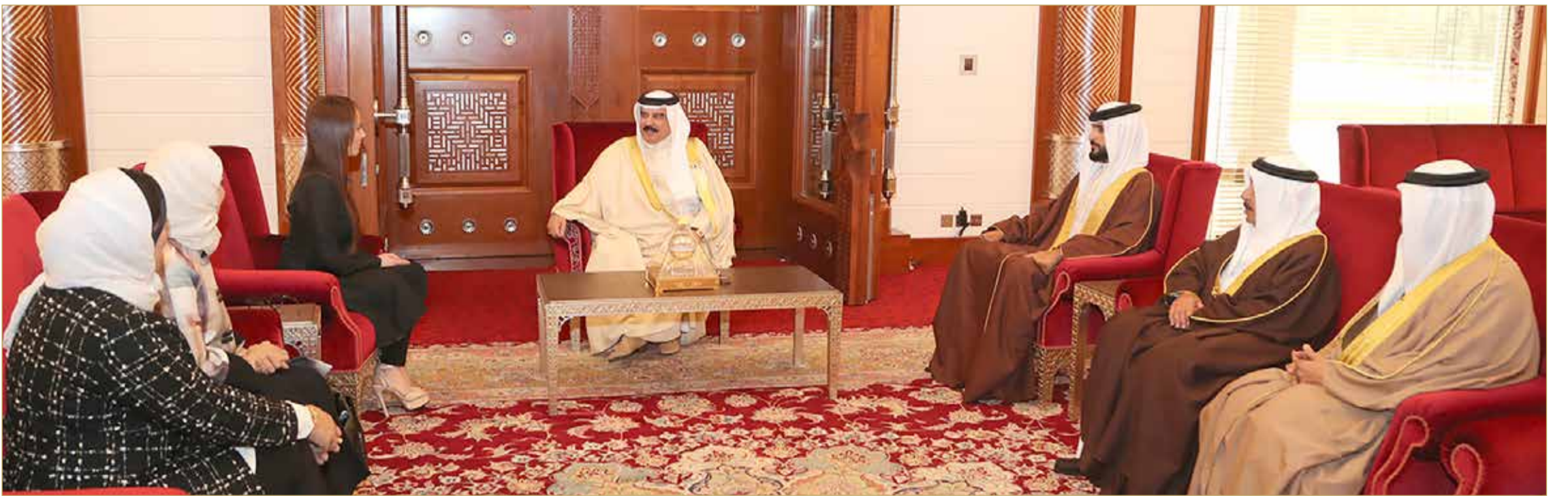
جلالة الملك مستقبلاً رئيسة الاتحاد البرلماني الدولي