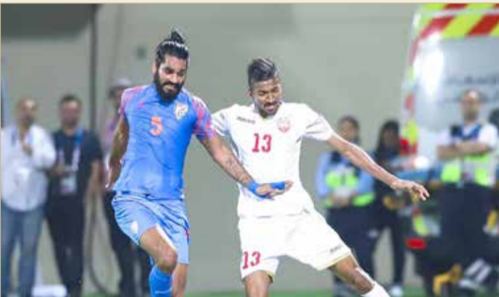
من لقاء منتخبنا أمام الهند