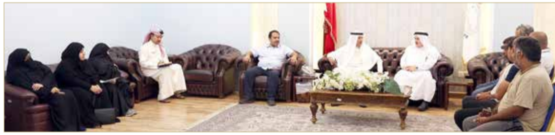
محافظ العاصمة يلتقي عددا من أهالي منطقة الجفير

بالمسؤوليات والمهام الموكلة إليها، بما من شأنه تطوير العلاقات الثنائية بين مملكة البحرين وجمهورية اندونيسيا. وتم خلال اللقاء، بحث مجالات التعاون الأمني بين البلدين الصديقين