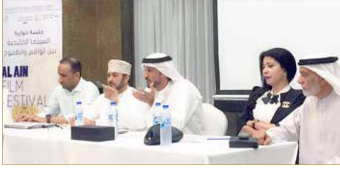
جلسة خليجية خاصة عن السينما

الخليجية، إلا أن أغلبها لا تزال تعرض قضايا بعيدة ربما عن الواقع الذي نعيشه، بصورة مكررة الأمر الذي يؤثر على ظهور السينما الخليجية بالسلب.