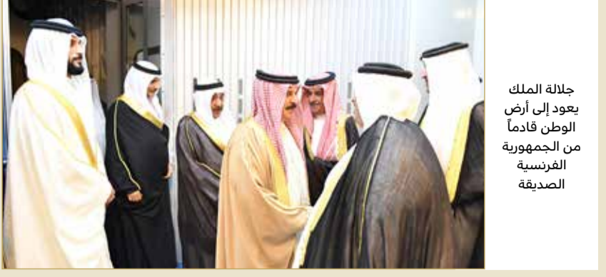
جلالة الملك يعود إلى أرض الوطن قادماً من الجمهورية الفرنسية الصديقة

عاد ملك البلاد صاحب الجلالة الملك حمد بن عيسى آل خليفة إلى أرض الوطن قادماً من الجمهورية الفرنسية الصديقة أمس بعد أن قام جلالتهم بزيارة جمهورية هونغ كونغ خلالها مباحثات مع رئيس جمهورية هونغ كونغ السيد كارين ليو، أعقبها زيارة للجمهورية الفرنسية الصديقة لتلبية لدعوة تلقاها جلالتهم من الرئيس الفرنسي إيمانويل ماكرون، أجرى فيها مباحثات معه تناولت سبل تطوير وتنمية مجالات التعاون الثنائي والعلاقات التاريخية الوطيدة التي تجمع بين البلدين الصديقين بالإضافة للتطورات والمستجدات على الصعيدين الإقليمي والدولي والقضايا ذات الاهتمام المشترك.