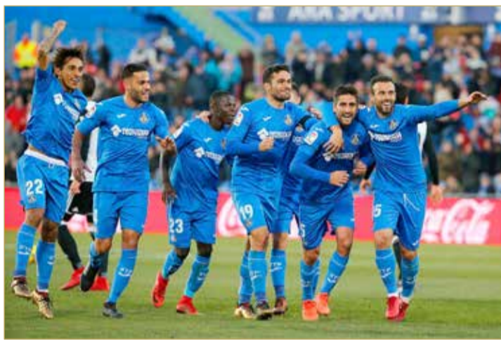
خيتافي يسعى لتحقيق الحلم الكبير

فرق سيلتا فيجو، وليفانتي وجيرونا وولد الوليد للبقاء في الدوري، بينما تستعد فرق هويسكا ورايو فايكانو، صاحب المركز التاسع عشر، للهبوط إلا إذا حدثت معجزة. ويحل برشلونة ضيفا على سيلتا، ولكن