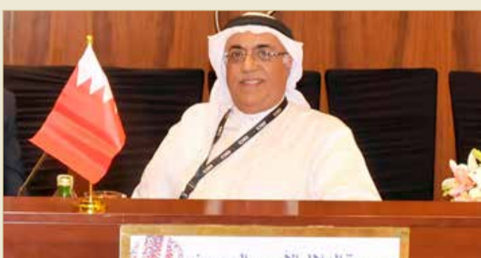
الأمين العام لجمعية الهلال الأحمر البحريني يشارك في أعمال اجتماع الدورة

كما كشفت عن استعداد منسوبي ومنسوبات الجمعيات الوطنية للتعاون مع أي من الجهات الحكومية في بلدانهم نحو إيلاء جهود نشر التعليم في مجال التسامح من حيث المشاركة في البرامج الموجهة نحو تنشئة مواطنين يقظين مسؤولين ومنفتحين على الثقافات الأخرى، وقادرين على درء الصراعات والنزاعات والعنف.