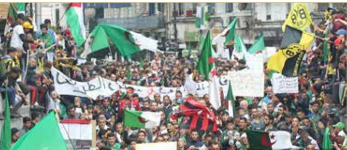
تظاهرة مناهضة للحكومة في العاصمة الجزائر

شرع آلاف الجزائريين في التظاهر للجمعة الحادية عشرة على التوالي، متمسكين بمطلب رحيل رموز النظام السابق وتشكيل هيئة رئاسية لإدارة المرحلة الانتقالية تضم أسماء تحظى بقبول شعبي.