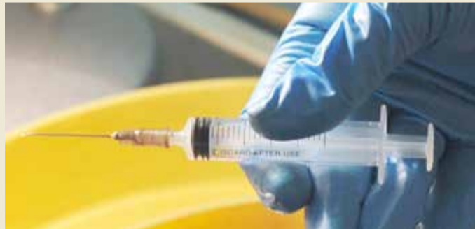
تم اعتقال الطبيب بعد جريمته الشنيعة

الآن، غير أن البعض ردها إلى رغبة انتقامية تصيب البعض عند علمهم بأنهم مصابون بذلك المرض.