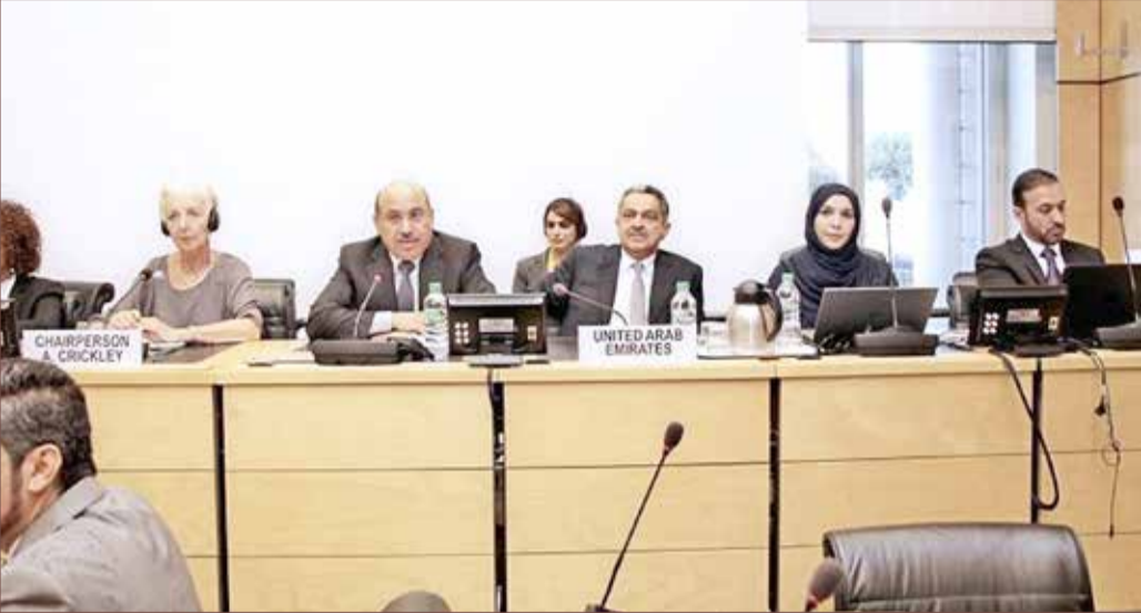
وقد دولة الإمارات في اجتماع "التمييز العنصري" التابعة للأمم المتحدة

قدمت دولة الإمارات العربية المتحدة، أمس الجمعة، بيانها أمام لجنة القضاء على التمييز العنصري في جنيف، مفندة الإدعاءات القطرية الكيدية، والتي زعمت أن التدابير التي اتخذتها دولة الإمارات ردا على الممارسات القطرية في دعم التطرف والجماعات الإرهابية تشكل - وفقا لادعاء قطر - تمييزاً عنصرياً - بموجب اتفاقية الأمم المتحدة للقضاء على جميع أشكال التمييز العنصري .