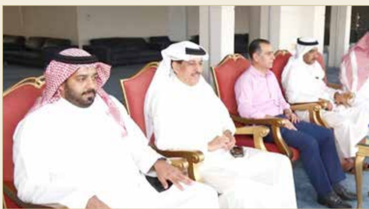
متابعة ميدانية من قبل اللجنة المنظمة

المالحي: شكراً لثقة ناصر بن حمد ودعم الشركات وأعضاء اللجان اللجنة الفنية تسابق الزمن وتصدر أكثر المشاركين من 1000 بطاقة