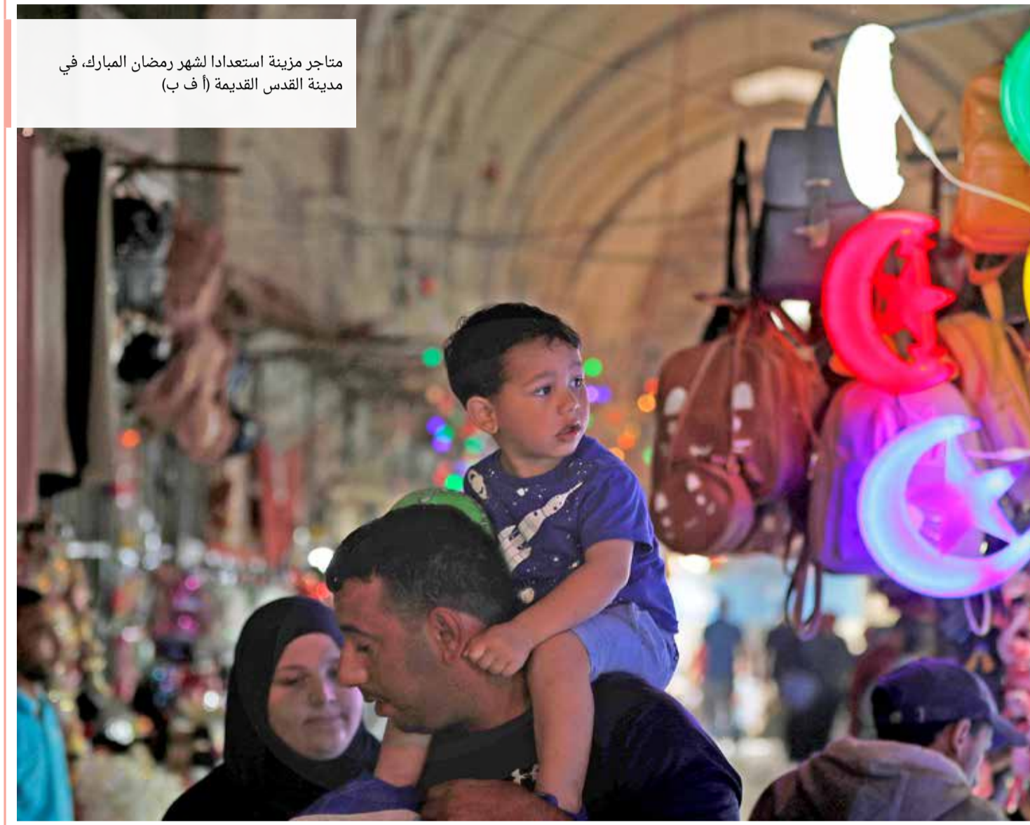
متاجر مزينة استعدادا لشهر رمضان المبارك، في مدينة القدس القديمة