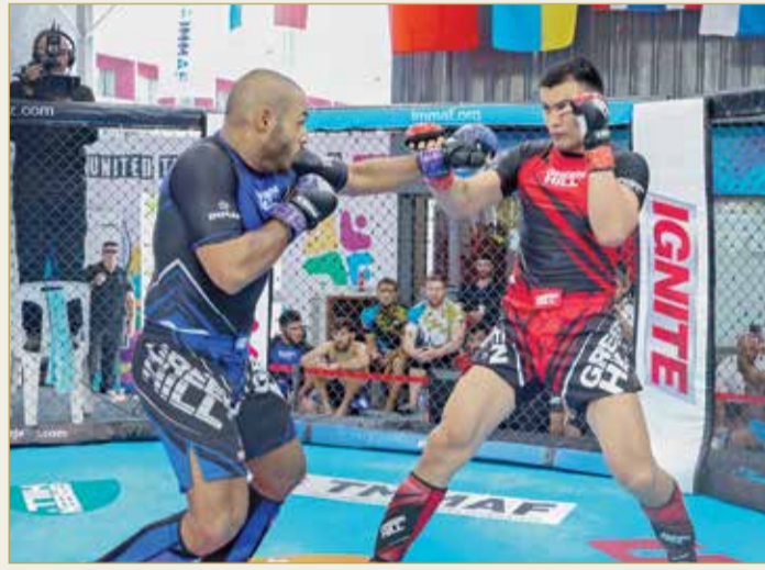
جانب من منافسات اليوم الثاني