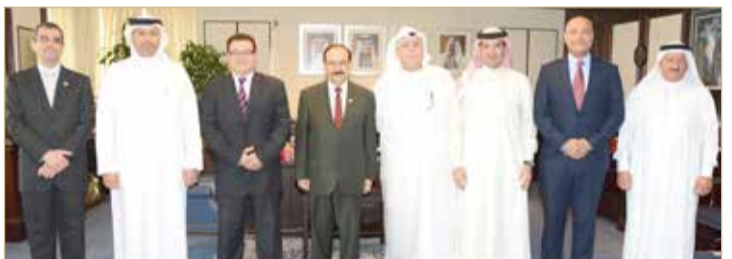
وزير الكهرباء والماء ومستقبل أصحاب الفكرة

من جانبهم استمع الحضور إلى توجيهات وزير الكهرباء والماء في هذا الخصوص والطريق الصحيح للسير على الخطوات نحو تحقيق الفكرة الطموحة، معربين عن خالص شكرهم وتقديرهم للوزير والمسؤولين على حسن الاستقبال والحفاوة والدعم والتشجيع الامحدود.