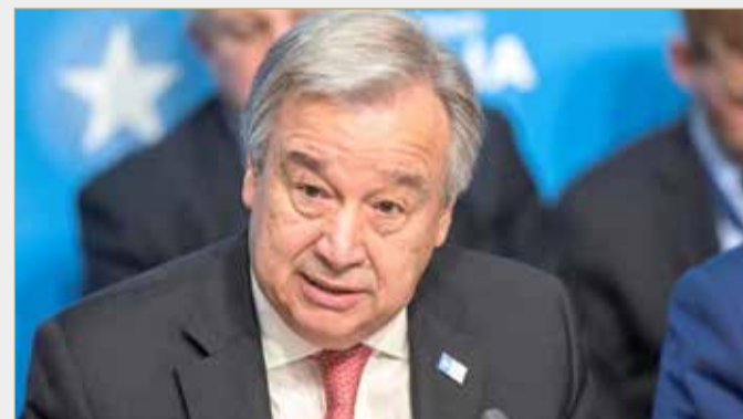
الأمين العام للأمم المتحدة انطونيو غوتيريش

مسلحة، لا يزالان يهددان أمن واستقرار لبنان في نزاعات إقليمية ويهدد استقراره وكذلك استقرار المنطقة". (14) ولفت إلى أن استمرار تدخل حزب الله