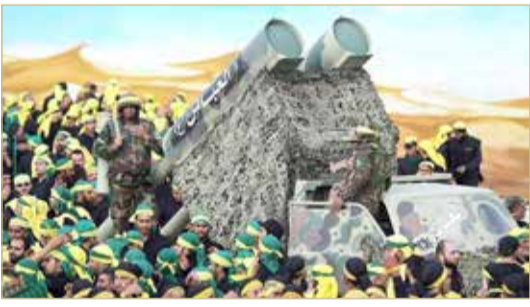
حرب الله يحصل على السلاح والمال من إيران

جدد الأمين العام للأمم المتحدة أنطونيو غوتيريش في تقرير نصف سنوي نشر أمس الجمعة، مطالبته بنزع سلاح حزب الله اللبناني ووقف عملياته العسكرية في سوريا المجاورة.