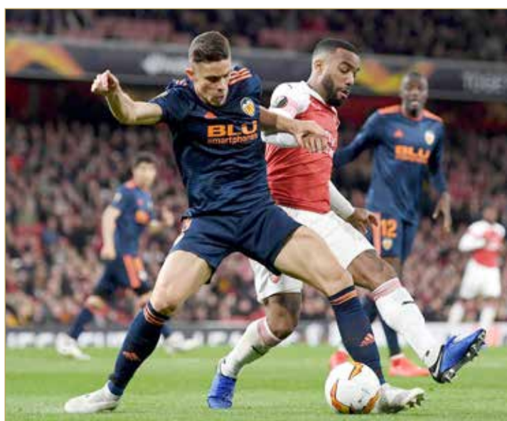
من مواجهة ارسنال وفالنسيا

صعبة. سنستعد للمباراة بالتفكير في الفوز والتسجيل والاستفادة من هجماتها لكن الأمر يعتمد على الكثير.