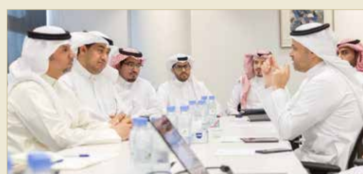
الرئيس التنفيذي للمجلس الأعلى للبيئة يطلع على برامج مركز كفاءة الطاقة السعودي

◆ "الأعلى للبيئة" يسعى للحصول على تكنولوجيات تبريد ذات كفاءة عالية