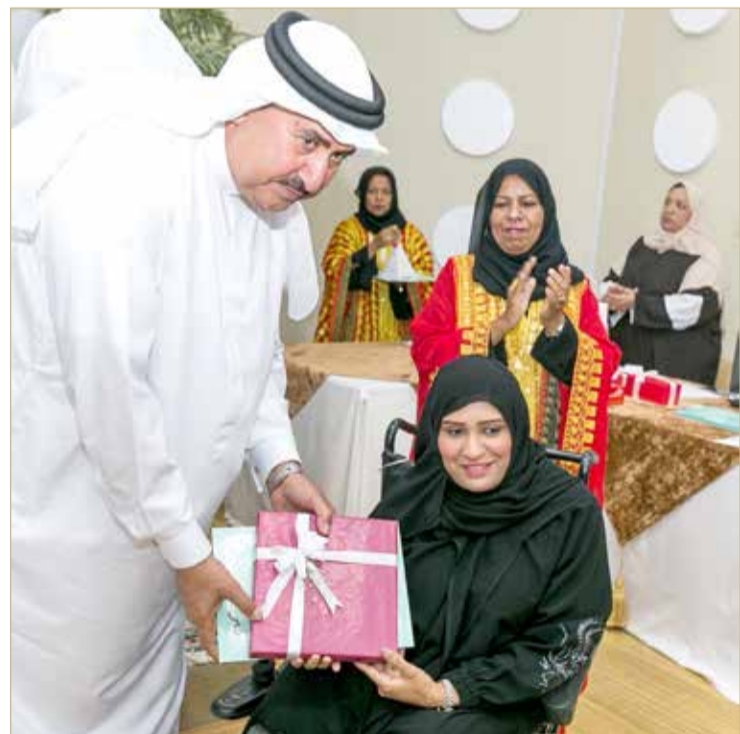
جانب من التكريم