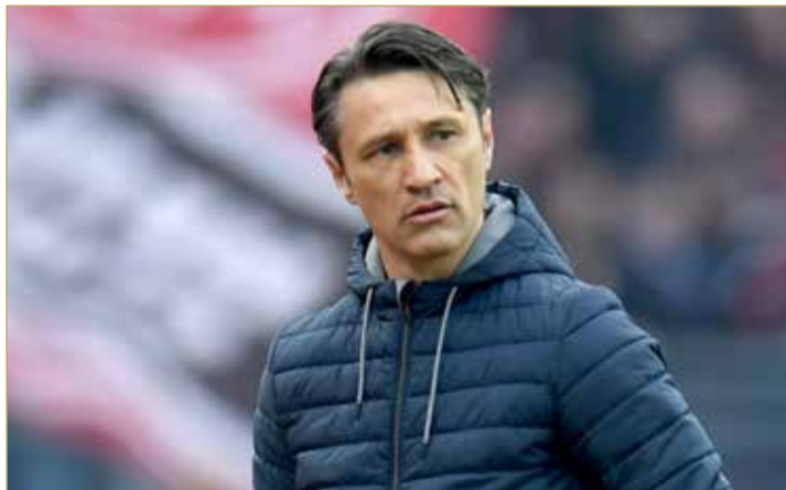
نيكو كوفاش (مدرب بايرن)

الربيع ويهدف للحفاظ على المركز الأخير المؤهل للعب في دوري أبطال أوروبا. وتتنافس ستة فرق وهي فرانكفورت، ومونشنجلادباخ، وباير ليفركوزن، وهوفنهايم وفولفسبورج وبريمن على المركز الأربعة المتبقية التي تؤهل