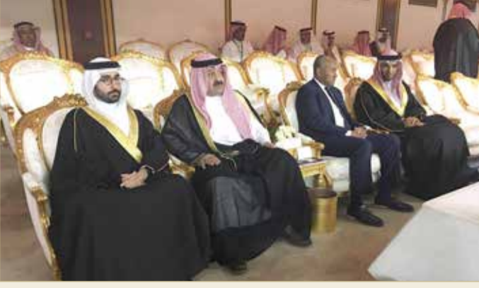
المؤيد يشهد المباراة الختامية لكأس خادم الحرمين الشريفين

تشريف الملك سلمان بمثابة أكبر تكريم للقطاع الشبابي والرياضي