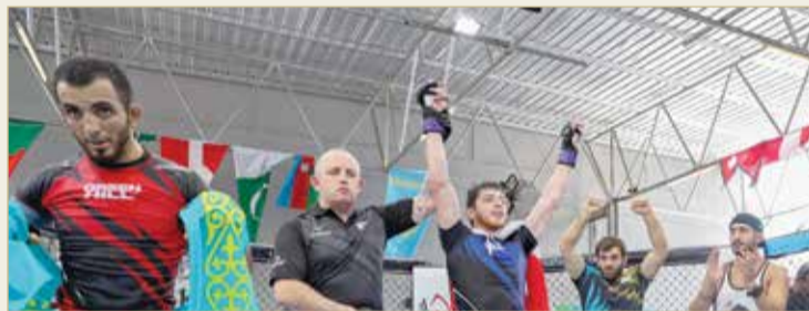
لاعبو المنتخب الخمسة المتأهلون للنهائي

فالفرة مواتيه لإحراز الميداليات الذهبية، التي تزيد من رصيد المنتخب وتساهم في تعزيز موقعه المتقدم على مستوى التصنيف العام للمنتخب في تصنيف الاتحاد الدولي. نتطلع أن يقدم لاعبو المنتخب المستوى الفني المطلوب، الذي يساهم في إحرازهم للنتيجة المشرفة في هذه المشاركة.