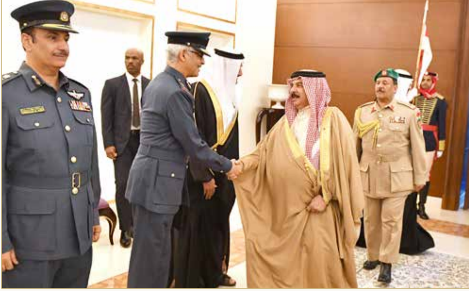
جلالة الملك يعود إلى أرض الوطن قادماً من الجمهورية الفرنسية الصديقة