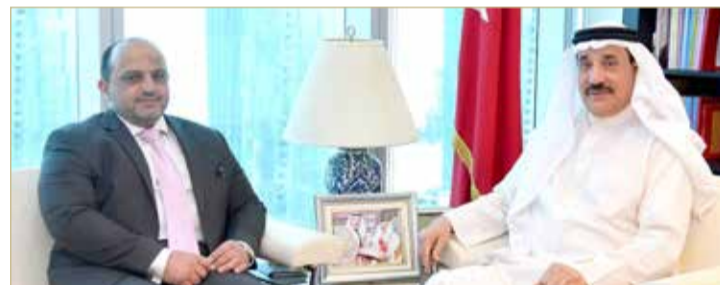
وزير العمل مستقبلاً النائب علي إسحاق

متنوعة لمختلف فئات المجتمع، مؤكداً أهمية التعاون بين السلطتين التشريعية والتنفيذية لما له من أثر إيجابي في تلبية احتياجات المواطنين من الخدمات التنموية الشاملة التي تقدمها الوزارة عبر مراكزها في جميع محافظات مملكة البحرين.