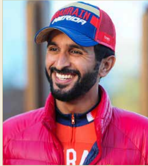
سمو الشيخ ناصر بن حمد