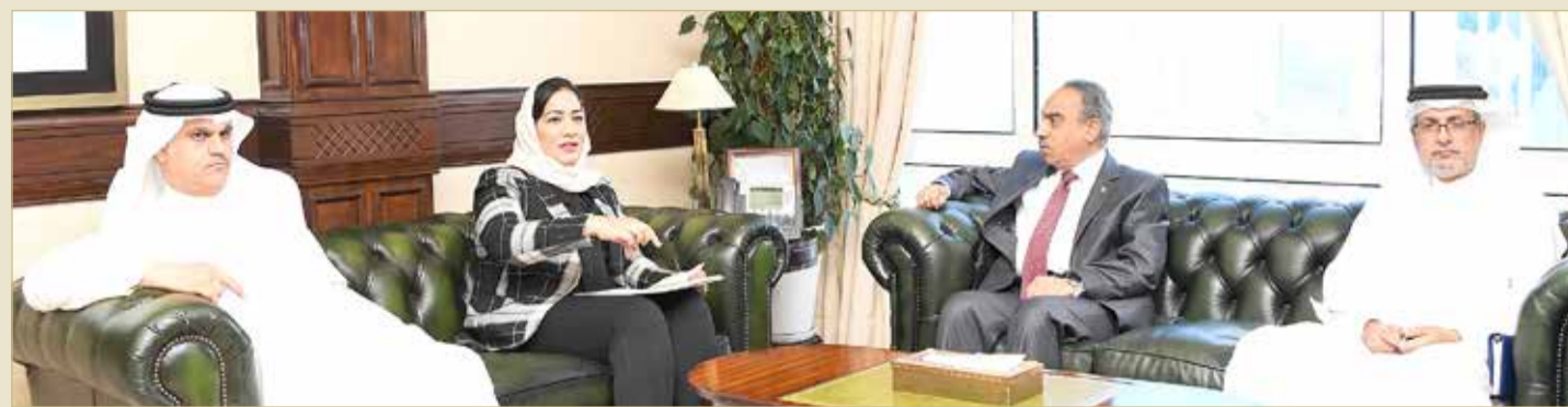
المنامة - وزارة الأشغال وشؤون البلديات

◆ خلف: حريصون على تنفيذ توجيهات سمو رئيس الوزراء