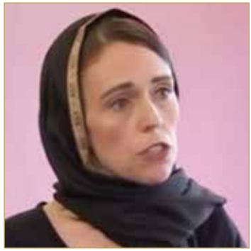
رئيسة وزراء نيوزيلندا

أكد مكتب رئيسة وزراء نيوزيلندا، جاسيندا أردن، أنه تمت خطبتها من شريكها كلارك جايفورد، استعداداً للزواج.