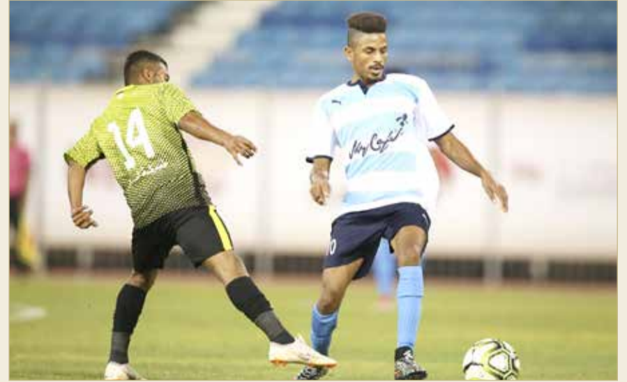
من مباراة دلمون والاساطير