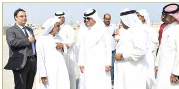
وكيل الزراعة والثروة البحرية في زيارة تفقدية للمرفأ

ومختلف العاملين في قطاع الصيد إلى التعاون مع وكالة الزراعة والثروة البحرية من أجل الارتقاء بهذا القطاع، وقال: "يدنا ممدودة للجميع، ونسعد بالتعاون مع الصيادين وصولاً إلى تطوير هذا القطاع الذي نعول كثيراً عليه".