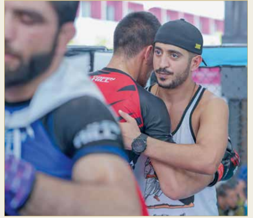
سمو الشيخ خالد بن حمد يؤازر لاعبي المنتخب