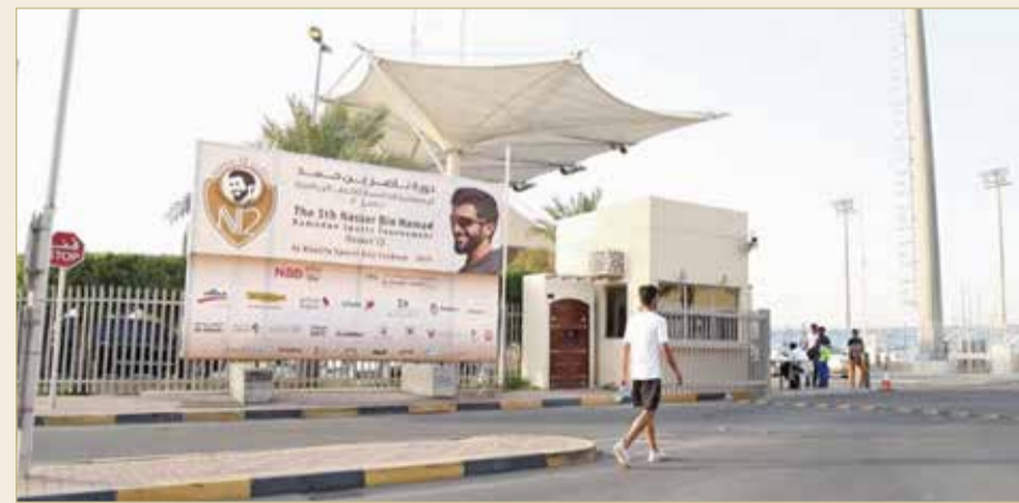
لافتات البطولة تنوزع في الشوارع