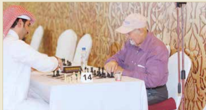
جانب من منافسات مهرجان ناصر بن حمد الرمضاني الشعبي