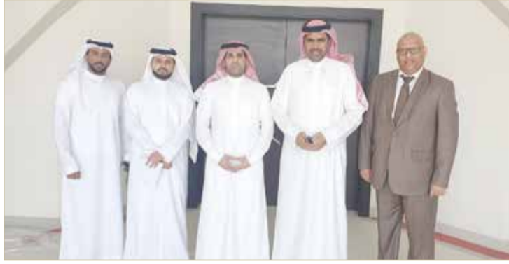
البوعيين يتوسط وفد المكتب الإقليمي

استقبل الأمين العام للاتحاد البحريني لكرة القدم إبراهيم البوعيين، وفد المكتب الإقليمي للاتحاد الدولي لكرة القدم (فيفا)، وذلك في مقر اتحاد الكرة بالرفاع.