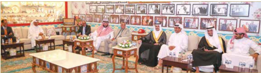
سمو محافظ الجنوبية في زيارة لعدد من مجالس أهالي مدينة عيسى

سمو محافظ الجنوبية: لقاءنا بالمواطنين يعكس تلاحمنا وترابطنا