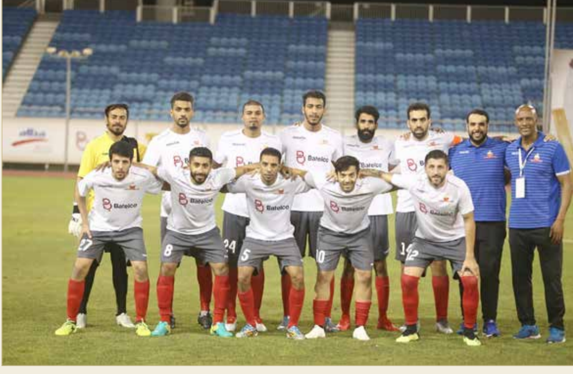
الصور الجماعية لفريق بنلكو غنرز يوناييتد