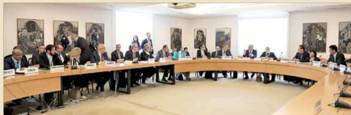
خلال مشاركة وفد مملكة البحرين في أعمال الجمعية العامة الـ 72 لمنظمة الصحة العالمية