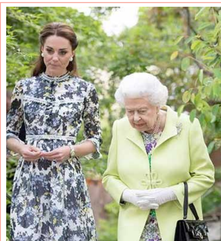
ملكة بريطانيا الملكة إليزابيث أثناء تفقد حديقة ”العودة للطبيعة“ التي صممها كيت ميدلتون دوقة كمبرج زوجة الأمير وليام في معرض تشيلسي للزهور في لندن

ويعد ثمانية مواسم و73 حلقة، وصل المسلسل لنهايتها بوفاة أخرى غير متوقعة واعتلاء شخصية لم تكن مرجحة العرش.