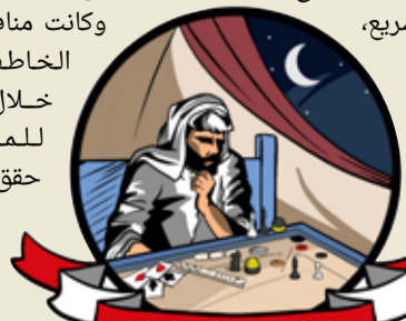
مهرجان ناصر بن حمد الرمضاني الشعبي

والشطرنج الزوجي. وكان مهرجان ناصر بن حمد الرمضاني الشعبي قد انطلق مع بداية شهر رمضان، حيث يستمر لغاية