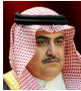
الشيخ خالد بن أحمد

أكد وزير الخارجية الشيخ خالد بن أحمد بن محمد آل خليفة أن موقف مملكة البحرين الرسمي والشعبي كان وسيظل ثابتًا ومناصرًا للشعب الفلسطيني الشقيق في استعادة حقوقه المشروعة في أرضه وإقامة دولته المستقلة وعاصمتها القدس الشرقية، ودعم اقتصاد الشعب الفلسطيني في كل موجه دولي وثنائي.