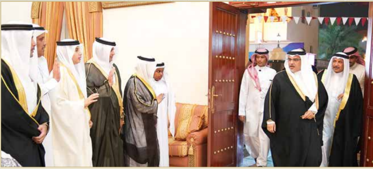
... وسموه يزور مجلس عائلة بن هندي