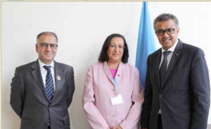
وزيرة الصحة سلمت الرسالة وعقدت اجتماعاً مع المدير العام لمنظمة الصحة العالمية