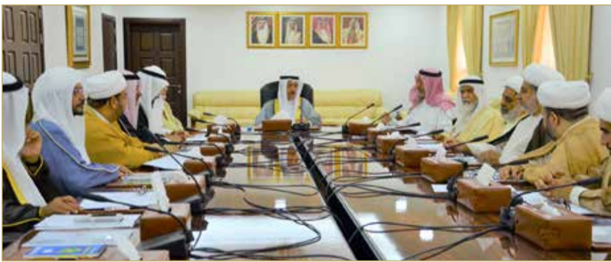
الشيخ عبدالرحمن بن محمد يترأس اجتماع المجلس الأعلى للشؤون الإسلامية

◆ "الأعلى الإسلامي" يندد بالأعمال الإرهابية والتخريبية بالسعودية والإمارات