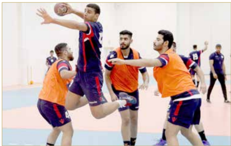
جانب من التدريبات