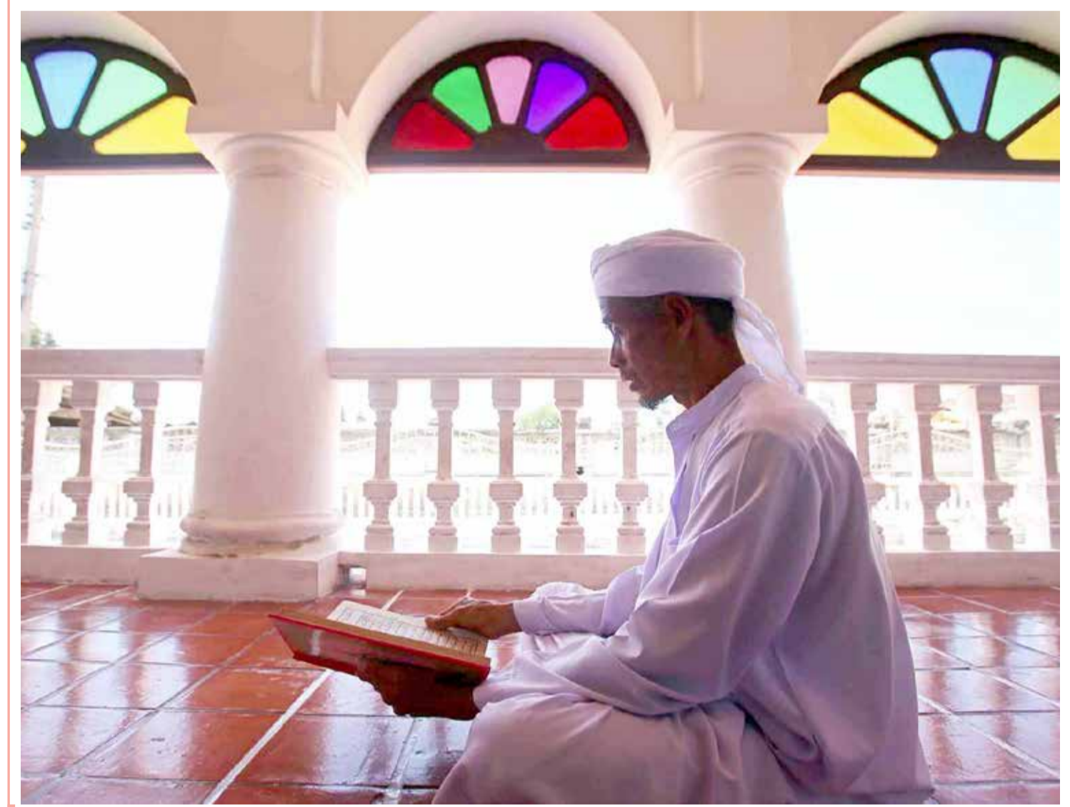
تايلندي يقرأ القرآن خلال شهر رمضان المبارك في مسجد داتوك في مقاطعة باتاني