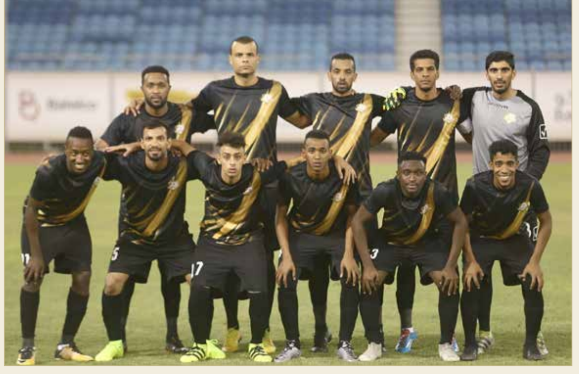
الصورة الجماعية لفريق وينغ