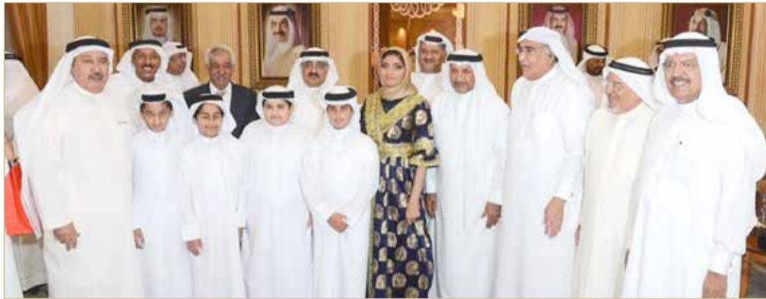
من حفل تكريم الرواد في العام الماضي

وبدا الحفل بتلاوة آيات عطرة من الذكر الحكيم بعدها أقيمت كلمة بهذه المناسبة ثم قدم إيجاز عن الدورة، بعد ذلك قدم الخريجون عرضا عمليا اشتمل على المسير العسكري، ثم رددوا قسم الخدمة العسكرية ونشيد قوة دفاع البحرين. وفي ختام الحفل تفضل مساعد رئيس