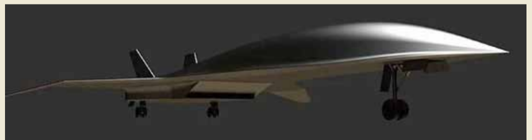
طائرة تحلق بسرعة تفوق سرعة الصوت

ونقل موقع الشركة عن مؤسس ”خوسلا فنتشرز“ فينود خوسلا، قوله: ”لا تقتصر فوائد الطائرة التي يجري تطويرها على تقصير زمن الرحلات الجوية والارتفاع بمستوى تجربة السفر فحسب، وإنما ستكون له تداعيات إيجابية من الناحية الاقتصادية“. وأضاف أن المشروع سيمكّن المسافرين في المستقبل من الوصول لوجهاتهم البعيد في زمن قياسي. ولم تكشف الشركة عن الكثير من التفاصيل التي تتعلق بالطائرة، إلا أن لديها منافسين يسعون بدورهم لتطوير طائرات تجارية أسرع من الصوت، إذ كشفت شركة ”بوينغ“ عن مشروع طائرة تحلق بسرعة 6120 كيلومترا في الساعة. وقبل عام منحت وكالة الفضاء الأميركية ”ناسا“ عقدا لـ ”لوكهيد مارتن“ بقيمة 241.5 مليون دولار لتطوير طائرة أسرع من الصوت، تكون جاهزة في منتصف 2022.