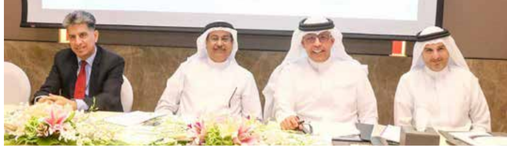
اجتماع الجمعية العامة غير العادية أمس

وافقت الجمعية العمومية غير العادية لشركة البحرين لمواقف السيارات المدرجة أسهمها في بورصة البحرين المشغلة لبنائية مواقف السيارات “مبنى الترمينال” على إصدار 40 مليون سهم عادي جديد بسعر 150 فلساً لصالح شركة “إدامة”، في وقت تمت فيه الموافقة على زيادة رأس المال الصادر والمدفوع لـ “مواقف السيارات” إلى 11 مليون دينار.