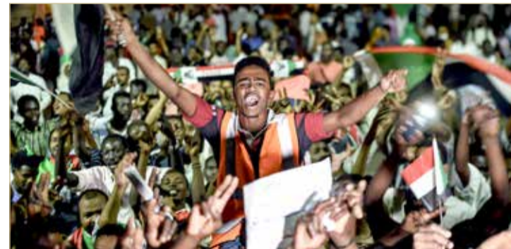
اعتصام خارج المقر العسكري في الخرطوم

دعا تجمع المهنيين السودانيين إلى الاستمرار في الاعتصام، وتنظيم إضراب عام، وذلك بعد تعثر المفاوضات بين المجلس العسكري الانتقالي وقوى إعلان الحرية والتغيير.