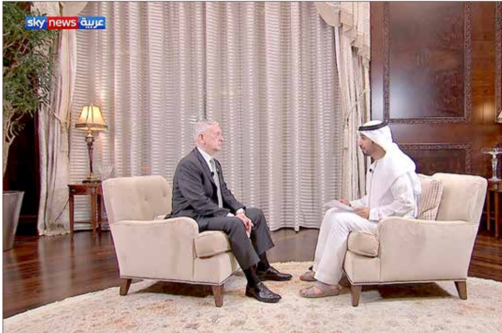
جيمس ماتيس في مقابلة مع "سكاي نيوز" عربية

وفي لقاء خاص مع "سكاي نيوز عربية"، دعا ماتيس، الذي يزور العاصمة الإماراتية أبوظبي، دول المنطقة إلى تشكيل جبهة موحدة لمواجهة إيران، ودفعها لتغيير "سلوكها التدميري".