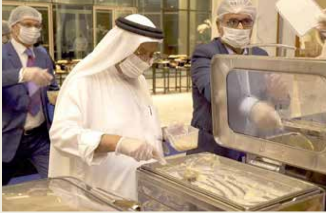
غبقة “حفظ النعمة”

ساهمت شركة مطار البحرين، الجهة المسؤولة عن إدارة وتشغيل مطار البحرين الدولي، بطعام الغبقة السنوية للموظفين إلى “جمعية حفظ النعمة”، وهي مؤسسة غير ربحية تعمل على جمع الطعام الفائض من الفنادق وتوزيعه على المحتاجين من الأفراد والأسر.