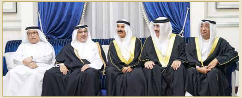
سمو ولي العهد يزور مجلس إبراهيم الشيخ