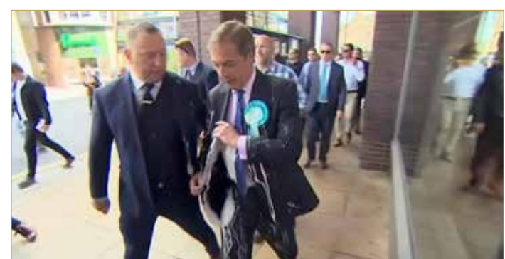
كان أبنغ قد أدلى بتصريح مستفز بعد الهجومين، قال فيه إن ”السبب الحقيقي لإرافة الدماء في نيوزيلندا هو برنامج الهجرة الذي سمح للمسلمين بالهجرة إليها“.

ويعتقد أن الحليب المخفوق قد أصبح أداة للاحتجاج على السياسيين، خاصة في بريطانيا، حيث استخدمه نايجل فاراج، زعيم حزب ”بريكست“، في هجمته على أعضاء البرلمان الأوروبي في مدينة نيوكاسل الإنجليزية، وفق ما ذكرت وكالة رويترز.