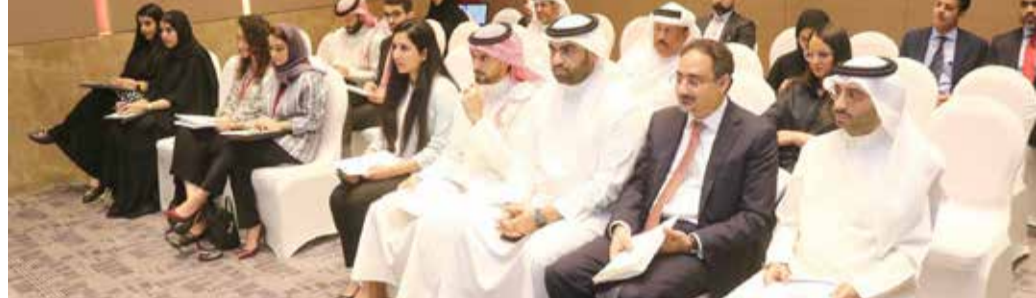
جانب من الحضور أمس

الداخلية للشركة، وبمنحها المرونة المالية لفرص النمو المستقبلي، وهذا هو الأساس الذي استندنا عليه. ووافق المساهمون في اجتماع الجمعية العمومية غير العادية لشركة البحرين لمواقف السيارات أمس التي عقدت بنصاب قانوني بلغ 85.3 %، على الصفقة متمثلة بالحصول على حق الانتفاع لمدة 99 عاماً يتجدد تلقائياً في بنائية مواقف السيارات ملوكة لشركة إدامة. وفي مقابل هذا الحق، ستقوم الشركة بعقوضه بإصدار 40 مليون سهم عادي جديد لصالح شركة إدامة من خلال الموافقة على زيادة رأس المال المصروح به للشركة من 10 ملايين دينار موزعة على 100 مليون سهم عادي تعادل 100 فلس للسهم الواحد إلى 12.5 مليون دينار موزعة على 125 مليون سهم عادي تعادل 100 فلس للسهم الواحد.