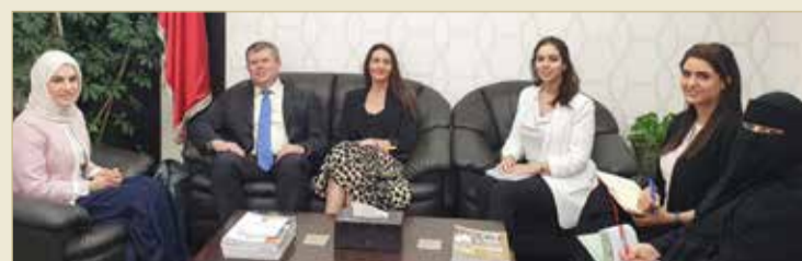
مجلس التعليم العالي يبحث التعاون البحثي مع وزارة الأعمال البريطانية

التركيز على المجالات ذات الأولوية الاقتصادية والاجتماعية للبحرين