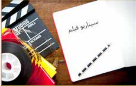
يمكن أن نطلق عليه صفة سحر السينما