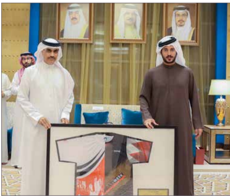
سمو الشيخ خالد بن حمد يتسلم هدية تذكارية من خالد الخياط