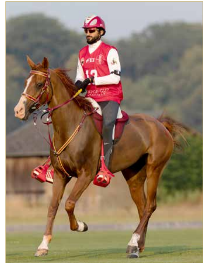
سمو الشيخ ناصر بن حمد يقود الفريق الملكي للقدرة