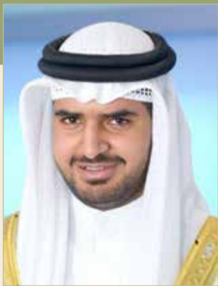
سمو الشيخ عيسى بن علي

والاتحاد البحريني لكرة السلة يشيد بتعاون الوزير المؤيد وحرصه على تلبية احتياجات الاتحاد البحريني والاندية الأعضاء، وهو الأمر الذي ساهم في تحقيق التطور المنشود لكرة السلة البحرينية والمسابقات والبطولات الرياضية، والاتحاد البحريني لكرة السلة يعتبر وزارة شؤون الشباب والرياضة شريكا أساسيا في النجاحات التي تحققت لكرة السلة البحرينية".