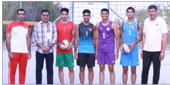
منتخب الناشئين خلال بدء التحضيرات

لاعبين من الناشئين في المعسكر التدريبي المزمع إقامته بمدينة إقليبييا بتونس في الفترة من 1 لغاية 10 أغسطس المقبل، لكن هذا الأمر مرهون بموافقة مجلس إدارة الاتحاد. وأشار الفردان بأن منتخب الناشئين بدأ تحضيراته ابتداءً من يوم الخميس الماضي بقيادة المدرب يونس الهدار، فيما سيبدأ منتخب الرجال تحضيراته بقيادة المدرب علي جعفر اليوم السبت على الملاعب الرملية بمدينة عيسى الرياضية.