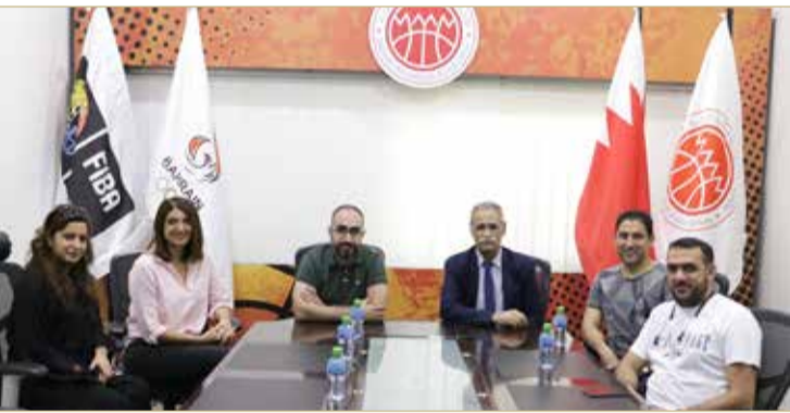
جانب من اجتماع لجنة التسويق والفعاليات

تهدف إلى وضع السياسات العامة والخطط التشغيلية