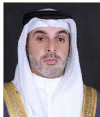
محمد بن دعيح

أشاد رئيس اللجنة البارالمبية البحرينية الشيخ محمد بن دعيح آل خليفة بالنتائج الايجابية المشرفة لمنتخب البحرين الوطني لذوي العزيمة في ختام ملتقى تونس الدولي لألعاب القوى لذوي العزيمة في نسخته الثالثة عشرة والمقام في الفترة من 25 يونيو الى 1 يوليو 2019 بالجمهورية التونسية، حيث أحرز المنتخب 9 ميداليات ملونة، منها ذهبيتان فضيتان و5 برونزيات، إضافة إلى حصول المملكة على الترتيب السادس عشر في الملتقى من بين 43 دولة مشاركة.