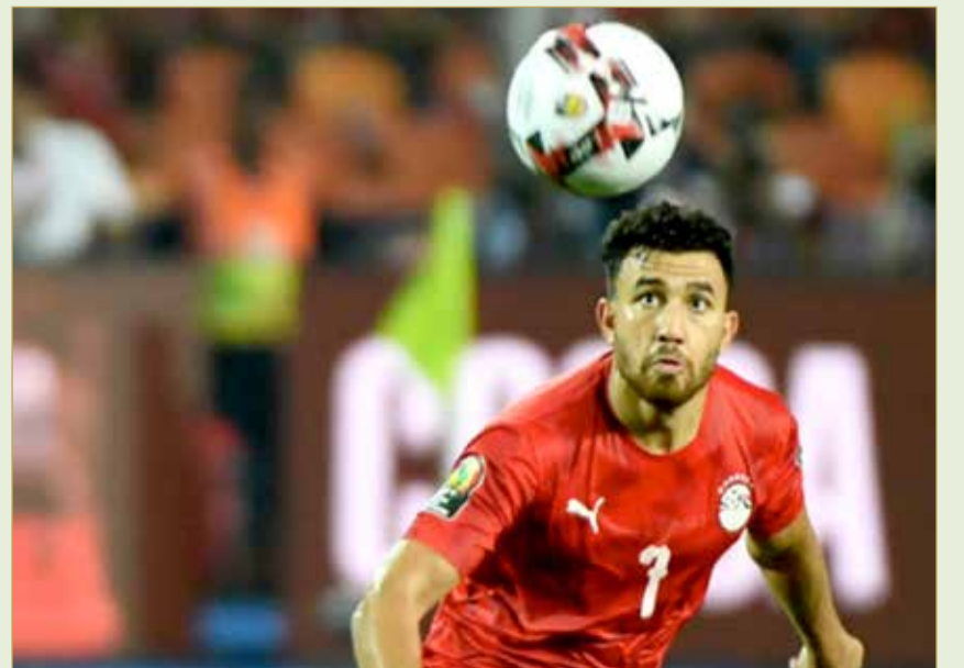
محمود حسن تريزيغيه

يختصر عبد الرحمن مواطنه تريزيغيه بمفردة "الجوكر"، فهو "كان يتمتع بموهبة السرعة والمهارة، يعرف كيف يسجل، يمرر... كنا نلعبه في أي مكان بحسب احتياج الفريق". في الملعب، شكل تريزيغيه محور الحركة الهجومية للمنتخب المصري، معتمداً بشكل أساسي على مهارة في المراوغة وتحطيم المدافعين، قبل التمركز نحو الهجوم إلى صلاح المتقدم يميناً، أو مروان محسن رأس الحربة الأساسي للفراعنة.