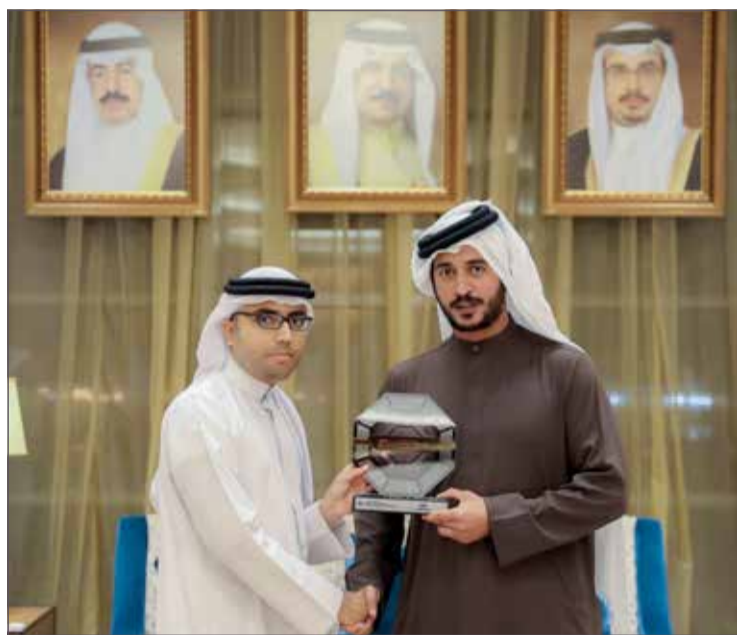
تكريم جريدة البلاد