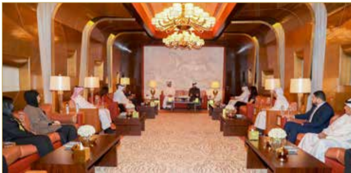
الذين قدموا مشاريع مبتكرة، عكست بصورة واضحة ما يتمتع به الشباب البحريني من قدرات وإمكانيات إبداعية وابتكارية، سيكون لها الأثر الواضح بالإسهام في تنفيذ المشاريع التنموية التي تخدم تطور ونماء المجتمع، متطلعا سموه في الوقت ذاته أن تشهد النسخة الثالثة من المسابقة المزيد

الثالثة بما يخدم تطورات سموه لدعم المجال العلمي، مضيفاً أن اللجنة تسعى لإبراز هذا الحدث على الشكل الذي يساهم في تطوير الحركة التعليمية وتكوين مجتمع قائم على المعرفة والابتكار، مشيراً إلى أن البحرين تزخر بالشباب المبدع والمحب للعلم والتعلم والذي يسعى أن يقدم الأفكار التي تساهم في تنمية مختلف المجالات الحياتية، مقدراً في الوقت ذاته جهود جميع العاملين في اللجنة المنظمة.