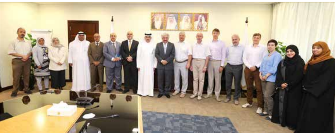
رئيس جامعة البحرين استقبل الرئيس التنفيذي للهيئة الوطنية لعلوم الفضاء

شراكة بين جامعة البحرين والهيئة الوطنية لعلوم الفضاء