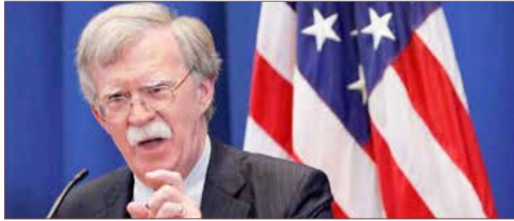
مستشار الأمن القومي الأميركي جون بولتون

قالت البعثة الأميركية في الوكالة الدولية للطاقة الذرية، أمس الجمعة، إن الولايات المتحدة طلبت اجتماعاً خاصاً لمجلس محافظي الوكالة المؤلف من 35 بلداً للبحث الملف الإيراني. وقال دبلوماسيون في الوكالة، إنهم يتوقعون عقد الاجتماع يوم الأربعاء المقبل بعدما قالت الوكالة هذا الأسبوع، إن إيران تجاوزت الحد الأقصى لمخزون اليورانيوم المنصوص عليه في الاتفاق النووي الموقع عام 2015 بين طهران والقوى العالمية.