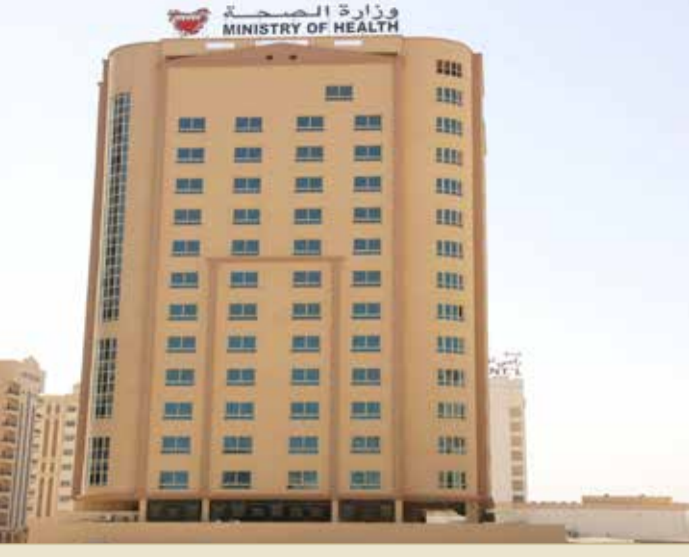
مبنى وزارة الصحة

اتخاذ الإجراءات الفورية بشأن شكوى لفيديو المشروب الغازي