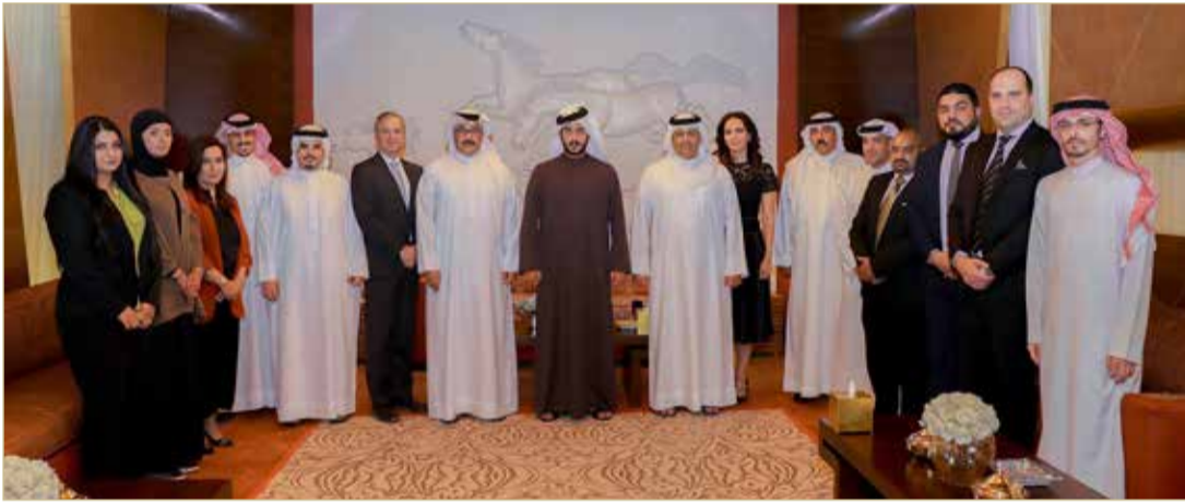
سمو الشيخ خالد بن حمد مستقبلاً رئيس مجلس أمناء جامعة بوليتكنك البحرين وعدداً من أعضاء اللجنة المنظمة لمسابقة سموه للابتكار في الذكاء الاصطناعي

خالد بن حمد يشيد بجهود اللجنة المنظمة لمسابقة سموه للذكاء الاصطناعي