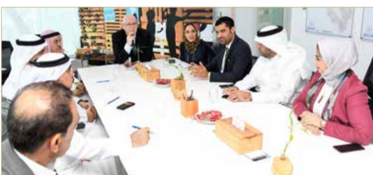
الوكيل المساعد للخدمات البلدية المشتركة يتحدث في اللقاء

وفد أمانة العاصمة يتفقد خدمات مركز "استدامة"