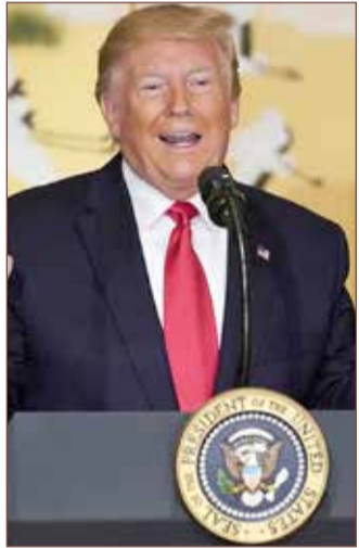
الرئيس الأميركي دونالد ترامب

قال الرئيس الأميركي دونالد ترامب، في خطابه للشعب الأميركي بمناسبة ذكرى الاستقلال إن الولايات المتحدة أقوى اليوم أكثر من أي لحظة أخرى على الإطلاق. وأضاف ترامب أن العلم الأميركي سيفرس قريباً على كوكب المريخ. “قبل 50 عاماً، شهد العالم انطلاق سفينة الفضاء أبولو وزرع علم أميركي على سطح القمر، سنعود إلى القمر قريباً وسنفرس العلم الأميركي على كوكب المريخ”.