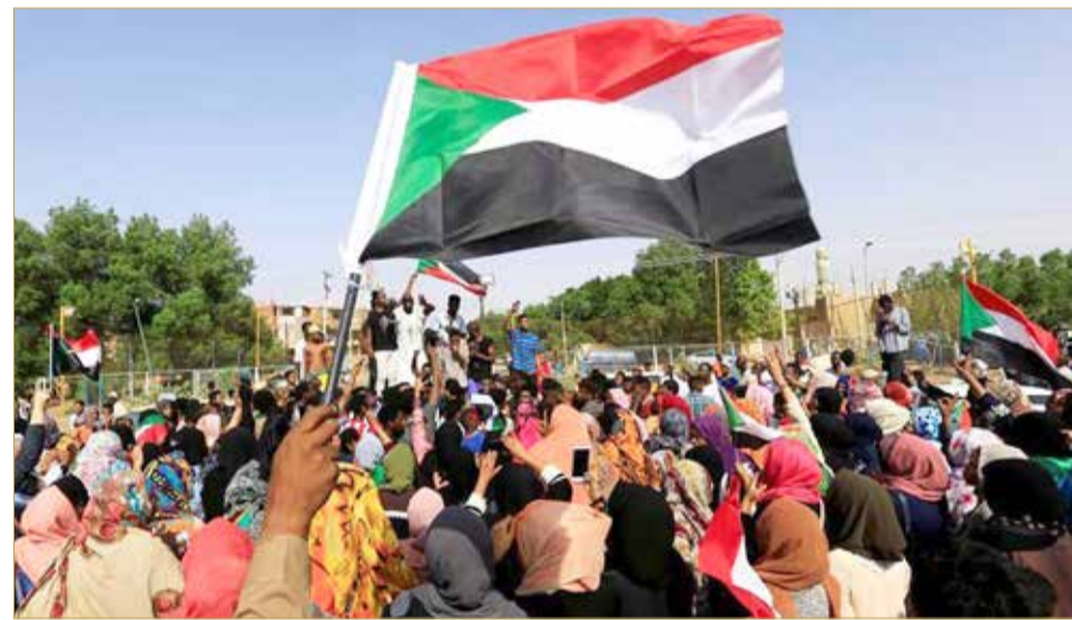
سودانيون يحتفلون بالتوصل إلى اتفاق بشأن اقتسام السلطة في الخرطوم

ترحيب عربي بنجاح مفاوضات ”المجلس العسكري“ و”قوى التغيير“