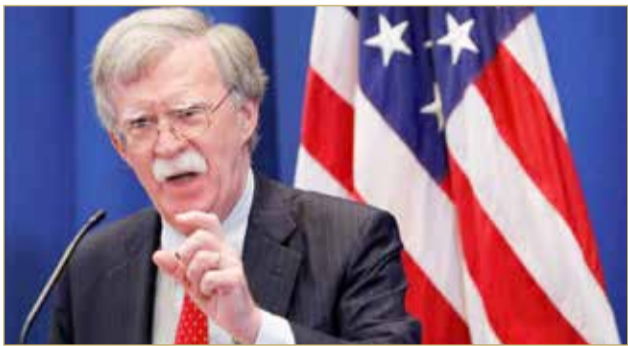
مستشار الأمن القومي الأمريكي جون بولتون