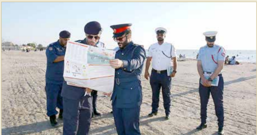
المنامة - وزارة الداخلية

لحفاة شرائح المجتمع طوال فصل الصيف الأمر الذي يعود بالخير على المواطنين كافة.