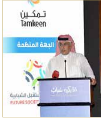
الزياني متحدثاً في الملتقى

أكد وزير الصناعة والتجارة والسياحة زايد الزياني أنه سيتم الانتهاء من تعديل قانون الإفلاس خلال هذا العام بالإضافة إلى مبادرتين أخريين. وقال الوزير إنه تم وضع خطة في العام 2018 وفق أطر واضحة ومعالم بناءة ذات 3 معايير أساسية لمدة 5 سنوات، وتهدف إلى أن يصبح حجم القطاع في الاقتصاد البحريني 40% من الناتج المحلي، والوصول إلى 20% من صادرات البحرين من هذا القطاع، وأن يصل عدد البحرينيين العاملين بالقطاع إلى 43 ألف عامل.