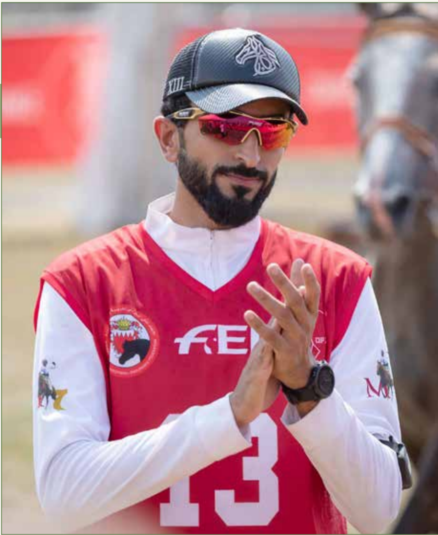
سمو الشيخ ناصر بن حمد

أكد مدرب الفريق الملكي أحمد جناحي أن مشاركة الفريق في السباق ستكون حافزاً كبيراً لأعضاء الفريق الملكي وتأكيد قدراته في السباقات العالمية، في ظل الخبرة والقدرات العالية التي يتمتع بها الفريق والجميع اكتسبها من سمو الشيخ