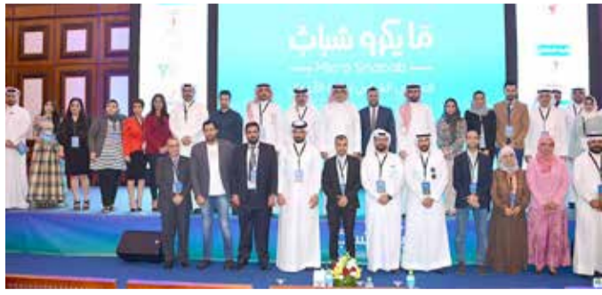
جانب من افتتاح ملتقى "مايكرو شباب"