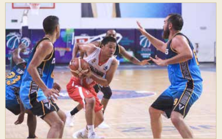
جانب من المباريات