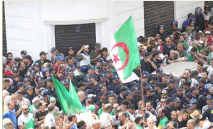
شهدت الجزائر منذ 22 فبراير الماضي حراكاً شعبياً واسعاً

◆ حضور متنوع في منتدى الحوار الوطني بالجزائر