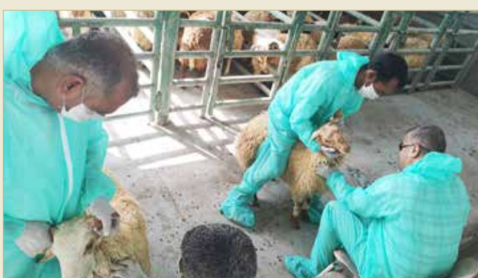
من عمليات الفحص

ويصبح مصدرًا إضافيًا للعدوى، إلا أن الفيروس لا يبقى لفترة طويلة خارج جسم الحيوان المضيف، وتم اكتشاف المرض لأول مرة في ساحل العاج عام 1942، ومن ثم انتشر المرض بعد ذلك ليتم تسجيله في 70 دولة في أفريقيا والشرق الأوسط و آسيا، وتضارف الدول تنسيقها مع المنظمات الدولية ذات العلاقة من خلال المبادرات لاستئصال المرض وللحد من الخسائر الاقتصادية للثروة الحيوانية لديها، فمبادرة استئصال طاعون المجترات الصغيرة تم تصميمها على غرار حملة استئصال مرض طاعون الأبقار- وهو مرض مشابه يصيب الأبقار والجواميس البرية وحيوانات برية أخرى - التي تم على إثرها إعلان خلو العالم من المرض عام 2011، وكانت المرة الأولى التي يعلن فيها عن استئصال مرض حيواني من جميع أنحاء العالم.