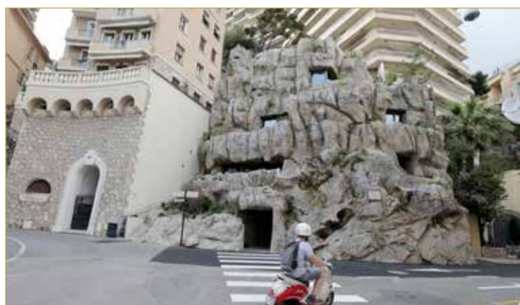
فيلا "تروجلودي" داخل جرف صخري في موناكو يوم 4 يوليو الجاري

وشيدت فيلا "تروجلودي" داخل جرف صخري كانت تعلوه قرية حصينة تعود إلى القرن العاشر قبل الميلاد وتبلغ مساحتها 220 متراً تقريبا وتتألف من 6 طوابق و3 غرف نوم و3 حمامات ومسبح. وتضم البناية وحدة مصغرة لمعالجة المياه