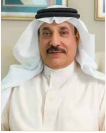
وزير العمل والتنمية الاجتماعية

الخطة الوطنية؛ لتعزيز الانتماء الوطني وترسيخ قيم المواطنة، وهما مبادرة "سجل الخبراء" التي تنفذها الوزارة بالتعاون مع هيئة المعلومات والحكومة الإلكترونية، ومبادرة "من أملك" التي تنفذها الوزارة بالتعاون مع ديوان الخدمة المدنية، حيث تم تشكيل لجان تنفيذية مختصة تعمل على تنفيذ المبادرات، ووضع الخطط التنفيذية والإعلامية اللازمة بالتعاون والتنسيق مع الجهات ذات العلاقة.