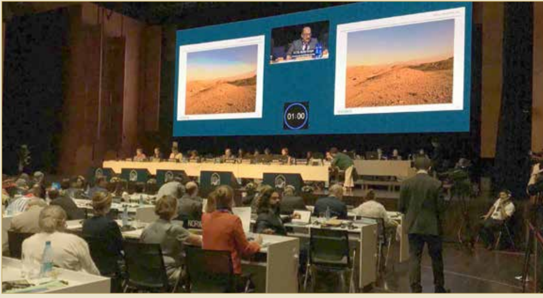
المنامة - هيئة الثقافة والآثار

أدرجت أمس، لجنة التراث العالمي موقع "تلال مدافن دلمون" على قائمة التراث العالمي لمنظمة الأمم المتحدة للتربية والعلم والثقافة (يونسكو) خلال اجتماع للجنة الثالث والأربعين في العاصمة الأذربيجانية باكو. ويعد موقع تلال مدافن دلمون ثالث مواقع البحرين على قائمة التراث العالمي بعد موقع قلعة البحرين الذي أدرج العام 2005 وموقع طريق اللؤلؤ في المحرق، والذي أدرج على القائمة العام 2012.