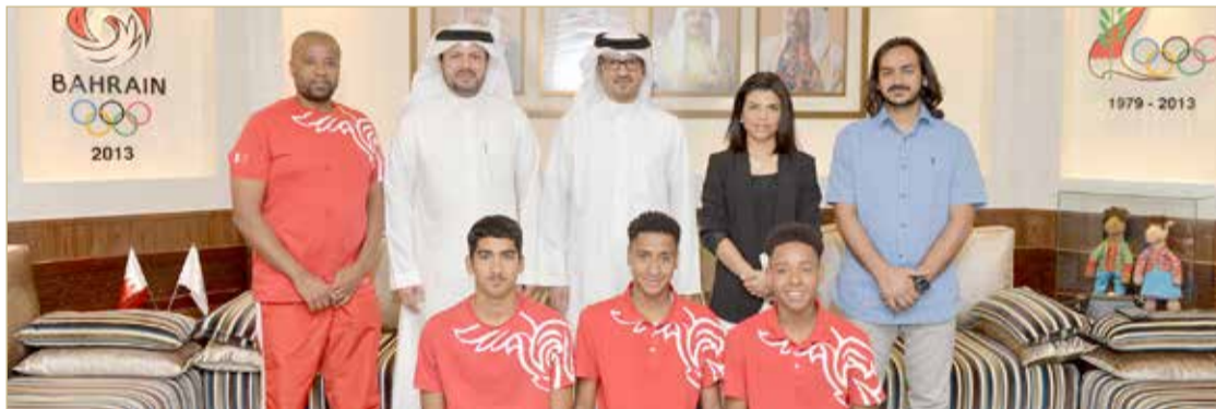
النصف يتوسط منتخب الترايثلون

مساندة للاتحاد، مؤكداً أن هذا الإنجاز ثمرة لما توفره اللجنة الأولمبية من دعم للاتحادات لتحقيق أفضل النتائج والمستويات، متمنياً أن تستمر إنجازات الترايثلون لتكون واجهة مشرفة لمملكة البحرين بمختلف المحافل الخارجية.