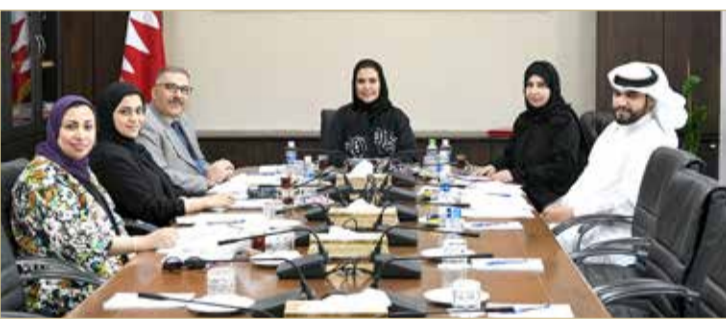
من اجتماعات اللجنة

تعمل اللجنة العلمية لمؤتمر “نعمل معاً من أجل تحقيق تطلعات تشريعية“، برئاسة جهاد الفاضل، على استكمال عملها بشأن حصر وجمع كل الآراء والتوصيات الصادرة عن المؤتمر لعرضها في الاجتماع المقرر عقده الثلاثاء المقبل لمناقشة التوصيات التي اعتمدها المؤتمر، وبحث سبل متابعتها من خلال الصلاحيات الدستورية والقانونية لمجلس الشورى.