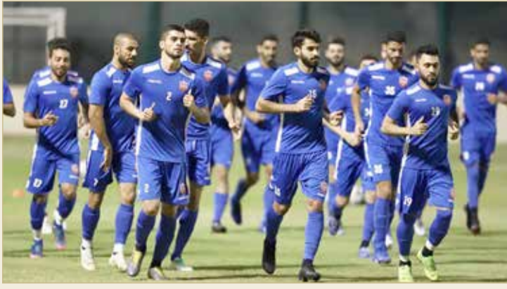
من تدريبات المنتخب الأول

المنتخب الوطني الأول واصل تحضيراته خلال الأيام الماضية على فترتين صباحية ومساءية مع دخول اللاعبين في معسكر داخلي بفندق "داون تاون روتانا"، وأقيمت