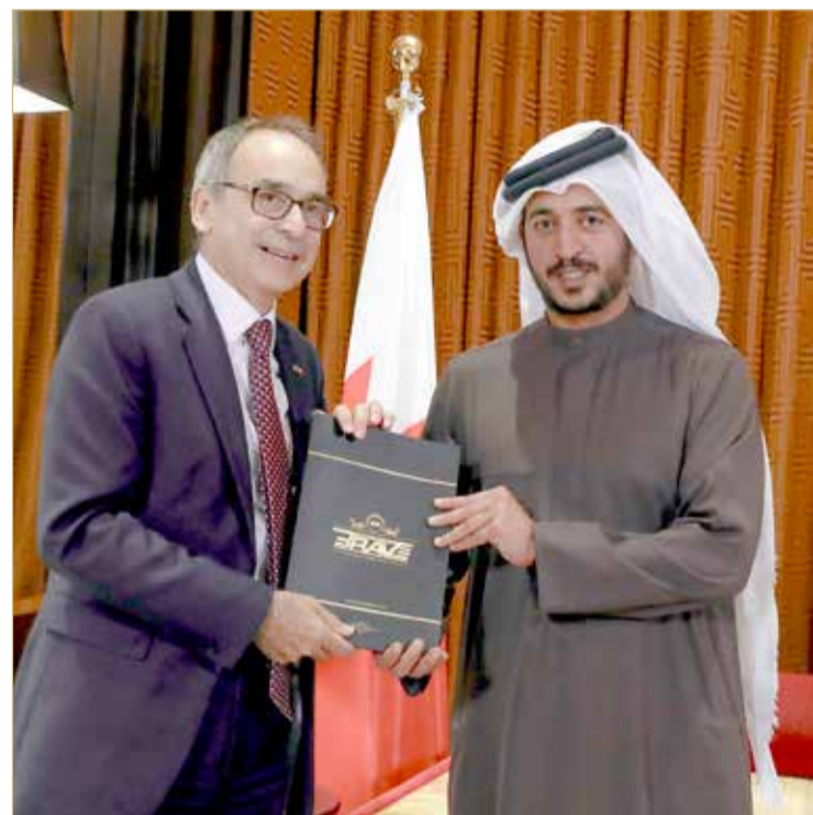
سمو الشيخ خالد بن حمد مع السفير البريطاني

سموه يشيد بالعلاقات ويبحث سبل تطوير رياضة فنون القتال المختلطة