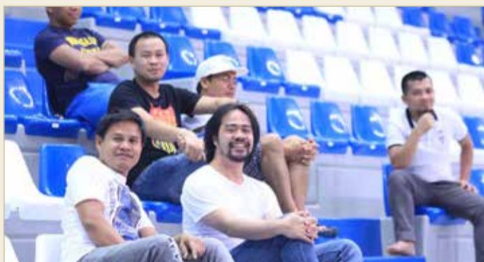
من حضور الدوري