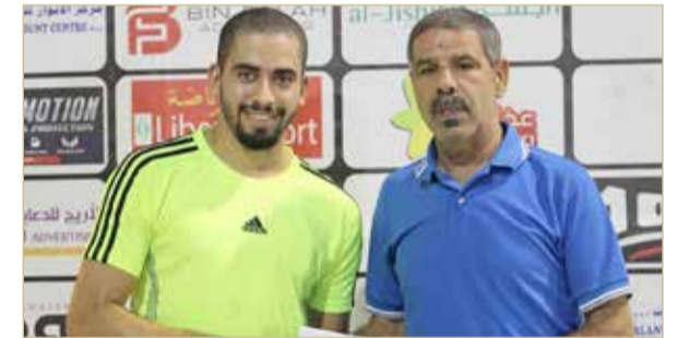
تكريم أفضل لاعب