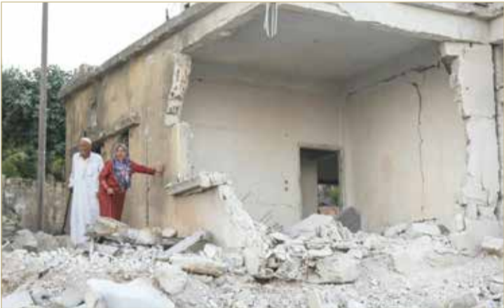
سوريان يتفقدان الدمار غداة قصف جوي لقوات النظام

◆ مسؤول أممي: استمرار الهجمات على المناطق المدنية مروغ