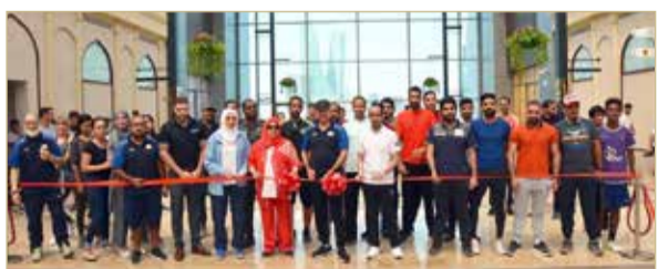
لحظة تدشين البرنامج