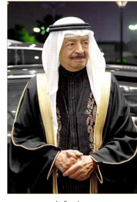
سمو رئيس الوزراء

جاء أمر رئيس الوزراء صاحب السمو الملكي الأمير خليفة بن سلمان آل خليفة، بإعادة بناء وتوسعة جامع الجسرة امتداداً لرعاية سموه لبيوت الله وبذل الإمكانيات كافة؛ لتكون المساجد قادرة على استيعاب مزيد من المصلين وبما يتناسب مع حاجة الأهالي في كافة المناطق وتوفير الراحة لهم في تأدية شعائرتهم بكل يسر وسهولة، إلى جانب حرص سموه المتواصل على تطوير وتوسعة المساجد والجوامع في البحرين، بما يدعم دورها في خدمة الإسلام والمجتمع، ولما لها من مكانة عظيمة في الدين الإسلامي.