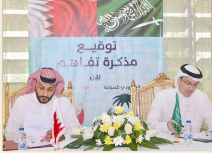
توقيع مذكرة التفاهم