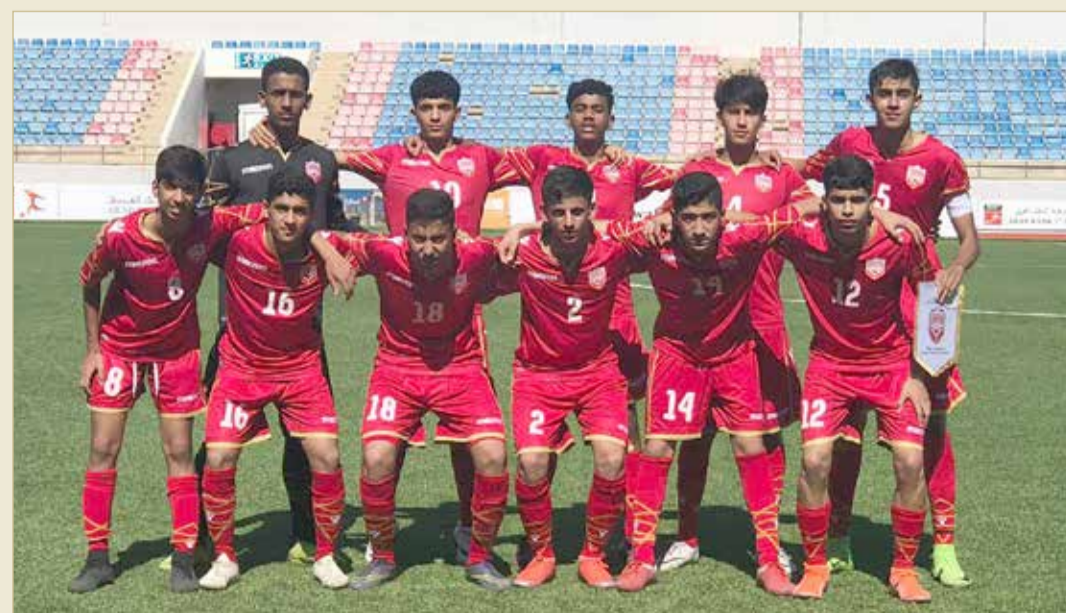
منتخب الناشئين لكرة القدم

يواجه العراق اليوم في بطولة غرب آسيا لكرة القدم