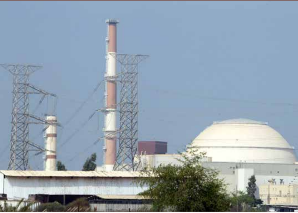
صورة تعود إلى 20 أغسطس 2010 لجزء من مفاعل بوشهر النووي الواقع في جنوب إيران

◆ طهران ترفع مستوى تخصيب اليورانيوم إلى 5 %