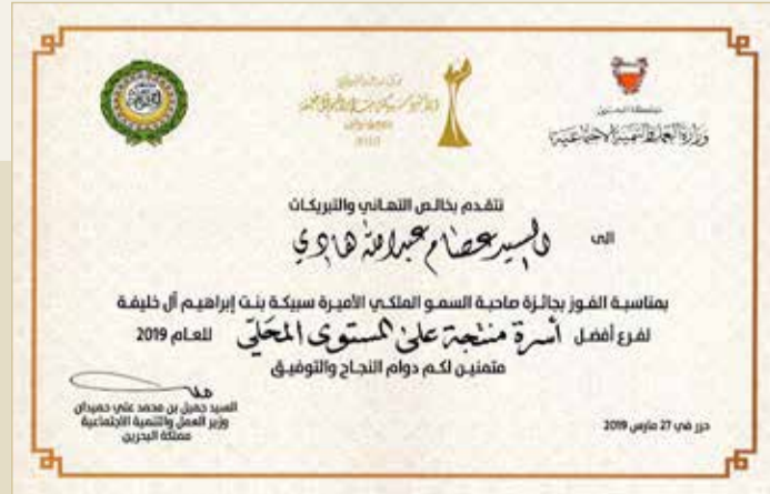
شهادة جائزة سمو الأميرة سبيكة

« حصلت على جائزة سمو الأميرة سبيكة لتشجيع الأسر المنتجة 2019 وكنت سعيد جدًا للفوز بالجائزة، وأفخر بالحصول عليها، وشعرت أنني أنجزت شيئًا كبيرًا، والفوز بالجائزة بعد حافزًا، خصوصًا لنا كأسر منتجة؛ لإنجاز المزيد وتطوير العمل باستمرار. كما أن المنتجات البحرينية تحتاج إلى دعم؛ لأن منتجنا مكتوب عليه "صنع في البحرين" وهو أمر مهم جدًا. وبعد الفوز سافرت إلى معرض كانتوم في الصين، وأعمل حاليًا مع الصين لجلب منتجات ومعدات جديدة لتغيير طريقة القهوة العربية.