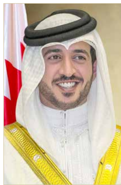
سمو الشيخ خالد بن حمد

وكان سمو الشيخ خالد بن حمد آل خليفة قد أصدر قراراً بشأن تعديل النظام الأساسي الموحد للاتحادات الرياضية بإضافة مادة جديدة تحت رقم (4 مكرر). وتنص المادة على التالي (الرئيس اللجنة الأولمبية تأسيس اتحادات رياضية مركزية تحت اسم "مجالس رياضية" يشرف كل منها إدارياً ومالياً وفيها على أنشطة وخطط وبرامج وفعاليات عدد من الاتحادات الرياضية. ويكون لكل مجلس رياضي مجلس إدارة يتم تعيينه بقرار من رئيس اللجنة الأولمبية من رئيس وخمسة أعضاء... وتسري على المجالس الرياضية والاتحادات الرياضية التابعة لها أحكام هذا النظام واللوائح الموحدة الصادرة عن اللجنة الأولمبية وفيما لا يتعارض مع طبيعة هذه المجالس الرياضية).