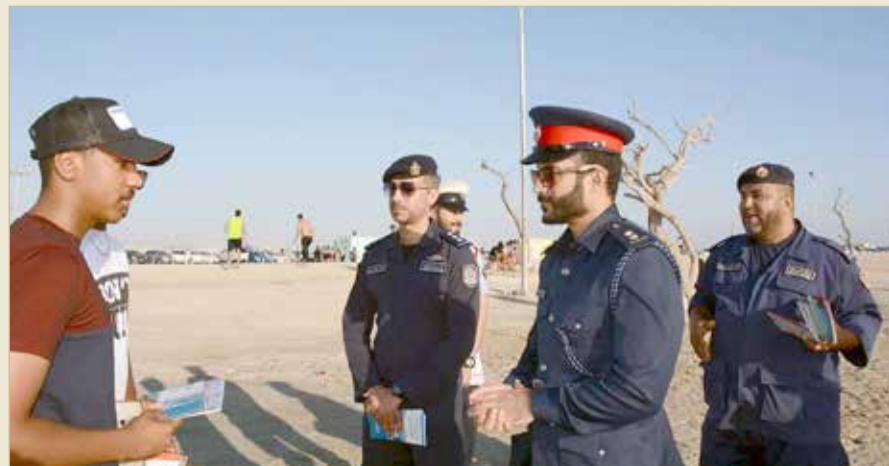
جانب من الحملات التوعوية