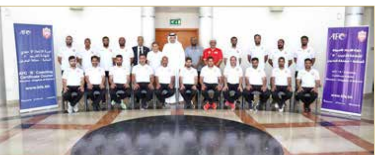
البوعيين يتوسط الدارسين