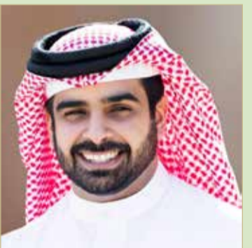
الشيخ سلمان بن محمد

سلمان بن محمد يهنئ بنجاح النسخة 24 للقتال الشجاع في لندن