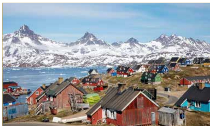
جبال يغطيها الجليد في بلدة بغرينلاند.

وقالت كلير نوليس وهي متحدثة باسم المنظمة العالمية للأرصاد الجوية التابعة للأمم المتحدة، في إفادة صحافية "وفقاً للتوقعات تلك الكتلة الجوية ستنتقل الآن تلك الحرارة صوب غرينلاند وهذا مبعث