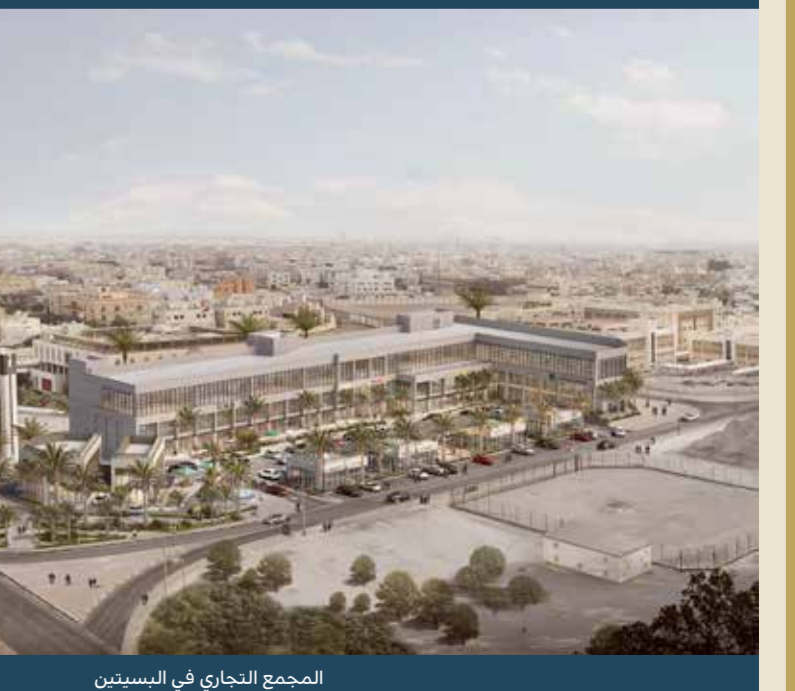
المجمع التجاري في السبطين

المرحلة تتطلب ضرورة العمل في صنع الحاضر والمستقبل وتحقيق مزيد من الإنجازات