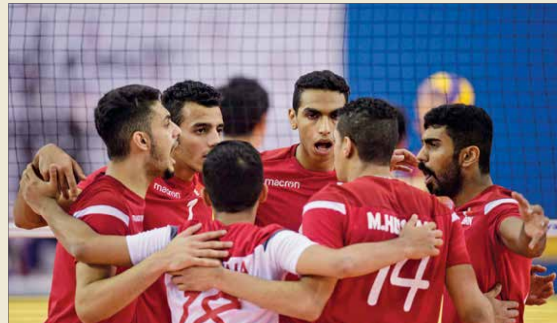
منتخبنا الوطني يواجه كوريا اليوم

حقق المنتخب التونسي فوزا صعبا على حساب بورتوريكو بنتيجة 3/2 (22/25، 25/18، 28/26، 12/15) في مواجهة