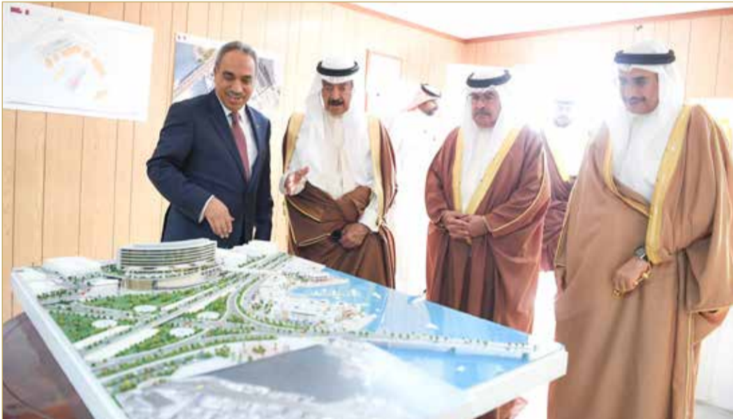
توجيهات سمو رئيس الوزراء تعكس الحرص على استنصاء المتطلبات التنموية