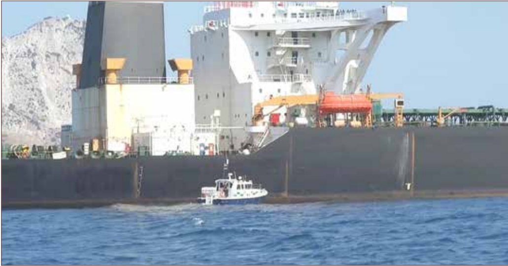
لندن طرحت مبادرة لحماية الملاحة في مضيق هرمز

أعلن البيت الأبيض، أمس الجمعة، أن الرئيس الأمريكي دونالد ترامب ملتزم بحماية مصالح واشنطن وحلفائها ضد تهديدات إيران في مضيق هرمز. وأضاف البيت الأبيض أن ترامب يرغب في مساعدة رئيس الوزراء البريطاني بوريس جونسون لحل أزمة الناقل البريطانية المحتجزة في إيران.