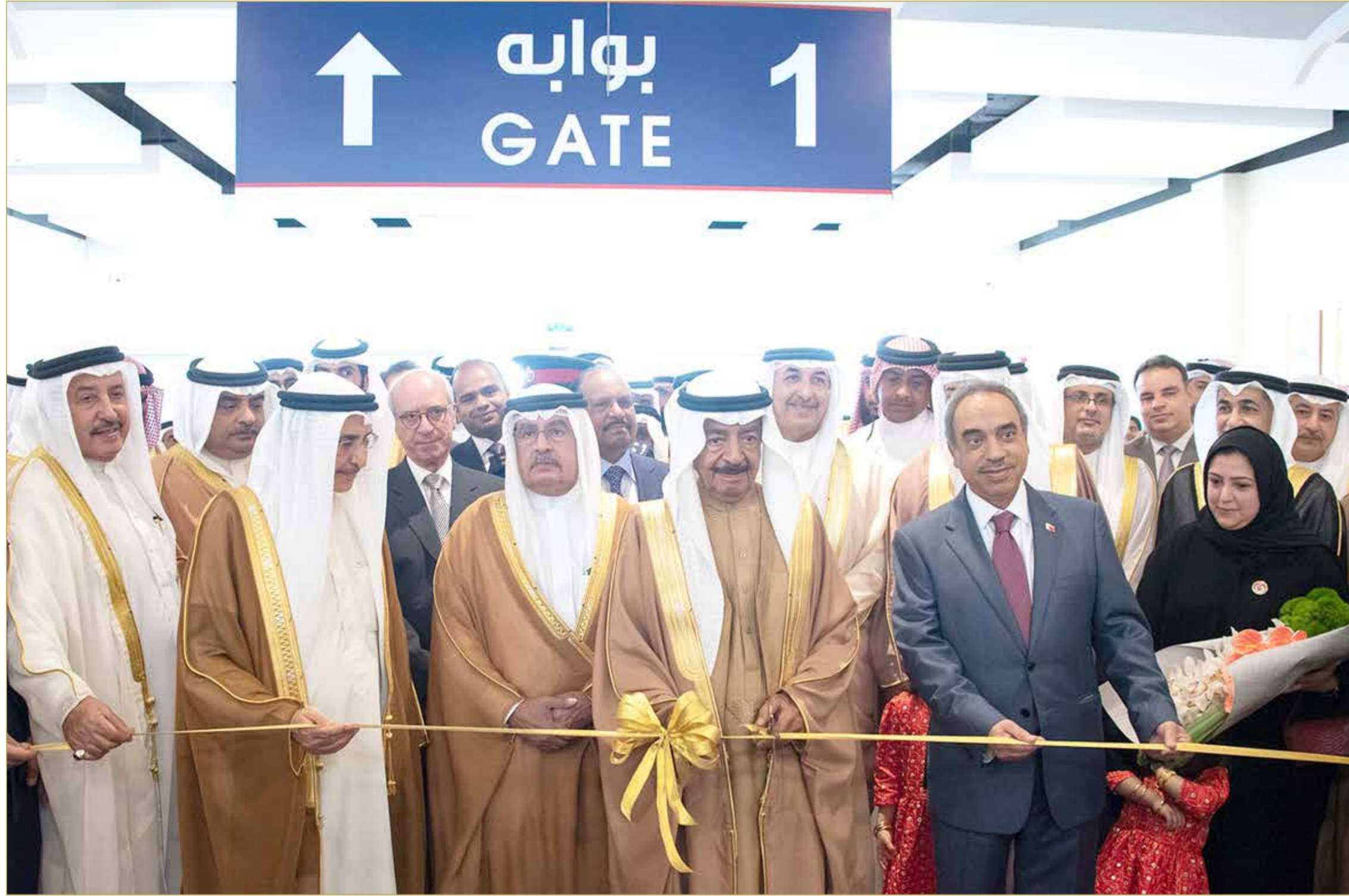
سمو رئيس الوزراء حريص على استمرار عجلة المشروعات التنموية والتطويرية في المحرق (أشفيق)

◆ توجيهات سمو رئيس الوزراء بالإسراع في تنفيذ مشروعات المحرق تؤكد الحرص على مسار التنمية