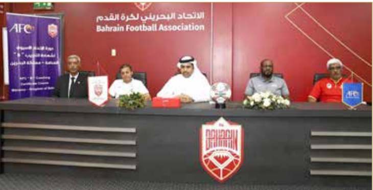
من افتتاح الدورة