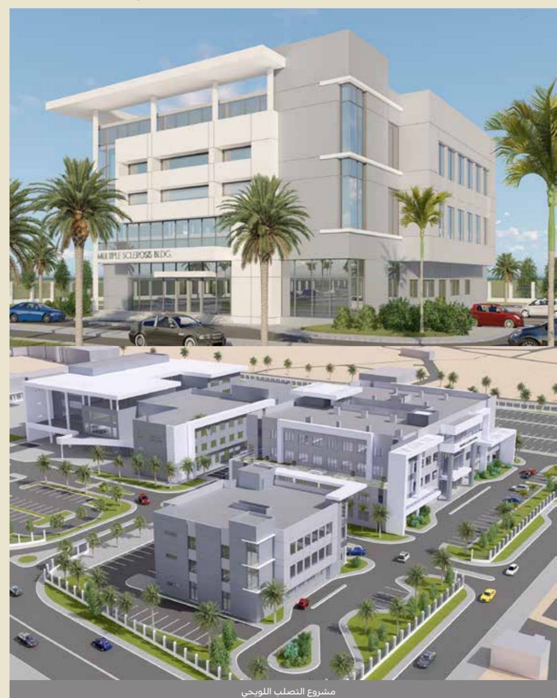
مشروع التصلب اللويحي

لقد أدركت الحكومة أن هذه المرحلة تتطلب إحرص صاحب السمو الملكي رئيس الوزراء على تحقيقه من خلال توجيهاته للمسؤولين وزيارته الميدانية لمواقع العمل، حرصاً من سموه على توفير أفضل وأرقى مستوى من الخدمات في مختلف مدن وقرى البحرين.