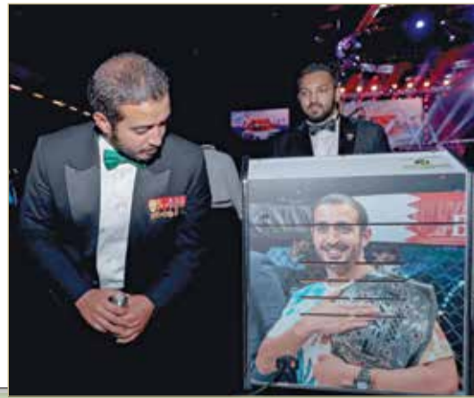
سمو الشيخ خالد بن حمد خلال متابعته للمنافسات