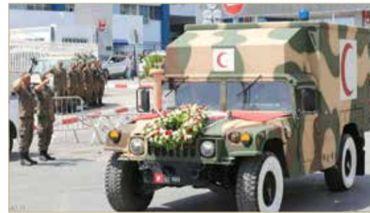
جثمان السبسي نقل من المستشفى العسكري إلى قصر قرطاج

أعلن رئيس الحكومة التونسية يوسف الشاهد، أنه سيتم تنظيم جنازة وطنية كبرى بحماية الجيش التونسي، اليوم السبت، لتوديع الرئيس الراحل الباجي قايد السبسي.