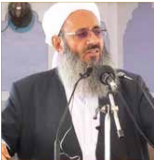
الشيخ عبدالحامد إسماعيل زهي

انتقد الزعيم السني البارز في إيران، الشيخ عبدالحامد إسماعيل زهي، في تصريحات غير مسبقة، تدخلات طهران الخارجية وكذلك هيمنة الحرس الثوري على الحياة السياسية والاقتصادية في البلاد. وقال إسماعيل زهي في مقابلة، نُشرت الخميس "لا ينبغي السماح لأفراد ومؤسسات الدولة في أي بلد بالقيام بأنشطة عسكرية في بلدان أخرى، لأنه سيكون ضد المصالح الوطنية لتلك البلدان". (12)