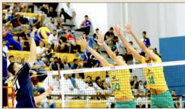
إيران أسقطت البرازيل