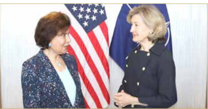
سعادة السفيرة بهية الجشي