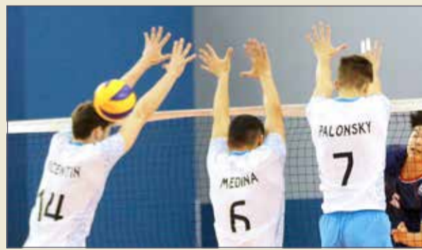
من لقاء إيطاليا وروسيا