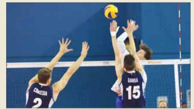
إيطاليا عبرت روسيا وتأهلت للنهائي