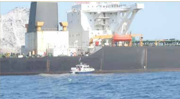
لندن طرحت مبادرة لحماية الملاحة في مضيق هرمز

بحرية بقيادة أوروبية لتأمين الشحن عبر مضيق هرمز بمجرد حصولها على مزيد من الإيضاح لشكل مثل هذه المهمة. وأعلنت الدنمارك، أمس، أنها رحبت باقتراح بحرية بقيادة أوروبية لتأمين الشحن عبر مضيق هرمز بمجرد حصولها على مزيد من الإيضاح لشكل مثل هذه المهمة. وأعلنت الدنمارك، أمس، أنها رحبت باقتراح