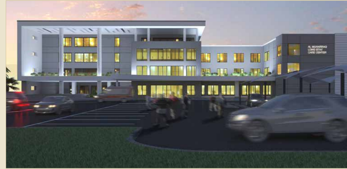
مشروع مركز العناية الخاصة

توجيهات سموه، حيث وجه سموه إلى استكمال مشروع تطوير خدمات الرعاية الصحية ومنها إنشاء مركز التصلب اللويحي ومركز العناية الخاصة ضمن مجمع المحرق الطبي، بهدف الارتقاء بالمنظومة الصحية من خلال التوسع في المشروعات الطبية لتعزيز منظومة الرعاية المتكاملة والعمل على استدامة الخدمات الصحية وفق أفضل المعايير الدولية.