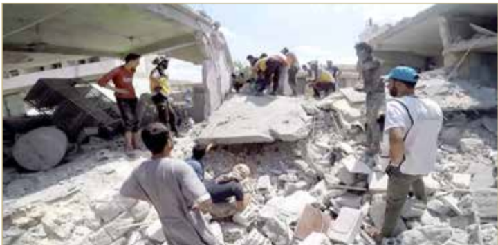
مسعفون بموقع غارة جوية في إدلب بسوريا يوم 17 يوليو الجاري.

قالت مفوضة حقوق الإنسان بالأمم المتحدة، ميشيل باشليه، أمس الجمعة، إن ضربات جوية نفذها النظام السوري وحلفاؤه على مدارس ومستشفيات وأسواق ومخازن أسفرت عن مقتل ما يقل عن 103 مدنيين في الأيام العشرة الماضية بينهم 26 طفلاً.