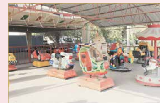
من ألعاب الحديقة المائية

والسينما ذكريات لا تنسى أيام الأعياد زمان.