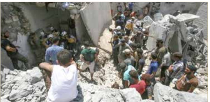
موقع غارة لقوات النظام في شمال غرب سوريا

حماه وفي إدلب واللاذقية إلى مقتل 23 من قوات النظام 32 مقاتلاً من الفصائل بينهم 25 جهادياً، وفق المرصد السوري لحقوق