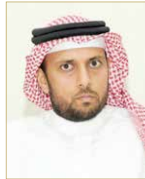
رئيس اتحاد الدراجات الهوائية

سمو الشيخ ناصر إلى وزير الشباب والرياضة أيمن المؤيد لحل ملف مستحقات الرياضيين والإداريين والفنيين وديون الأندية بتوجيه من جلالة الملك المفدى، هو تأكيد لرعاية جلالة واهتمامه بالقطاع الرياضي، مما يعث بالاعتزاز والفخر لدى الأسرة الرياضية في المملكة، منوها كذلك بالجهود المبذولة من سمو الشيخ خالد بن حمد آل خليفة رئيس اللجنة الأولمبية البحرينية، التي تصب في دعم الحركتين الشبابية والرياضية من أجل المحافظة على المكاسب وتحقيق المزيد من النجاحات.