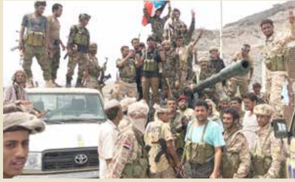
مقاتلو الحركة الانفصالية الجنوبية في خور مكسر في عدن (8 - 14)

طلب تحالف دعم الشرعية في اليمن بقيادة السعودية وقفا فوريا لإطلاق النار في العاصمة اليمنية المؤقتة عدن اعتبارا من الواحدة فجر الأحد بتوقيت اليمن.