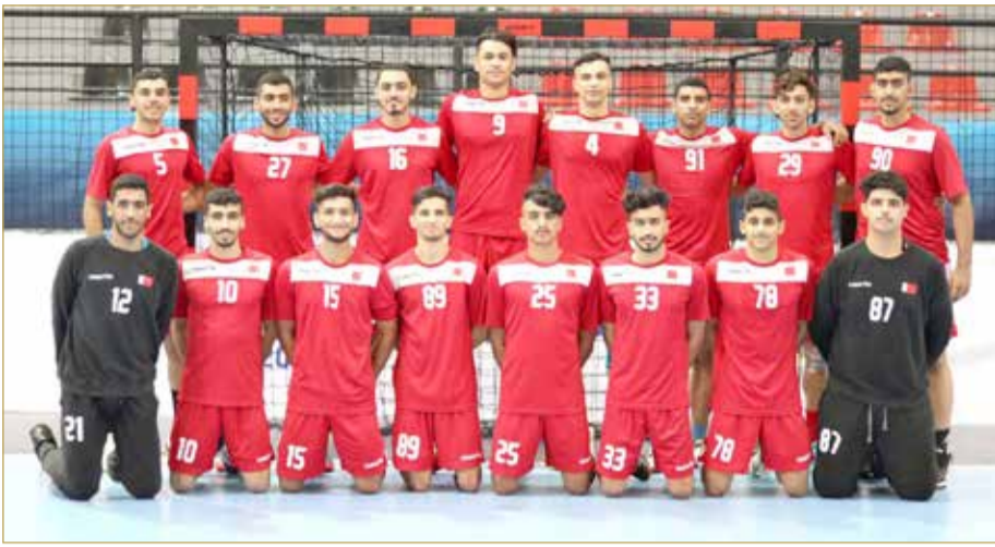
منتخبنا الوطني للناشئين لكرة اليد

وأمام مقدونيا بفارق هدفين، وهو ما أعطى منتخبنا أحقية التقدم في مراكز الترتيب على نظيره الأرجنتيني. اقتصر برنامج الاستعداد لمباراة اليوم على التدريب الصباحي في صالة المباراة وفيها ركز المدرب الأيسلندي على الأخطاء التي وقع فيها لاعبونا أمام مقدونيا وإيجاد الحلول المناسبة لمعالجة المشكلات الفنية وإعادة تنظيم وضعية الفريق في تطبيق الطرق الدفاعية والهجومية، وفي الفترة المسائية دخل الفريق في اجتماع فني وتم فيه مشاهدة فيديو للمباراة السابقة وتم عرض بعض اللقطات لمنتخب الأرجنتين وطريقة أداءه لمعرفة مراكز القوة والضعف لديه.