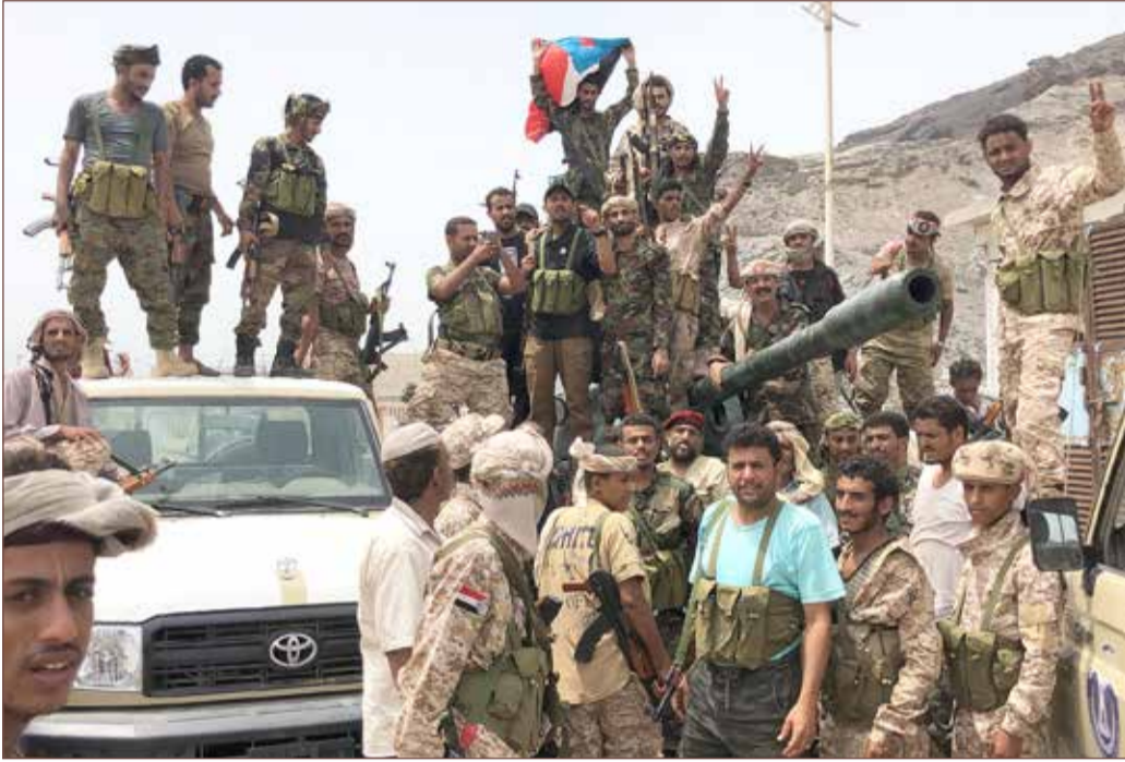
مقاتلو الحركة الانفصالية الجنوبية في خور مكسر بمدينة عدن الساحلية

بسطت قوات الحزام الأمني في اليمن، أمس السبت، سيطرتها على قصر المعاشيق الرئاسي في عدن، بعد مفاوضات مع ضباط وجنود كانوا بداخله. ويأتي هذا التطور في محافظة عدن بعد معارك بين قوات الحزام الأمني وقوات الحماية الرئاسية لليوم الرابع على التوالي، سقط في عدد من القتلى والجرحى. وقالت المصادر اليمنية إن قوات الحزام الأمني تمكنت فجر السبت، وبعد مواجهات مع قوات الحماية الرئاسية، من السيطرة على المعسكر التابع "لواء الثالث حماية رئاسية".