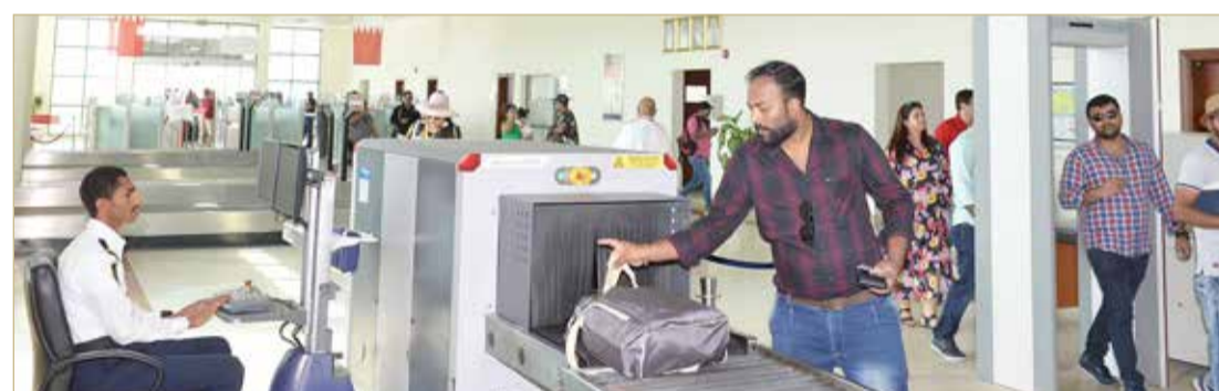
موظفو الجمارك أنهوا إجراءات دخول المسافرين بكل يسر وسهولة

♦ سفينة سياحية على متنها أكثر من 2200 شخص