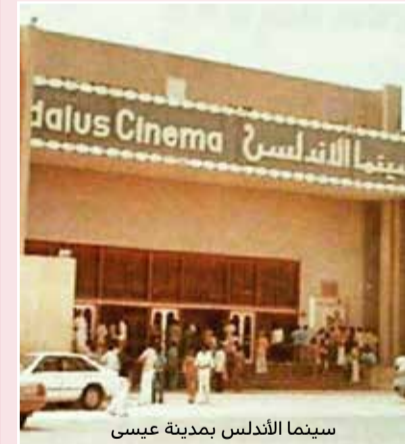
سينما الأندلس بمدينة عيسى