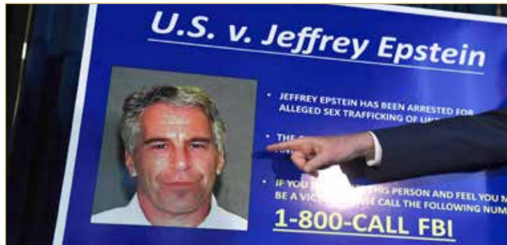
ورفض في 18 يوليو طلب الملياردير، الذي تقدر ثروته بما يزيد على 500 مليون دولار، إطلاق سراحه بكفالة.

ووفق صحيفة "نيويورك تايمز" الأميركية فقد أقدم إيبستين البالغ 66 عاماً على الانتحار شنقاً في زنزانته وعثر على جثته صباح أمس، نقلاً عن مسؤولين لم تكشف أسماءهم، وسبق أن عثر على إيبستين أواخر يوليو على الأرض في زنزانته في مركز ميتروبوليتان الإصلاحية