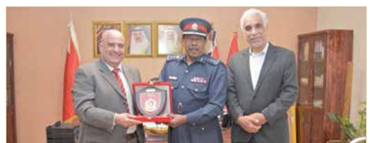
المدير العام للدفاع المدني يلتقي نائب الرئيس التنفيذي رئيس لجنة الصحة والسلامة بشركة "بابكو"

♦ الوقوف على الخطط المشتركة وسيناريوهات الاستجابة الفاعلة