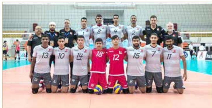
منتخب الكرة الطائرة لفئة الشباب

أنهى منتخبنا لكرة الطائرة لفئة الشباب، مشوار البطولة الآسيوية تحت 23 عامًا، والمقامة حالياً في ميانمار، باحتلاله المركز 12، وذلك بعد خسارته (3-0) أمام منتخب تايلند، في المباراة التي جمعتهم، أمس، ضمن منافسات المباريات التمهيدية. وجاءت نتائج الأشواط كالتالي لمنتخب تايلند (23/25)، (25-21) و(24/26). واحتل منتخبنا المركز 12 من بين 16 منتخباً مشاركاً.