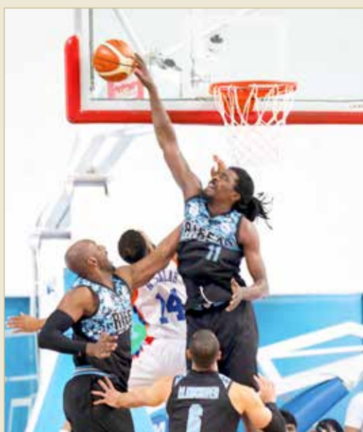
من مشاركة اللاعبين المحترفين في الجولة الأولى