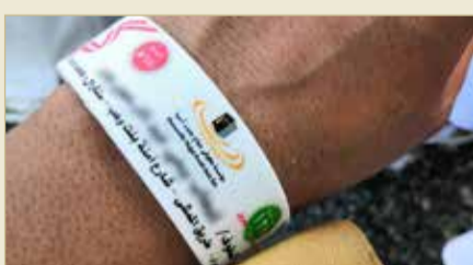
تسترد بعض الحملات الأساور لتفويج حجاج