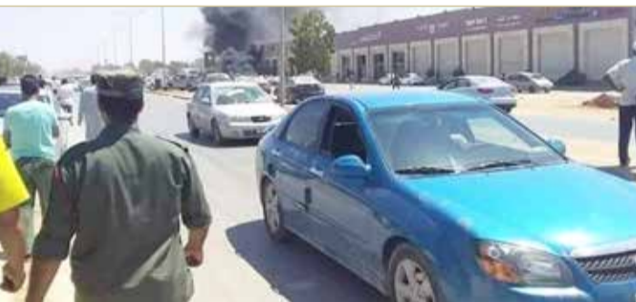
من موقع انفجار السيارة في بنغازي

الليبي. وقال مسؤولون إن الانفجار وقع خارج مركز تسوق "أركان" في حي "الهوري"، حيث تجمع الناس لشراء مستلزمات عيد الأضحى.