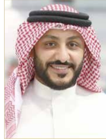
رئيس الاتحاد البحريني للسباحة

بن حمد آل خليفة النائب الأول لرئيس المجلس الأعلى للشباب والرياضة، ومن الأمين العام للجنة الأولمبية البحرينية محمد النصف، في تطوير المنظومة الرياضية والشبابية.