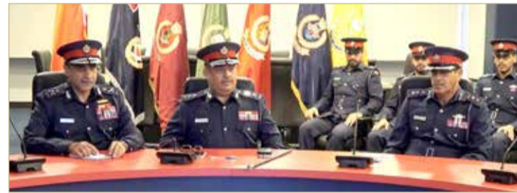
رئيس الأمن العام في زيارة لقيادة خفر السواحل

♦ رئيس الأمن العام: مخرجات الدورات التدريبية تسهم في رفع الجاهزية