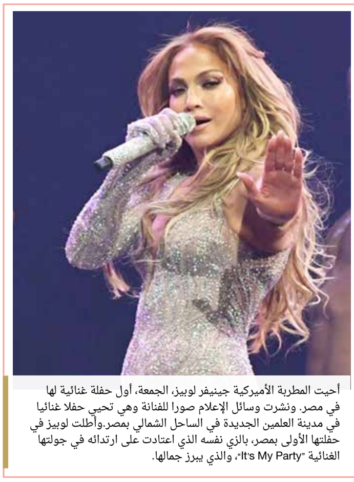
أحيت المطربة الأميركية جينيفر لوبيز، الجمعة، أول حفلة غنائية لها في مصر. ونشرت وسائل الإعلام صوراً للفنانة وهي تحيي حفلاً غنائياً في مدينة العلمين الجديدة في الساحل الشمالي بمصر. وأطلقت لوبيز في حفلتها الأولى بمصر، بالزي نفسه الذي اعتادت على ارتدائه في جولتها الغنائية "It's My Party"، والذي يبرز جمالها.

واعتقلت الشرطة رجلاً يبلغ عمره 45 عاماً طعن أحد أفراد هيئة التمريض ولاذ بالفرار. وأصيب الشخصان الآخران والشرطي أثناء محاولتهم اعتقال الجاني. والجريمة العنيفة نادرة في اليابان وتقع معظم الجرائم باستخدام سكاكين أو سيوف بسبب قوانين البلاد الصارمة بشأن الأسلحة النارية. وفي مايو أيار طعن رجل بسكين مجموعة من التلميذات عند إحدى محطات الحافلات مما أدى إلى مقتل تلميذة وإصابة 16 تلميذة أخرى في حادث أصاب اليابان بصدمة.