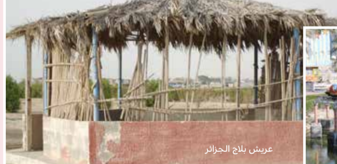
عريش بلّاح الجزائر