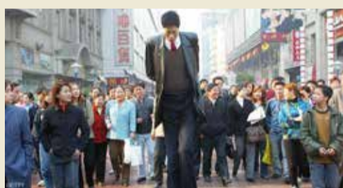
أحد أطول الرجال بالصين ويبلغ ارتفاعه 2.42 متر.

تدرجياً. ويضيف: "في الواقع تنمو الأجنة زهاء 20 مرة أسرع من الأطفال، الذين أعمارهم 5 سنوات، ويزداد نشاط صفائح النمو عند المواليد الجدد، مما يجعلها تنمو بسرعة".