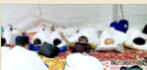
المخيم منكم بالحجاج بسبب قبول عدد أكبر بالحملة