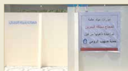
وضعت حملة لافتة بأن الحمامات عامة وأنها أملتها

الحملة من الحجاج الأساور التي تؤذن بدخولهم قطار المشاعر والمخيم، والسبب معروف: لإعادة استخدام هذه الأساور لتفويج عدد آخر من الحجاج، وهو ما أدى لاكتظاظ المخيم بمزيد من الحجاج، وبحيت لا يستوعب المخيم التكدس، وبما يؤدي لتقلص مساحة الحاج بالمخيم. «إنني أوم بشكل كبير بعض أصحاب الحملات الذين لوثوا طهارة الموسم