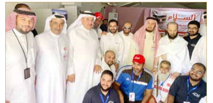
القنصل ورئيس البعثة وسط كادر إحدى الحملات