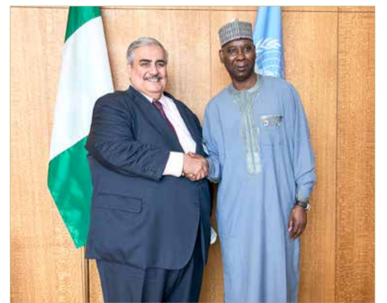
وزير الخارجية مع رئيس الدورة الرابعة والسبعين للجمعية العامة للأمم المتحدة

وخلال الاجتماع، تقدم وزير الخارجية بالتهنئة لباندي على ما حظي به من ثقة من قبل الدول الأعضاء بالأمم المتحدة وانتخابه رئيساً للدورة الحالية للجمعية العامة، متمنياً له كل التوفيق في الاضطلاع بمهامه وتعزيز دور الجمعية العامة بما يخدم مصالح جميع دول العالم. وقد أكد الوزير التزام مملكة البحرين بالعمل على تطوير مختلف أطر التعاون مع الأمم المتحدة، وذلك إيماناً بما تقوم به من دور محوري في كافة القضايا التي تهم المجتمع الدولي وفي تحقيق الأمن والسلام الدوليين ودفع جهود التنمية