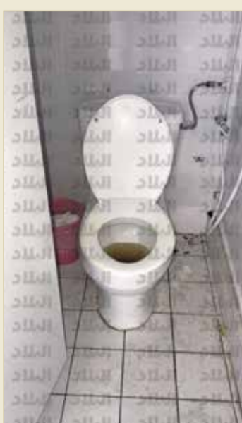
قذارة بلا حدود