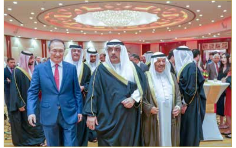
نيابة عن صاحب السمو الملكي رئيس الوزراء. سمو الشيخ سلمان بن خليفة يحضر حفل السفارة الصينية