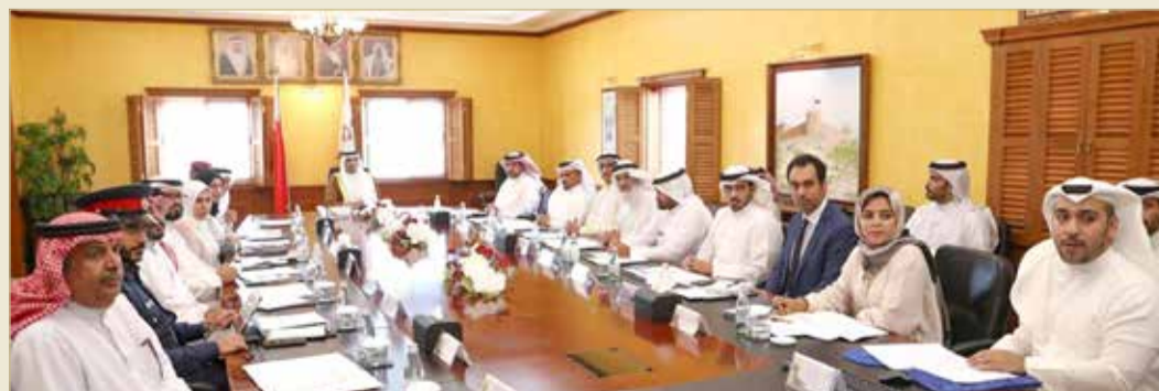
سمو محافظ الجنوبية يترأس الاجتماع التنسيقي بحضور ممثلي الجهات الحكومية

التي تواجههم، والعمل على إطلاق البرامج والمشاريع بالسرعة والكفاءة التي تضمن وصول الخدمات كافة إلى المواطنين، والعمل على مشاركتهم في