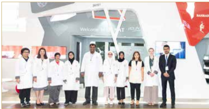
جناح “دانات” في معرض هونغ كونغ للمجوهرات

برامج تدريبية متخصصة في البحرين والشرق الأوسط. وفي تصريح لها بهذه المناسبة قالت مديرة معرض المجوهرات في إنفورما ماركس، سيلين لاو “يسرنا مرة أخرى والترحيب بمعهد دانات في معرضنا، وتتيح هذه المشاركة المتميزة من قبل دانات في المعرض أمام العارضين والزوار والمشتريين فرصة الوصول إلى خدمات