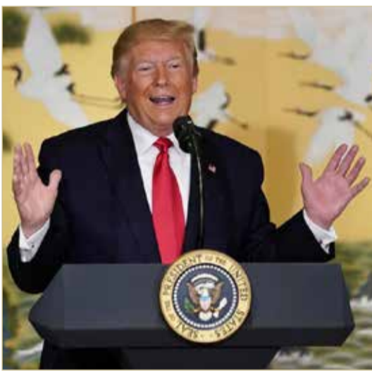
الرئيس الأميركي دونالد ترامب

واشنطن. وكالات رد الرئيس الأميركي دونالد ترامب على سؤال عن احتمال الاجتماع مع نظيره الإيراني حسن روحاني، قائلاً: "سنرى ما سيحدث". وكان ترامب يتحدث للصحافيين لدى وصوله مقر اجتماعات الجمعية العامة للأمم المتحدة في نيويورك أمس الإثنين.