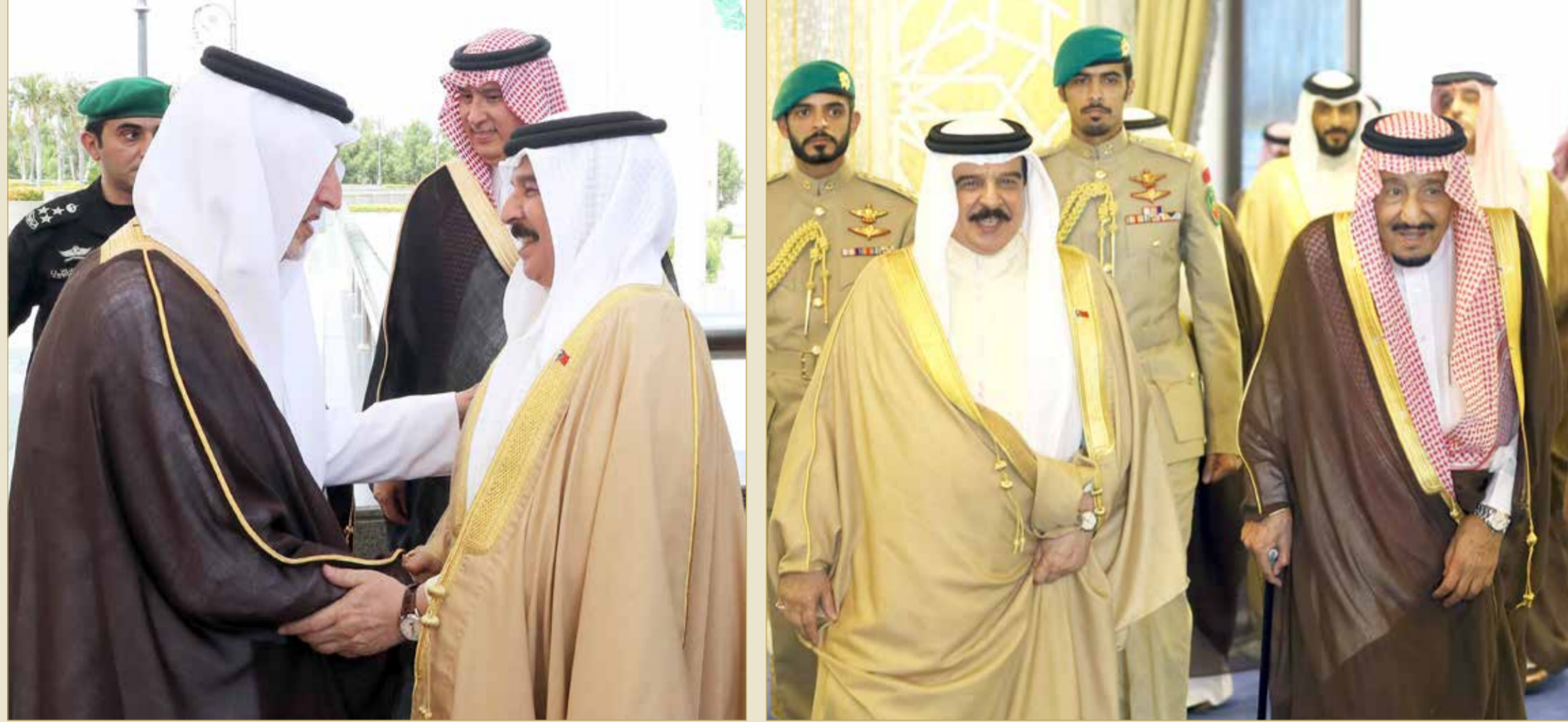
جلالة الملك لدى وصوله إلى جدة

◆ جلالة الملك: نقف مع السعودية ضد كل من يحاول المساس بسيادتها ومكانتها ويهدد أمنها ◆ الملك سلمان: مواقف البحرين الأخوية الثابتة والمشرفة تجسد العلاقات الراسخة