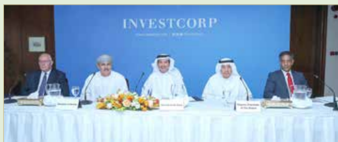
اجتماع عمومية “إنفستكوروب”