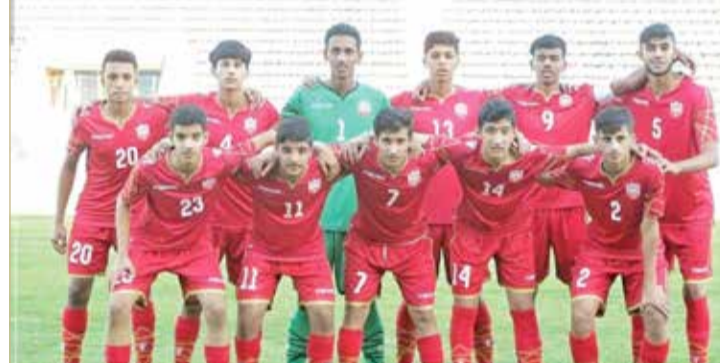
منتخبنا الوطني للناشئين

الرابعة الحائزين على مركز أفضل ثاني، وهي منتخب اليمن عن المجموعة الخامسة، منتخب إندونيسيا عن المجموعة السابعة، منتخب أوزبكستان عن المجموعة الثمانية ومنتخب عمان عن المجموعة الرابعة. وخاض منتخبنا للناشئين التصفيات في المجموعة الثانية التي استضافتها