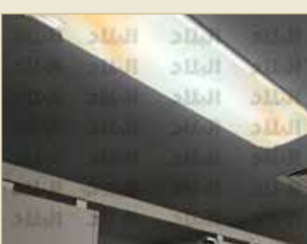
إضاءة قوس قزح قديمة بمصباح مكسور

ومن خلال صور الطلبة والموظفين بالجامعة يتبين الوضع المرئي لدورات المياه، حيث يبين عليها