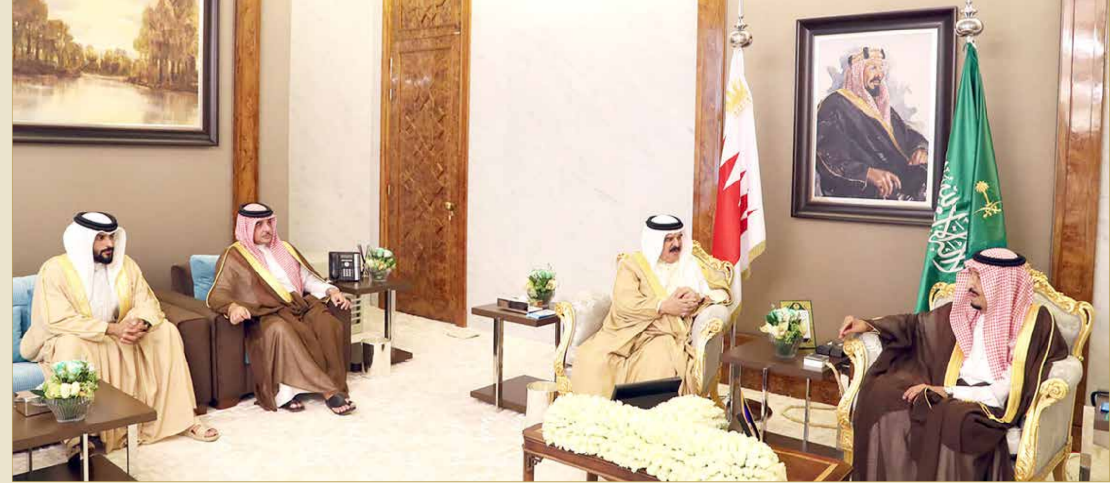
جلالة الملك يلتقي خادم الحرمين الشريفين