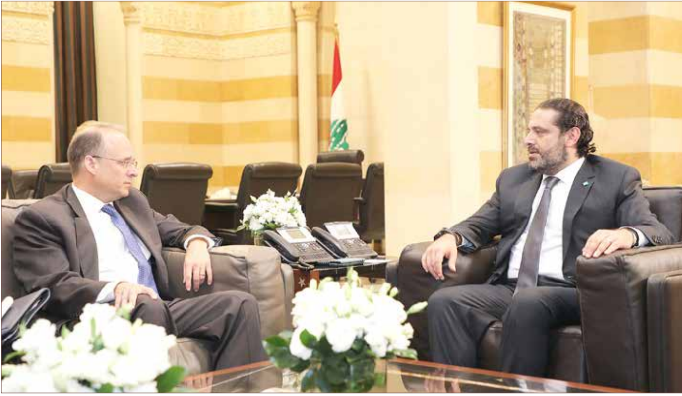
سعد الحريري في مقابلة مع مساعد وزير الخزانة الأميركي لتمويل الإرهاب مارشال بيلنغسلي في القصر الحكومي في بيروت. (أ. ف. ب)

وينتشر الجنود الأتراك في شمال العراق منذ مايو في إطار عملية عسكرية ضد حزب العمال الكردستاني المحظور في أنقرة. ونفذ حزب العمال تمرداً ضد الدولة التركية منذ العام 1984، أسفر عن مقتل أكثر من 40 ألف شخص. وتصنف أنقرة وحلفاؤها الغربيون المجموعة على أنها "منظمة إرهابية".