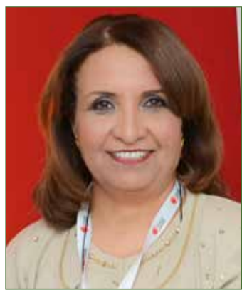
الشيخة حياة بنت عبدالعزيز

تلقت رسالة تهنئة بمناسبة احتفال الياسي في إسبانيا