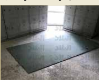
فوضى بمنطقة "اللوكرات"