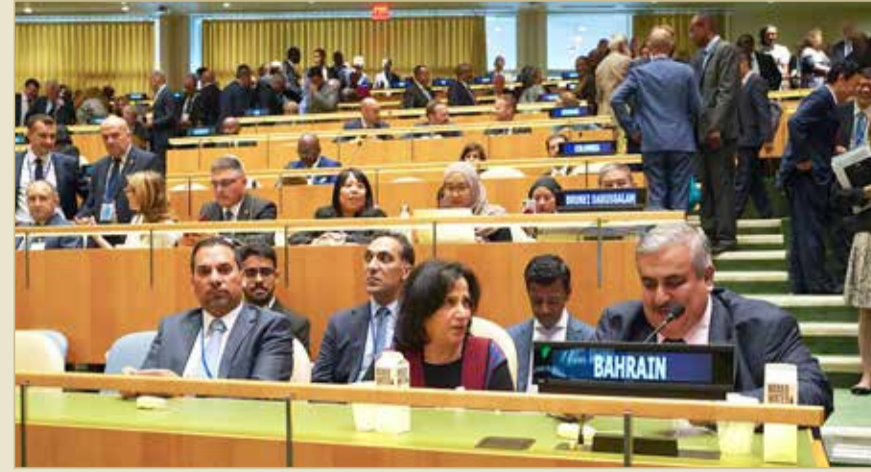
وزير الخارجية يشارك في "الاجتماع رفيع المستوى حول التغطية الصحية الشاملة"، و "قمة الأمم المتحدة للعمل من أجل المناخ" في نيويورك