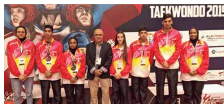
رئيس الاتحاد بتوسط فريق الدوي للتايكواندو

المجلس البحريني للألعاب القتالية - المركز الإعلامي