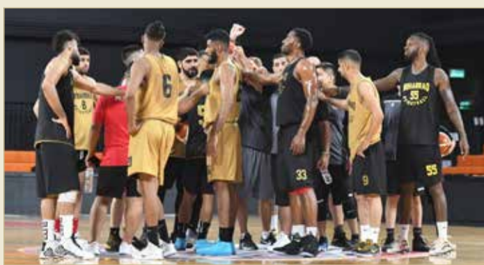
جانب من تحضيرات المحرق