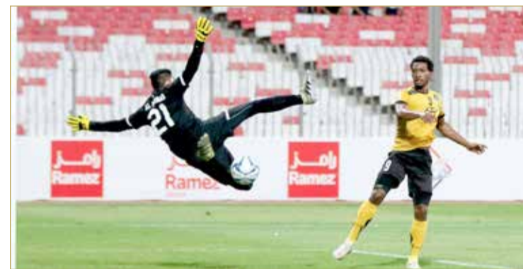
من منافسات الدور الأول

حرص الاتحاد البحريني لكرة القدم على المشاركة في الاحتفالات التي تقيمها مملكة البحرين بمناسبة اليوم الوطني السعودي 89، من خلال مشاهدته الجولة الأولى من مسابقة دوري ناصر بن حمد الممتاز لكرة القدم، من أهانج وأغان وطنية معبرة ولافتة تهنئة للقيادة السعودية الشقيقة بهذه المناسبة الوطنية.