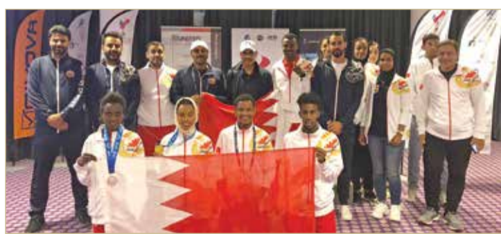
لقطات من التتويج

التميز الذي يقدمه جميع المشاركين في البطولة في جميع الألعاب، والذين لديهم مستوى عالٍ من التحدي والإنجازات. يذكر أن بعثة وزارة الداخلية في الدورة تضم (32) مشاركاً في الألعاب الرياضية (رماية، الشونز، الرماية التكتيكية، الجودو، ألعاب القوى، والجيوجستو).