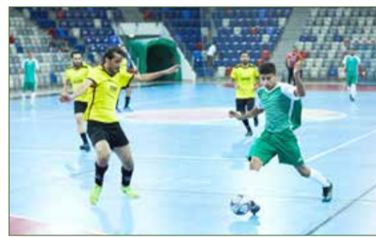
جانب من المنافسات

السهلة الجنوبية يقصي سند في دوري خالد بن حمد للصالات