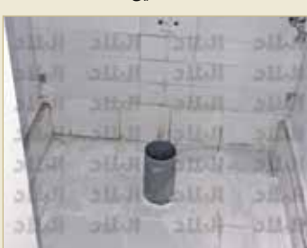
أزيل المراض ولم يوضع بديل له