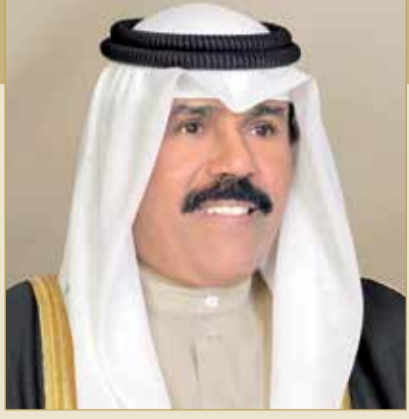
سمو الشيخ نواف الأحمد