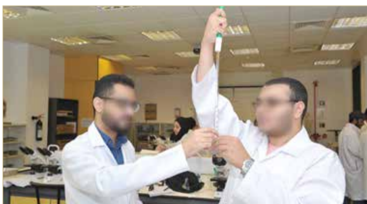
تجربة مخبرية لطلاب كلية العلوم (صورة إرشيفية)

وقال المصدر إن الجميع يعلم الظروف الاقتصادية الصعبة بالبحرين، وتأثير سياسة خفض المصروفات العامة على الجامعة، وما أداه إلى خفض ميزانية