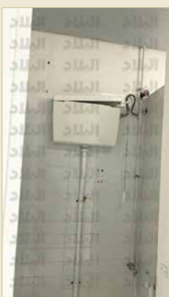
هل هذا صالح للاستخدام؟