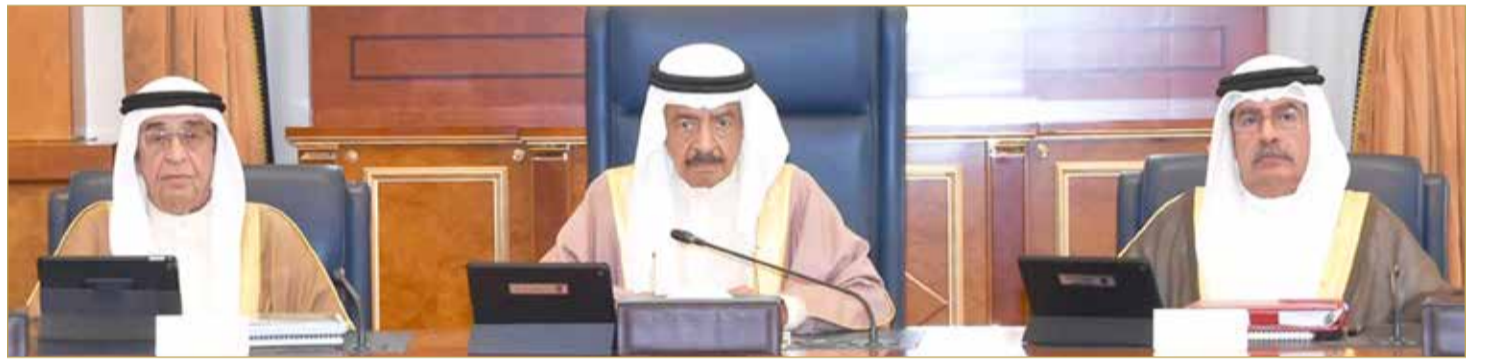
سمو رئيس الوزراء مترنسا جلسة مجلس الوزراء أمس

سمو رئيس الوزراء: منح المقاول الوطني الأفضلية بالمشاريع الإنشائية الحكومية