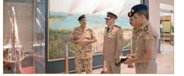
الرفاع - قوة الدفاع

كبيسي. وخلال الزيارة أطلع الوفد المتاحف العسكرية برئاسة مدير إدارة المتاحف العسكرية بالقوات المسلحة المصرية اللواء أركان حرب عماد محمد جبر محمود، صباح أمس، بزيارة للمتحف العسكري بقوة دفاع البحرين، حيث كان في الاستقبال مدير الإعلام والتوجيه المعنوي اللواء محمد قطامي