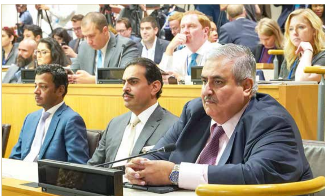
وزير الخارجية يشارك في فعالية "النداء العالمي لحماية حرية الأديان"

ويهدف النداء العالمي لحماية حرية الأديان إلى دعم وحماية حرية الأديان ومكافحة مختلف أشكال الاضطهاد والتصدي للهجمات التي تستهدف دور العبادة، وضمان احترام التراث الثقافي والديني للدول.