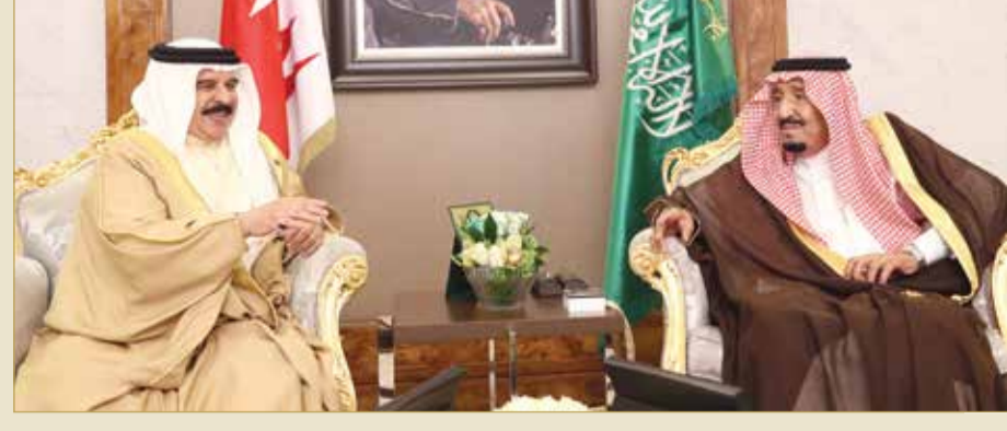
جلالة الملك يلتقي خادم الحرمين الشريفين في قصر السلام بجدة