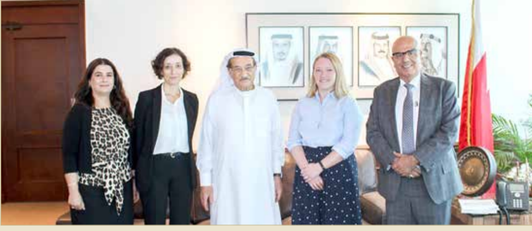
رئيس المجلس الأعلى للصحة يستقبل وفد الشبكة الدولية للتعاون الصحي

◆ يبحث أفضل التجارب والممارسات العالمية بمشاركة 34 دولة