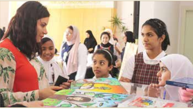
مشاركة 25 من المدارس المنتسبة لليونسكو

يصادف 13 أكتوبر من كل عام، إضافة إلى إنشاء معرض افتراضي على منصة الموقع الإلكتروني لليونسكو.