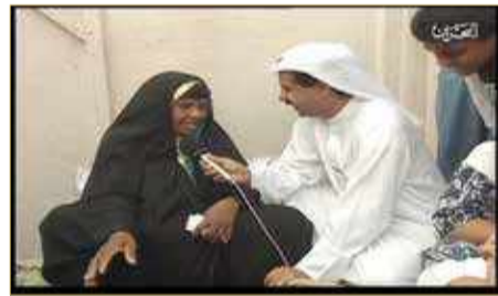
مسابقة فكر وارج