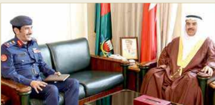
الرفاع - قوة الدفاع

استقبل وزير شؤون الدفاع الفريق الركن عبدالله بن حسن النعيمي في القيادة العامة صباح أمس، العقيد الركن طيار عبدالله عبدالرحمن العقيلي الملحق العسكري بسفارة دولة الكويت الشقيقة لدى المملكة. وخلال اللقاء رحب وزير شؤون الدفاع بالملحق العسكري الكويتي، واستعرض معه العلاقات الأخوية والتعاون المستمر بين البلدين الشقيقين في المجال العسكري.