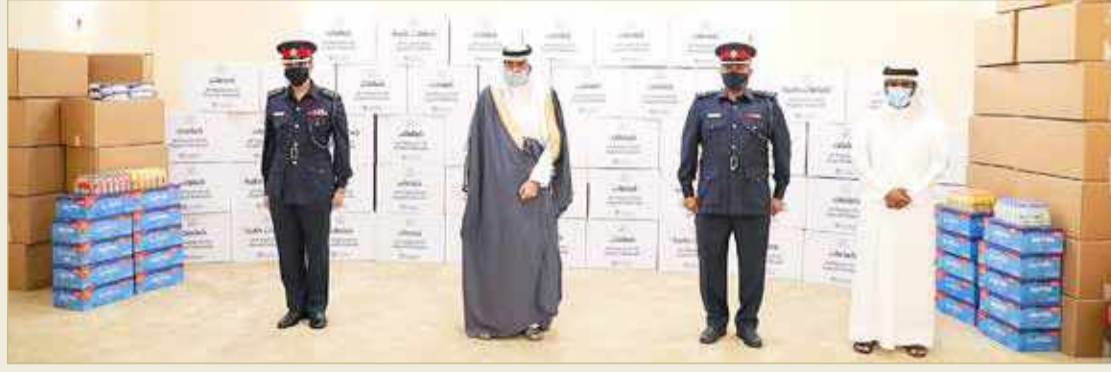
سمو محافظ الجنوبية لدى تسلم المحافظة 3000 كمائة وقائية صنعت محلياً بالتعاون مع عدد من المؤسسات الأهلية

لدى تسلم المحافظة الجنوبية 3000 كمائة وقائية صنعت محلياً بالتعاون مع عدد من المؤسسات الأهلية، أكد محافظ الجنوبية سمو الشيخ خليفة بن علي بن خليفة آل خليفة أن الجهود التي تبذلها المحافظة الجنوبية في تعزيز الإجراءات الاحترازية لمكافحة فيروس كورونا (كوفيد 19)، بالشراكة مع مختلف الإدارات الأمنية ومنها مديرية شرطة المحافظة الجنوبية، تسهم في نشر الوعي وإبراز متطلبات السلامة في