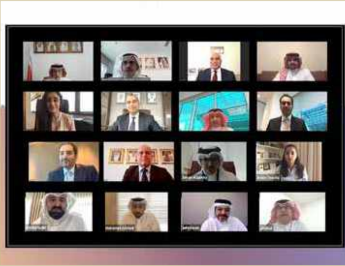
الزياني يترأس الاجتماع الدوري الأول عن بعد لمجلس إدارة الهيئة الجديد

واشتمل العرض المقدم من الإدارة التنفيذية للهيئة على آخر المستجدات الخاصة لجذب مزيد من السياحة الوافدة من خلال المكاتب التمثيلية التابعة للهيئة في فترة ما بعد فيروس كورونا المستجد (كوفيد-19)، ومدار العام ضمن رزنامتها السنوية. وبالإضافة إلى ذلك أطلع المجلس على المؤشرات السياحية للمملكة البحرين في النصف الأول من العام.