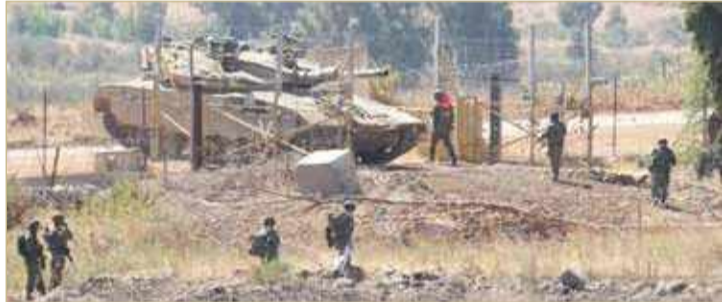
اسرائيل ترفع حالة التأهب عند الحدود الشمالية

شدد رئيس الوزراء الإسرائيلي بنيامين نتنياهو على أن تل أبيب لن تسمح لإيران بالتموضع عسكرياً عند حدودها الشمالية، محذراً سوريا ولبنان من عواقب أي هجمات على إسرائيل من أراضيها. وصرح نتنياهو في مستهل الجلسة الحكومية الأسبوعية، أمس الأحد، بأن إسرائيل في الجبهة الشمالية "تعمل وفقاً لسياسة متسقة مفادها أنها لن تسمح لإيران بالتموضع عسكرياً عند حدودها الشمالية". وتابع: "سوريا ولبنان يتحملان المسؤولية عن أي اعتداء على إسرائيل ينطلق من أراضيها. لن نسبح بزعة أمننا وبتهديد مواطنينا، ولن نتسامح مع أي مساس بقواتنا". وأشار نتنياهو إلى أنه يعقد جلسات مستمرة لتقييم الموقف مع وزير الدفاع، بيني غانتس، ورئيس هيئة الأركان