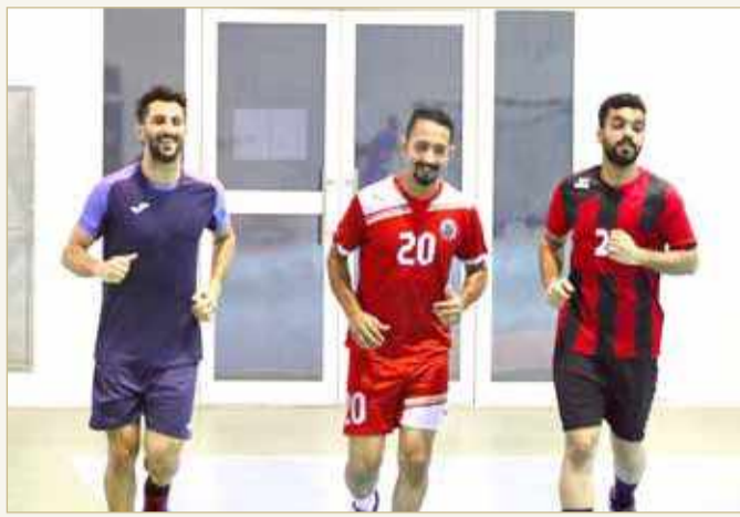
جانب من التدريب

وأضاف "أن اللاعبين أظهروا حماسهم وجديتهم في التدريب الأول، وهذا يبشر بالخير، وأن