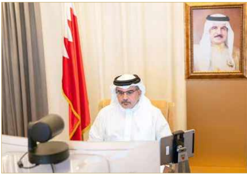
سمو ولي العهد مترئسا اجتماع اللجنة العليا للتخطيط العمراني

”العليا للتخطيط“ تناقش طلبات تصنيف العقارات