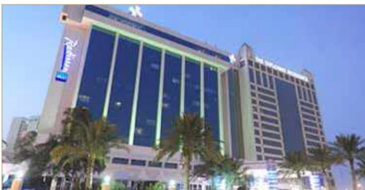
* الشركة تلقت مساعدة مالية مثلت جزءا من تكاليف الموظفين

رسوم السياحة، والتنازل عن رسوم المرافق. ويشتمل بيان الربح أو الخسارة على 88,583 دينارًا من الدعم الحكومي المستلم فيما يتعلق بدعم كشوف مرتبات موظفي الشركة، 119,765 دينارًا تتعلق بفواتير المرافق و21,173 دينارًا تتعلق بالضريبة الحكومية. مع تشغيل الفنادق والشقق السكنية بمستويات دون المستوى الأمثل، إلى جانب نقص الطلب الكافي، وأسعار الغرف غير المجزية، كان لـ "COVID"