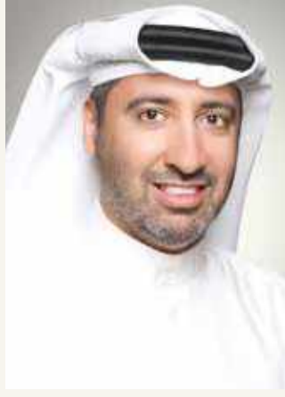
الشيخ دعيح بن سلمان

وجاءت إيرادات الشركة مدفوعة خلال الربع الثاني 2020 بارتفاع حجم مبيعات الألمنيوم وذلك بفضل إنتاج خط الصهر السادس، إلا أنها تأثرت بانخفاض الأسعار في بورصة لندن للمعادن (انخفاض سنوي بنسبة 17 %) 1,494 دولار لكل طن في الربع الثاني من 2020، مقابل 1,793 دولار لكل طن في الربع الثاني من 2019، فيما تأثرت أرباح الشركة بارتفاع قيمة الاستهلاك والرسوم المالية.