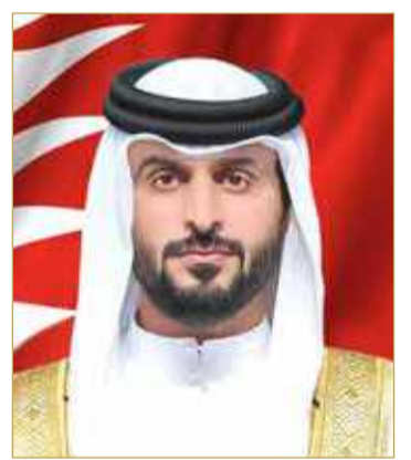
سمو الشيخ ناصر بن حمد

أكد ممثل جلالة الملك للأعمال الإنسانية وشؤون الشباب سمو الشيخ ناصر بن حمد آل خليفة أن عاهل البلاد صاحب الجلالة الملك حمد بن عيسى آل خليفة حريص على دعم الباحثين والكتاب الذين يوثقون الإنجازات التاريخية والتراث البحريني في العهد الزاهر لصاحب الجلالة الملك والتي تعتبر نبراً وطنياً للأجيال القادمة. وتسلم سمو الشيخ ناصر بن حمد