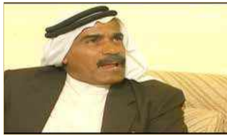
مسلسل الكلمة الطيبة