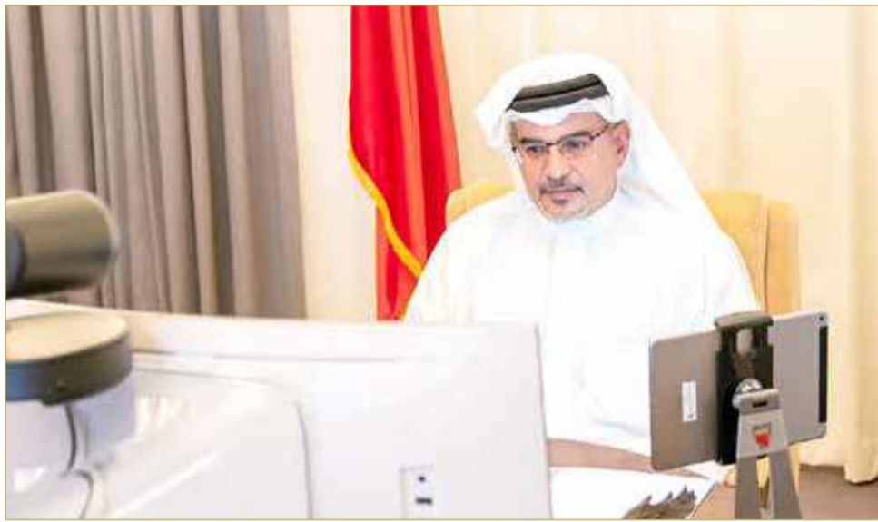
سمو ولي العهد يلقى سفير جمهورية بنغلاديش الشعبية عن بُعد

فتح آفاق أرحب من التعاون الثنائي لخدمة المصالح المشتركة