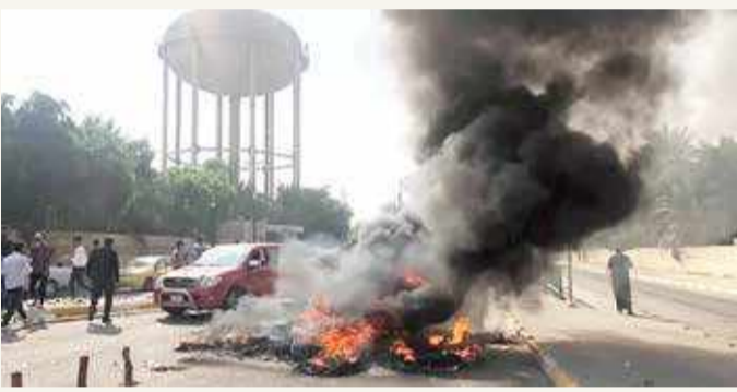
منظاهرون يقطعون طرقاً رئيسة جنوبي العراق

وذكر بيان للخلية، أن "القطعات المنفذة للواجب في قاطع صلاح الدين، وضمن عمليات أبطال العراق بمرحلتها الرابعة، عثرت على كدس صواريخ كاتيوشا، بداخله أكثر من 20 صاروخاً مدفوناً تحت الأرض"، وفق ما ذكرت وكالة الأنباء العراقية. يأتي ذلك في الوقت الذي انطلقت فيه عملية "أبطال العراق" في 4 محاور، التي تأتي استكمالاً لعمليات مماثلة