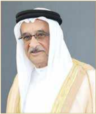
الشيخ محمد بن عبدالله

محمد بن عبد الله: اتخذوا التدابير الوقائية حتى في المنزل الواحد