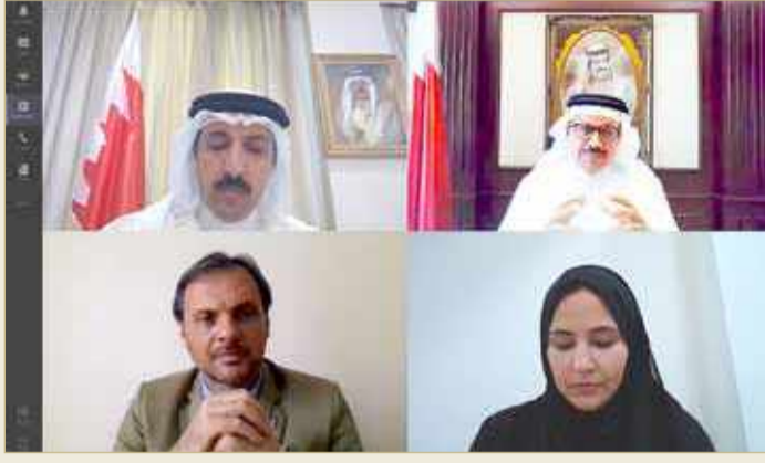
المنامة - وزارة الخارجية

البحرين بما تشهده الشراكة القائمة بين مملكة البحرين ومنظمة الأمم المتحدة ووكالاتها وأجهزتها المختلفة وبرامجها المتخصصة من تطور ونماء مستمرين، مؤكداً اهتمامه بتنمية وتطوير علاقات التعاون والتنسيق المشترك بين مكتب الأمم المتحدة الإنمائي ووزارة الخارجية إلى آفاق أوسع على كافة المستويات. وجرى خلال اللقاء بحث أوجه التعاون المشترك بين مملكة البحرين وبرنامج الأمم المتحدة الإنمائي وسبل الاستفادة من الخبرات والتجارب والمشروعات الأممية لتحقيق الأولويات التنموية التي تتبناها مملكة البحرين.