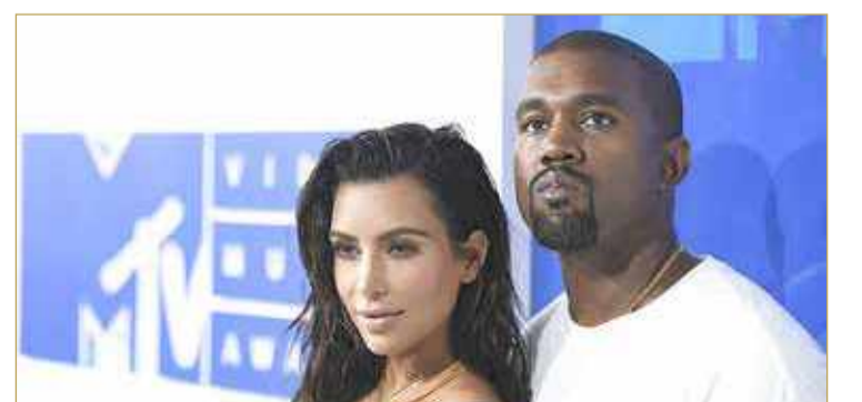
أشارت تقارير في وقت سابق من الأسبوع إلى أن كيم كارداشيان (39 عاماً) كانت "غاضبة" بشأن مزاعم الإجهاض.

أقول أنني أعرف أنني آذيتك. أرجوك ويست، من زوجته عارضة الأزياء ونجمة تلفزيون الواقع، كيم كارداشيان عبر حسابها على موقع "تويتز"، وهي نفس منصة التواصل الاجتماعي التي أعلن من خلالها عن خطته للطلاق منها قبل أيام فقط. وقال ويست في تغريدته: "أود أن اعتذر لزوجتي كيم لقيامها بإعلام أمراً خاصاً بيننا، لم أسترها مثلما سترتني، أريد أن