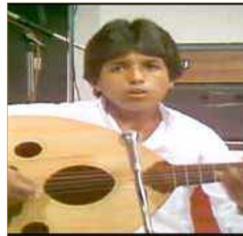
راشد الماجد في دنيا الاطفال

حول العديد من القضايا الاجتماعية التي تمس أفراد المجتمع لتأتي كل حلقة مستقلة بعينها بطرح المشكلة أولا ثم معالجتها من الناحية الدينية والاجتماعية التي حث عليها ديننا الحنيف، وذلك تمام الساعة الثامنة مساءً والاعادة الرابعة صباحا، وأيضا مسلسل “حزاي الدار” من تأليف راشد الجود وإخراج أحمد يعقوب الفعلة وتمثيل مجموعة كبيرة من الفنانين في تمام الساعة السابعة مساءً