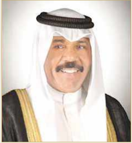
سمو الشيخ نواف الأحمد

جلالة الملك يطمئن على صحة أمير الكويت في اتصال هاتفي مع نواف الأحمد