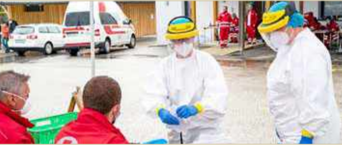
محطة للكشف عن الإصابة بالفيروس التاجي في سانت ولفجانج، النمسا

وانتشر كوفيد-19 في دول جديدة ككوريا الشمالية التي كانت حتى الآن في منأى، ووضعت البلاد الأحد في "حال تأهب قصوى" بعد الاعلان عن أول حالة مشبوهة. وبين أكثر من خمسة ملايين حالة جديدة منذ الأول من يوليو أي أكثر من ثلث الحالات المعلنه منذ بدء تفشي الفيروس، تسبب الواء بوفاة ما لا يقل عن 645715 شخصاً وفق تعداد لفرناس برس استناداً إلى مصادر رسمية أمس الأحد. ورغم زيادة الحالات سعت الحكومة الإسبانية إلى الطمأنة مؤكدة أن