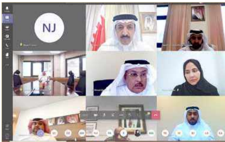
المنامة - وزارة الخارجية

وأشاد بالإجازات الكبيرة والجهود المتميزة لمملكة البحرين بقيادة عاهل البلاد صاحب الجلالة الملك حمد بن عيسى آل خليفة، في مكافحة الإرهاب وتمويله والالتزام بالتواصين والاتفاقات الدولية لحماية الأمن الشامل وتحقيق التنمية المستدامة ودعم القيم الإنسانية وصولاً إلى عالم أكثر استقراراً وازدهاراً.