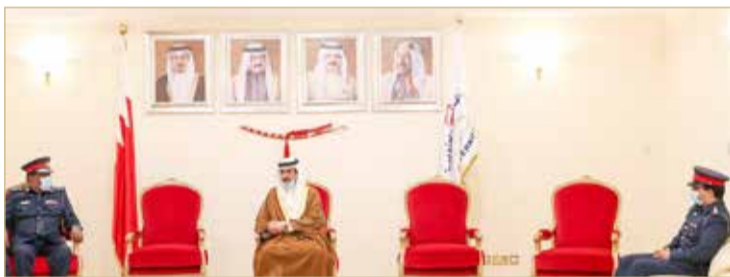
تكريم عدد من الضباط المشاركين في حملات التطهير

والمواطنين وإطلاع سموه على مختلف الأمور الأمنية التي تسهم في تعزيز مبادئ الأمن المجتمعي. وفي ختام اللقاء قام سمو المحافظ بتكريم عدد من ضباط الإدارة العامة الدفاع المدني، تقديراً على جهودهم المبذولة في الشراكة الأمنية في حملات التطهير الاحترازي، والزيارات الميدانية التي نظمتها المحافظة الجنوبية بمختلف مناطق المحافظة، الأمر الذي ساهم في تعزيز الجهود الاحترازية لمكافحة فيروس كورونا (كوفيد 19) وفق أعلى المستويات الوقائية.