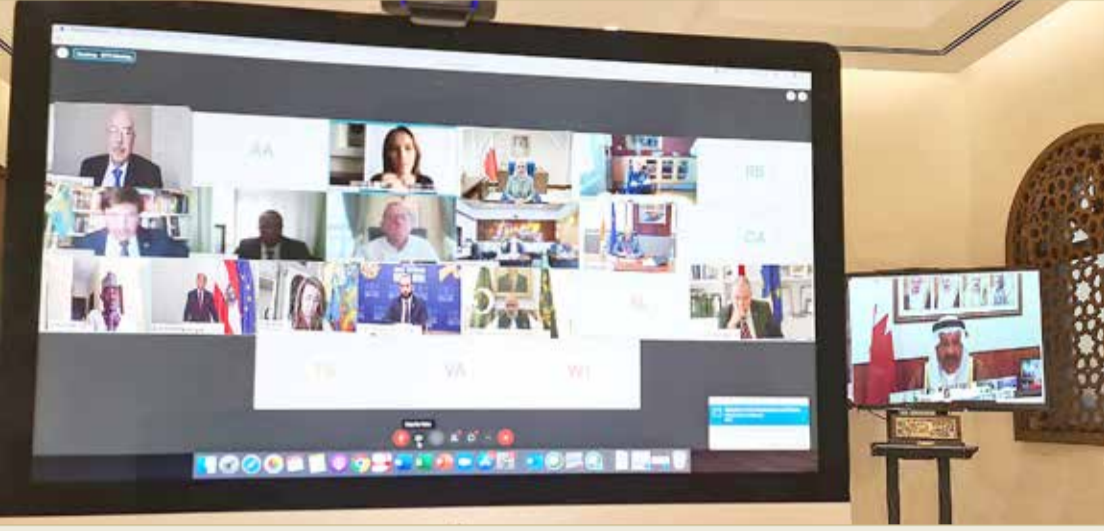
ختام المؤتمر العالمي الخامس لرؤساء البرلمانات

العالمي، وحماية النساء والشباب، ودعم انخراطهم في اتخاذ القرارات العالمية، بما يعزز دورهم في بناء المجتمعات.