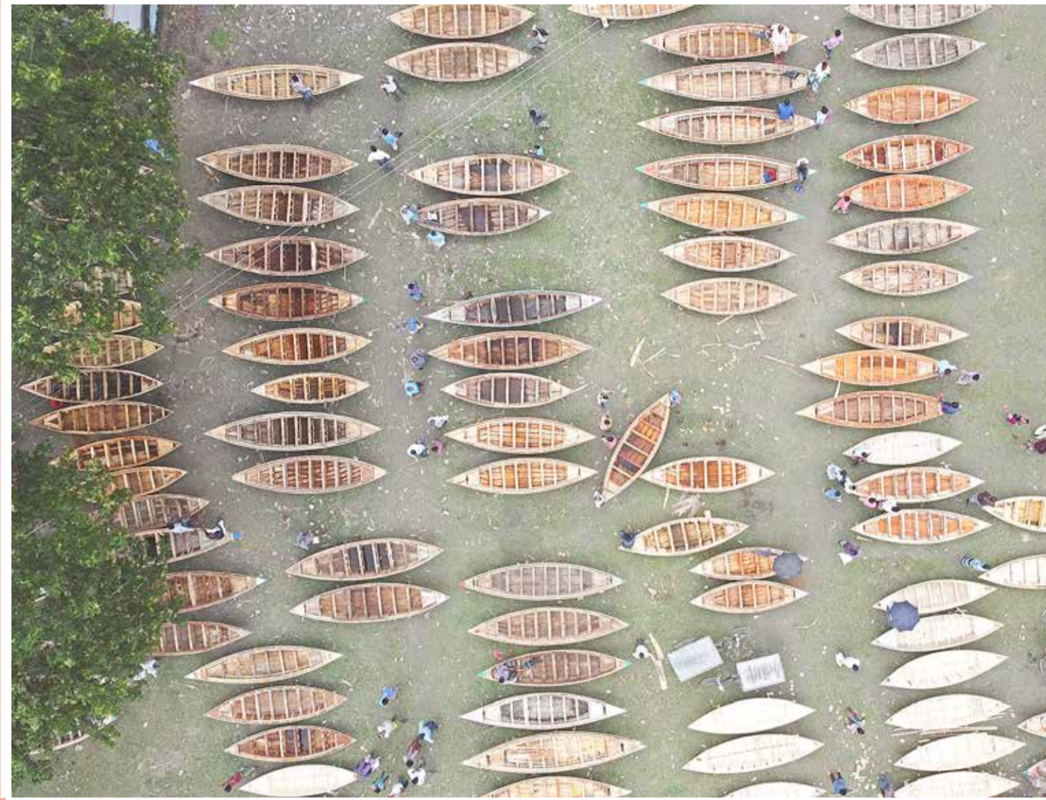
صورة جوية تظهر سوق قوارب خشبية تقليدية في مانيكجانج، وسط بنغلاديش

وشبهه المواطنون السلحفاة الغريبة بالتنجسيد الأسطوري للإله الهنديوسي "فيشنو"، حيث تقول الأساطير إن اللورد فيشنو أخذ شكل السلحفاة لإتقاذ الكون من الدمار. وبحسب صحيفة "ديلي ميل" البريطانية، يُعتقد بأنها المرة الخامسة فقط التي يتم فيها رصد سلحفاة ذهبية من هذا النوع النادر في العالم، والمرة الأولى على الإطلاق في النيبال.