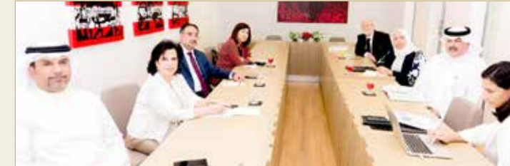
المنامة - هيئة البحرين للثقافة والآثار

في ساحات مواقف السيارات خلف مبنى الجمارك. وأشارت إلى أن المشروع من شأنه ربط مدينة المنامة القديمة بالمنامة الحديثة بعنصر بصري جذاب يعمل كرافد اجتماعي واقتصادي للعاصمة وسيشكل بيئة جديدة تؤسس للاستثمار النوعي والإبداعي. وهدف اللقاء إلى مناقشة الجدوى الفنية لمشروع بحيرة المنامة، وغيرها