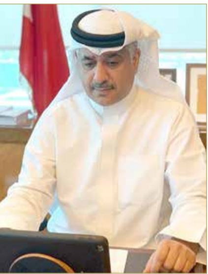
وزير المواصلات والاتصالات يجتمع مع فريق البحرين للفضاء

وزير المواصلات: الفترة المقبلة ستشهد مزيدا من الإنجازات