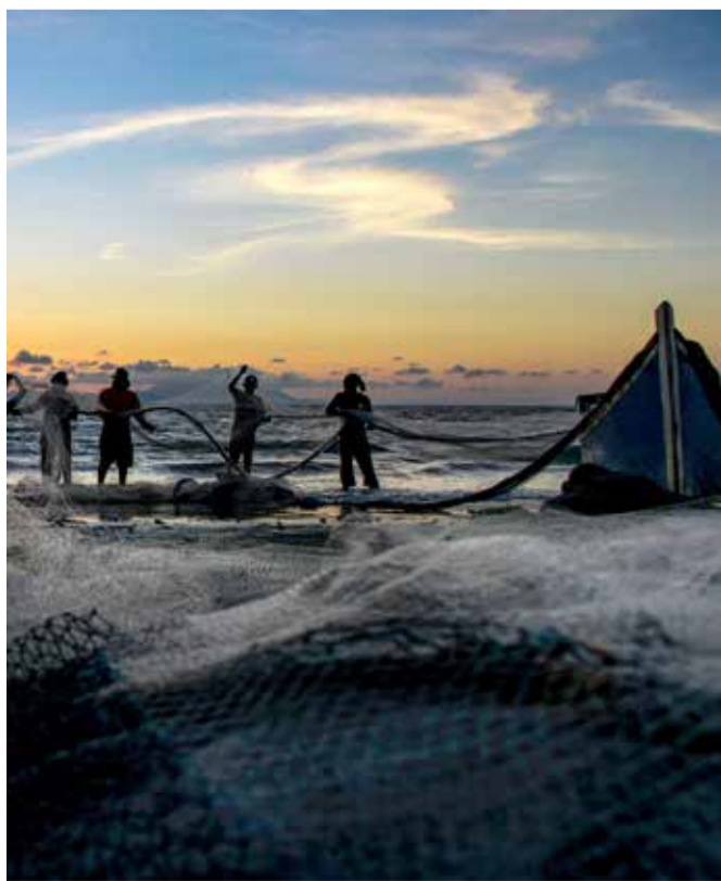
صيادون ينظفون شباكهم بعد الصيد عند غروب الشمس في باندا أتشيه، الإندونيسية.

نجحت الشرطة وجهاز مختص لمثل هذه الحالات، في الإمساك بأسد جبلي خلال تجوله في شوارع سانتيافغو عاصمة تشيلي، حسبما أعلنت السلطات. والحادث هو السادس من نوعه في العاصمة التشيلية منذ مارس الماضي، في انعكاس لإجراءات الإغلاق وحظر التجول التي فرضتها أزمة كورونا. وأبلغ سكان حي لو بارنياتشا الراقي السلطات بوجود الأسد، بعدما لجأ إلى منزل إثر تجوله في الشوارع خلال النهار. وخرج الحيوان المفترس بعد ذلك من المنزل، فطارده عناصر الشرطة والجهاز الوطني المعني بالحيوانات، وتمكنوا من الإمساك به باستخدام سهام مهدئة.