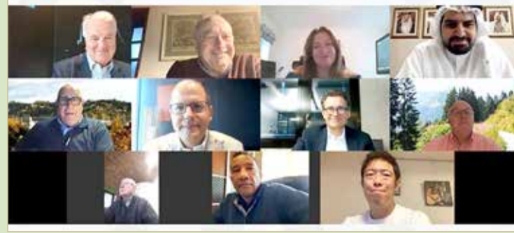
المشاركين في الاجتماع

جدول الأعمال والتي تركزت في نشر لعبة كرة السلة وتعزيز مكانتها بين الألعاب الجماعية التي تحظى بتشجيع جماهيري واسع.