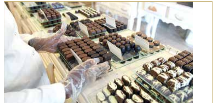
ووفقا لخبراء، فإن قشور الفول السوداني ليست بقايا الطعام الوحيدة التي يمكنها تحسين الشوكولاتة وإضافة الفائدة لها، وفي موقع "eurekalert" ويقوم الخبراء الآن بدراسة إمكانية استخراج المركبات الفينولية من القهوة المستخدمة وأوراق الشاي.

أعلن خبراء من الجمعية الكيميائية الأميركية عن إنشاء صيغة لأفضل أنواع الشوكولاتة ذات طعم لذيذ ومفيدة للصحة. وأشار العلماء إلى أن شوكولاتة الحليب هي الأكثر شعبية في العالم، حيث يقدر عشاقها مذاقها الرائع وجودتها المميزة. ومع ذلك، ومن وجهة نظر الفوائد التي تعود على الجسم، فإن الشوكولاتة الداكنة (التي تحتوي على نسبة عالية من