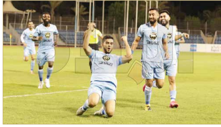
فرحة سماوية تكررت 3 مرات