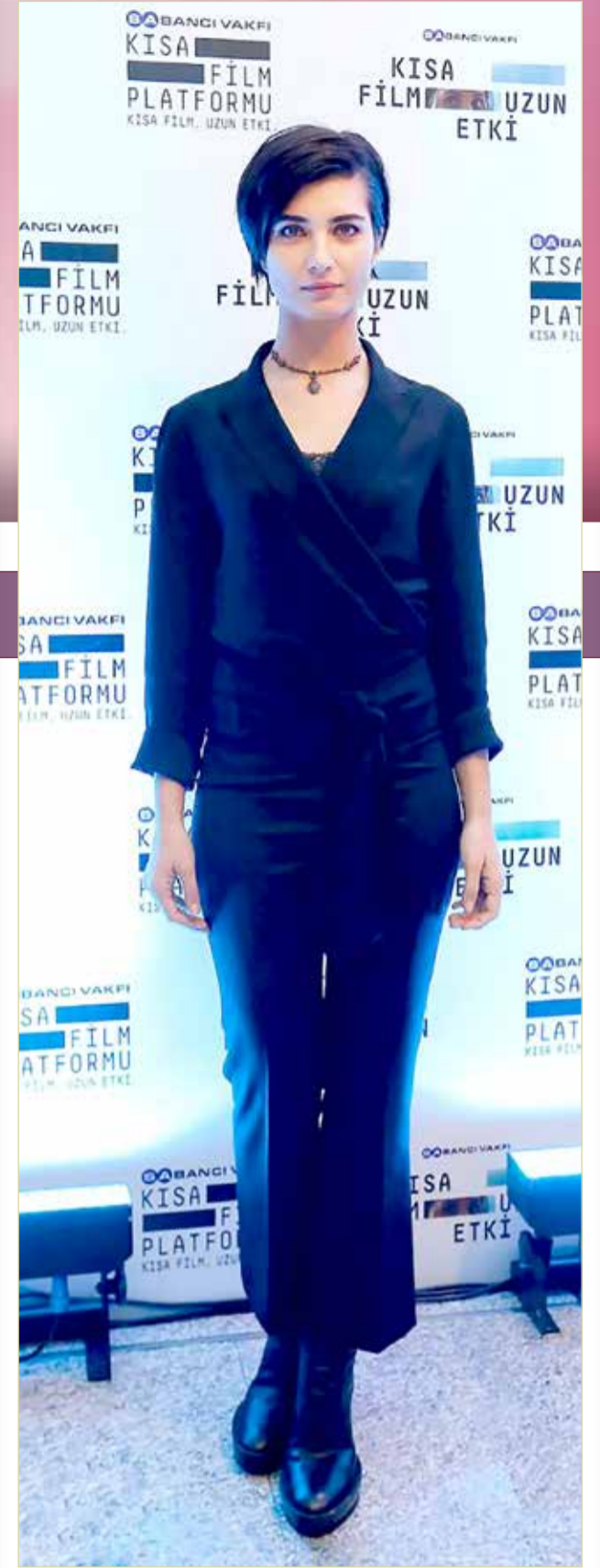
« دعت النجمة توبا بويوكستون متابعيها إلى التبرع لأطفال لبنان الذين تضرروا من جراء انفجار مرفأ بيروت ، الذي وقع في 4 أغسطس الجاري، وخلف أضرارا مادية كبيرة، وخسائر في الأرواح فاقت 170 شهيدا، و6000 جريح، وعدد من المفقودين.