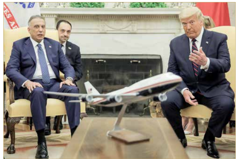
من لقاء ترامب والكاظمي في البيت الأبيض الخميس

شدد على أن "العراق يرحب بالشركات والاستثمارات الأميركية". إلى ذلك تعالت الإدانات الدولية للترهيب، مع استمرار رصاص القدر في استهداف الناشطين والصحافيين والباحثين في العراق، لاسيما مؤخرا في البصرة. (10)