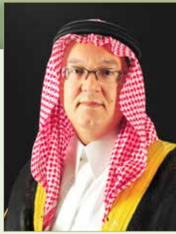
الأمير عمرو الفيصل

المستمرة لتشجيع العملاء على إجراء معاملاتهم المصرفية عبر الإنترنت، وكجزء من استراتيجيتنا في التحول الرقمي الحاصلة على جائزة، قام البنك مؤخراً بإطلاق تطبيق جديد كلياً للهواتف النقالة. إن التطبيق، والذي تم تصميمه خصيصاً لتعزيز تجربة العملاء المصرفية عبر الإنترنت مع تقليل الحاجة لزيارة الفروع، يسمح للمستخدمين بفتح حساب مباشرة من هواتفهم النقالة. وبعد إطلاق التطبيق، أصبح في إمكان المواطنين والمقيمين في مملكة البحرين الآن فتح حساب جديد بأمان في بضع دقائق من خلال تحميل تطبيق بنك الإثمار بكل سهولة دون الحاجة لزيارة الفروع. (التفاصيل في الموقع الإلكتروني)