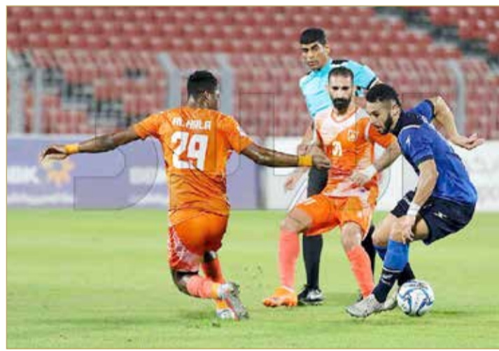
من لقاء الحالة والبسيتين