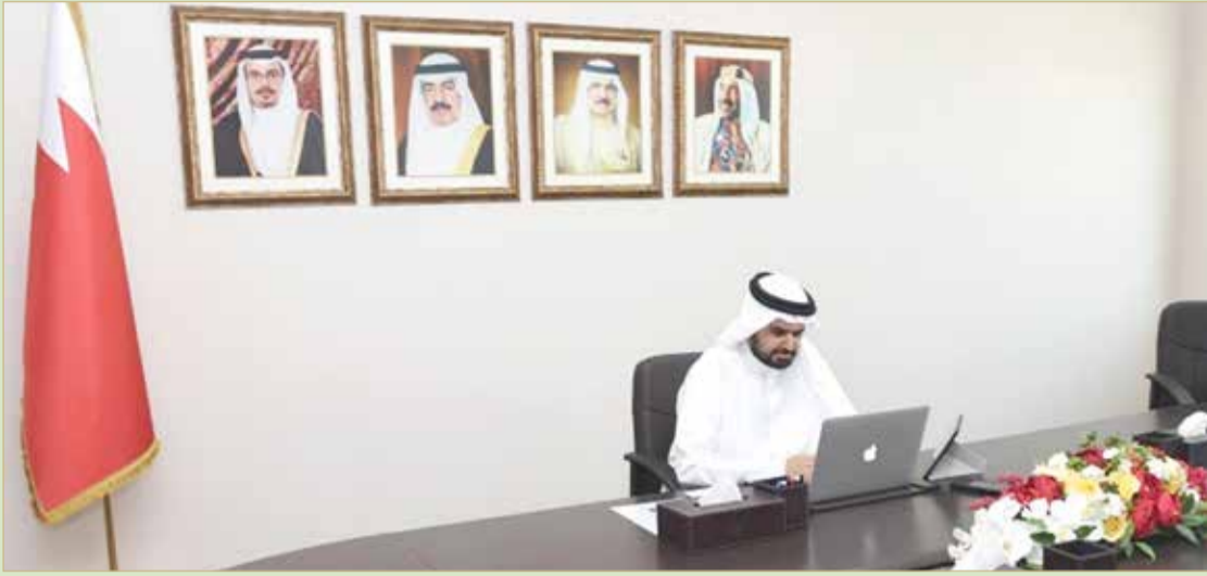
سمو الشيخ عيسى بن علي خلال مشاركته في الاجتماع