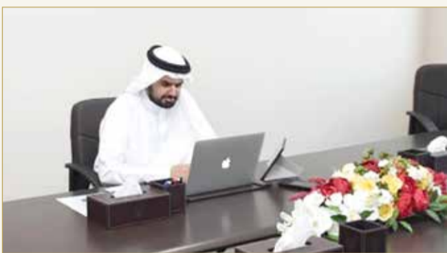
سمو الشيخ عيسى بن علي أثناء مشاركته في الاجتماع