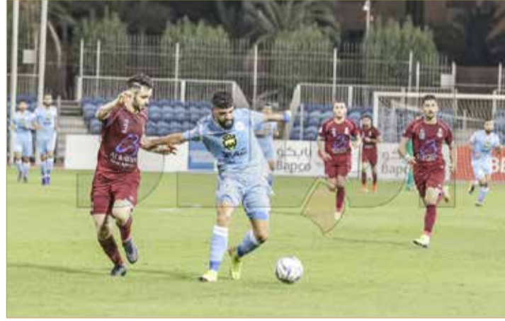
من لقاء الرفاع والشباب