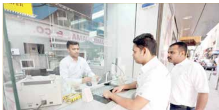
أعمال صرافة النقد الأجنبي انخفضت بنحو الثلث بسبب تداعيات جائحة كورونا

كبير بسبب الوباء في المقابل ارتفعت المعاملات التي تتم عبر القنوات الإلكترونية أو المواقع والتطبيقات. ورغم ذلك قال نونو "ما زالت فئة خصوصا من العمالة ذات الأجور المحدودة تفضل زيارة الفروع ونحن نوفر لهم مختلف الخيارات". (07)