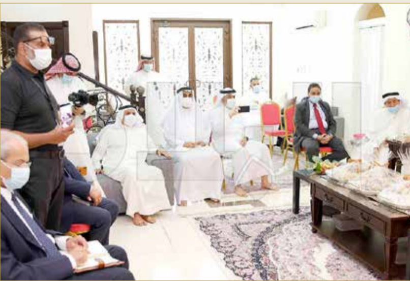
جانب من الحضور بالمجلس