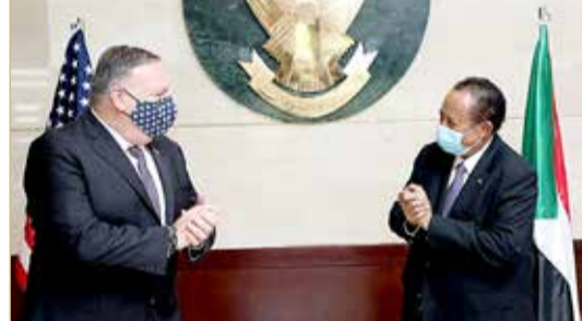
بومبيو في الخرطوم في أول زيارة لوزير خارجية أمريكي إلى السودان منذ 15 عاما

أكد أن مهمة حكومته "محددة" باستكمال العملية الانتقالية