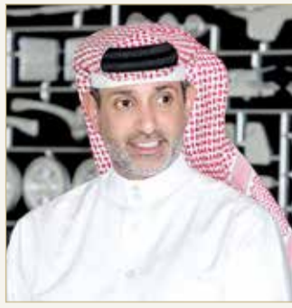
سلمان بن عيسى

بالشكل المطلوب، كما سيتم الإعلان في أوقات لاحقة عن أي تطورات متعلقة بهذه الاستضافة. وفي الختام، أعرب الشيخ سلمان بن عيسى عن عظيم الامتنان إلى مقام عاهل البلاد صاحب الجلالة الملك حمد بن عيسى آل خليفة على قيادته الراسخة ورعايته لجميع المواطنين والمقيمين في مملكة البحرين، وإلى رئيس الوزراء صاحب السمو الملكي الأمير خليفة بن سلمان آل خليفة، وإلى ولي العهد نائب القائد الأعلى النائب الأول لرئيس مجلس الوزراء صاحب السمو الملكي الأمير سلمان بن حمد آل خليفة على قيادتهما بحكمة واقتدار جهود مملكة البحرين في التصدي لجائحة كورونا (كوفيد 19).