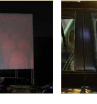
الأمير علي والأميرة ريم في المهرجان

الأفلام لعرض أعمالهم وللتنافس فيما بينهم والاستفادة من المزيد من التدريب والفرص. طالما هناك طرق لتحقيق ذلك بأمان، لا داعي للتقليل من شأن الثقافة أو حرمان الفنانين من الفرص للمضي قدما. غرض فيلم الافتتاح "البؤساء" لأول