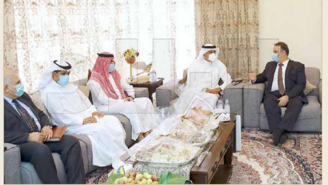
الوزير في لقائه مع الأهالي بمجلس النائب هشام العشري