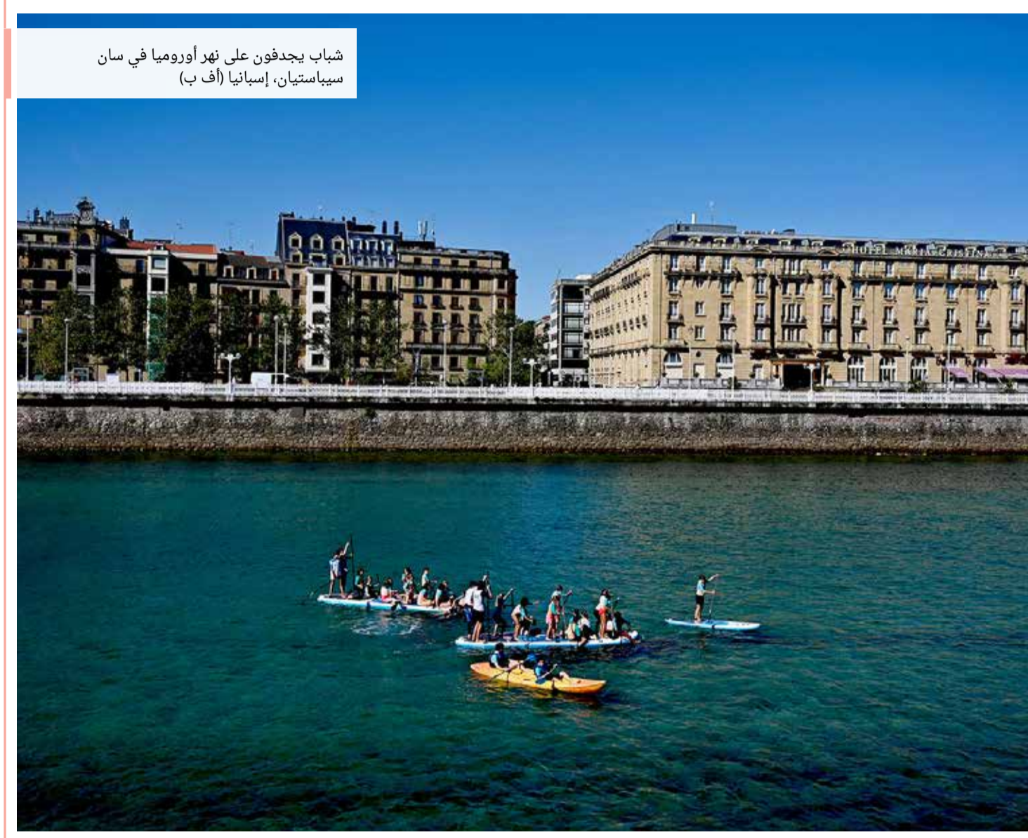
شباب يجدفون على نهر أوروبا في سان سباستيان، إسبانيا