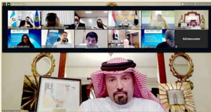
الشيخ أحمد بن حمد مترسا اجتماع مجلس منظمة الجمارك "عن بعد"

والمحاور الخاصة فيها في الاجتماع المقبل وذلك في أكتوبر 2020. وفي نهاية الاجتماع أكد الشيخ أحمد بن حمد آل خليفة القائم بأعمال رئيس مجلس منظمة الجمارك العالمية، اهتمام المنظمة بسلامة وحماية المجتمعات والصحة العامة عبر تعزيز الأمن والاستمرار بتيسير التجارة الدولية، بما في ذلك تبسيط النظم الجمركية وتوحيد ورفع مستوى كفاءة الجمارك وتحسين أدائها بما يساهم في تعزيز ثقافة الأداء الاحترافي من خلال نشر المعلومات والبيانات الجمركية بين أعضاء المنظمة والجهات المعنية.