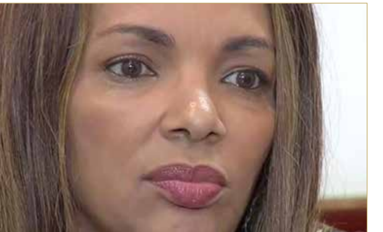
وكانت دي سوزا قد قالت في شهادتها للشرطة عقب الحادث إن زوجها قُتل في حادث سطو.

اتهمت الشرطة البرازيلية البرلمانية فلورديليس دي سوزا، عضو الكونغرس البرازيلي بإصدار أمر بتصفية زوجها، الفس أندرسون دو كارمو، الذي تلقى أكثر من 30 رصاصة في منزلهما في يونيو 2019. وقالت شرطة ولاية ريو دي جانيرو إنه تم توجيه الاتهام لـ 11 شخصا فيما يتعلق بالجريمة. وقال الحزب الديمقراطي الاجتماعي البرازيلي، الذي تنتمي له البرلمانية، في بيان إن عضويتها سئلت على الفور، ومع تقدم الإجراءات ستفصل من الحزب. وأوضحت الشرطة أن دافع دي سوزا كان "صراعا على السلطة وتحريها ماليا". ولم يصدر حاليا أمر بالقبض على دي سوزا على أساس أنها تتمتع بـ "حصانة برلمانية" باعتبارها نائبة اتحادية منتخبة.