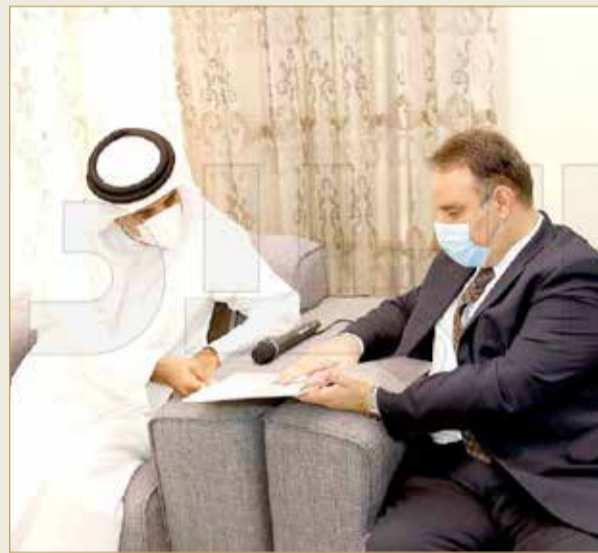
مشاركات بين العشري والوزير