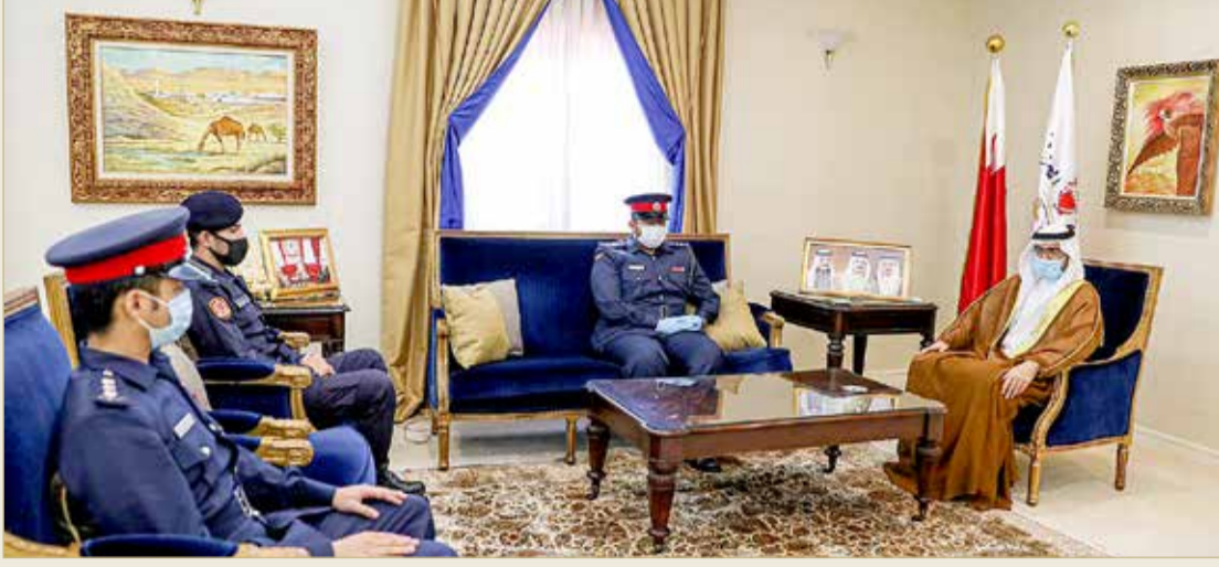
سمو محافظ الجنوبية مستقبلا عددا من ضباط مركز الدفاع المدني بالرفاع