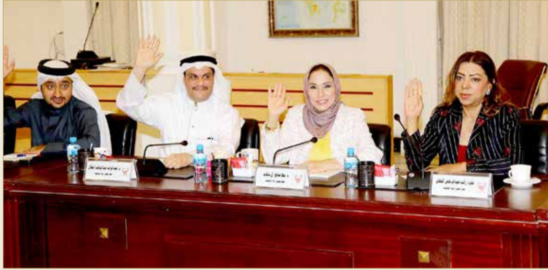
جانب من التصويت باجتماع سابق لمجلس أمانة العاصمة

وتمنى النكال التوفيق لجميع الأعضاء في مناصبهم باللجان سواء بالرئاسة أو نوابا للرئيس.