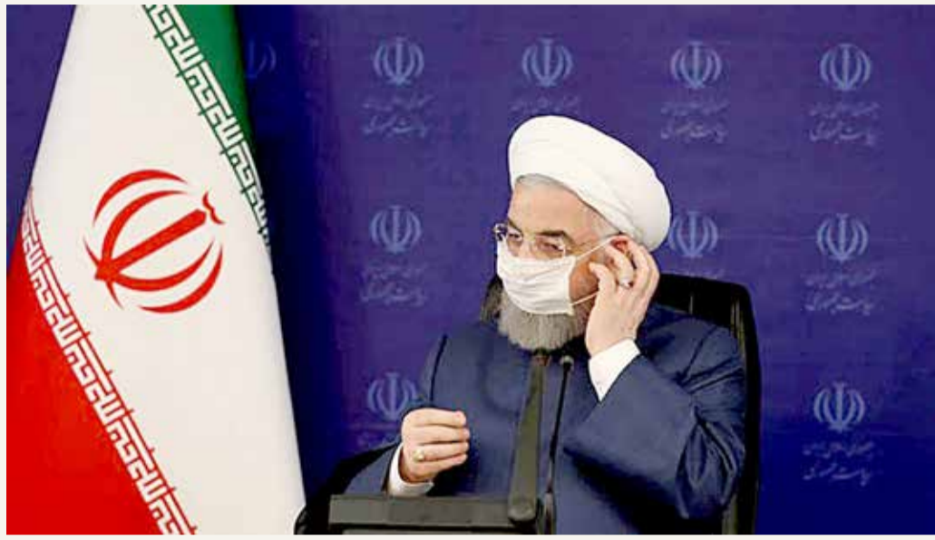
روحاني يقول إن المحادثات ممكنة إذا عادت أميركا إلى الاتفاق النووي للعام 2015

روحاني يعلن إمكان التفاوض مع واشنطن حال عودتها لاتفاق 2015