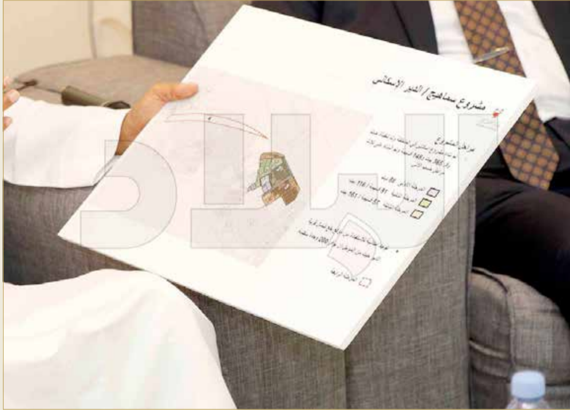
المشروع الإسكاني المرتقب

البلاد | سعيد محمد من الدير | (تصوير: رسول الحجيري)