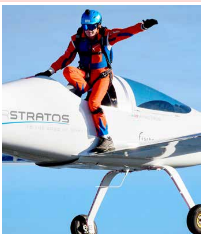
رافائيل دومجان، مؤسس مشروع طائرة ستراتوسفير ستراتوسفير التي تعمل بالطاقة الشمسية، خلال محاولة تسجيل رقم قياسي عالمي بالقفز بمظلة من طائرة تعمل بالطاقة الشمسية في بايرن، غرب سويسرا

كشفت دراسة حديثة أن عقاقير علاج ضعف الانتصاب مثل "الفايغرا"، قد تزيد من معدلات النجاة من سرطان القولون والمستقيم. وبحسب صحيفة "ديلي ميل"، وجد الباحثون أن هذه العقاقير قللت من خطر الوفاة المبكرة لدى مرضى سرطان القولون بنحو 20%، حيث يعتقد أن لها خصائص مضادة للالتهابات والقدرة على تثبيط الأورام. وحلل فريق البحث التابع لجامعة لوند السويدية، حالات لرجال شخصت إصابتهم بسرطان القولون بين عامي 2005 و2014، ومن بين المشاركين، كان أكثر من 11300 لا يتناولون دواء الضعف الجنسي، وأكثر من 1100 مريض يتناولونه. وتبين أن الرجال المصابين بسرطان القولون، والذين تناولوا أدوية لعلاج الضعف الجنسي وخضعوا لعملية جراحية، أقل عرضة بنسبة 39% لوفاة المبكرة من سرطان القولون وخطر الإصابة بالورم النقيلي بنسبة 31%.