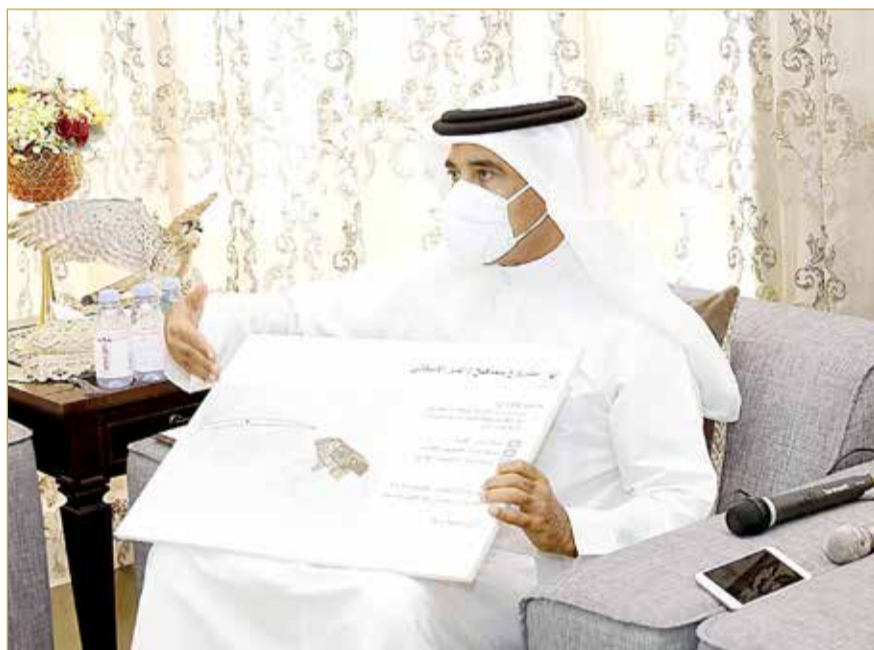
وزير الإسكان يقدم شرحاً عن المشروع

وعبر الوزير الحمر في زيارة للأهالي صباح أمس بمجلس النائب هشام العشري عن سعادته باللقاء تنفيذياً لتوجيهات رئيس الوزراء صاحب السمو الملكي الأمير خليفة بن سلمان آل خليفة بزيارة المنطقتين، والاطلاع على الاحتياجات الإسكانية في المنطقة والالتقاء بالأهالي للاستماع منهم بشكل مباشر إلى متطلباتهم في هذا الشأن، وتبادل الحديث مع الأهالي قائلاً: "أنا سعيد بقاء أهلتنا في الدير وسماهيح، وأعتذر عن عدم تمكني من مرافقة الأخ العزيز وزير الأشغال وشؤون البلديات والتخطيط العمراني عصام خلف في زيارته الأخير لعارض صحي، وبالتأكيد، فإن الزيارة هي لاستعراض خططنا في الوزارة والاستماع إلى مقترحاتكم ورغباتكم والسعي لعلاجها". (03)