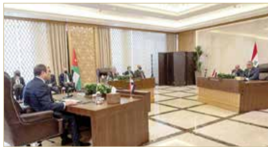
الزعماء بحثوا توسيع التعاون الاقتصادي والتجاري والاستثماري

جمعت قادة الأردن ومصر والعراق وناقشت تعزيز العلاقات