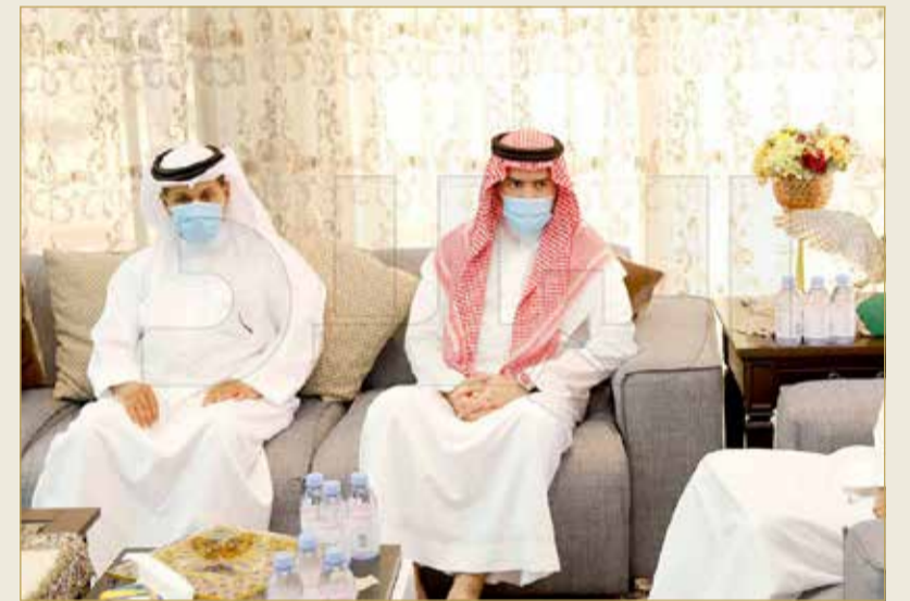
جانب من الزيارة

الحمير: استيعاب الكثير من الطلبات وجار تسلم أرض المشروع