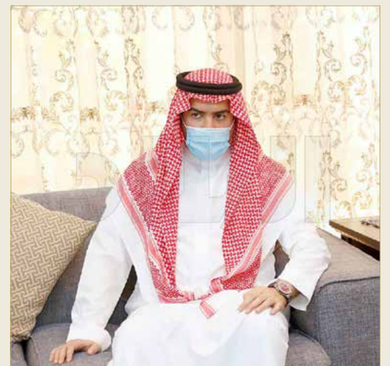
الوكيل الجديد لوزارة الإسكان بأول جولة ميدانية