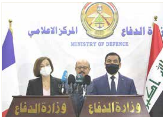
وزيرة الجيوش الفرنسية ووزير الدفاع العراقي

وزيرة الجيوش الفرنسية تدعم إبعاد العراق عن سياسة المحاور