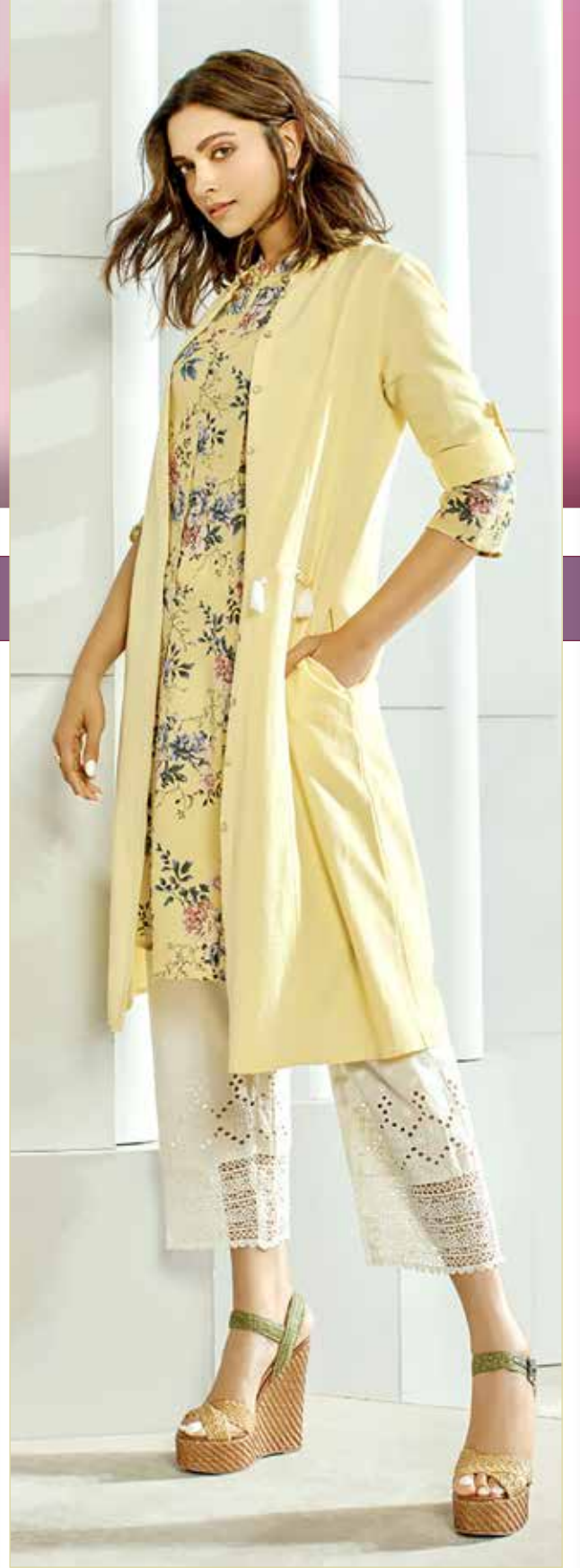
« قالت الممثلة الهندية، ديبিকা بادكون، إن العلاقات الرومانسية تصبح أكثر تعقيداً عندما يكون شخص ما في قمة نجاحه؛ لأنه من الصعب العثور على شخص يتفهم النجاح والشغف الذي لدي تجاه عملي. »