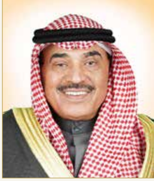
سمو الشيخ صباح خالد الحمد الصباح