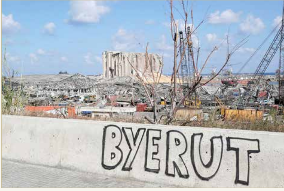
من آثار الدمار الذي أحدثه انفجار مرفأ بيروت

انتقدت تقاعس الطبقة السياسية ودعت لإصلاحات "عاجلة"