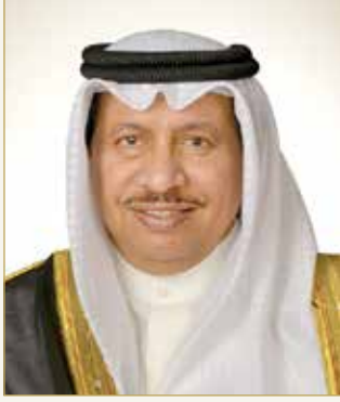
سمو الشيخ جابر مبارك الحمد الصباح

◆ سموه يتلقى تهاني عدد من أفراد عائلة الصباح