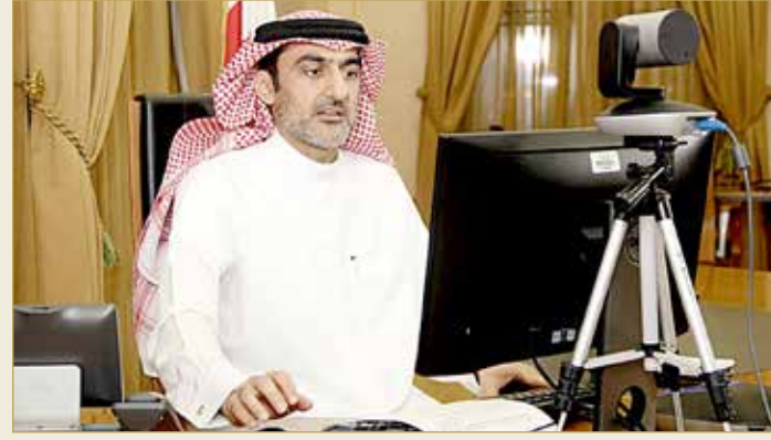
رئيس هيئة المعلومات متحدنا ضمن برنامج "رابط 2"

وتطرق القائد في هذا الجانب إلى المشروعات المستقبلية التي تركز على تقنيات الذكاء الاصطناعي التي برزت في تطبيق "مجتمع واعي" دون التدخل البشري، وقال إن رصد الإصابات من خلال التطبيق تتراوح في اليوم الواحد بين 15% و 40%. ما يقلل من كلفة الفحص الروتيني.