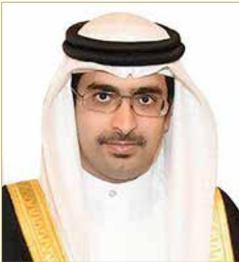
سمو محافظ الجنوبية

◆ التنسيق لاقامة موسم عاشوراء وسط اجراءات آمنة وصحية