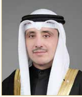
الشيخ أحمد ناصر محمد الصباح