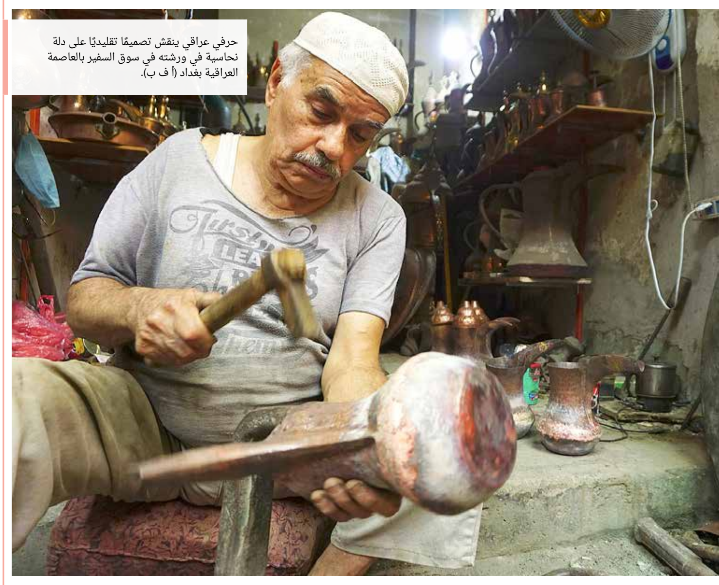
حرفي عراقي ينقش تصميما تقليديا على دلة نحاسية في ورشته في سوق السفير بالعاصمة العراقية بغداد.

يشار إلى أن البخاخ المخصص للوقاية من البعوض، ليس كافيا بشكل تام، إذ لا يغني عن وسائل الوقاية الأخرى، مثل ارتداء الكمامة والحرص على النظافة والتباعد الاجتماعي.