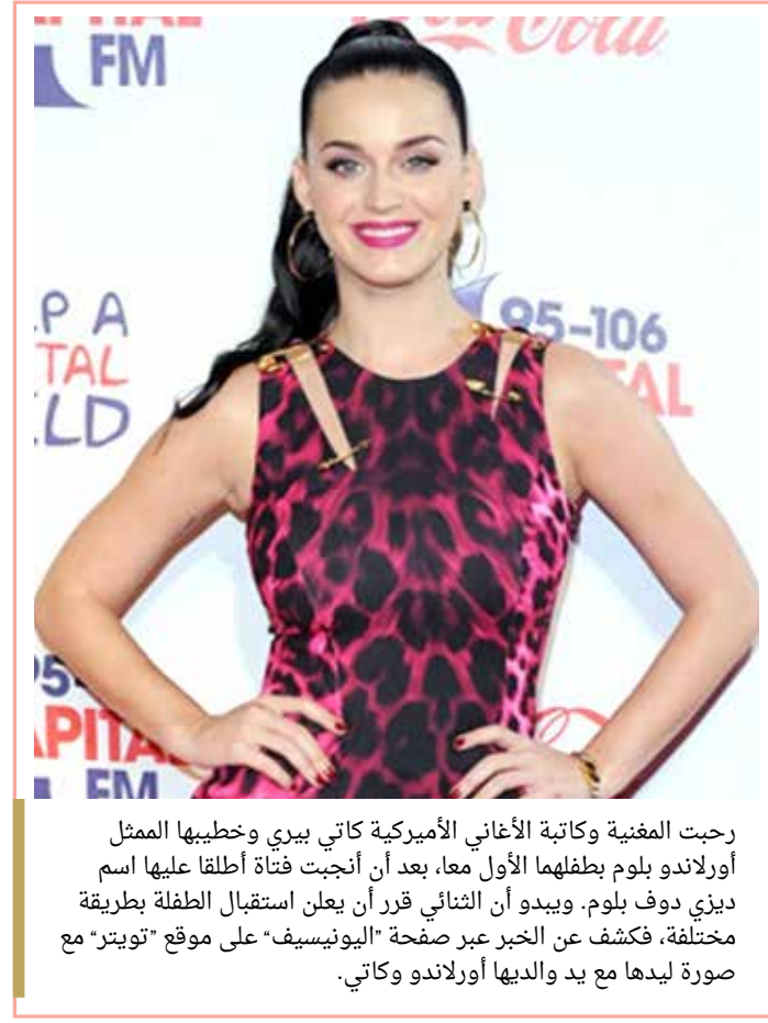
رحبت المغنية وكاتبة الأغاني الأميركية كاتي بيبي وخطيبها الممثل أورلاندو بلوم بطفلهما الأول معا، بعد أن أنجبت فتاة أطلقا عليها اسم ديزي دوف بلوم. ويبدو أن الثنائي قرر أن يعلن استقبال الطفلة بطريقة مختلفة، فكشف عن الخبر عبر صفحة "اليوتيسيف" على موقع "تويت" مع صورة ليدها مع يد والديها أورلاندو وكاتي.

ونشرت ميدلر تغريدة عبر حسابها الرسمي على موقع "تويت"، تسخر فيها عن عدم إتقان ميلانيا ترامب للغة الإنجليزية قائلا "يا إلهي.. ما زالت لا تستطيع التحدث باللغة الإنجليزية". وواصلت ميدلر السخرية على ميلانيا؛ كونها من أصل سلوفيني وعن ضعف لغتها الإنجليزية، وكيف أن 4 سنوات في البيت الأبيض لم تصلح أي شيء. ولقيت الممثلة الأميركية انتقادات حادة، إذ اتهم البعض ميدلر بنشر تغريدات معادية للأجانب.