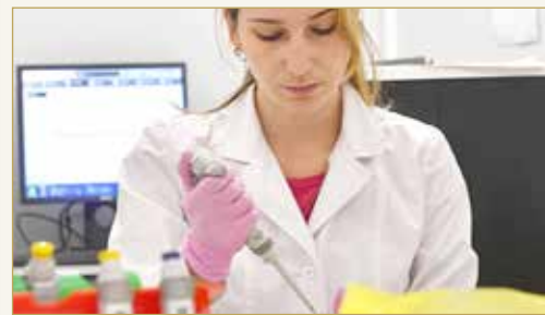
"تأثير مربع".. لما يفعله فيروس كورونا بمن يعانون السمنة

يشكون السمنة، أكثر عرضة للوفاة من جراء مضاعفات المرض بـ 48 مقارنة مقارنة بالأشخاص الذين يتمتعون بوزن صحي.