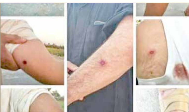
جرحى برصاص الأمن الإيراني

◀ تخريب منازل ومصادرة أراضٍ وجرح واعتقال العشرات