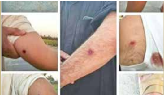
جرحى برصاص الأمن الإيراني

تخريب منازل ومصادرة أراض وجرح واعتقال العشرات