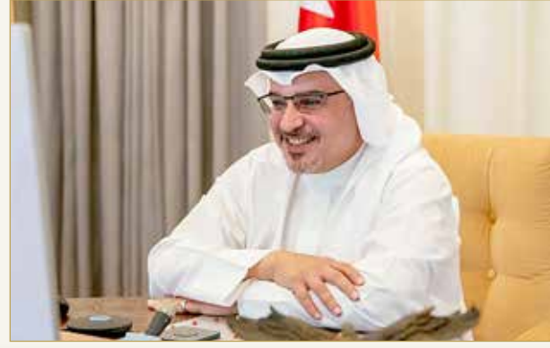
سمو ولي العهد بترأس اجتماع اللجنة التنسيقية

ترأس ولي العهد نائب القائد الأعلى النائب الأول لرئيس مجلس الوزراء صاحب السمو الملكي الأمير سلمان بن حمد آل خليفة اجتماع اللجنة التنسيقية رقم 342 الذي عقد عن بعد، إذ اطلعت اللجنة على عرض بشأن تصنيف مملكة البحرين في تقرير الأمم المتحدة للحكومة الإلكترونية 2020. كما اطلعت اللجنة على آلية تقييم مراكز الخدمة الحكومية 2020 ومستجدات مركز الجينيوم الوطني، إضافة إلى آخر مستجدات التعامل مع فيروس كورونا (كوفيد 19).