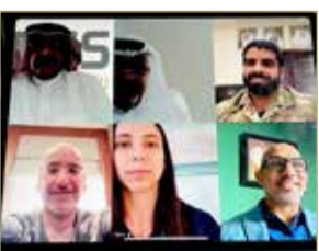
المشاركين في الاجتماع