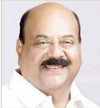
ماني سي كاين

مجرد عمل حب، بل هو علامة مميزة للأخوة العالمية والوئام الثقافي، لقد أثبتت البحرين، كونها موطناً رائعاً للعديد من سكان كيرلا، والأفراد الأعزاء من بلدي المحلي والمغتربين الآخرين، مرة أخرى قيمها الراسخة المتمثلة في الحرية بين الأديان والاحترام المتبادل. بكل سرور، اسمحو لي أن أغتنم هذه الفرصة لأشكر القادة الأكثر احتراماً ورؤية في البحرين وسمو الشيخ ناصر على نهجهم المنفتح في تعزيز التعايش الثقافي. مرة أخرى، شكراً سموكم وكل التوفيق على أنشطتكم الإنسانية".