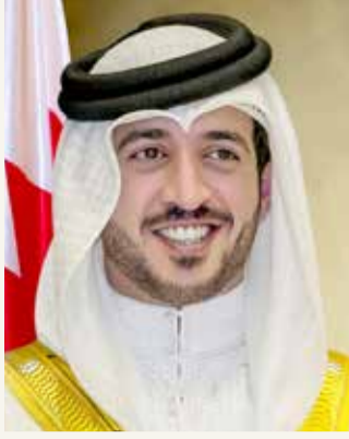
سمو الشيخ خالد بن حمد

تعكس الجهود المتميزة التي يبذلها سمو الشيخ ناصر بن حمد آل خليفة، وما يوليه سموه من رعاية ودعم لرياضة الترايثلون،