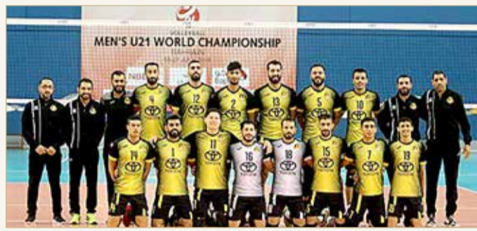
فريق الأهلي لكرة الطائرة (أرشيفية)

الأهلي تدريباته وحاض أول حصة تدريبية يوم السبت الماضي بقيادة المدرب التونسي أيمن المنصالي استعدادا للموسم المقبل والذي سينطلق ببطولة الدوري مطلع شهر نوفمبر القادم بعد إلغاء مسابقة كأس الاتحاد ليقصر الموسم على بطولتي الدوري وكأس سمو ولي العهد.