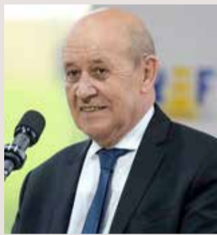
وزير الخارجية الفرنسي جان إيف لودريان

الأوروبي، وفي مقدمتها فرنسا، مع تركيا توتراً شديداً خصوصاً بشأن القضية الليبية ومسألة الهجرة فضلاً عن احتياطات الغاز في شرق البحر المتوسط. وتتهم أنقرة بانتعاج سياسة توسعية، وأضاف لودريان "نقول لتركيا: من الآن وحتى عقد المجلس الأوروبي يجب إبداء القدرة على مناقشة ملف شرق المتوسط هذه أولاً، معتبراً أن "أمر مناقشة هذه المسألة يعود للترك. هذا ممكن. حينها، ندخل في مرحلة فعالة لحل جميع المشاكل المطروحة" وأصبح الوضع متقلباً خصوصاً في المنطقة بعد شهر من التصعيد الذي بدأ في 10 أغسطس عندما أرسلت تركيا