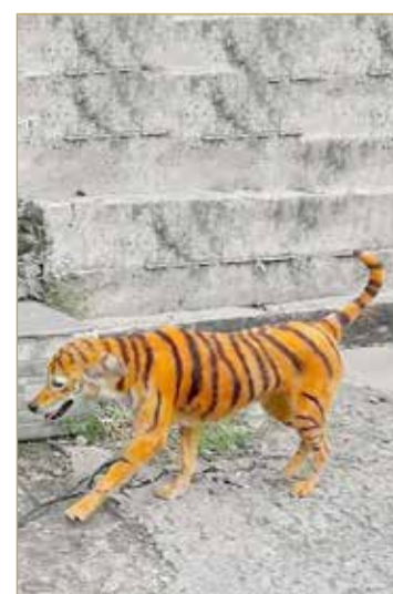
وشاهد الكلب يتجول لساعات طويلة في أماكن عدة في مدينة ماليزيا، بالوانه المميزة، ما تسبب بقلق بعض المواطنين وخوف الاهالي على ابنائهم.

صدم المارة في شوارع ماليزيا بوجود نمرة مخطط يتجول في شوارع المدينة ما تسبب بحالة من الذعر بين السكان، بمجرد رؤيتهم لألوانه المميزة.