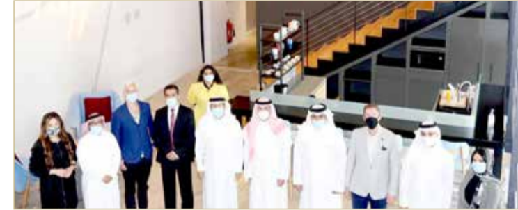
محافظ العاصمة يزور حاضنة الأعمال "ديوان"

محافظ العاصمة: الحاضنات منصات مهمة لتبادل الخبرات