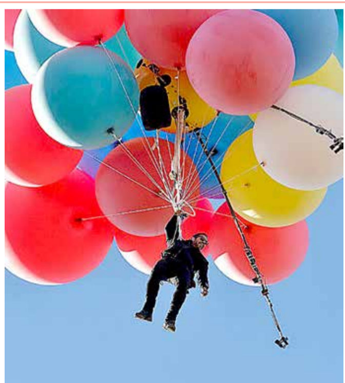
الأميركي ديفيد بلايني يطير على ارتفاع 8 آلاف متر في الهواء مستخدما 52 بالوتا مملوءة بغاز الهيليوم، ولاية أريزونا

طور فريق من الباحثين في استراليا نوعية من الجلد الصناعي يمكنه التفاعل مع الألم على غرار البشر، ما يفتح الباب على مصراعيه أمام ابتكار أطراف صناعية أفضل وروبوتات وبدائل للجلد البشري. وأفاد الموقع الإلكتروني "techxplore" أن فريق بحثي من جامعة "أ.إم.أي. تي" في مدينة ملبورن الأسترالية استطاع تقليد الطريقة التي يشعر بها الجلد البشري بالألم. وأكد رئيس فريق الدراسة مادهو بهاسكاران أن النموذج الأولي للجلد الصناعي تمثل تطورا ملموسا نحو الجيل المقبل من تقنيات الطب الحيوي والروبوتات الذكية، وأوضح أن "الجلد هو أكبر عضو استشعار في الجسم البشري، ويتميز بمواصفات مركبة تعمل كوحدة استشعار سريع .