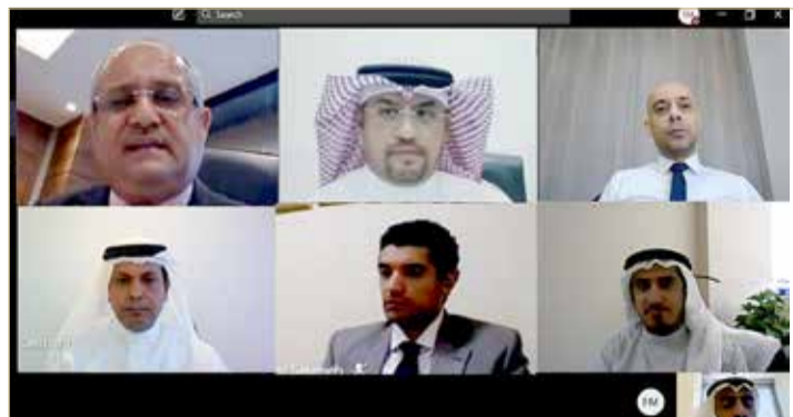
جانب من اللقاء

بتغطية المصاريف التي ترتبت على توقف عملها بسبب الجائحة والحد من آثارها. وأوضح الجشي أن جانب الجمعية تطرق أيضاً خلال الاجتماع إلى إمكانية الحصول على دعم تمكين في تسهيل الإجراءات حصول معاهد التدريب على قروض بأرباح معقولة وإجراءات مبسطة، وذلك عن طريق برنامج "تمويل+" أو "تمويل+" من "تمكين"، أو أية طريقة متاحة. وأكد الجشي في نهاية تصريحه أن مبادرات جمعية البحرين لمعاهد التدريب لاقت كل الاهتمام من قبل جناحي، منوها بحرصه على فتح قناة تواصل دائمة وفاعلة مع الجمعية كممثل منتخب عن جميع معاهد التدريب، واستعداده لتكثيف اللقاءات والمشاورات خلال المرحلة القادمة من أجل مواصلة مناقشة جميع المستجدات والتحديات بما يحقق الأهداف المنشودة لكل من تمكين والجمعية.