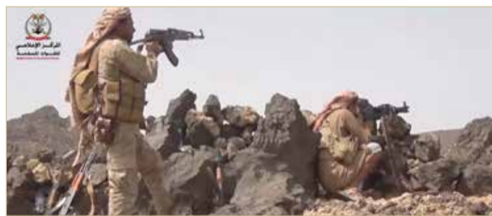
من جبهة صرواح غربي محافظة مارب

الحوثيون يعلنون "انتصارات وهمية" رغم حالة الانهيار