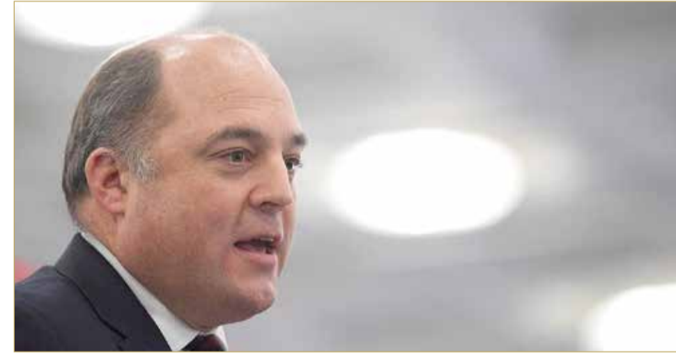
وزير الدفاع البريطاني بن والاس

الطائرات المسييرة من دون طيار أو صواريخ الكروز، أو حتى من التهديد الإيراني. هذا أمر مهم جدا الحفاظ عليه في المنطقة". وأشار أيضا إلى أن الإيرانيين يستخدمون الحروب الإلكترونية لتهديد الملاحة البحرية في الخليج، مشددا على أهمية التصدي لهذا الخطر. (10)