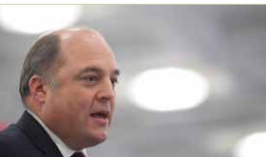
وزير الدفاع البريطاني بن والس

وزير الدفاع يكشف عن منح الرياض تراخيص أسلحة جديدة