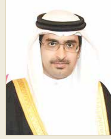
سمو الشيخ خليفة بن علي

سمو محافظ الجنوبية: مبادرات تواكب التواصل الإلكتروني والتحول الرقمي