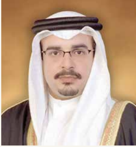
سمو ولي العهد

بمناسبة تكريم سموه لأفضل الجهات من حيث الأداء في "تواصل"