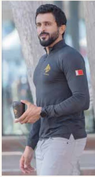
سمو الشيخ ناصر بن حمد