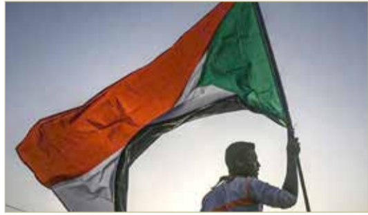
شاب سوداني بلوح يعلم بلده في الخرطوم

◆ 7 قتلى و23 جريحا في اشتباكات عنيفة بمدينة كسلا