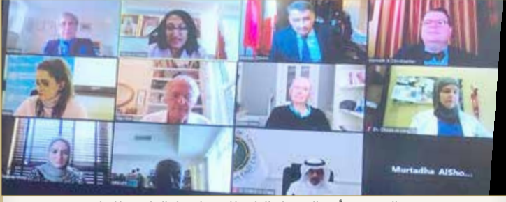
وزيرة الصحة ترأس الاجتماع الثاني للجنة اختيار الفائزين للجائزة

الأولى لـ 3 بحرينيين أعدوا أبحاثاً علاجية والثانية للإنجازات المتميزة