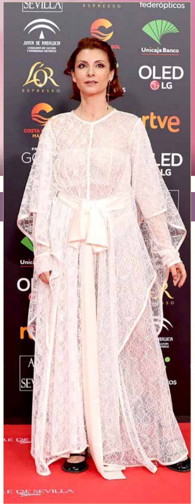
« حصلت المغنية والممثلة الإسبانية ذات الأصول الأردنية نجوى نمري على الجائزة الفخرية الكبرى من مهرجان سبتغيس السينمائي الدولي تقديراً لمسيرتها الفنية. وفي تصريحات صحفية بعد حصولها على الجائزة، قالت نمري البالغة من العمر 48 عاماً مساء السبت إنها تود تقديم «فيلم كوميدي أو عمل يعالج سيرة ذاتية أو حدث تاريخي».

ولكن هناك بعض الأعراض التي ينفرد بها فيروس