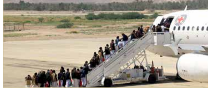
دفعة من الاسرى في مطار سيون

◆ تحالف دعم الشرعية يؤكد وصول 15 أسيرا سعودياً إلى الرياض