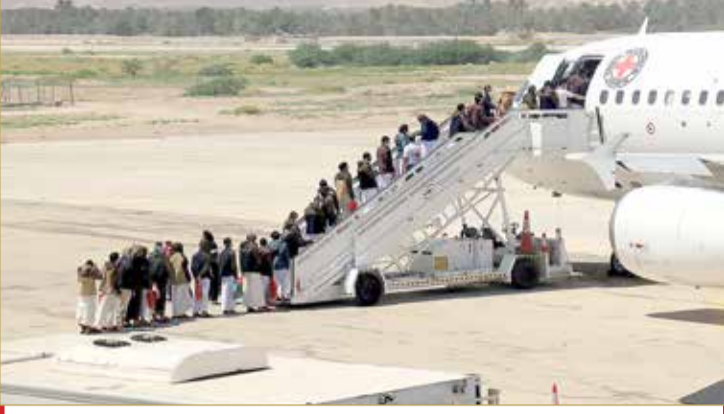
دفعة من الأسرى في مطار سينون (10)