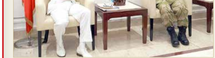
الصخير - الحرس الوطني

”إنجاز البحرين“: إطلاق برامج لغرس مفاهيم ريادة الأعمال