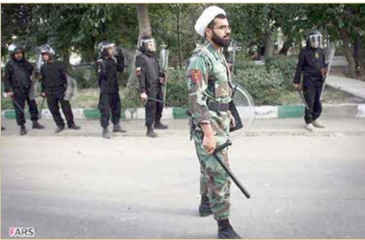
عصر من باسج رجال الدين يشارك في قمع مظاهرات نوفمبر الماضي في إيران.

قمع وحرمان الأقليات.. أعمال تعذيب واحتجاز تعسفي.. واعتراقات بالإكراه