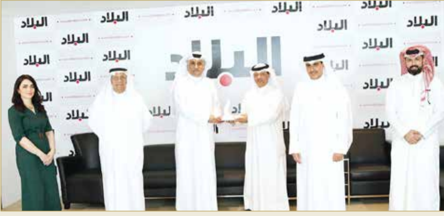
رئيس التحرير متسلماً التكريم

♦ “البلاد”: مبادرات سمو الشيخ عيسى بن علي قبس نور يهتدي به الجميع في خدمة الإنسانية