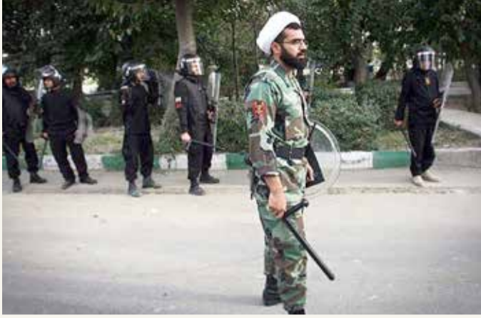
عنصر من باسج رجال الدين يشارك في قمع تظاهرات نوفمبر الماضي في إيران.

كما عبر عن القلق إزاء استمرار التمييز ضد النساء فيما يتعلق بشؤون الأسرة وحرية التنقل والعمل والثقافة والرياضة، فضلا عن الوصول إلى الوظائف السياسية والقضائية. وقال إن التمييز والعنف ضد أفراد الأقليات الإثنية والدينية في إيران أدى إلى وقوع وفيات وإصابات واعتقالات وإصدار أحكام، فضلا عن السجن لفترات طويلة والوفاة بتهم تتعلق بالأمن القومي.