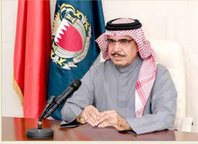
وزير الداخلية في زيارة لمديرية شرطة المحرق

“أم المدن“ هي الأصل وفاقد الغيرة على أصله لا خير فيه