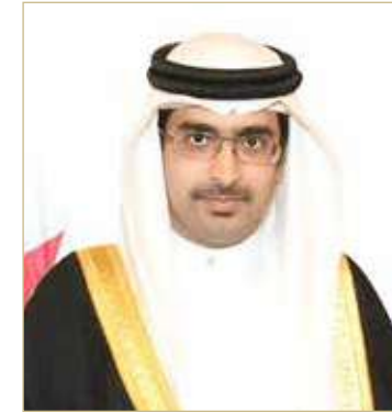
سمو محافظ المحافظة الجنوبية

عبر محافظ الجنوبية سمو الشيخ خليفة بن علي بن خليفة آل خليفة، عن خالص شكر وامتنان أهالي المحافظة بمختلف مدننا وقراها لعاهل البلاد صاحب الجلالة الملك حمد بن عيسى آل خليفة، مثنين اعتزازهم وفخرهم بما يحظون به من رعاية وحرص من جلالتهم على توفير حياة كريمة للمواطنين والعمل على تأمين مصادر أرزاقهم، مثنين في الوقت ذاته رفض مجلس الوزراء في اجتماعه أمس برئاسة ولي العهد رئيس الوزراء صاحب السمو الملكي الأمير سلمان بن حمد آل خليفة، لأي أعمال مسيئة بحق المواطنين، وأنه سيتم اتخاذ الإجراءات اللازمة لحفظ حقوقهم، كما نقل سمو المحافظ، تقدير المواطنين في المحافظة لجهود دعم الصيادين البحرينيين، وما قامت به وزارة الداخلية من إجراءات لحصر الأضرار التي لحقت بهم لتعويضهم، جراء الإجراءات المتخذة من السلطات القطرية.