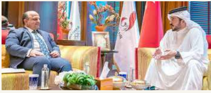
سمو الشيخ خالد بن حمد خلال لقائه علي إسحاقى

◆ سموه استقبل إسحاقى واطلع على ملف أولمبياد طوكيو