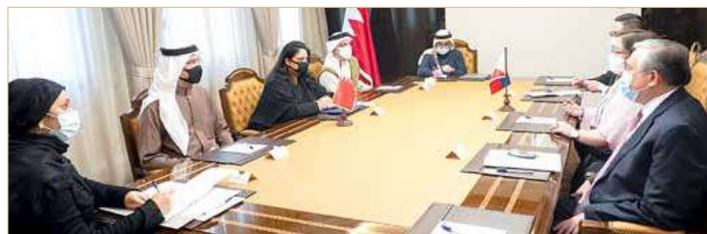
المنامة - وزارة الخارجية

أكدت وكيل وزارة الخارجية الشيخة رنا بنت عيسى بن دعيح آل خليفة أن علاقات الصداقة بين مملكة البحرين وجمهورية الفلبين مقبلة على مرحلة أكثر تطوراً وازدهاراً على المستويات كافة في ظل سياسة عاهل البلاد صاحب الجلالة الملك حمد بن عيسى آل خليفة، بالانفتاح والتعاون مع دول العالم وما يوليه ولي العهد رئيس مجلس الوزراء صاحب السمو الملكي الأمير سلمان بن حمد آل خليفة، من اهتمام كبير لتطوير مختلف أوجه العمل المشترك مع جمهورية الفلبين بما يدعم جهود التنمية والازدهار في البلدين. جاء ذلك، لدى استقبال الشيخة رنا، أمس بالديوان العام للوزارة، وكيل وزارة الشؤون الخارجية لشؤون العمال المهاجرين بجمهورية الفلبين سارة لو أريولا، والوفد المرافق. وعبرت أريولا عن اعتزاز جمهورية الفلبين بعلاقات الصداقة الوثيقة مع مملكة البحرين وما تشهده من تقدم مستمر على كل الأصعدة، مشيدة بمواقف مملكة البحرين الداعمة لجمهورية الفلبين وبدورها البارز في تعزيز الأمن والسلم على المستويين الإقليمي والدولي. ونوهت أريولا بالتجربة المتميزة