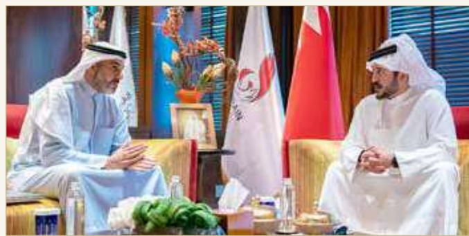
سمو الشيخ خالد بن حمد خلال لقائه محمد بن دعيح

الشيخ محمد بن دعيح آل خليفة في تنفيذ الخطط والبرامج للارتقاء برياضة # ذوي_العزيمة، لتواصل تحقيق المزيد من الإنجازات في المشاركات القارية والدولية. واطلع سموه على خطة اللجنة البارالمبية البحرينية للعام الجديد، والتي تتضمن مشاركات المنتخبات الوطنية، وكذلك الترتيبات والإجراءات التي ستقوم بها اللجنة لاستضافة وتنظيم دورة الألعاب البارالمبية الآسيوية للشباب في الفترة 1-10 ديسمبر 2021، متمنياً