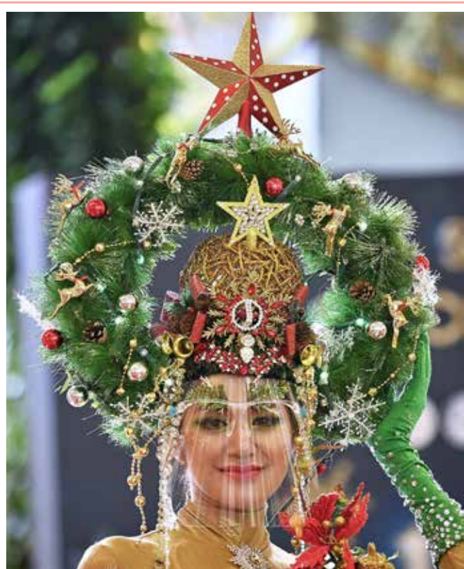
عازنة تعتمر شجرة عيد الميلاد وترتدي درعاً للوجه في مركز تسوق في بانكوك

كشفت دراسة جديدة أن الأشخاص الذين تعافوا من الإصابة بفيروس كورونا المستجد يحتفظون بذاكرة مناعية للحماية من العدوى مرة أخرى. وذكر موقع "medisite" أن الدراسة التي أجراها باحثون أستراليون أن هذه المناعة قد تستمر مع المتعافين لمدة 8 أشهر على الأقل. وأشار الباحثون إلى دور الخلايا اللمفاوية في تأمين المناعة ضد فيروس كورونا المستجد بعد الإصابة به. وأثناء الدراسة، فحص الباحثون حالة 25 مصاباً بكورونا، إذ جرت مراقبة معدل المناعة المكتسبة لديهم بعد التعافي، وتحديدًا بين اليوم الرابع واليوم الـ242 بعد الإصابة. وتبين أن معدل الأجسام المضادة يبدأ في الانخفاض بعد اليوم الـ20 من التعافي.