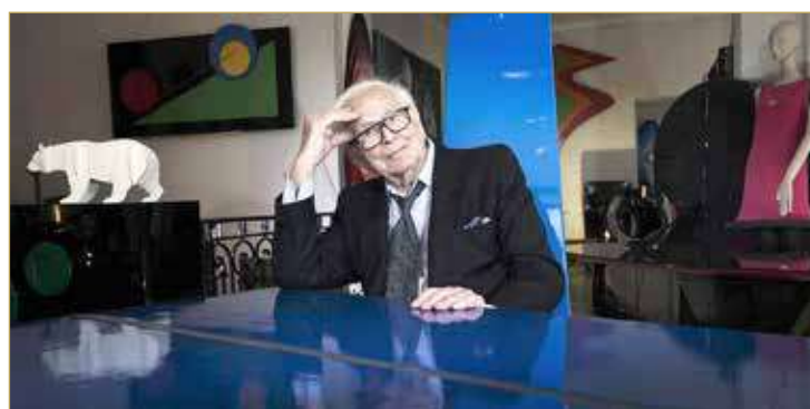
وبدا كاردان بإطلاق مجموعة ملابس رجالية في البداية، ثم شرع في إطلاق مجموعات أخرى نسائية، منذ سنة 1957، ثم نواتل محطات الجناح الخاصة بالراحل.

أعلنت أكاديمية الفنون الفرنسية، الثلاثاء، وفاة مصمم الأزياء الشهير، بيير كاردان، عن عمر ناهز 98 عاماً، في منطقة نوبي، غربي العاصمة باريس. وأسس كاردان دار الأزياء الأولى سنة 1950، ولم يفارقه شغف "الموضة" منذ ذلك الحين، إلى أن حصد شهرة واسعة وفتحت فروع الدار في مختلف مناطق العالم. ويعد الراحل رجلاً عصامياً، بحسب