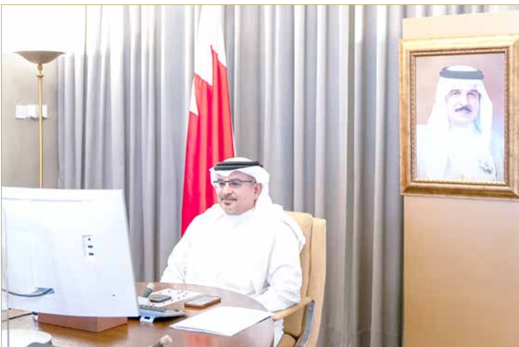
سمو ولي العهد رئيس الوزراء في لقاء مع المتأملين في مسابقة الابتكار الحكومي (فكرة)

♦ سمو ولي العهد رئيس الوزراء: خلق الفرص لتحقيق التميز