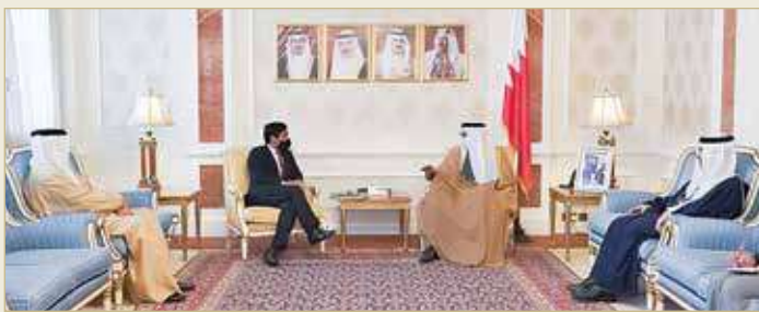
المنامة - وزارة الخارجية

أن مملكة البحرين تعد نموذجاً للتأخي والسلام والتعايش والتسامح بين الأديان والثقافات، لما تنعم به من حرية وانفتاح كبيرين في ممارسة الشعائر الدينية لمختلف المذاهب دون تفرقة أو تعصب، منوهاً بأوجه التعاون القائم بين مملكة البحرين والمملكة المتحدة وما تمتاز به من حرص متواصل ومتبادل من كلا البلدين الصديقين على تعزيزها وتمييزها بما يعود عليهما بالنفع والخير، متمنياً لمملكة البحرين دوام التقدم والنماء.