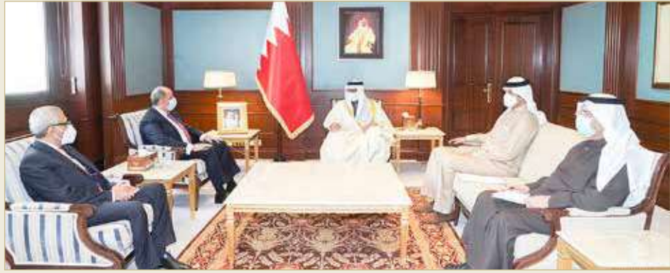
المنامة - وزارة الخارجية

استقبل وزير الخارجية، عبداللطيف بن راشد الزياني، أمس، بالديوان العام للوزارة، كلا من سفير المملكة الأردنية الهاشمية لدى مملكة البحرين، رامي العدوان، وسفير جمهورية مصر العربية لدى مملكة البحرين، ياسر شعبان، بحضور وكيل وزارة الخارجية للشؤون الدولية، الشيخ عبدالله بن أحمد آل خليفة، ووكيل وزارة الخارجية للشؤون الإقليمية ومجلس التعاون وحيد مبارك سيار. وتم خلال الاستقبال بحث العلاقات الأخوية التاريخية الراسخة التي تربط بين مملكة البحرين وكل من المملكة الأردنية الهاشمية الشقيقة وجمهورية مصر العربية الشقيقة، وما وصلت إليه من مستوى متميز في كافة المجالات.