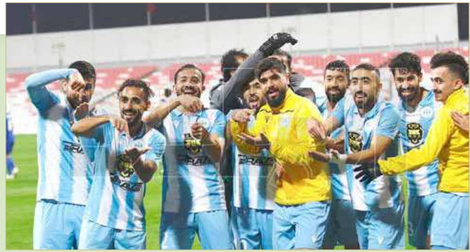
فرحة رفاعية بالهدف