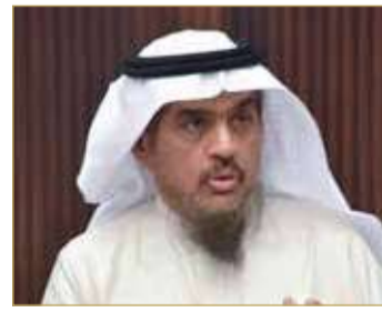
رئيس ديوان الخدمة

وأشارت الوزارة إلى أنها اختارت 75 باحثاً عن عمل لتنفيذ مهام إدارية ومالية وفنية للبرنامج الوطني للتوظيف، إذ تم التعاقد معهم بصفة «عقود تدريب» مؤقتة؛ لإكسابهم المهارات اللازمة لسوق العمل ومساندة المشروع في تحقيق أهدافه. وقالت الوزارة إنها لجأت إلى تخصيص