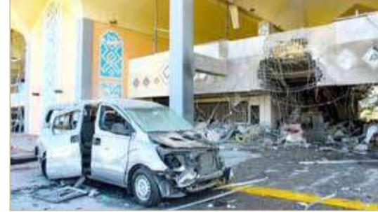
الانفجار وقع عند مدخل الصالة

الحوثية في تصعيدها باستهداف اليمنيين وتجمعاتهم السكانية (...) ضاربة عرض الحائط بالقانون الدولي الإنساني ومتنصلة من جميع الاتفاقات المبرمة". ونقلت قناة "المسيرة" الحوثية عن محافظ الحديدة المعين من قبل الحوثيين قوله "الحادثة مؤلمة جداً، وللأسف هذه جريمة من جرائم تسكت عنها الأمم المتحدة وصمتها يشجع مرتزقة العدوان على ارتكاب جرائم". وأضاف "قوى العدوان ترتكب الجرائم ولا تتردد في إلقاء اللائمة على الآخرين". وروى شاهد أن "الانفجار وقع عند مدخل المجمع المؤلف من عدة قاعات للأفراح" في منطقة يسيطر عليها الحوثيون، مضيفاً أن الحشود كانت تحضر زفاف أحد أنصار المتطرفين.