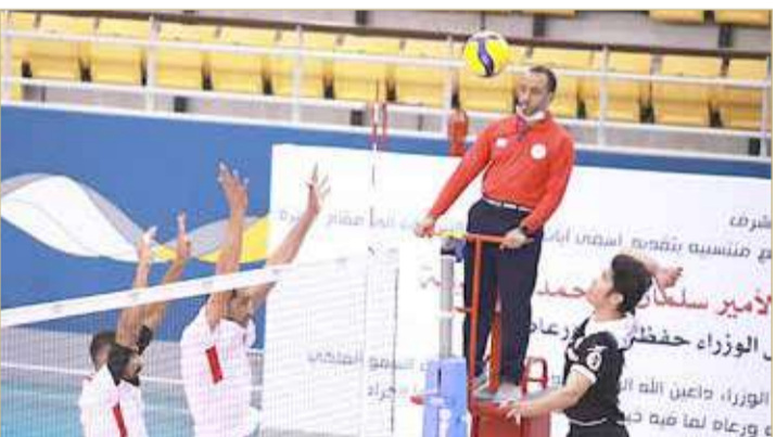
المحرق كبر انتصاره على بني جمرة