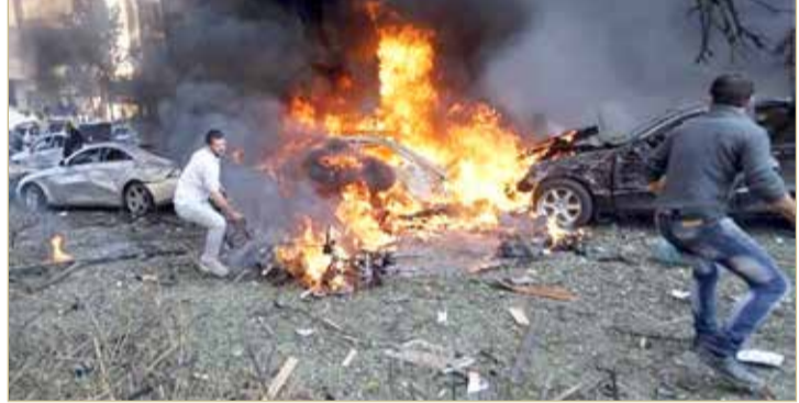
السنة النيران تصاعد جراء الانفجار

في أكتوبر 2019 ضد المقاتلين الأكراد، على منطقة حدودية واسعة بطول نحو 120 كيلومتراً بين مدينتي تل أبيب (شمال الرقة) ورأس العين (شمال الحسكة). ومنذ ذلك الحين، تشهد المنطقة تفجيرات عدة بسيارات ودراجات مفخخة نادراً ما تعلن أي جهة مسؤوليتها عنها.