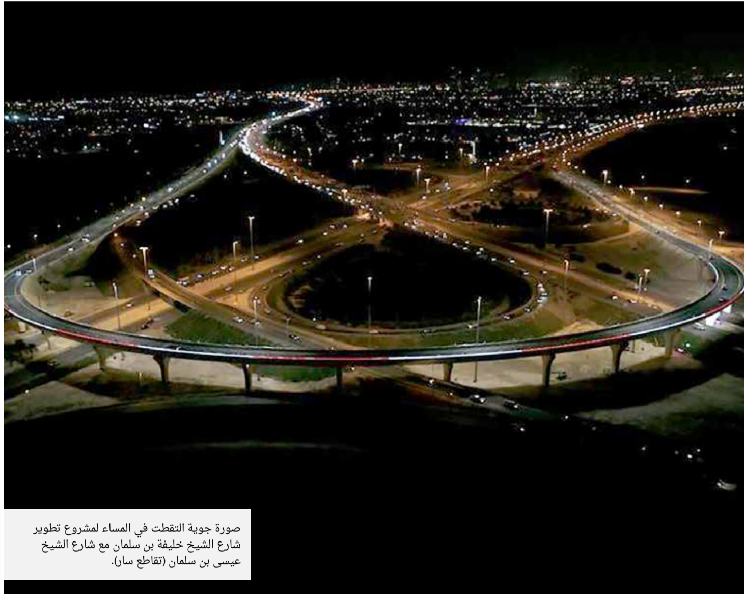
صورة جوية التقطت في السماء لمشروع تطوير شارع الشيخ خليفة بن سلمان مع شارع الشيخ عيسى بن سلمان (تقاطع سار).

إدارة التحرير: +973 17111444 / +973 17111467 / 385 @albiladpress.com / 2008 / تصدر عن دار البلاد للصحافة والنشر والتوزيع / س.ت 67133 / تطبع في مؤسسة الأيام للنشر / قسم الإعلانات: 508 / +973 17111501 / +973 32224492 / 39615645 / +973 17580939 / +973 17111432 / +973 17111434