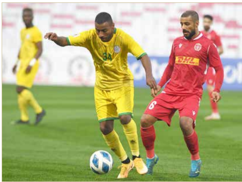
من لقاء المحرق والمالكية

المالود و"سمعة" حققا الفوز الأول "ل"الذيب"