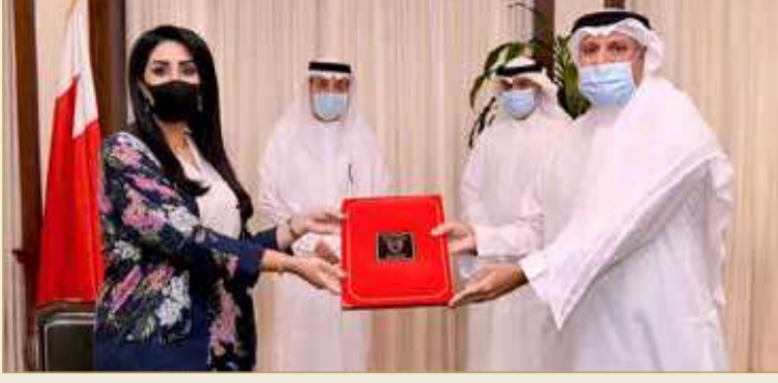
من توقيع مذكرات التفاهم مع المؤسسات التدريبية لتأهيل الكوادر الوطنية لسوق العمل

توظيف 19 ألف بحريني... ودفع الرواتب ساهم باستقرار العمالة الوطنية