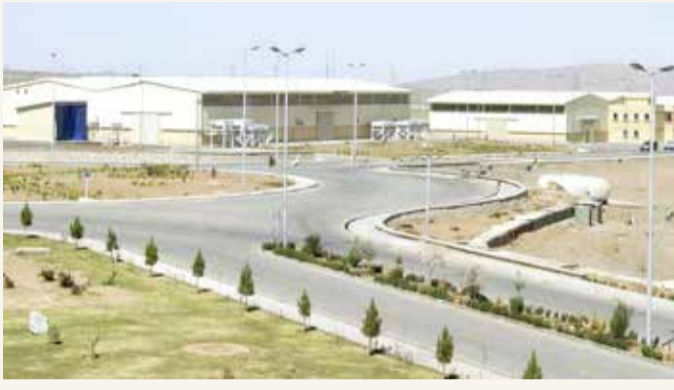
منشأة فوردو النووية "أرشيفية"

الأولى لاغتيال اللواء قاسم سليمانى، قائد فيلق القدس في الحرس الثوري، بغارة أميركية في العراق في الثالث من يناير 2020. وقال "نحن هنا اليوم لنجري تقييماً وتكون متأكدين من قدراتنا القوية في البحر وضد الأعداء الذين يفاخرون أحياناً (...) ويهددون"، بحسب الموقع الرسمي للحرس "سبها نيوز"، وأضاف "سترد بضربة متكافئة، حاسمة، وقوية، على أي خطوة قد يقدم عليها العدو ضدنا".