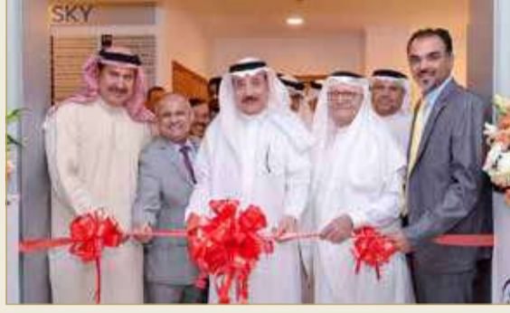
افتتاح مركز تدريب ريادة الأعمال