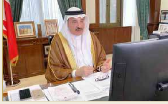
مشاركة الوزير في مؤتمر منظمة العمل الدولية

مدينة عيسى - وزارة العمل والتنمية الاجتماعية