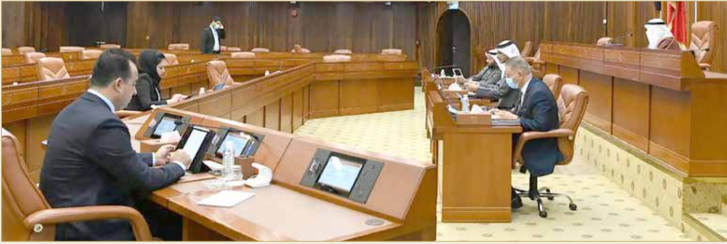
الجلسة الأخيرة لمجلس الشورى

4.7 مليون دينار وديعة بـ "البحرين الوطني"... و"الرقابة": لا تجاوزات بالمجلس