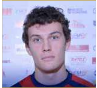
محترف داركليب السلوفاكي

العاشرة. يشار إلى أن داركليب يحتل المركز الثالث في الترتيب العام بـ 18 نقطة من ستة انتصارات وخسارتين، ويعتبر العتيد آخر ناد يتعاقد مع لاعب محترف بعد أن احتفظ المحرق بالكامبروني "كودي" والنجمة باللاعب البرازيلي "كوستا"، فيما تعاقد الأهلي مع البرازيلي "فيرناندو جوفينتينو"، والبيسيتين مع الروسي "سيرجي" وبني جمرة مع الفلبيني "اسبيديو" والنصر مع الإندونيسي "دونني" وعالي مع الإندونيسي "ريندي".