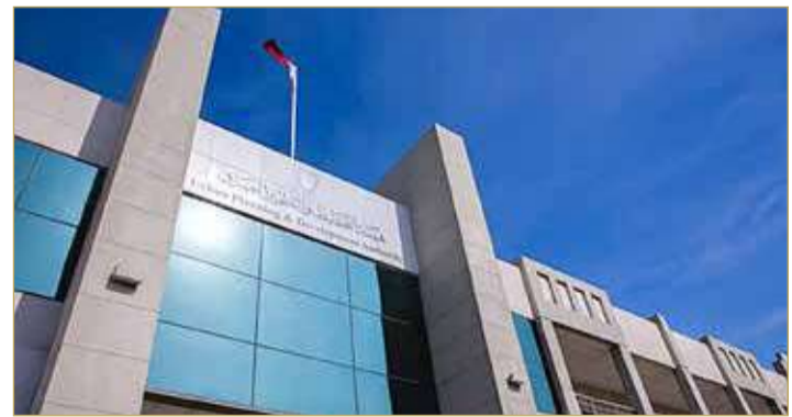
هيئة التخطيط والتطوير العمراني

خصوصاً أنه قد تضمن عقوبات جنائية لمن يخالف أحكامه. - لو كان يوجد ثمة ضرر - على فرض وجوده - فسبب ذلك خلو التشريع من نص يعالج المشكلة. - كافة القوانين ذات الصلة التي صدرت قبل القانون المدني أو بعد صدوره لم تلزم المحاكم بهذا الإجراء. - لو كان ثمة ضرر يلحق بالوزارة، فإن إزالة هذا الضرر لا تكون بطريق الاعتراض على الحكم، بل عن طريق ملء الفراغ التشريعي، وهو الأمر الذي تنحسر عنه وظيفة المحاكم احتراماً لمبدأ الفصل بين السلطات.