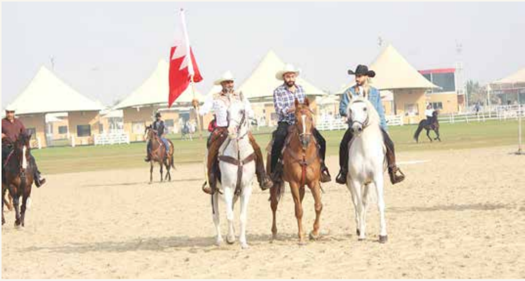
جانب من الفعالية

بمباركة ناصر بن حمد وبتنظيم لجنة رعاية الخيل والاتحاد الملكي