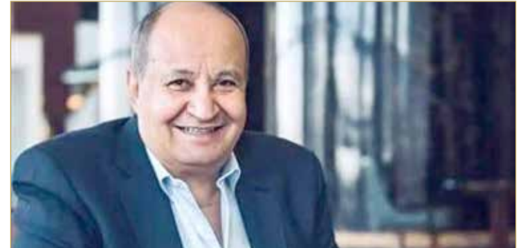
ومن أبرز المسلسلات التي تحمل اسمه، "البشائر" و"العائلة" و"الدم والنار" و"أوان الورد" و"الجماعة".

ويعد حامد من أكبر كتاب الأفلام السينمائية والمسلسلات التليفزيونية خلال العقود الأربعة الماضية في المنطقة العربية، وجسد شخصيات أعماله أبرز