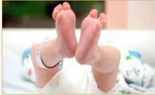
ولادة أثناء الغيوبه