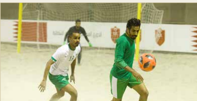
من مباراة البديع وأبراج التاخي

وفي المباراة الأخيرة تغلب فريق نادي داركليب على فريق مركز شباب البسيتين بخمسة أهداف دون مقابل ليرفع رصيده إلى ست نقاط من مباراتين، فيما بقي البسيتين من دون نقاط من ثلاث مباريات ضمن منافسات المجموعة الثالثة.