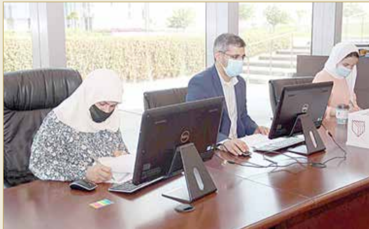
خلال إحدى جلسات مجلس المناقصات (أرشيفية)

وقد حضر عملية فتح العطاءات عدد من ممثلي الجهات المتصرفة والشركات المشاركة في المناقصات، وذلك في إطار التزام مجلس المناقصات والمزايدات الراسخ بتوفير معاملة عادلة لجميع الموردين والمقاولين تحقيقاً لمبدأ تكافؤ الفرص، وستتخذ جميع العطاءات المقدمة للمناقصات للتقييم الفني والمالي، وستتم الترسية على العطاء الأفضل شروطاً والأقل سعراً. ويمكن الاطلاع على التفاصيل الكاملة لجميع المناقصات والمزايدات التي تم فتح مظاريف عطاءاتها على الموقع الإلكتروني الرسمي لمجلس المناقصات والمزايدات www.tenderboard.gov.bh