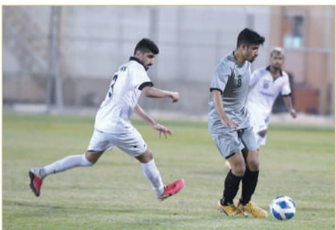
من لقاء مدينة عيسى والتضامن