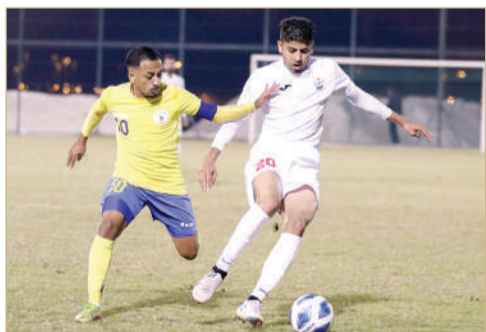
من لقاء قلالي وسترة

تعادل سلبي بين البحرين والاتفاق في ختام الجولة 5