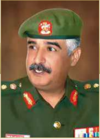
سمو الشيخ محمد بن عيسى

لتلبية نداء الوطن بكل كفاءة واقتدار لأداء واجبه السامي المشرف للدفاع عن الوطن والمحافظة على أمنه. ودعا الله العلي القدير أن يوفق الحرس الوطني، رئيساً ومنتسبين،