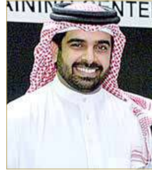
الشيخ سلمان بن محمد

فخره واعتزاز به بالجهود الطبية لتأسيس الحرس الوطني، مؤكداً سموه أن المكانة المرموقة التي يتبوها الحرس الوطني، جاءت بفضل رعاية ودعم عاهل البلاد ومتابعة سموه ولي العهد رئيس مجلس الوزراء، والتي أسهمت في وصول الحرس الوطني إلى الجاهزية العالية والاحترافية المتميزة والاستعداد الدائم لتلبية نداء الوطن.