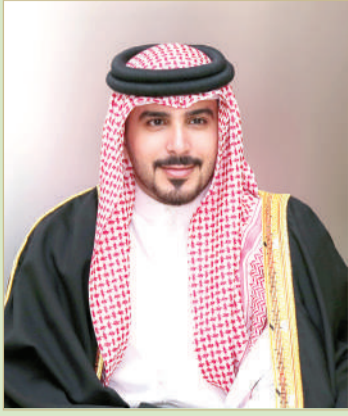
سمو الشيخ محمد بن سلمان

وسيقام الشوط الثامن والأخير على كأس العاديات ريسنج للفئة الثانية من جيات الدرجة الأولى "مستورد" مسافة 1800 متر والجائزة 8000 دينار.