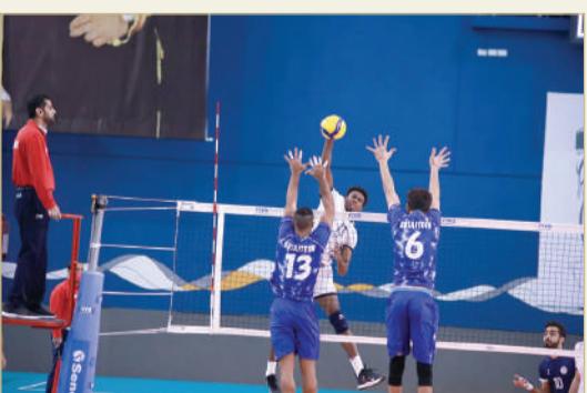
من لقاء النجمة والبسيتين