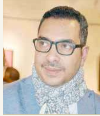
الفنان خالد الطهمازي

اختتم في متحف محمود مختار في القاهرة المعرض التشكيلي للفنان البحريني خالد الطهمازي والذي حمل عنوان "إيماءات الروح" والمنعقد في الفترة من 31-17 ديسمبر الماضي وحقق نجاحا كبيرا وإشادة من النقاد.