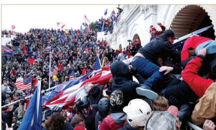
جانب من الفوضى التي وقعت في محيط الكابيتول

الديمقراطية الأميركية تتلقى ضربة موجعة هي الأولى في تاريخها