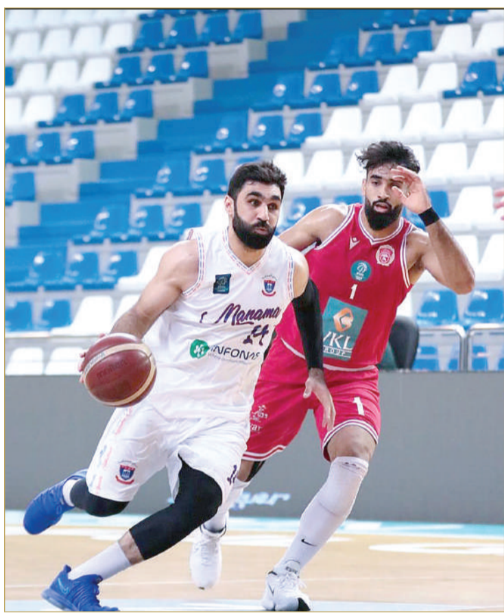
لقاء المحرق والمنامة