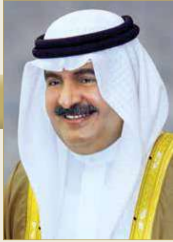
سمو الشيخ علي بن خليفة