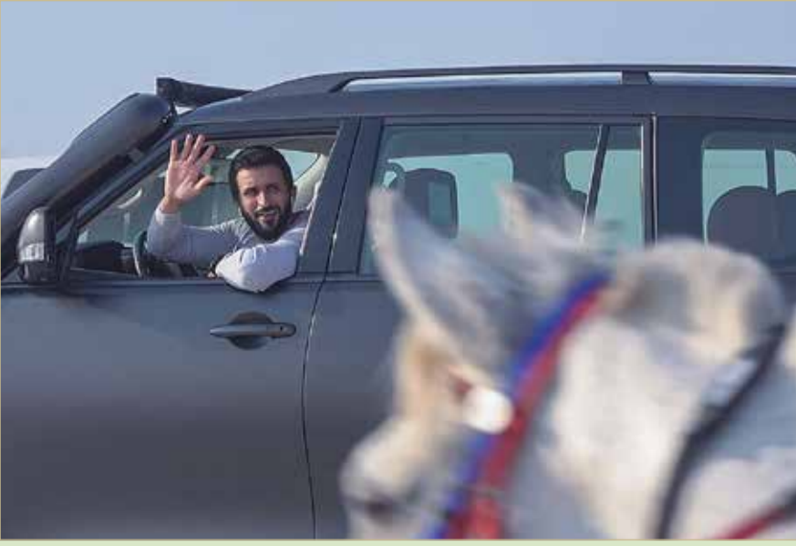
سمو الشيخ ناصر بن حمد يتابع المنافسات