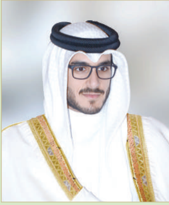
سمو الشيخ عيسى بن سلمان

الأولى "نتاج محلي" مسافة 1800 متر والجائزة 4000 دينار.