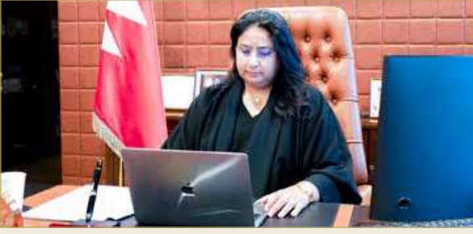
الشبيخة رنا بنت عيسى

رنا بنت عيسى: إجراءات وطنية فعالة لمواجهة الجريمة