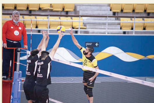
الأهلي أطاح بداركليب بسهولة

توقف رصيد البسيتين عند نقطتين لبقى في مؤخرة الترتيب وقريبا من الهبوط لدوري الدرجة الثانية مع تبقي 4 مباريات على انتهاء القسم الثاني من المسابقة.