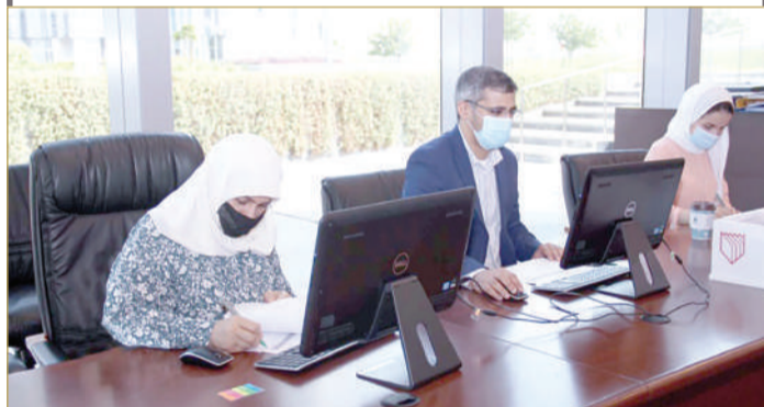
خلال إحدى جلسات مجلس المناقصات (أرشيفية)