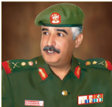
سمو الشيخ محمد بن عيسى

استقبل ملك البلاد القائد الأعلى صاحب الجلالة الملك حمد بن عيسى آل خليفة، في قصر الصافية أمس رئيس الحرس الوطني الفريق أول ركن سمو الشيخ محمد بن عيسى آل خليفة، بمناسبة الذكرى الرابعة والعشرين لتأسيس الحرس الوطني، حيث رفع سموه إلى المقام السامي لجلالة الملك خالص التهاني وأطيب التبريكات بهذه المناسبة الوطنية العزيرة.