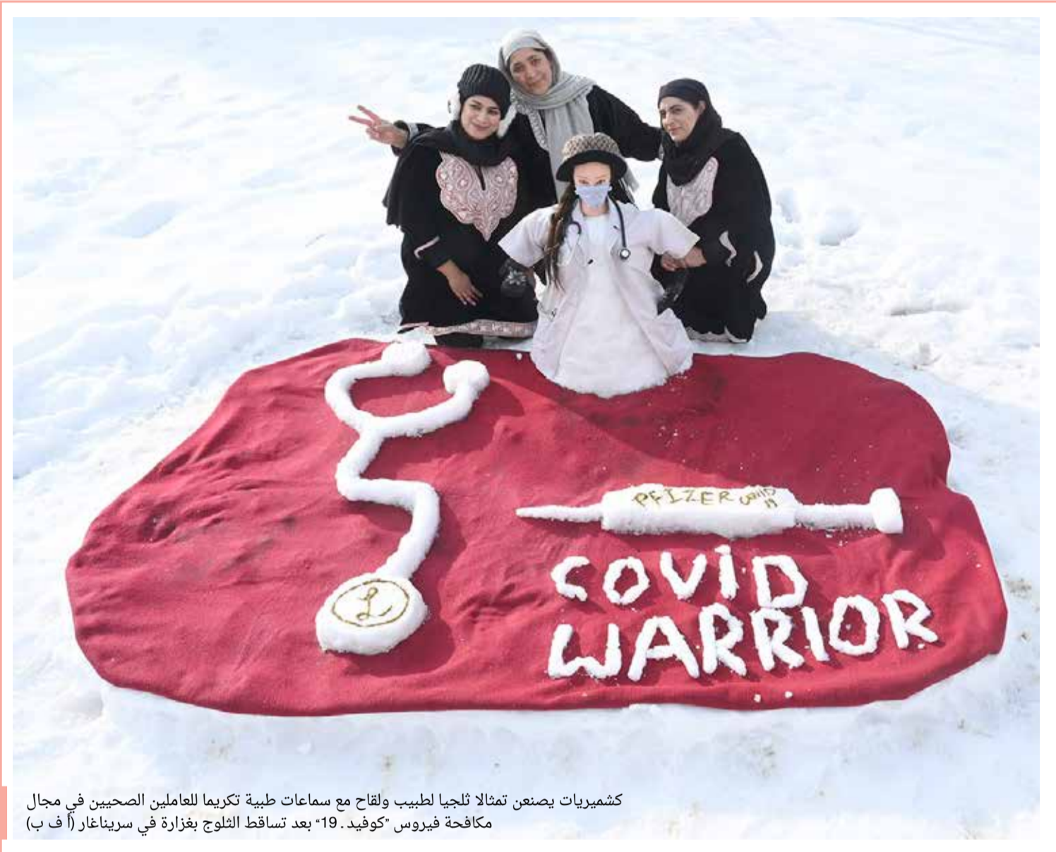
كشميريات يصنعن تمثالاً لتلجيا لطبيب ولقاح مع سماعات طبية تكريماً للعاملين الصحيين في مجال مكافحة فيروس "كوفيد.19" بعد تساقط الثلوج بغزارة في سريناغار