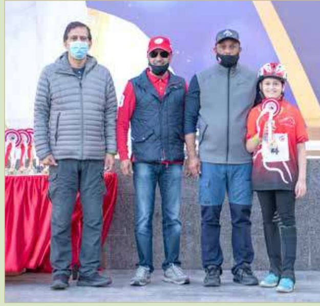
جانب من تتويج الفائزين