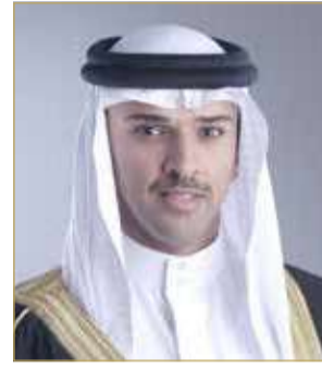
الشيخ علي بن خليفة

رفع رئيس مجلس إدارة الاتحاد البحريني لكرة القدم الشيخ علي بن خليفة بن أحمد آل خليفة، أسمى آيات التهاني والتبريكات إلى عاهل البلاد صاحب الجلالة الملك حمد بن عيسى آل خليفة، وإلى ولي العهد رئيس الوزراء صاحب السمو الملكي الأمير سلمان بن حمد آل خليفة؛ بمناسبة الاحتفال بالذكرى الـ 24 لتأسيس الحرس الوطني.