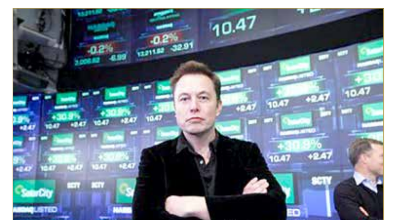
وقدرت محطة "سي إن بي سي" التلفزيونية الأميركية ثروة إلون ماسك بنحو 185 مليار دولار.

أصبح إلون ماسك صاحب شركة "تيسلا" لصناعة السيارات الكهربائية أسس الخميس أغنى أغنياء العالم بفضل ارتفاع سعر أسهم مجموعته في البورصة على ما ذكرت وكالة "بلومبرغ نيوز". ومع الارتفاع الكبير في سعر سهم تيسلا التي يملك 18% منها في البورصة، تجاوز رجل الأعمال البالغ 49 عاماً صاحب مجموعة "أمازون" جيف بيزوس الذي كان أثرياً أثرياً منذ العام 2017. ويملك إلون ماسك كذلك شركة "سبايس إكس" لتكنولوجيا الفضاء المتعاقدة مع وكالة الفضاء الأميركية (ناسا) لإرسال رحلات مأهولة وأخرى لنقل المؤن إلى محطة الفضاء الدولية.