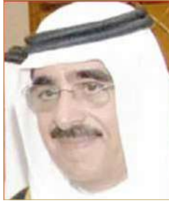
سمو الشيخ محمد بن خليفة

كما تلقى ولي العهد رئيس مجلس الوزراء صاحب السمو الملكي الأمير