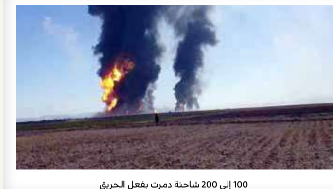
100 إلى 200 شاحنة دمرت بفعل الحريق

«إسلام قلعة - أ ف ب: أتى حريق على ما لا يقل عن مئة صهريج نفط وغاز في أفغانستان، في "كارثة" وقعت عند أحد أهم المعابر الحدودية مع إيران وخلفت أضراراً بملايين الدولارات، وفق ما أفاد مسؤولون الأحد. وتم إخماد الحريق الضخم الذي اندلع بعد ظهر السبت في معبر إسلام قلعة الواقع على بعد 120 كلم من مدينة هرات (غرب)، بالكامل تقريباً بينما فتح تحقيق بشأن أسبابه. وقال الناطق باسم حاكم ولاية هرات جيلاني فرهاد