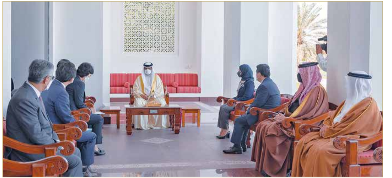
جلالة الملك يستقبل رئيس الجمعية الوطنية بجمهورية كوريا