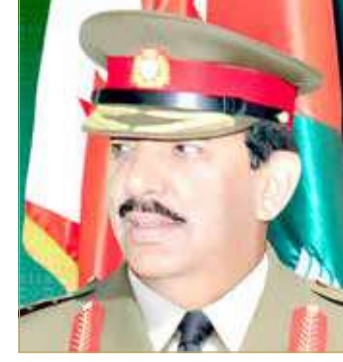
الشيخ خليفة بن احمد

بمناسبة نجاح الإنجاز التاريخي لدولة الإمارات العربية المتحدة الشقيقة بوصول مسبار الأمل إلى كوكب المريخ أكد القائد العام لقوة دفاع البحرين المشير الركن الشيخ خليفة بن أحمد آل خليفة أن نجاح "مسبار الأمل" في الوصول إلى مدار المريخ يمثل نجاحًا وإنجازًا تاريخيًا، ومصدر فخر واعتزاز ليس للأشقاء بدولة الإمارات العربية المتحدة فقط، بل لجميع الأشقاء بدول مجلس التعاون لدول الخليج العربية، ولجميع الأخوة في العالمين العربي والإسلامي وللبشرية جمعاء، والإنجاز العظيم يؤكد أن الوصول إلى القمة وتحقيق الأحلام يتطلب إرادة وعزيمة وتخطيطًا سليماً ومتابعة دؤوبة. وأشار إلى أن أحد أهم دروس الإنجاز التاريخي غير