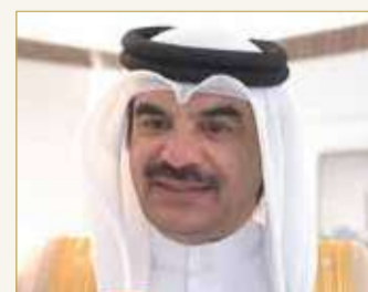
محمد السيسى البوعيين

موافقة بلغت 98.4% من المواطنين يؤكد الالتفاف الوطني الحر حول المشروع الإصلاحي، لما يشكل ميثاق العمل الوطني من وثيقة تاريخية مهمة أسست كل التحولات الديمقراطية التي شهدتها المملكة، وفق رؤية طموحة وواضحة قامت على كفالة الحريات العامة والمساواة بين المواطنين والعدالة والمساواة والشفافية وإرساء حكم القانون ودولة المؤسسات والديمقراطية وصون حقوق الإنسان، وتكملت بعودة الحياة البرلمانية، لتعكس بذلك رؤية حكيمة هدفت لإحداث تغيير شامل في سبيل المسيرة الإصلاحية الشاملة.“