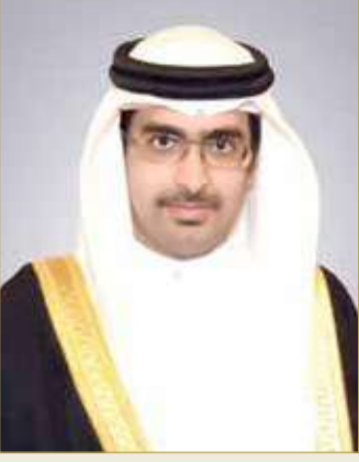
سمو الشيخ خليفة بن علي

♦ سمو الشيخ خليفة بن علي: بذل المزيد لخدمة أهالي "الجنوبية"