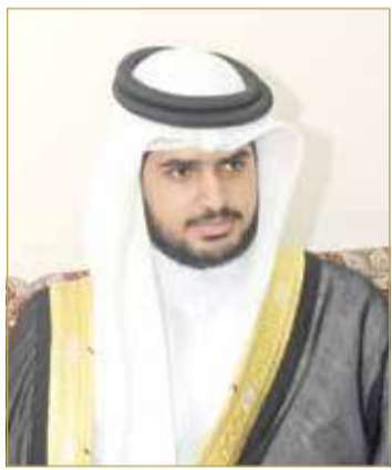
سمو الشيخ عيسى بن علي

♦ سمو الشيخ عيسى بن علي: ذكرى عزيزة على كل بحريني