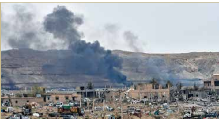
غالبا ما تتعرض مواقع الميليشيات الإيرانية في سوريا لضربات مجهولة

لتفادي الاستهدافات المتصاعدة التي طالتها وميليشياتها