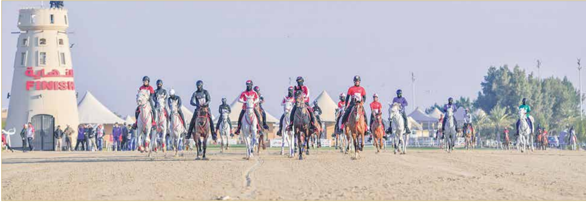
من المنافسات سابقا

أعرب عن تقديره لرعاية ودعم جلالة الملك لرياضات الفروسية