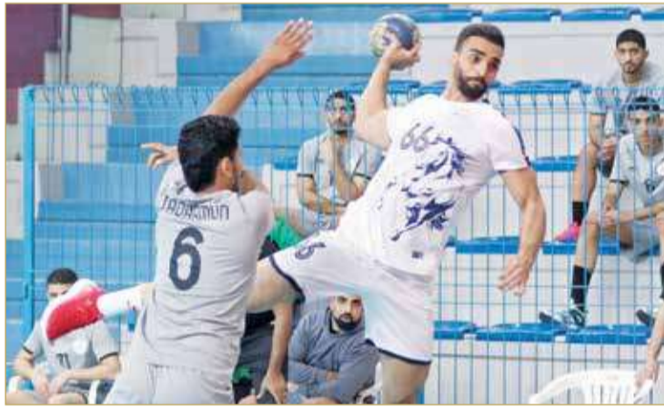
لقاء النجمة والتضامن