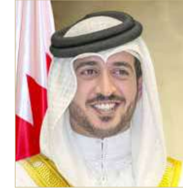
سمو الشيخ خالد بن حمد

وجاء في المادة (2) على الأمين العام وكافة المعنيين بتنفيذ هذا القرار - كل فيما يخصه - ويعمل به اعتباراً من تاريخ صدوره.