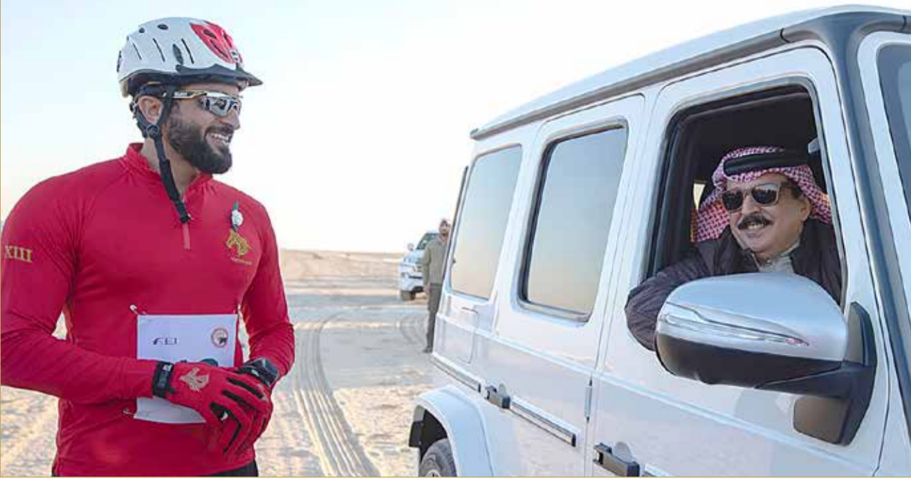
جلالة الملك مع سمو الشيخ ناصر بن حمد