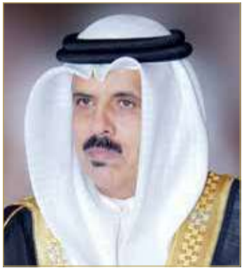
وزير التربية والتعليم

أكد وزير التربية والتعليم ماجد النعيمي، عضو لجنة ميثاق العمل الوطني: أن الاحتفال بمضي 20 سنة على ميثاق العمل الوطني لحظة مهمة في تاريخ مملكة البحرين نستذكر خلالها أمرين مهمين، أولاً: أن المشروع الإصلاحي لجلالة الملك، كان وراء النقلة النوعية التي تحققت في تاريخ البحرين المعاصر على كافة الأصعدة السياسية والتنموية والتعليمية. وأضاف: أن ميثاق العمل الوطني فتح الباب أمام مرحلة جديدة ومتطورة من الحياة السياسية والاجتماعية أمام جميع البحرينيين، من خلال ثوابت جامعة تجمع كافة البحرينيين، ولا شك أن هذا الاحتفال يشكل فرصة مهمة لتعزيز قيم الولاء للوطن، والوفاء لجلالة الملك حيث قدم لشعبه الكثير من العطاء والنماء والازدهار وحقق العديد