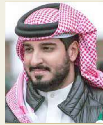
سمو الشيخ عيسى بن عبدالله

وأشار سمو الشيخ عيسى بن عبدالله آل خليفة أن المشروع الإصلاحي لجلالة الملك يعد مثالا رائدا في تحول البحرين الحديث ورسم مستقبل مشرق لمملكة البحرين خصوصا أنه صاغ معالم الفجر لمملكتنا الغالية برؤية جلالته الحكيمة التي ساهمت في تحقيق تطلعات أبناء البحرين ليكون