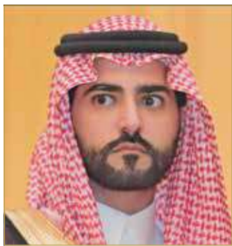
الأمير سلطان بن أحمد بن عبدالعزيز

رفع سفير خادم الحرمين الشريفين لدى مملكة البحرين صاحب السمو الملكي الأمير سلطان بن أحمد بن عبدالعزيز آل سعود أسمى آيات التهاني والتبريكات إلى عاهل البلاد صاحب الجلالة الملك حمد بن عيسى آل خليفة، وإلى ولي العهد رئيس الوزراء صاحب السمو الملكي الأمير سلمان بن حمد آل خليفة، وإلى الأسرة الحاكمة والشعب البحريني الشقيق، بمناسبة الذكرى السنوية العشرين لإقرار ميثاق العمل الوطني. وقال: تعتبر ذكرى التصويت على الميثاق الذي يصادف الـ 14 من