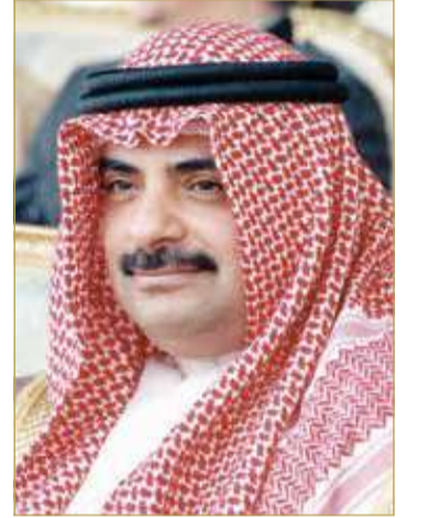
سمو الشيخ سلمان بن خليفة

تلقى ملك البلاد صاحب الجلالة الملك حمد بن عيسى آل خليفة برقية تهنئة من سمو الشيخ سلمان بن خليفة آل خليفة، بمناسبة الاحتفال بالذكرى العشرين للتصويت على ميثاق العمل الوطني.