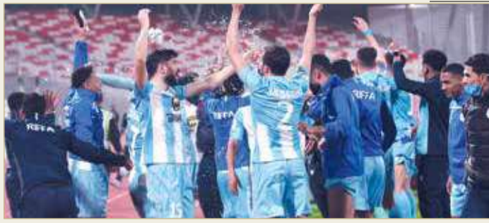
فرحة رفاعية بالتأهل