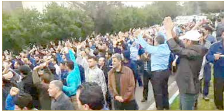
مظاهرات عمالية سابقة في إيران

صاحوا: نرزح تحت خط الفقر... واستولى اللصوص على حقوقنا