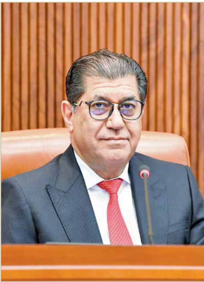
النائب الأول جمال فخرو مترئساً جانباً من جلسة مجلس الشورى

البلاد قال رئيس مجلس الشورى علي الصالح إن ذكرى ميثاق العمل الوطني العزيرة مضى عليها 20 عاماً تحققت خلالها إنجازات كبيرة، مؤكداً أن ما تشهده البحرين اليوم كله من ثمرات الميثاق الذي أرسى مبادئه جلاله الملك للتوافق مع شعب البحرين الكريم.