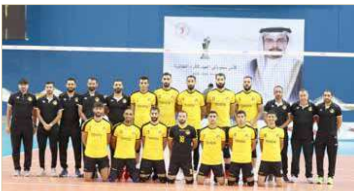
فريق الأهلي لكرة الطائرة

طائرة الأهلي تركز على الدوري ونسعى لكسب "الثلاثية"