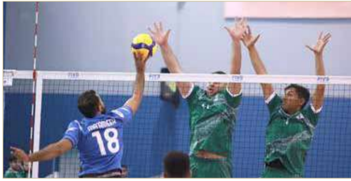
من لقاء المعامير واتحاد الريف

بعد فوزهما على اتحاد الريف والدير بتمهيدي كأس ولي العهد