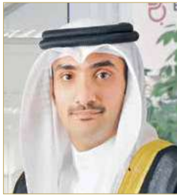
الشيخ عبدالله بن خليفة آل خليفة

جدارتها للحصول على هذا التصنيف وهذا بالتأكيد سينعكس إيجابًا على جميع الزبائن الذين سيحصلون على خدمة متميزة من موظفي بتلكو.