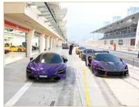
الإلكتروني الرسمي التالي (Bah- rain.McLaren.com).