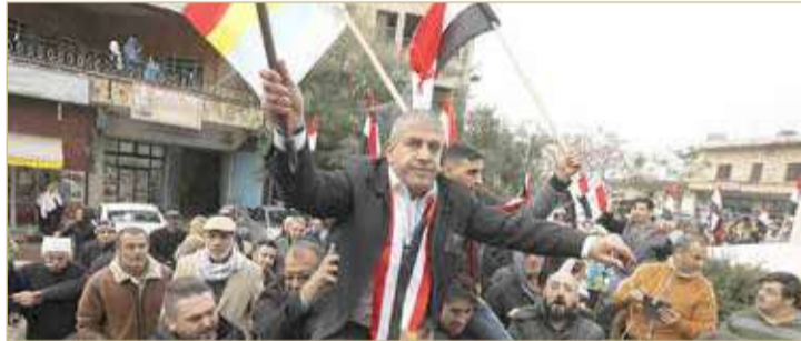
أجرت إسرائيل وسوريا صفقات تبادل أسرى في السابق