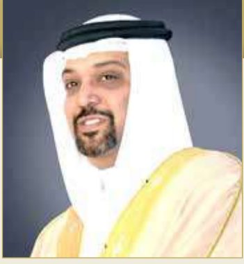
الشيخ سلمان بن خليفة

وزير "المالية": "النقد الدولي" أشاد بمساهمة البحرين في الحد من آثار تداعيات كورونا