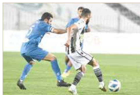
من لقاء الخالدية ومدينة عيسى

سترة والشباب يتعادلان سلبياً.. والبحرين يكسب الاتحاد