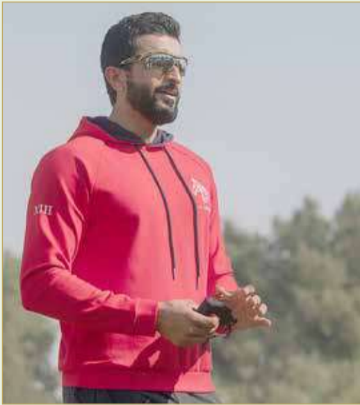
سمو الشيخ ناصر بن حمد

وقال "الجميع يأمل بالتحرف في الصعود على منصة التتويج؛ لأنها أعلى البطولات وتحمل اسم فارس المملكة الأول، لاشك أننا نسعى لتحقيق الإنجاز ولدينا العزيمة والإصرار على تحقيق أفضل المراكز". وتوقع سرحان العنزي أن تشهد السباقات سرعات عالية ومنافسة قوية بين جميع المشاركين.