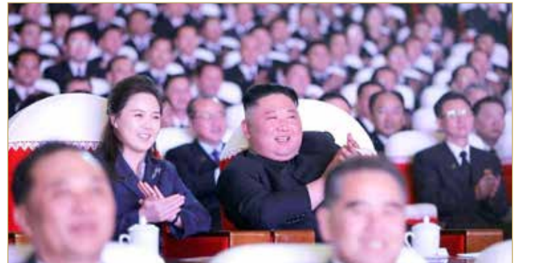
وخلال الأحداث سابقة عدة لم يظهر أي شخص في الصور التي نشرتها الصحيفة وهو يضع الكمامة أو يحافظ على تدابير التباعد الاجتماعي

والد كيم. وغالباً ما رافقت ري زوجها في المناسبات العامة الكبرى، لكنها لم تشهد منذ يناير من العام الماضي عندما شاركت في حدث بمناسبة عطلة رأس السنة القمرية الجديدة، مما أثار تكهنات حول صحتها واحتمال حملها. وابتسم الزوجان أثناء مشاهدة الحفل الموسيقي في مسرح مانسودي للفنون في العاصمة بيونغ يانغ.