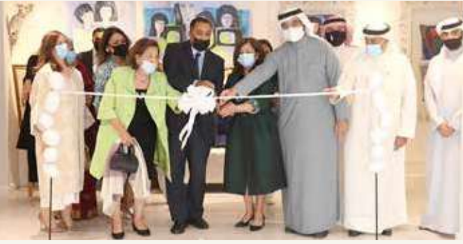
أثناء تدشين مبادرة الرواد المبدعين