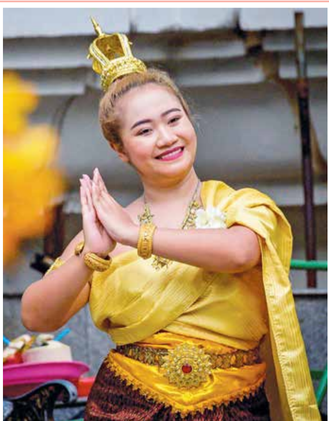
تايلندية ترتدي الزي التقليدي في العاصمة بانوك

شهد بركان إتنا القريب جداً من ميناء كاتانيا على الساحل الشرقي لجزيرة صقلية الإيطالية، ثوراناً جديداً. ورغم أن الثوران الجديد لا ينطوي على خطر كبير، لكنه تسبب في تساقط حجارة بركانية صغيرة ورماد على هذه المدينة التي أغلق مطارها. وقال مسؤول في المعهد الوطني للجيوفيزياء والبراكين لوكالة الأنباء "أجي" إن انهيار جزء من فوهة البركان الشهير، تسبب في اندفاع حمم بركانية على طول سفحه الغربي، لكن ذلك لا يشكل خطراً على القرى المأهولة الواقعة بالقرب من البركان. وصرح ستيفانو برانكا مدير المعهد في كاتانيا "شهدنا أسوأ من ذلك من قبل"، معتبراً أن الحادث الذي بدأ في نهاية فترة بعد ظهر الثلاثاء لا يدعو إلى القلق إطلاقاً.