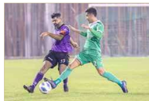
من لقاء سترة والشباب