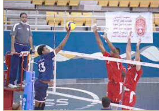
من لقاء المحرق والنجمة