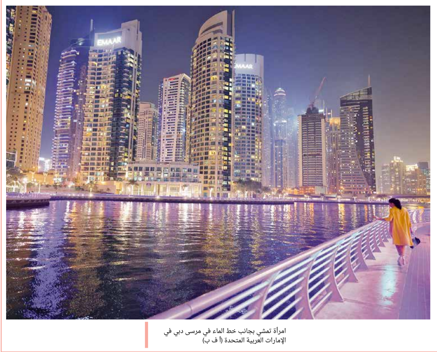
امرأة تمشي بجانب خط الماء في مرسى دبي في الإمارات العربية المتحدة