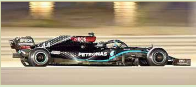
من سباق الفورمولا 1

استعداداً لموسم 2021 بمشاركة جميع الفرق العالمية