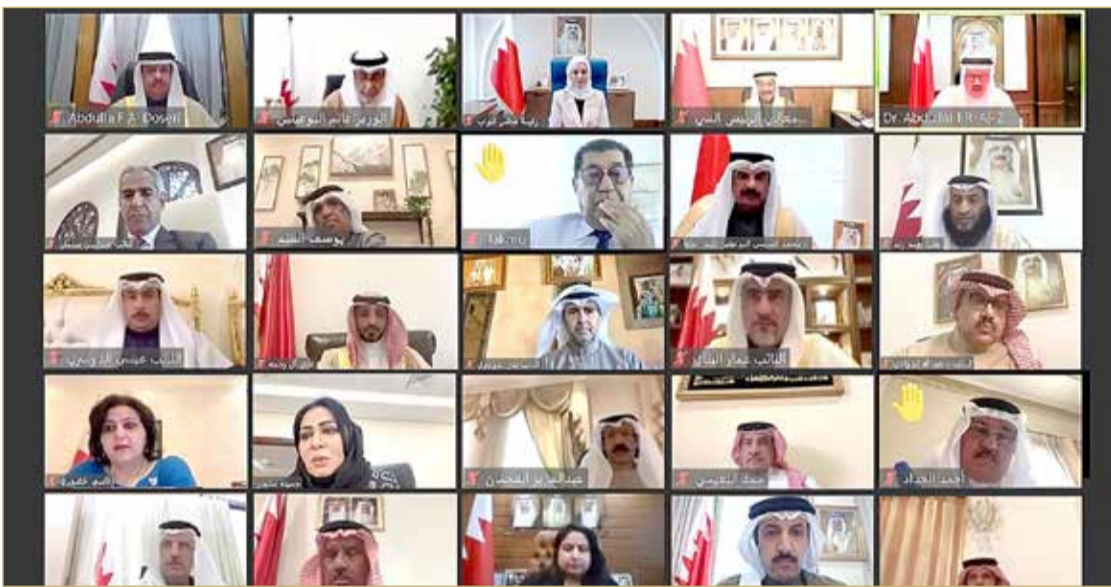
اجتماع برلماني حكومي مشترك، عبر الاتصال المرئي

عقد صباح أمس، اجتماع برلماني حكومي مشترك، عبر الاتصال المرئي برئاسة رئيس مجلس النواب فوزية زينل، وبمشاركة رئيس مجلس الشورى علي الصالح، وبحضور وزير الخارجية عبداللطيف الزباني، ووزير شؤون مجلسي الشورى والنواب غانم البوعيين، وكل من رئيسي وأعضاء لجنتي الشؤون الخارجية والدفاع والأمن الوطني بمجلسي الشورى والنواب، وبحضور مساعد وزير الخارجية، عبدالله الدوسري، ووكيل وزارة الخارجية للشؤون الدولية، الشيخ عبدالله بن أحمد آل خليفة، ووكيل وزارة الخارجية للشؤون الإقليمية ومجلس التعاون، السفير وحيد سيار، لإطلاع السلطة التشريعية على نتائج الزيارة التي قام بها وزير الخارجية لبروكسل واللقاءات التي أجراها مع المسؤولين في الحكومة البلجيكية والاتحاد والبرلمان الأوروبي. وفي بداية الاجتماع أكدت رئيسة مجلس النواب أن الاجتماع يأتي في ظل استمرار تعزيز التعاون الفاعل بين مجلسي الشورى والنواب مع الحكومة، تنفيذاً لتوجيهات عاهل البلاد صاحب الجلالة الملك حمد بن عيسى آل خليفة، وحرص واهتمام من ولي العهد رئيس الوزراء صاحب السمو الملكي الأمير سلمان بن حمد آل خليفة.