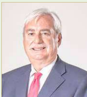
جان كريستوف دوراند

بينما شهد صافي الربح العائد لمساهمي بنك البحرين الوطني انخفاضا بنسبة 28.2% ليصل إلى 53.3 مليون دينار للفترة المنتهية في 31 ديسمبر 2020، مقابل 74.2 مليون دينار في العام 2019. وتأثر صافي الربح للعام 2020 بجائحة كوفيد-19، حيث نجم عنها وضع مخصصات احترازية، انخفاض هوامش الربح، انخفاض الدخل من تقييمات الأسهم مع المؤسسات الرميطة وانخفاض أرباح الأسهم المستمثلة. انخفضت ربحية السهم الواحد بنسبة 23.8% لتصل إلى 32 فلسا، مقابل 42 فلسا في 2019. شهد إجمالي الدخل الشامل العائد لمساهمي بنك البحرين الوطني انخفاضا بنسبة 44.9% ليصل إلى