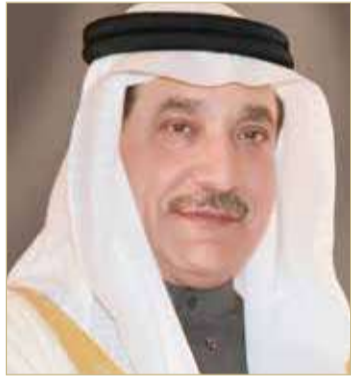
وزير العمل والتنمية الاجتماعية

◆ ترسيخ مكانة البحرين في مجال صون حقوق الإنسان