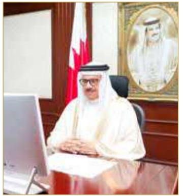
وزير الخارجية متحدثاً في اللقاء

والأعراف الدبلوماسية، ولا تزال الدعوة قائمة. وأضاف في اجتماع برلماني حكومي مشترك، عبر الاتصال المرئي أمس: سوف تستمر وزارة الخارجية في طلب عقد المباحثات الثنائية بين البلدين؛ لتسوية القضايا والمسائل العالقة بين البلدين، التزاماً بما جاء في بيان العلا وحفاظاً على تماسك مجلس التعاون وتعزيز مسيرته المباركة.