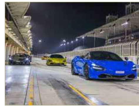
العرض في توبلي أو الاتصال على (80007878) أو زيارة الموقع

أقامت شركة كانو موتورز، الوكيل الرسمي لسيارات ماكلارين الحارقة في مملكة البحرين، فعاليات خاصة “ليلة حصرية مع ماكلارين” وذلك في حلبة البحرين الدولية. واستضافت من خلالها مجموعة من ملاك سيارات ماكلارين الذين حصلوا على تجارب قيادة حصرية على مضمار السباق الخاص بالحلبة، مكنتهم من التعرف على القدرات الحارقة لسياراتهم في أجواء آمنة. وللراغبين بالحصول على مزيد من المعلومات عن أحدث