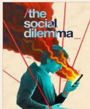
The Social Dilemma