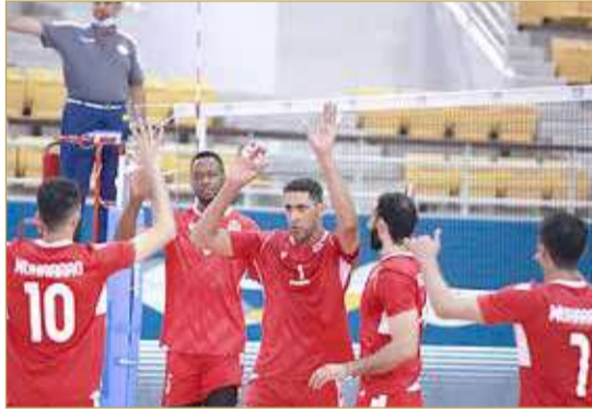
المحرق هزم النجمة وطار للنهائي