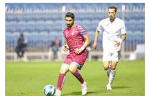
من لقاء البحرين والاتحاد