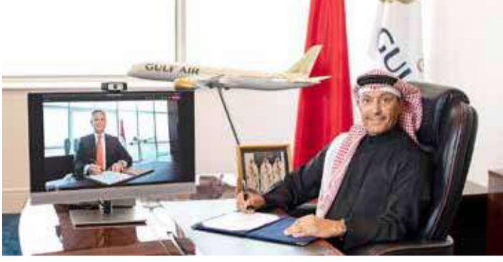
أثناء توقيع الاتفاقية

العمليات المشتركة على خط البحرين-أبوظبي وعلى شبكة الوصل عبر مقريهما. كما ستسمح الاتفاقية المزيد من المزايا للضيوف المتميزين من برنامجي فالكون فلاير وضيف الاتحاد. كما سيعمل الشريكان على تيسير رحلة المسافرين على خط البحرين-أبوظبي؛ لجعلها أكثر سلاسة، بغض النظر عن الشركة المشغلة، مع تطوير وتنسيق القوانين والمنتجات في قطاعات مختلفة مثل الأمتعة والملحقات.