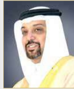
الشيخ سلمان بن خليفة

أكد وزير المالية والاقتصاد الوطني الشيخ سلمان بن خليفة آل خليفة أن ما اتخذته مملكة البحرين من خطوات سباقة وريادية لمواجهة انعكاسات الانتشار العالمي لفيروس كورونا (COVID-19) على المستوى المحلي ومنها إطلاق الحزمة المالية والاقتصادية جاءت بفضل حكمة وتوجهات عامل البلاد صاحب الجلالة الملك حمد بن عيسى آل خليفة وحرص ومتابعة ولي العهد رئيس مجلس الوزراء صاحب السمو الملكي الأمير سلمان بن حمد آل خليفة لحفظ صحة وسلامة المواطنين والمقيمين بالتوازي مع استمرار برامج الدولة ومسيرة عملها تحقيقاً لمساعي التنمية المستدامة لصالح المواطنين، ونوه بالبيان الصادر مؤخراً من صندوق النقد الدولي الذي أشاد بخطوات مملكة البحرين ومساهمتها في الحد من الآثار المترتبة على تداعيات الجائحة.