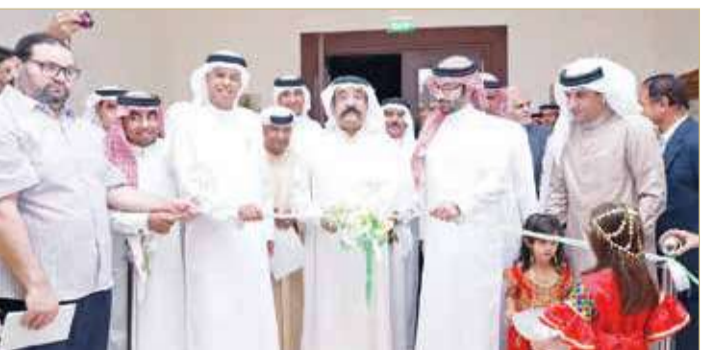
من حفل افتتاح نادي المالكية (أرشيفية)

يسدد الفاتورة خلال الأشهر الماضية بعد أن يقوم بإيقاف مخصصات ورواتب بعض العاملين في النادي وهو أمر غير مقبول، كما أوضح بأن مبلغ الـ 2000 دينار يلتهم حوالي 24 ألف دينار سنوياً (أقل أو أكثر) من الميزانية السنوية للنادي التي تبلغ 38