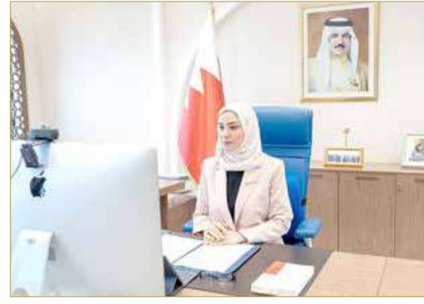
رئيسة مجلس النواب