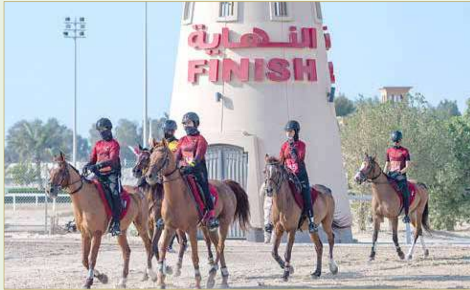
جانب من المنافسات

تشهد قرية البحرين الدولية للقدرة اليوم انطلاق سباقات 80 كيلومترا محلي و100 كيلومتر تأهيلي دولي الساعة 7 صباحاً، وستكون مراحل سباق مسافة 80 كيلومترا على 3 مراحل، المرحلة الأولى (لون أحمر) لمسافة 40 كيلومترا، المرحلة الثانية (لون أصفر) لمسافة 20 كيلومترا، والمرحلة الثالثة (لون أصفر) لمسافة 20 كيلومترا. ومرحلة سباق مسافة 100 كيلومتر: المرحلة الأولى (لون أحمر) لمسافة 40 كيلومترا، المرحلة الثانية (لون أزرق) لمسافة 30 كيلومترا،