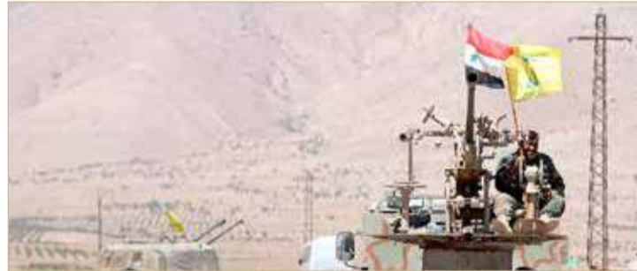
قوات من ميليشيا حزب الله في سوريا