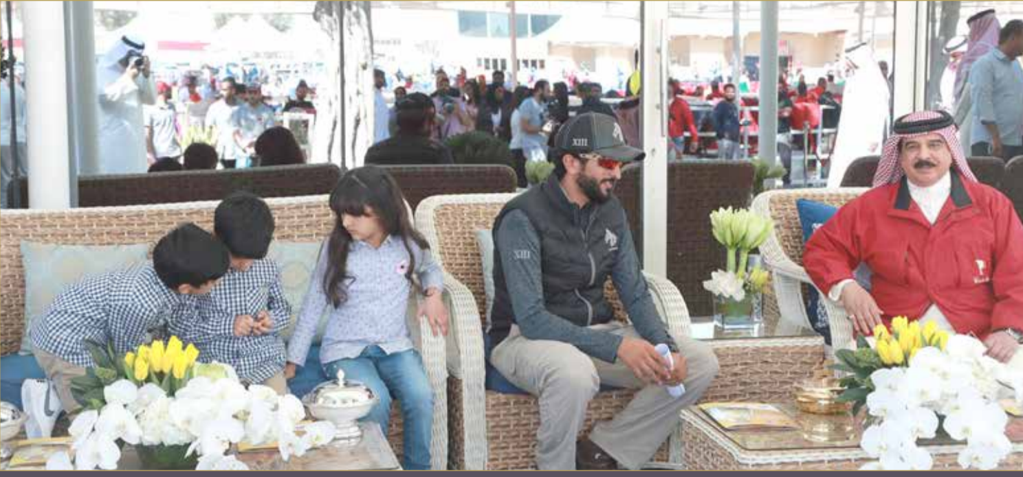
جلالة الملك وسمو الشيخ ناصر بن حمد