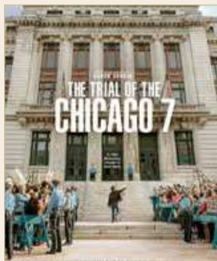
The Trial of The Chicago 7