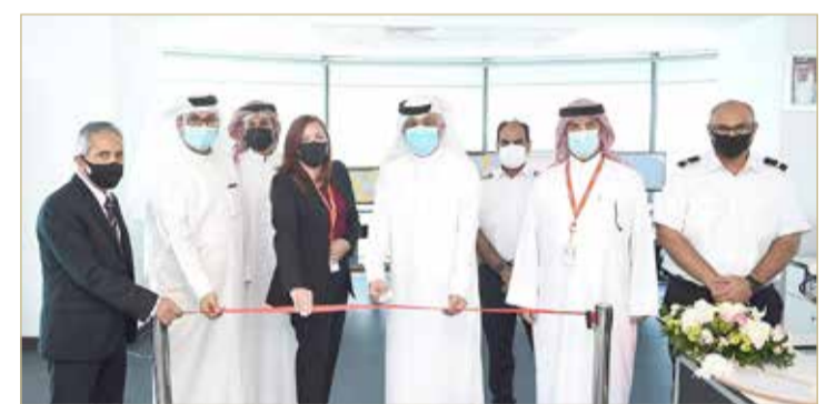
تدشين النظام الجديد لبرج المراقبة

معقدة من العمليات التشغيلية والتي تضم حركة السفن، وإدارة الشحنات، وعمليات البنية التحتية كما أننا نعمل في سوق تنافسية لذا فإنه يتم الاعتماد بشكل كبير على فاعلية إدارة حركة السفن القادمة إلى أرصفة الميناء والتي سيتم تنظيم حركتها من خلال هذا النظام الجديد والمتطور بشكل آمن وفعال. كما نواصل في رفع مهارات