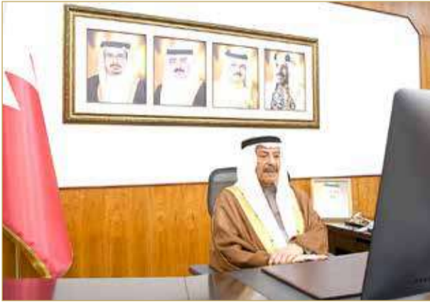
رئيس مجلس الشورى

وزير الخارجية يطلع "التشريعية" على المباحثات مع المسؤولين بالاتحاد والبرلمان الأوروبي