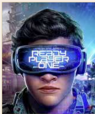
Ready Player One

الأحداث تدور في إطار الخيال العلمي، بشأن مراهق يدعى "وايد واتس"، يشارك في لعبة إلكترونية تسمى "OASIS"، ويخوض منافسة من أجل الحصول على ثروة الملياردير مؤسس اللعبة. لكن بعد مرور 5 سنوات يجد نفسه مُحاصرًا بديون كثيرة سواء في العالم الحقيقي أو الافتراضي. العمل من بطولة كل من أوليفيا كوك وتي شيردان.