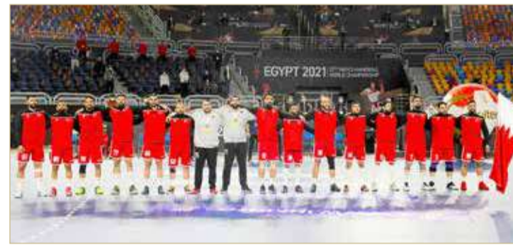
منتخب البحرين لكرة اليد

إلى 14 مارس المقبل لتحديد باقي المنتخبات المتأهلة، حيث تبقى 6 مقاعد تتنافس على نيلها 12 منتخبًا بعدما تأهل 6 منتخبات بشكل رسمي. وينص نظام دورة الألعاب الأولمبية بطوكيو، تأهل المنتخبات الأربعة الأوائل من كل مجموعة إلى الدور ربع النهائي، حيث يلعب صاحب المركز