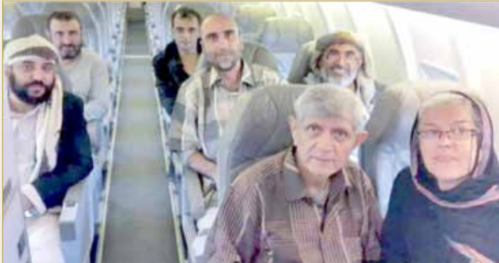
عدد من البهائيين الذين تم تهجيرهم من اليمن

وتفان، بجو من التعايش استسته الدولة البحرينية منذ البدايات الأولى، واحتضنه المشروع الإصلاحي لجلالة العاهل، كنموذج حي يدرس في المنطقة والأقليم والعالم ككل. إن أهم ما يميز التواجد البهائي في البحرين هو عدم تمركز البهائيين في أحياء أو قرى معينة بل انتشارهم في مختلف مناطق وقرى البحرين