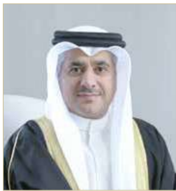
وزير المواصلات والاتصالات

وحضر الاجتماع كل من: وزير النقل السعودي صالح بن ناصر الجاسر، ووزير المواصلات والاتصالات كمال بن أحمد محمد، ورئيس هيئة النقل العام بالمملكة العربية السعودية ربيع بن محمد الريمح، ورئيس مجلس إدارة مؤسسة جسر الملك فهد أحمد بن عبدالعزيز الحقاني، ووكيل وزارة