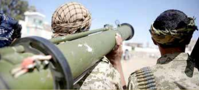
طهران تضغط على الحوثيين لاستهداف منشآت مدنية بالسعودية

صارمة إزاء دور إيران الخبيث في اليمن ودفع ميليشيا الحوثي للتصعيد وإشعال فتيل المواجهات في جبهات مأرب، وتقويض دعوات التهدئة وحل الأزمة سلميا، دون اكتراث باستمرار نزيه الدم والمعاناة الإنسانية المتفاقمة". هذا وجددت الولايات المتحدة الأميركية، أمس الثلاثاء، تأكيد ضرورة وقف الحوثيين لجميع