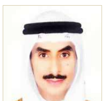
الشيخ ثامر الاحمد الصباح

المستقبل ومواصلة تجديد نهضته في جميع المجالات وبذل الغالي والنفيس لخدمة أممتها واستقرارها. وأكد السفير الكويتي أن بفضل الله وبعد نظر القيادة واجهت دولة الكويت تحديات جاثمة كوروننا بكل اقتدار ونجاح في التصدي لهذا الوباء، والكويت مستمرة بإنجازات التنمية بكافة أشكالها، كما أثبتت الأيام أن دولة الكويت ستظل مصدر ثقة للعالم في نشر ثقافة السلام والمحبة والتعاون وتوحيد الكلمة لما يخدم أمن واستقرار وازدهار المنطقة ودول العالم. كما أكد السفير أن مملكة البحرين ودولة الكويت ماضيتان بكل عزيمة وإصرار لتعزيز العلاقات بجميع المجالات لتحقيق طموحات وتطلعات القيادتين الحكيمتين البلدين والشعبين الشقيقين.