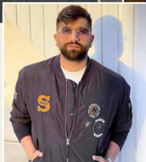
« أن تمتلك أنت منصة تنتج مواد إعلامية أمر مختلف تماماً من أن تكون جزءاً من منظومة إعلامية، أين تجد نفسك أكثر؟

جريت المنظومة الإعلامية لمدة 14 سنة، والآن أصبح الوقت مناسباً لاكتشاف منصتي الجديدة التي تريد أن تنتج لي المواد الإعلامية، كيف ستكون التجربة لا أعلم، وأنا مازلت في بداية الطريق لإيجادها. المنظومة الإعلامية شيء كبير جداً وتأسيسه أمر مختلف، ولكن اليوم الفرد لا يستطيع أن يخلق وحده ويفرد عكس التيار فيما يخص قناعاته بدون أي أسس أو قوانين تتبعها المنظومة الإعلامية لا بد من احترامها واتباعها؛ لأنه يعمل في هذه المنظومة. أظن أن الحرية اليوم ستجعلني أكتشف شيئاً