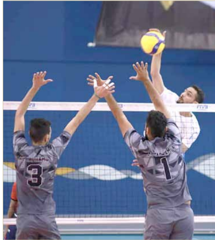
عالي فاز على التضامن وتأهل لدور الثمانية

تأهل عالي والنبيه صالح إلى دور الثمانية لمسابقة كأس سمو ولي العهد رئيس الوزراء للكرة الطائرة بعد تغلبهما على التضامن والبسيتين ضمن منافسات الدور التمهيدي التي أقيمت مساء أمس الأربعاء على صالة عيسى بن راشد الرياضية.