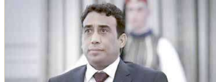
رئيس المجلس الرئاسي في ليبيا محمد المنفي

موالية لها، وسط مطالبات دولية بخروج جميع المقاتلين الأجانب من البلاد. وأوضحت معلومات المرصد أن التحضير لإرسال المجموعة الجديدة من المرتزقة إلى ليبيا يتزامن مع تجميد عودة مجموعة أخرى تتكون من 140 عنصرا. يذكر أن خروج جميع المقاتلين الأجانب من ليبيا كان أحد أبرز بنود الاتفاق الليبي الليبي في يناير الماضي.