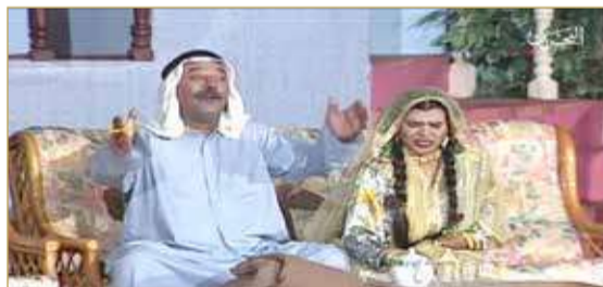
مسرحية بيت خاص جدا

تطويع شخصية الممثل لما يراه مناسباً، ويجب على الممثل في حال قبوله العمل تحت إمرة أي مخرج أن يكون تلميذاً نجيباً ومستمعاً جيداً.