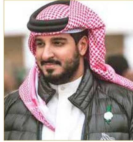
عيسى بن عبدالله

خلال الفترة القادمة، وأيضا طبقنا دروس علاج لذوي الهمم بالخيل وهذا يكسب مهارات عديدة وخبرات واسعة لتبادلها بين الطرفين". وأعربت هيا جمال عن تقديرها لدعم ومتابعة سمو الشيخ عيسى بن عبدالله آل خليفة وأعضاء الاتحاد الملكي للفروسية وسباقات القدرة، مؤكدة أنها ستعمل على مواصلة الارتقاء ببرامج علاج أطفال التوحد في المملكة.