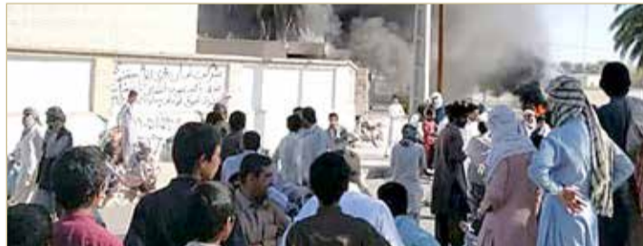
مواطنون بلوش يستولون على مقر قائم مقامية سراوان

من الحدود. وخلال الساعات الماضية أطلق عدد من الناشطين على مواقع التواصل، حملة للتنديد بقتل ناقلي الوقود، واحتج الآلاف على تويتير على قتل "تجار الوقود" والتمييز ضد البلوش على حدود مدينة سراوان في سيستان-بلوشستان، باستخدام هاشتاغ "سراوان ليست وحيدة" و"لا تقتلوا تجار الوقود"، معربين عن دعمهم لاحتجاجات أهالي المدينة التي انطلقت أمس الثلاثاء.