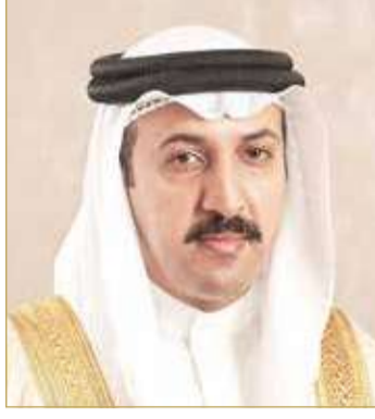
الشيخ عبد الله بن أحمد

في تعزيز التآخي والتضامن بين الدولتين الشقيقتين، فضلاً عن الامتدادات الأسرية والقبلية على أراضي الدولتين اللتين تجمعهما أواصر مشتركة تضرب بجذورها في التاريخ، وسطرها انتصارات كان لها أبلغ الأثر في بناء اللبنة الأولى للدولتين.