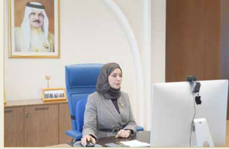
القضيبية - مجلس النواب

في تقليل العجز الكلي والجزئي بمقدار 160 مليون دينار في 2021، مشيراً إلى أنه على رغم زيادة المصروفات فإن عجز الموازنة سوف يقل بسبب ارتفاع أسعار النفط من ناحية وزيادة الإيرادات غير النفطية من ناحية ثانية. وأضاف رئيس اللجنة أن أبرز التعديلات على الميزانية العامة للدولة تمثلت في زيادة مصروفات الحماية الاجتماعية