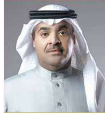
الشيخ تركي بن دعيح

عبر مواكبتها لكافة المتغيرات المتسارعة للتحويل الرقمي، مبيئاً الآثار الإيجابية المترتبة على توفير الخدمات إلكترونياً من حيث سرعة إنجاز المعاملات عن بعد، ودعمها للتباعد الاجتماعي في ظل جائحة كورونا، فضلاً عن دورها بتعزيز الأداء الحكومي وحفظ وقت وجهد المستفيدين من الخدمة. وأوضح أن الإقبال عموماً على الخدمات الجمركية الإلكترونية المختلفة بلغ مستويات قياسية خلال فترة زمنية قصيرة نظراً لتوفيرها عدداً من المزايا كاختصار زمن التخليص الجمركي، وإنهاء إجراءات البضائع بكل مرونة،