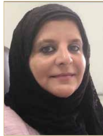
نجاة أبو الفتح

كشفت مديرة إدارة الصحة العامة في وزارة الصحة نجاة أبو الفتح عن استمرار الزيادة في أعداد الحالات القائمة بفيروس كورونا خلال شهر فبراير الحالي، حيث بلغ مجموع أعداد الحالات القائمة الجديدة حتى يوم أمس الموافق 23 فبراير 7081 حالة قائمة، مؤكدة خطورة استمرار الزيادة في الحالات القائمة والتي تسببت في وفيات بلغت إلى تاريخه 433 وفاة من مختلف الأعمار، ونهت أفراد المجتمع إلى ضرورة التعامل بمسؤولية مع الوضع الحالي مع انتشار الفيروس المتحور، والذي قد يؤدي إلى عواقب وخيمة خصوصاً في حال تواجد حالات قائمة لا تظهر عليها الأعراض