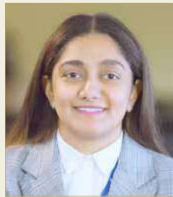
الشيخة فتي بنت عبدالله