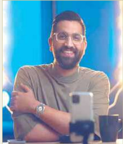
« 14 عاماً في الإعلام، ما اللقاءات التي لا أنسى واللقاءات التي تمنى لو أجريتها؟

فريقي شعلة الشغف التي لا تنطفئ... والإعلامي ليس مضطراً لوضع قناع