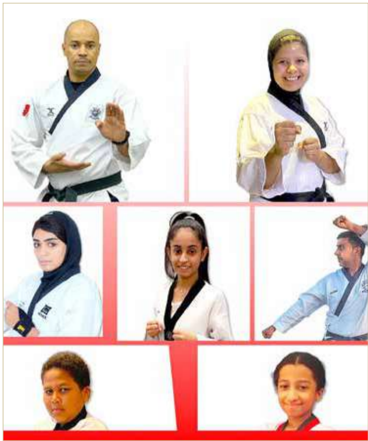
لقطة للاعبين التايكوندو البحرينيين