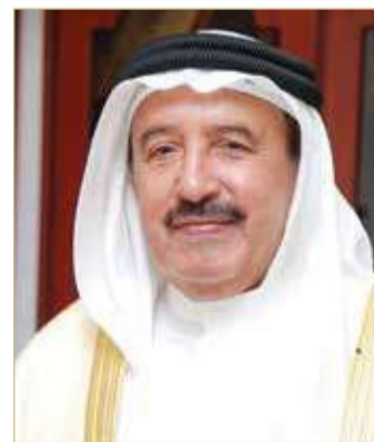
سلمان بن هندي

أكد محافظ المحرق سلمان بن هندي أن وزارة الداخلية تسخر كافة أجهزتها في خدمة المواطنين والمقيمين، مشيراً إلى أن محافظة المحرق تطبق مبدأ الشراكة المجتمعية وهي السياسة التي وضعها وزير الداخلية لتطوير الخدمات الأمنية والمجتمعية، مشيداً في الوقت ذاته بالتعاون البناء والملموس بين المحافظة ومديرية شرطة محافظة المحرق. جاء ذلك خلال استقبال المحافظ لمدير عام مديرية شرطة محافظة المحرق العميد صالح الدوسري وعدد من كبار ضباط المديرية، حيث تم بحث كافة الخدمات التي تقدمها المديرية