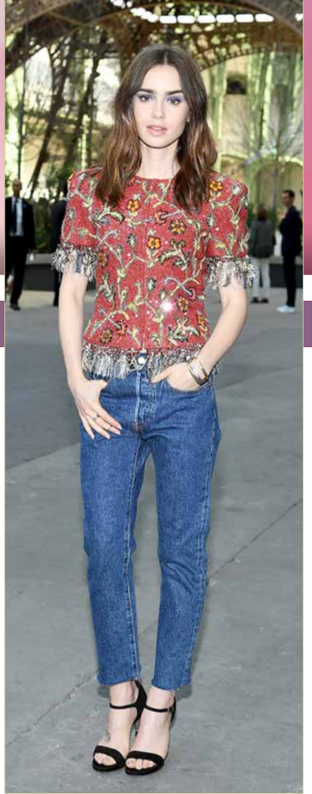
« أعربت النجمة ليلي كولينز عن سعادتها بأداء دور البطولة في مواجهة النجم العالمي الكبير وحاصد الجوائز غاري أولدمان، الذي قدم أعمالاً مهمة وخالدة بذاكرة السينما الأميركية. وكشفت كولينز عن ملامح شخصيتها في الفيلم السينمائي الجاري تصويره ويحمل عنوان "Mank" موضحة في مقابلة إعلامية، أنها تؤدي دور سكرتيرة بطل الفيلم الذي يحمل اسم العمل "مانك" وتجمعها علاقة حب ذات ملامح مختلفة.