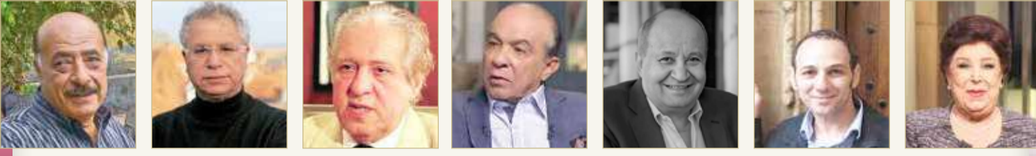
رجاء الجداوي بهاء عبدالمجيد وحيد حامد هادي الجبار محمود الإدريسي الشاعر مريد البرغوثي فايز عزب

أبرزهم الشاعر مريد البرغوثي والسيناريست حامد