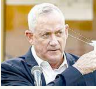
وزير الدفاع الإسرائيلي بيني غانص

% تنتج 15 كيلوغراما منها كل شهر، لافتة إلى أن تبرير إيران لوجود يورانيوم في أماكن غير معلنة لا مصداقية له. إلى ذلك، أكدت أن مخزون إيران من اليورانيوم المخصب أكثر بـ 14 مرة من الحد المسموح.